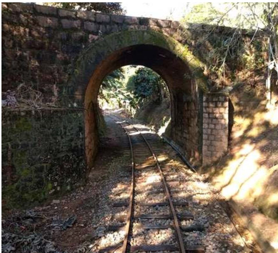
Vistas da limpeza feita ao longo da via férrea resultado de três meses de intensa atividade. (Marta Hain)