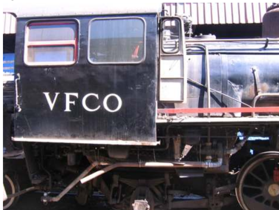
Injetor já adaptado na locomotiva 338