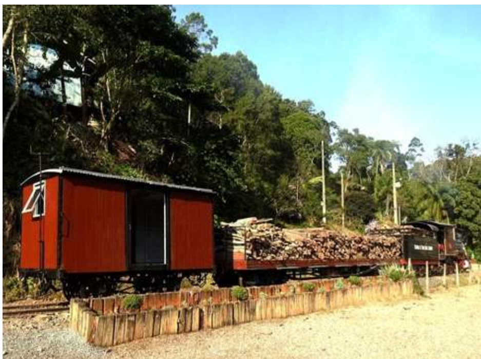
Raro momento da locomotiva 232 tracionando um vagão com lenha e o vagão CAP.