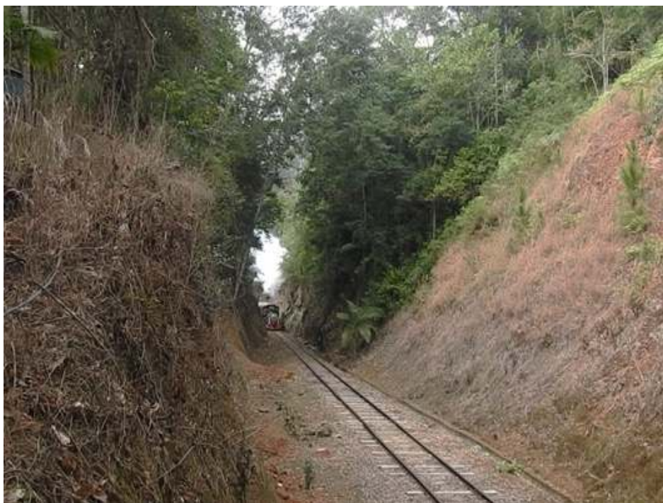
"Trem da EFSC" entrando no grande corte, detalhando -se a limpeza da via férrea.

Segundo o autor da foto poderia se classificar como "trem lenheiro"