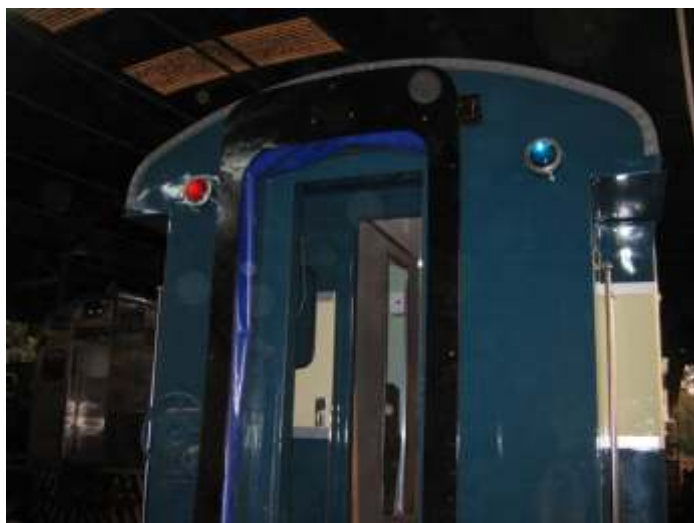
CA-62 - Detalhes da cabeceira