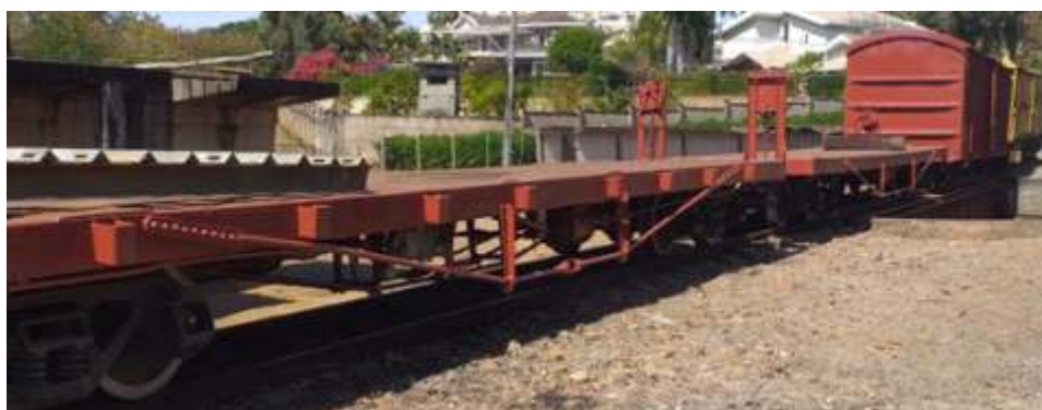
Vagões plataformas repintados

Ambos prestam relevantes serviços na distribuição de dormentes ao longo do trecho!!