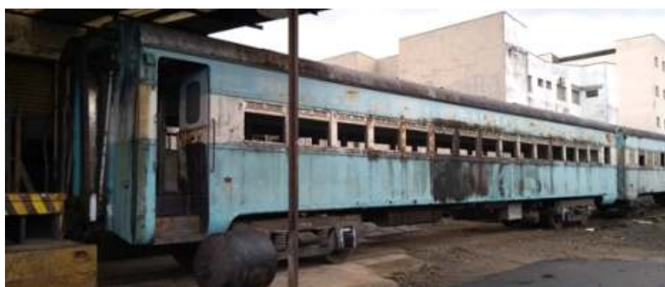
Carros PC 6390 e 6391 já nas oficinas