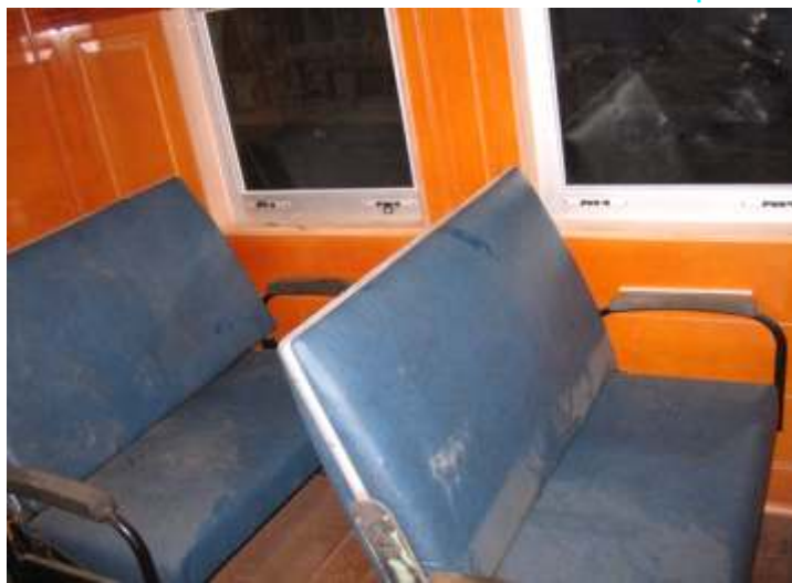
Primeiros assentos instalados, bem como as novas janelas de alumínio.