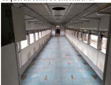
Interior do carro PC6391 após limpeza.