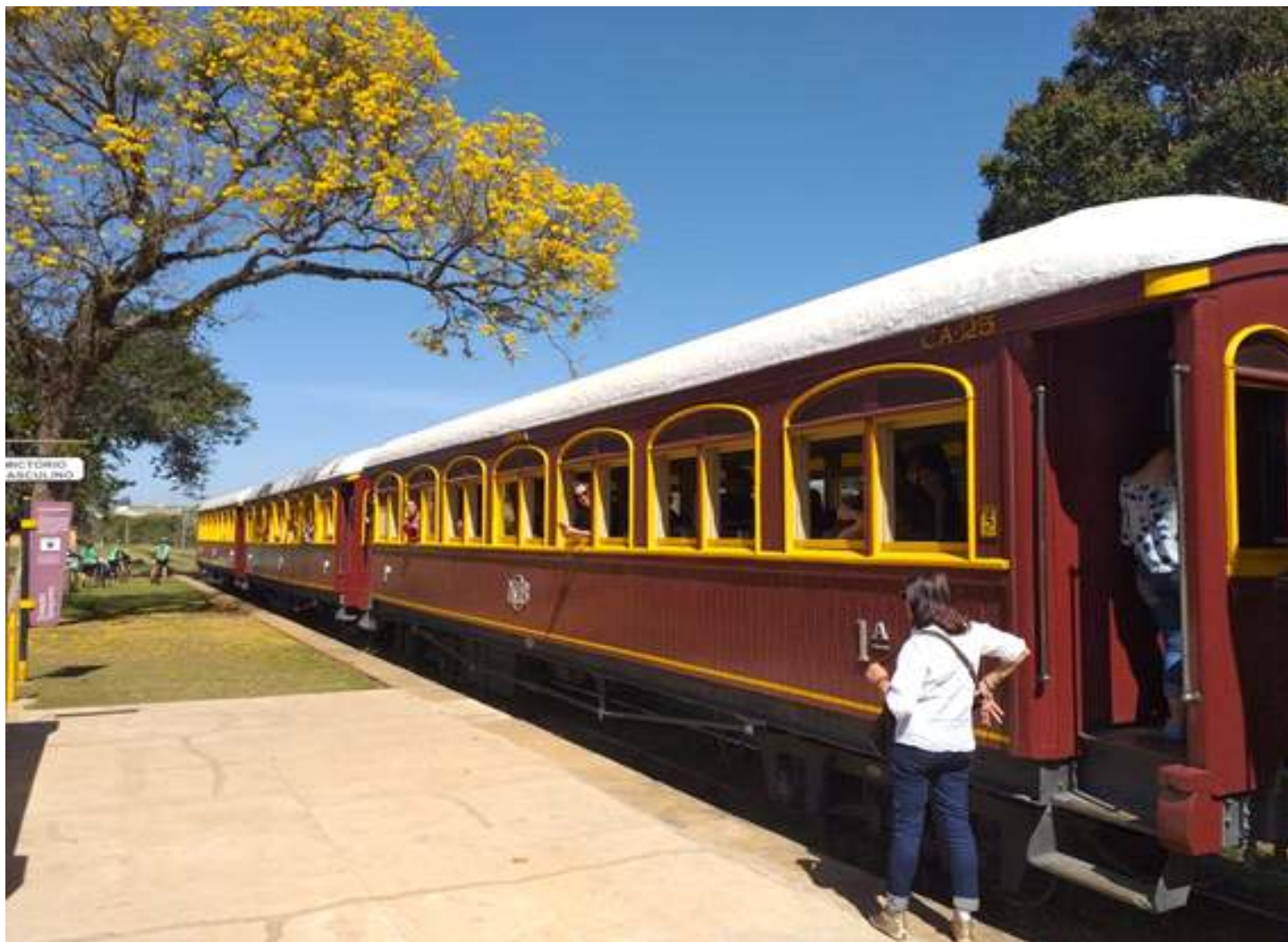
Os três carros NOB repintados na plataforma da estação de Tanquinho.

Os trabalhos foram feitos em Anhumas, no próprio pátio, sendo lavado lixado e pintado.