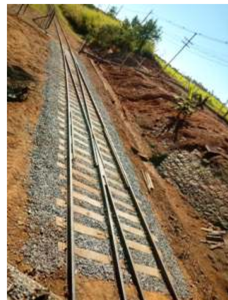
Manutenção AMV de Anhumas – lado Guanabara e outros serviços na via permanente