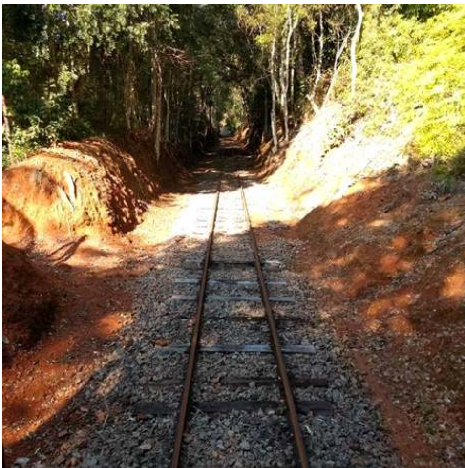
Vista da limpeza feita ao longo da via férrea resultado de três meses de intensa atividade.