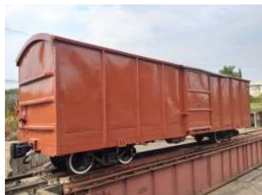
Antigo vagão box da Companhia Paulista