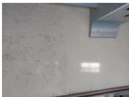
Interior do carro PC 6390 passando por limpeza: na foto, na porção direita a parte já limpa e na esquerda como se encontrava.