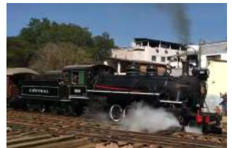
Primeira viagem da 1424 à frente do Trem das Águas após conclusão da reforma

Continuam os trabalhos de manutenção de via em Passa Quatro, onde está sendo feita a renovação do lastro, com descontaminação do existente e aplicação de novo para complementação, troca de dormentes e correções na geometria da via.