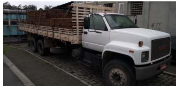
Carregamento recebido no dia 16/08/2019