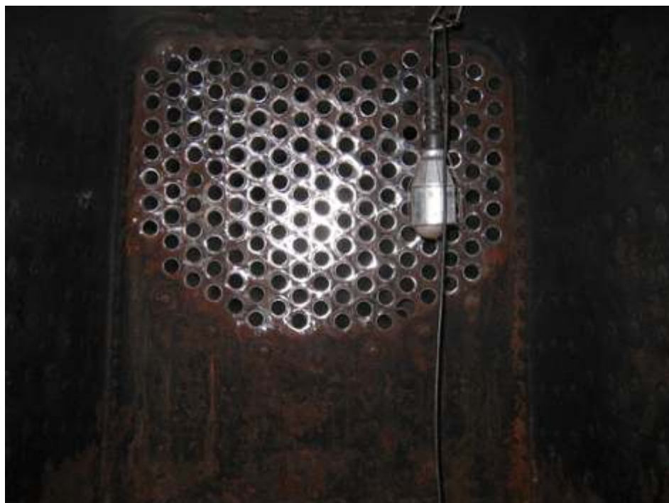
Espelho locomotiva 9 com os novos tubos

Em operação estão as locomotivas 604, 401 e 50, com as diesel 3, 57 e 905.