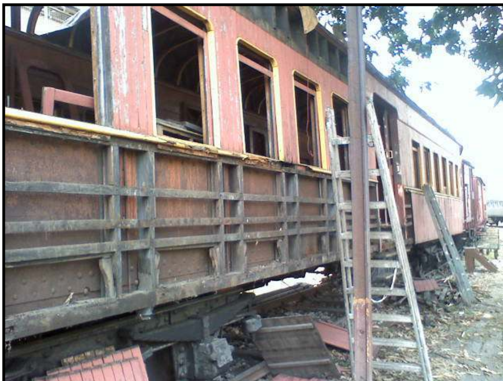
Acima: Carro 451 da SPR em reforma na ABPF-SP. Abaixo: Locomotiva 353 da EFCB em reforma na ABPF-SP.