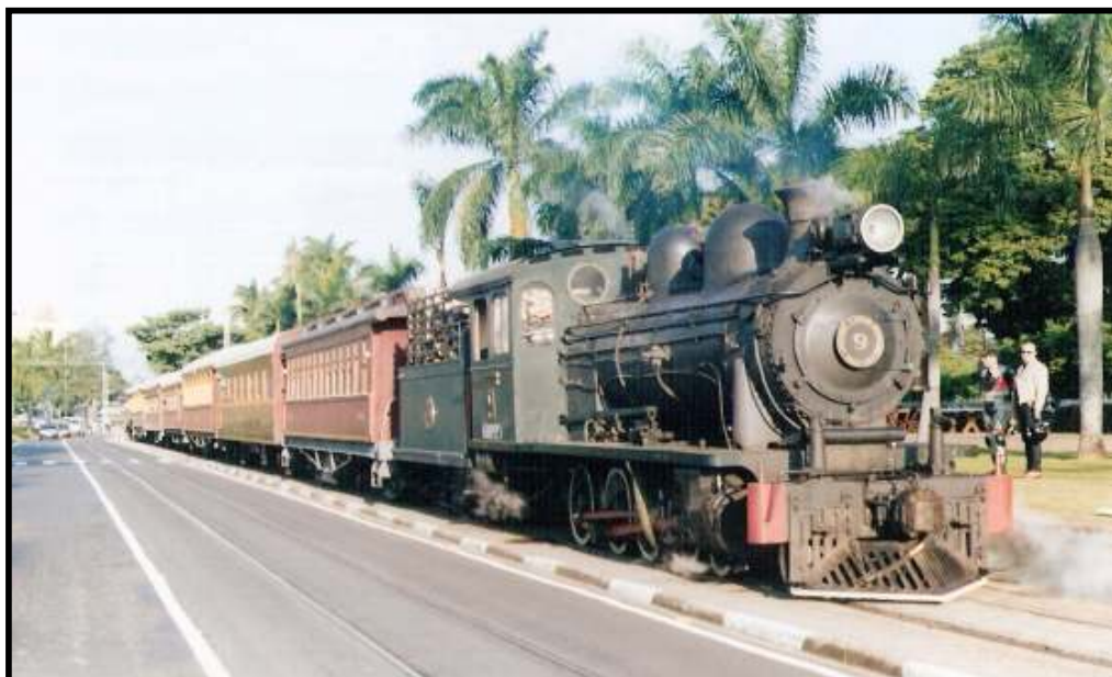
Acima: Locomotiva n. 9 da EFA na estação de Jaguariúna. Abaixo: Trem com destino a Jaguariúna sobre a ponte “Maria Fumaça”