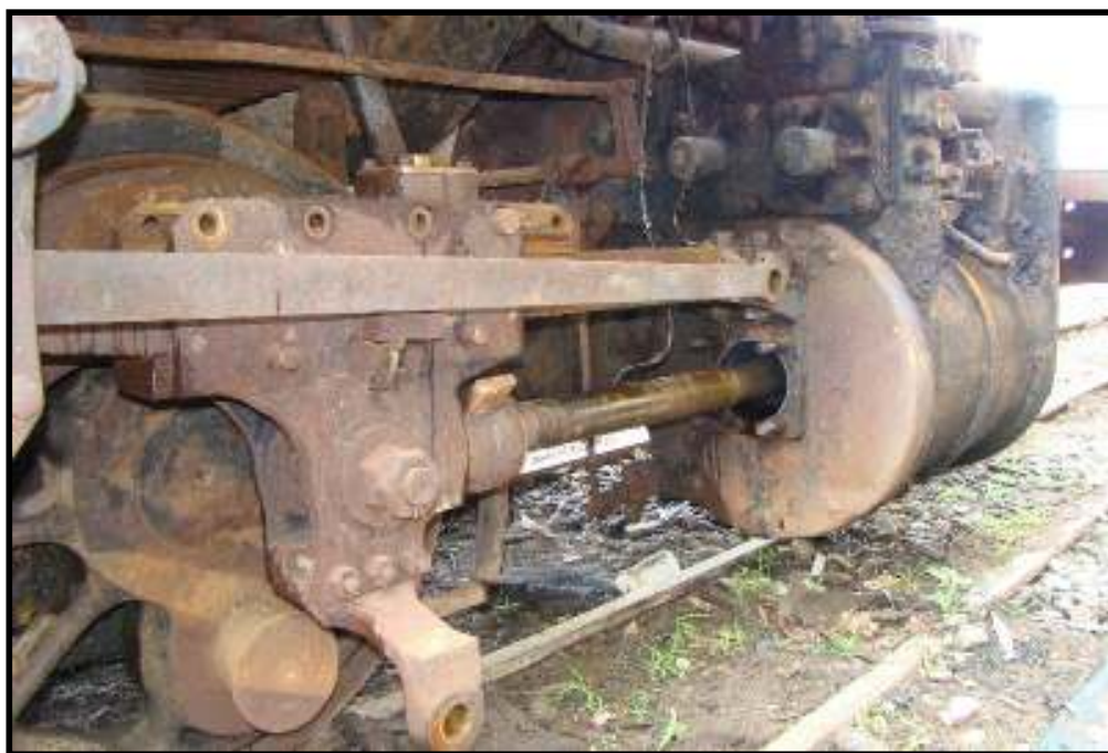
Locomotiva n. 103 sendo desmontada para restauração nas Oficinas de Cruzeiro da ABPF Sul de Minas.