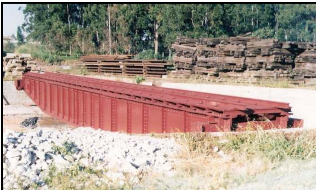
Girador já pintado aguardando instalação definitiva na estação de Anhumas da ABPF-Campinas.