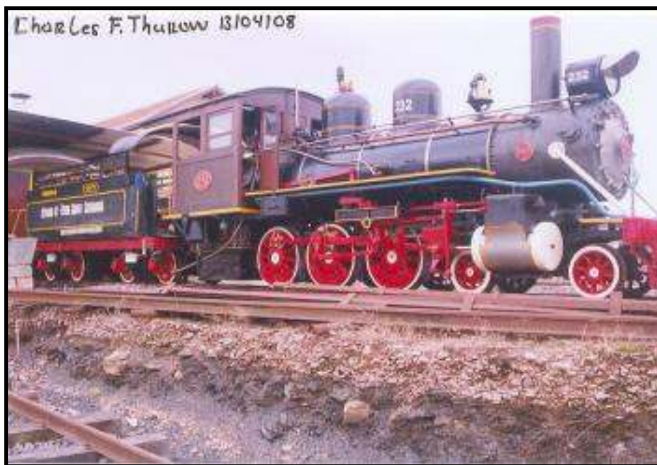
Foto atual da locomotiva 232, que em breve terá capitel para torná-la mais original. Foto: Charles Thurow em 13 de abril de 2008.