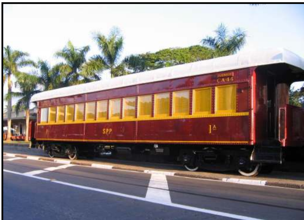
Carro CA-44 da EF São Paulo – Paraná recém restaurado pela ABPF-Campinas na estação de Jaguariúna-SP. Foto: Helio Gazetta Filho em junho de 2008.