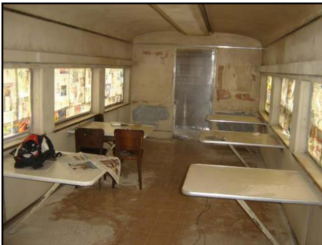
Interior do carro restaurante da CPEF que se encontra em reforma na ABPF-SP. Foto: Lourenço S. Paz em sete de julho de 2008