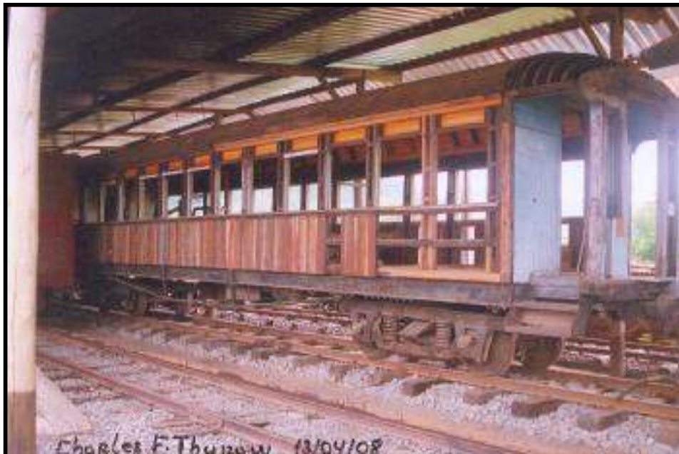
Carro P03 no momento sendo restaurado internamente pelo NuRVI, em Rio do Sul-SC. Foto: Charles Thurow em 13 de abril de 2008.