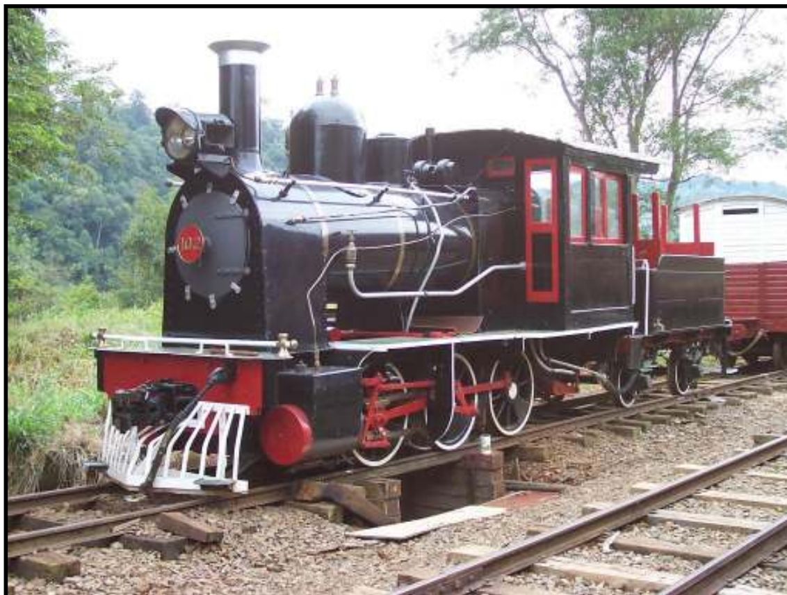
Locomotiva n. 102 La Meuse recentemente reformada pela ABPF-SC, em Piratuba-SC.