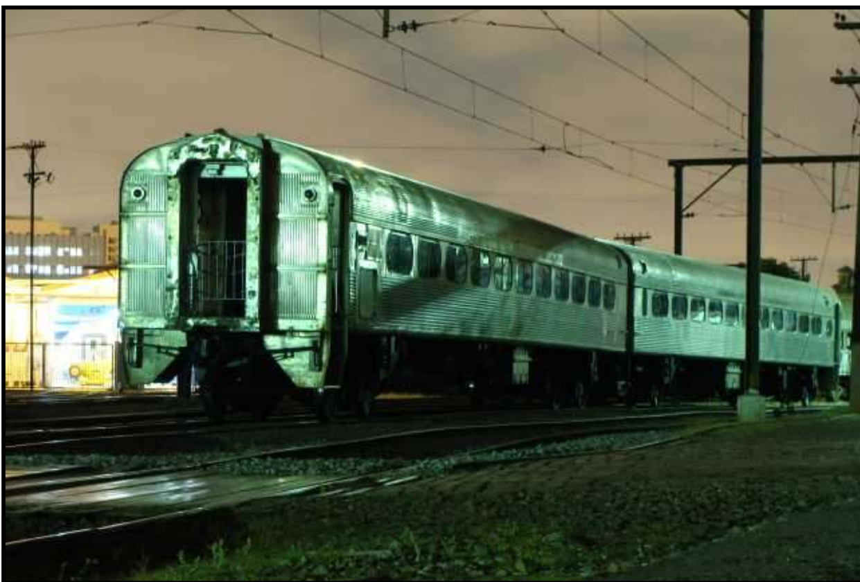
Carros Mafersa em inóx oriundos da EFA sendo levados para as oficinas da CPTM para recuperação. Foto: Rafael Nogueira em 2008.

O ABPF Boletim é uma publicação em meio eletrônico destinada somente aos associados da ABPF. As opiniões expressas nos artigos assinados não necessariamente representam a opinião da ABPF. Para contatar a redação: paz.lourenco@gmail.com. Diagramação: Lourenço S. Paz. Conselho Editorial: Sérgio Romano, Hélio Gazetta Filho, Geraldo Godoy e Lourenço S. Paz. Para contatar a Diretoria Nacional da ABPF e o Conselho Permanente: Av. Dr. Antônio Duarte da Conceição nº. 1501 – Parque Anhumas – Campinas – SP Cep: 13091-240. Telefone (19) 3207-3637, Fax (19) 3207-4290, e-mail: abpfcps@terra.com.br.