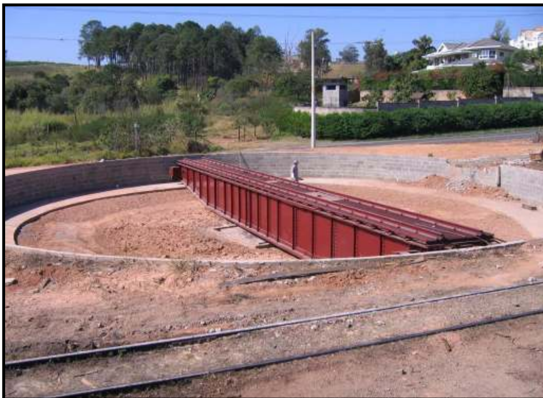
Girador de locomotivas já colocado em seu fosso na estação Anhumas da ABPF-Campinas.

Foto: Hélio Gazetta Filho em julho de 2008.