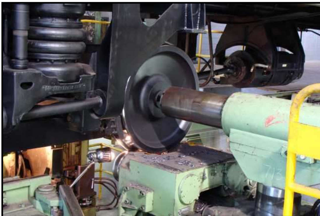
Rodeiro de um dos carros Mafersa em inóx no torno de rodas das Oficinas de Presidente Altino da CPTM.