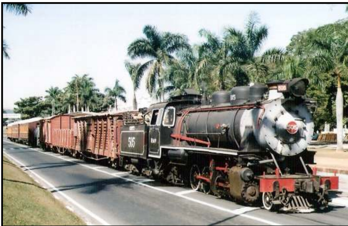
Trem misto já no pátio de Jaguariúnas. Foto: Vanderlei Zago em julho de 2008.