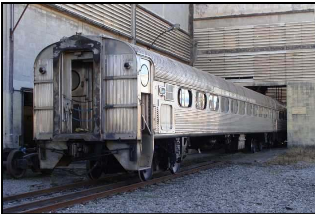
Carro Mafersa em inóx oriundo da EFA no torno de rodas das Oficinas de Presidente Altino da CPTM. Foto: Rafael Nogueira em 2008.