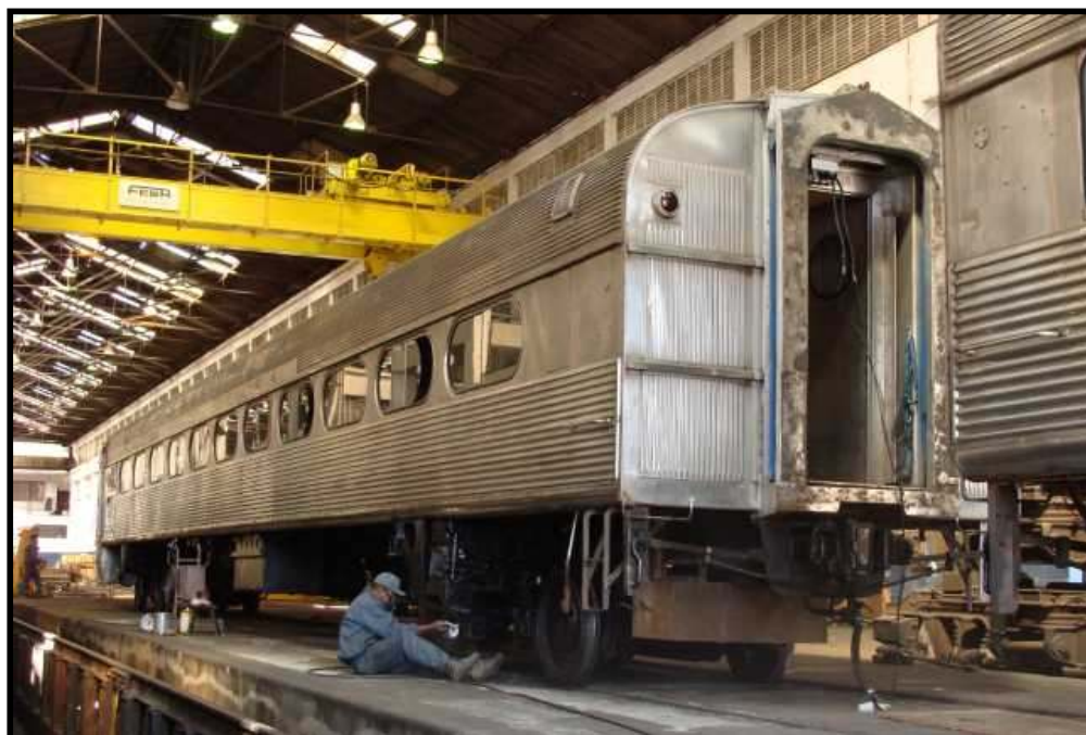
Carro Mafersa em inóx oriundo da EFA sendo recuperado nas oficinas da CPTM. Foto: Rafael Nogueira em 2008.