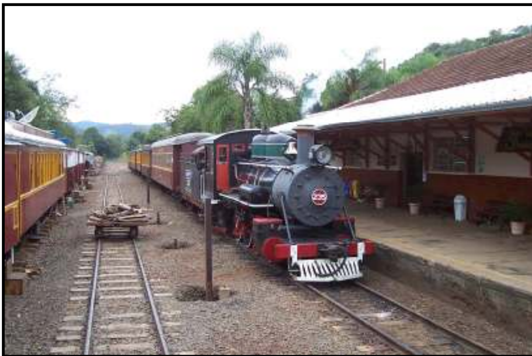
Locomotiva n. 235 com o Trem das Termas na estação de Piratuba-SC.