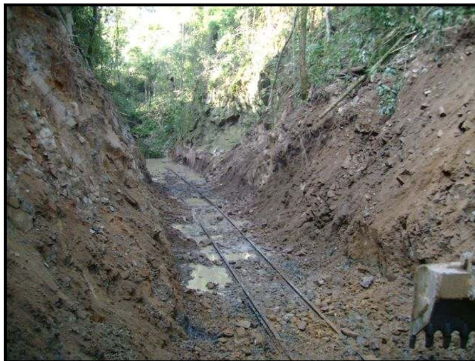
Reencontro de trilhos da antiga via da EFSC, durante os trabalhos de remoção de um desbarrancamento. Foto: Carlos Ramiro da Silva em 14/07/2008