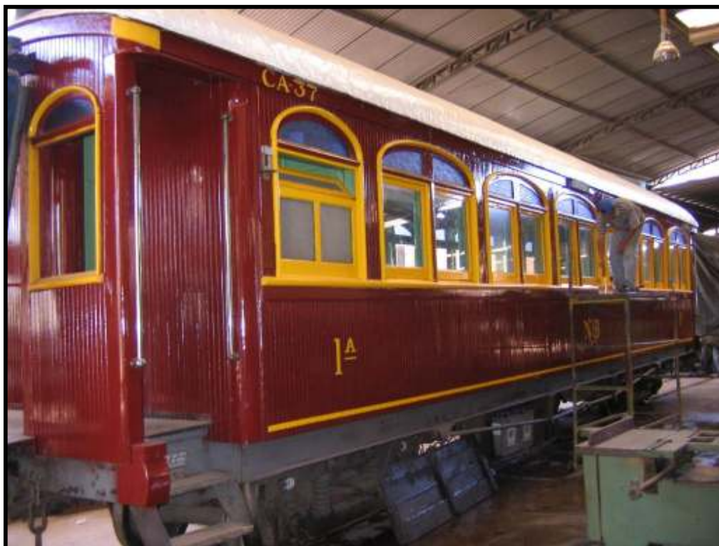
Acima: Carro CA-37 oriundo da NOB em restauração nas Oficinas de Carlos Gomes. Abaixo: Tender da locomotiva n. 604 da CPEF após receber nova pintura. Fotos: Hélio Gazetta Filho em julho de 2008.