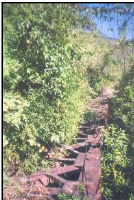
Aspecto da ponte 13, de 48m de comprimento, localizada no km 7, inserida na 2ª etapa pretendida para reativação sem data definida, vista aqui durante a caminhada de verificação do leito realizada em 19/07/2008.