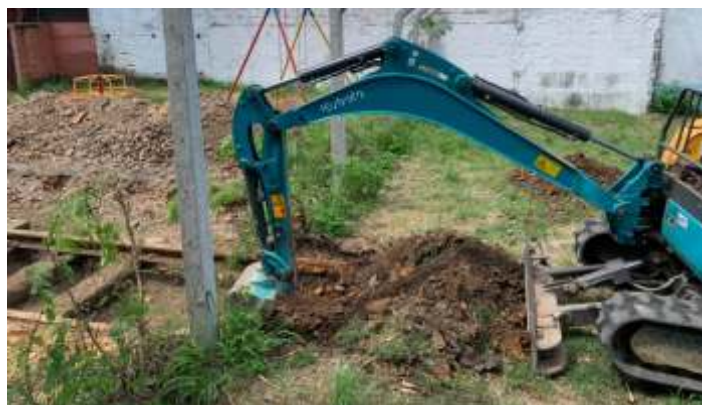
♦ Trabalhos no km 0+300: antes, durante a limpeza e já com a nova dormentação instalada