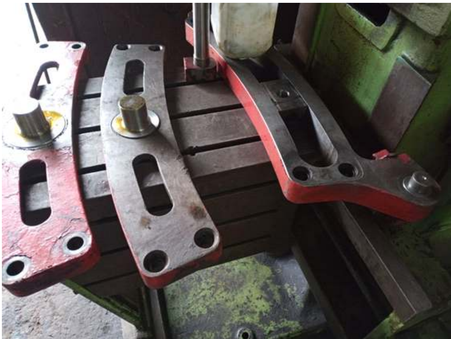
♦ Componentes da locomotiva 505