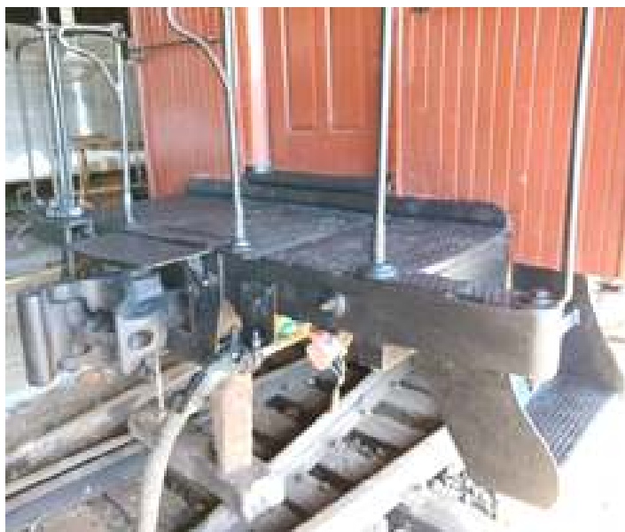
♦ Troca de vigas de madeira nas plataformas do carro passageiro PM-33