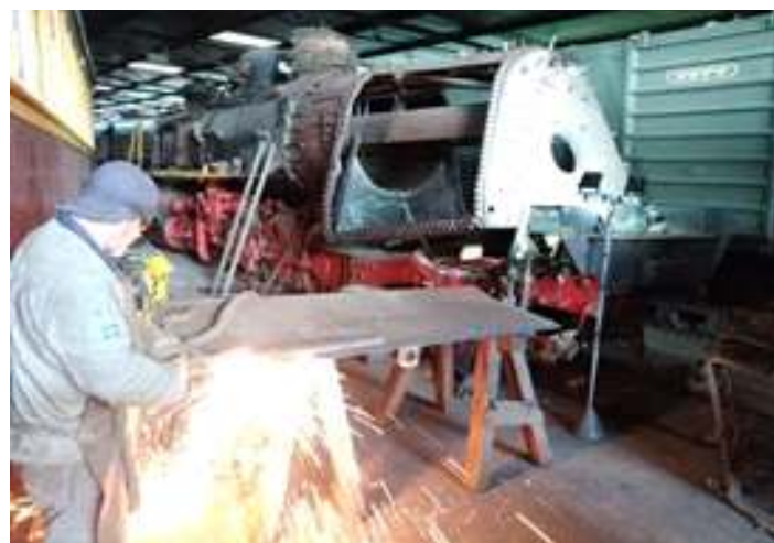
◆ Instalação da parte frontal e a preparação na nova chapa, lateral interna do lado esquerdo da locomotiva nº 156