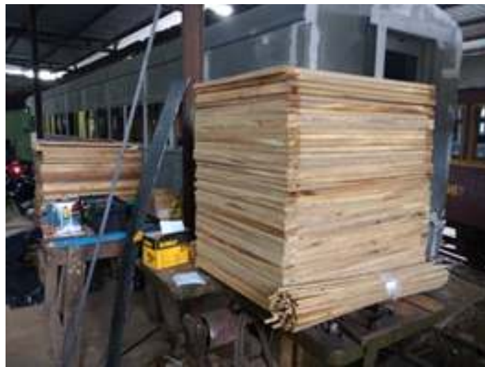
♦ confecção das novas janelas do carro PC-49