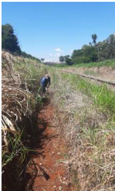
◆ Limpeza dos canais de água no trecho do km 10, área urbana, um dos piores trechos da ferrovia, pois os bairros despejam toda a água, que traz terra e lixo a margem da ferrovia.