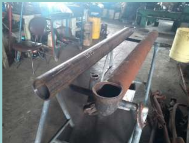
♦ O tubo antigo a direita e o novo a esquerda

Estamos confeccionando um novo tubo condutor de vapor além de uma nova válvula do regulador para a locomotiva nº5 ex. EFCB utilizada pela ABPF-SP no Trem dos Imigrantes, na capital paulista.