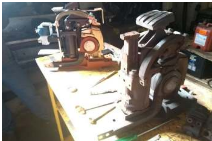
♦ Contadoras sendo reparadas