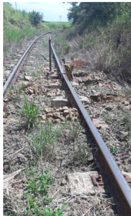
◆ Nivelamento próximo a junta dos trilhos!