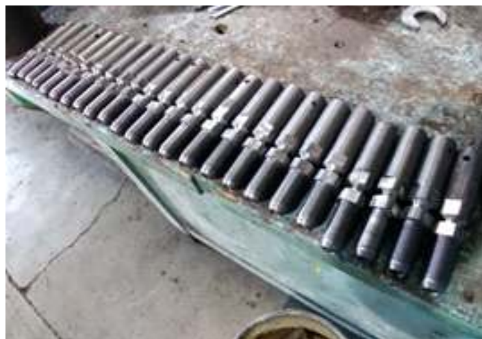
♦ Trabalho de usinagem na confecção dos fusíveis, última peça no importante sistema de PPV ((detector de descarrilamento de vagões)