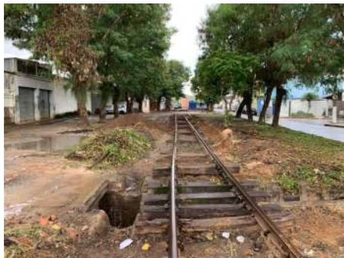
♦ Km 0+300 antes e depois da limpeza: próximo passo é remover o que restou dos dormentes e instalar novos