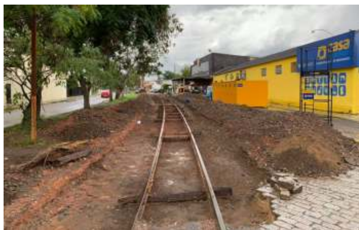
♦ Trabalhos no km 0+400