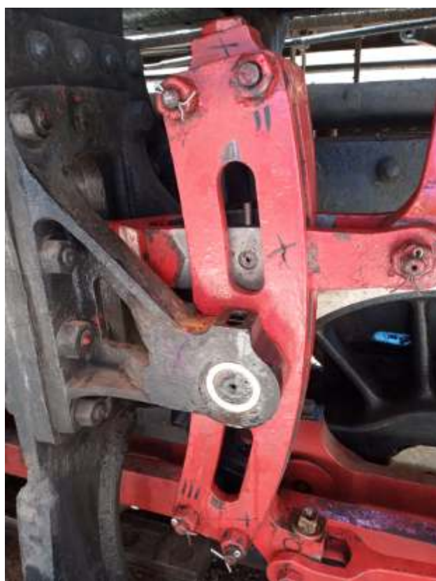
♦ Lado esquerdo já pronto da 505