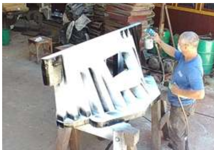
♦ Confecção de um novo limpa trilho que será enviado para a locomotiva Mogum nº 11 em Antonina (PR)