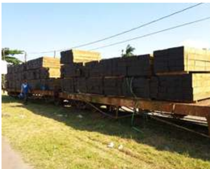
◆ Descarga de mais 900 peças de dormentes que serão aplicados no trecho entre Antonina (PR) e Morretes (PR)