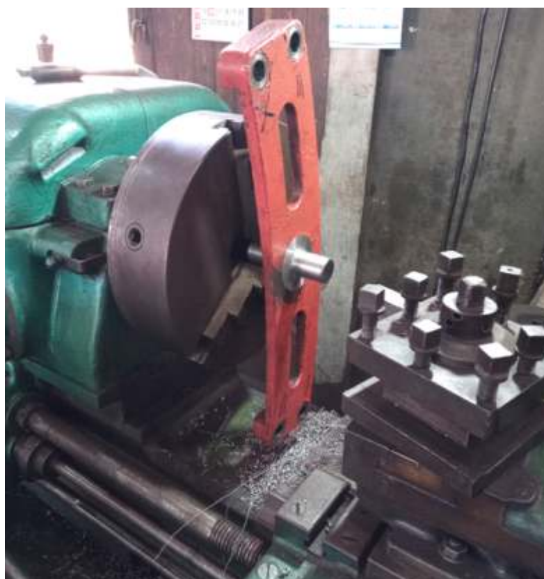
♦ Confeção de novo pino sendo usinado nas oficinas