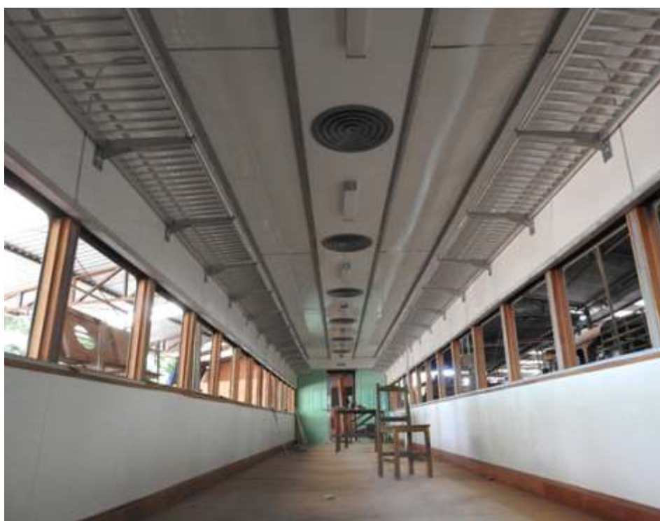
♦ Carro SC 145 já com os maleiros reconstruídos em alumínio