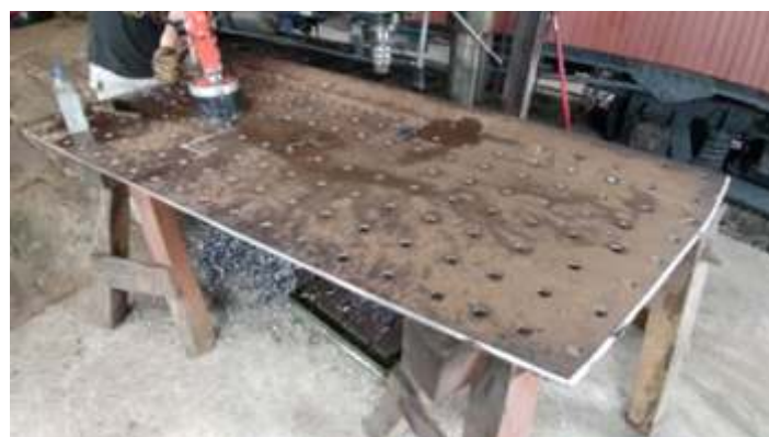
◆ Chapa lateral interna do lado esquerdo finalizando a furação dos estais