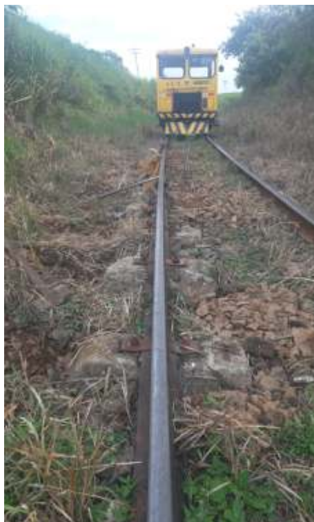
◆ Ajusteis pontuais de nivelamento ao longo do trecho.