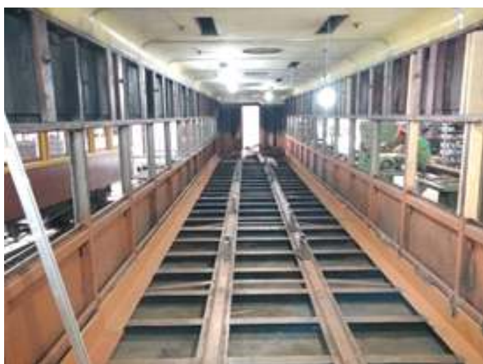
♦ Trabalhos no interior do carro PC-49 com a instalação do reforço com perfil de metal