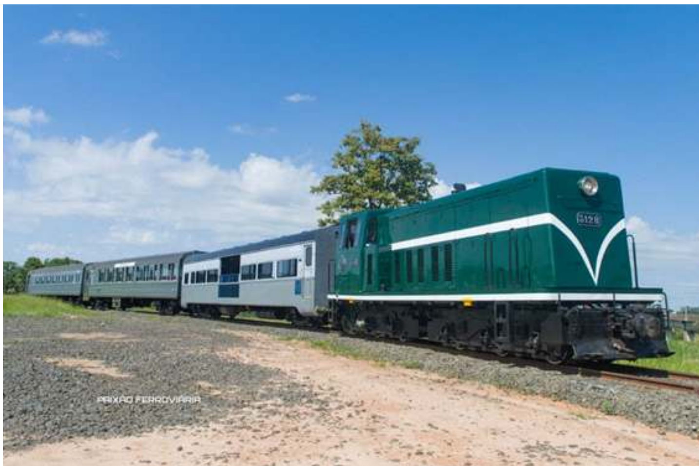
♦ Locomotiva 3128 em operação no trem Republicano.

A locomotiva diesel 3128 foi transportada para Itu, para operar conjuntamente com a número 3, no projeto do trem republicano. Agora estamos trabalhando na recuperação de algumas peças para reserva técnica, como por exemplo a recuperação de um motor de tração.