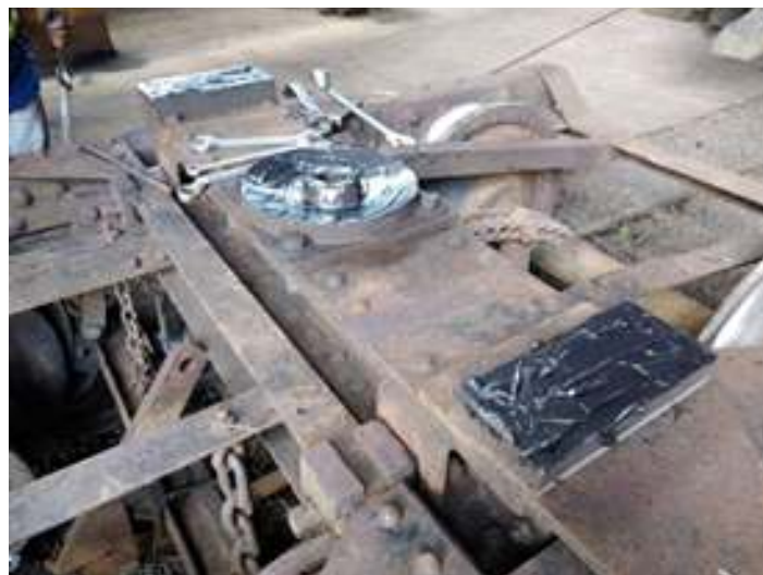
♦ Aspecto de como estão ficando os truques após os trabalhos

Tivemos ainda a realização do ultrassom dos eixos, procedimento realizado por nossa equipe de engenheiros com equipamento próprio, assim ocorreu já na sequência a inspeção de toda composição com a vistoria por representantes da Concessionária Rumo. Neste mês também tivemos a recuperação de plataformas e a substituição de pequenas vigas de madeira na cabeceira de alguns carros passageiros.