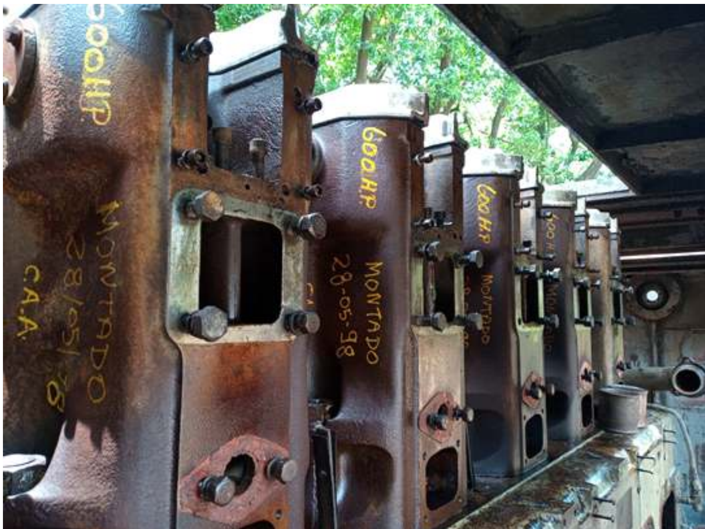
♦ Desmontagem dos tubos de admissão e escape, bem como limpeza dos cabeçotes da 3104