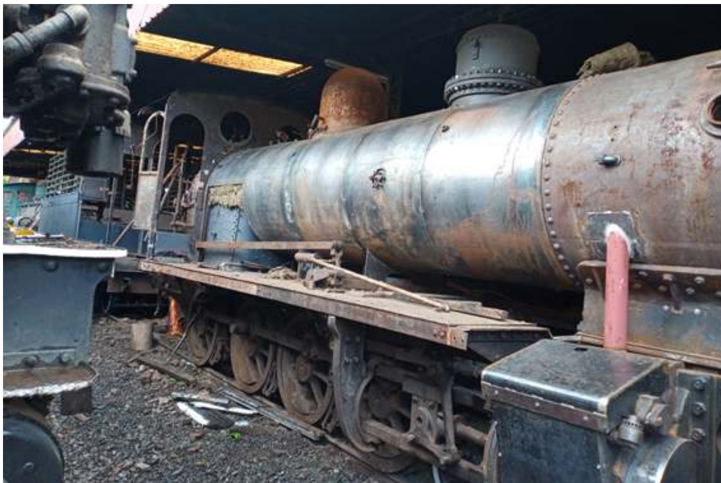
♦ Reconstrução do revestimento da caldeira, locomotiva EFA 8 e U. Amália 12.

Continuamos trabalhando na recuperação da locomotiva 8 de Ribeirão Preto.