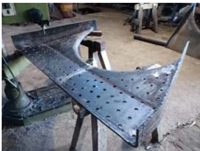
◆ Os trabalhos de usinagem na furação da chapa frontal interna da fornalha da locomotiva nº 156