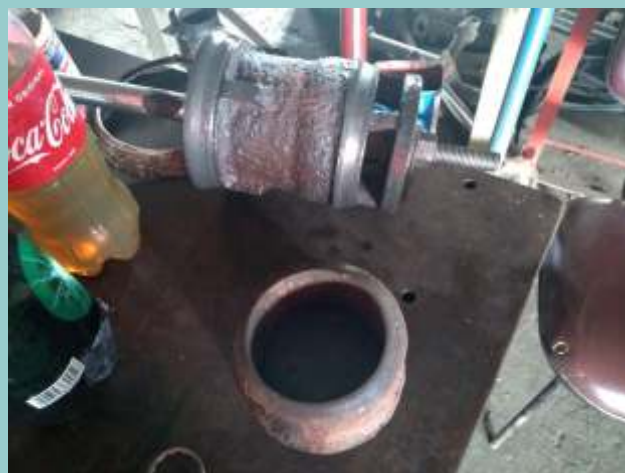
♦ A válvula antiga do regulador, bastante corroída