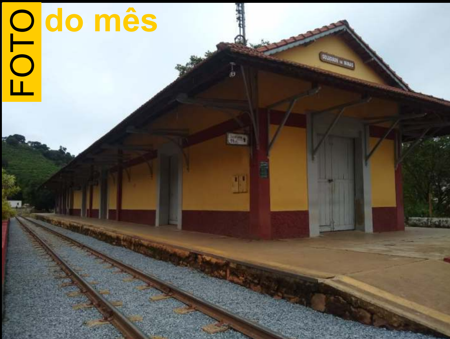
FOTO do mês

♦ A bela estação de Soledade de Minas, inteiramente recuperada e preparada pela ABPF para receber os passageiros. A via também foi toda recuperada, recebendo novos dormentes, alinhamento, nivelamento e novo lastro.