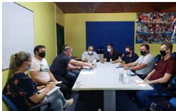
♦ Reunião histórica que reuniu os representantes governamentais e a ABPF dos municípios que integram o passeio do Trem das Termas

As atividades por lá também foram marcadas, com a volta dos passeios, pela retomada da aquisição de dormentes, que já estão sendo aplicados em nosso trecho do Trem das Termas. Ocorreram diversas melhorias no pátio da estação e a via permanente também vem trabalhando na limpeza de vala de contenção.