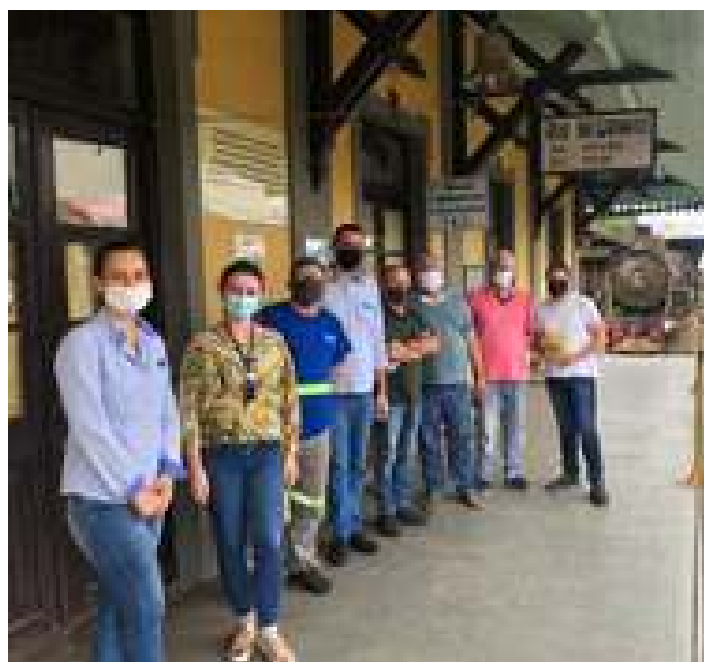
♦ Comitiva de representantes dos setor de turismo