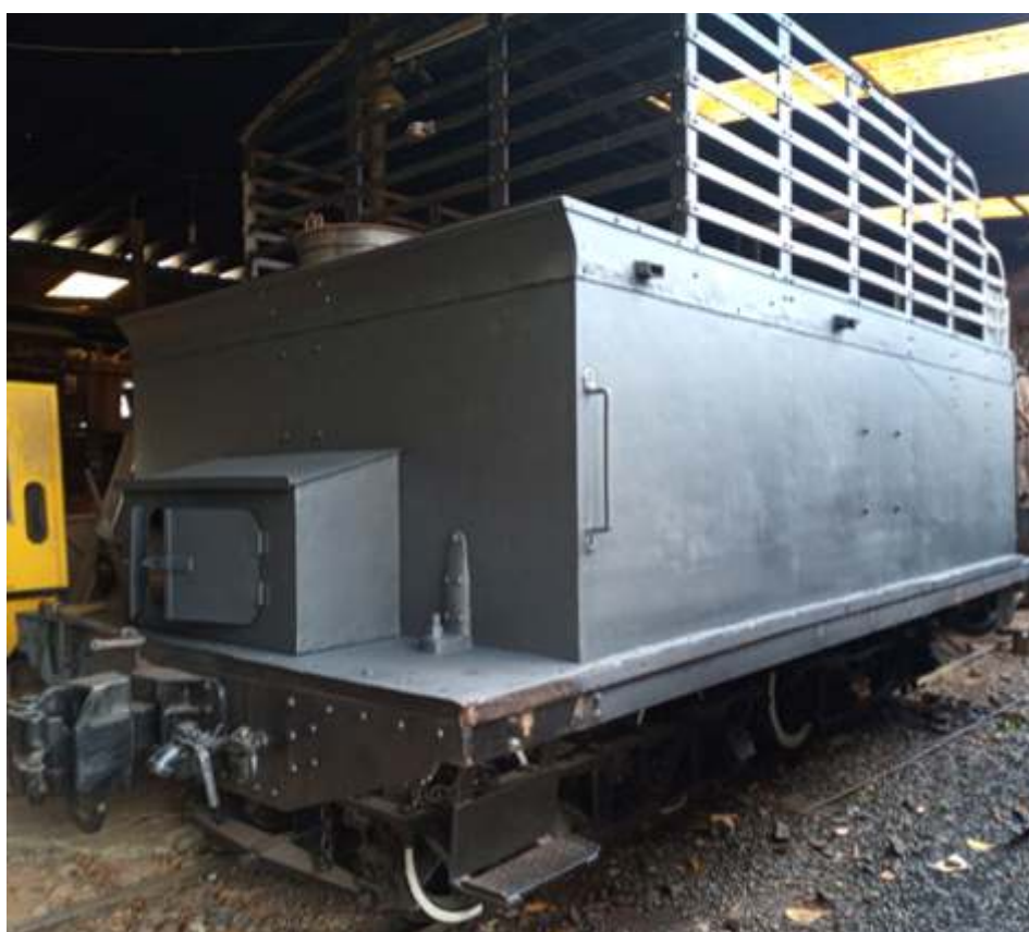
♦ Tender da locomotiva 12.

Também aos finais de semana estamos fazendo limpeza, levantamento de peças faltantes, bem como o que terá que ser feito fora para ver o funcionamento do motor diesel da locomotiva GE 3104. Caso venha a funcionar, ai sim começará a revisão de parte elétrica.