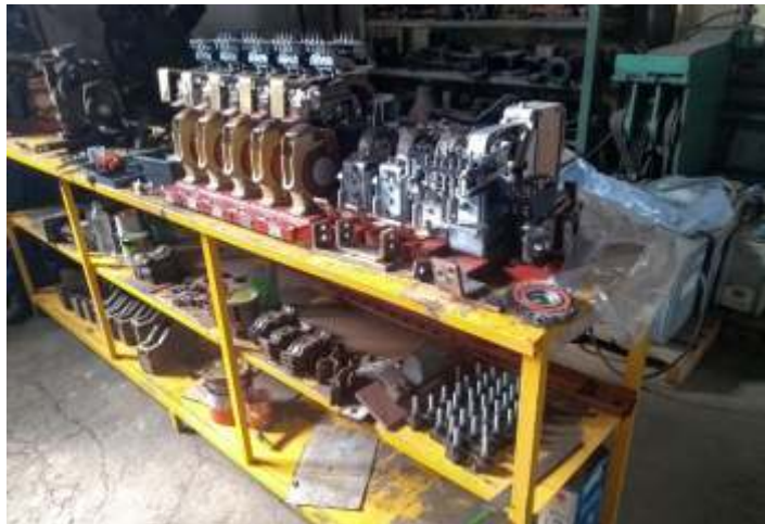
♦ Equipamento da 9380 sendo recuperado nas oficinas

Todos os componentes foram removidos da locomotiva e estão sendo trabalhados na bancada pelo nosso electricista Sebastião, que analisou e testou um por um antes da desmontagem e reparação. Todo esse trabalho está sendo realizado nas oficinas de Cruzeiro da ABPF.