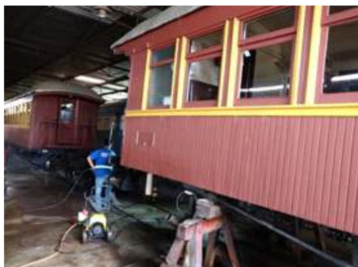
♦ Revisão do carro passageiro PM – 33