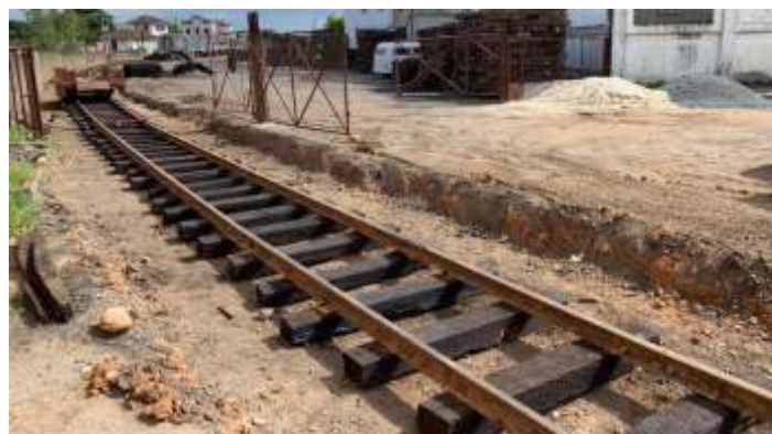
♦ Trabalhos no km 0+100; do início do desaterramento da via a limpeza, instalação de novos dormentes e pregação