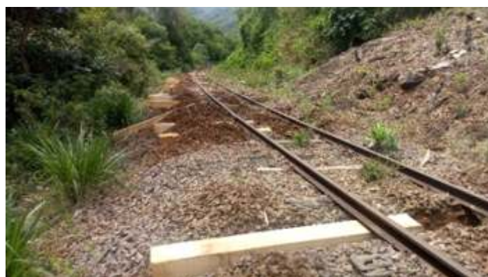
♦ Retomada os serviços na via permanente na aplicação de dormentes no trecho entre Piratuba (SC) – Marcelino Ramos (RS)