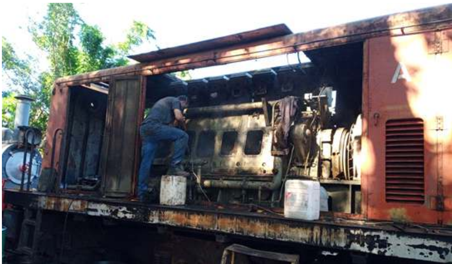
♦ Lavagem interna do motor diesel da locomotiva 3104