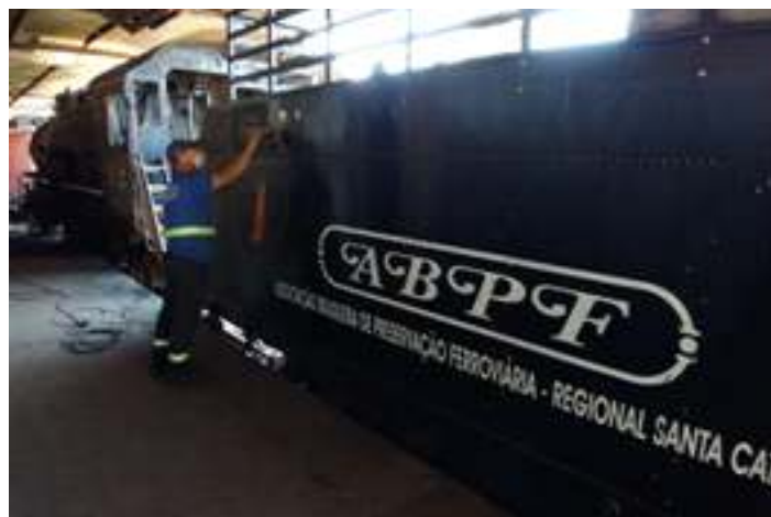
♦ Raspagem e retirada das camadas de tinta nos trabalhos de funilaria na locomotiva Mikado nº 760