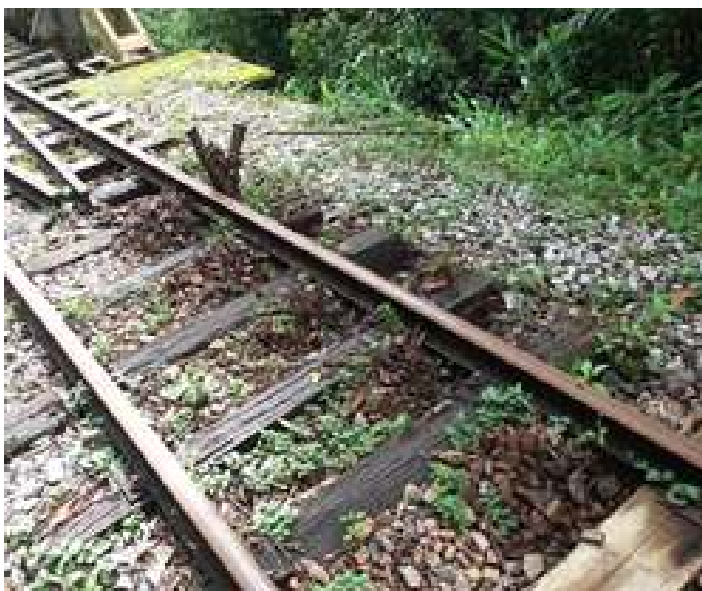
◆ Os trabalhos de aplicação de dormentes e nivelamentos do trecho do Trem Caiçara