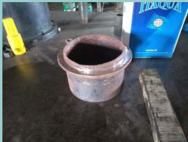
♦ Conexão frontal do tubo condutor, onde acopla-se o «T» que distribui o vapor para os dois cilindros