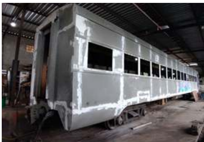
♦ Finalização da funilaria do carro PC-49