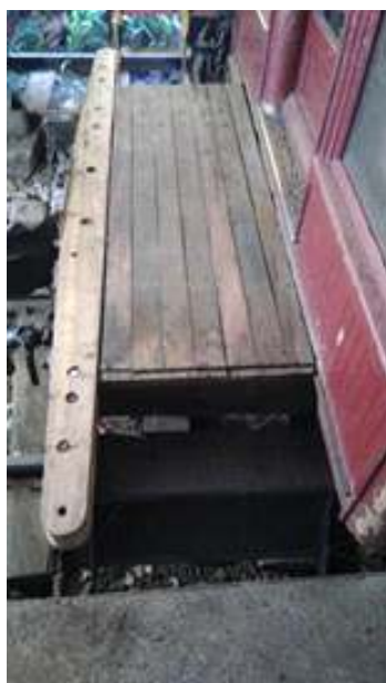
♦ Novas peças em madeira estão sendo confeccionadas para as plataformas dos carros passageiros