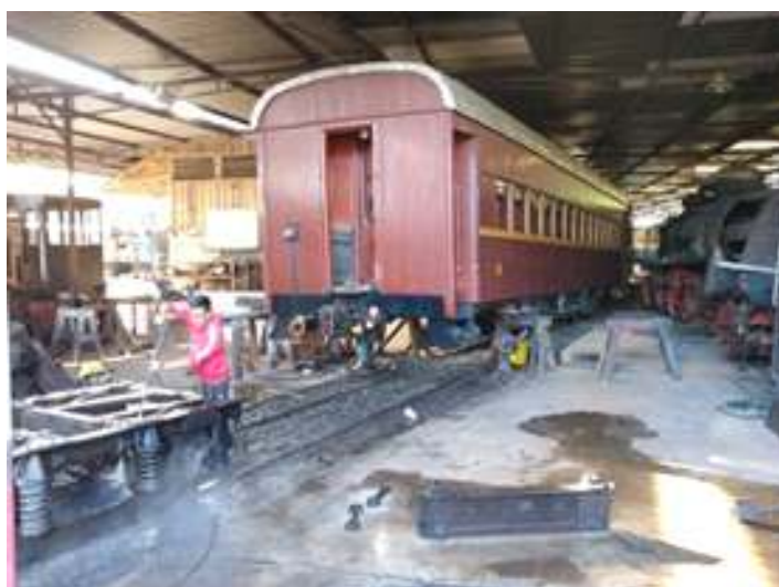
♦ Revisão da parte rodante dos carros PD 34 e PD 33