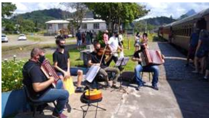
♦ Animação da bandinha na estação de Corupá

Também tivemos este mês, mais uma vez a renovação do Regulamento de Operação (RO), com avaliação, aplicada por representante da Concessionária Rumo. Esta avaliação deixa apto todos os colaboradores e associados da regional sul a estarem acessando as áreas operacionais da malha ferroviária da Rumo. Nos mesmos moldes, através do módulo, um e dois, deixa apto nossa equipe de máquinas, condutores e manobreadores a realizarem as mais diversas operações. Este já é quinto ano que ocorre esta avaliação, que contou com a presença de todos os envolvidos na operação do Trem da Serra do Mar, Trem das Termas, Trem Caiçara e os associados do Rio Grande Sul envolvidos já no futuro Trem dos Vales.