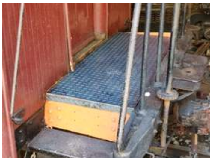
♦ Restauração das plataformas do carro passageiro PD - 34