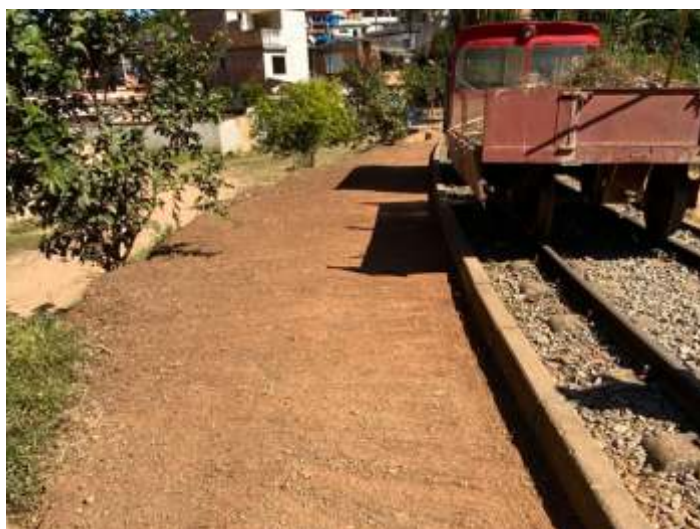
♦ Limpeza da faixa de domínio ao longo do trecho