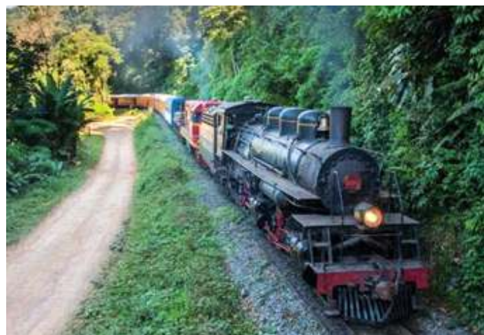
♦ Trem da Serra do Mar com duplex no Km 124