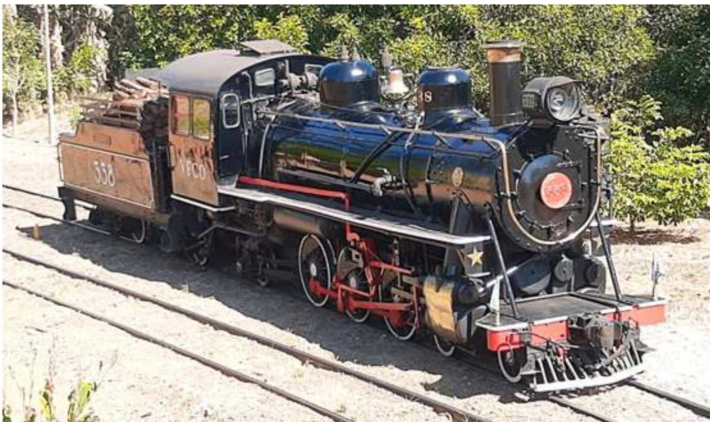
♦ Locomotiva 338 limpa e encerada pelo Pedro Etter e Eric Gazetta.