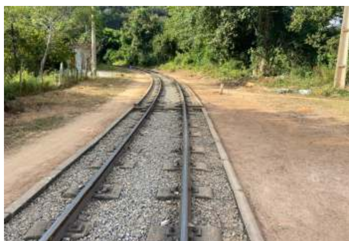
♦ Limpeza ao longo do trecho