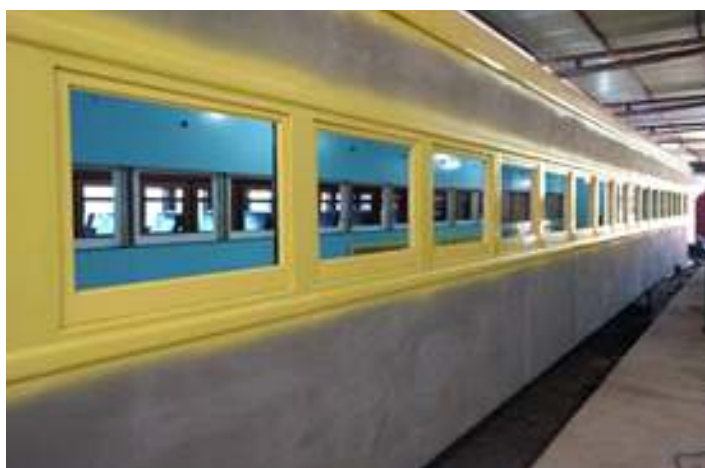
♦ Exterior do carro Cacique recebendo a segunda cor

Também realizamos a pintura das janelas, essas ao contrário das originais que eram de inox, agora será de madeira. Na parte interna ainda deu-se início a instalação do novo sistema elétrico, com recolocação da fiação. Já temos instalado os ventiladores, que são os originais, faltando uma peça, que terá que ser providenciada. Já na parte externa ocorreu pintura da segunda cor na caixa do carro, essa cor vermelha com a faixa amarela na linha das janelas, são as originais da composição do Trem Cacique.