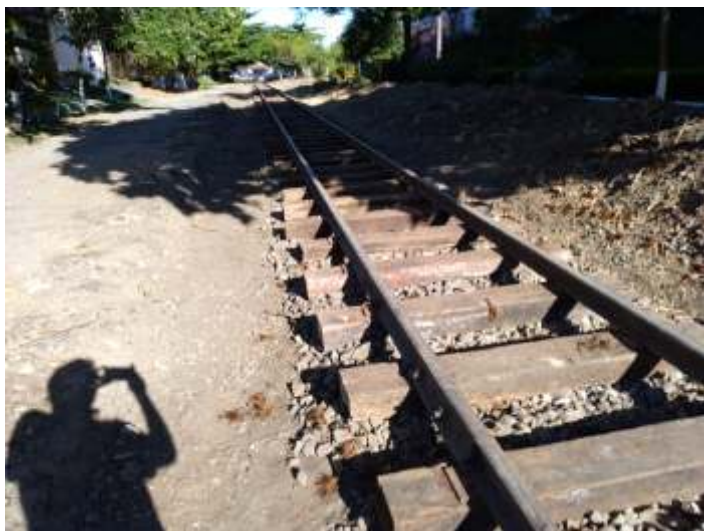
♦ Aspecto do km1+100 após os trabalhos de recuperação

Seguem em bom ritmo os trabalhos na linha que sai de Cruzeiro e segue para a Serra da Mantiqueira estação; cerca de 1,3km já estão prontos. Essa é a Segunda etapa para a implantação de um trem turístico em Cruzeiro que, a princípio, sairá da estação central e seguirá até a estação Rufino de Almeida. A terceira etapa será a recuperação do trecho entre Rufino de Almeida e o túnel grande, no alto da serra, na divisa com Minas Gerais, totalizando 23 km de linhas recuperadas.