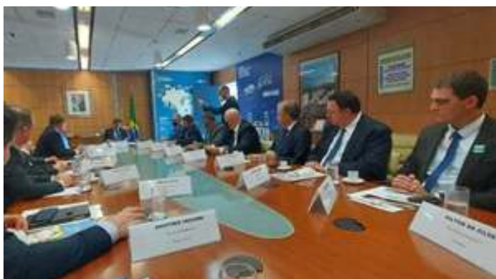
◆ A reunião com pauta da Infraestrutura