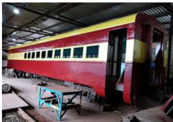
♦ Carro da ex E.F. Leopoldina sendo pintado na cor original da composição do Trem Cacique