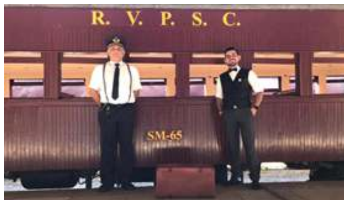
♦ Um dia de homenagens aos ferroviários que moram no entorno do projeto do Trem Caiçara