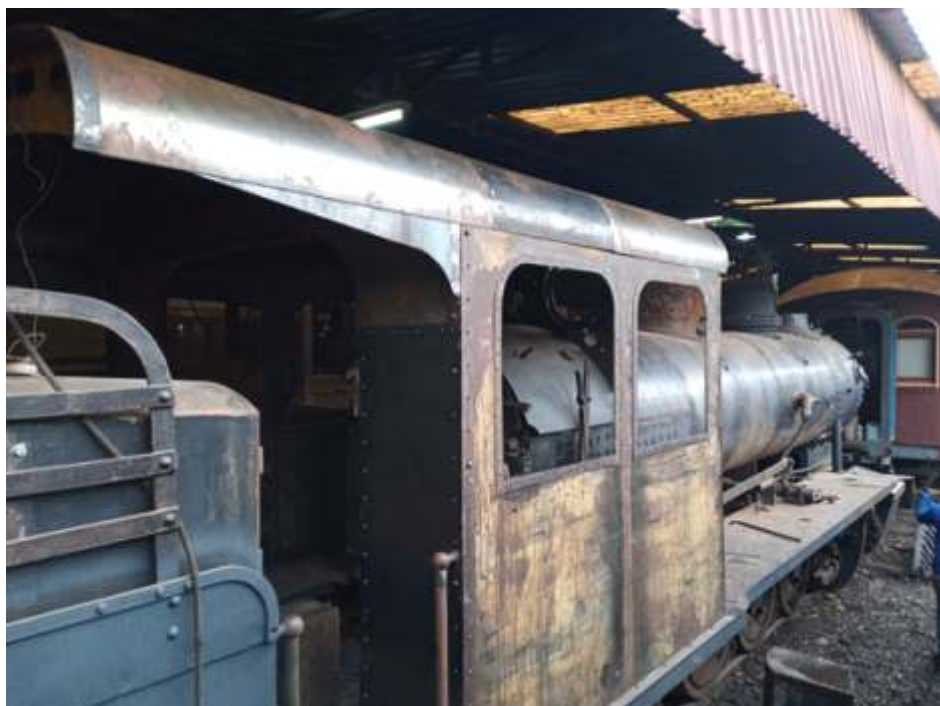
◆ Lateral Locomotiva 8 – ex EFA

para receber sua nova pintura. Também foi acesa para manutenção a locomotiva 50 na estação Anhumas.