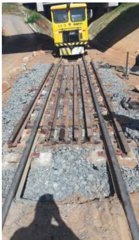
◆ Construção da PN no km 10