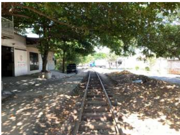
♦ Aspectos do antes e depois das obras no km1+150