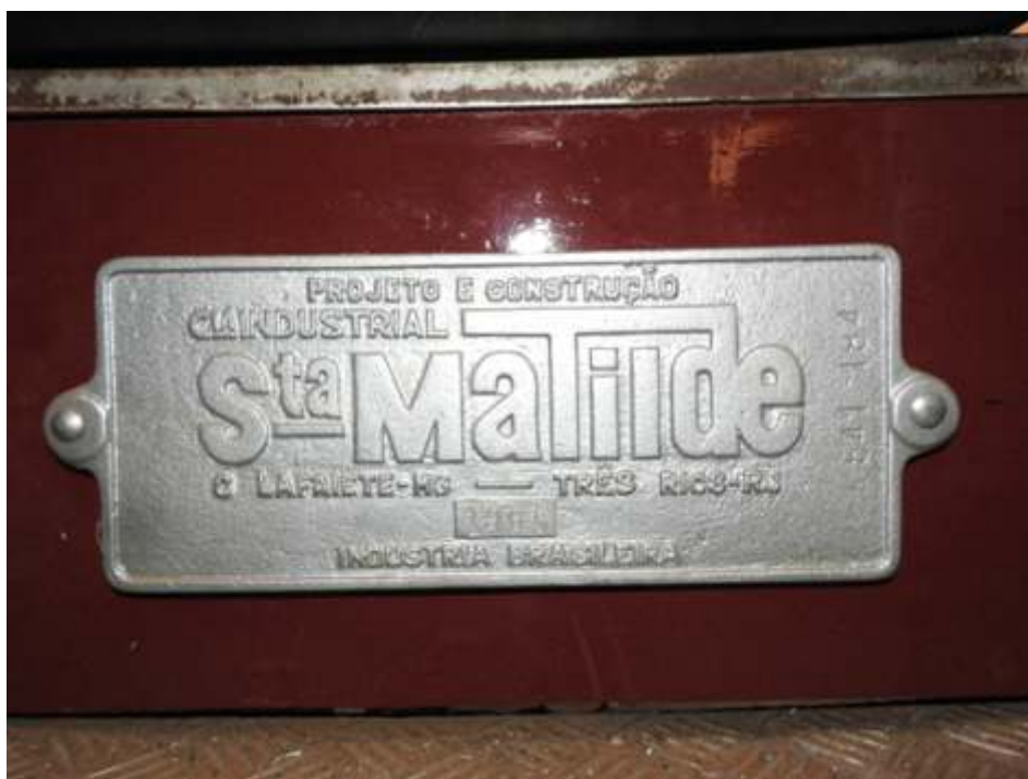
♦ Placa do fabricante colocada nos degraus do carro.