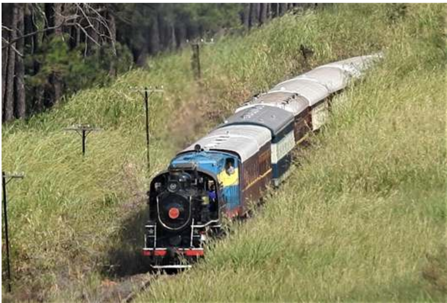
◆ Trem sentido Pedro Américo no km 14

O mês de maio foi um bom mês de visitantes, não como antes, mas devido o atual cenário, conseguimos passar o mês com equilíbrio. Esperamos que tudo melhore e que os próximos continuem cada vez melhores!