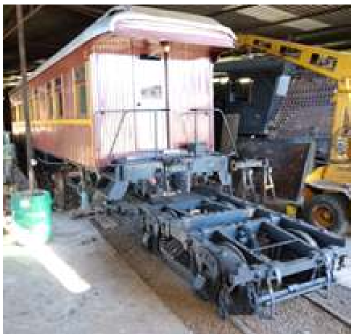
♦ Carro SD – 39 recebendo o novo truque confeccionado em nova própria marcenaria

Já os trabalhos para a retirada da locomotiva Mikado nº 632 de dentro da antiga oficina de vagões da Rumo, em Mafra/SC ocorreu com sucesso no dia 13/05, a descarga foi no dia seguinte. Tanto o tender, como a locomotiva foram erguidos pelo guincho Orton III da Rumo, uma operação que nos ajudou e facilitou muito no resgate desta máquina. Já em Rio Negrinho a máquina, assim como o tender foram preparados e desembarcados através da rampa, assim a máquina desceu rodando após década parada. Esta locomotiva, ex Estrada de Ferro São Paulo – Rio Grande, que também pertenceu a Rede de Viação Paraná – Santa Catarina, foi construída pela The Baldwin Locomotive Works, em abril de 1925. Esse modelo de Mikado era chamado aqui no estado de “Rainhas da Serra”, sendo as máquinas que realizavam os trechos mais pesados e os de serra, como o de Corupá até Rio Vermelho (SBS) e a de Porto União até Caçador. Agora a máquina será abrigada em nossas oficinas e ficará em exposição até o dia de sua reforma.