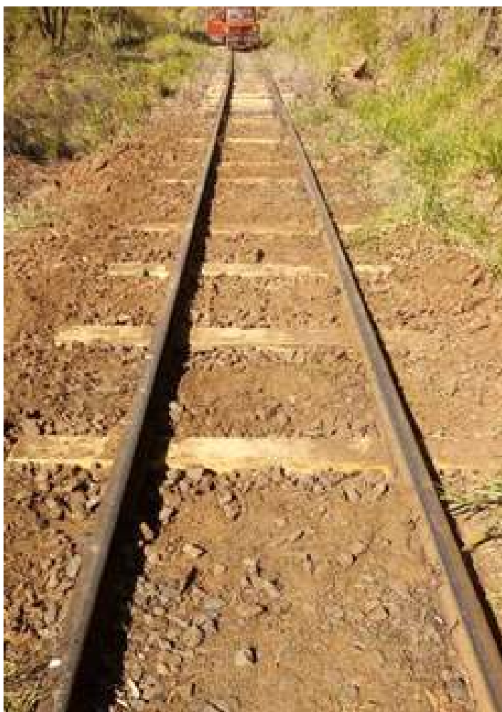
♦ Melhorias no Km 855+300