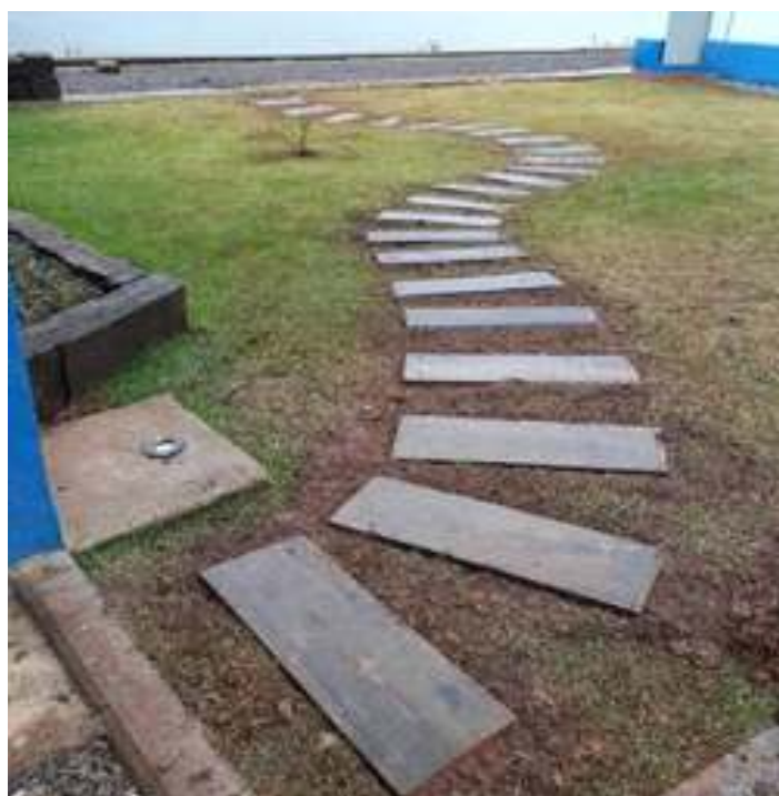
♦ Melhorias no entorno da estação de Marcelino Ramos/RS

Já do lado gaúcho, na estação de Marcelino Ramos a “Associação dos Artesões da Estação Ferroviária” estão trabalhando no entorno da estação, com melhorias no jardim. Estão sendo aplicadas peças de dormentes que foram retiradas, na reforma da ponte sobre o Rio Uruguai. A equipe de via permanente leva as peças até o local e os artesãos, que hoje são os responsáveis pelo local da realização este belíssimo trabalho.