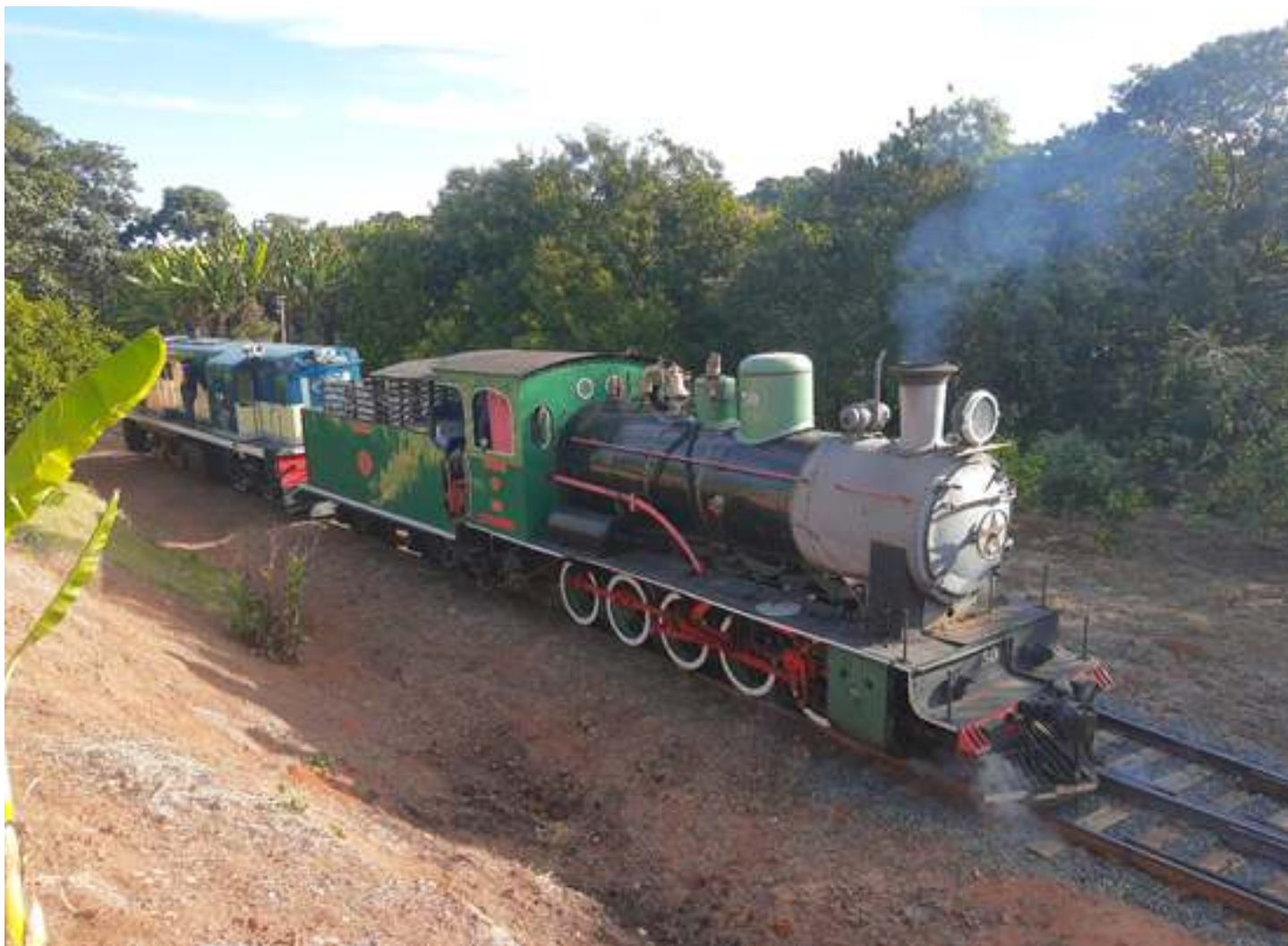
♦ Locomotiva Henschel número 50 acesa para manutenção.