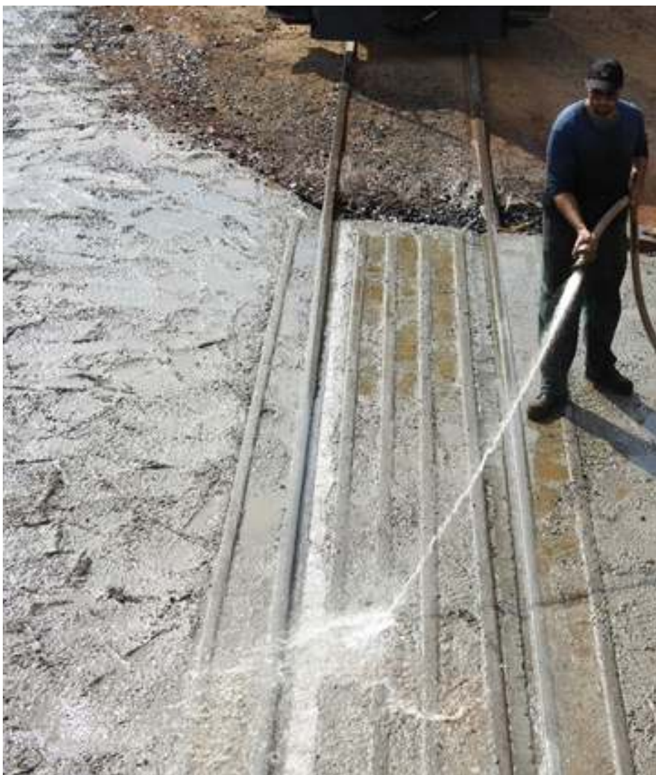
◆ Pedro Etter molhando o concreto da PN no km 10.