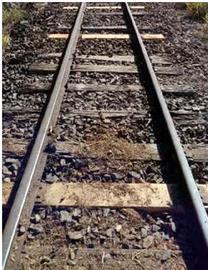
♦ Melhorias no Km 860+700

Já do lado gaúcho, na estação de Marcelino Ramos a “Associação dos Artesões da Estação Ferroviária” estão trabalhando no entorno da estação, com melhorias no jardim. Estão sendo aplicadas peças de dormentes que foram retiradas, na reforma da ponte sobre o Rio Uruguai. A equipe de via permanente leva as peças até o local e os artesãos, que hoje são os responsáveis pelo local da realização este belíssimo trabalho.