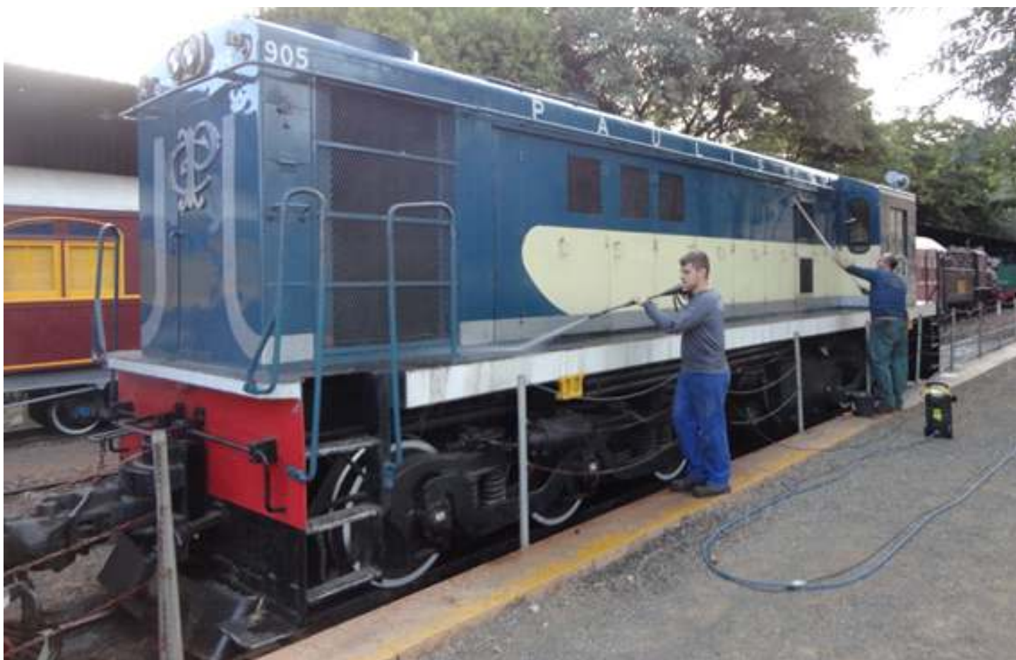
♦ A ALCO também recebeu um talento....