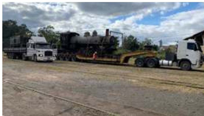
♦ Resgate da locomotiva Mikado nº 632 de dentro das antigas oficinas de vagões da Rumo em Mafra