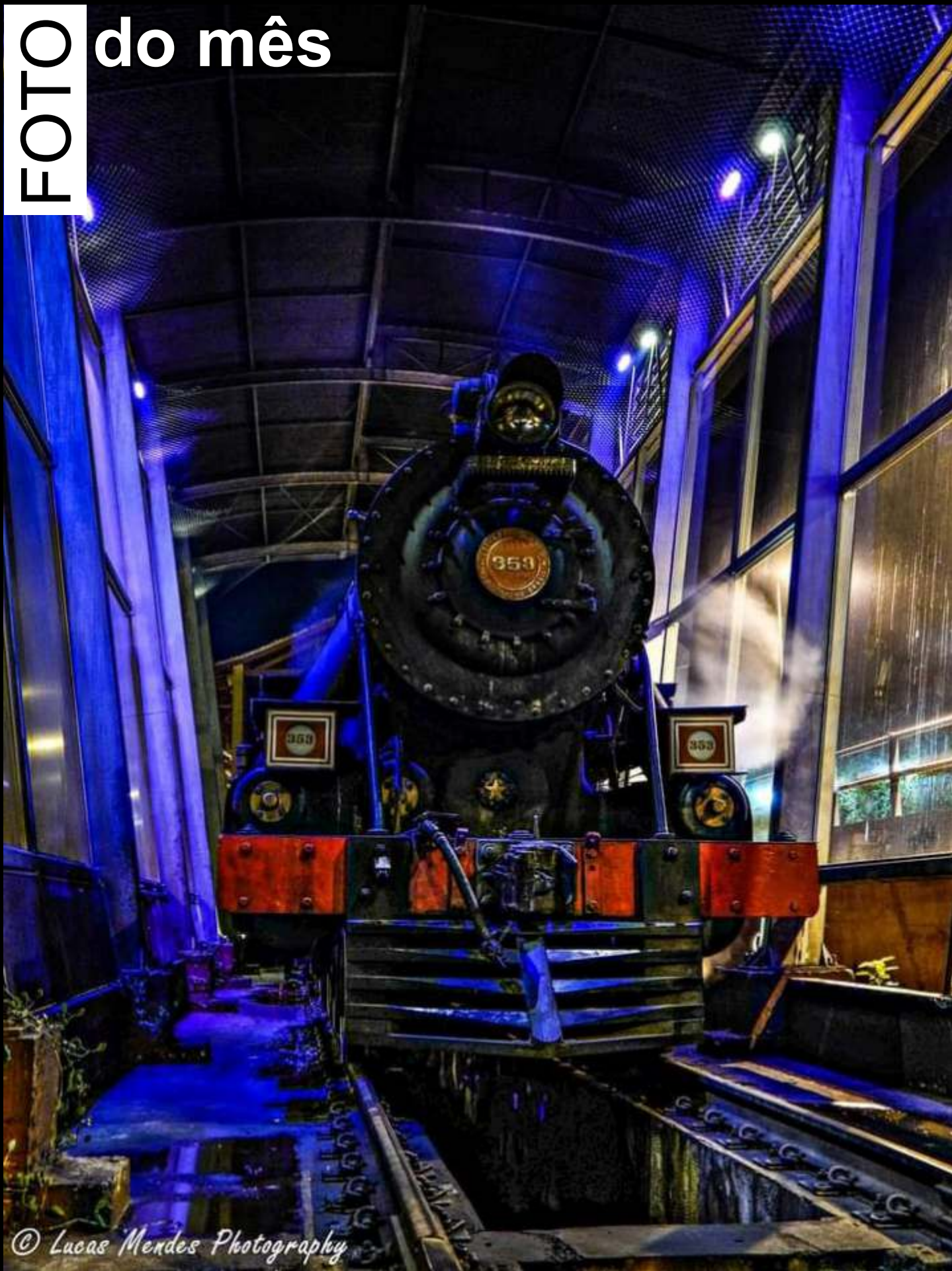
FOTO do mês