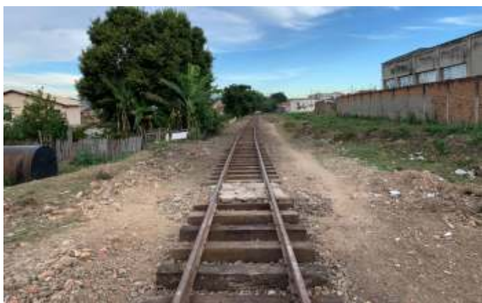
♦ Km 1+300: aspectos de antes e depois das obras