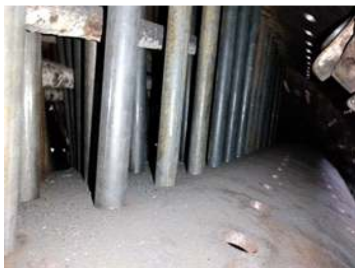
♦ Início da instalação do estais fixos, os rígidos