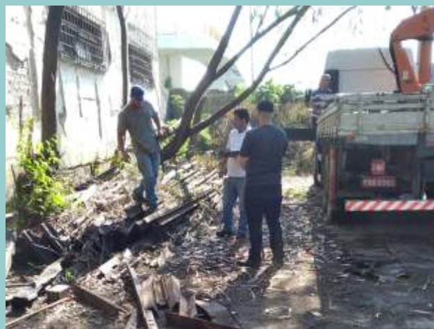
♦ Preparação para carregamento no pátio do Irajá

Mais uma vez, externamos nossos agradecimentos ao DNIT, a PRF e ao MPF pelo apoio e sensibilidade para com a nossa causa, que é o resgate e a valorização da memória ferroviária nacional.