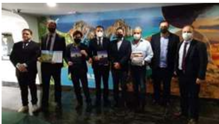
◆ Encontro na Embratur