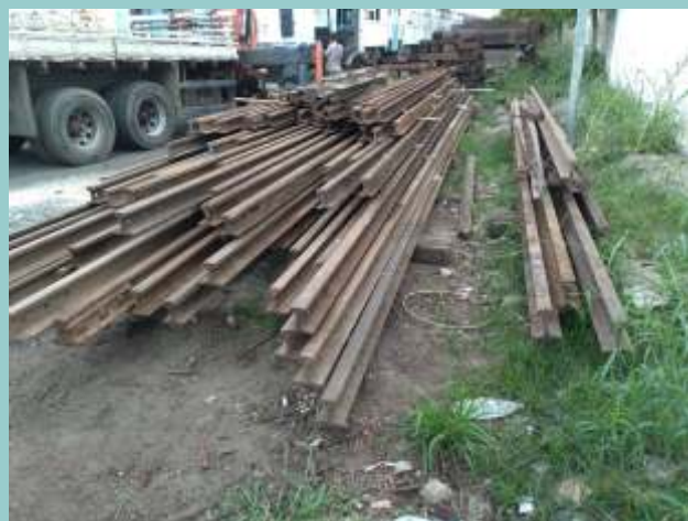
♦ Os trilhos já no pátio da ABPF em Cruzeiro/SP