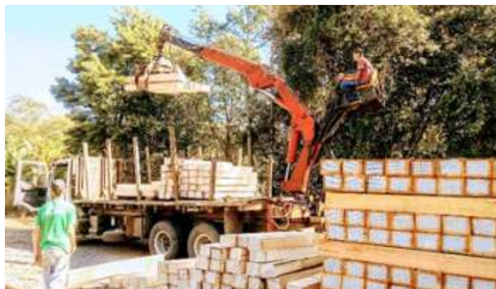
♦ Mais um pequeno lote de dormentes, estes adquiridos com recursos próprios

Em Piratuba, as atividades na via permanente se concentram na aplicação de dormentes ocorrendo nas curvas mais importantes. Este mês recebemos mais um pequeno lote de dormentes, estes adquiridos com recursos próprios. Aplicamos dormentes no Km 857+100, local onde ainda realizou-se a limpeza de lastro, limpeza de passagem de nível e alinhamento de junta. Outros dois pontos que receberam atenção foram os Km 855+300 e Km 860+700, são trechos de reta, mas que também aguardavam estes reparos. Agora com a chegada do frio, iniciamos as podas e os desbastes da vegetação, pois no verão há um enorme perigo por picadas de animais peçonhentos.