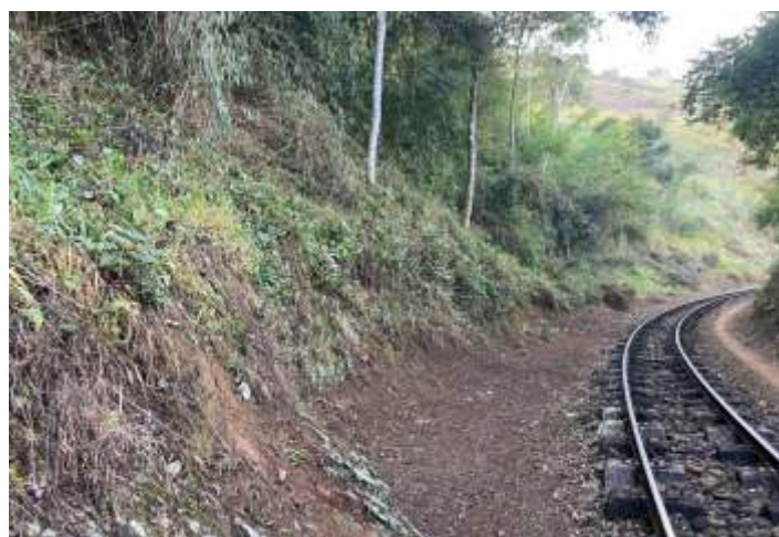
♦ Limpeza ao longo do trecho