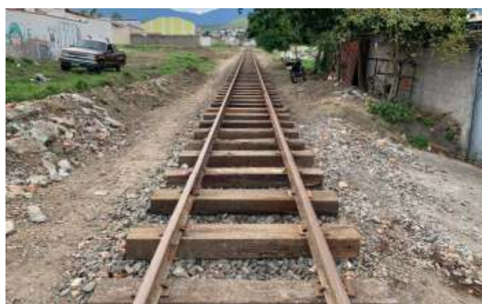
♦ Km 1+250: aspectos de antes e durante as obras