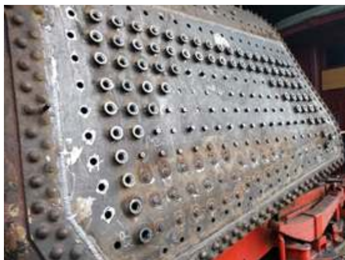
♦ Fixação das duas últimas chapas na montagem da fornalha da loc. nº 156 com os serviços de soldas definitivos