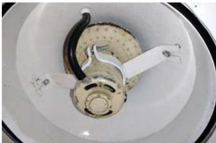
♦ Com a nova instalação elétrica são instalados os primeiros ventiladores no carro Cacique