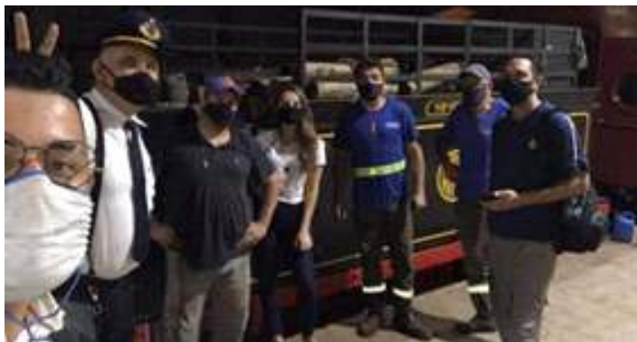
♦ Equipe do Trem Caiçara e voluntários aplicando novo piso no carro administrativo