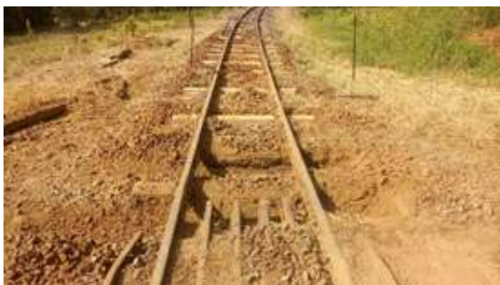
♦ Melhorias com aplicação de dormentes no Km 857+100, o local ainda recebeu limpeza de lastro e limpeza de passagem de nível