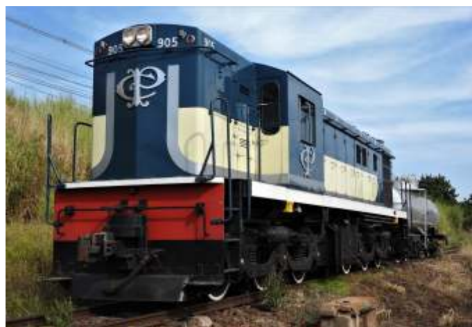
♦ A ABPF preserva hoje duas ALCO modelo RSD8 originárias da Companhia Paulista de Estradas de Ferro