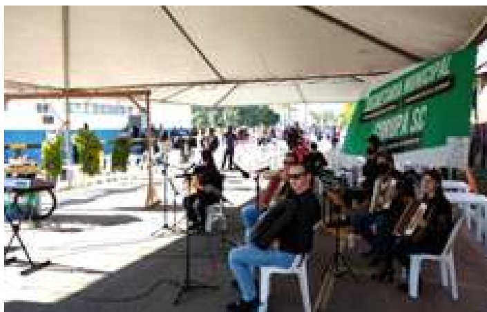
♦ Composição do Trem da Serra do Mar posicionada já sobre a passagem de nível e a contribuição através da prefeitura de Corupá com tendas e bandinha