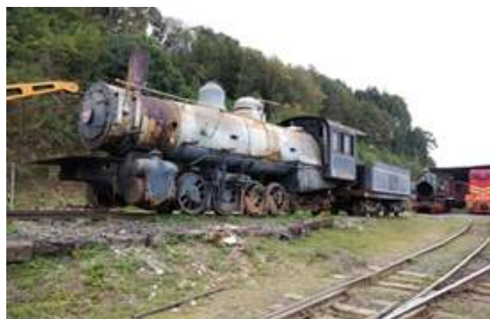
♦ Já em Rio Negrinho, a primeira movimentação da locomotiva Mikado após décadas parada