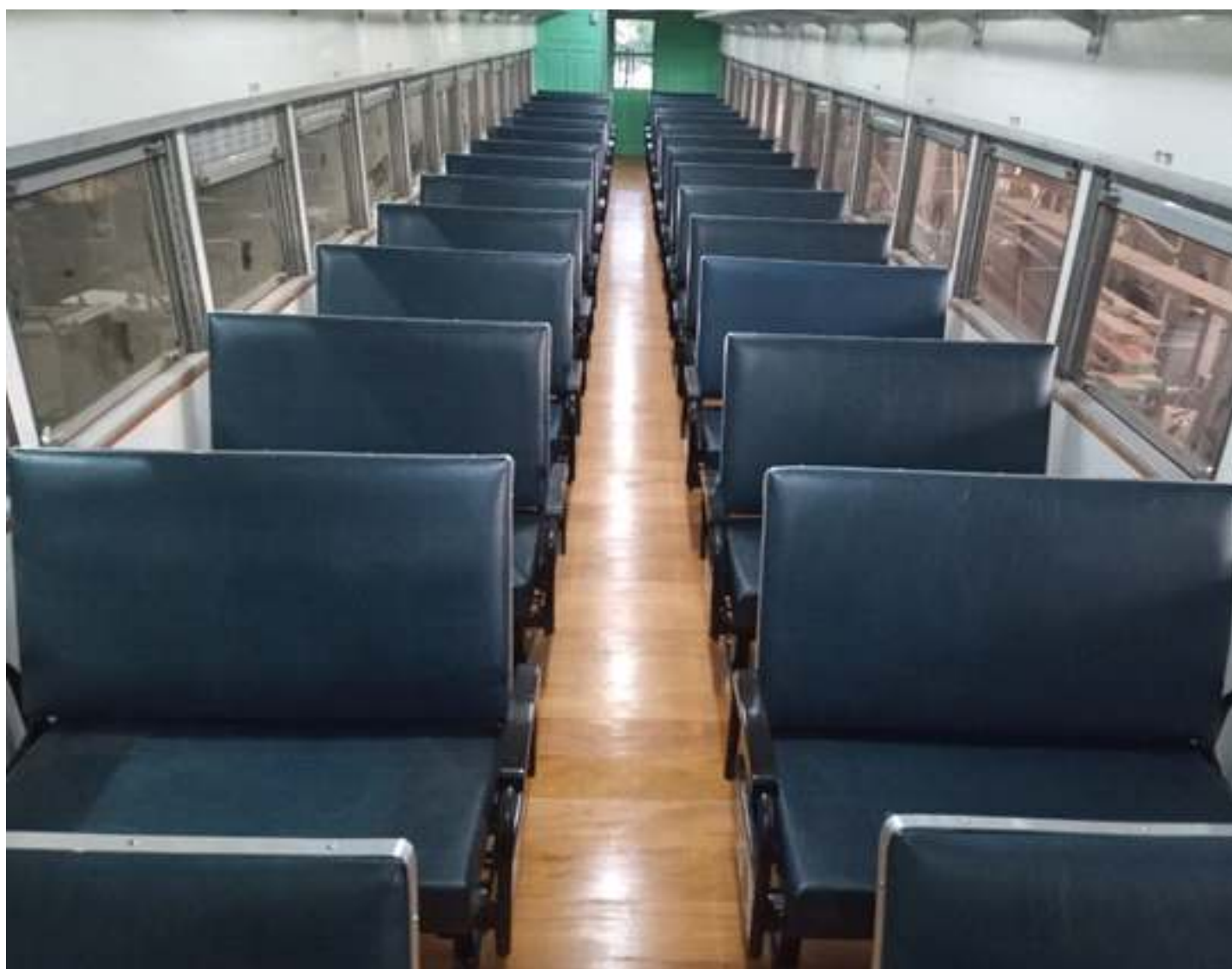
♦ Carro SC -145 da EFVM já com o mobiliário concluído e instalado