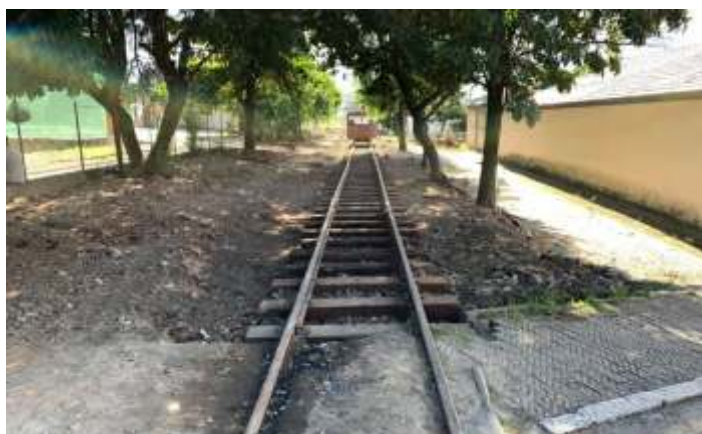
♦ Aspectos antes e depois ao longo do km1+200