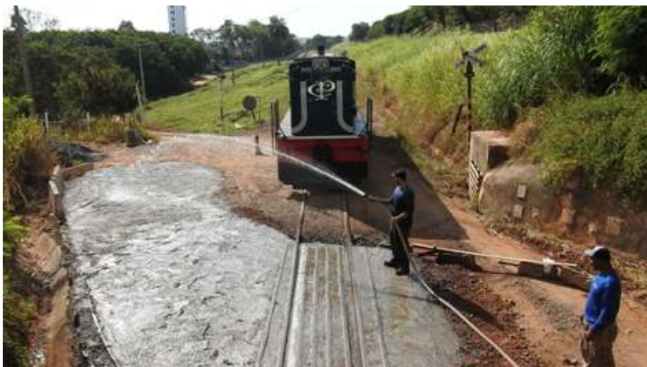
◆ Aspecto da PN após concretagem

Finalizando agradecemos a participação de todos os colaboradores e associados que ajudam em diversas funções na VFCJ.