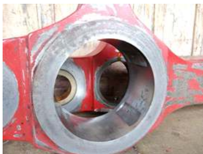
♦ As duas novas buxas de bronze e usinagem das brassagens agora na tolerância correta