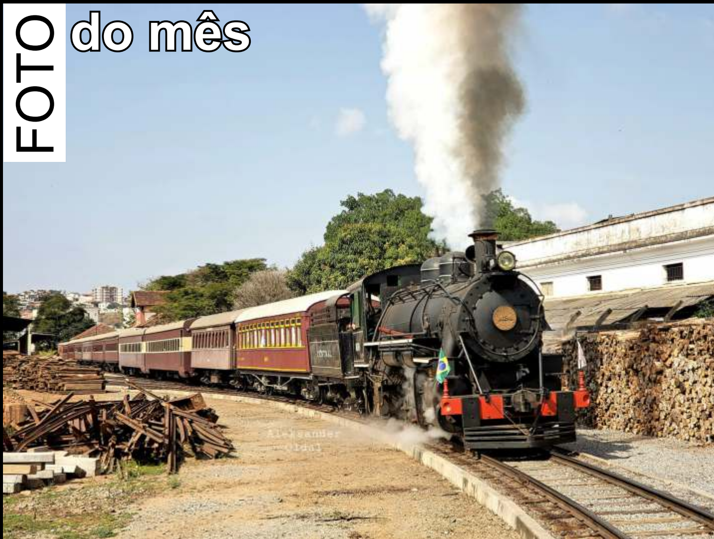
♦ Locomotiva 1424 partindo com 11 carros da estação de São Lourenço/MG.

Todo mês selecionaremos uma foto relacionada ao trabalho da associação publicada no grupo ABPF - Oficial no Facebook para publicar aqui.