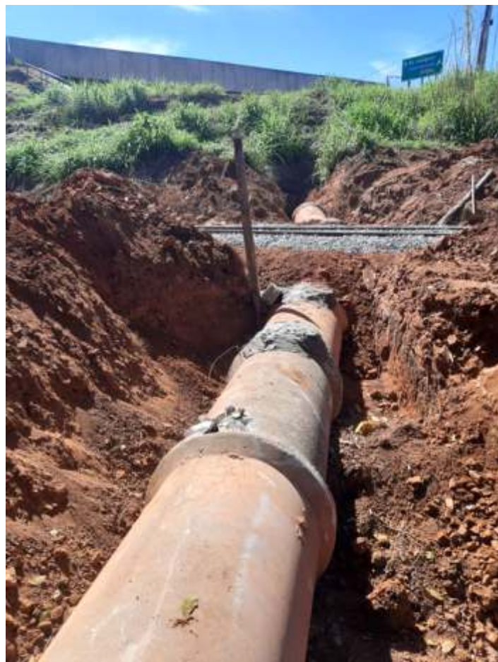
♦ Tubulação de água pluvial sob a via no km 10