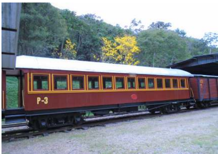
♦ Carros C02 e P03 com nova cobertura em manta asfáltica. Destacamos a primavera começando a dar o ar da graça.