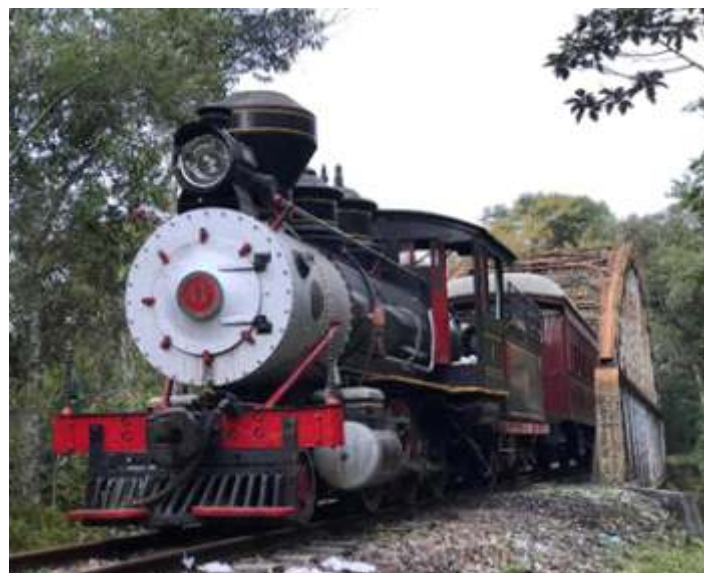
◆ Nossa locomotiva Mogul nº 11 passando por uma das pontes ao longo do passeio

O Trem Caiçara vem operando com saídas em todos os finais de semana e feriados, neste mês voltou a operar com duas saídas no sábado e duas saídas aos domingos. Assim como os demais passeios, este também apresentou o melhor resultado após a retomada pós-pandemia. Esse passeio garante agora uma “viagem no tempo” passeio que no estado do Paraná é único, a bordo de locomotiva a vapor, nossa recém restaurada Mogul nº 11, fabricada em 1884, uma das mais antigas em operação no Brasil. O trajeto do Trem Caiçara faz parte da Estrada de Ferro Dona Isabel, inaugurada em 1892, e se inicia ou tem o término na histórica Estação de Antonina reconhecida como Patrimônio Cultural Brasileiro e reformada, no ano de 2019, pelo Iphan-PR. O percurso entre Antonina (PR) e Morretes (PR), ou vice versa, tem duração de 50 minutos, atravessa uma grande área de Mata Atlântica, cruza áreas de rios, manguezais, além de propriedades rurais.