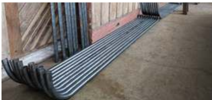
♦ Os antigos tubos do super aquecedor e a pré-montagem dos novos tubos do super aquecedor