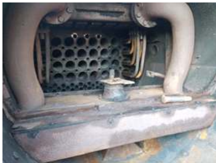
♦ Limpeza da caixa de fumaça da locomotiva nº 761