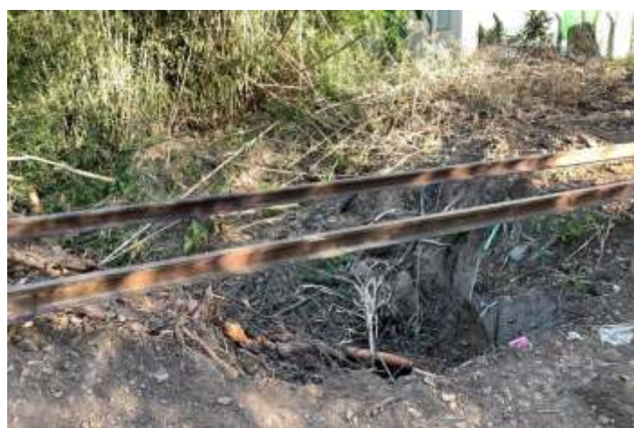
♦ Aspecto das obras nos km2+750 e 2+800