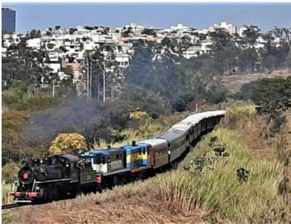
♦ Composição indo para Pedro Americo

Indo ao que interessa, as oficinas de locomotivas, estamos na fase final de acabamentos e início da pintura da caldeira da locomotiva 12 de Ribeirão Preto – SP. O tender já está 100% concluído e a locomotiva restam muitos poucos serviços a serem feitos, a maioria detalhes de acabamento. Esperamos que até dia 30 de setembro, ela esteja totalmente acabada e pronta para devolver a cidade de Ribeirão!