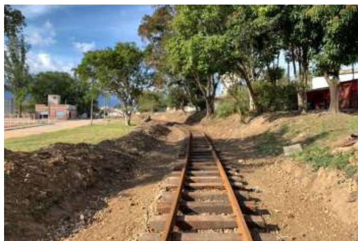
♦ Aspectos antes e depois das obras no km2+500