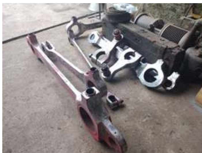
♦ Remoção das camadas de tinta nas braçagens e nos puxavantes da locomotiva Mikado nº 761