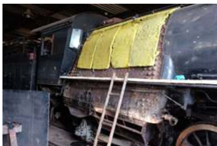
♦ Montagem do isolante térmico e da chaparia na nº 761