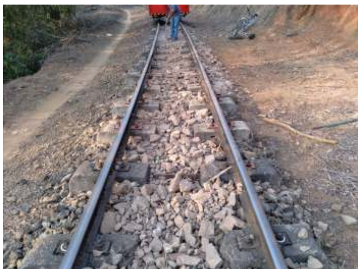
♦ Alinhamento, nivelamento e complementação de lastro no km 87+150