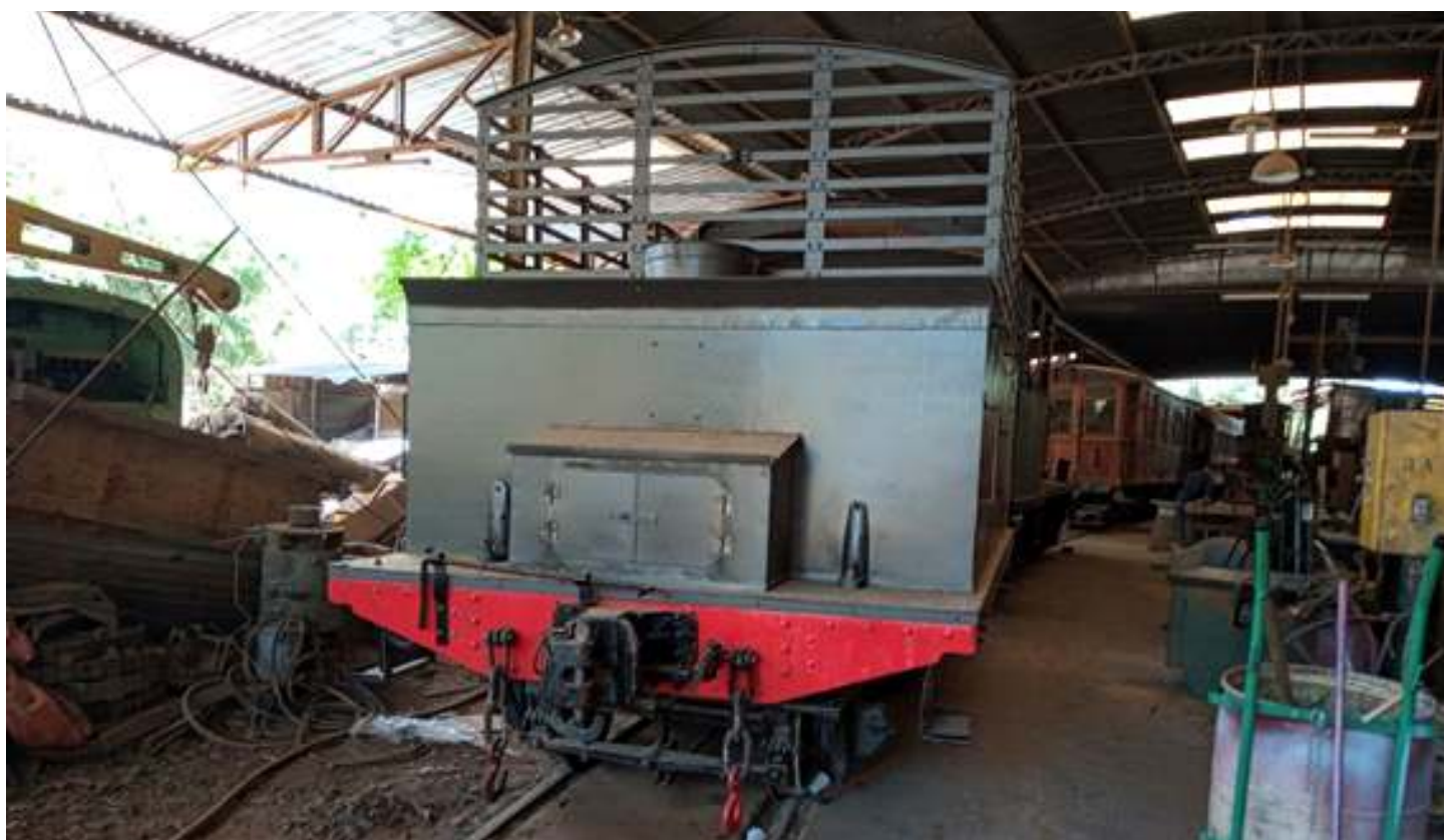
♦ Vista traseira do tender já concluído, ostentando sua cor original grafite.