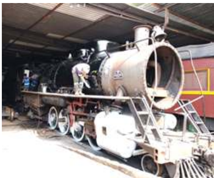
♦ Início da pintura da locomotiva Mikado nº 761