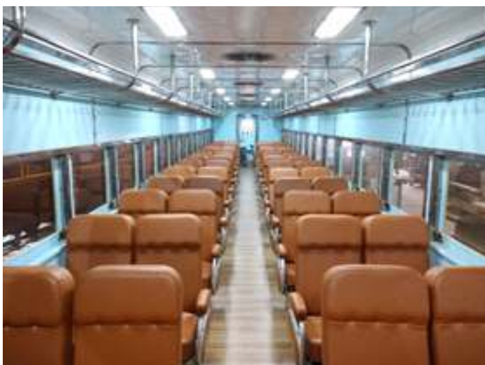
♦ Montagem e instalação das poltronas recuperadas no carro passageiro PC 49