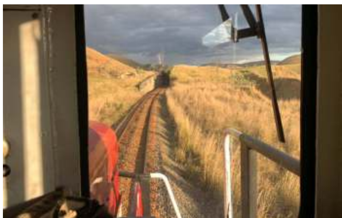
◆ A 9380 no trecho durante a viagem de teste

Foi feita uma pequena viagem de teste de Cruzeiro a Cachoeira Paulista e a locomotiva foi testada e aprovada tanto pela ABPF quanto pela MRS. Agora ela está pronta para retornar para o Trem de Guararema. A data da viagem ainda não está definida, mas será em breve e, a 9380 já deverá levar o carro de aço-carbono PC-926390-0F, inteiramente reformado nas nossas oficinas no ano passado, o primeiro dos carros resgatados de Santos Dumont a ser recuperado. O carro já foi testado e aprovado e atende as normais atuais de segurança e operação.