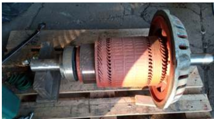
♦ Rotor do gerador auxiliar da locomotiva GL-8 57, já reformado

Os serviços na locomotiva a vapor número 10 de Indaiatuba, também foram concluídos, bem como o teste da caldeira e já entregue. Em breve o museu da cidade irá divulgar a reabertura do Museu, bem como da locomotiva entregue reformada.