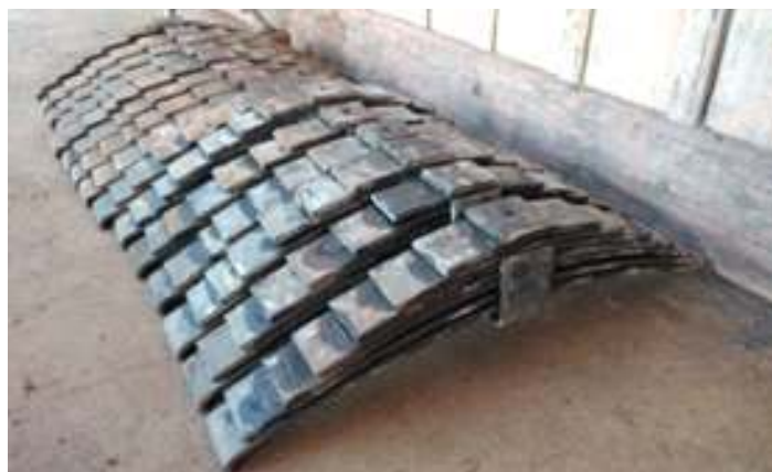
♦ Revisão completa de todo conjunto dos truques do carro passageiro PC 49