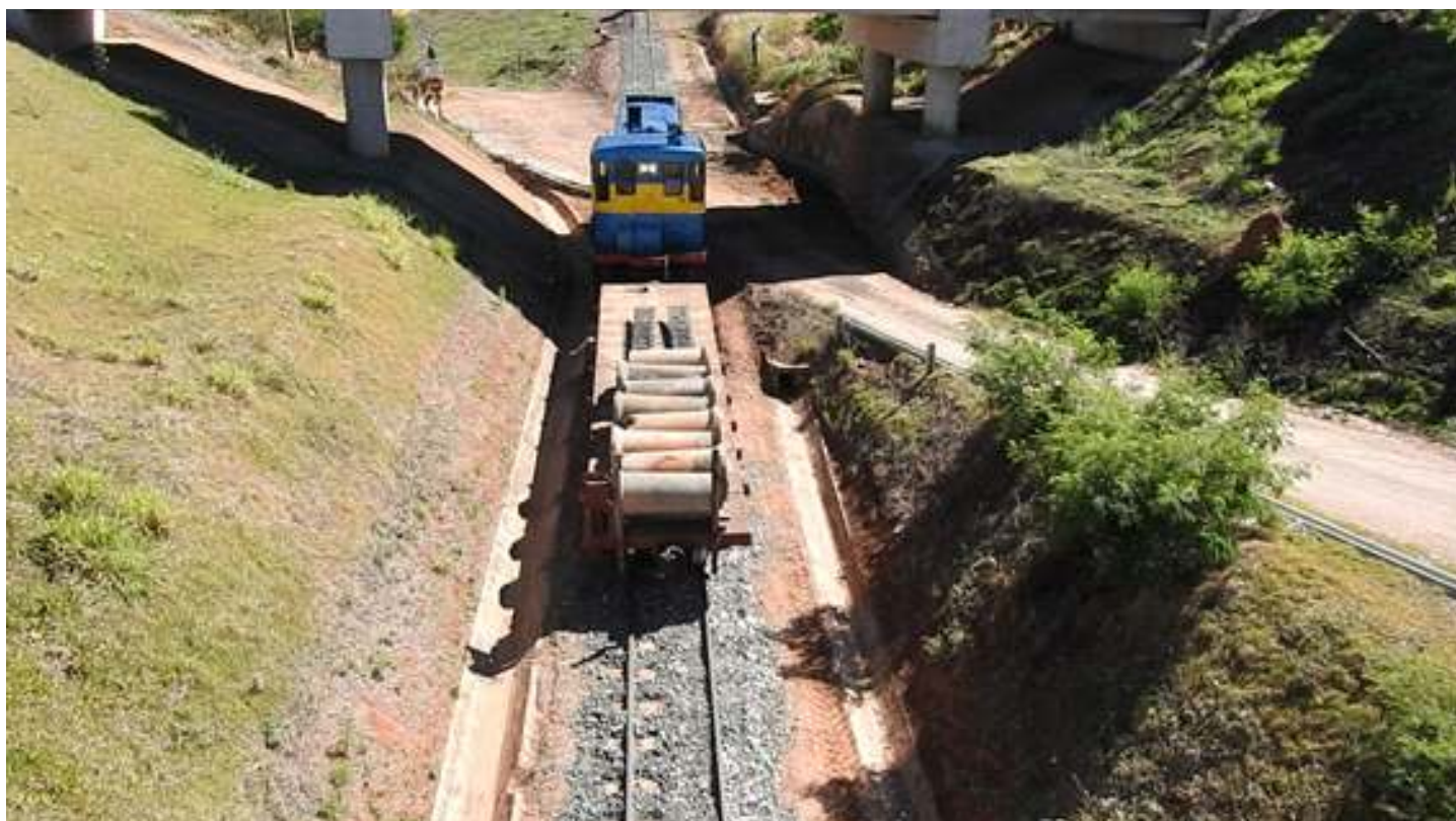
♦ Trem de lastro trazendo os tubos de concreto (usados) para galeria de agua pluvial no km 10