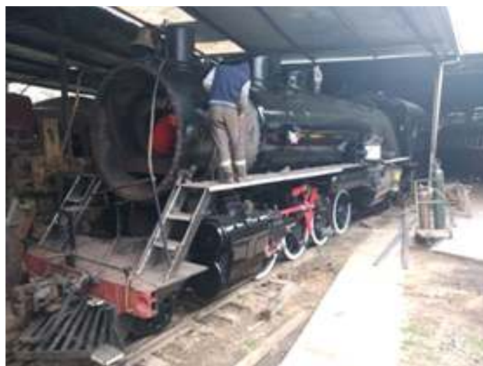
♦ Pintura da locomotiva Mikado nº 761 nas cores originais da Companhia Mogiana