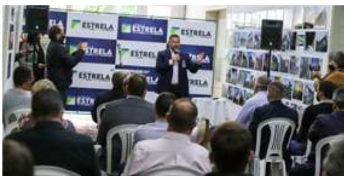
♦ Reunião de aprovação do Projeto Executivo do Trem dos Vales