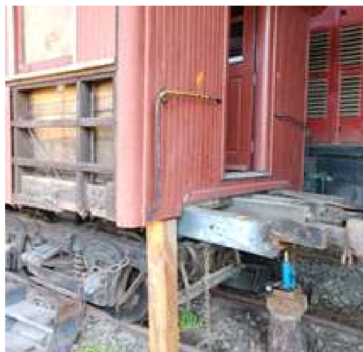
♦ Reparos no ripamento e no madeiramento estrutural no carro passageiro PM 35