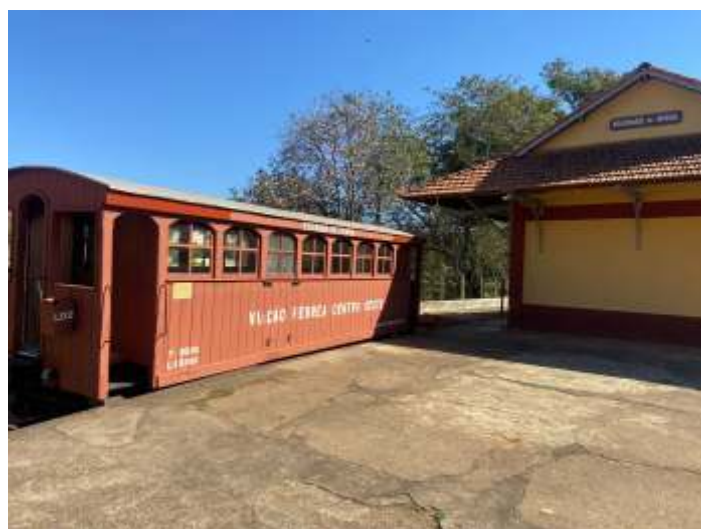
♦ Chegada do carro em Soledade de Minas: a operação de descarregamento foi feita a noite, com a colocação do carro sobre os trilhos; na manhã seguinte a equipe da ABPF o empurrou até a posição definitiva.