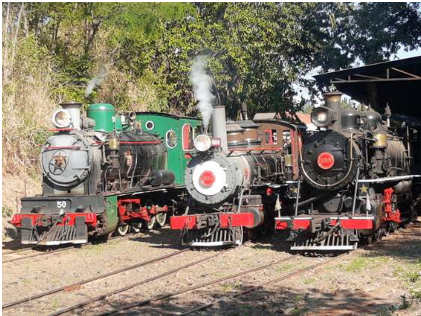
♦ As três locomotivas sendo a 50, 604 e 338 acesas.