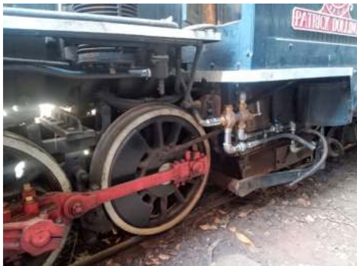
♦ Novo injetor sendo adaptado na 215

A locomotiva 604 que estava em reparação ficou pronta e voltou ao tráfego, já com a 338. Com isso retomamos os serviços de adaptação do injetor novo na 215, e alguns serviços nos estais da fornalha, e que ao término destes serviços ela será repintada novamente. Também será reiniciado em setembro, os serviços de caldeiraria na cabina da locomotiva 9, danificada pelo incêndio de setembro do ano passado e em seguida repintura novamente!