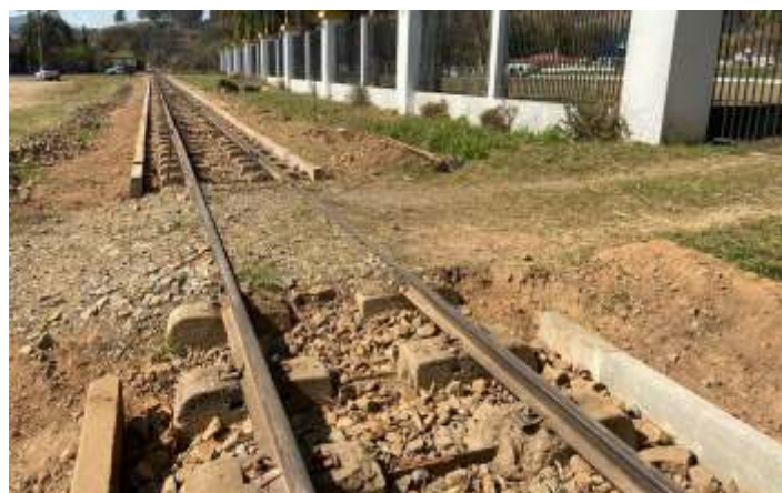
♦ Descontaminação de lastro, alinhamento, nivelamento e instalação de meio-fio para contenção de lastro no km 84