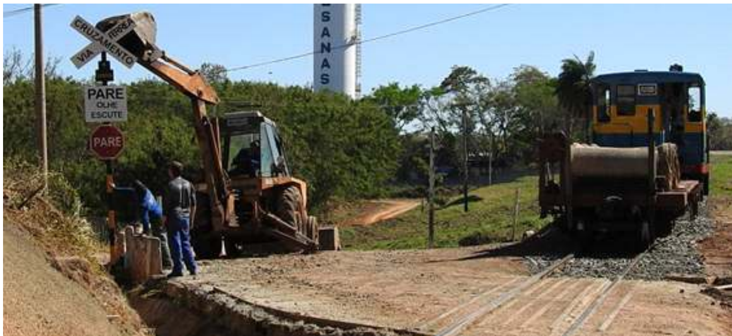
♦ Instalação de nova Cruz de Santo Andre

A regional Campinas agradece a todos os colaboradores, associados e amigos que colaboram e colaboraram pelo sucesso das operações do mês de agosto, os trabalhos na via e nas oficinas.