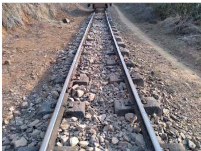
♦ Alinhamento, nivelamento e complementação de lastro no km 89+000