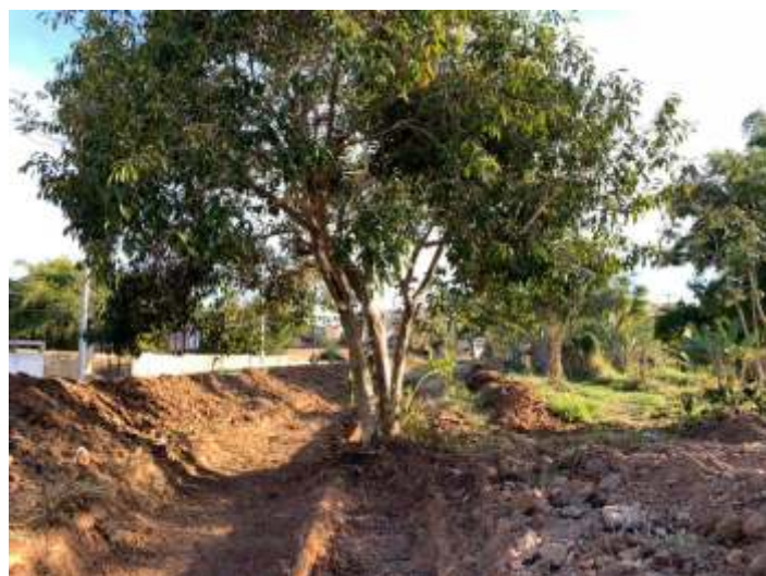
♦ Aspecto das obras no km3+200