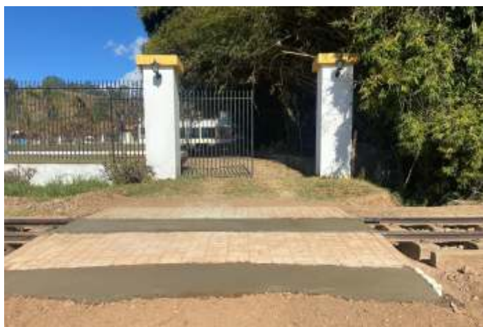
♦ Reforma de pn no km 84