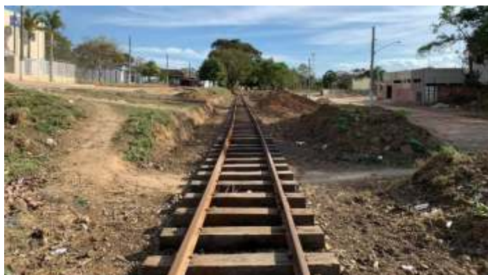
♦ km 2+300 antes e após as obras, aguardando lastro