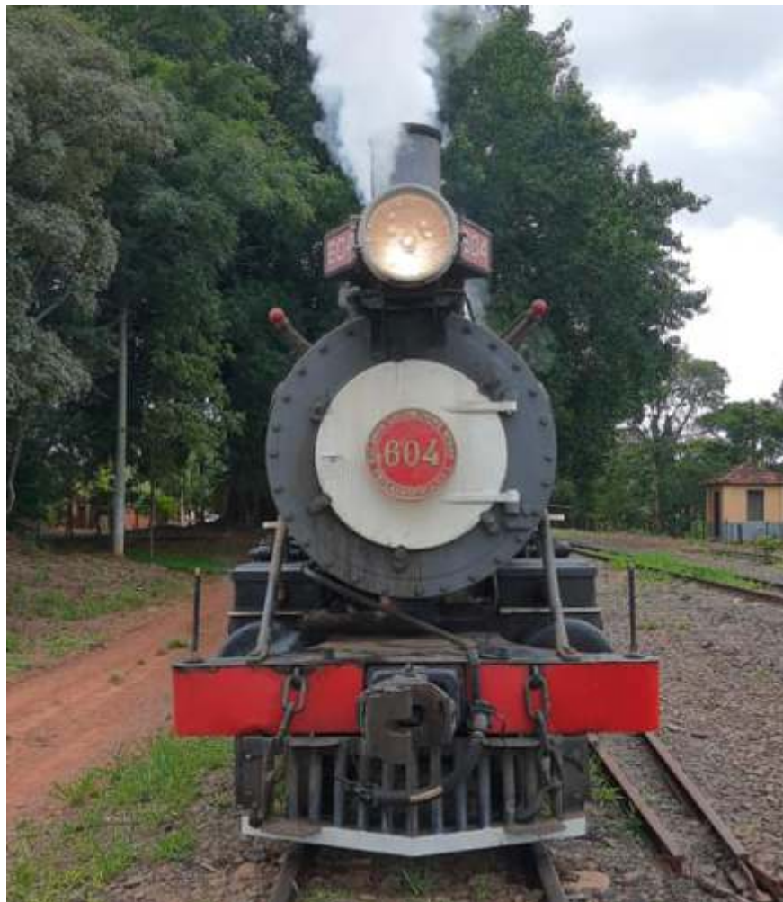
♦ A locomotiva 604 em Tanquinho

O mês de agosto foi um ótimo mês, com um bom movimento de visitantes nos passeios de trem; não foi tanto movimento quanto em julho mas foi muito bom. Os trens puderam circular sem interrupções devido à regressões de Ondas dos Planos dos Governos Estaduais e Municipais de enfrentamento a pandemia.