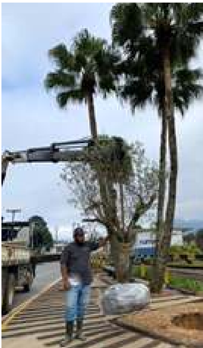
◆ Melhorias no entorno da estação de Corupá novas plantas, um apoio importante do poder público municipal