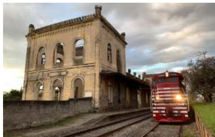
◆ A 9380 ao lado da estação de Cachoeira Paulista