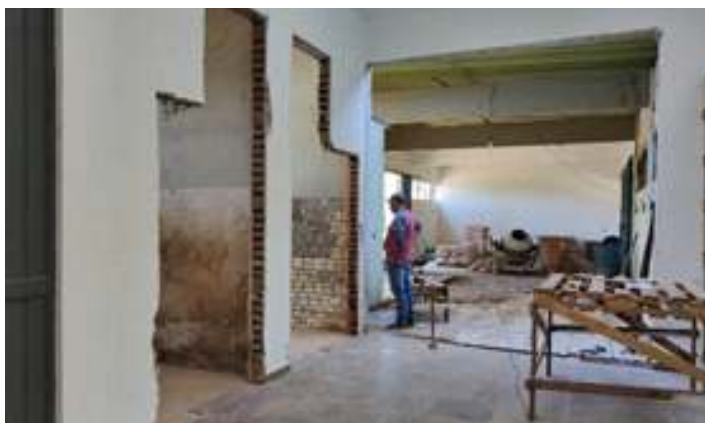
♦ Novos sanitários, uma bilheteria e um café na edição 2021 do Trem dos Vales