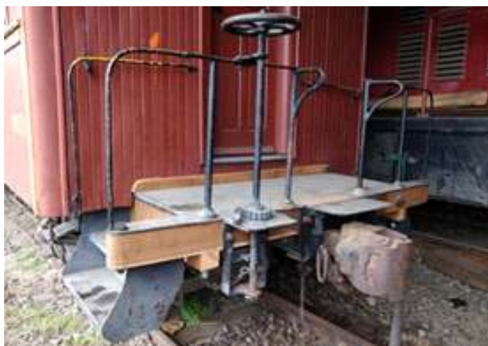
◆ Reconstituição da plataforma do carro passageiro PM 35