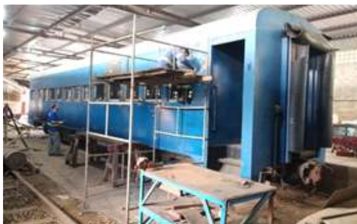
♦ Início dos trabalhos na funilaria do carro passageiro PC 63