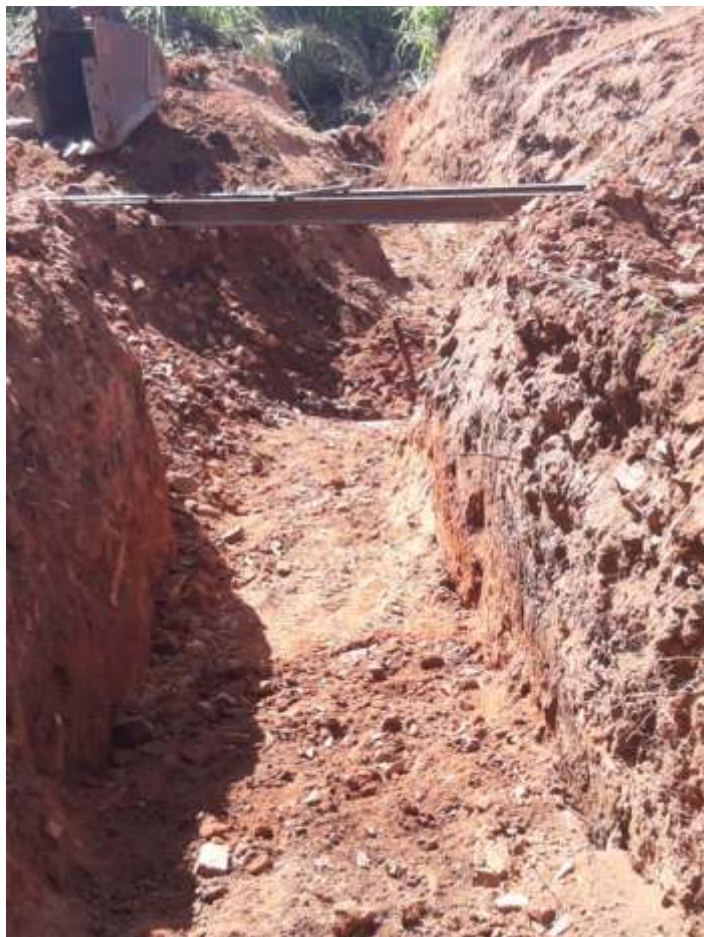
♦ Passagem sob a via para tubulação de água pluvial