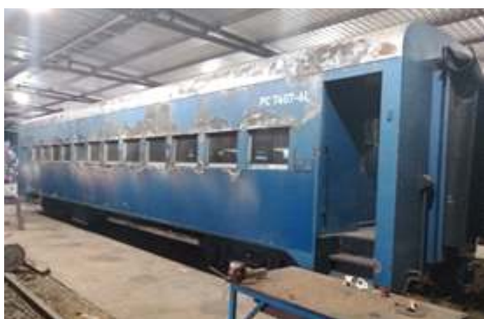
♦ Os pontos que serão corrigidos combatendo a oxidação no carro que receberá nova pintura

Ainda em uma terceira frente de trabalho estamos preparando novos carros para compor a nova composição do Trem da Serra do Mar. Considerando que doze carros passageiros estarão em viagem cumprindo o calendário dos trens comemorativos. Já no mês anterior trabalhamos no carro PM 36, que ainda se encontra em Piratuba, mas que nos próximos dias será transportado para Rio Negrinho. Neste mês iniciamos a restauração do carro PM 35, um carro muito pouco usado, mas que agora terá uma fundamental importância na operação dos passeios. Neste carro estamos substituindo o madeiramento estrutural do chassi, principalmente as vigas que sustentam o engate.