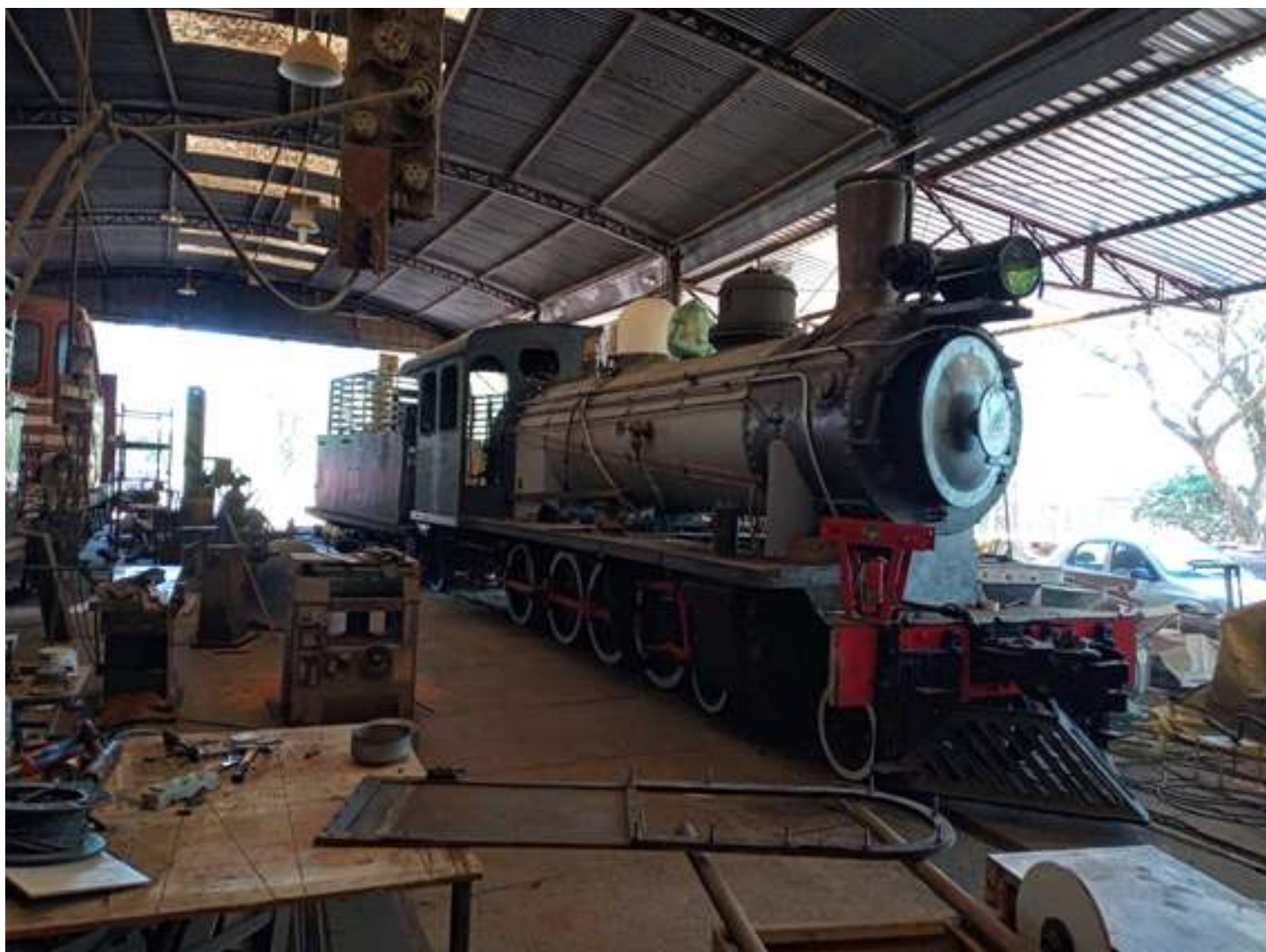
♦ Visão geral locomotiva ex 8 da EFA atual 12 da Usina Amália