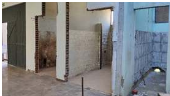
♦ As obras da reforma no interior da estação de Guaporé