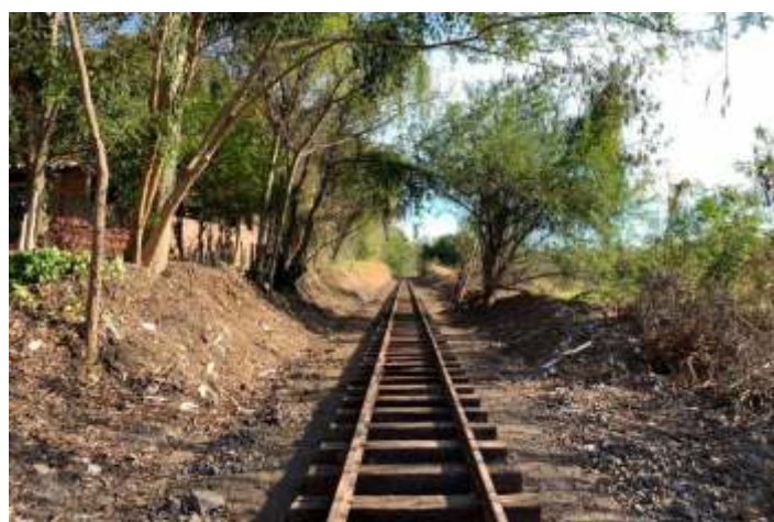
♦ Aspectos antes e depois das obras no km2+600