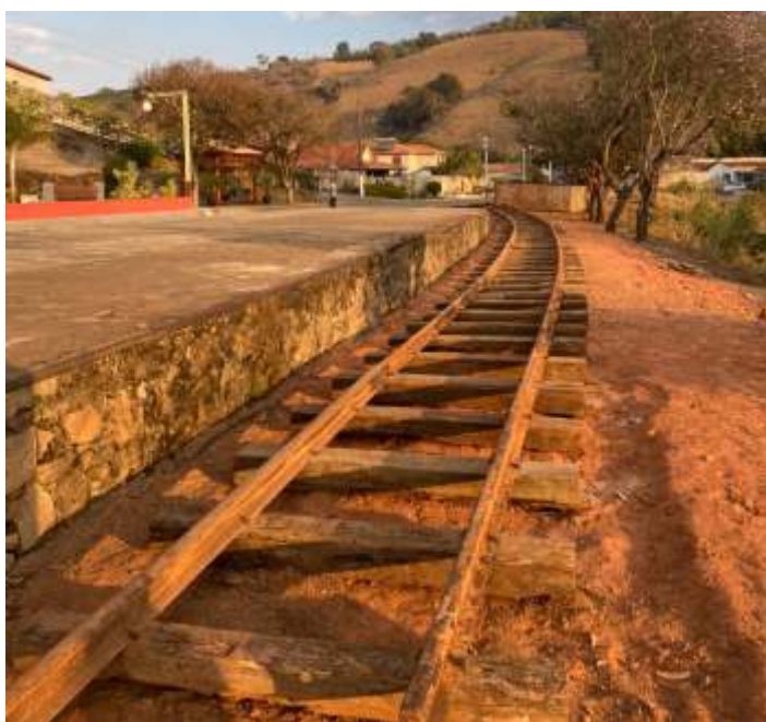
♦ Aspecto do antes e depois da construção da linha para colocação do carro ao lado da estação de Soledade