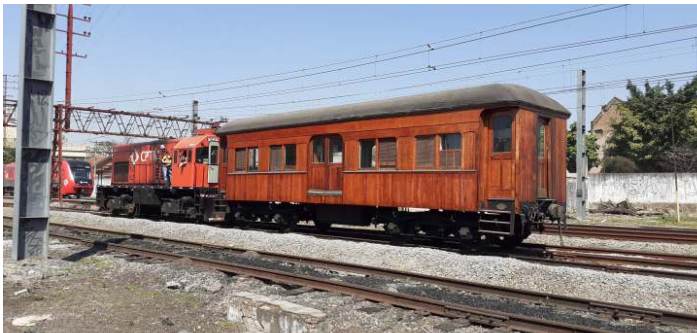
◆ A locomotiva 3059 da CPTM manobrando o carro da antiga São Paulo Railway no pátio da Mooca

No mês de agosto foram realizadas manobras no pátio da ABPF na Mooca afim de se reorganizar o material rodante. Como a locomotiva a vapor nº 5 encontra-se em processo de manutenção, o que a impede de funcionar, contamos com a colaboração e apoio da CPTM, que gentilmente cedeu uma de suas locomotivas diesel com equipagem para a realização das movimentações que por sua vez fazem parte do plano de reestruturação daquele pátio da ABPF, com revisão do material rodante. Na oportunidade, com a locomotiva diesel engatada no carro Pullman da antiga Cia. Paulista, realizou-se testes do sistema de freio afim de se verificar o mesmo uma vez que pretende-se futuramente homologar este carro para tráfego nas linhas das concessionárias, a exemplo do que já foi feito com outros carros e locomotivas.