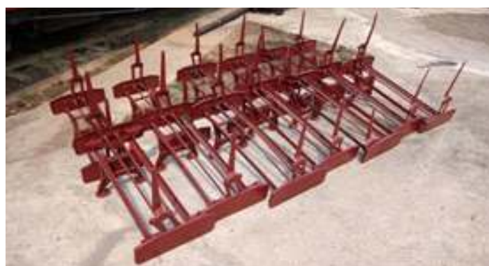
◆ Os primeiros trabalhos no interior do carro PM 35 e a recuperação das suas poltronas