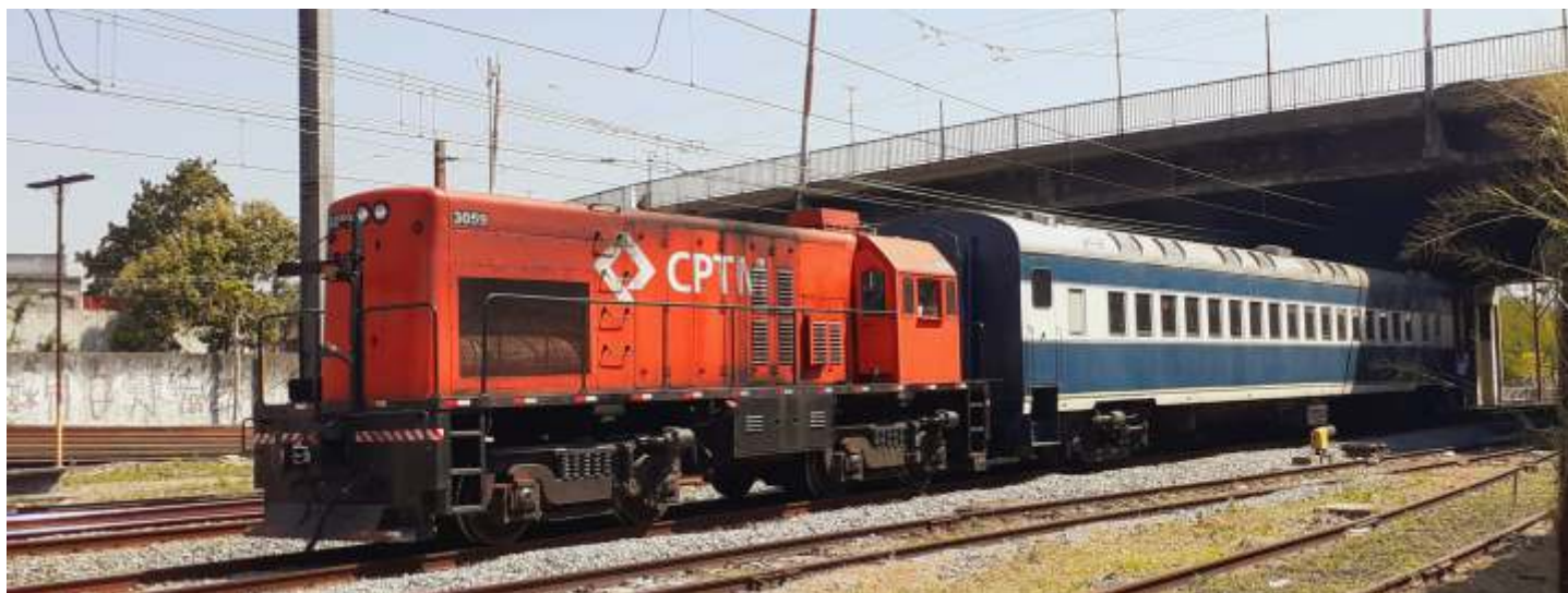
◆ A locomotiva GE U6B nº 3059 manobrando o carro Pullman da antiga CPEF. Na oportunidade, foi testado o freio

Deixamos registrados aqui mais uma vez nossos agradecimentos a CPTM e a seus colaboradores pelo apoio e enaltecemos o compromisso da CPTM em apoiar a causa da preservação da memória ferroviária, importante capítulo da história não só do estado de São Paulo mas também de todo o país. A CPTM é uma grande parceira da ABPF e sempre tem nos apoiado e atendido prontamente.