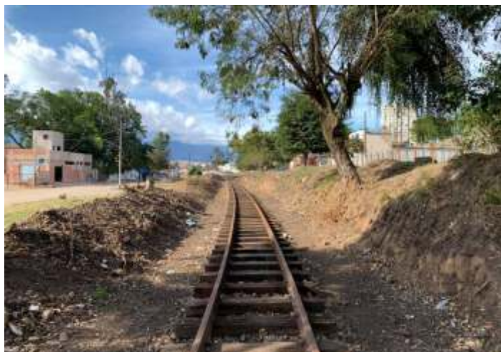
♦ Aspectos do antes e após as obras no km2+400