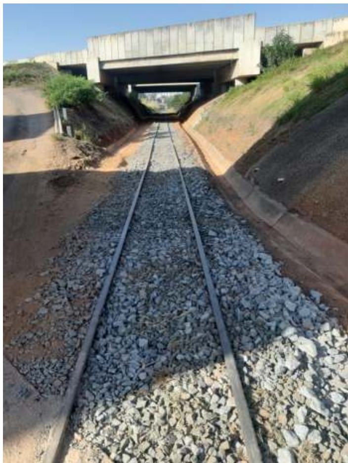
♦ Trecho descontaminado no km 10, aguardando a Plasser

As oficinas de carros por enquanto vai ajudar na pintura das locomotivas que foram citadas acima, sem mexer em carros no momento, apenas fazendo reparos e manutenções nos carros em tráfego!