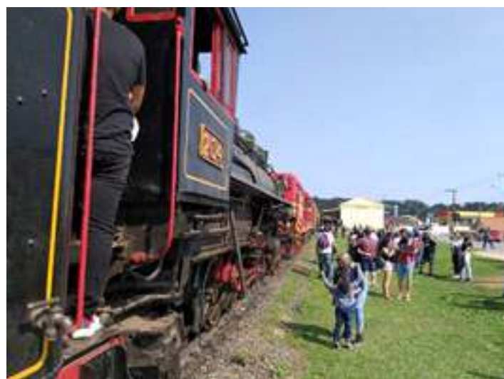
◆ Parada do passeio na estação São Bento