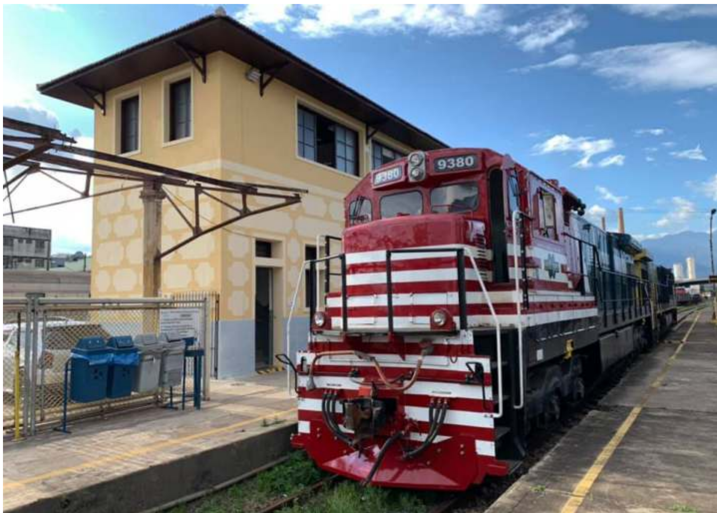
◆ A 9380 já nas linhas da MRS Logística, pronta para iniciar a viagem de teste até Cachoeira Paulista

No dia 31/08 a C30-7 n°9380 foi devolvida ao tráfego após cerca de 1 ano de trabalhos intensos em toda a parte elétrica, funilaria e mecânica, trabalhos todos esses realizados nas Oficinas da ABPF em Cruzeiro/SP.