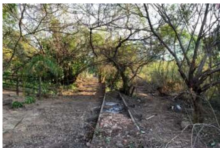
♦ Aspecto das obras no km2+900