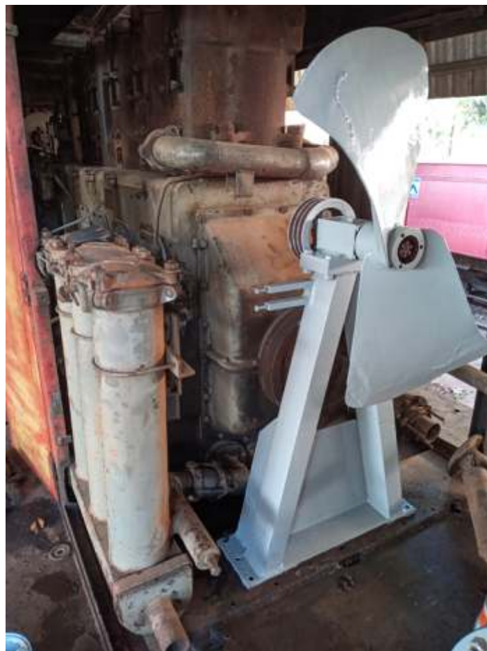
♦ Detalhe do conjunto de filtros e pedestal da hélice da 3104

Referente a GE 3104 da EFS – FEPASA, no último final de semana foram retomados os serviços de revisão das peças e remontagem do conjunto de filtros de lubrificante, tubulações de água e óleo, pedestal da hélice etc. o radiador, infelizmente condenado por corrosão, terá que ser reconstruído assim como foi o da 3128! Mas aos poucos vamos fazendo a remontagem da locomotiva.