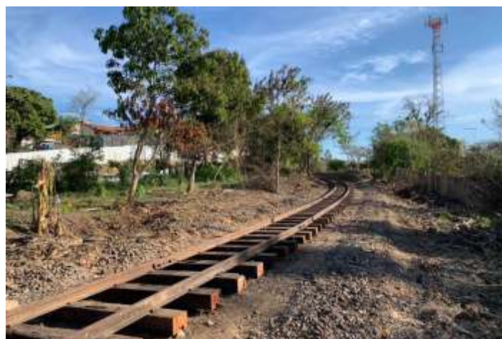
♦ Aspectos antes e depois das obras no km2+400