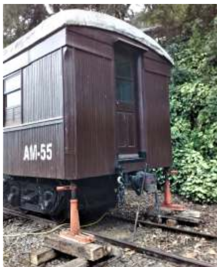
♦ Carro Administrativo "macaqueado" para reaperto dos tirantes

Em Rio do Sul , na estação de Matador, encontra-se depositado parte do material rodante do NuRVI, ainda por restaurar, bem como o museu estático e fotográfico relativo aos fatos históricos que marcaram a EFSC no Alto Vale do Itajaí. A estação se situa no Beco Artur Hering – Nº 50, bairro Bela Aliança de Rio do Sul.