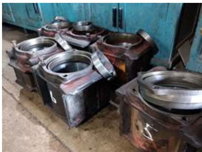
♦ Os novos rodeiros que serão instalados no carro passageiro PC 49