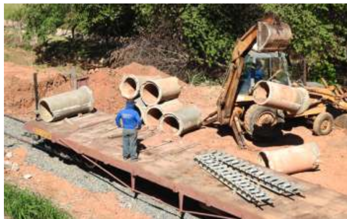
♦ Descarregamento de tubos no km 10.

A via permanente praticamente concluiu os serviços no trecho da reta da Rodovia D. Pedro, km 10, colocando o lastro novo, nova placa Cruz de Santo André, e por fim uma passagem de água pluvial cruzando a via para que toda a água dos bueiros das ruas, que é despejada na faixa de domínio, não atravesse mais o leito. Tudo está sendo feito pelo próprio pessoal da ferrovia. Agora é aguardar o nivelamento e alinhamento final com os equipamentos Plasser da empresa Engecom.