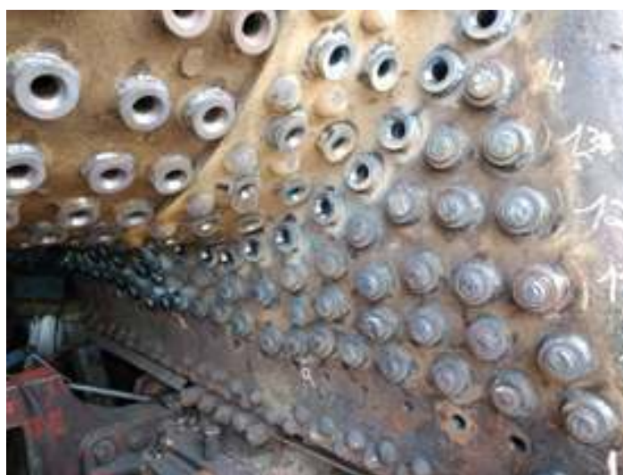
◆ Os trabalhos mais críticos de soldagem na parte externa da conduta