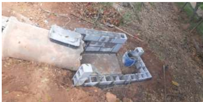
♦ Construção de caixa na saída da tubulação.

A regional Campinas agradece a todos os colaboradores, associados e amigos que colaboram e colaboraram pelo sucesso das operações do mês de agosto, os trabalhos na via e nas oficinas.