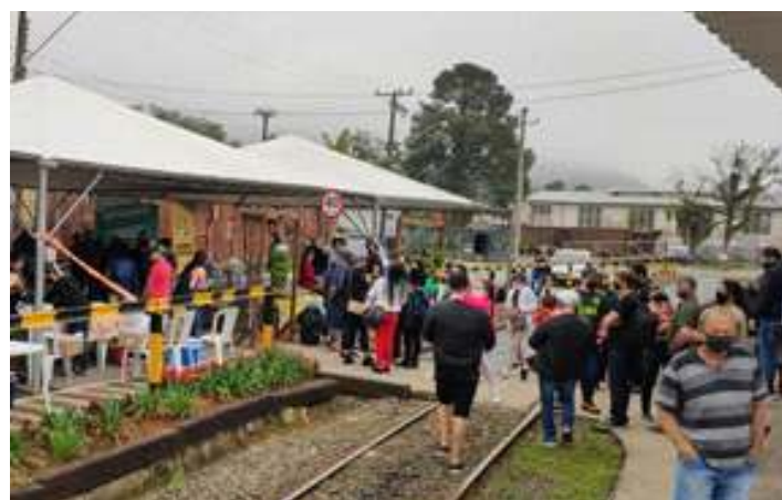
◆ Evento organizado por nossos parceiros em Corupá