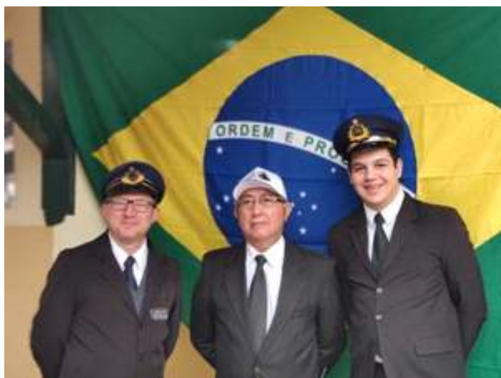
♦ Chefe de Trem e comissários de bordo, posando frente a Bandeira do Brasil para o Dia da Independência.