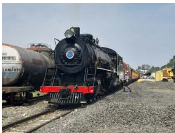
♦ Composição do Trem dos Tropeiros após a chegada do traslado à estação de Mafra.

O primeiro Trem Comemorativo aconteceu já no início do mês, durante o final de semana prolongado devido ao feriado do Dia da Independência do Brasil. Sendo este passeio, o único comemorativo realizado com a locomotiva Mikado nº 761. Durante a chegada da composição à estação de Mafra, houve a inauguração solene do Museu do Ferroviário, nas próprias dependências da estação.