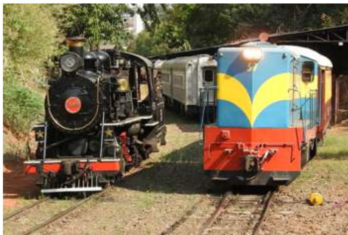
♦ Locomotiva GL-8 nº 57 novamente na operação

A recuperação da locomotiva 3104 da EFS, teve continuidade nesse mês de setembro, onde estamos revisando as peças, limpando, reparando e montando novamente. A maioria das peças tem que se fazer alguma