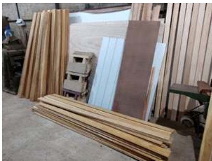
♦ Janelas já pintadas conforme o padrão original e madeiramento novos para o carro de MD-47.