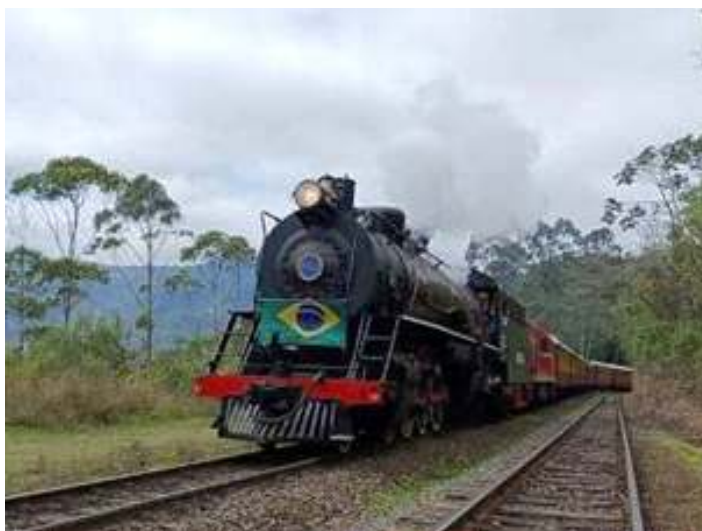
◆ Locomotiva Mikado nº 761 na subida da Serra do Mar – Foto: Fabiano Schloegel.