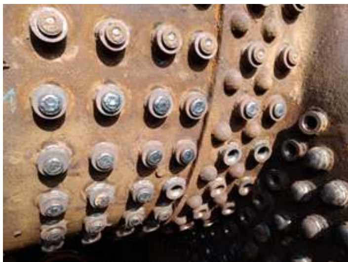
♦ A instalação dos estais flexíveis na fornalha da locomotiva Mikado nº 156.