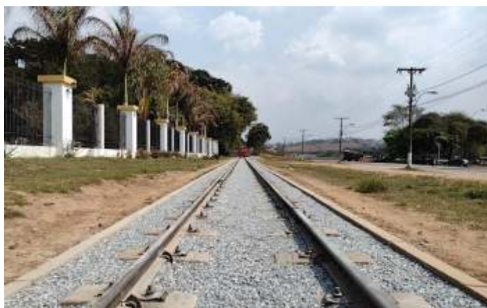
♦ Antes e depois do km 84: limpeza, descontaminação de lastro, nivelamento e instalação de meio-fio (pára-lastro)