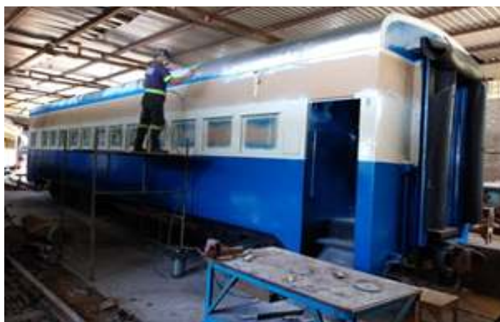
♦ Carro PC-63 durante processo da nova pintura