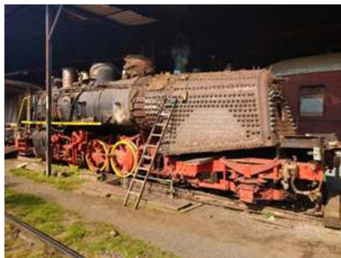
♦ Na fase final a locomotiva Mikado nº 156 passará pelo teste hidrostático antes da entrega.