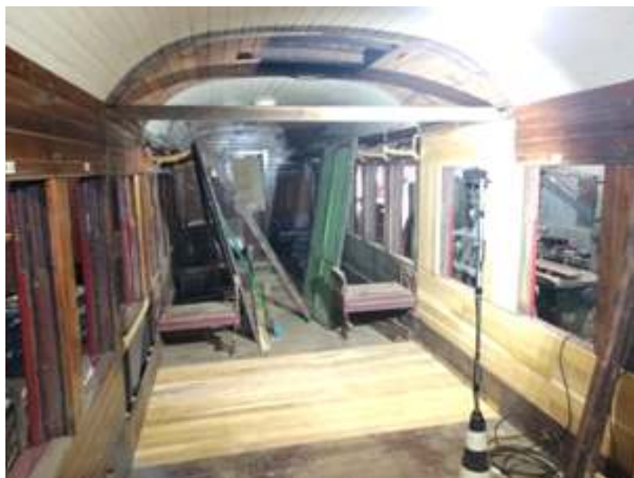
♦ Interior do carro de passageiros MD-47 após a remoção do madeiramento comprometido.