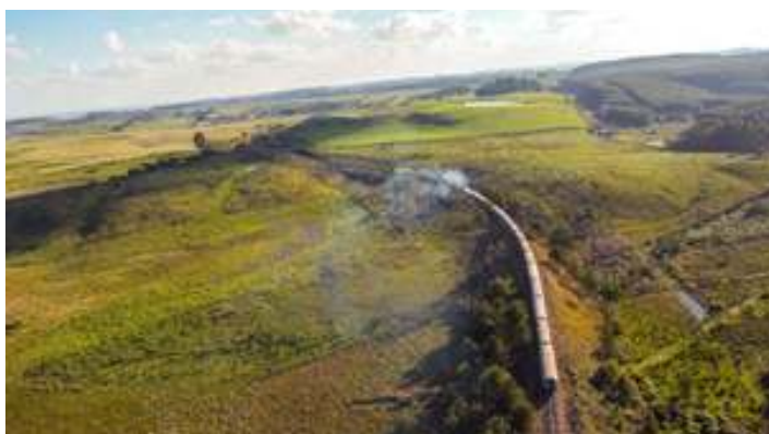
♦ Na Coxilha Rica.