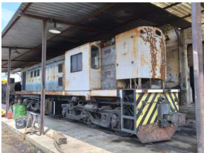
♦ Trabalhos de funilaria na 3507 estão avançando