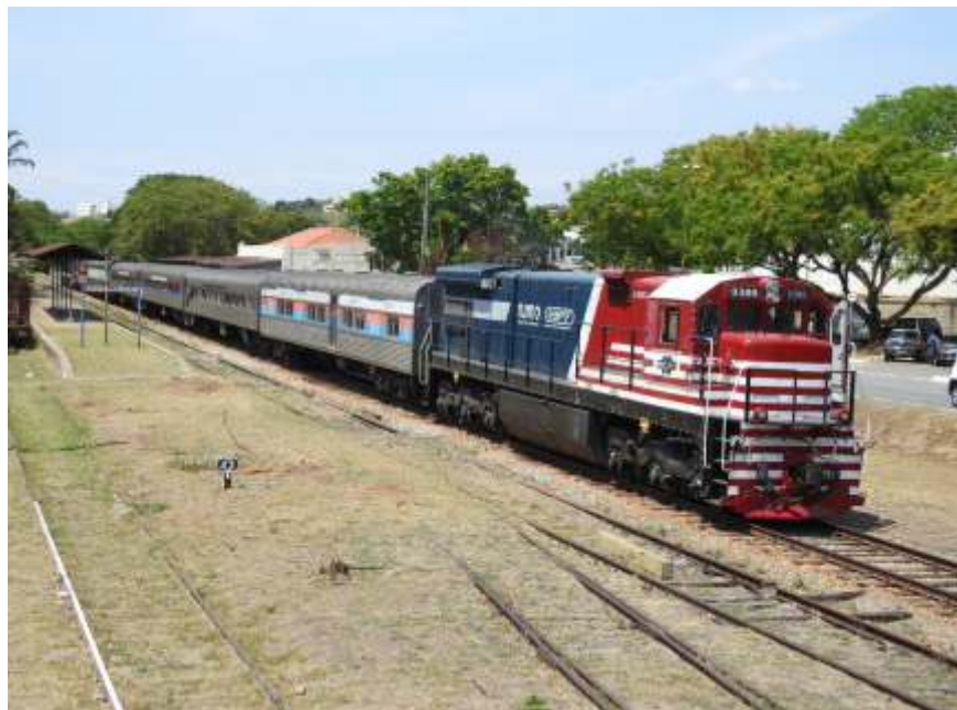
◆ Expresso Vale das Frutas na estação de Vinhedo

O mês de setembro trouxe consigo a concretização de um grande projeto, fruto de uma grande parceria inédita no país, onde a união da ABPF com diversas concessionárias tornou possível a realização do Expresso Vale das Frutas, um trem de passageiros de caráter turístico/cultural que está percorrendo o trecho da antiga Companhia Paulista de Estradas de Ferro entre Louveira e Valinhos, realizando paradas na estação de Vinhedo. É a primeira vez que um trem de passageiros percorre esse trecho em mais de 20 anos.