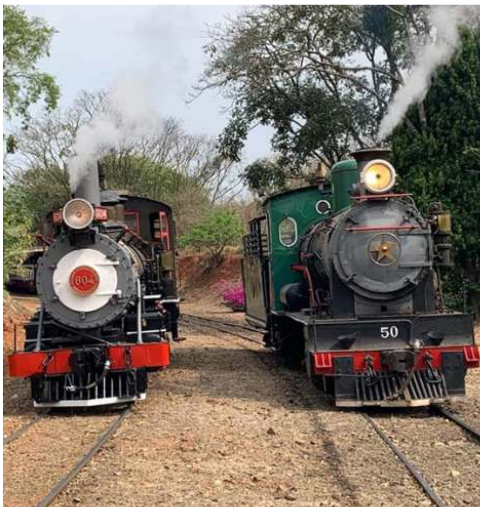
♦ Locomotivas acesas para teste em Anhumas