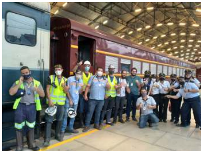
◆ Parte da equipe responsável pelo Expresso

Esse projeto é uma realização da ABPF – Associação Brasileira de Preservação Ferroviária com parceria do VFC&VB - Vale das Frutas Convention & Visitors Bureau e da APHV - Associação de Preservação Histórica de Valinhos; conta com apoio da Rumo, CPTM e MRS Logística, demonstrando mais uma vez o interesse dessas concessionárias perante a sociedade no reconhecimento da ferrovia como instrumento de desenvolvimento e representação cultural, parte de nosso legado histórico e do desenvolvimento técnico e logístico, contribuindo para a preservação da memória e da história nacionais.