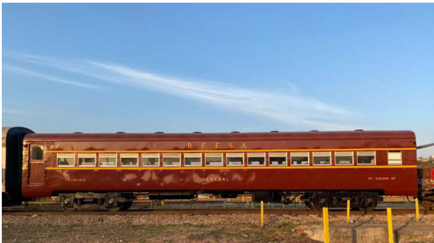
◆ O PC-926390-0F na composição do Expresso Vale das Frutas, pronto para entrar em serviço.