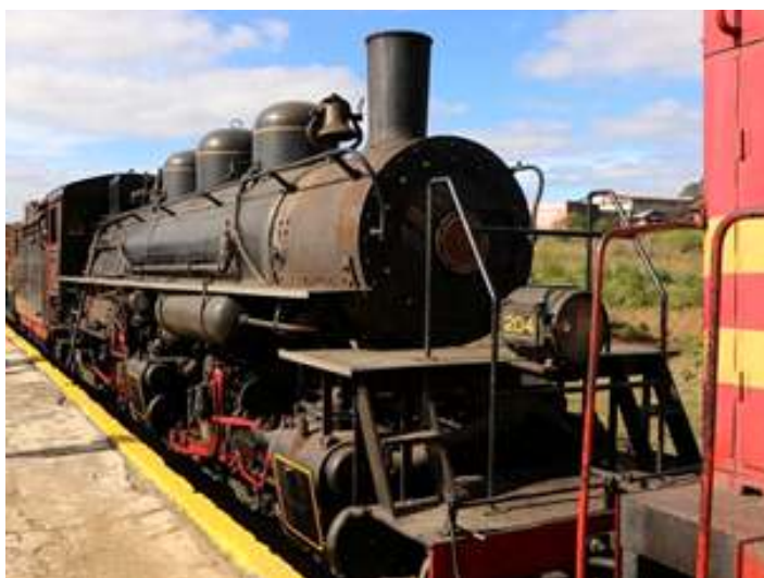
♦ Chegada pós-traslado, da composição que fará os Trens Comemorativos edição 2021.