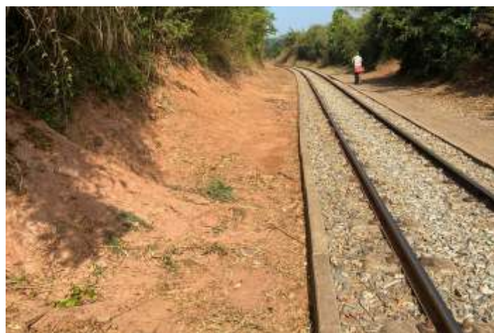
♦ Antes e depois: limpeza e complementação de lastro