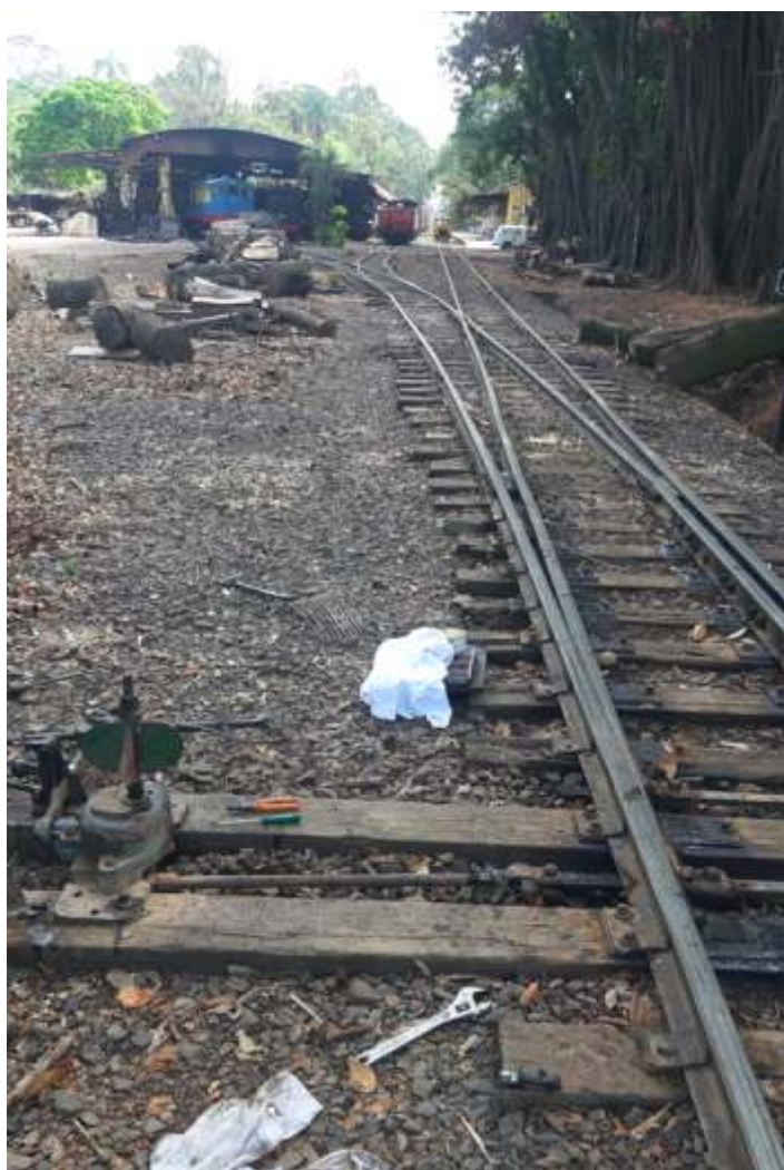
♦ Instalação do novo aparelho, aguardando nova pintura.

Também estão sendo instalados novos aparelhos de mudança de via. Conseguimos adquirir 4 conjuntos usados, mas muito bons e estamos instalando nos lugares mais críticos!