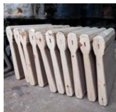
♦ Confeção em madeira, dos novos assentos e encostos das novas poltronas do carro de passageiros PM-35.