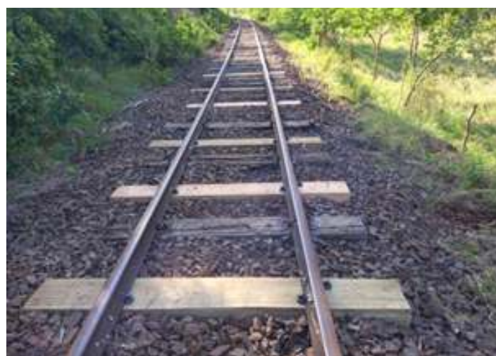
◆ Pintura dos AMVs e troca de dormentes na via permanente.