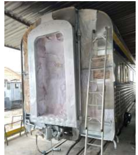
◆ Pintura de partes dos carros