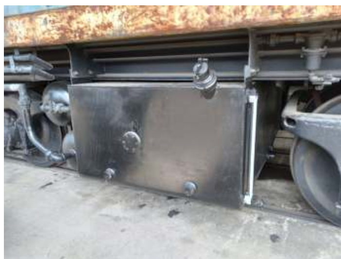
♦ O tanque de combustível foi removido, aberto, limpo, recuperado e reinstalado na locomotiva