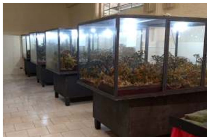
♦ Acervo de Maquetes do Museu, conta com mais de cinco mil personagens contando a história do contestado e importância da ferrovia para o desenvolvimento de Mafra.