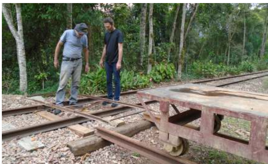
♦ Instalação e testes com o girador de vagonete. Autoria de Luiz C. Henkels

Em Rio do Sul , na estação de Matador, encontra-se depositado parte do material rodante do NuRVI, ainda por restaurar, bem como o museu estático e fotográfico relativo aos fatos históricos que marcaram a EFSC no Alto Vale do Itajaí. A estação se situa no Beco Artur Hering – Nº 50, bairro Bela Aliança de Rio do Sul.