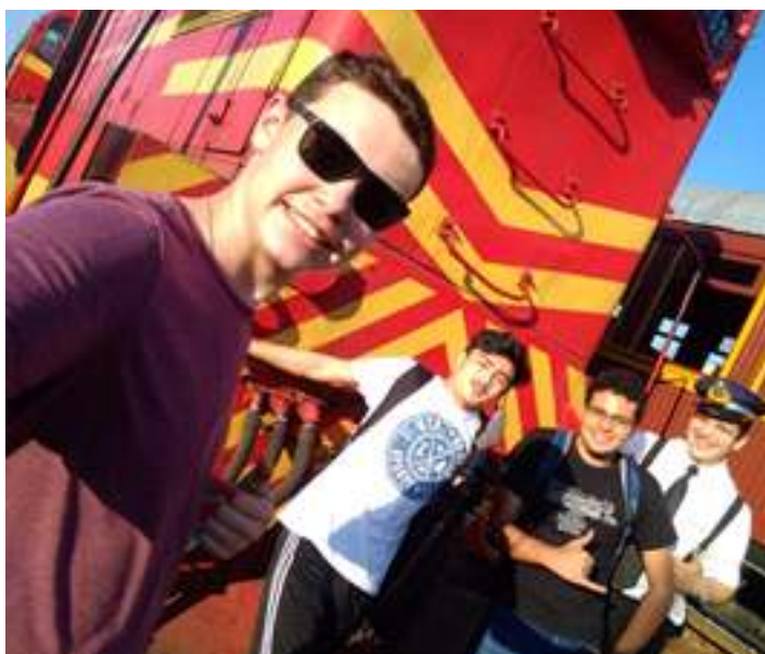
♦ Railfans voluntários posam para foto, após o 2º dia de passeios