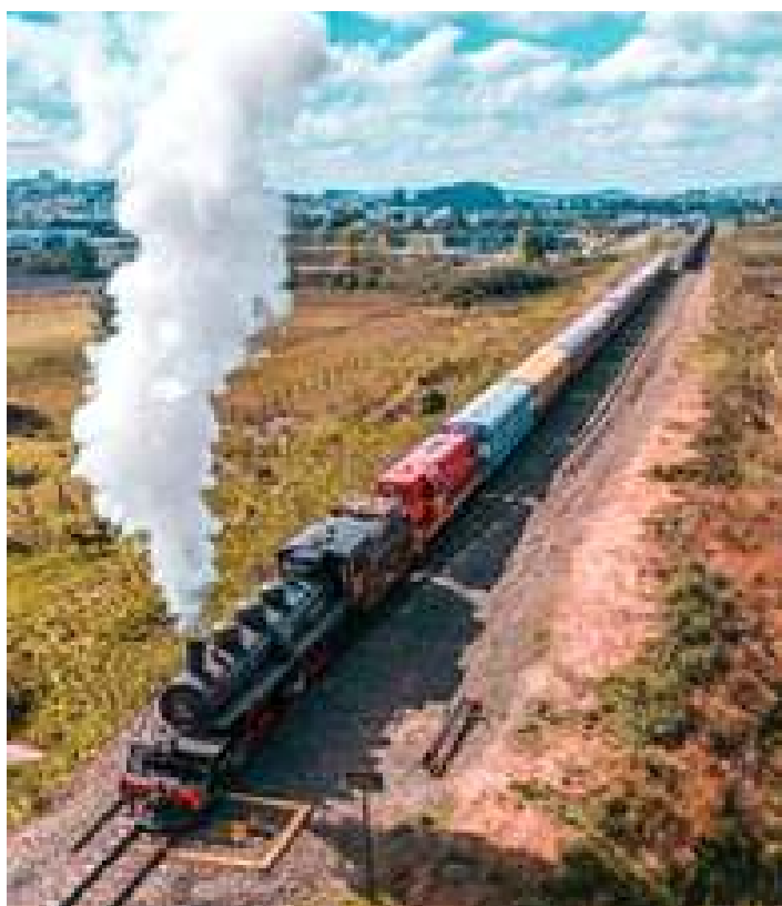
♦ Na saída de Lages.