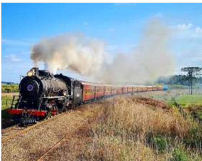
♦ Passagem do Trem dos Tropeiros pelos Campos Gerais do Paraná.