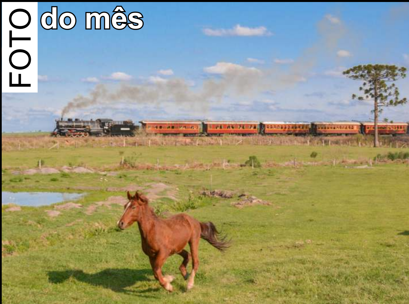
♦ Trem dos Tropeiros sendo conduzido pela Mikado #761 da ABPF Regional Sul .

Todo mês selecionaremos uma foto relacionada ao trabalho da associação publicada no grupo ABPF - Oficial no Facebook para publicar aqui.