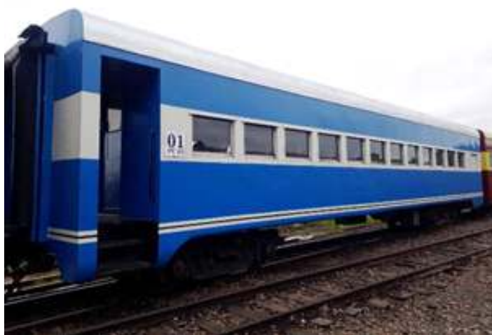
♦ Carro PC-63 classe Marumbi, já com a pintura finalizada.