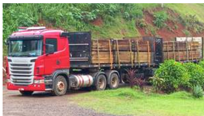
◆ Chegada da carga de dormentes novos, cedidos pela Concessionária Rumo Logística.