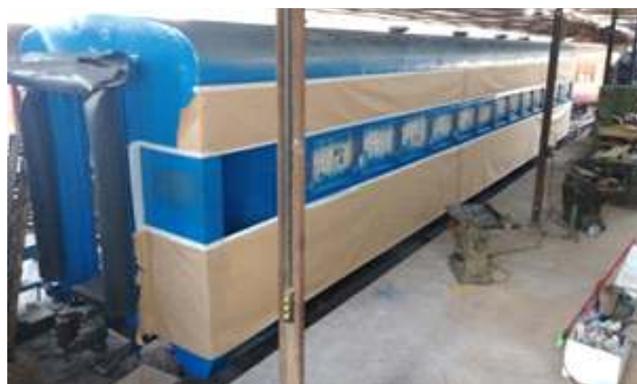
♦ Carro PC-63 classe Marumbi, durante processo da nova pintura