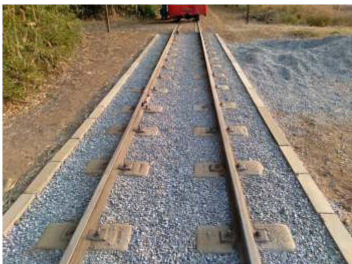
♦ Lastro para complementação sendo aplicado no km 84 para finalização do serviço