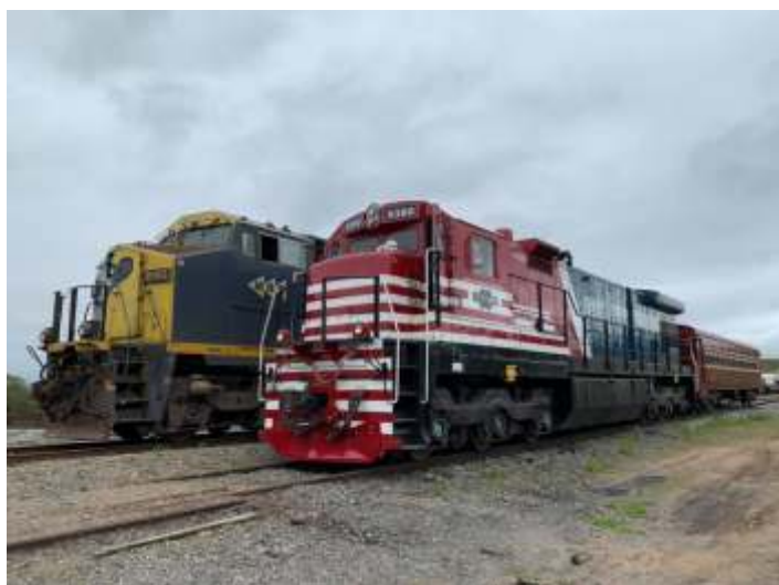
♦ O trem da ABPF no pátio de São Bento

Chegando nas oficinas da Lapa, o trem da ABPF aguardou o outro que veio de Guararema que foram então unidos para a formar a composição que está sendo utilizada no Expresso Vale das Frutas, entre Louveira e Valinhos. Nossos agradecimentos a MRS e a CPTM pela parceria e por todo o apoio.