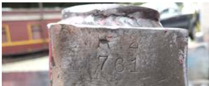
♦ Numeração original encontrada após limpeza das partes móveis da locomotiva Mikado nº 761