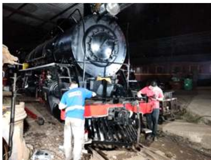
♦ Locomotiva Mikado nº 761 recebendo nova pintura, conforme padrões originais