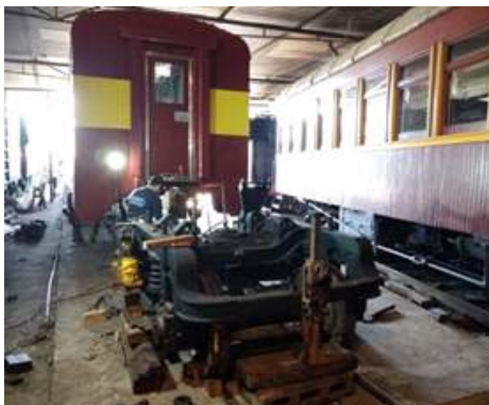
♦ Remontagem dos componentes dos truques do carro PC-49, Cacique

Já no setor de carros de passageiros, no início do mês foi finalizada a restauração do carro PC-49 (antigo P-218) com a remontagem dos truques e finalização dos componentes hidráulicos e sanitários. Este carro de primeira classe é fabricado em aço carbono, e originalmente pertencia ao Trem Cacique, da Estrada de Ferro Leopoldina. Foi construído em 1965 pela Companhia Industrial Santa Matilde e modernizado nas oficinas de Porto Novo em 1976. Agora está sendo preparado para, em breve, fazer parte da composição do Trem dos Vales, na Serra Gaúcha.