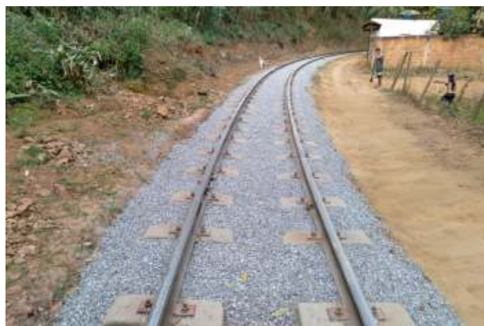
♦ Limpeza e complementação de lastro no trecho