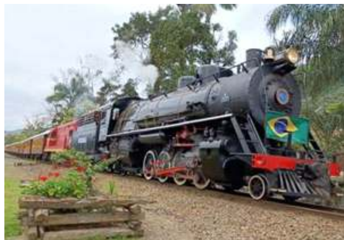
♦ Locomotiva Mikado nº 761 na subida da Serra do Mar