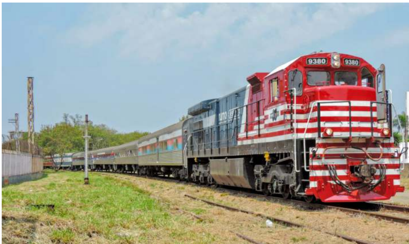
◆ O Expresso Vale das Frutas no trajeto: um trem de passageiros no trecho após décadas.