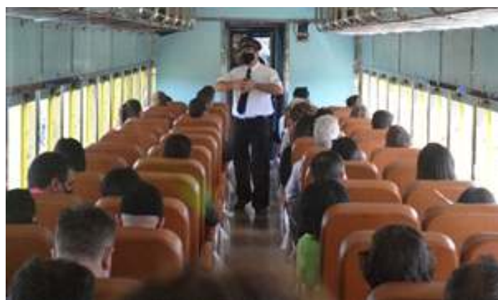
♦ Inauguração com passageiros do carro PC-49, Cacique – no trem comemorativo dos Tropeiros