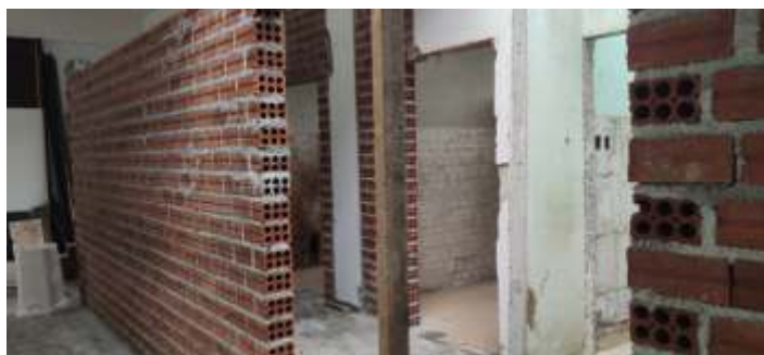
◆ Reformas internas na estação de Guaporé.

Muitas ações já estão em andamento para esta nova edição. A estação de Guaporé está sendo recuperada uma parte do prédio. Este local está sobre os cuidados da prefeitura, que atualmente tem o convênio do prédio. No local será realizada uma completa reforma, sendo adequada para o receptivo dos passageiros do Trem dos Vales. Serão construídos, sanitários masculinos, femininos, com acessibilidade e um fraldário. Além disso, será preparada uma área para a bilheteria, um espaço para um café e uma sala de reunião. Todo este projeto vem em uma grande parceria com o poder público local. Já se tem previsto a reforma completa do prédio, e uma vez que o projeto “Trem dos Vales” ocorra por definitivo, o prédio será repassado, através de convênio, para nossa associação.