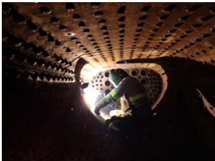
♦ Soldagem nos estais rígidos.

A recuperação da caldeira, da locomotiva Mikado nº 156 é um serviço terceiro, pois esta máquina pertence ao Trem do Vinho, de Bento Gonçalves (RS). É um processo lento, que já está entrando no décimo segundo mês de trabalhos, um desafio que vem chegando agora, a sua fase final. Os trabalhos no decorrer deste mês se concentram na soldagem das bases das cabeças, dos estais rígidos, e na soldagem das tampas dos estais de bola, os flexíveis. O teste hidrostático, já está marcado para início de outubro, onde terá o acompanhamento dos engenheiros do cliente.