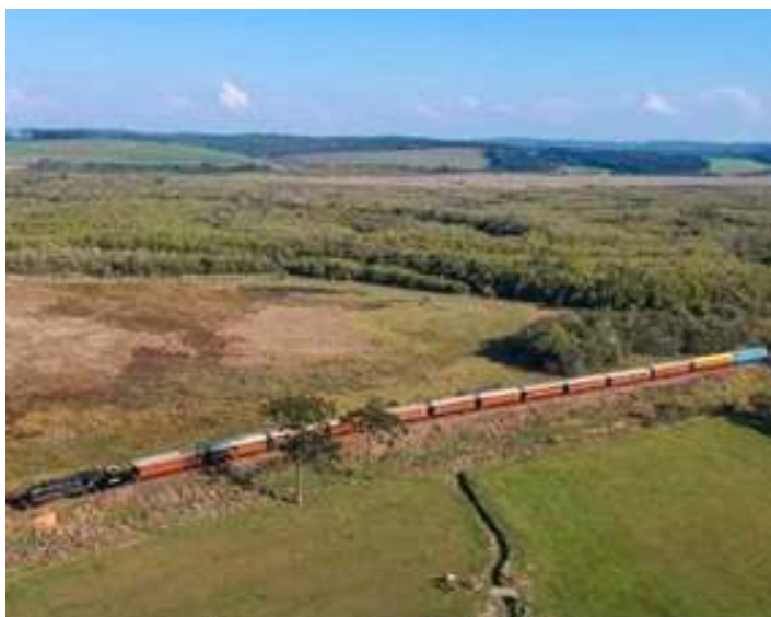
♦ Passagem do Trem dos Tropeiros pelos Campos Gerais do Paraná.