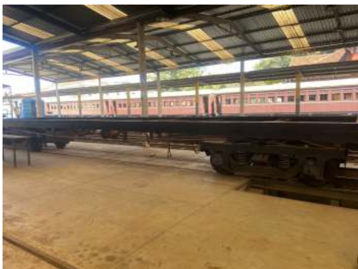
♦ Os truques revisados foram reinstalados nos carros