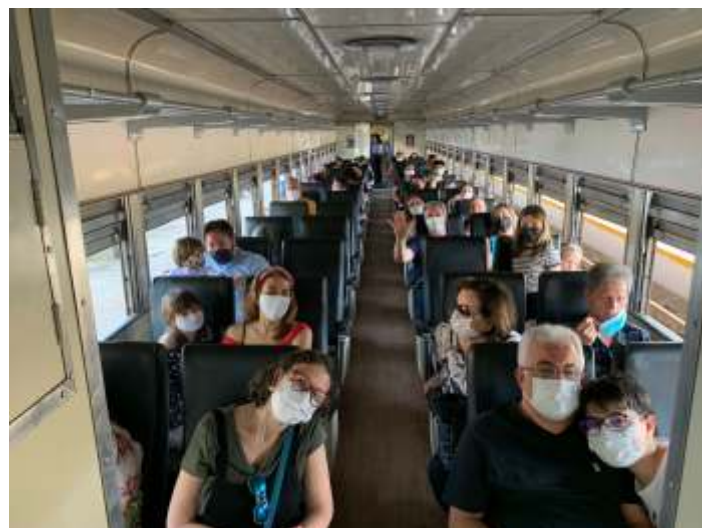
◆ Após 25 anos o PC-6390 voltou a receber passageiros