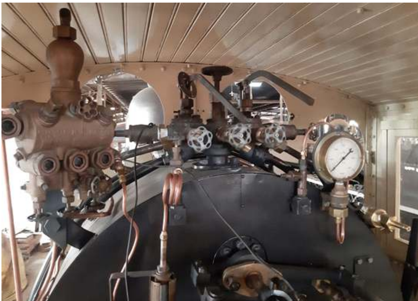
♦ Detalhe da instrumentação no painel, totalmente reconstruído.