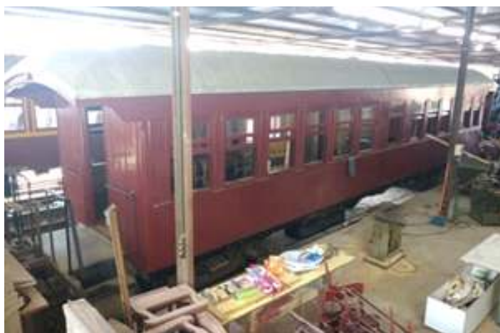
♦ Aspecto do carro de passageiros MD-47 antes e depois da pintura.