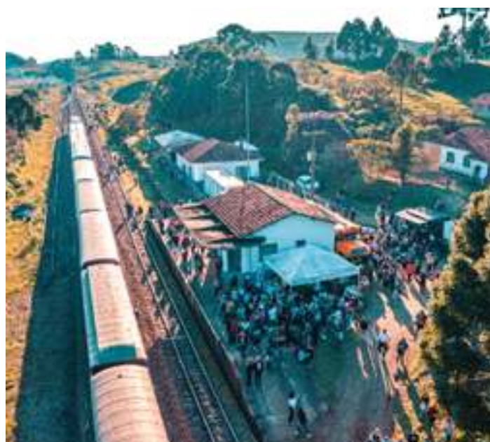
♦ Chegada do primeiro passeio à Estação de Escurinho.