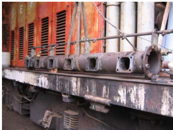
♦ Tubo de admissão de ar já limpo e preparado

reparação, seja devido a corrosão dos anos parado ou danificadas. A locomotiva chegou sem muitas peças do sistema de injeção e faltando os seis bicos injetores, e conseguimos adquirir com empresas prestadoras de serviços e de reparação, bem como tubos de alta pressão e outras peças menores. Ao menos agora temos todas as partes para ser montada. O radiador também foi encaminhado a uma empresa especializada para fazer a reforma.