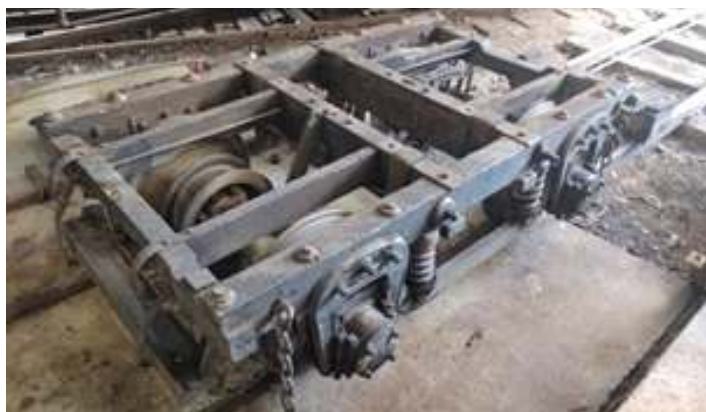
♦ Remoção dos truques do carro de passageiros MD-47 para revisão e inspeção de componentes.