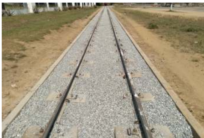
♦ Chegada de lastro para complementação no km 84