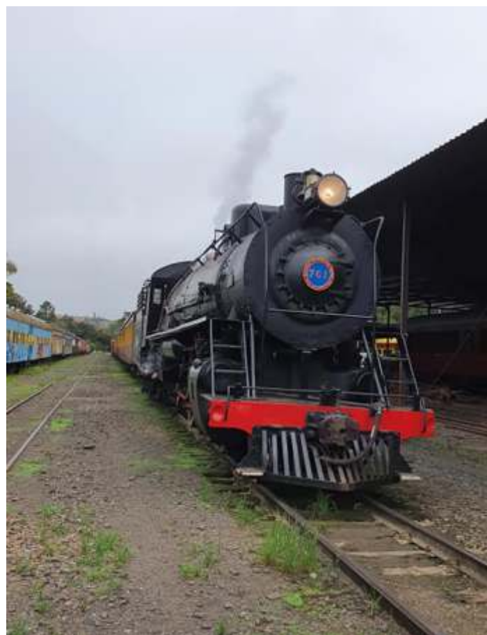
◆ Trem com a locomotiva nº761 no pátio da estação de Rio Negrinho.

Mais informações sobre o Trem da Serra do Mar com Natali e Suiane, pelos fones (47) 9.9986-0600, Instagram @tremdaserradomar, Facebook Trem da Serra do Mar ou pelo site www.abpfsul.com.br . Sobre o Trem das Termas com Roberta e Maridiane pelos fones (49) 3553-1121 e (49) 9.9121-7700, pelo site www.abpfsul.com.br , Instagram @tremdastermas, Facebook Trem das Terma. Sobre o Trem Caiçara com Camille, pelos fones (41) 99287-7001, Instagram @tremcaicara, Facebook Trem Caiçara. Sobre o Trem dos Vales pelo Instagram @tremdosvales. Também no Instagram abpf_regionalsul e Facebook ABPF Regional Sul.