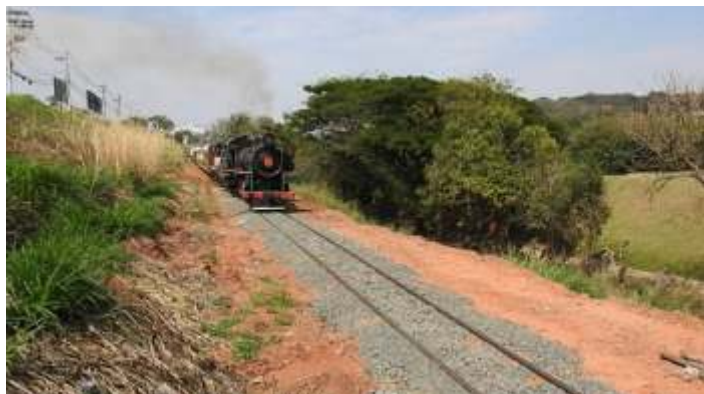
♦ Aspecto do trecho remodelado

Como concluímos os serviços no trecho do KM 10, e agora temos que esperar passar a niveladora, para em seguida completar a brita após a socaria. O pessoal iniciou outro serviço um pouco mais a frente, no km 11 onde estamos virando os trilhos da grande curva do início da subida, onde os mesmos estão desgastados e com isso a bitola fica um pouco maior. Os trilhos desta via nunca foram virados e esta curva foi a primeira de outras a fazer o mesmo serviço em breve. Os trilhos estão em muito bom estado e com isso a durabilidade deles será de muitas décadas! Os trechos com raios de curva maiores e retas estão muito bons e não há necessidade de inversão.