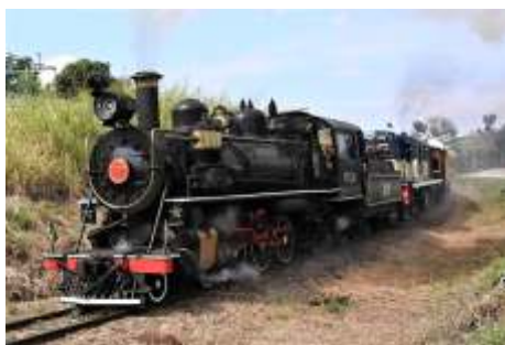
♦ Trem seguindo para Pedro Américo no km 10

Nas oficinas de locomotivas, concluímos a pintura da locomotiva a vapor 12, pertencente a Prefeitura de Ribeirão Preto. Já estamos na fase das montagens definitivas do pós pintura, interior da cabina e colocação de vidros e ornamentos. A Prefeitura nos solicitou que envie a locomotiva para Ribeirão Preto em novembro.