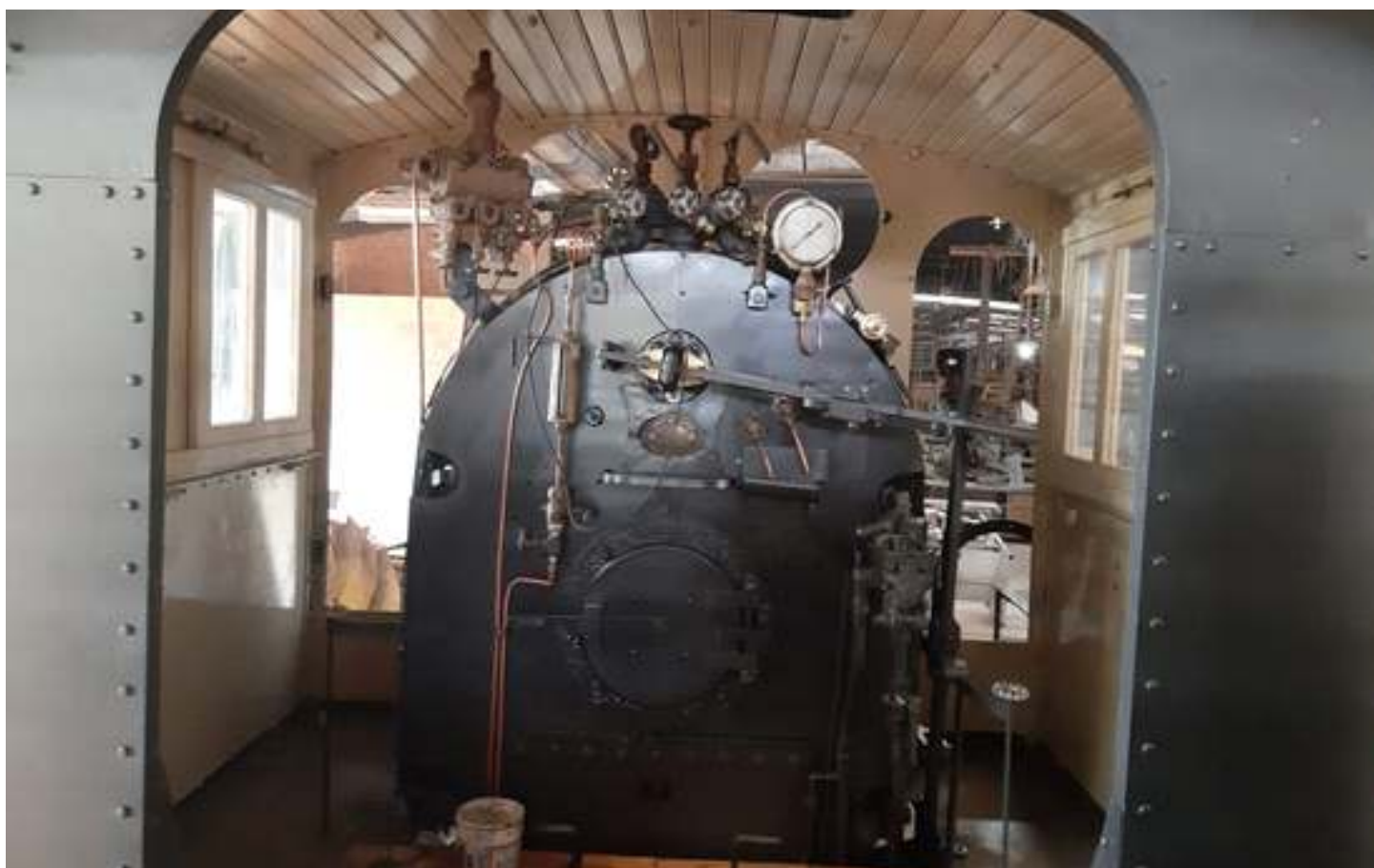
♦ Painel frontal da caldeira: como chegou (no alto da página) e como ficou