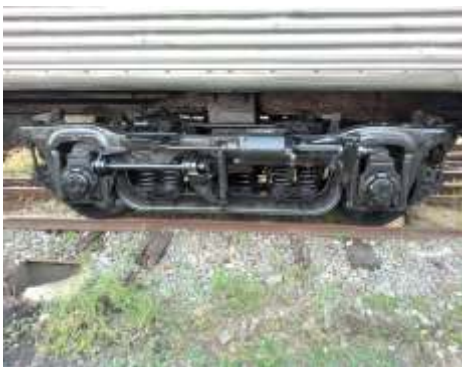
◆ Antes e depois: os truques foram revisados e receberam nova pintura