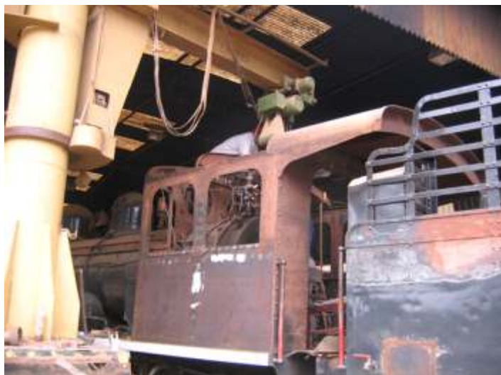
♦ Troca das chapas do teto da locomotiva 9

Parte do pessoal que estava na caldeiraria da locomotiva 12, passaram a trabalhar na locomotiva 9, fazendo a troca das chapas da cabina que foram danificadas pelo incêndio em setembro do ano passado. As chapas já foram adquiridas e iniciamos o processo de remoção das chapas velhas e calandra das novas chapas, principalmente do teto. Feito isso ela vai passar por nova pintura e voltará ao tráfego novamente.