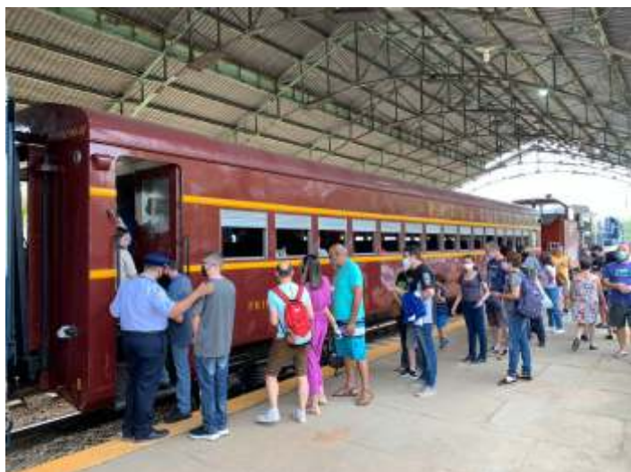
◆ Passageiros embarcando na estação de Valinhos

O carro vai ser utilizado até o dia 12/10 no “Expresso Vale das Frutas”, que está percorrendo o trecho da antiga Cia. Paulista de Estradas de Ferro entre Louveira e Valinhos e, após esse período, segue para Guararema, onde passará a compor a frota fixa do Trem de Guararema. Esse é mais um bem resgatado e inteiramente recuperado pela ABPF e disponibilizado para o público.