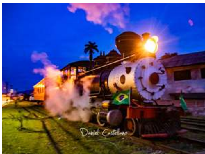
♦ Fotografias em homenagem ao primeiro ano do Trem Caiçara – Imagens Daniel Castellano.