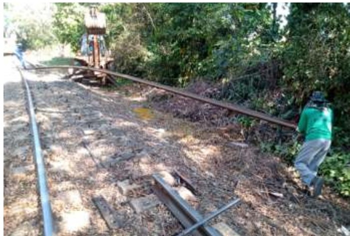
♦ Trecho descontaminado no km 10, aguardando a Plasser

Também estão sendo instalados novos aparelhos de mudança de via. Conseguimos adquirir 4 conjuntos usados, mas muito bons e estamos instalando nos lugares mais críticos!