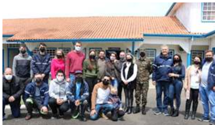
♦ Visita de nossa equipe ao 1º Batalhão Ferroviário de Lages.