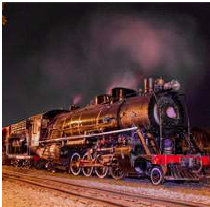
♦ Chegada do primeiro Trem dos Tropeiros à Estação Ferroviária de Lapa.