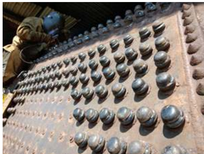
♦ A instalação das tampas dos estais flexíveis na fornalha da locomotiva Mikado nº 156.