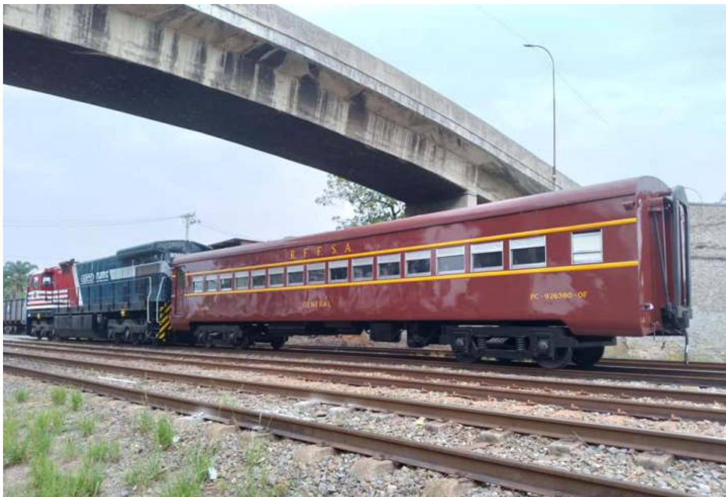
♦ A 9380 com o carro PC-926390-0F já nas linhas da MRS Logística, pronta para iniciar a viagem até São Paulo

Entre o dia 15/09 e 17/09 houve o deslocamento da locomotiva 9380 tracionando o carro PC-926390-0F de Cruzeiro para o pátio da Lapa, na capital paulista.