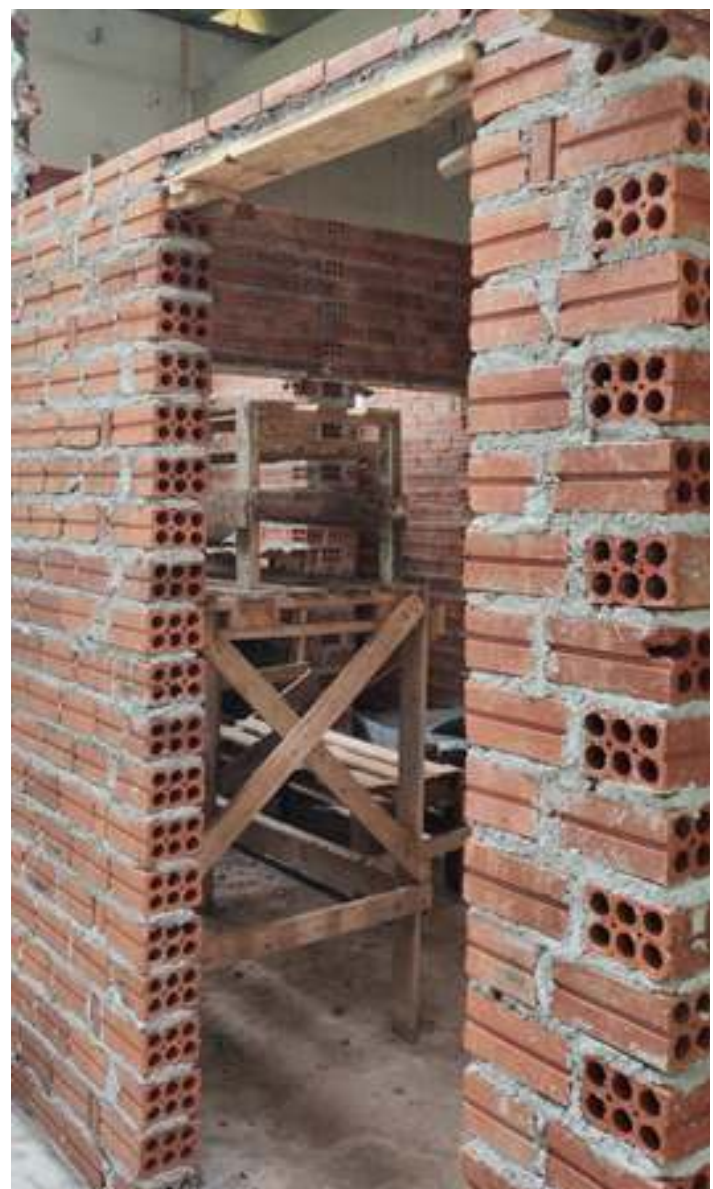
♦ Edificação das paredes dos novos sanitários internos da estação de Guaporé

Esse passeio é considerado um dos mais encantadores do Brasil, ocorre no Vale do Taquari, na Serra Gaúcha – localizado entre os municípios de Guaporé e Muçum. O trajeto possui 46 Km, passando por 14 pontes e viadutos e 23 túneis, através da Ferrovia do Trigo. Durante a edição 2021, serão 26 dias de passeio com duas saídas diárias, totalizando 52 passeios. O percurso será apenas de ida, sempre com o retorno de ônibus. Ocorrerá em Novembro, nos dias 06, 07, 13, 14, 15, 19, 20, 21, 27 e 28; em Dezembro nos dias, 04, 05, 11, 12, 17, 18, 19, 22, 26, 28, 29 e 30; e em Janeiro de 2022 nos dias 02, 07, 08 e 09. A comercialização dos bilhetes, que neste primeiro momento foi aberto apenas à agências e operadoras de turismo já se encontram com 78% esgotados.