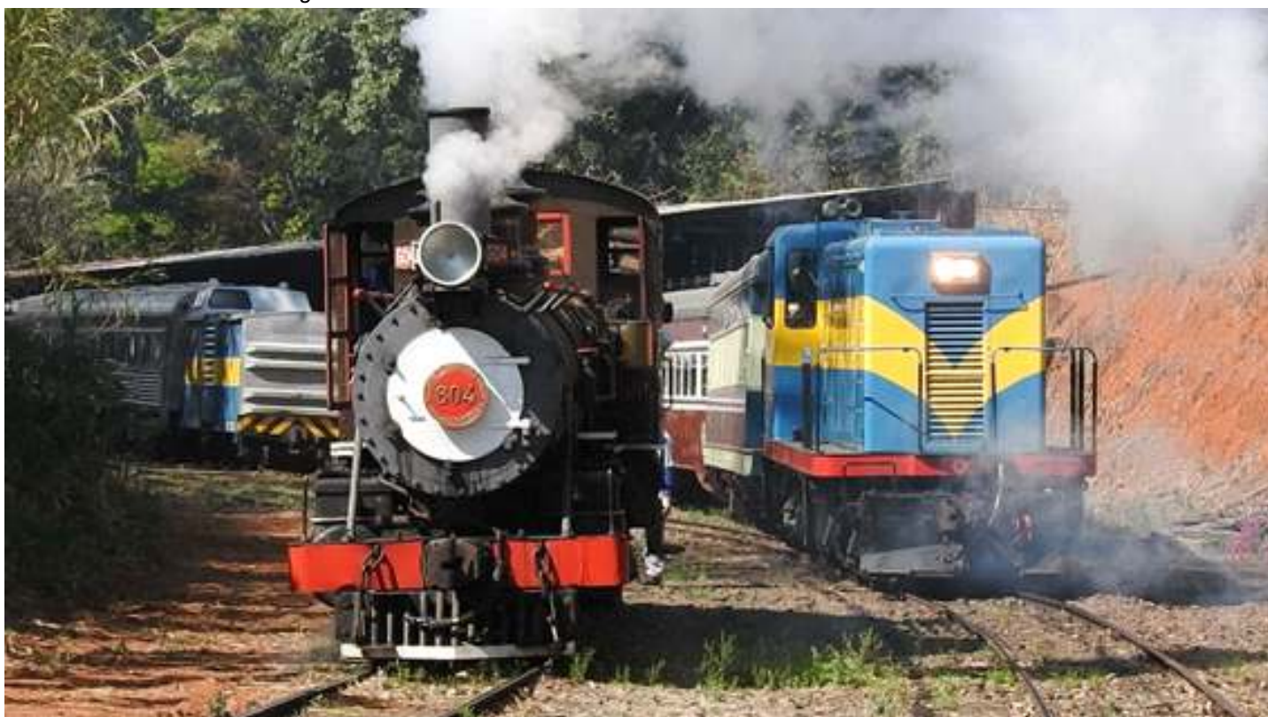
♦ Preparação do trem em Anhumas.