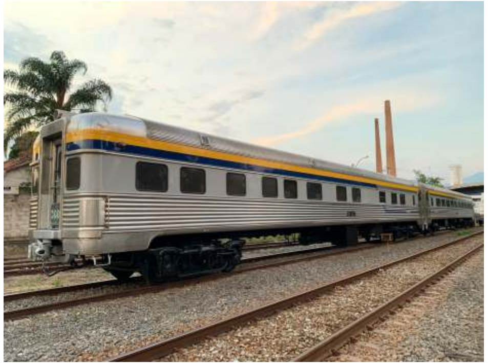
◆ Os carros da MRS após a conclusão dos trabalhos, já nas linhas do pátio da MRS em Cruzeiro/SP.

Após a conclusão dos trabalhos, os carros foram utilizados para conduzir autoridades do Ministério da Infraestrutura, entre eles, o Ministro Tarcísio Gomes de Freitas, ao longo do trecho ferroviário que dá acesso ao Porto de Santos. A bordo dos carros também haviam representantes da Agência Nacional de Transporte Terrestres (ANTT), da Agência Nacional de Transportes Aquaviários (Antaq) e da Santos Port Authority (SPA). A viagem aconteceu ontem, dia 24/09 e teve como objetivo apresentar os investimentos já