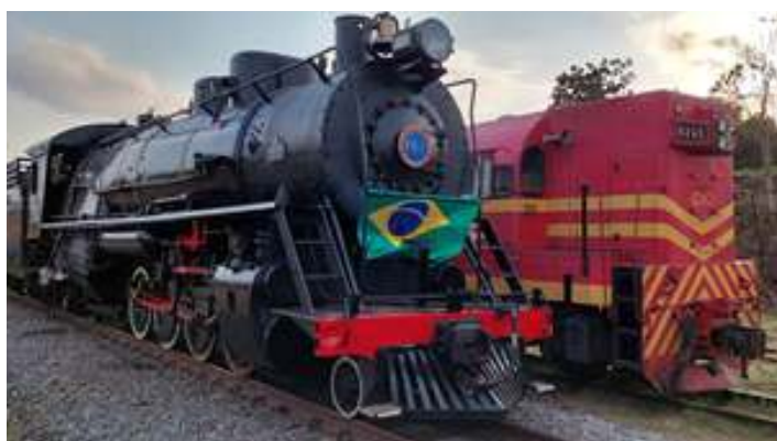
♦ Locomotiva Mikado nº 761 enfeitada com a Bandeira do Brasil, para comemoração do Dia da Independência.