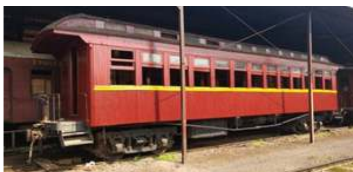
♦ Pintura externa do carro PM-35 conforme pintura original.