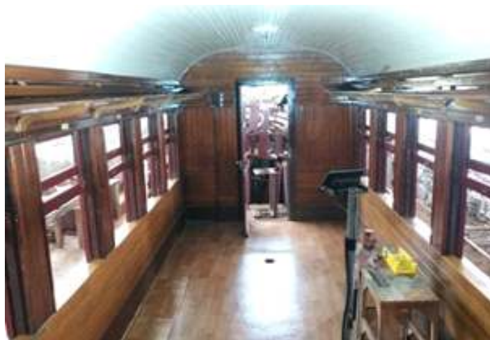
♦ Interior do carro de passageiros MD-47 após troca de madeiramento e aplicação de Decorflex.