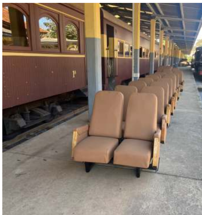
♦ Chegada dos bancos reformados nas oficinas de Cruzeiro; os mesmos já foram descarregados e colocados ao lado do carro para instalação

Seguem os trabalhos de manutenção e conservação da via e do material rodante. A via está sendo limpa, com capina e retirada de lixo. As saídas de água de vários boeiros e de drenagem da faixa de domínio foram corrigidas. Vários trechos foram nivelados e receberam complementação de lastro.