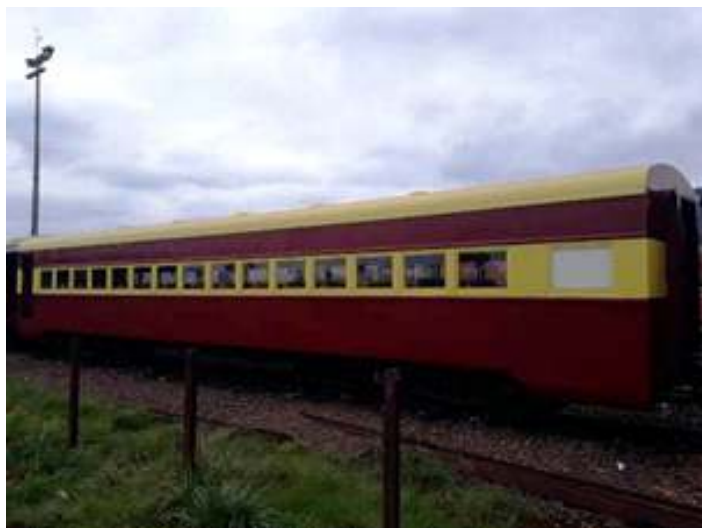
♦ Aspecto externo do carro PC-49 com a pintura finalizada.