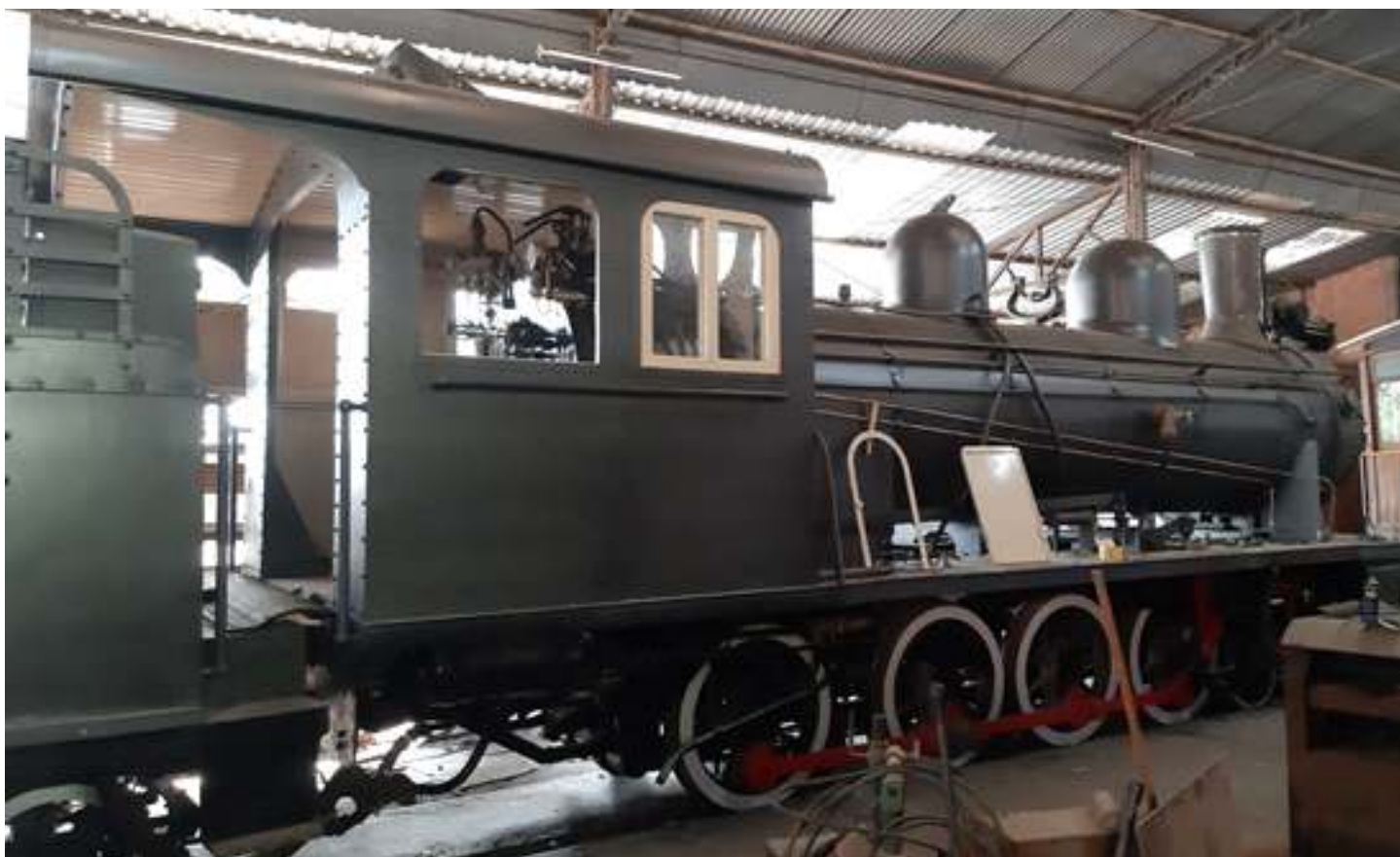
♦ Vista lateral com a pintura principal pronta, na cor grafite escuro.