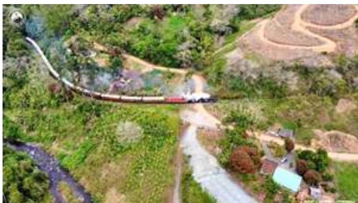
◆ Registro da composição do Trem da Serra do Mar gravada com drone por Anthar Cesar Hartmann (Cesar Blumenau).