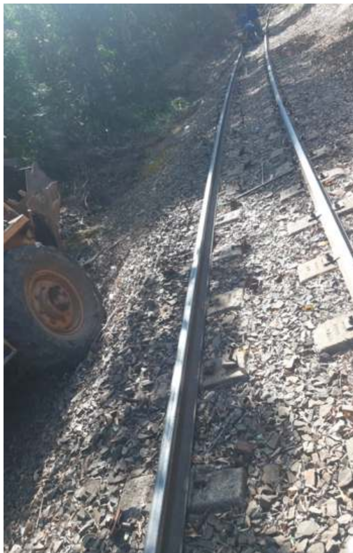
♦ Trabalho de inversão de barras de trilho – KM 11

A Regional Campinas agradece a todos os colaboradores, associados e amigos que colaboram e colaboraram pelo sucesso das operações do mês de setembro, os trabalhos na via e nas oficinas.