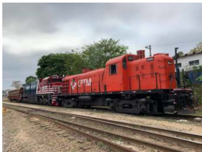
♦ Já na estação Manoel Feio da CPTM com a Rs3 lider