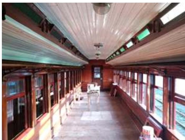
♦ Aspecto do carro de passageiros PM-35 após pintura interna.

Ainda em uma terceira frente de trabalho, estamos preparando novos carros para compor a nova composição do Trem da Serra do Mar. Considerando que doze carros de passageiros estarão em viagem, cumprindo o calendário dos Trens Comemorativos. O mês avança com a restauração do carro PM-35, foi realizada a troca de madeiramento comprometido e iniciado a pintura interna e externa nas cores originais do carro. Na parte interna já foi confeccionada as bases em madeira – que agora aguardam as espumas e revestimentos - para as novas poltronas que serão instaladas no carro, bem como o sistema hidráulico. O carro também teve seus conjuntos de truques retirados para que se pudesse ser feita a revisão e troca de componentes do material rodante.