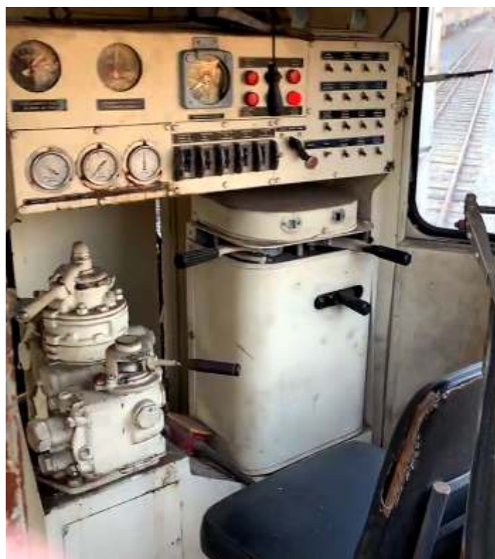
♦ Painel da 3507 durante os testes nas linhas do pátio