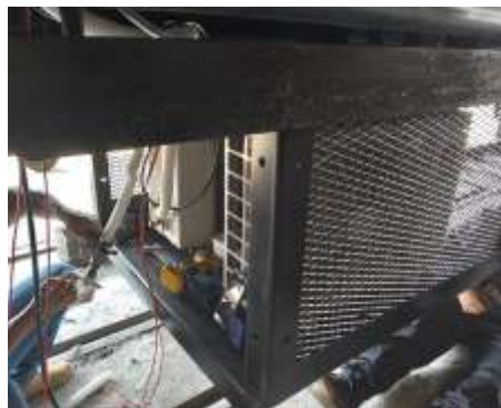
◆ Revisão completa do sistema de ar-condicionado dos carros