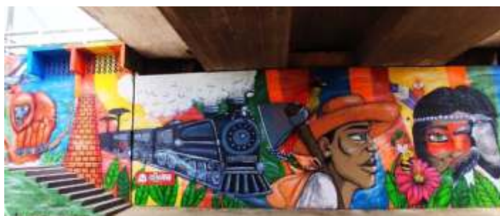
♦ Antes e depois do mural sobre o viaduto Rodrigo Ajace.