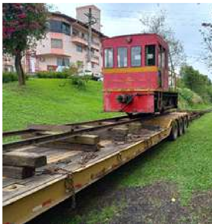
♦ Translado de Rio Negrinho para Piratuba da locomotiva nº 06 – GE 25T (Bitruca).