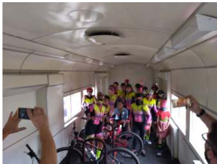
♦ Ciclistas embarcando suas bikes no carro bicicletário da CPTM para fazer a viagem no Expresso Vale das Frutas

Esse projeto foi uma realização da ABPF – Associação Brasileira de Preservação Ferroviária com parceria do VFC&VB - Vale das Frutas Convention & Visitors Bureau e da APHV - Associação de Preservação Histórica de Valinhos; contou com apoio da Rumo, CPTM e MRS Logística, demonstrando mais uma vez o interesse dessas concessionárias perante a sociedade no reconhecimento da ferrovia como instrumento de desenvolvimento e representação cultural, parte de nosso legado histórico e do