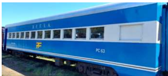
♦ Carros PC-63 e PC-49 com pintura finalizada, conforme o padrão original.