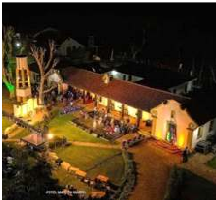
◆ Apresentações musicais noturnas na Fazenda do Socorro.

Aproveitando o feriado do Dia das Crianças, foi realizado também, um passeio especial com as crianças de algumas escolas do município de Vacaria. Ainda no dia 12 de Outubro, na Fazenda do Socorro, foi feito a gravação de um DVD, com Live nas redes sociais, do grupo Tchê Barbaridade. Para os passageiros, o acesso a gravação foi gratuito, além disso, havia também o “opentruck”, uma modalidade semelhante ao já conhecido “openbar” porém, para os lanches oferecidos pelos foodtrucks.