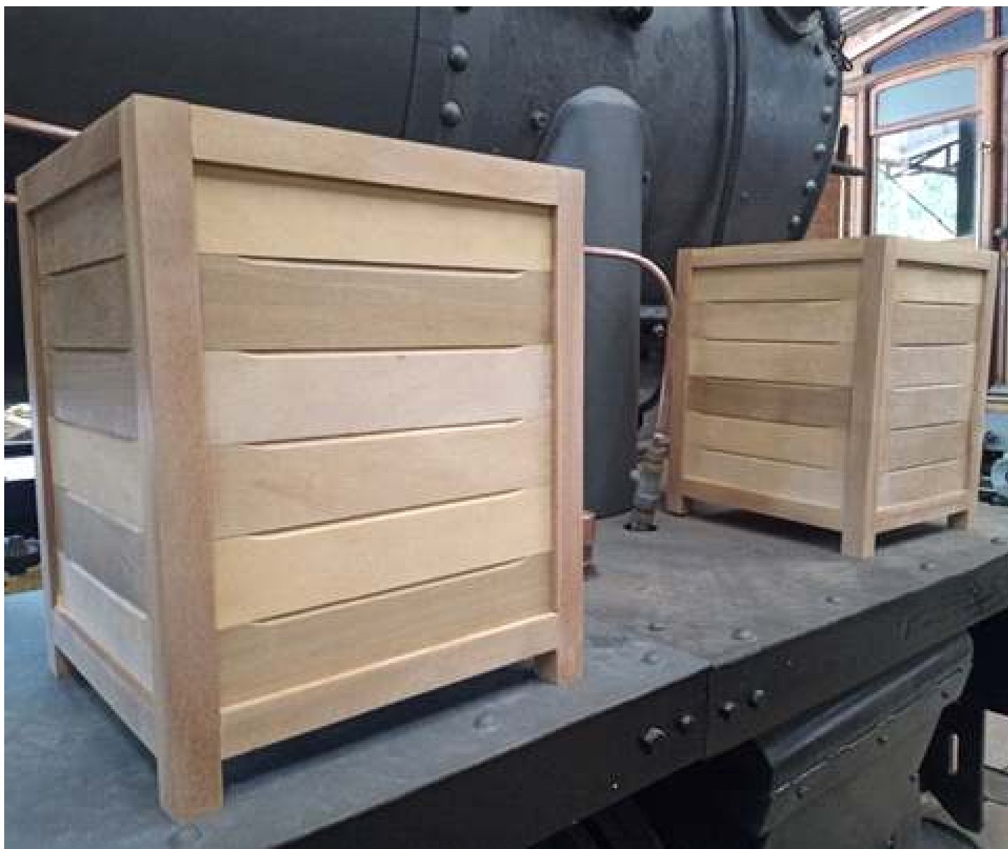
♦ Novos assentos da cabina da locomotiva 12 – Ribeirão Preto – SP