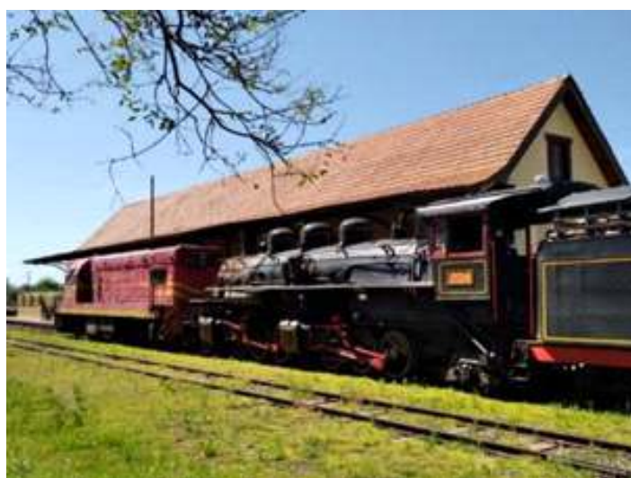
♦ Chegada da composição à Estação de Restinga Seca, na linha Porto Alegre – Uruguaiana.