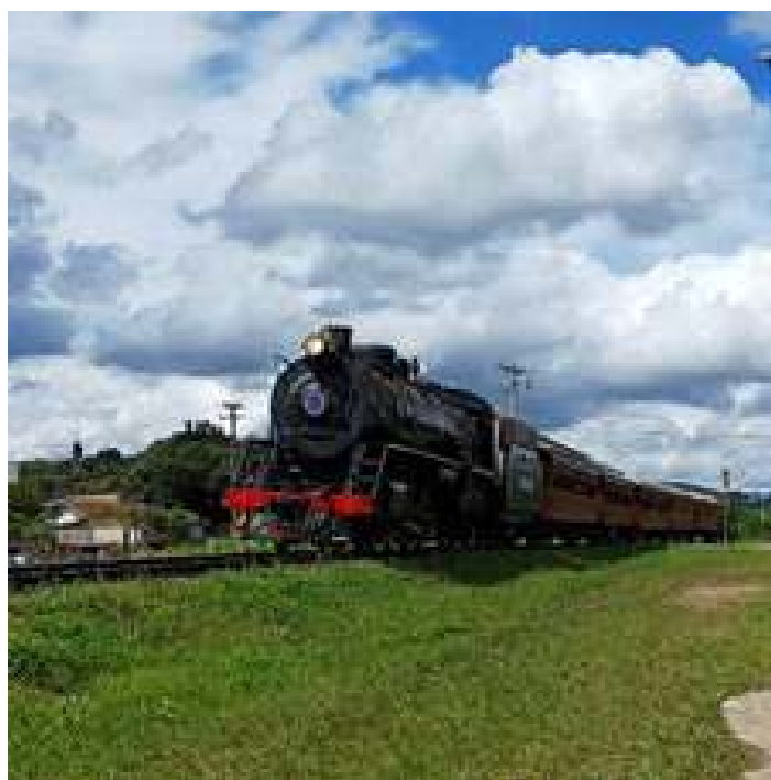
♦ Belíssima imagem do segundo final de semana de passeios.