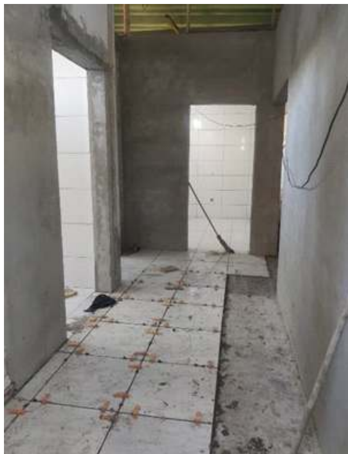
♦ Finalização da construção dos novos sanitários na Estação Ferroviária de Guaporé – RS