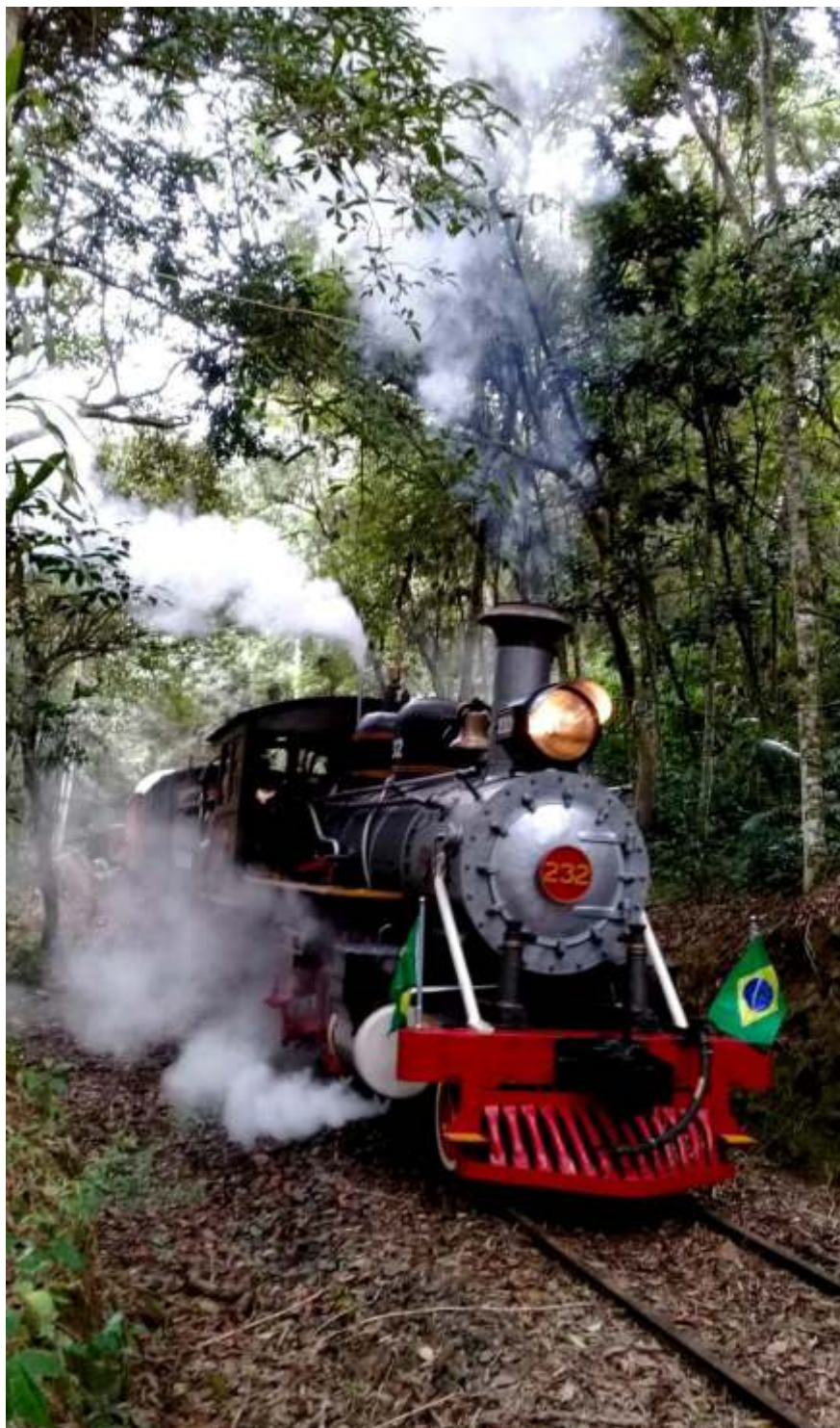
♦ Locomotiva 232 tracionando o trem da EFSC.