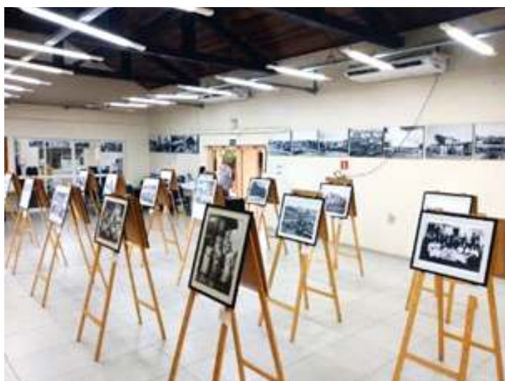
◆ Exposição de fotos do acervo de Alicio de Assunção.