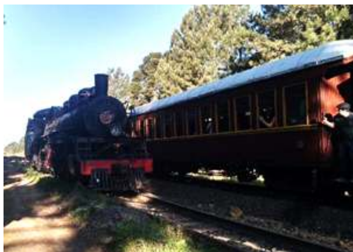
♦ Nossa locomotiva articulada nº 204 durante as manobras do último passeio.

Assim como no primeiro final de semana de passeios, este também foi de grande sucesso com o público, com saídas sempre lotadas, sendo utilizado os doze carros de passageiros, lembrando sempre de fazer uso do distanciamento social e demais protocolos do COVID-19, também tivemos dias com clima bastante ensolarado sendo assim, muito proveitosos para o passeio. Novamente pudemos contar com o serviço de bordo especial, fornecido pelo Restaurante Bistrô de Lages, servindo tábuas de queijo e frutas harmonizada com espumantes e vinhos. Por conta de o nosso trem ser grande durante esta edição, contamos novamente com a ajuda de nossos preciosos voluntários, que nos deram uma enorme ajuda no serviço de bordo.