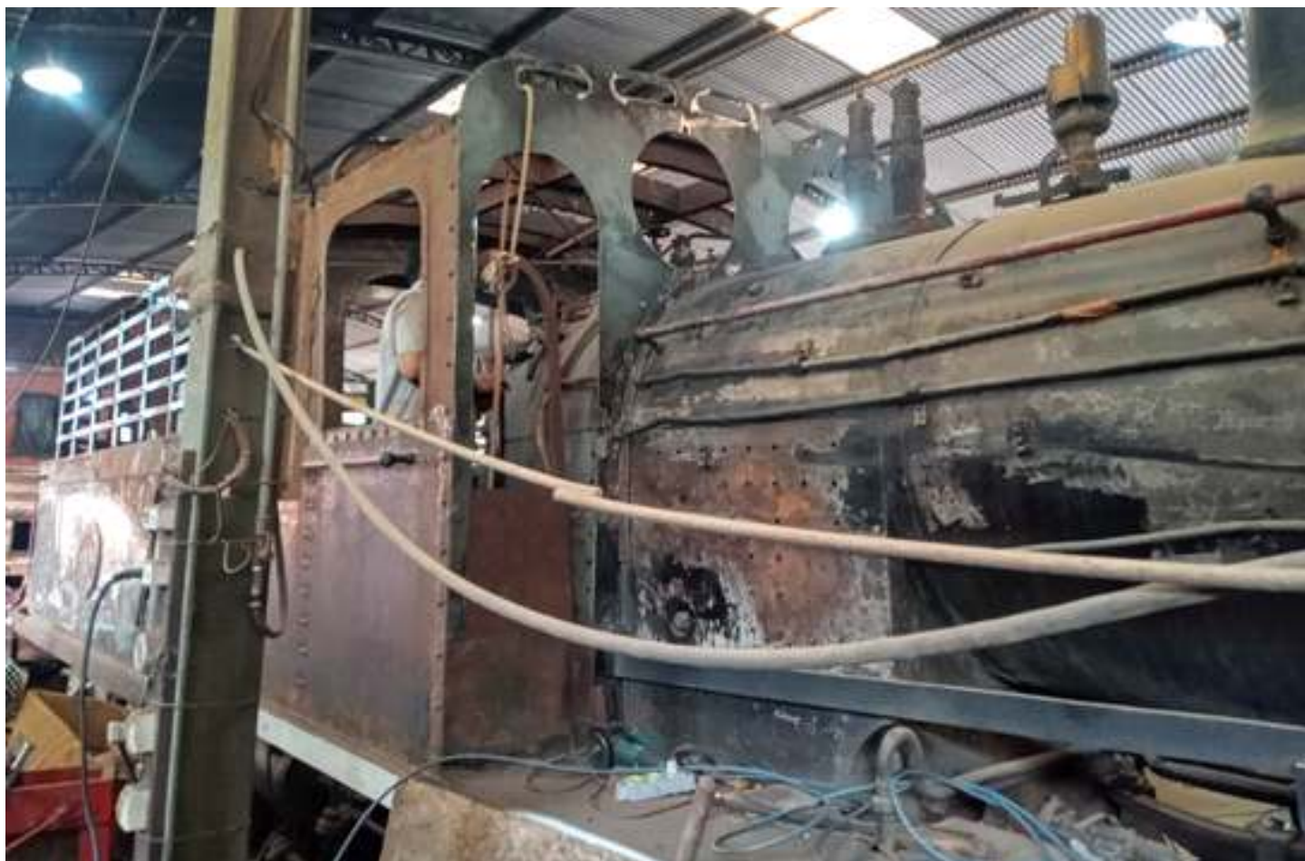
♦ Locomotiva 9 sendo raspada e com nova chapa na frente da cabina.