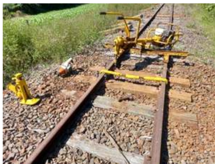
♦ Operação de troca de dormentes comprometidos em Piratuba.