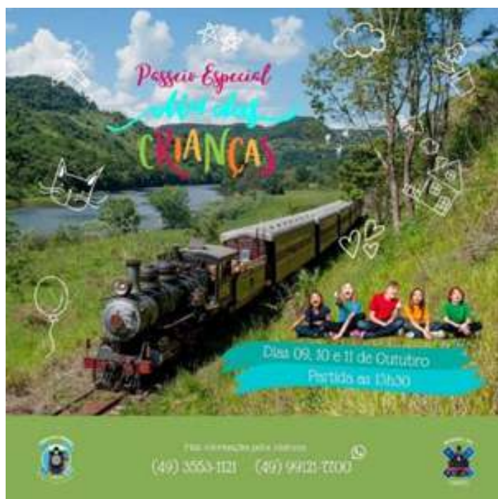
♦ Post publicitário dos passeios especiais de Dia das Crianças.

Durante o mês, no Trem das Termas, foi criada uma programação de passeios especiais, tendo em vista que foi um dos maiores públicos para essa época do ano, com o trem operando em todos os finais de semana, inclusive aos domingos e durante a semana, lembrando sempre de estar cumprindo todos os protocolos de segurança em relação ao Covid-19. Durante o mês, também foi feita uma grade de programação especial de passeios, em comemoração ao Dia das Crianças.