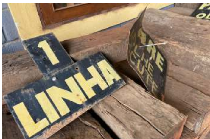
♦ Placas de sinalização removidas para recuperação