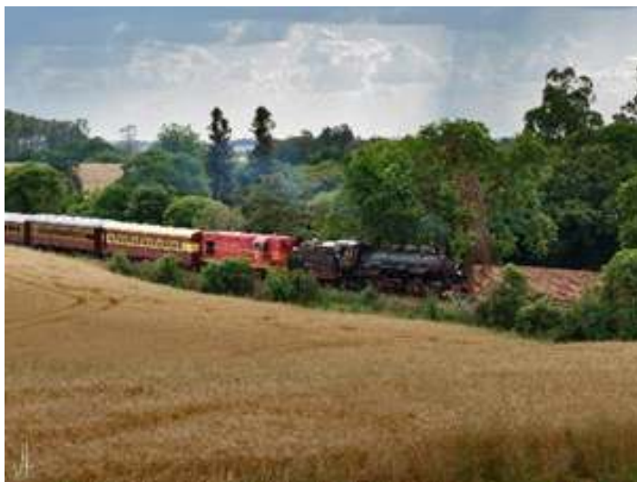
♦ Belíssimas imagens externas do Trem das Missões