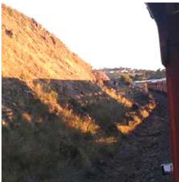
♦ Composição do passeio atravessando a Coxilha Rica ao entardecer do último passeio.

Após os passeios em Lages e Vacaria, aproveitamos as paradas durante o traslado de nossa composição até Ijuí, para realizarmos as pinturas das inscrições em alguns de nossos carros de passageiros. Esta pintura ajudou a deixar os carros em questão, ainda mais próximos das características originais. Foram feitas pinturas nos carros de aço de fabricação Santa Matilde PC-49 com inscrição R. F. F. S. A. – LEOPOLDINA, e no PC-63: R. F. F. S. A.- PARANÁ-SANTA CATARINA. Já o carro PD-44, recebeu a pintura das iniciais da Rede Mineira de Viação (RMV). Todos os carros pintados durante o mês receberam também, a pintura de suas respectivas classes e numeração. Ainda durante o traslado para Ijuí, houve diversos railfans que acompanharam a viagem durante boa parte do passeio, fotografando e filmando a passagem de nosso trem.