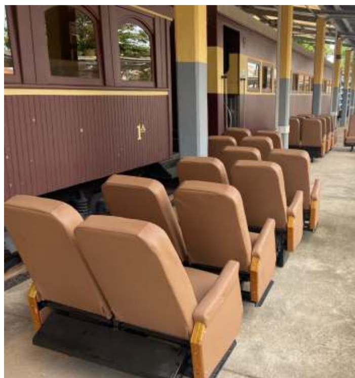
♦ Chegada da Segunda leva de bancos reformados nas oficinas de Cruzeiro; os mesmos já foram descarregados e colocados ao lado do carro para instalação

Seguem os trabalhos de manutenção e conservação da via e do material rodante. A via está sendo limpa, com capina e retirada de lixo. As saídas de água de vários boeiros e de drenagem da faixa de domínio foram corrigidas. Vários trechos foram nivelados e receberam complementação de lastro. As placas de sinalização estão sendo desmontadas e recuperadas.