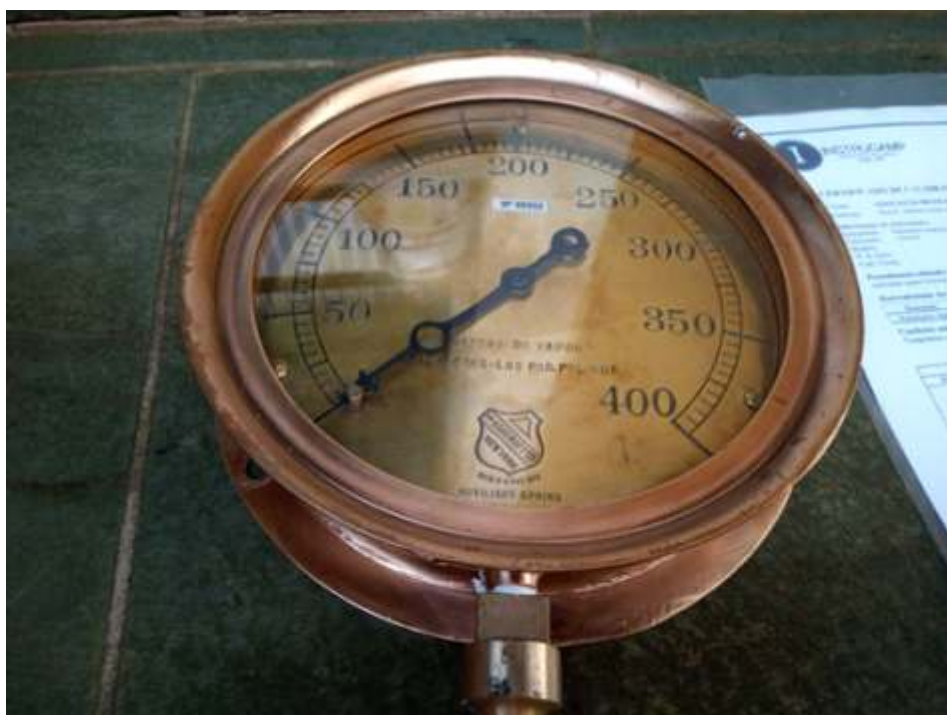
♦ Manômetro de pressão de locomotiva a vapor recuperado e aferido.

Na via permanente prosseguimos com as manutenções de rotina e também foi feito um mutirão para limpeza e recolhimento de galhos e arvores e dormentes que foram substituídos. Por fim saiu uma vagão plataforma lotada de lenha e outros materiais recolhidos do trecho, somente entre Anhumas e Tanquinho. Agora será feito de Tanquinho a Jaguariúna.