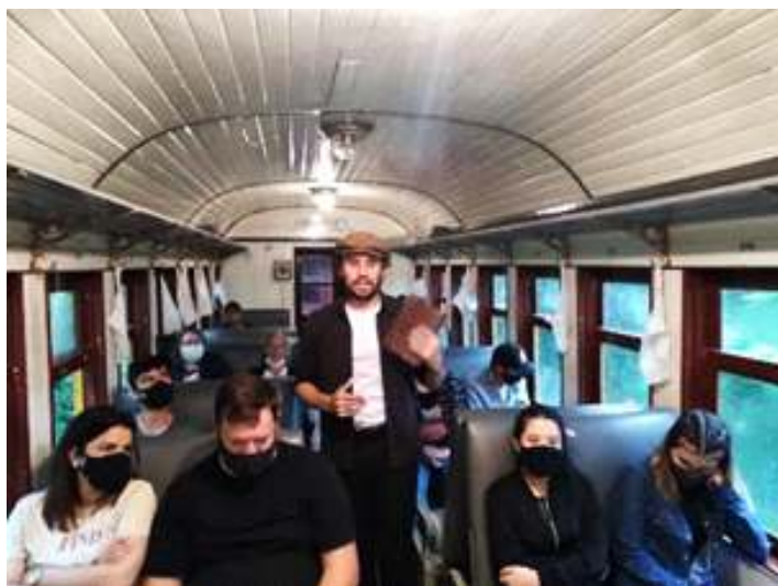
♦ Atração artística 04 – O Poeta.

Atração 04 – O Poeta: Este personagem, vestido à caráter, percorria todo o trem a procura de sua amada namorada. Durante sua procura, ele recitava diversos versos de amor e poemas sobre o romantismo e a vida das antigas viagens de trens de passageiros pelo Rio Grande do Sul.