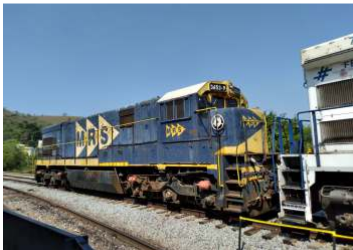
♦ A MRS disponibilizou uma locomotiva GE U23C para visitaç o durante o evento