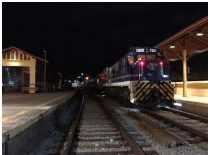
♦ O Trem do Horror na plataforma da linha 2 na estação de Guararema.

Realizamos no dia 30 o primeiro trem com temática de Halloween em Guararema em parceria com um restaurante local. Esse trem circulou após os trens do dia e foi um grande sucesso de público, atraindo também a imprensa, que cobriu o evento.