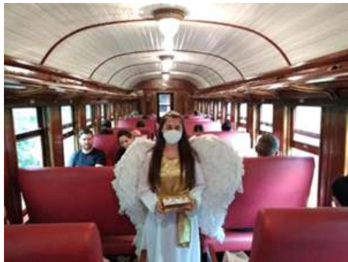
♦ Atração 02 – O Anjo.

Atração 02 – O Anjo: Um anjo passava pelos carros de passageiros com uma caixa com diversas cartas com mensagens. Cada passageiro retirava uma carta e a lia, após, era feita uma meditação acerca da mensagem do conteúdo da carta. A ideia de utilizar um anjo como atração turística da prefeitura de Santo Ângelo (Santo Anjo em Latim), devido às missões de Jesuítas no passado, fazendo que a região fosse reconhecida nacionalmente como a região das missões e de São Miguel Arcanjo.