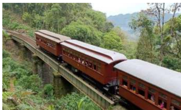
♦ Aspecto exterior dos carros MD-37, PM-45 e PM-36 – recém-restaurados