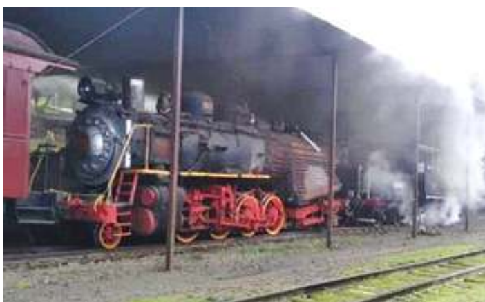
♦ Locomotiva Mikado nº 156 já com as braçagens montadas, durante manobra no pátio de Rio Negrinho.