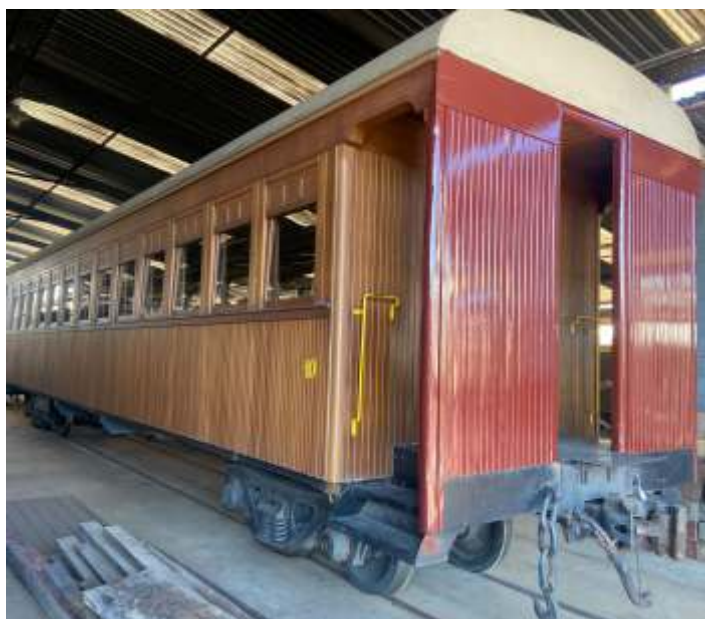
♦ As cabeceiras do carro SD-05 receberam nova pintura nas oficinas de São Lourenço