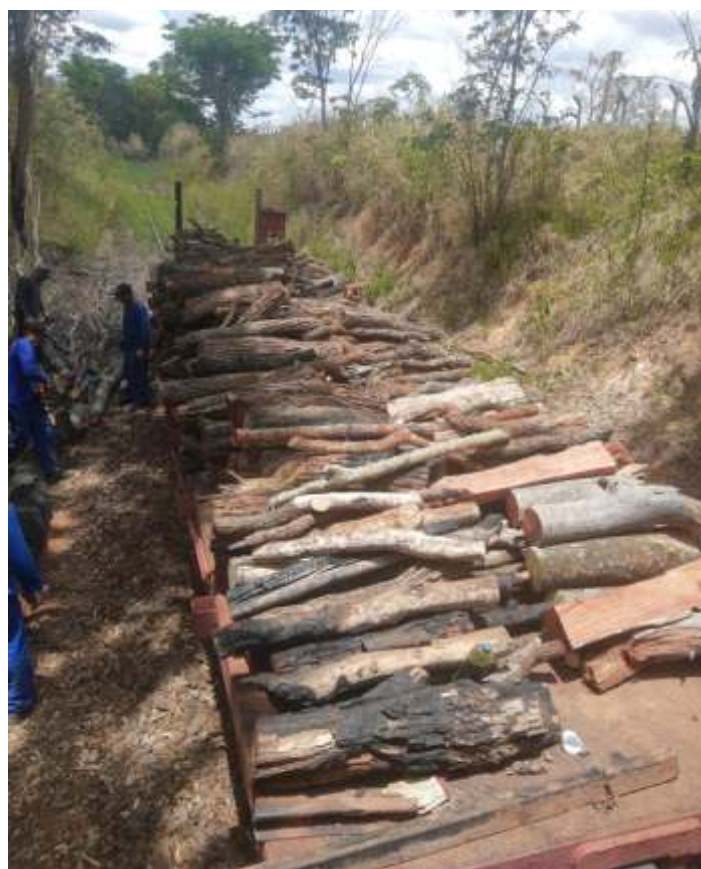
♦ Carregamento de madeiras ao longo da via em mutirão da equipe!