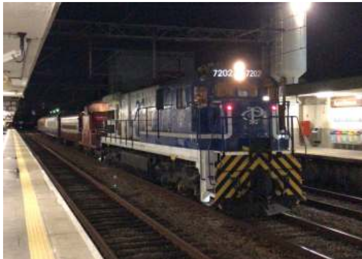
♦ Composição retornando para Guararema, passando pelas linhas da CPTM.

Após o encerramento do Expresso Vale das Frutas, a composição da ABPF retornou para Guararema para retomada dos passeios. Como adição a composição, veiram os carros de aço carbono ex. RFFSA/Central e o Pullman ex. Cia. Paulista.