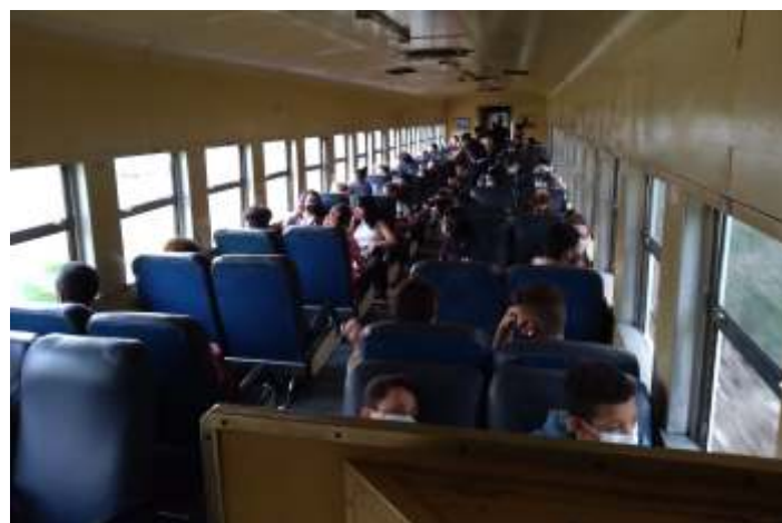
◆ Crianças durante a viagem de caráter social

Tivemos a bordo também um grupo de ciclistas, que embarcou suas bikes no carro biciletário da CPTM e fez a viagem no expresso.