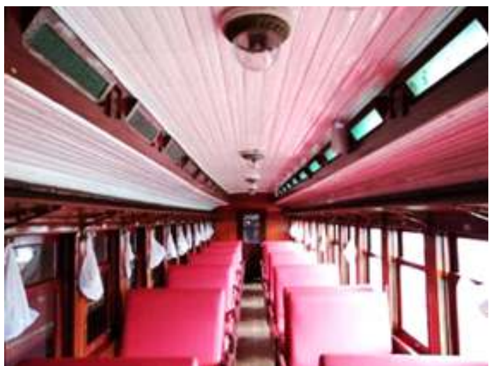
♦ Aspecto interior do Carro de Passageiros PM-36