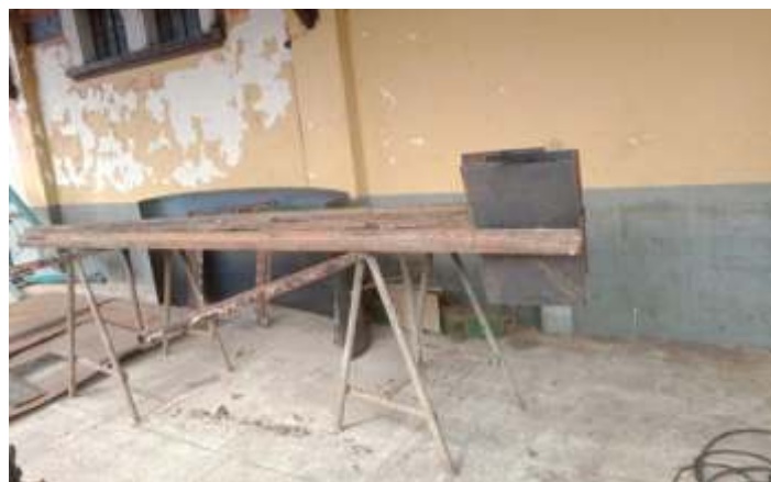
♦ Confeção de placas para via permanente e ao fundo chapa calandrada para o teto da cabina da locomotiva 9.