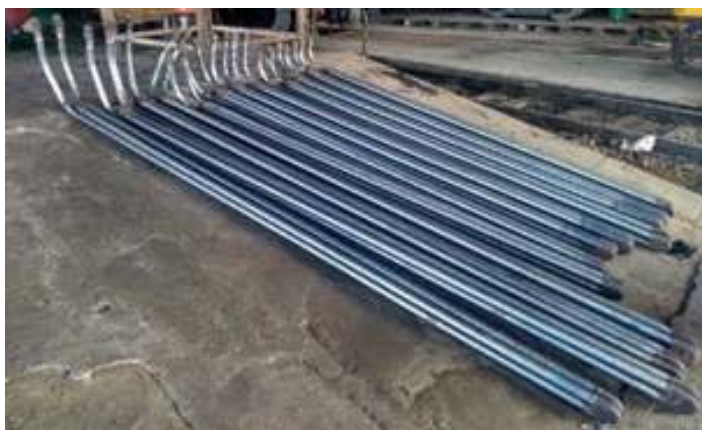
♦ Novos tubos da serpentina do superaquecedor da locomotiva Mikado nº 156.

Já a locomotiva Mikado nº 156, entra na fase de finalização de suas reformas. Durante a primeira metade do mês, a locomotiva teve todas as suas rodas motrizes instaladas, o que possibilitou a locomoção da máquina para a vala de manutenção, possibilitando a instalação das braçagens, e remontagem da cabine. Também foi realizado o teste hidrostático, acompanhados pelos engenheiros do cliente. Agora, os trabalhos nesta locomotiva concentram-se na montagem das serpentinas do super-aquecedor, e finalização com a remontagem de todos os componentes. A recuperação da caldeira desta locomotiva, é um serviço terceiro, pois, esta máquina pertence ao Trem do Vinho, de Bento Gonçalves (RS). É um processo lento, que já está entrando no décimo terceiro mês de trabalhos, um desafio que vem chegando agora, a sua fase final.