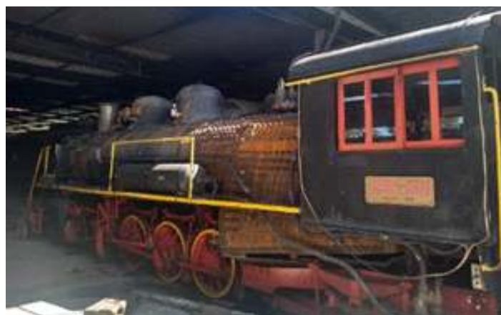
♦ Locomotiva Mikado nº 156 com a cabine já reposicionada e início da finalização da caldeira.

Já no setor de carros, finalizamos no início do mês, a restauração dos três carros de passageiros que estavam sendo preparados para formar a nova composição do Trem da Serra do Mar. Também iniciamos a restauração de mais um carro, este construído na Metalúrgica Nacional, em Joinville – SC, durante a década de 1940. Foi encomendado pela RVPSC, durante a época que esta ferrovia estava modernizando toda sua frota de carros, vagões e locomotivas. Ainda no início do mês, este carro foi posicionado na vala de manutenção, e teve os trabalhos de remoção de material comprometidos iniciado. Em outra frente de trabalhos, foi dado início à restauração do vagão VF-127. Este vagão do tipo FNB, está sendo preparado a pedido da Prefeitura Municipal de Rio Negrinho, para ser colocado estaticamente no pátio de entrada da cidade, onde atuará como um ponto de informações turísticas. No local onde o vagão ficará, será preparada uma estrutura adequada com trilhos, lastro e uma cobertura para proteger o vagão.