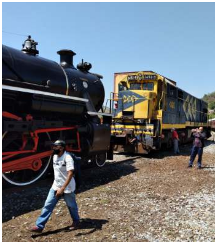
♦ A U23 da MRS frente a frente com a 353 durante o evento: ambas as locomotivas puderam ser visitadas pelo público presente