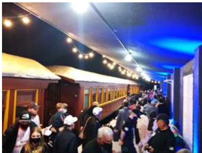
♦ Estação de Santo Ângelo revitalizada para os passageiros.