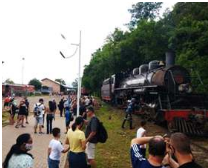
◆ Recepção de nossos passageiros na Estação Ferroviária de Ijuí.