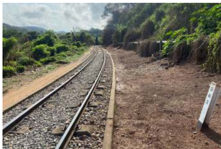
♦ Limpeza do km 80+100 ao 80+400