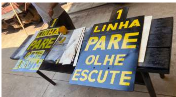
♦ Placas de sinalização sendo recuperadas em nossas oficinas