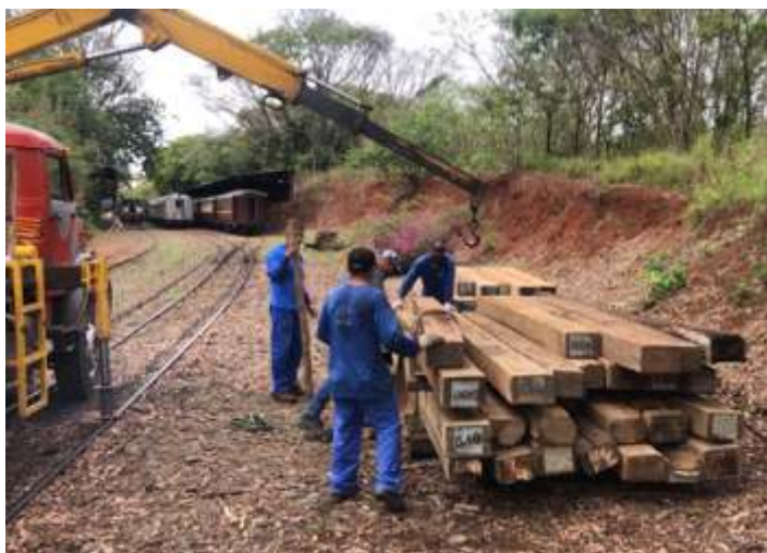
♦ Organização dos dormentes no pátio.

Também foram transportados para a VFCJ os truques de bitola de 1,60 metros que estavam sob os estrados dos vagões incendiados na cidade de Louveira SP, que foram cortados e retirados, mas ao menos os truques conseguimos salvar.