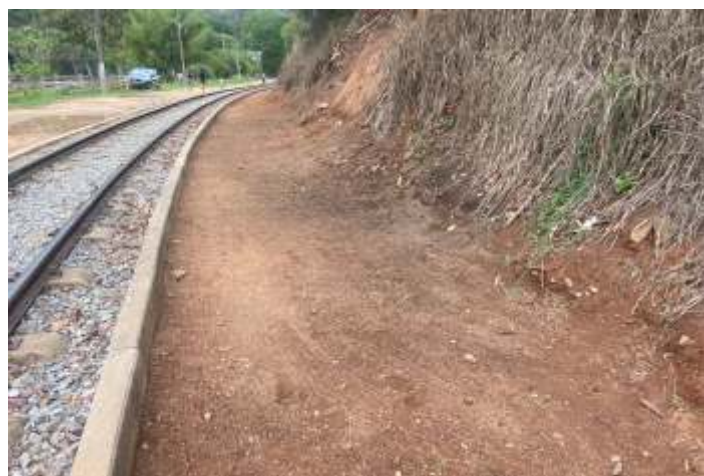
♦ Antes e depois: limpeza no km 81+300