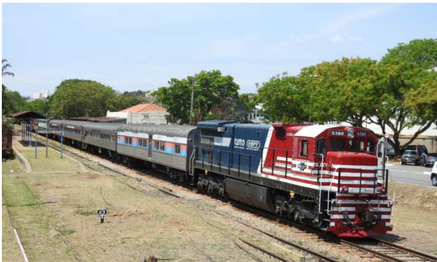
◆ O Expresso Vale das Frutas durante parada na estação de Vinhedo.