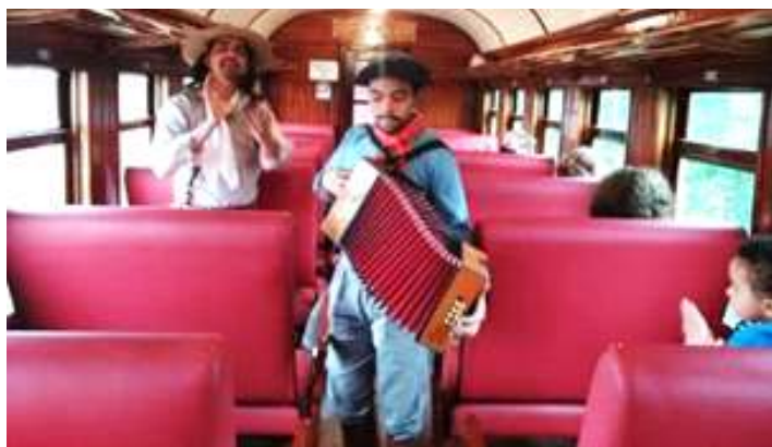
♦ Atração 05 – Show a Bordo com Música ao Vivo.

Atração 05 – Show Nativista: Sendo a última apresentação do passeio, a dupla de artistas nativistas, percorreram o trem apresentando vários versos, que acompanhados de música de acordeon, demonstravam o tradicionalismo gaúcho.