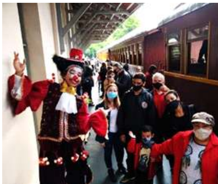
♦ Atração Circense na Estação Ferroviária de Catuípe.