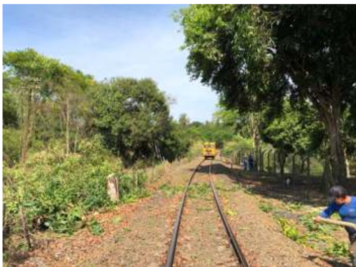
♦ Poda de galhos de arvores e limpeza da via permanente.