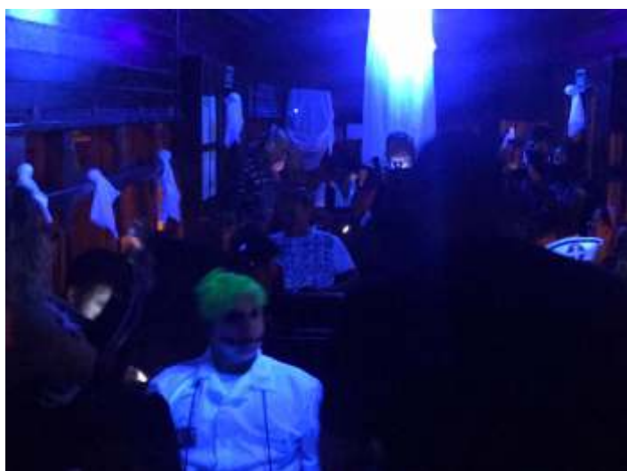
♦ Os carros foram preparados, com decoração e iluminação para dar o clima de Halloween