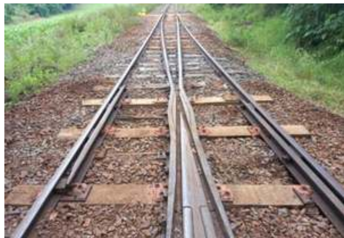
♦ novos dormentes na via permanente, próximo à estação de Rio Uruguai.