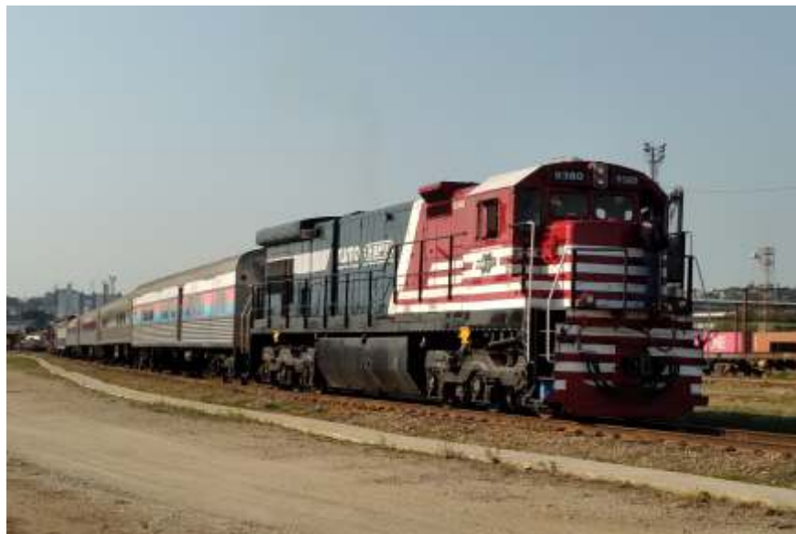
◆ Expresso Vale das Frutas no pátio de Jundiaí

O mês de outubro consolidou ainda mais o trabalho desenvolvido pela ABPF, com sucesso em diversas realizações, como o Expresso Vale das Frutas que correu até o dia 12/10 no trecho entre Louveira e Valinhos e os diversos trens comemorativos que percorreram boa parte da Malha Sul do país. Graças a interação e confiança de diversas concessionárias, foi possível realizar esses trens, que foram sucesso por onde passaram, atraindo grande público e dando grande visibilidade para a associação e para as concessionárias, CPTM, MRS e Rumo, as quais agradecemos mais uma vez pelo apoio, confiança e parceria, que tem trazido tão bons frutos.