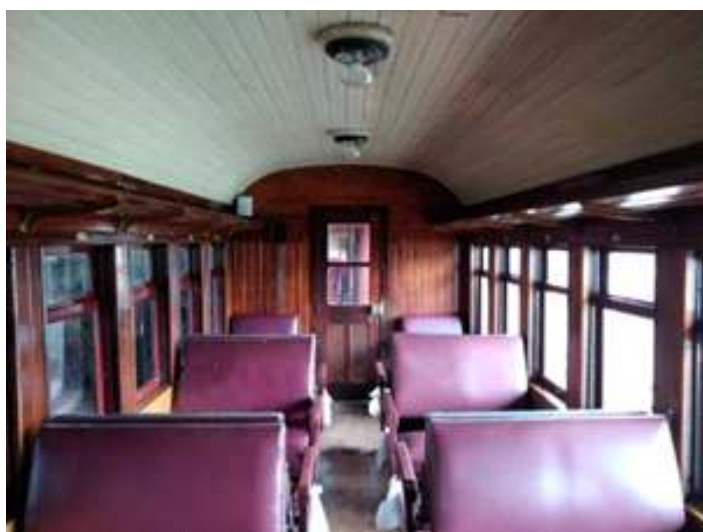
♦ Aspecto interior do Carro de Passageiros MD-37

No início do mês, finalizamos a restauração dos três carros que formarão a nova composição do Trem da Serra do Mar. Os trabalhos concentraram-se principalmente na instalação da parte elétrica e hidráulica e dos sanitários em conjunto com a instalação das poltronas nos carros MD-37 e PM-36. Já os trabalhos no carro PM-45 concentraram-se na revisão de seus truques e troca das molas helicoidais. A pintura externa dos carros já havia sido realizada no mês anterior, porém futuramente os carros ganhará os letreros em cor amarela, conforme os padrões originais da RVPSC (Rêde de Viação Paraná – Santa Catharina).