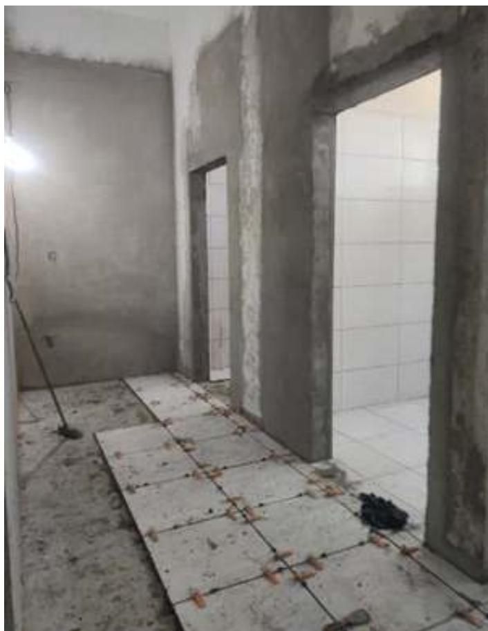
♦ Finalização da construção dos novos sanitários na Estação Ferroviária de Guaporé – RS