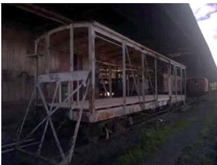
◆ Aspecto externo do carro PC-49 com a pintura finalizada.

Já em uma terceira frente de trabalhos, demos início à revisão da parte rodante do nosso auto de linha, apelidado de “Bolinha”, que será utilizado como batedor durante a edição de 2021 do Trem dos Vales, na Serra Gaúcha. Os trabalhos concentraram-se no torneamento dos rodeiros, conforme o padrão da Concessionária Rumo Logística. Também foram revisados a parte do motor e dos freios, bem como a instalação elétrica. Os testes do “Bolinha” estão marcados para a primeira metade de Novembro, quanto o mesmo receberá GPS, e faróis auxiliares em LED.