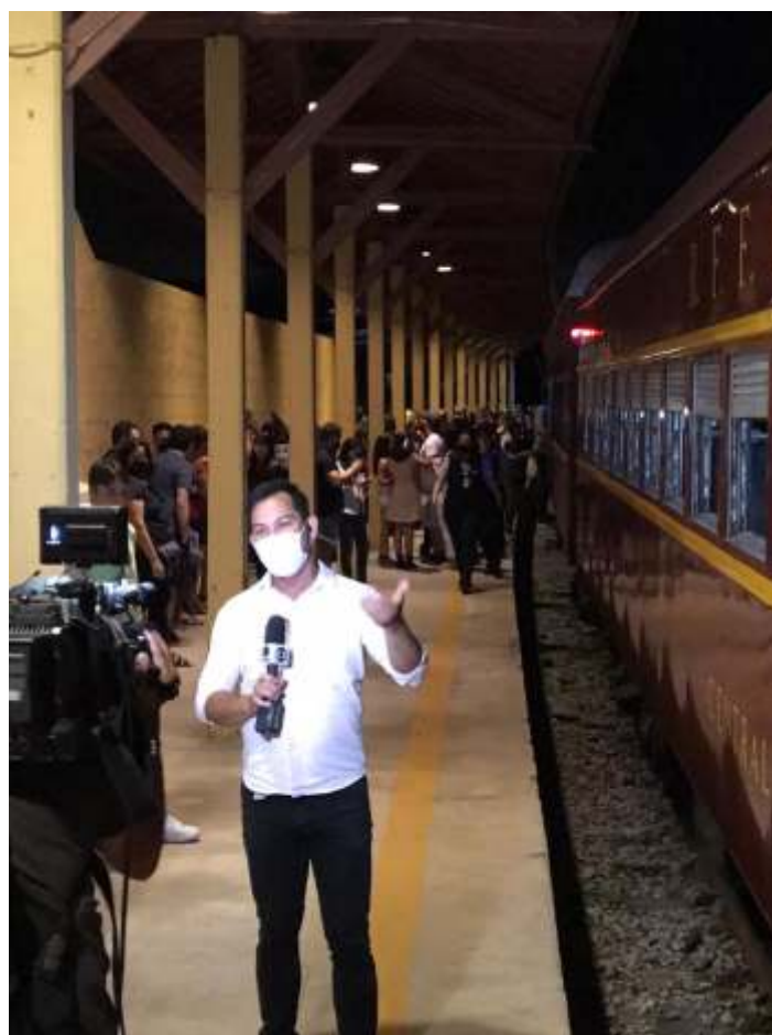
♦ O evento atraiu a atenção da mídia, que esteve presente