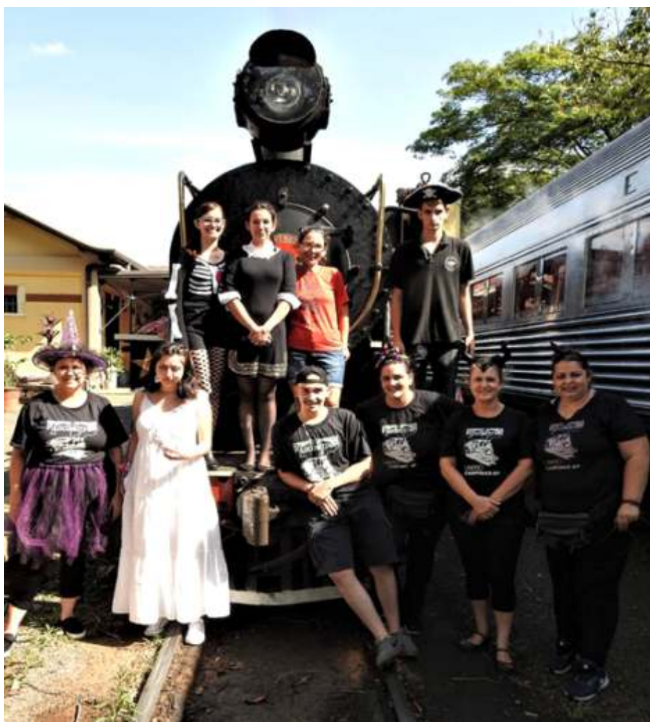
♦ Parte da equipe do trem no dia das Bruxas!!