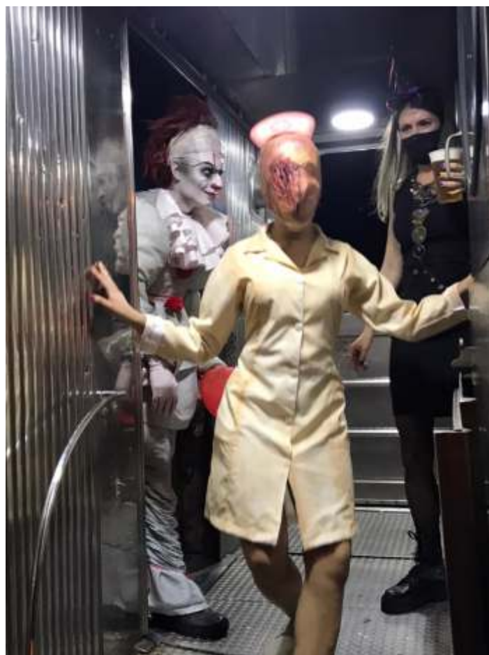
♦ Os participantes capricharam nas fantasias