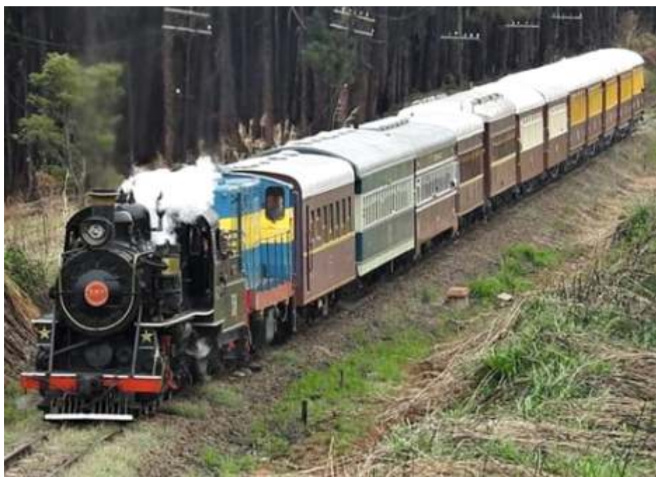
♦ Trem sentido a Pedro Américo – Foto de Vanderlei Zago.