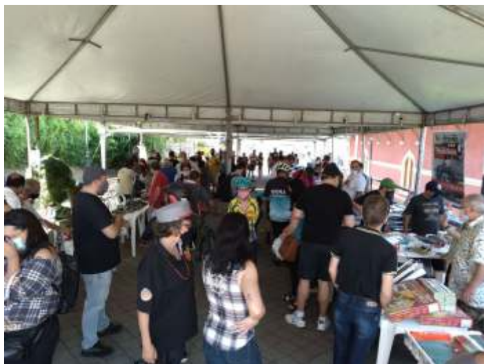
♦ Parte do público presente no encontro de ferromodelismo