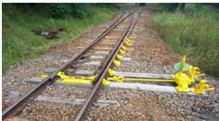
♦ Pintura dos AMV na estação de Rio Uruguai – SC

Este passeio está localizado no interior de Santa Catarina, na região do meio oeste no baixo vale do Rio do Peixe. Operação que está entrando no seu décimo oitavo ano de operação, é um resgate da antiga Estrada de Ferro São Paulo – Rio Grande, inaugurada em 17/12/1910. O percurso do passeio é de 25 Km através desta ferrovia, que no Estado é chamada Ferrovia do Contestado, pois foi nesta região que ocorreu um dos maiores confrontos armados entre sertanejos e militares, a chamada de Guerra do Contestado, que teve como pivô, a construção desta ferrovia.