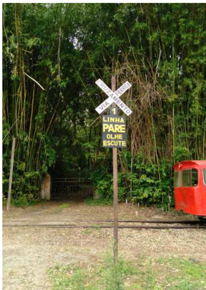
♦ Algumas placas recuperadas em nossas oficinas já reinstaladas em seus locais