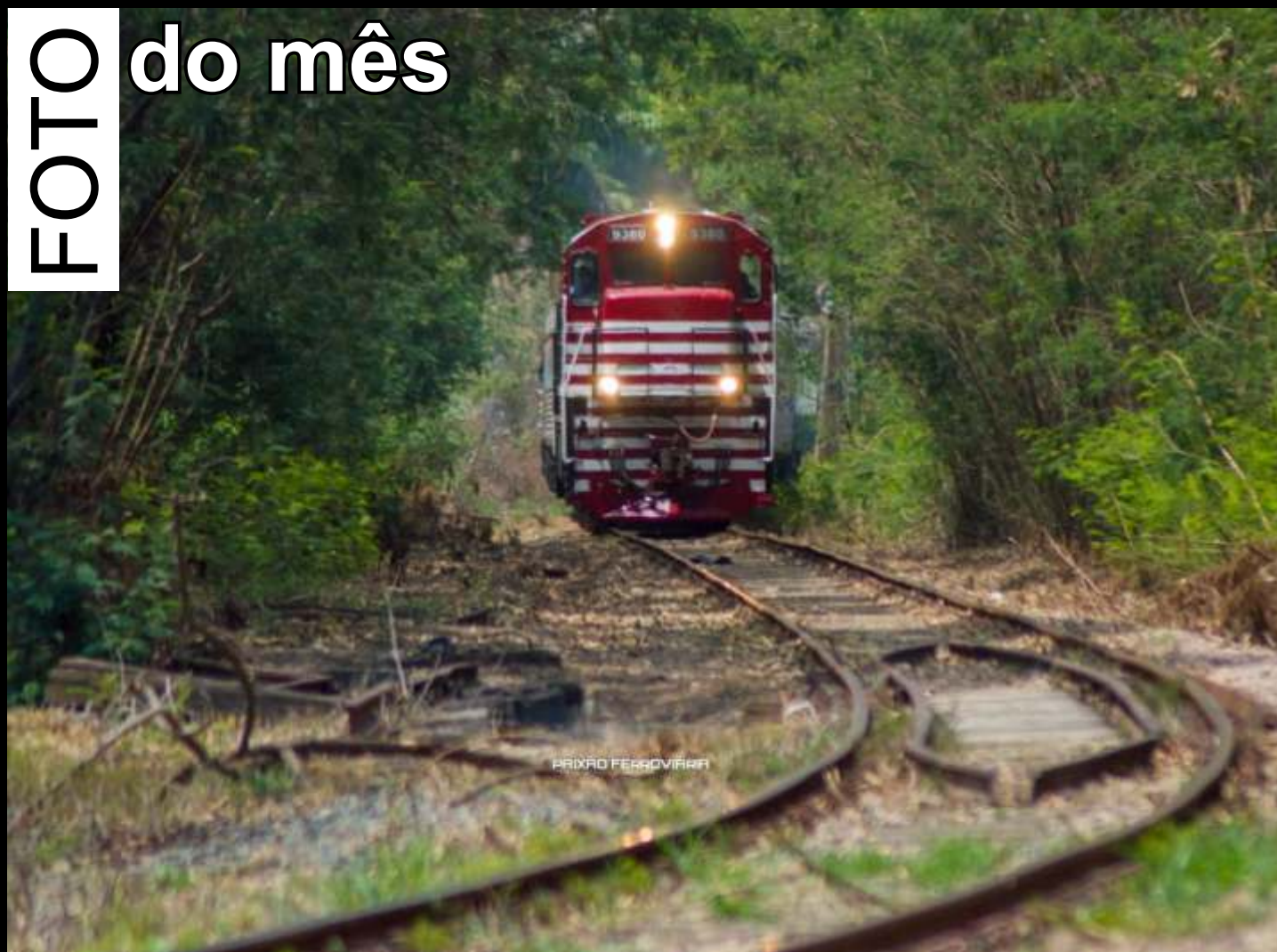
♦ O Expresso Vale das Frutas sendo conduzido pela C30-7 #9380 da ABPF Regional Sul de Minas . Autoria de Ítalo Moreira

Todo mês selecionaremos uma foto relacionada ao trabalho da associação publicada no grupo ABPF - Oficial no Facebook para publicar aqui.