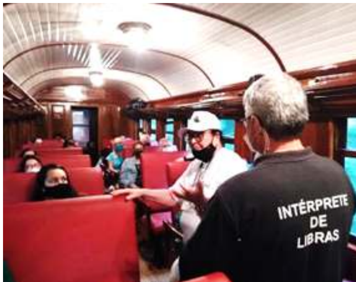
♦ Guia de Turismo local, com intérprete de Libras.

agradecimento, ao jornalista Alício de Assunção, por seu apoio, parceria e auxílio durante nossas viagens pelo Rio Grande do Sul, bem como por sua exposição de fotos em Ijuí. Agradecemos também, o fotógrafo Valdir Hobus (Instagram: @valdir_hobus_photoart) que realizou diversas filmagens e belíssimas fotografias de nossa composição nos dias de passeio.