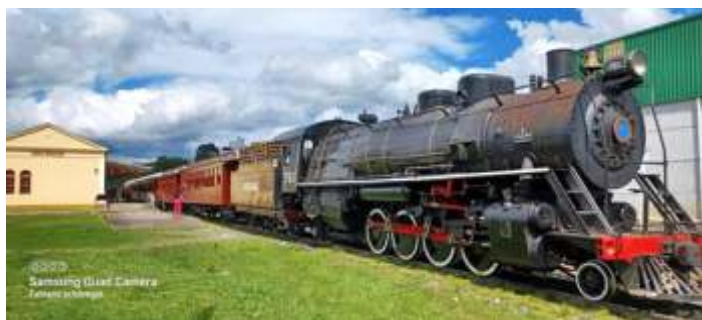
♦ Belíssimas imagens do segundo final de semana de passeios.