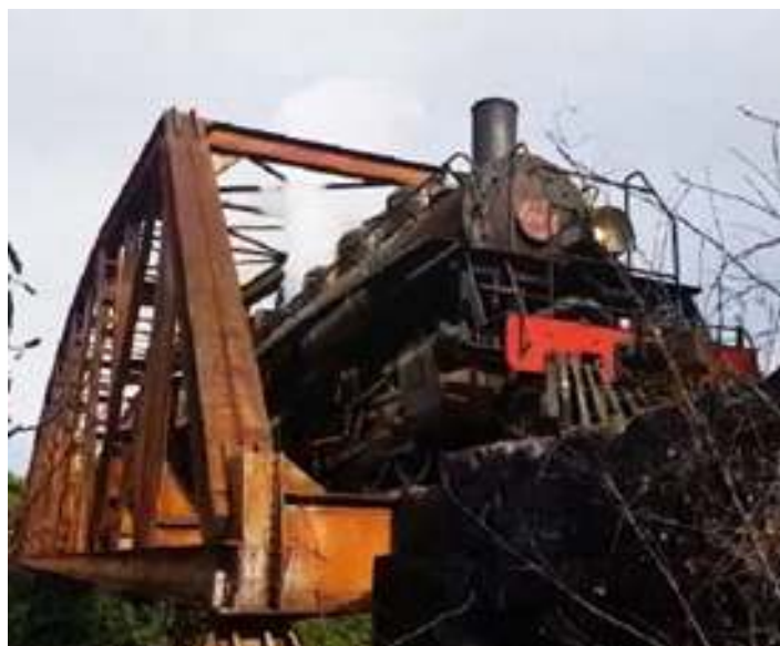
◆ Registros de nosso trem passando pelas paisagens da região das Missões Jesuítas.