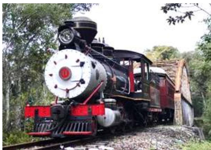
♦ Locomotiva Mogul nº 11 após limpeza, pintura e polimento das peças em bronze.