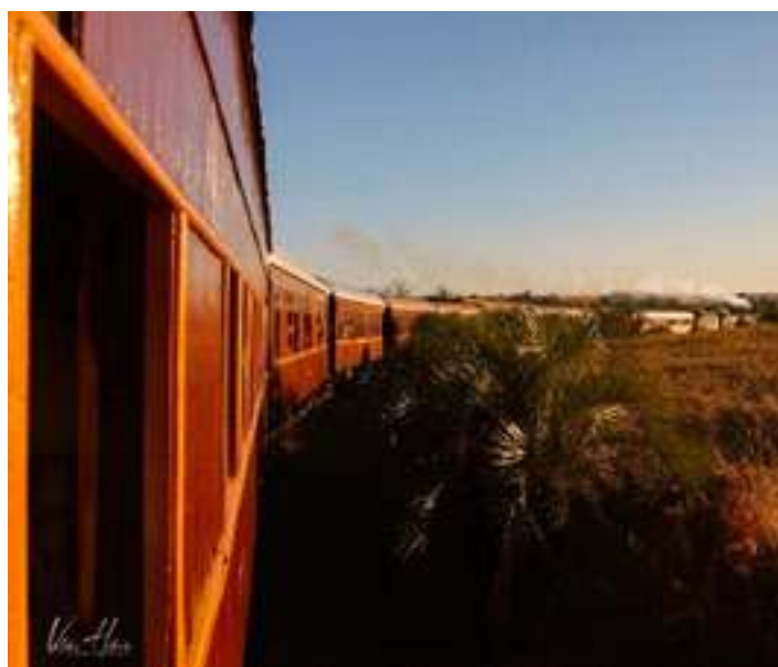
◆ Belíssima imagem do Trem das Missões, registrada pelo fotógrafo Valdir Hobus @valdir_hobus_photoart