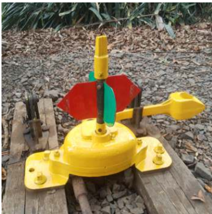
♦ Novo. aparelho instalado em Carlo Gomes, após pintura