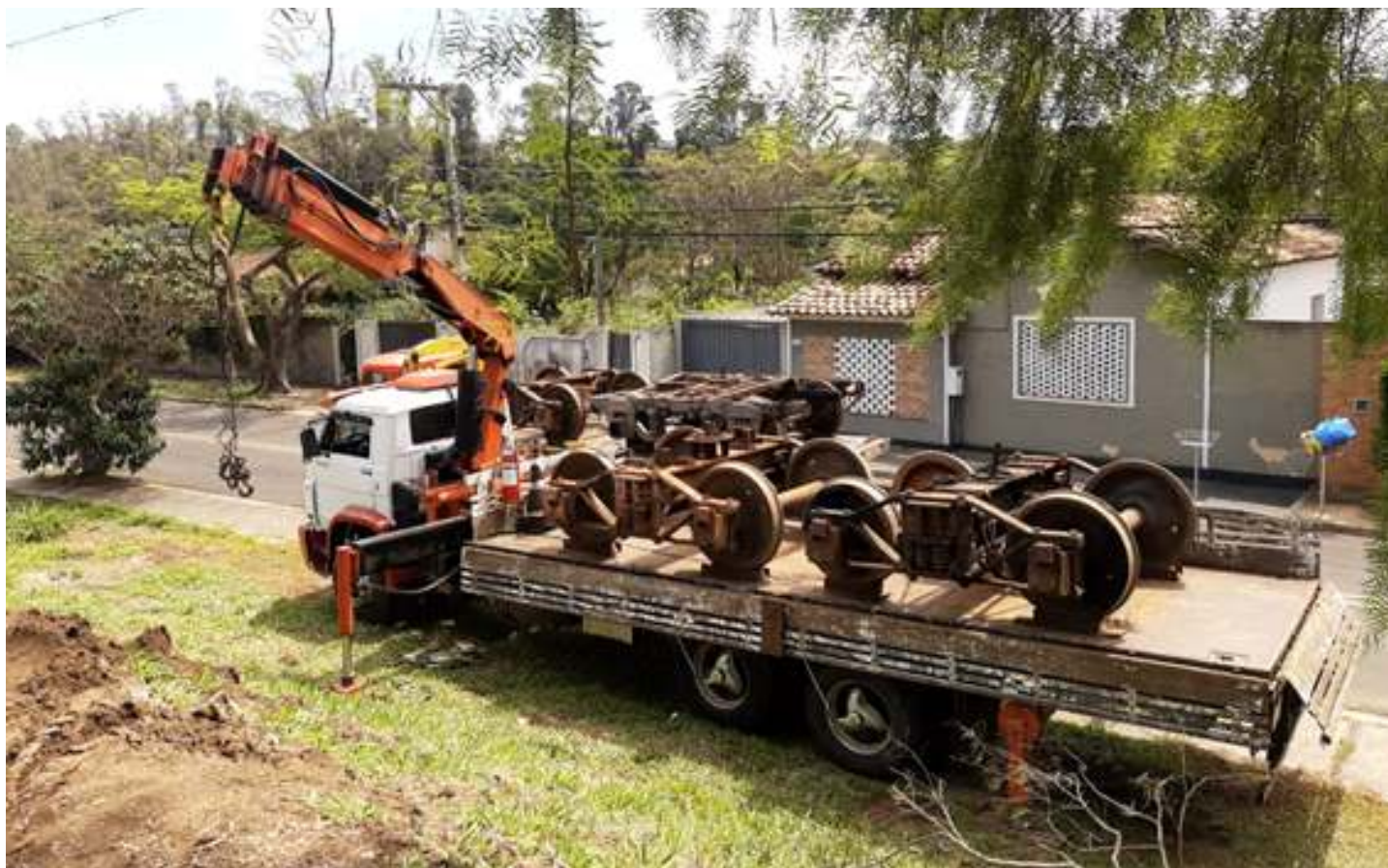
♦ Truques de bitola larga, vandalizados e parcialmente incendiados.