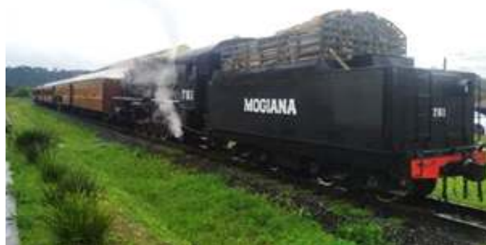
♦ Passagem do Trem da Serra do Mar pela estação de São Bento no passeio inaugural dos novos Carros de Passageiros.