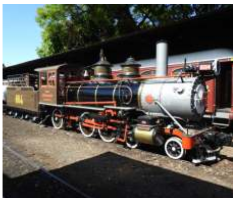
♦ Locomotiva 604 no pátio de Anhumas.