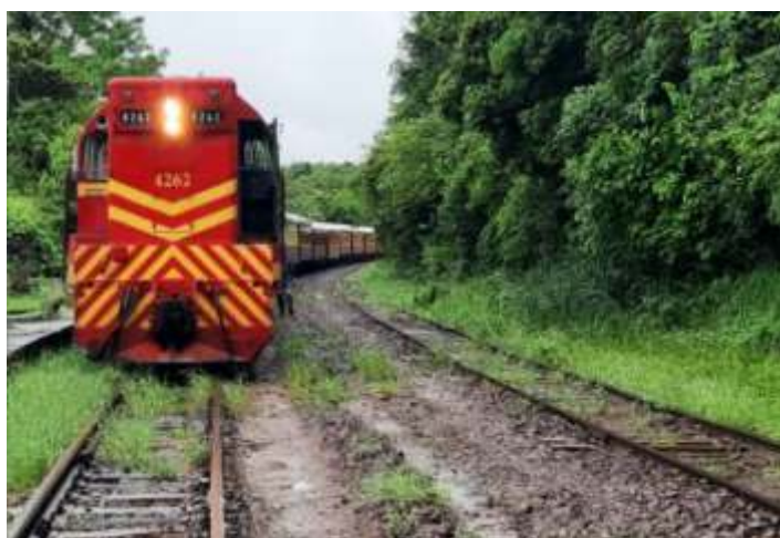
◆ Translado de nossa composição chegando na estação de Corvo, município de Colinas – RS.