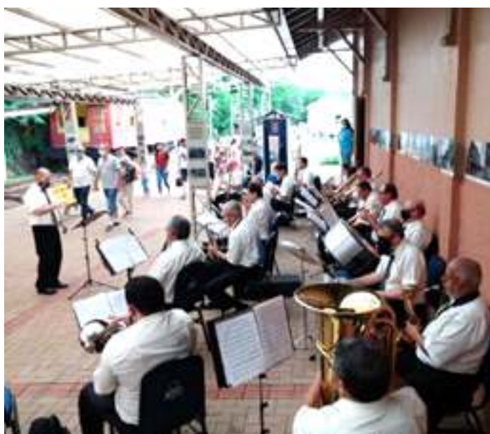
◆ Apresentação da Banda Municipal Carlos Gomes em conjunto exposição das fotos do jornalista Alicio de Assunção.