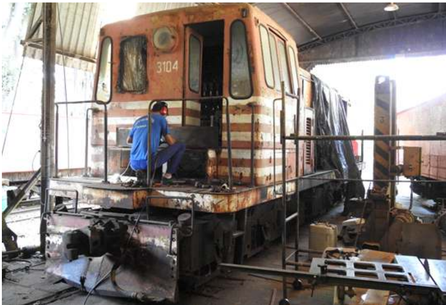
♦ Serviços sendo feitos na locomotiva 3104