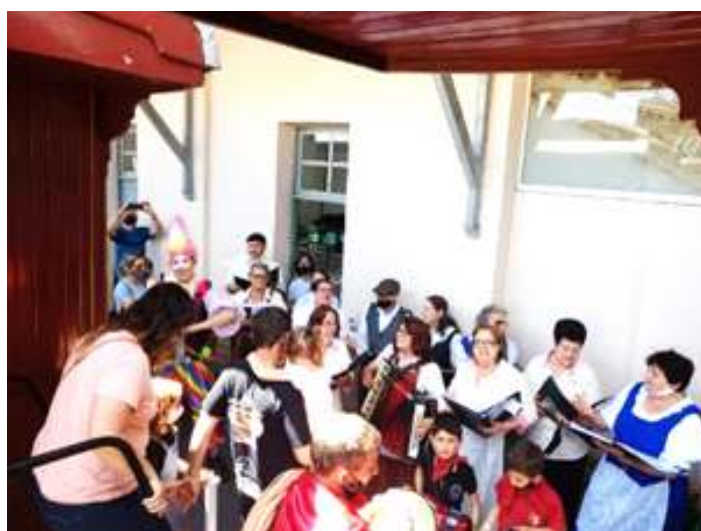
♦ Coral de Catuípe em apresentação na Estação Ferroviária de Catuípe.