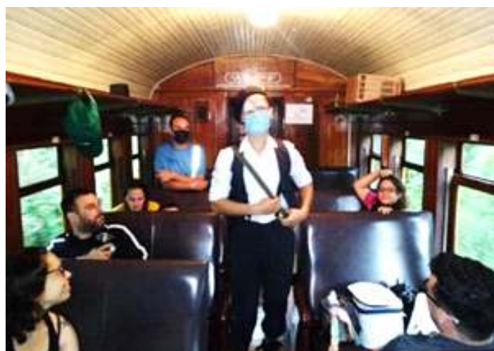
♦ Atração 03 – Apresentação Circense.