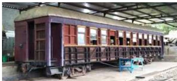
♦ Carro de Passageiros fabricado em Joinville já posicionado na vala de manutenção

Já no setor de carros, finalizamos no início do mês, a restauração dos três carros de passageiros que estavam sendo preparados para formar a nova composição do Trem da Serra do Mar. Também iniciamos a restauração de mais um carro, este construído na Metalúrgica Nacional, em Joinville – SC, durante a década de 1940. Foi encomendado pela RVPSC, durante a época que esta ferrovia estava modernizando toda sua frota de carros, vagões e locomotivas. Ainda no início do mês, este carro foi posicionado na vala de manutenção, e teve os trabalhos de remoção de material comprometidos iniciado. Em outra frente de trabalhos, foi dado início à restauração do vagão VF-127. Este vagão do tipo FNB, está sendo preparado a pedido da Prefeitura Municipal de Rio Negrinho, para ser colocado estaticamente no pátio de entrada da cidade, onde atuará como um ponto de informações turísticas. No local onde o vagão ficará, será preparada uma estrutura adequada com trilhos, lastro e uma cobertura para proteger o vagão.