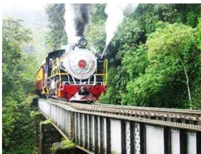
♦ Nossa composição, em foto recriada pelo railfan Fabiano Schloegel, no famoso Viaduto das Quatro Pontes. São aproximadamente dez anos de diferença entre as duas fotos.