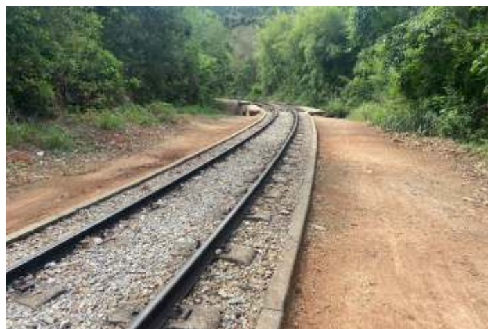
♦ Limpeza da pn localizada no km 82+300