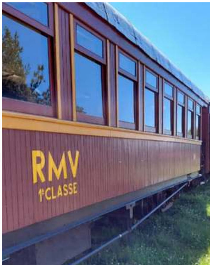
◆ Carro PD-44 com pintura finalizada, conforme o padrão original.