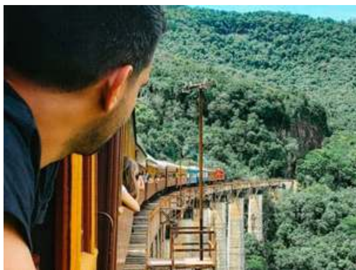
♦ Paisagens do Vale do Taquari vista a partir do viaduto V-13 e Mula Preta.