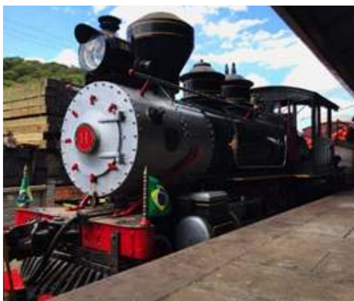
◆ Locomotiva Mogul nº 11 após limpeza e pintura.