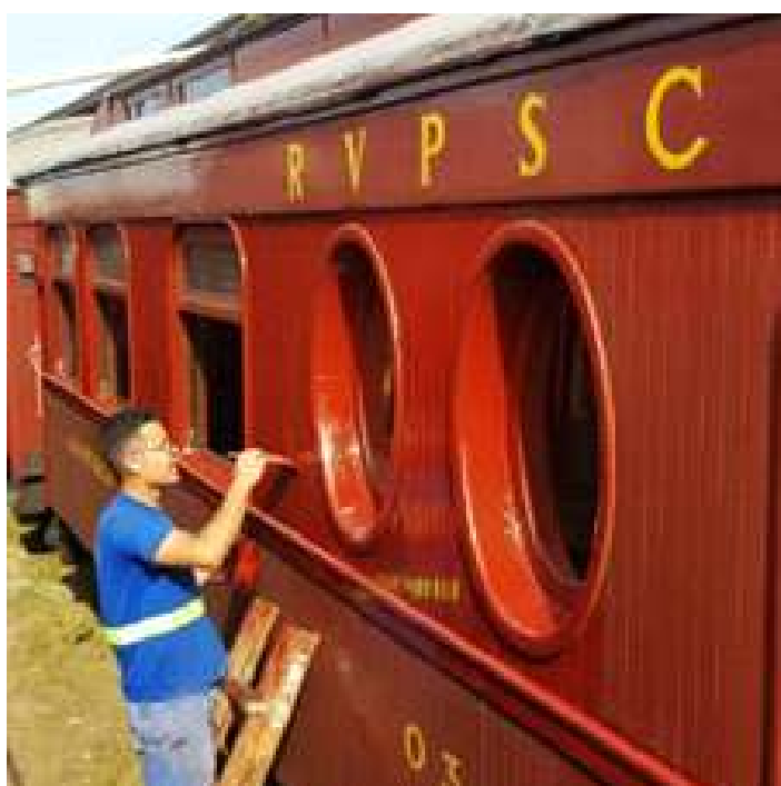
◆ Pintura do carro administrativo AM-18.