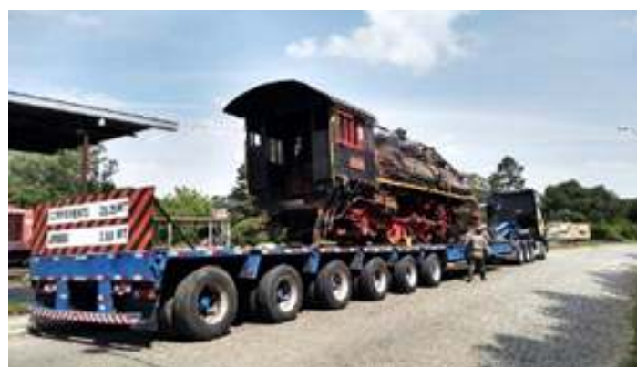
♦ Locomotiva Mikado nº 156 já posicionada no caminhão para o traslado.