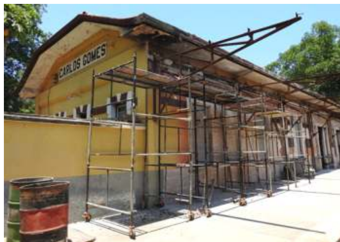
◆ Início dos trabalhos da recuperação da plataforma de Carlos Gomes – Foto Hélio Gazetta.