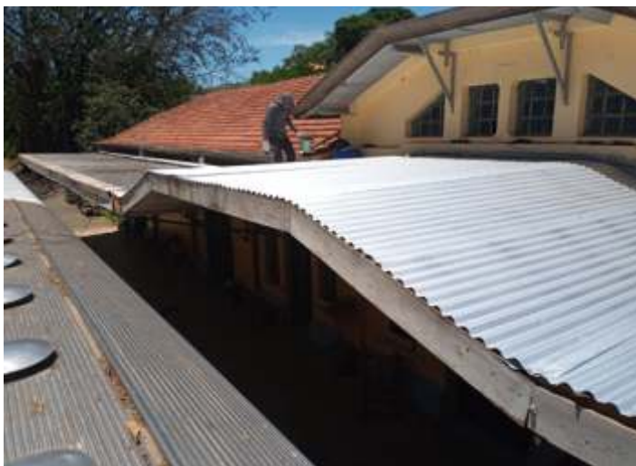
◆ Novas telhas metálicas para a plataforma da Estação Anhumas – Fotos de Hélio Gazetta.

E por fim teve início a restauração das paredes e teto da plataforma de Carlos Gomes, na área atingida pelo incêndio em 30 de setembro de 2020. Por hora será reconstruído todo o reboco das paredes do piso até o beiral, substituição das calhas e recomposição da cobertura. Em outra etapa será feito as portas e janelas danificadas, bem como elétrica e pintura. O trabalho é similar ao que já foi feito em Tanquinho e Anhumas.