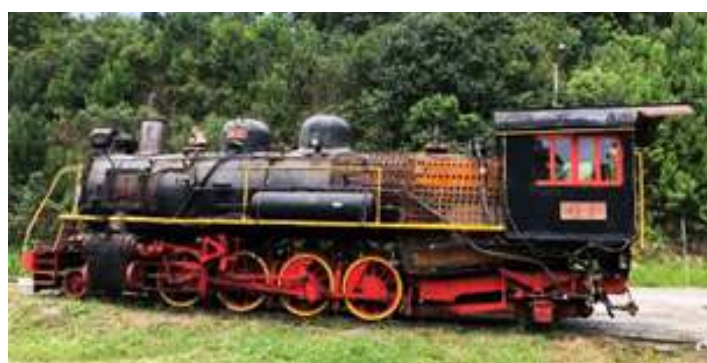
♦ Locomotiva Mikado nº 156 já finalizada na rampa de embarque para o caminhão.

As obras na locomotiva Mikado nº 156 finalmente foram concluídas e a locomotiva foi transladada para Bento Gonçalves (RS) ainda no final de Novembro. Ao longo do mês, os trabalhos concentraram-se na remontagem das serpentinas do super aquecedor de vapor, e dos componentes na cabine. Também foi confeccionado um novo limpa-trilhos para a locomotiva. A recuperação desta locomotiva, é um serviço terceiro, pois, esta máquina pertence ao Trem do Vinho, de Bento Gonçalves (RS). É um processo lento, que estendeu-se ao décimo quarto mês de trabalhos, e que finalmente chegou ao final. Dentre os trabalhos realizados nesta locomotiva estão: A recuperação da caldeira, reconstrução da fornalha e de novas serpentinas do super aquecedor de vapor, torneamento dos perfis do friso dos rodeiros, confecção de novo limpa trilhos e chaminé.