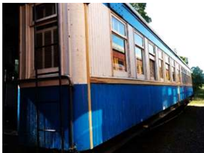
◆ Troca de madeiramento comprometido do carro administrativo AD-09.