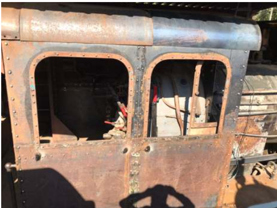
◆ Detalhe da colocação dos rebites.