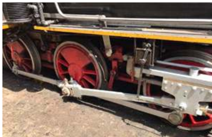
♦ Antes e depois da limpeza das braçagens da Mogul nº 11