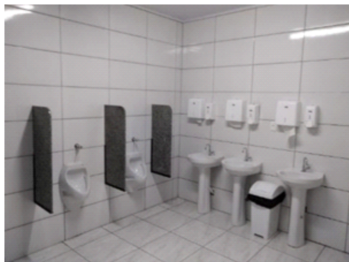
◆ Sanitários já finalizados na Estação de Guaporé.