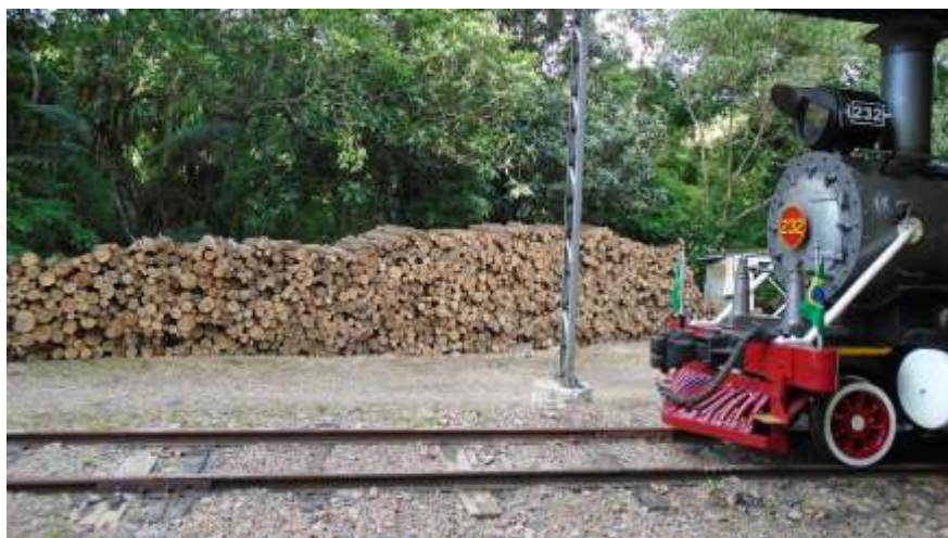
♦ Vitais suprimentos de lenha, garantindo parte dos passeios de 2022. Autoria: Luiz Carlos Henkels