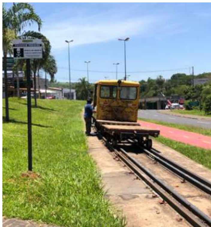
♦ Placa instalada na entrada do viaduto em Jaguariúna

Outro importante trabalho é a troca das telhas da plataforma da estação de Anhumas, onde as telhas de fibro cimento que não são originais, estão sendo retiradas e substituídas por telhas metálicas onduladas, assim como eram antes, conhecidas como telhas de zinco. Cerca de 60 por cento da pior parte já foi substituída, trabalho este com o nosso pessoal da marcenaria e ajudantes de Anhumas. Também foi reparado parte do madeiramento do teto na direção da porta do saguão.