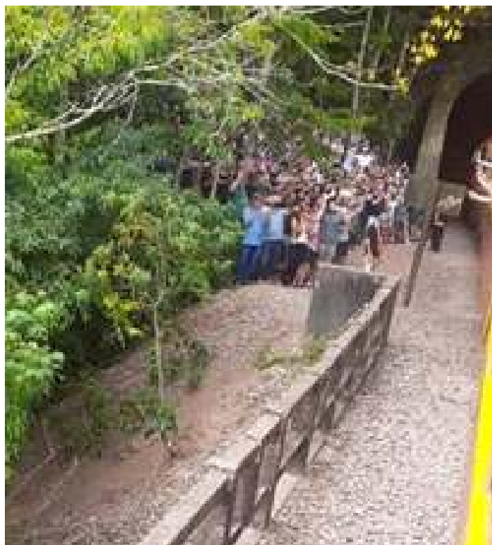
♦ Segurança na cabeceira do viaduto V-13.