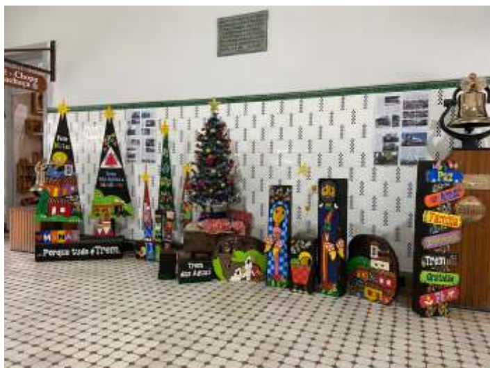
♦ O saguão da estação de São Lourenço decorado para a época de festas de fim de ano