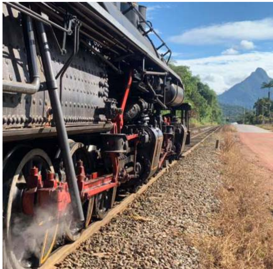
♦ Trem da ABPF - Regional Sul percorrendo parte da malha sul da Rumo Logística.

O mês de novembro foi, felizmente, mais um bom mês. Os trens continuaram em funcionamento, sem interrupções e, receberam bom movimento de visitantes e passageiros. Apenas o Trem dos Imigrantes não circulou, uma vez que a locomotiva nº5 ex. EFCB está com a manutenção sendo finalizada. Todas as Regionais tem trabalhado bastante e avançado em diversas frentes; todas as oficinas estão a todo vapor, realizando reformas e manutenção de material rodante.