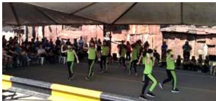
♦ Apresentação de música ao vivo das alunas da rede municipal de ensino.