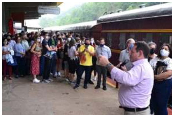
♦ Cerimônia de abertura do Trem dos Vales edição 2021, na estação de Muçum (RS).