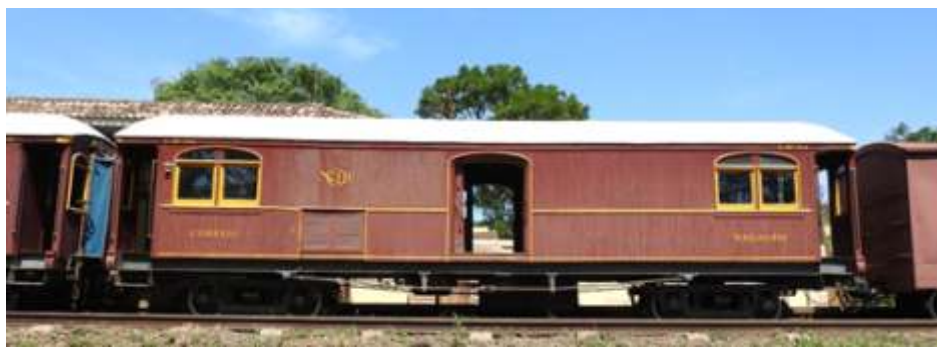
♦ Carro Bagagem Correio da NOB

A locomotiva 50 foi usada com muito sucesso e elegância, para a gravação de algumas cenas da próxima novela das seis horas da Rede Globo. As cenas foram gravadas em Tanquinho e Pedro Américo, usando também o vagão da paulista e o Bagageiro da NOB.