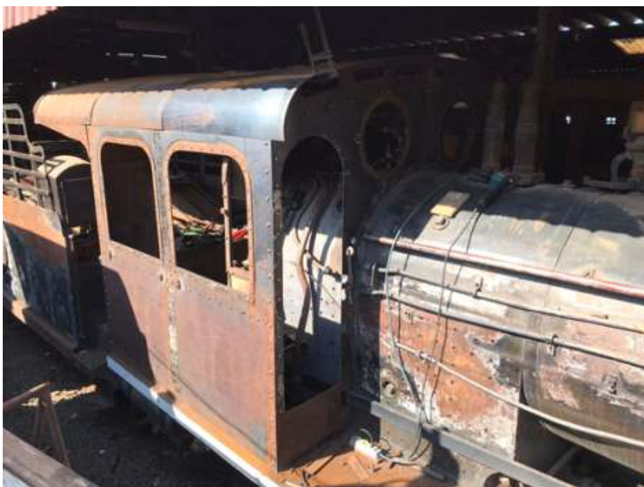
◆ Detalhe da cabina com chaparia nova e teto rebitado. Apesar do ferrugem superficial da umidade, as chapas são novas.

A locomotiva 338 foi para a oficina para fazer a troca de anéis do cilindro do lado direito (maquinista) pois foi o único lado que ficou sem fazer e agora vai ficar os três lados novos. Para início de dezembro ela volta ao tráfego!