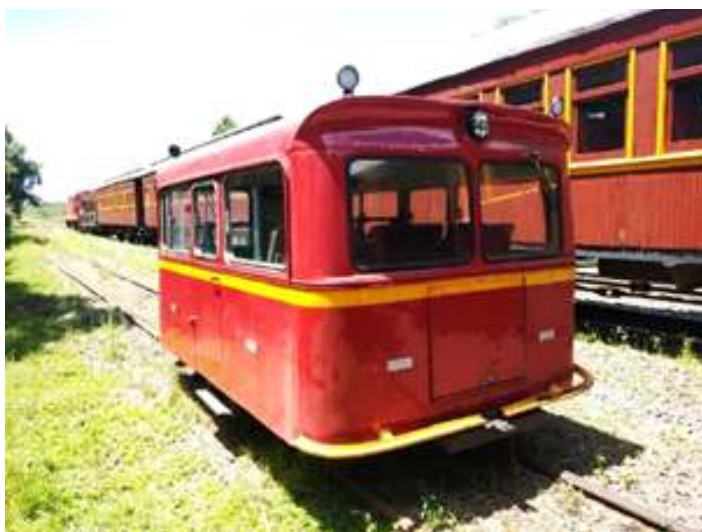
◆ Auto-de-linha Bolinha já posicionado na Estação Ferroviária de Guaporé.

Durante a estadia em Guaporé, aproveitamos para fazer algumas reformas rápidas no nosso carro administrativo AD-09, este carro foi construído em 1925, nas oficinas de Rio Grande (RS), para transportar diversas personalidades do Rio Grande do Sul e diretores de linha. Foi amplamente utilizado por Getúlio Vargas durante suas viagens de trem pelo Sul. Agora, o carro está recebendo uma atenção especial, onde estão sendo trocados o madeiramento comprometido. Também terá sua tinta lixada e receberá uma nova pintura em cor marrom, conforme o padrão original da Viação Férrea do Rio Grande do Sul (VFRGS), ferrovia na qual este carro era originário.