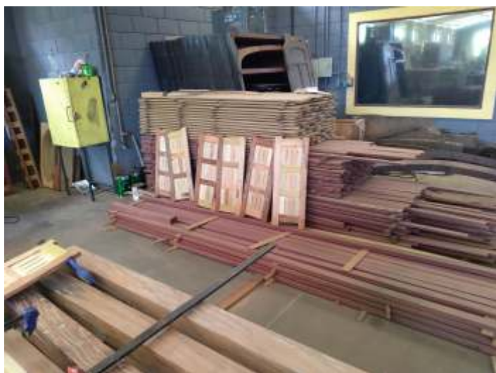
♦ Novas peças confeccionadas para o carro SD-22 armazenadas nas oficinas, aguardando montagem