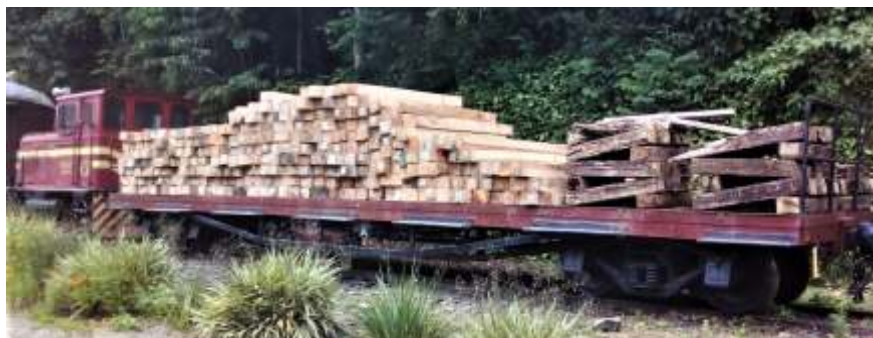
♦ Vagão plataforma VP138 carregado com os novos dormentes recebidos em novembro.