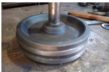
◆ Embolo da 338 já com os novos anéis de segmento.