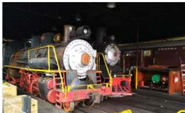
♦ Locomotiva Mikado nº 156 entregue ao cliente, em Bento Gonçalves (RS).