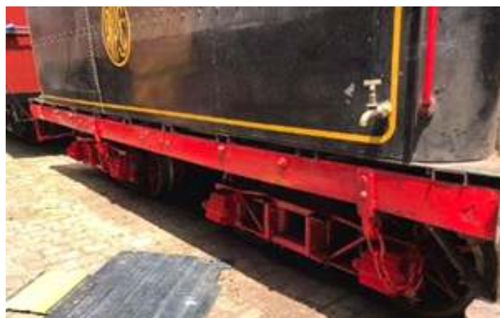
♦ Pintura dos truques do tender da locomotiva Mogul nº 11.