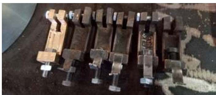
♦ Partes da bomba injetora reformadas e reproduzida uma nova