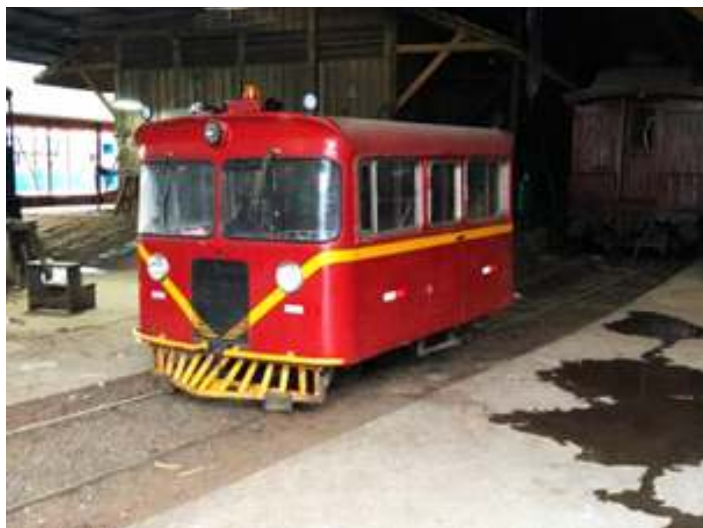
♦ Auto-de-linha “Bolinha” finalizado nas Oficinas de Rio Negrinho.

Já em uma terceira frente de trabalhos, finalizamos a revisão do nosso auto-de-linha “Bolinha”, foram instalados os faróis auxiliares em LED, GPS e faixas refletivas. O traslado para Guaporé foi feito ainda na primeira metade do mês, onde o mesmo está sendo utilizado como batedor durante a edição de 2021 do Trem dos Vales. Como já citado em outras edições, os trabalhos concentraram-se na revisão dos motores, freios, sistema elétrico e parte rodante – com torneamento dos rodeiros, conforme o padrão da Concessionária Rumo Logística. Também foram revisados a parte do motor e dos freios, bem como a instalação elétrica.