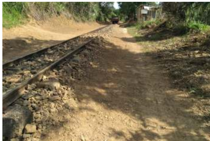
♦ Limpeza ao longo dos km 83 e 85