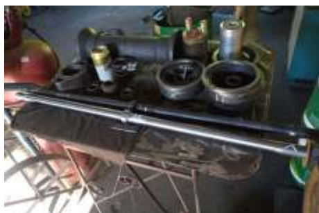
◆ Novo eixo do slide da locomotiva 338 sendo fabricados em Carlos Gomes