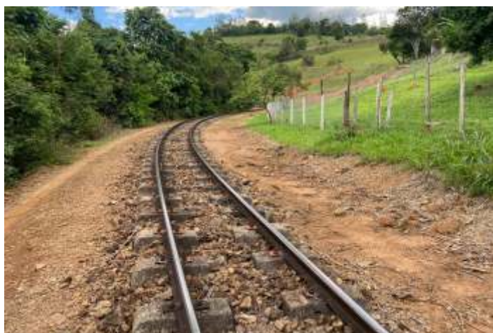
♦ km 89: remoção da terra jogada por moradores