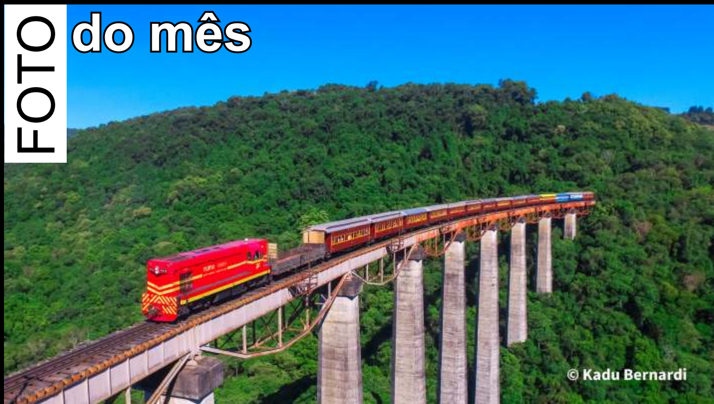
◆ O Trem dos Vales, sobre o viaduto Mula Preta em Dois Lajeados, Rio Grande do Sul.

Todo mês selecionaremos uma foto relacionada ao trabalho da associação publicada no grupo ABPF - Oficial no Facebook para publicar aqui.