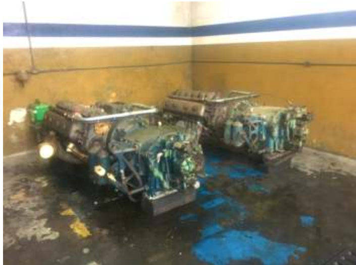
♦ Os motores Detroit lado a lado –.