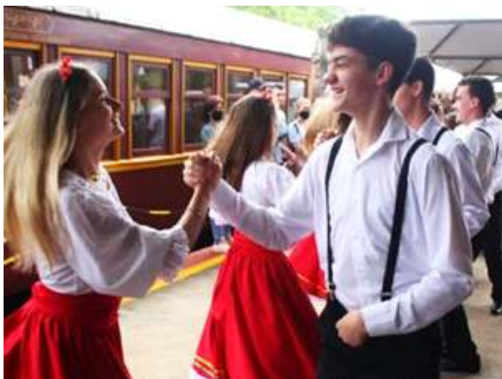
◆ Animações musicais na Estação de Muçum – RS.

As obras dos novos sanitários na estação de Guaporé foram finalizadas ainda no início do mês, onde parte do prédio pôde ser recuperada. Foram criados também, uma bilheteria, sala de reunião e um espaço para café. A estação de Guaporé está sobre os cuidados da prefeitura municipal, que atualmente tem o convênio do prédio. Todo este projeto vem em uma grande parceria com o