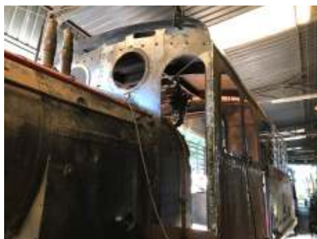
♦ Chapas dianteiras já rebitadas

Passaram por reparos pequenos e manutenção as locomotivas GE 3 e a ALCO 905, troca de filtros, revisão de baterias e bicos e bombas injetoras.