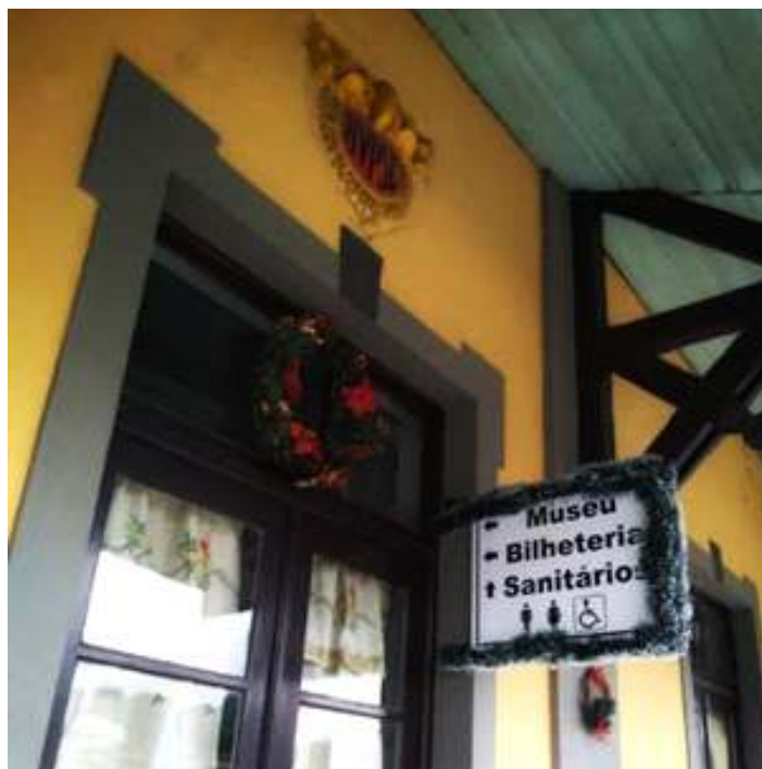
♦ Estação de Rio Negrinho decorada com motivos natalinos.