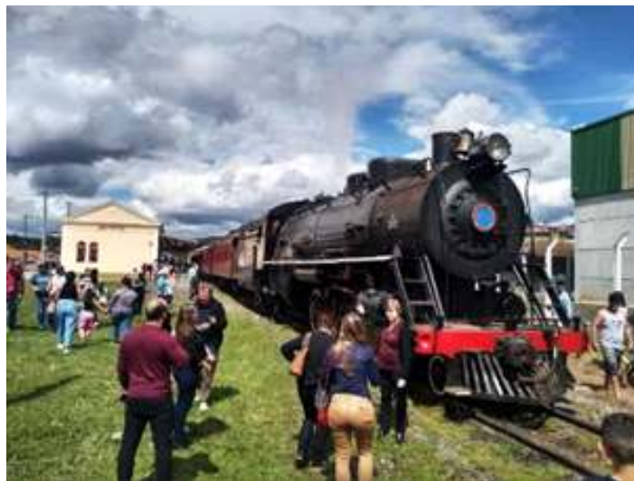
♦ Trem da Serra do Mar durante a parada rápida na estação de São Bento.