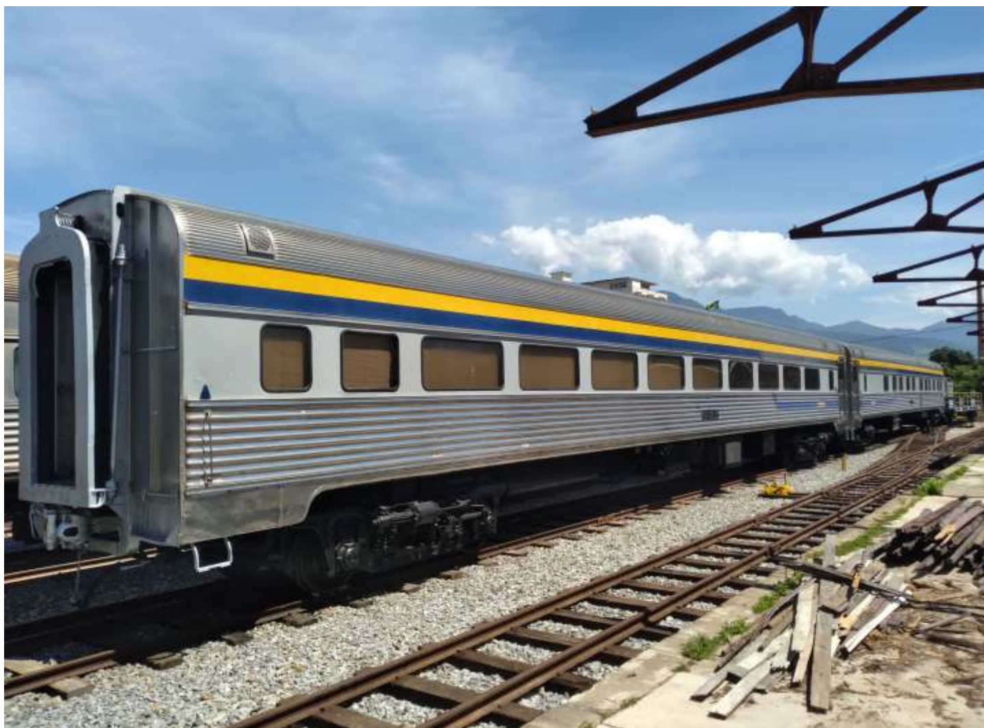
◆ Os carros administrativos da MRS armazenados em nosso pátio em Cruzeiro aguardando a próxima viagem

Os carros administrativos da MRS voltaram ao nosso pátio. Deram entrada nas oficinas para manutenção, com troca das borrachas das sanfonas, revisão do sistema elétrico e limpeza. Estão agora armazenados em nosso pátio aguardando a próxima viagem.