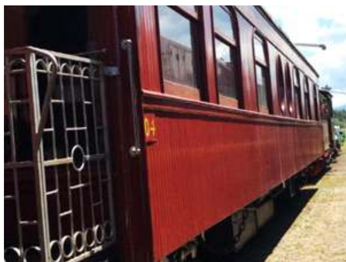
◆ Aspecto exterior do carro AM-18 após a pintura.