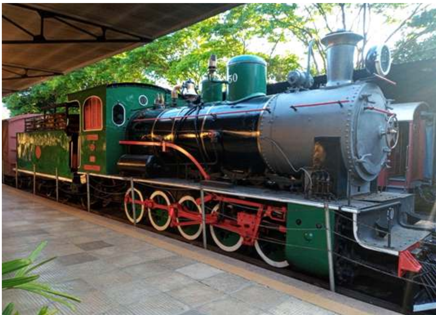
♦ Locomotiva 50 na plataforma de Anhumas