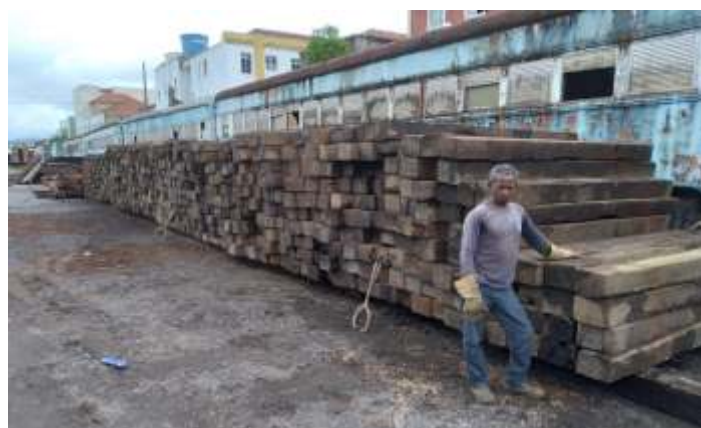
◆ Os 1.000 dormentes doados já em nosso pátio