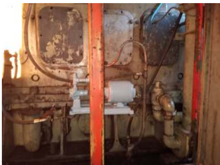
♦ Bomba de diesel restaurada e instalada