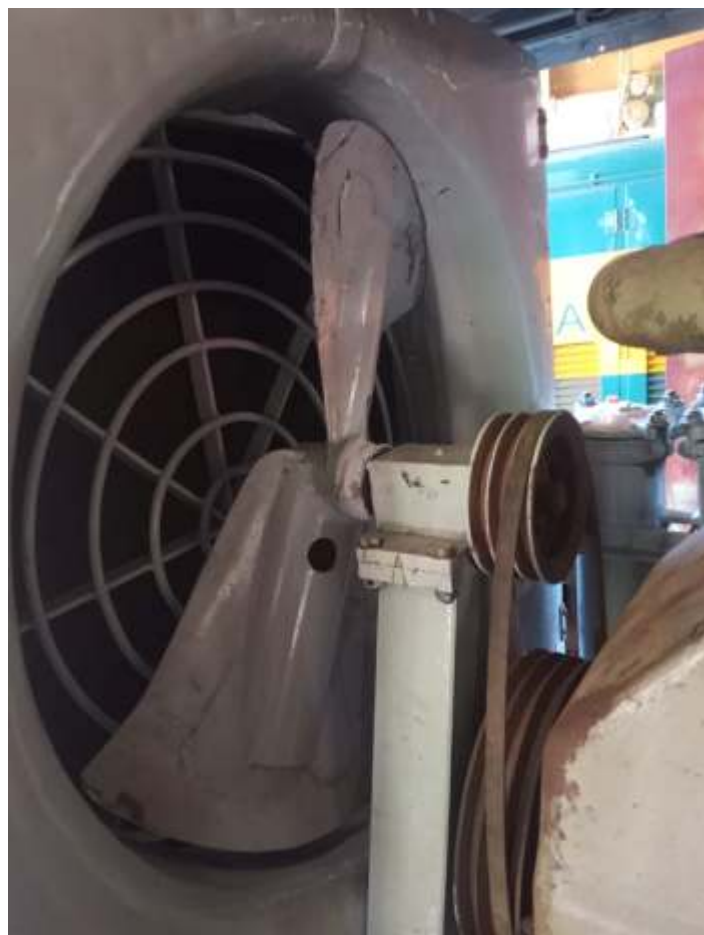
♦ Conjunto já instalado