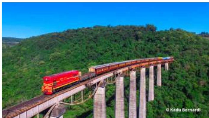
♦ Passagem da composição pelos viadutos V-13 e Mula Preta.