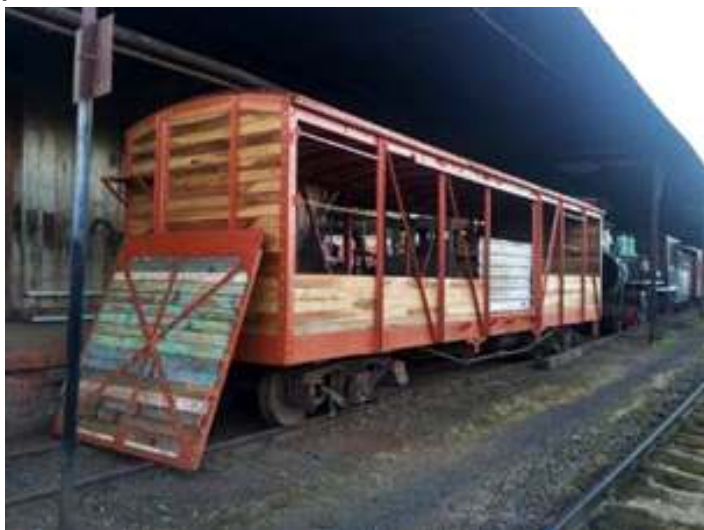
♦ Vagão VF-127 após pintura e parte do madeiramento já reconstruído

No setor de carros e vagões, foi dada continuidade à restauração do vagão VF-123, onde foram realizadas a correção de pontos de ferrugem e pintura das partes metálicas, sendo seguidas pela reconstrução do assoalho e das paredes em madeira. Este vagão do tipo FNB, está sendo preparado a pedido da Prefeitura Municipal de Rio Negrinho, para ser colocado estaticamente no pórtico de entrada da cidade, onde atuará como um ponto de informações turísticas. No local onde o vagão ficará, será preparada uma estrutura adequada com trilhos, lastro e uma cobertura para proteger o vagão.