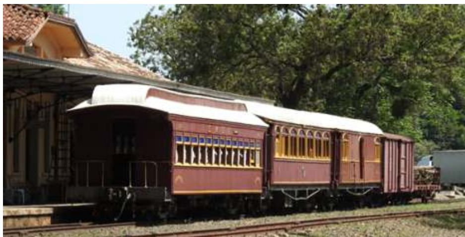
♦ Composição usada para filmagem – Foto de Vanderlei Zago em Tanquinho