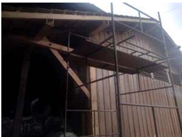
♦ Armazém de cargas de Rio Negrinho com madeiramento já trocado.