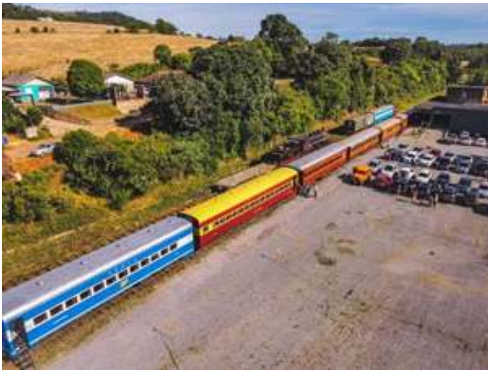
♦ Chegada do Trem dos Vales à Estação de Muçum.