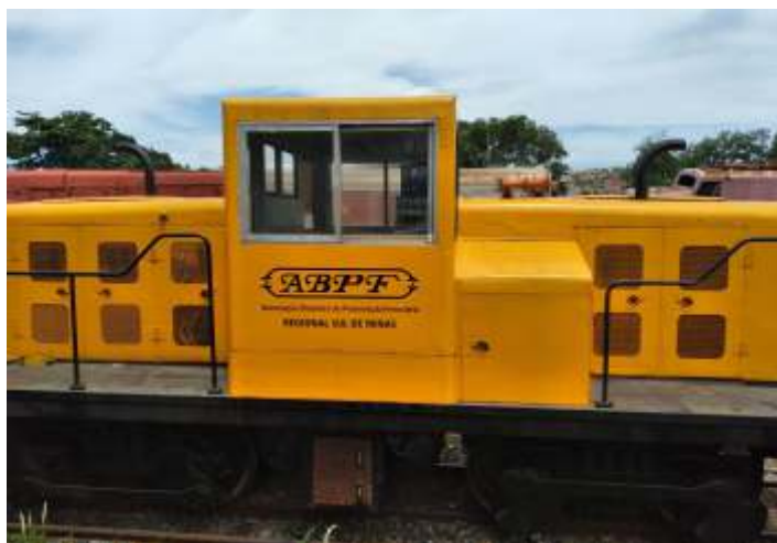
◆ Pintura da GE45T concluída com logo da ABPF

Paralelamente, parte de nossa equipe da oficina concluiu a reforma da caldeira da locomotiva nº5 ex. EFCB na Mooca, em São Paulo. O tubo condutor de vapor foi substituído por um novo confeccionado nas nossas oficinas bem como o escapamento, que também precisou ser substituído por um novo; parte do espelho frontal foi substituída e novos tubos foram instalados.