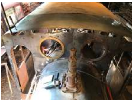
◆ Parte da frente e teto ainda sendo colocado. Foto de Paulo Deodato.p