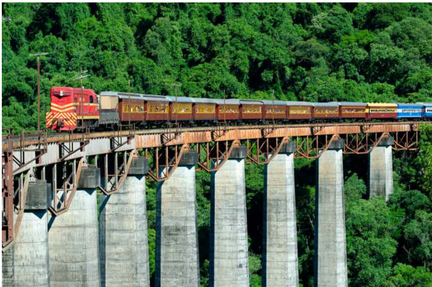
♦ Na foto, a composição do Trem dos Vales parada para fotos no Viaduto Mula Preta, em Dois Lajeados, Rio Grande do Sul.