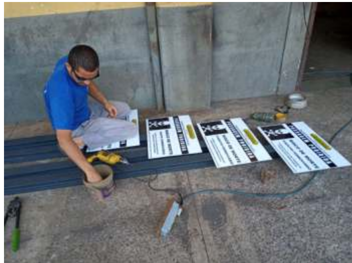
♦ Confeção de placas para serem colocadas nas pontes

Os serviços na via prosseguem com pequenas intervenções e manutenção de rotina, bem como as inspeções ao logo de todo o trecho. Houve troca de dormentes próximo ao km 17, roçagem de mato e bambus e realizada a capina química de todo o trecho, trabalho este feito pela equipe de via e oficina, com a locomotiva GE 3. As placas de aviso para pedestres, também foram instaladas na ponte do Atibaia e pontilhão de Jaguariúna.