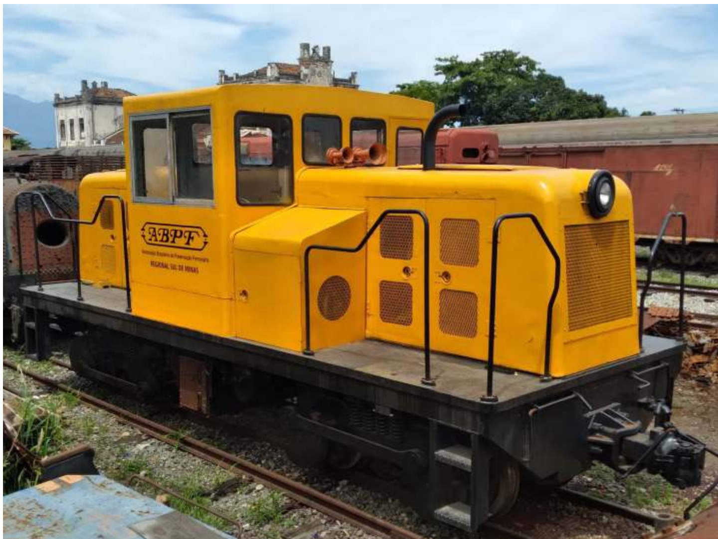
◆ A GE45Ton com a pintura concluída, com aplicação do logo da ABPF - Regional Sul de Minas nas laterais da cabine

Concluimos a pintura da GE 45ton de bitola métrica. A mesma já havia passado por revisão completa e funilaria e agora concluimos a pintura, com aplicação do logo da ABPF.