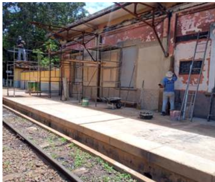
◆ Parte do reboco pronto e recuperação das tesouras – Foto Hélio Gazetta.

E por fim teve início a restauração das paredes e teto da plataforma de Carlos Gomes, na área atingida pelo incêndio em 30 de setembro de 2020. Por hora será reconstruído todo o reboco das paredes do piso até o beiral, substituição das calhas e recomposição da cobertura. Em outra etapa será feito as portas e janelas danificadas, bem como elétrica e pintura. O trabalho é similar ao que já foi feito em Tanquinho e Anhumas.