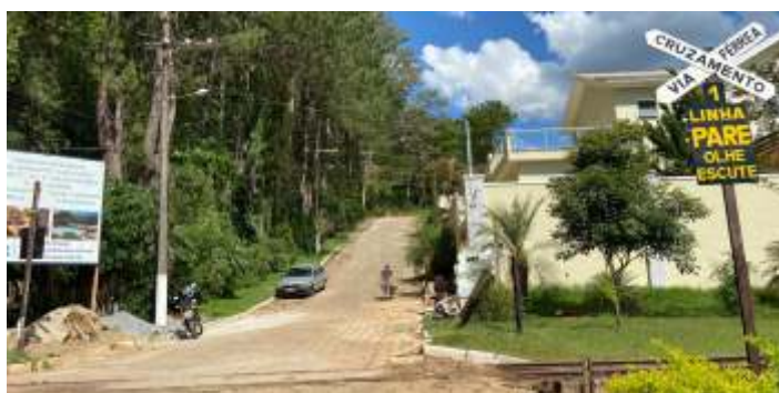
♦ Placas de sinalização recuperadas em nossas oficinas já reinstaladas nas pn's