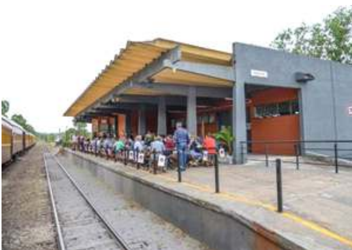
♦ Happy Hour de inauguração do Trem dos Vales.