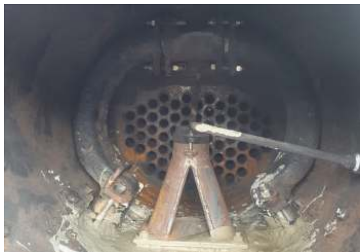
◆ Trabalhos concluídos na caldeira da nº5 ex. EFCB