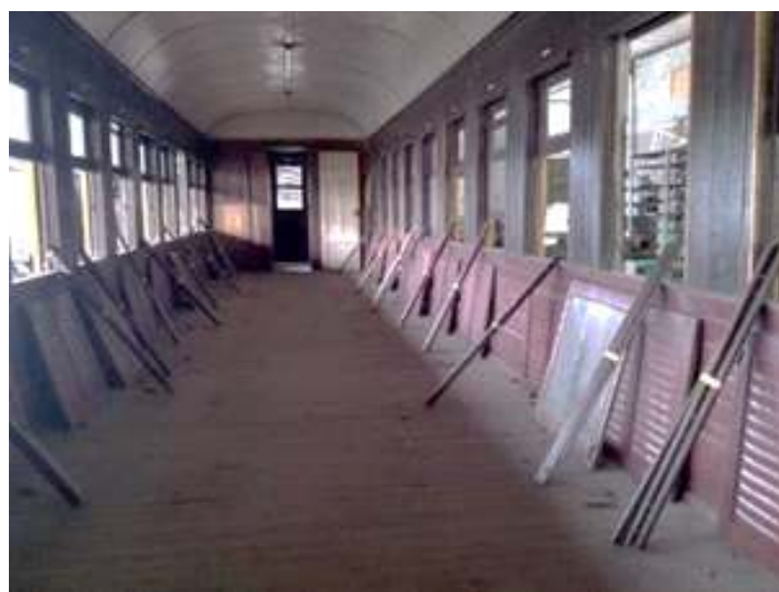
♦ Interior do carro de passageiros fabricado Indústria Metalúrgica de Joinville