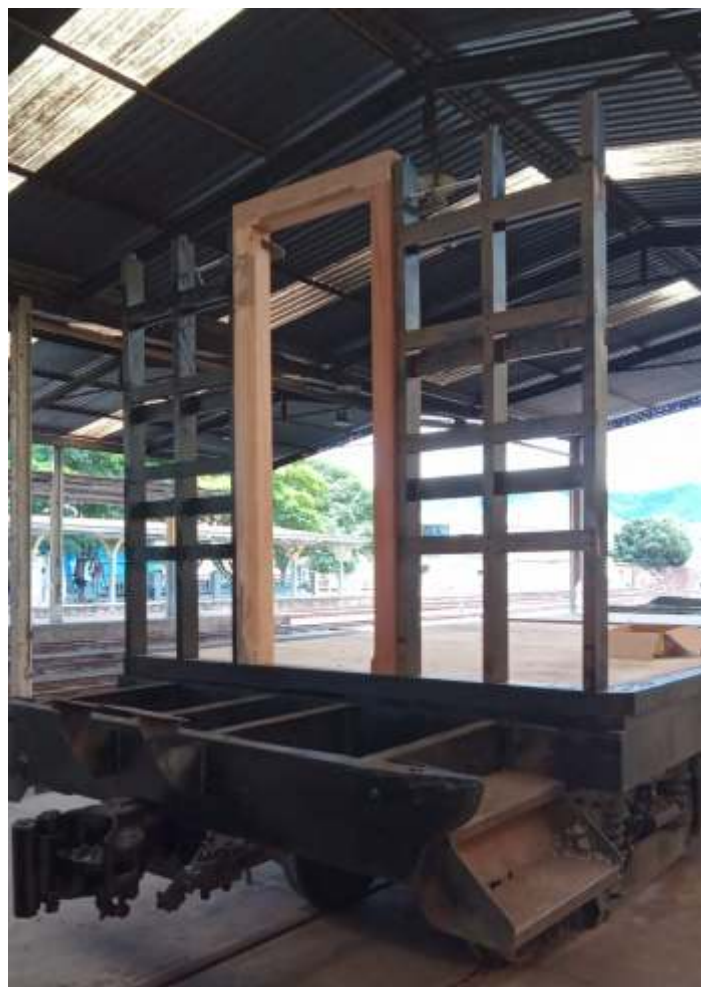
♦ Início da montagem da estrutura de madeira do SD-22

Seguem os trabalhos de manutenção e conservação da via e do material rodante. A via está sendo limpa, com capina e retirada de lixo. As saídas de água de vários boeiros e de drenagem da faixa de domínio foram corrigidas. Vários trechos foram nivelados e receberam complementação de lastro. As placas de sinalização estão sendo desmontadas e recuperadas.