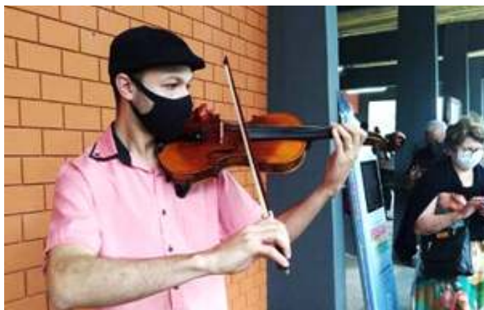
♦ Animação musical durante a inauguração do Tem dos Vales, estação ferroviária de Guaporé.