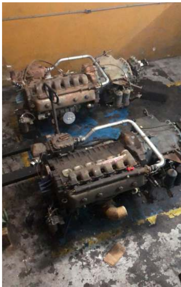
♦ Vista superior dos motores – Foto de Gerson Ramos.

Os serviços na via prosseguem com pequenas intervenções e manutenção de rotina, bem como as inspeções ao logo de todo o trecho. Houve troca de dormentes próximo ao km 17, roçagem de mato e bambus e realizada a capina química de todo o trecho, trabalho este feito pela equipe de via e oficina, com a locomotiva GE 3. As placas de aviso para pedestres, também foram instaladas na ponte do Atibaia e pontilhão de Jaguariúna.