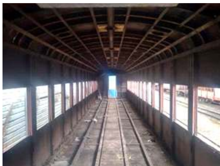
♦ Interior do carro de passageiros PC-39 já desmontado e limpo

Também foi início ao processo de restauração do carro de passageiros PC-39, este carro foi construído pela Viação Férrea do Rio Grande do Sul (VFRGS) nas oficinas de Rio Grande em 1942, para formar o Trem Farroupilha, que corria de Porto Alegre a Santa Maria. Ficou durante anos parado, e durante o mês teve seu processo de restauração iniciado com a remoção das paredes internas, forrações e assoalho. Também foram marcadas as áreas onde o metal está comprometido. Já as obras no carro em madeira construído nas Indústria Metalúrgica de Joinville, se concentraram na limpeza e revisão das estruturas das poltronas e troca do madeiramento dos caixilhos das janelas.