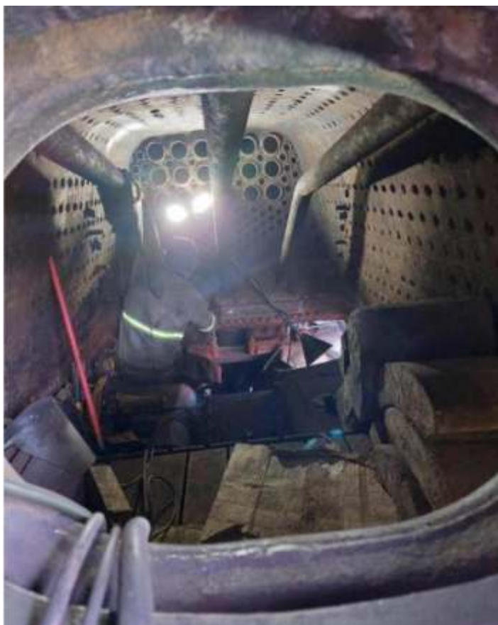
◆ Caldeira da locomotiva Mallet n°. 204 em manutenção.