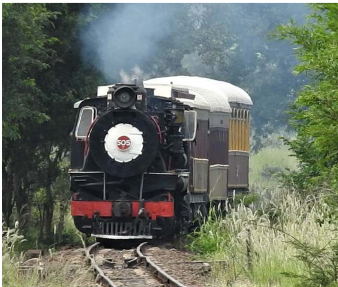
◆ Locomotiva 505 próximo a Jaguariúna.