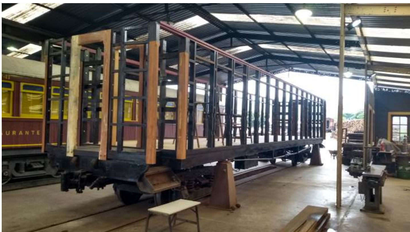
♦ Carro SD-22 em reconstrução na marcenaria de São Lourenço: toda a nova estrutura da caixa já está montada.