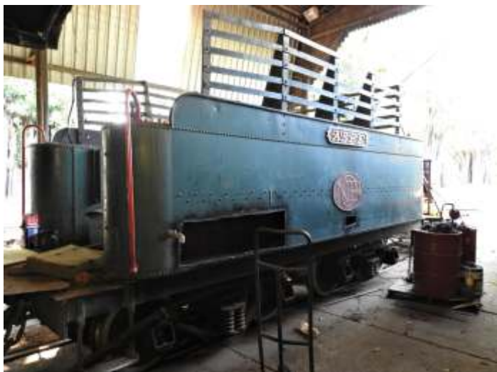
♦ Início dos serviços do tender da 401

Iniciamos a caldeiraria do tender da locomotiva 401. Toda parte inferior das laterais do tender e o fundo será substituído. O reparo da cabina já foi terminado.