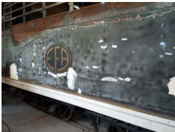
♦ Detalhe do tender sendo lixado e preparado para nova pintura.

Também prossegue nas oficinas a preparação para a pintura da locomotiva 9. O novo forro de madeira da cabina, já foi instalado e pintado e agora prosseguem os trabalhos no tender. Em breve a locomotiva estará com a nova pintura.