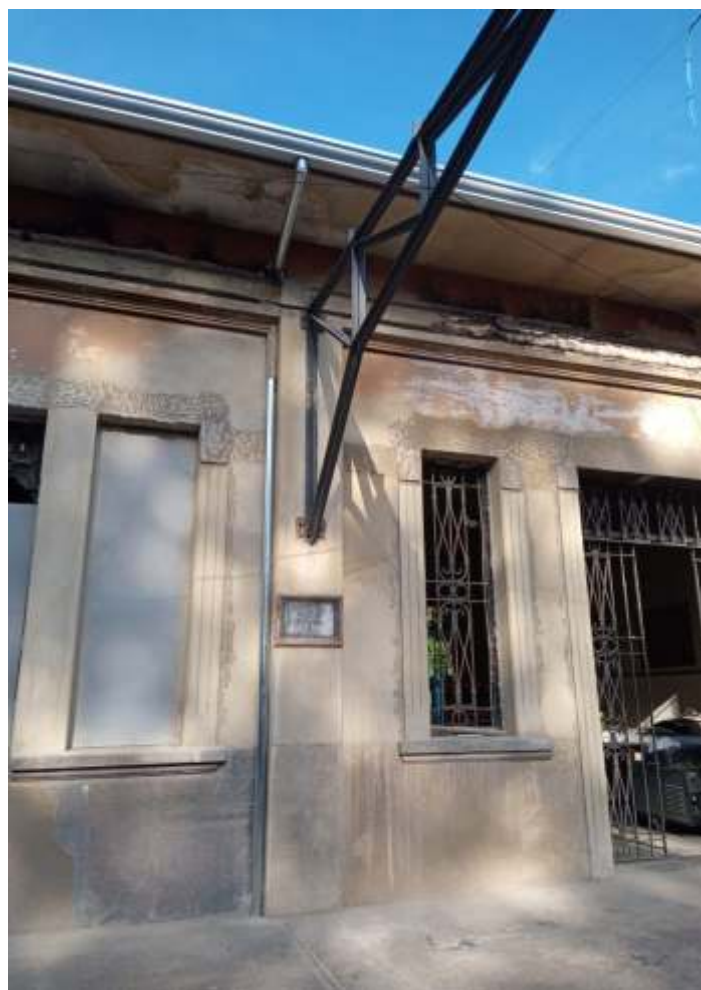
♦ Novas calhas e condutores instalados na estação de Carlos Gomes.

A ABPF Campinas agradece a todos os colaboradores, associados e simpatizantes!!