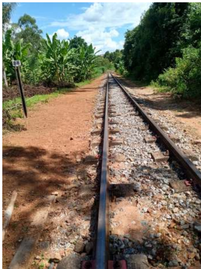
♦ Serviço de capina e limpeza da faixa de domínio.