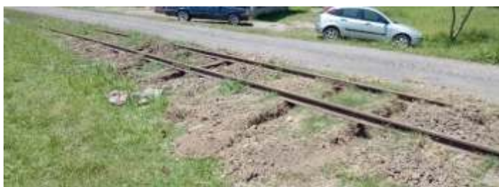
♦ Substituição de dormentes.