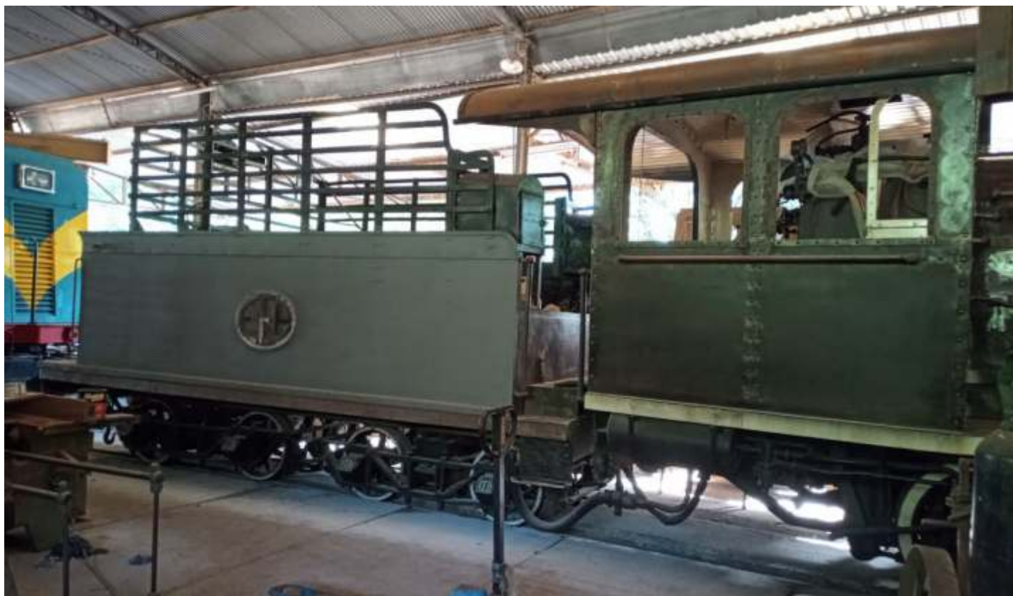
♦ O tender da locomotiva nº9 ex. Estrada de Ferro Araraquara já com o primer aplicado.