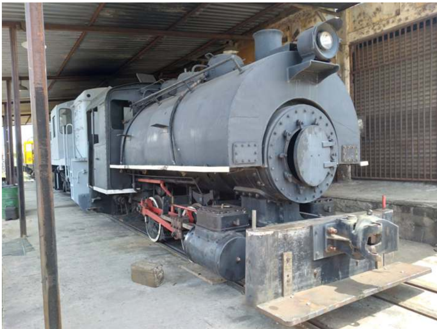
◆ A locomotiva nº2 já remontada nas oficinas de Cruzeiro após os trabalhos nas caixas das rodas e braçagens.

Avançaram bem os trabalhos nas três locomotivas nas oficinas de Cruzeiro: a pequena locomotiva a vapor nº2, a ALCO RSD8 3507 e a pequena diesel-hidráulica CBA 1. Graças ao aumento do efetivo da equipe da oficina, com a contratação de mais um mecânico de locomotivas a vapor, foi possível retomar os trabalhos na locomotiva nº2, que já foi remontada. As caixas das rodas foram preenchidas bem como foram feitos novos discos de cubação. Os rodeiros