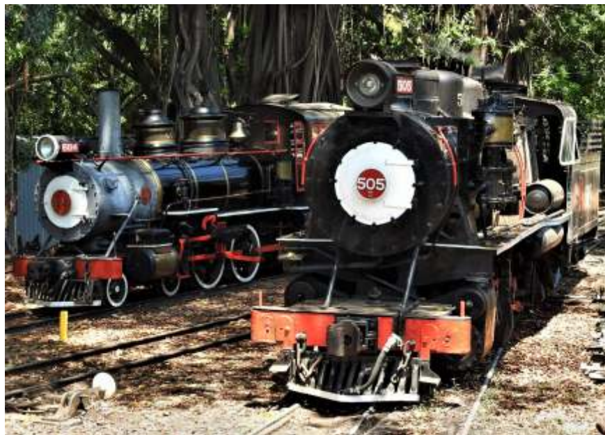
◆ Locomotivas a vapor 604, ex. CPEF e 505, ex. RMV no pátio da estação de Carlos Gomes.

O mês de fevereiro, como de costume, tem movimento bem menor de turistas nos trens por ser um período pós férias e de volta às aulas. Mesmo assim, todos os trens circularam e tiveram um movimento razoável, o que ajuda no avanço dos trabalhos, já que a arrecadação com a venda das passagens dos trens são a principal fonte de receita para as regionais realizarem suas atividades. As oficinas de todas as regionais trabalharam bastante e avançaram na manutenção e na recuperação de material rodante histórico.