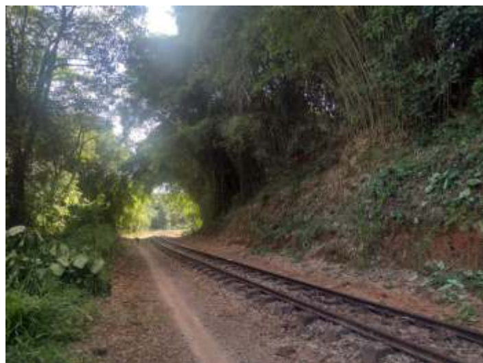
♦ Serviço de capina e limpeza da faixa de domínio.