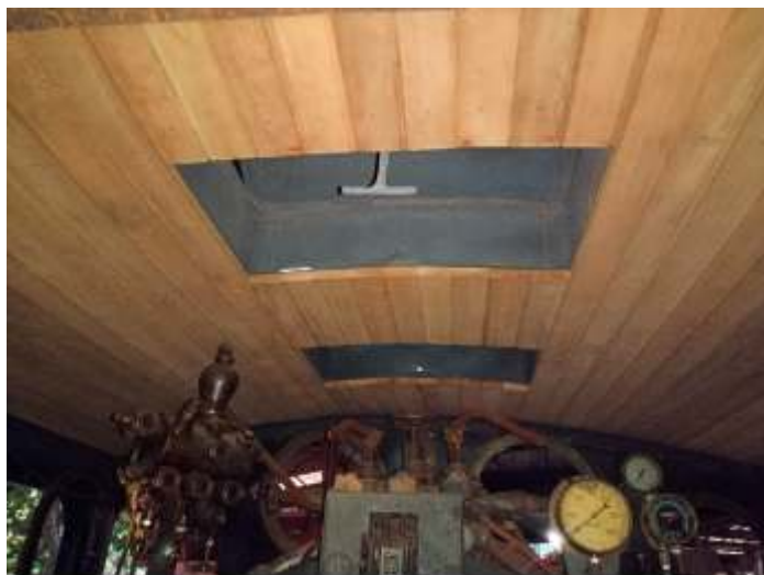
♦ Detalhe do novo forro da cabina da locomotiva 9.