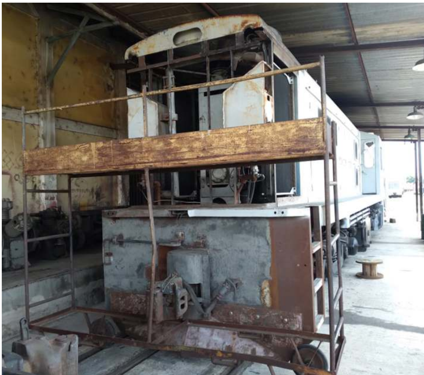
◆ A chaparia da traseira da 3507 foi removida pois estava podre em diversos pontos. Novas serão confeccionadas.

Seuqem os trabalhos na pequena locomotiva diesel-hidráulica CBA 1, fabricada pela Orenstein & Koppel na Alemanha em 1975, locomotiva essa que estava sendo utilizada para a realização de manobras em São Lourenço, no Trem das Águas, formando a composição e recolhendo os carros para o depósito de material rodante, além de manobras dos carros que entram e saem de reforma na marcenaria e da locomotiva 1424 quando apagada para manutenção.