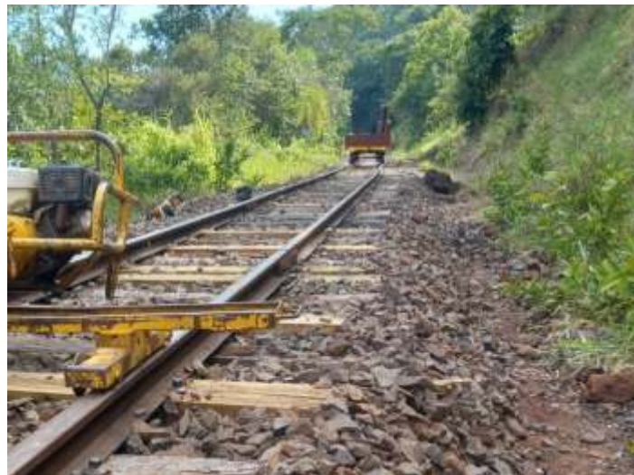
◆ Substituição de dormentes.

No decorrer do mês, as atividades concentraram-se na manutenção e melhoria da via permanente, com a troca de dormentes ao longo do traçado do passeio, e nivelamento da via férrea. Os dormentes utilizados vieram de doação da Concessionária Rumo Logística, que mandou alguns lotes de dormentes para que a troca pudesse ser realizada. Conforme a solicitação da concessionária, o trecho ferroviário onde ocorre o passeio foi mapeado através de prospecção e os pontos onde constatou-se problemas, estão sendo corrigidos com a troca dos dormentes. Trabalho este que já está se estendendo ao longo dos últimos meses.