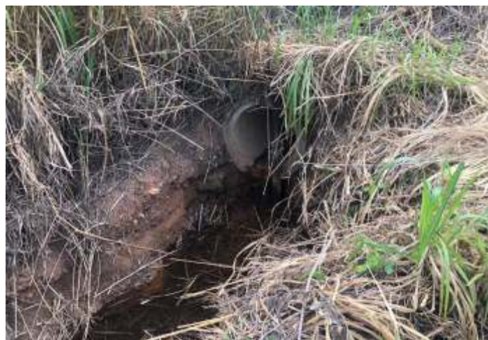
♦ Entrada e saída de uma passagem de agua no km 12.