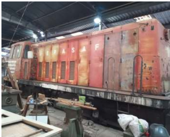
♦ A 3104 nas oficinas de Carlos Gomes

E após um ano de trabalho, nos finais de semana e pulando alguns meses, terminamos a montagem das partes do motor diesel da GE 3104, de 1947 da antiga Sorocabana. Por fim no último final de semana de fevereiro, foi dada a primeira partida no motor diesel. Foi um sucesso tremendo e o motor funcionou perfeitamente.