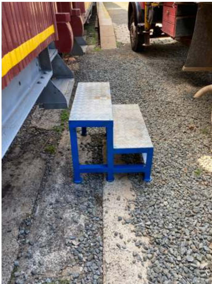
♦ Novas escadas na estação de Anhumas – Foto de Eric Gazetta.

Outro detalhe importante, foi a distribuição das novas escadas para embarque e desembarque nos carros que ficam fora da plataforma na estação de Anhumas. Todas elas são metálicas e com piso antiderrapante. As mesmas foram adquiridas em leilão de materiais e adaptadas ao nosso uso.