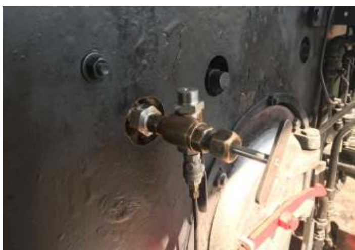
◆ Instalação de injetores Comodoro na Mogul nº 11.