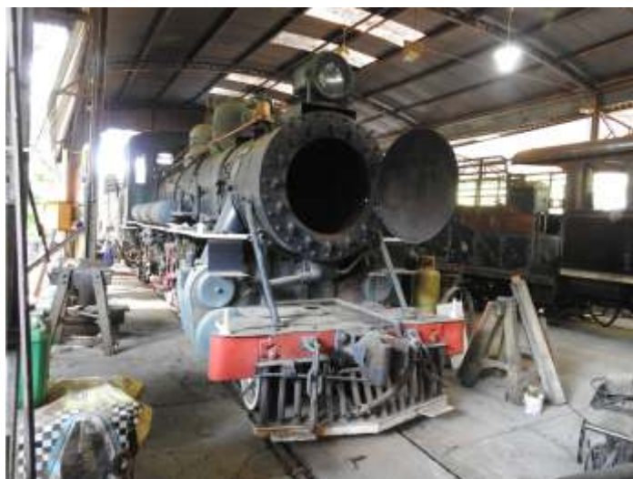
♦ Locomotiva 401 nas oficinas.

Também prossegue nas oficinas a preparação para a pintura da locomotiva 9. O novo forro de madeira da cabina, já foi instalado e pintado e agora prosseguem os trabalhos no tender. Em breve a locomotiva estará com a nova pintura.