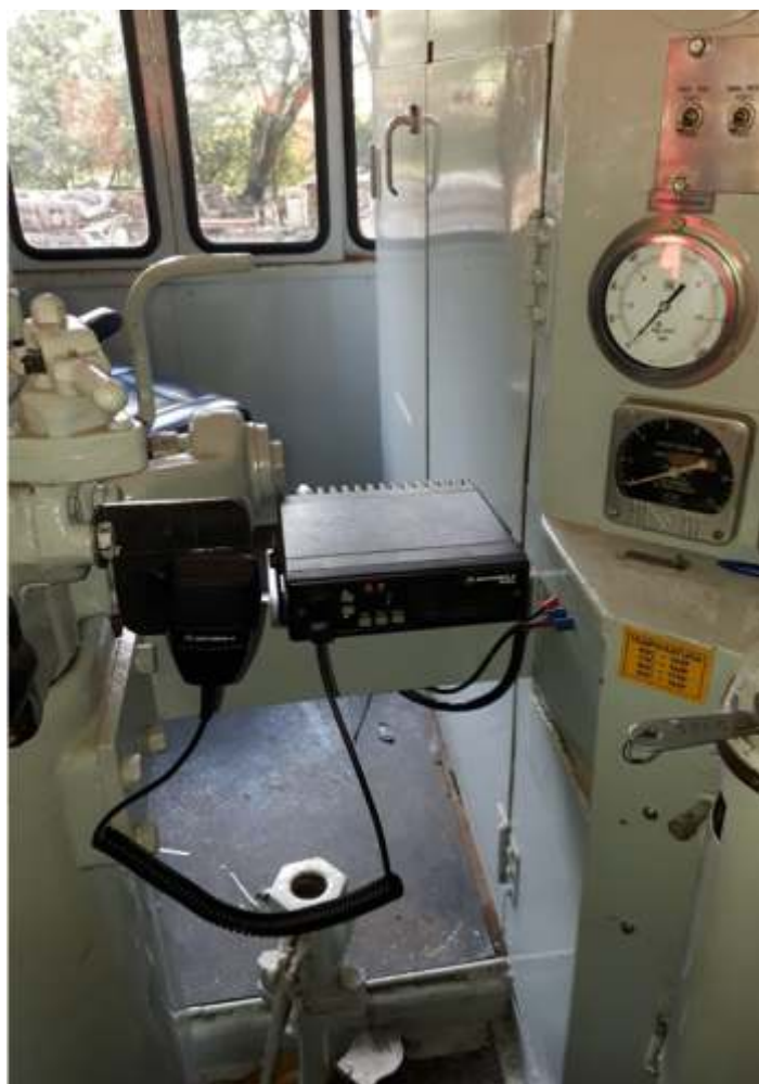
♦ Radio instalado na Locomotiva GE número 3.