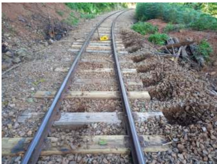
♦ Substituição de dormentes.

Em outra frente de trabalhos, iniciamos a construção de uma vala de manutenção de locomotivas e vagões. Localizada em uma linha desviada no pátio da Estação Ferroviária de Piratuba, a vala faz parte da futura oficina de manutenção que será construída nas imediações da estação ferroviária.