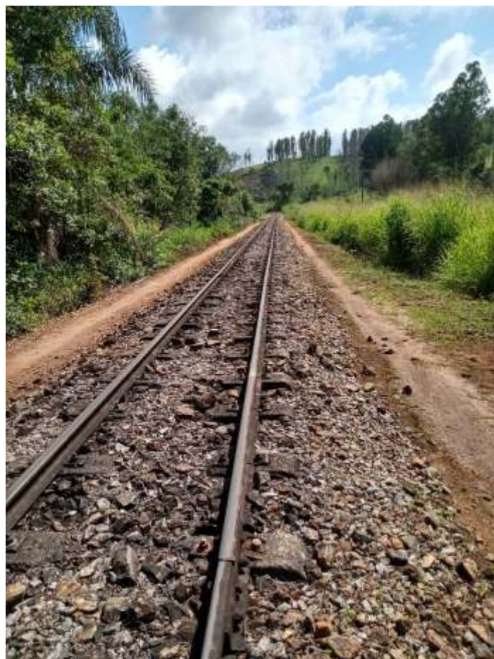
♦ Serviço de capina e limpeza da faixa de domínio.