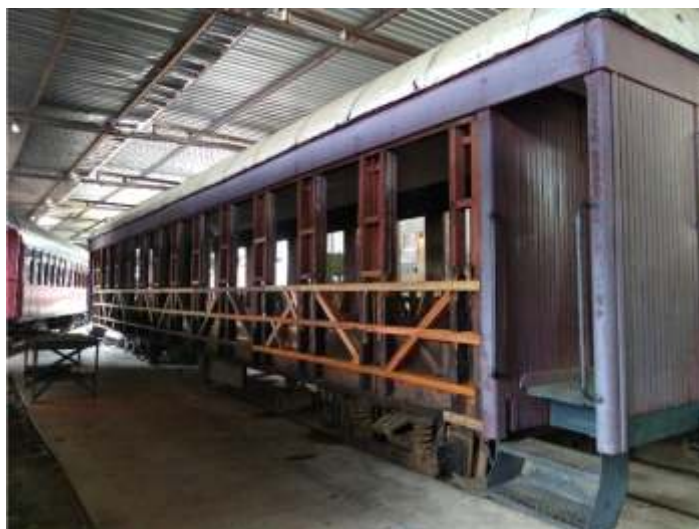
♦ Troca do madeiramento do carro de passageiro PD-43.