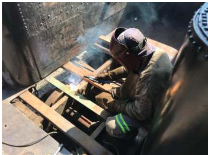
♦ Trabalhos no chassi do Tênder da Mogul nº 11.