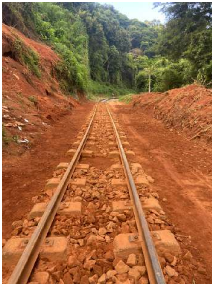
◆ A via já desobstruída. Terminaremos agora o processo de descontaminação do lastro e fará a complementação.