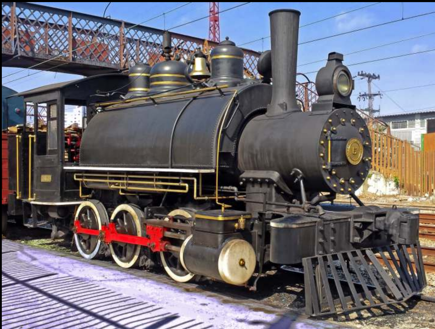
♦ A locomotiva a vapor no. 5 que traciona o Trem dos Imigrantes, em São Paulo/SP. Autoria de Alexandre A. Pisciotano.

Todo mês selecionaremos uma foto relacionada ao trabalho da associação publicada no grupo ABPF - Oficial no Facebook para publicar aqui.