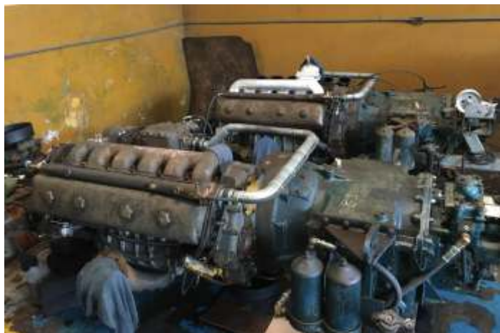
♦ Acima o detalhe da adaptação feita em nossas oficinas e a peça já instalada no conjunto P-2 do lado direito.