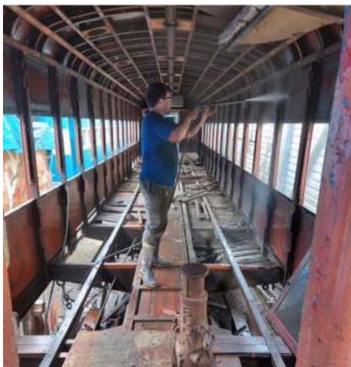
♦ Limpeza da parte interna do carro PC-59.