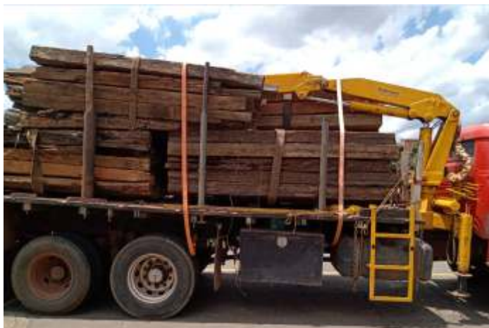
♦ Caminhão da ABPF com dormentes velhos doados pela empresa GBMX.

Queremos aqui também agradecer a empresa GMX – Greenbrier Maxion de Hortolândia SP, pela doação de 32 toneladas de dormentes de madeira usados, retirados das vias do pátio de estacionamento de vagões e que nos servirá como lenha para as locomotivas a vapor. Nosso muito obrigado a GBMX que sempre nos ajudou com doação de materiais diversos.