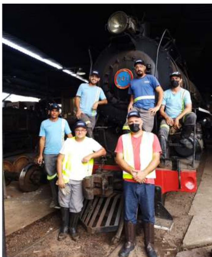
◆ Parte da equipe da ABPF em Rio Negrinho.