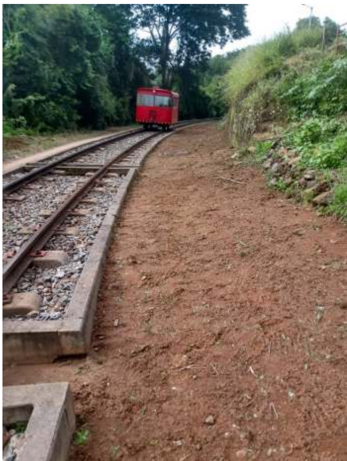
♦ Serviço de capina e limpeza da faixa de domínio.