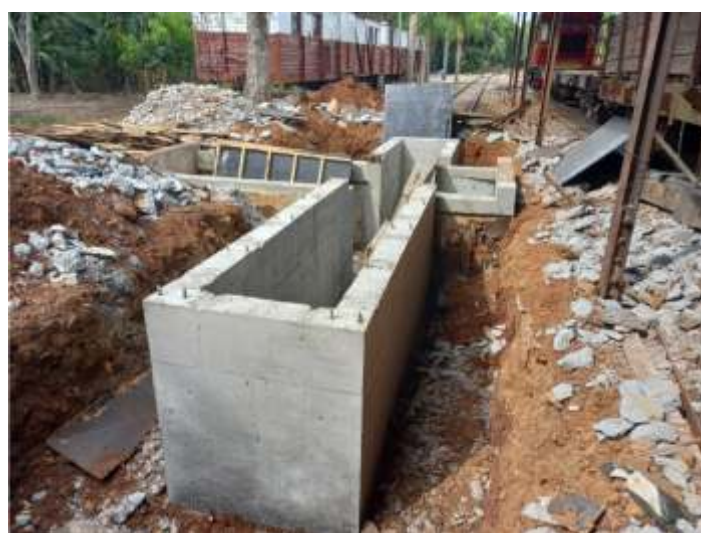
♦ Construção de uma vala de manutenção de locomotivas e vagões em Piratuba.