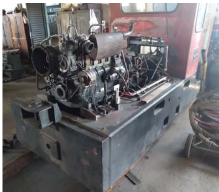
◆ O motor já reinstalado na locomotiva.

Enquanto o motor diesel estava na retífica, fizemos a revisão completa da transmissão hidráulica. A parte elétrica também está sendo refeita e a locomotiva irá receber uma nova pintura antes de ser devolvida ao tráfego.