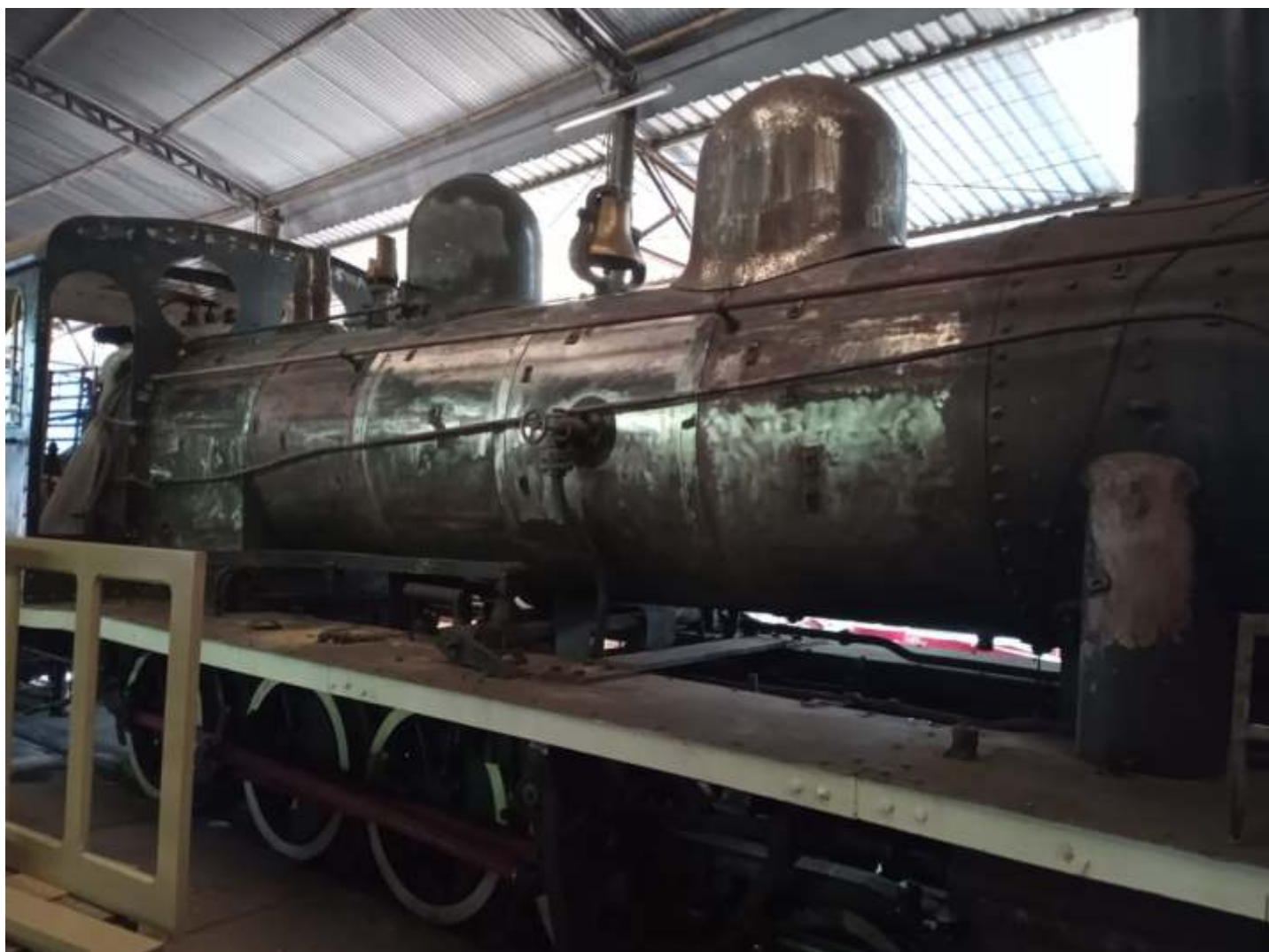
♦ Detalhe do revestimento da caldeira e capa do domo sendo lixados e preparados para nova pintura.