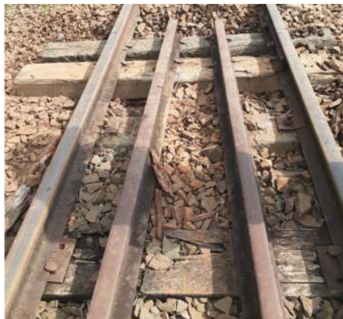
♦ Detalhe de reparação de contra trilhos num dos pontilhões.

Na via permanente prosseguimos com diversos reparos e também com inspeção e limpeza de bueiros, principalmente os que tem agua continua, nos diversos mananciais que cortam a ferrovia. Foi feita a roçagem na entrada e saída dos mesmos. Um deles foi retirado o excesso de lama e terra, dando plena passagem.