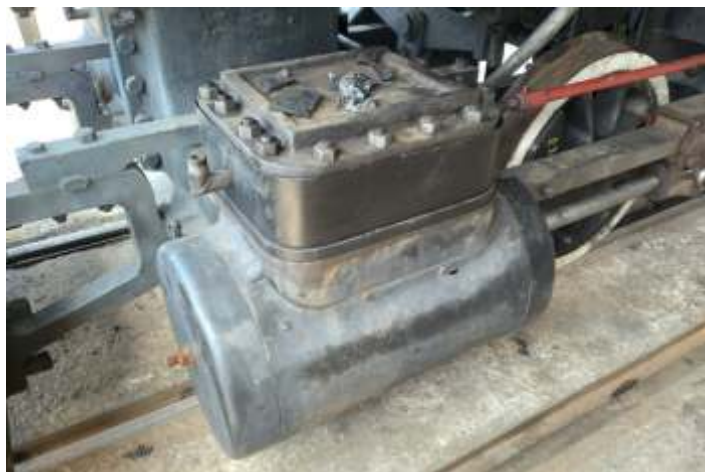
◆ Gavetas da locomotiva nº2 já remontadas.

A nº2 será a primeira locomotiva a vapor a percorrer o trecho de linha recuperado pela ABPF.