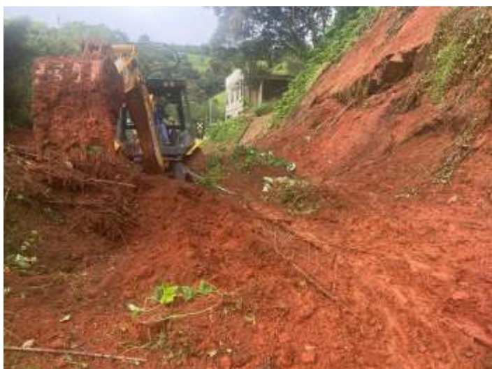
◆ A barreira que desceu na linha em Soledade de Minas e o processo de limpeza.