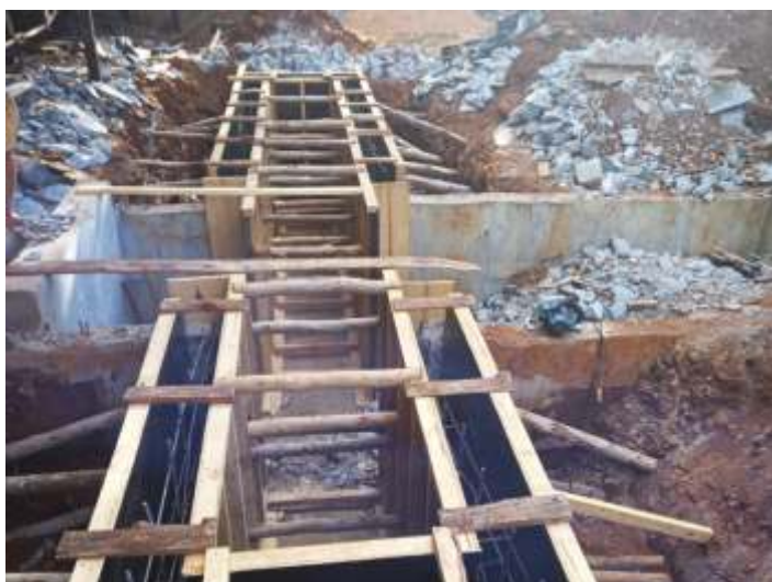
♦ Construção de uma vala de manutenção de locomotivas e vagões em Piratuba.