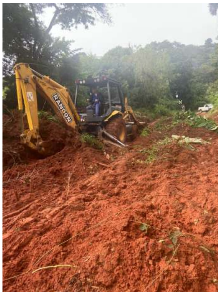
◆ Remoção da terra que caiu sobre a linha.