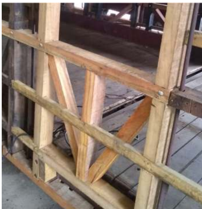
♦ Troca do madeiramento do carro de passageiro PD-43.