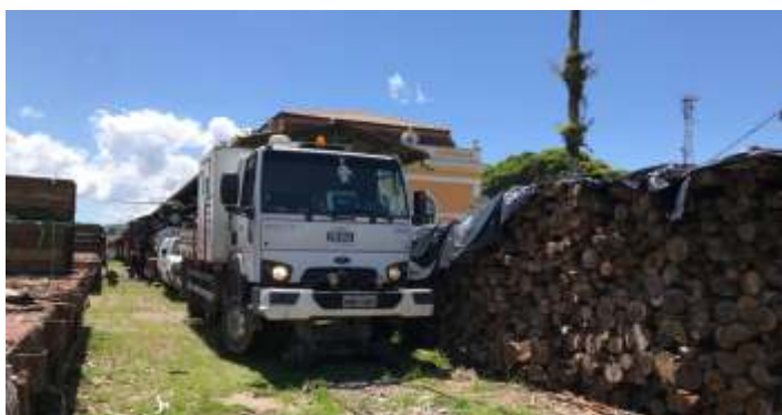
♦ Inspeção do trecho entre as estações de Antonina e Morretes, sendo utilizado um caminhão ferroviário da Rumo.

A nossa locomotiva Mogul nº. 11 passou por reparos no mancal do rodeiro guia. A locomotiva recebeu também, novos injetores, de modelo Comodoro. Já o tender da locomotiva, recebeu trabalhos de manutenção estrutural em seu chassi.