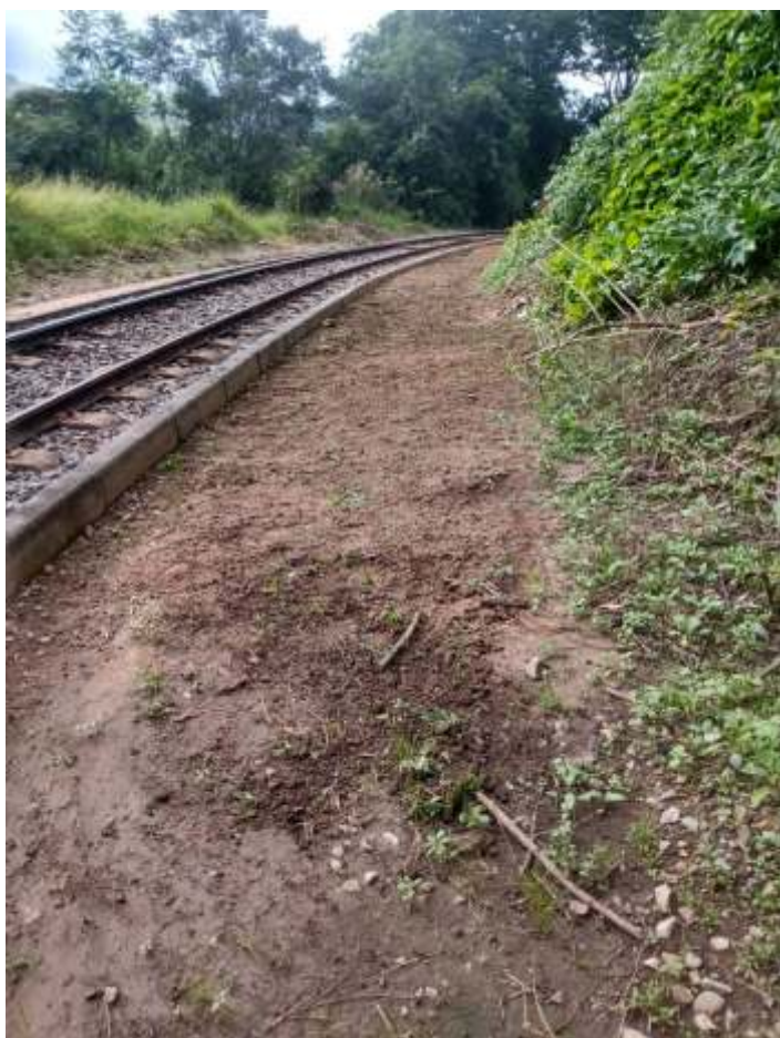
♦ Serviço de capina e limpeza da faixa de domínio.