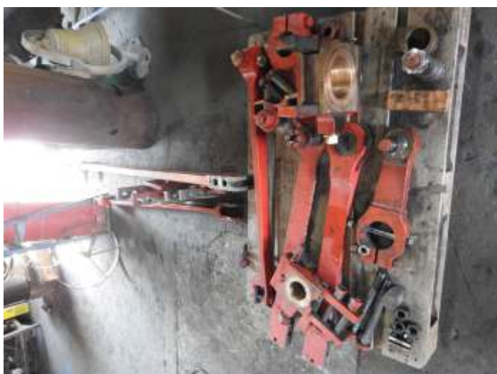
♦ Estais sendo substituídos e partes dos mecanismos da locomotiva 215, nas oficinas para serem refeitos.

Iniciamos a caldeiraria do tender da locomotiva 401. Toda parte inferior das laterais do tender e o fundo será substituído. O reparo da cabina já foi terminado.