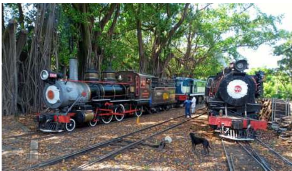
◆ Trem chegando de Anhumas em Carlos Gomes, com as duas Paulistas e ao lado a 505 acessa recepcionando o trem.

Nas oficinas de locomotivas, foi montado o compressor de ar da 505 com novos anéis de segmento, retrabalho no puxavante do lado do maquinista, troca de enchimentos e com isso ela pode fazer os horários de Jaguariúna na semana do carnaval.