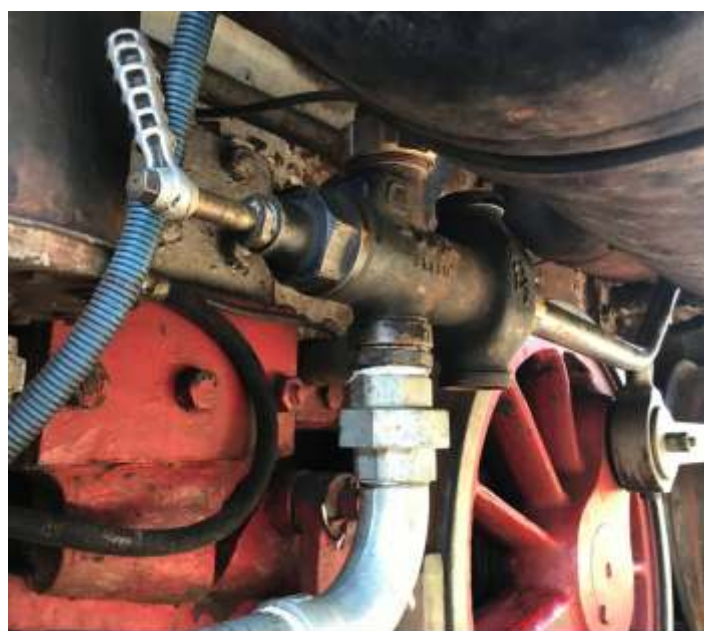
♦ Injetor Comodoro já instalado sob o estrado da cabine da locomotiva Mogul nº 11.