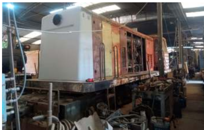
◆ Porta por porta sendo raspada e lixada, trabalho demorado.