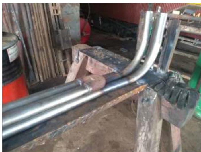
◆ Fabricação de serpentinas novas, para o super-aquecedor da locomotiva articulada Mallet nº. 204.