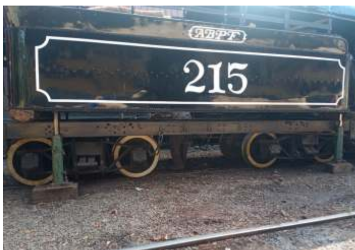
♦ Reparação do assoalho do tender da 215.

A locomotiva 505 também já está em operação, mas sempre passando por melhorias, melhorias estas que nunca foram feitas e agora estamos tendo este tempo e oportunidade de refazer o que precisa.