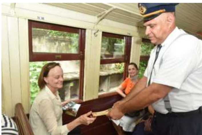
♦ Passeio especial com a presidente do IPHAN e diversas excelências do IPHAN-PR.