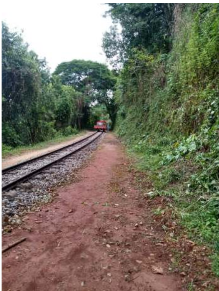
◆ Serviço de capina e limpeza da faixa de domínio.