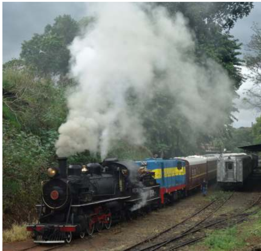
◆ Locomotiva 338 liderando trem saindo de Anhumas.

No mês de março, todos os trens circularam e tiveram um movimento razoável, o que ajuda no avanço dos trabalhos, já que a arrecadação com a venda das passagens dos trens são a principal fonte de receita para as regionais realizarem suas atividades. As oficinas de todas as regionais trabalharam bastante e avançaram na manutenção e na recuperação de material rodante histórico.