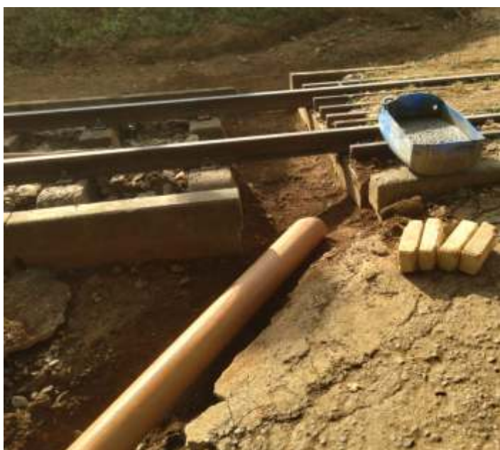
♦ Colocação do tubo para escoamento da água pluvial que desce pela rua que existe logo acima.