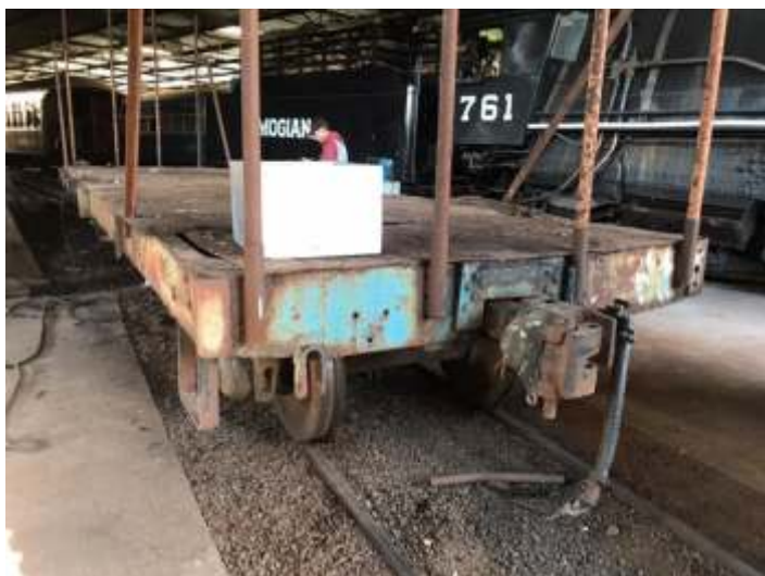
♦ Troca do sistema de freio do vagão de apoio VP-72.