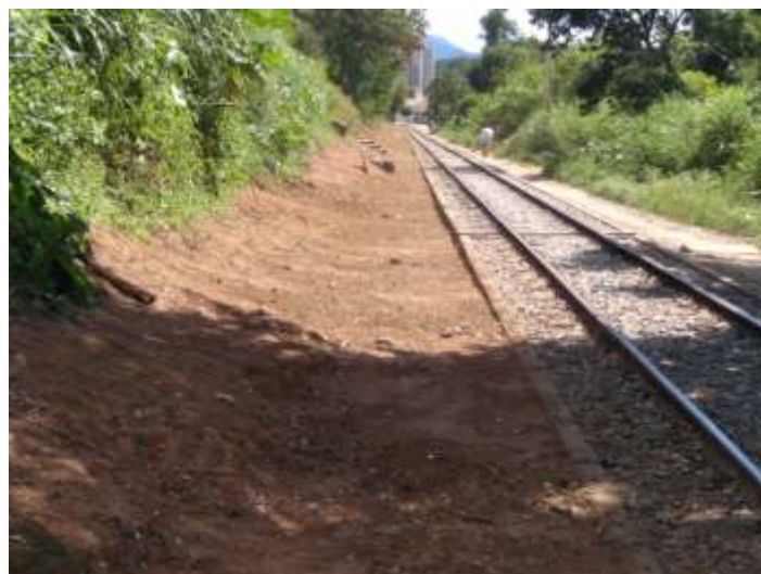
♦ Serviço de capina e limpeza da faixa de domínio.