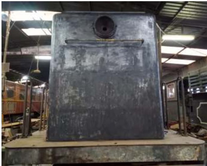
◆ Após decapagem, aplicação de ferrox. Agora pode notar as partes da chaparia que foram substituídas.