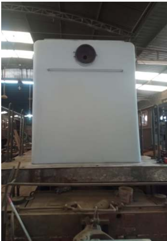
◆ Na sequência com fundo primer.