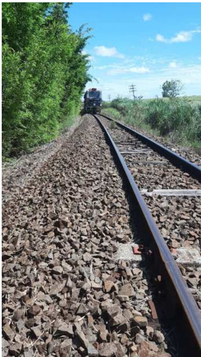
♦ Aspecto do trecho após puxamento de brita.