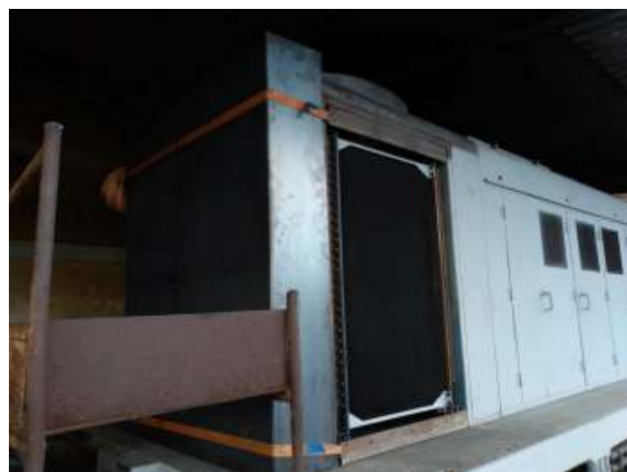
♦ Chapas colocadas no lugar para serem realizados os trabalhos de formatação e criação das aberturas.