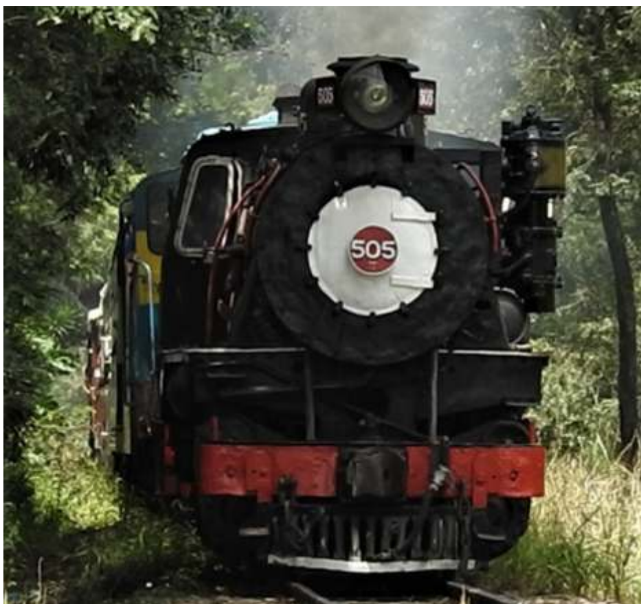
♦ Locomotiva 505 liderando trem para Jaguariúna.

A locomotiva 215 que já estava em funcionamento, passa por pequenos reparos e ajustes para concluirmos a pintura da locomotiva, uma vez que em maio próximo ela comemora seus 110 anos de vida.