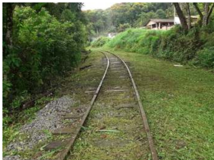
◆ Aspecto de depois da roçada na via permanente.