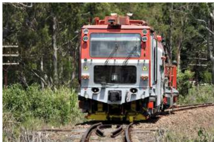
♦ Socadora e niveladora Plasser.