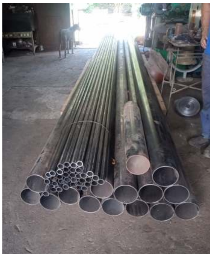
♦ Tubos da locomotiva 401

Outra locomotiva que está sendo reparada é a 401, onde parte do tender já teve a chaparia substituída e em breve ele será retirado para fazer o fundo totalmente novo. Os tubos para a caldeira, bem como para a fabricação das novas serpentinas já foram recebidos e logo iniciaremos os trabalhos de substituição.