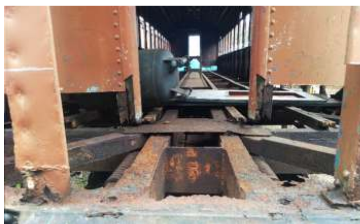
♦ Remoção das chapas metálicas comprometidas do carro de passageiros PC-59.