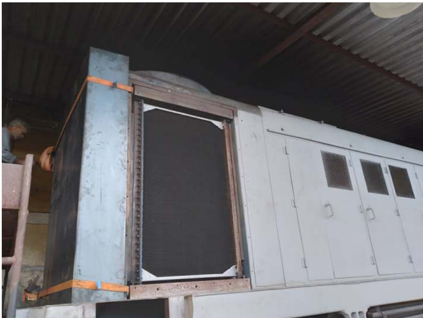
♦ Início da confecção da nova chaparia da extremidade do nariz longo da locomotiva ALCo RSD8.

Seguem os trabalhos na locomotiva ALCO RSD8 3507. No momento os trabalhos estão concentrados na extremidade do nariz longo, que irá receber nova chaparia. A antiga estava muito amassada e com a diversas partes podres o que tornou inviável a sua recuperação. A equipe removeu toda a chaparia antiga e realizou a recuperação de