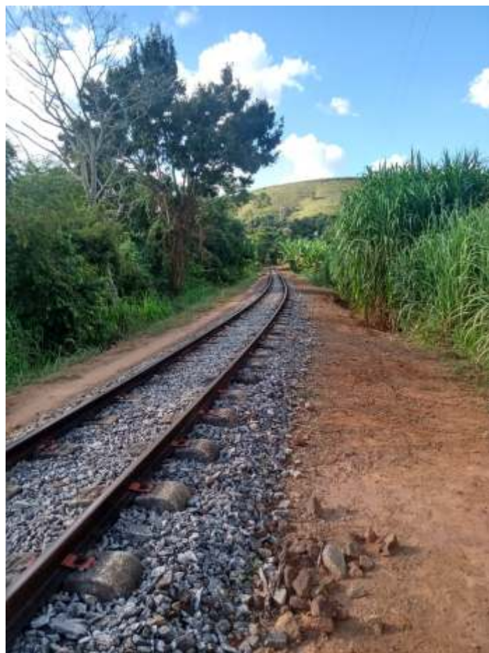
◆ Serviço de capina e limpeza da faixa de domínio.