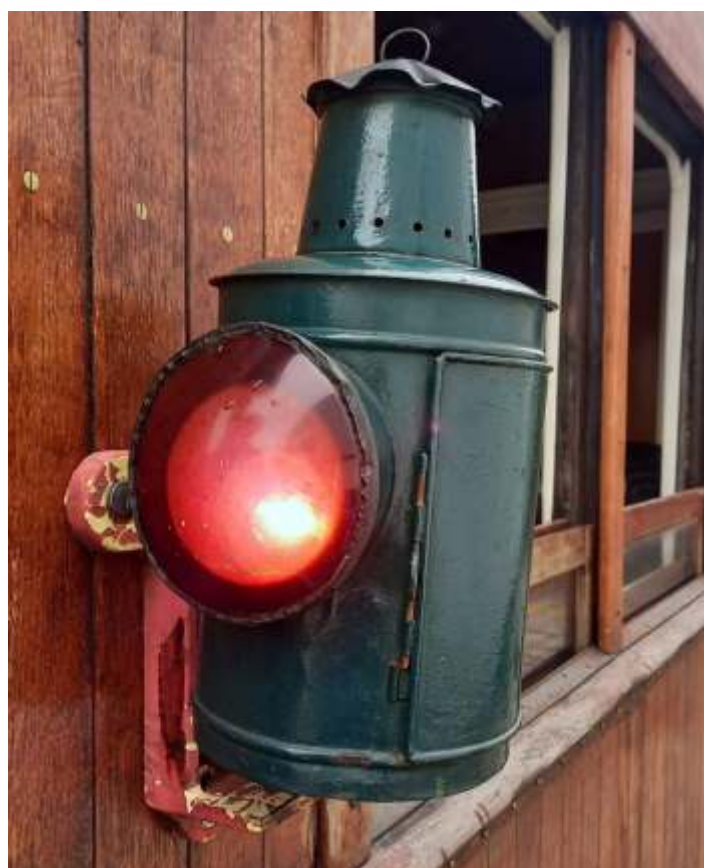
♦ Reinstalação do lampião na cauda do carro reservado.