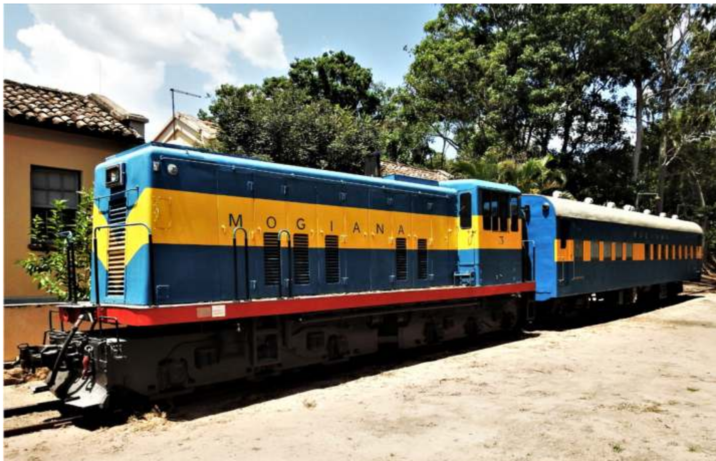
♦ Composição Mogiana sendo preparada.