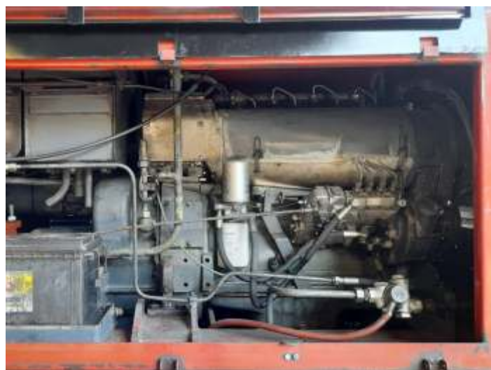
♦ A CBA 1 no depósito de material rodante de São Lourenço e o motor diesel Deutz reconstruído.