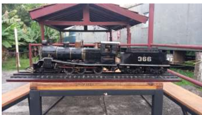
♦ Serviço de limpeza do modelo da 366 da Mogiana.