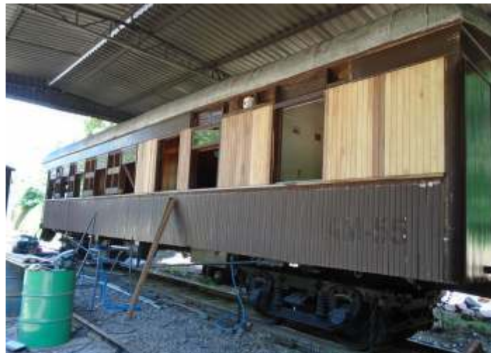
◆ Detalhe da restauração da parede externa. A autoria de Luiz Carlos Henkels.

por cerca de três semanas, realizando o serviço, ao qual agradecemos pelo bom trabalho realizado. A pintura nova do carro foi executada pelos próprios associados do NuRVI. Nos próximos meses o A11 deverá passar por mais algumas interferências, visto que se encontra operacional e nem tudo pode ser feito ao mesmo tempo.