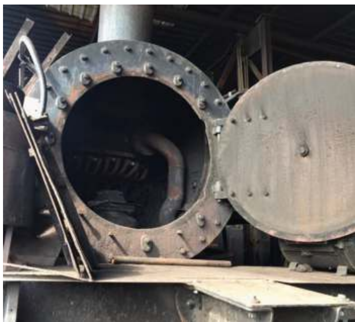
◆ Caixa de fumaça da locomotiva articulada Mallet nº. 204, aberta e com as serpentinas já removidas.