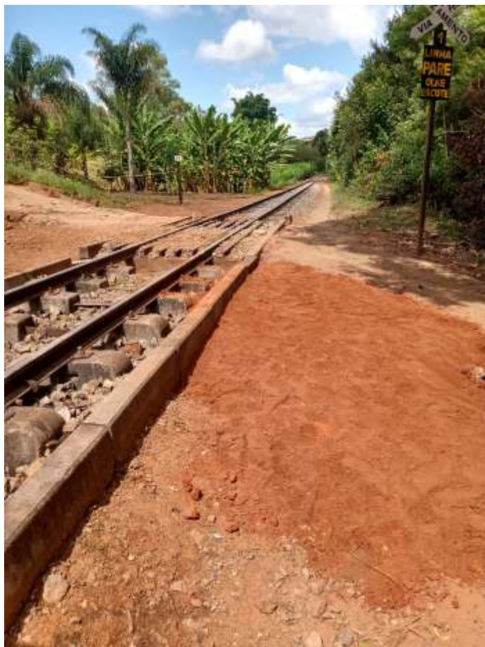
♦ Trabalhos concluídos, já com o tubo coberto e o concreto seco.