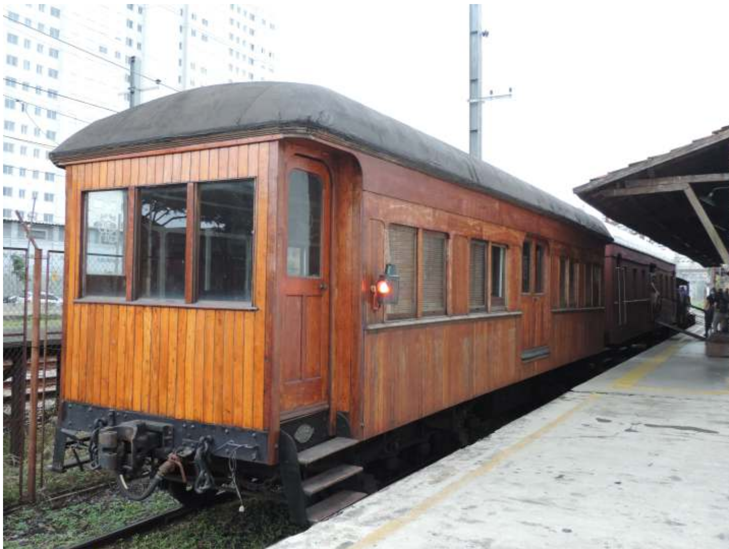
♦ Carro Reservado de 1928, já com o suporte e a lanterna reinstalados e funcionando.

A regional vem seguindo em um bom ritmo desde o início do ano, com os passeios de trem acontecendo todos os finais de semana ininterruptamente. Estamos também tendo bastante ajuda dos voluntários em diversas atividades, como organização do pátio, manutenção do acervo e nas operações aos finais de semana.