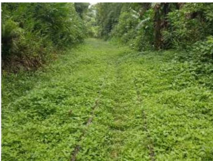
◆ Aspecto de antes da roçada na via permanente.

Ao longo do mês de março, as atividades do Trem Caiçara encontraram-se ainda paralisadas. Durante este tempo sem operação do trem, foram realizadas roçadas na via permanente entre Antonin – PR e Morretes – PR, de modo a conservar o bom estado da ferrovia para quando as atividades retornarem. Ainda durante este período, a equipe de operação recebeu diversos treinamentos, em especial, sobre o uso de calços no trem. Esses treinamentos foram realizados pela concessionária Rumo Logística, a qual agradecemos a grande parceria que vem apresentando em todos os nossos trens.