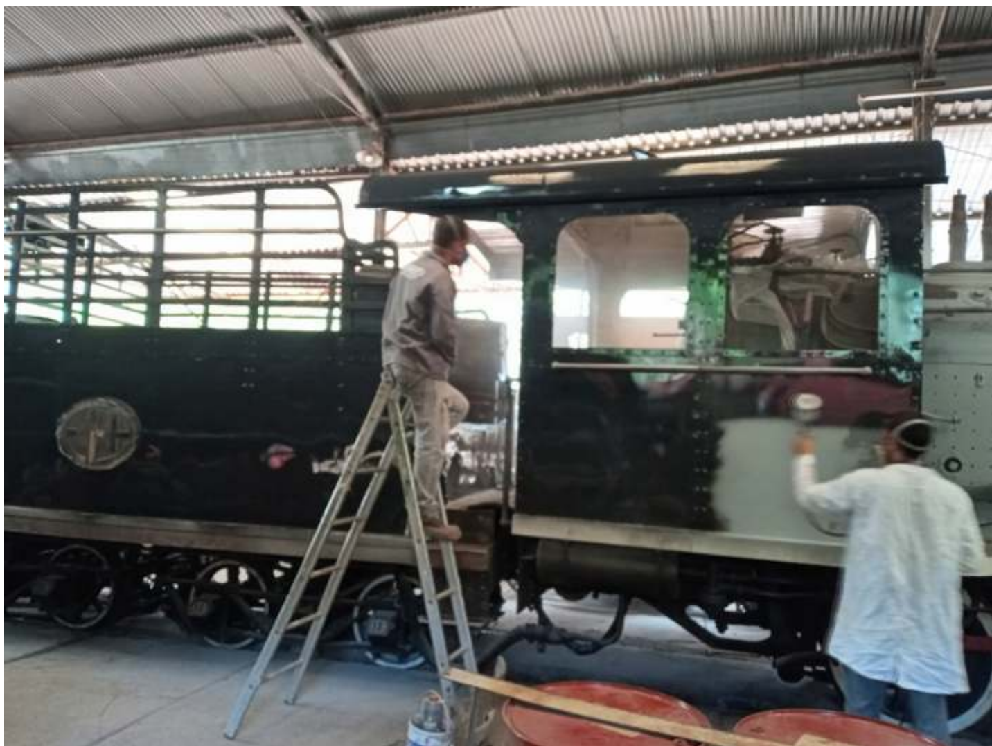
♦ Locomotiva 9 em pintura.