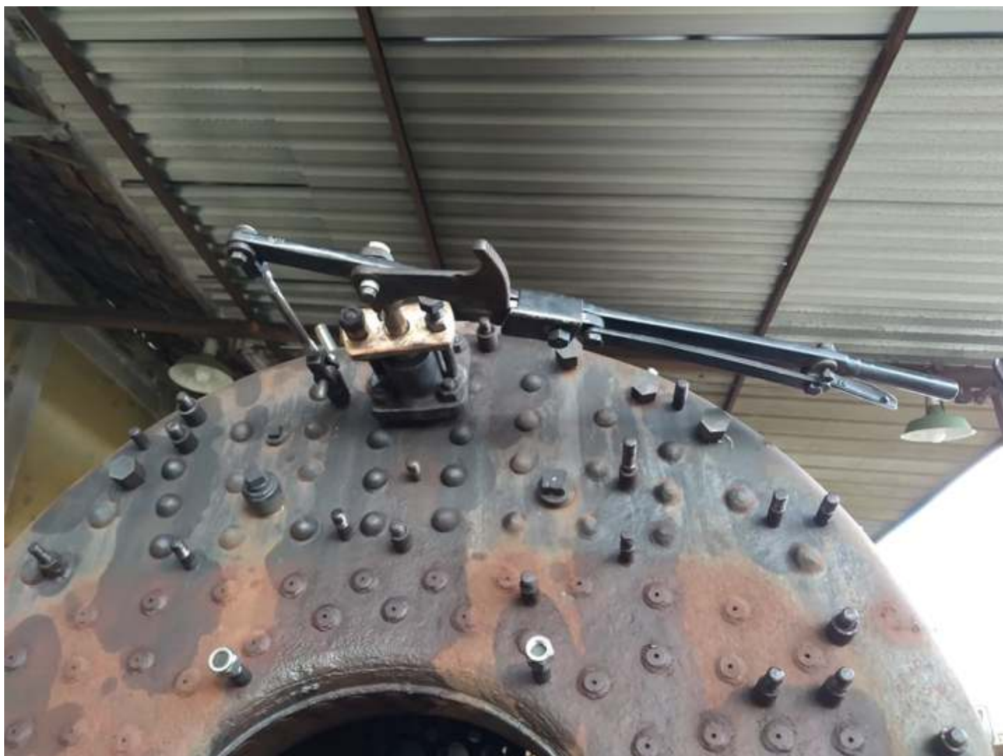
◆ Conjunto da alavanca do reguladro recuperado e já reinstalado na locomotiva nº 522 ex. RMV.

Prosseguem os trabalhos na locomotiva a vapor ALCO nº 522 ex. RMV. O conjunto da alavanca do regulador de vapor foi inteiramente recuperado e já está montado novamente na locomotiva.