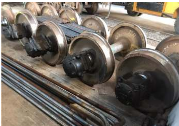
♦ Novos rodeiros já torneados e prontos para instalação nos truques dos carros.