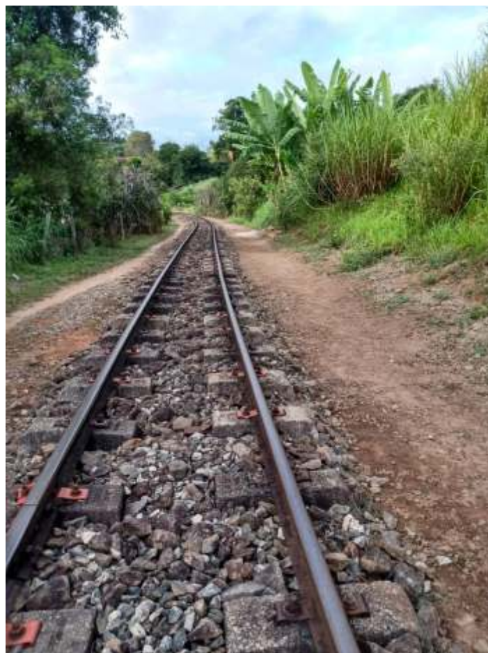
◆ Serviço de capina e limpeza da faixa de domínio.