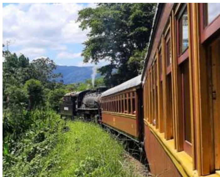
♦ Imagens dos passeios do Trem da Serra do Mar de Fevereiro.