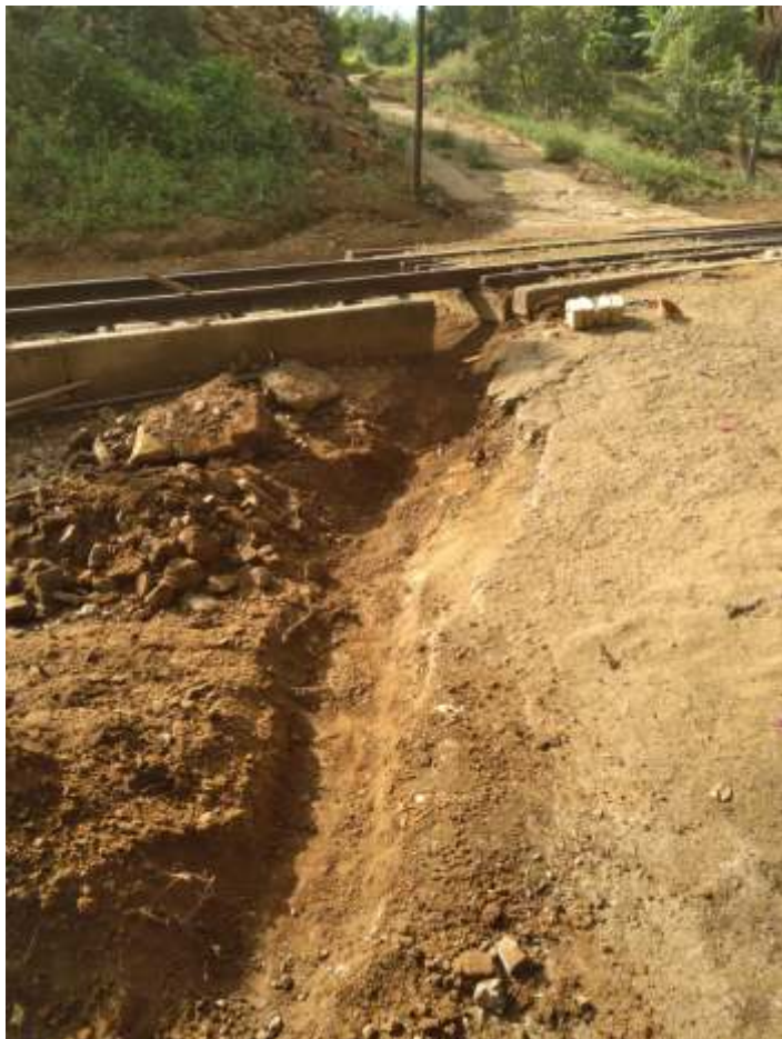
♦ Início dos trabalhos, com abertura de valeta para instalação de tubo para escoamento da água pluvial que desce da rua que existe do outro lado da via-férrea.

Seguem os trabalhos de manutenção e conservação da via e do material rodante. A via está sendo limpa, com capina e retirada de lixo. As saídas de água de vários boeiros e de drenagem da faixa de domínio foram corrigidas. Vários trechos foram nivelados e receberam complementação de lastro. A equipe está também realizando roçada da faixa de domínio.