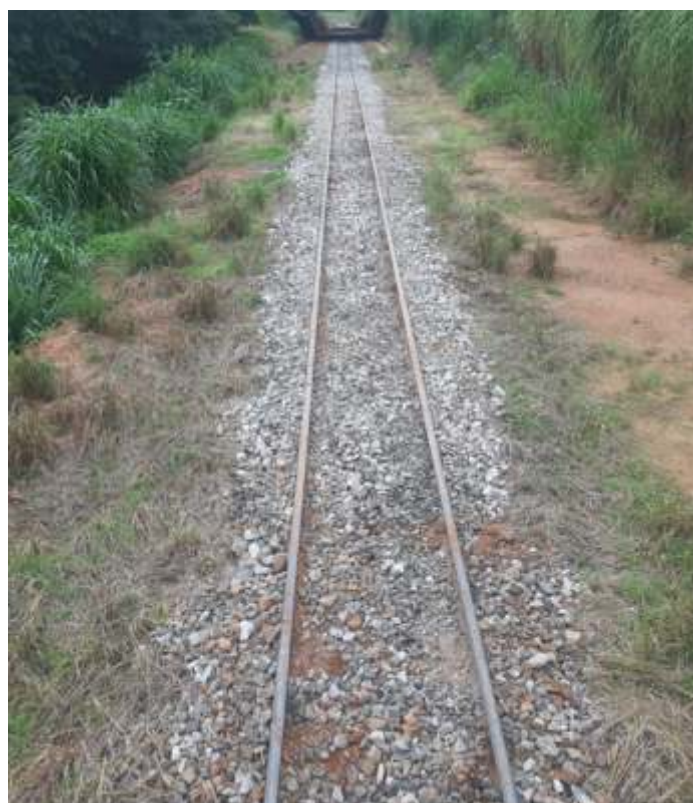
♦ Outro trecho após reparos, sendo colocado brita.

A ABPF Regional de Campinas agradece a todos os seus colaboradores e associados que se dedicam as nossas atividades!