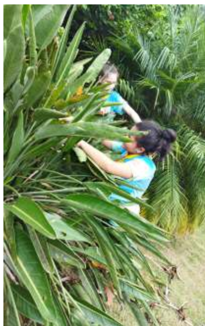
♦ O grupo em destaque, e atividades diversas realizadas no pátio do Trem da EFSC.

Em Rio do Sul , na estação de Matador, encontra-se depositado parte do material rodante do NuRVI, ainda por restaurar, bem como o museu estático e fotográfico relativo aos fatos históricos que marcaram a EFSC no Alto Vale do Itajaí. A estação se situa no Beco Artur Hering – Nº 50, bairro Bela Aliança de Rio do Sul.