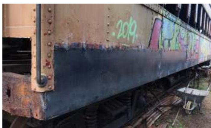
♦ Soldagem e reconstrução da nova chaparia externa do carro de passageiros PC-59.