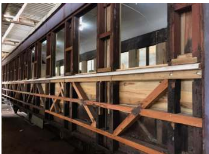
♦ Reconstrução do madeiramento interno do carro PD-43.

Já no carro PC-59, foi feita a remoção da chaparia metálica externa, que estava bastante comprometida, sendo esta chaparia, substituída e por novas placas de aço, já parcialmente soldadas na lataria externa do Carro. Na parte interna do carro, todo o madeiramento foi removido, para ser substituído por novo, ficando, apenas o madeiramento estrutural do carro. Também foi realizado a limpeza tanto do interior, quanto do exterior do carro. Este carro foi construído pela Viação Férrea do Rio Grande do Sul (VFRGS) nas oficinas de Rio Grande em 1942, para formar o Trem Farroupilha, que corria de Porto Alegre a Santa Maria.