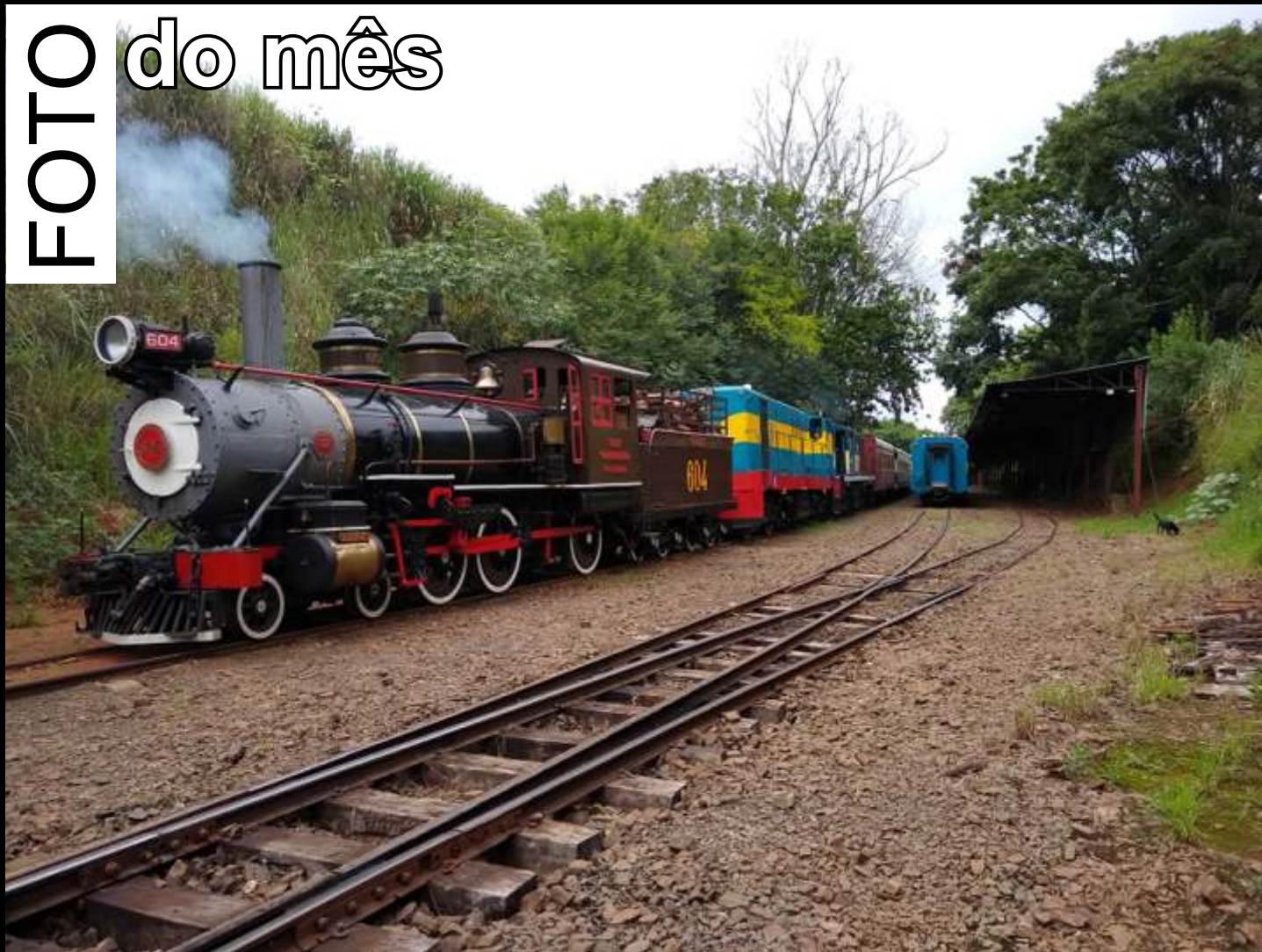
◆ Trem pronto para partir da estação Anhumas, em Campinas, com a locomotiva 604 liderando.

Todo mês selecionaremos uma foto relacionada ao trabalho da associação publicada no grupo ABPF - Oficial no Facebook para publicar aqui.