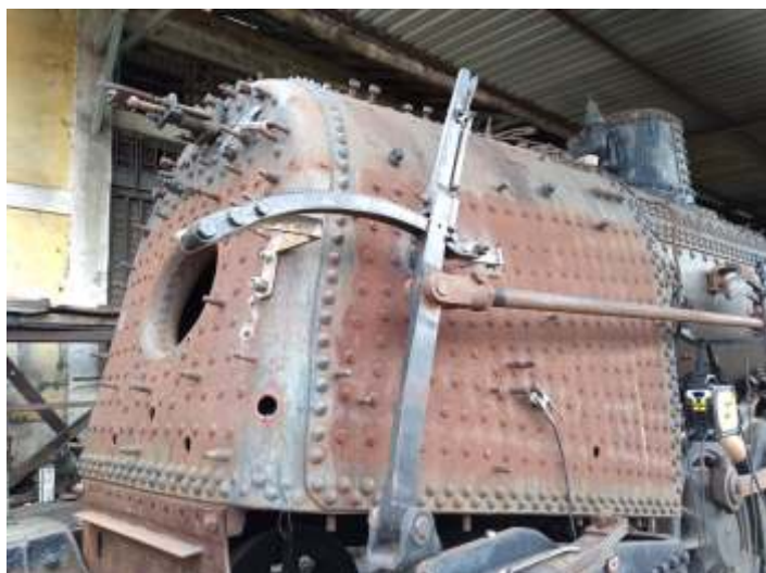
◆ Conjunto da alavanca de reversão da 522 reinstalado.

Está sendo feita a montagem das braçagens da locomotiva. Os braços principais, que conectam as rodas motrizes já haviam sido montados antes e agora começamos a montar a parte da distribuição, começando pelas barras radiais, quadrantes e dados para já ir realizando os ajustes necessários. novas buchas e pinos foram confeccionados nas nossas oficinas.