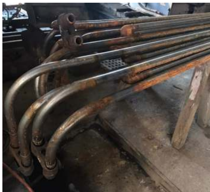
◆ Serpentinas do super-aquecedor da locomotiva articulada Mallet nº. 204, já prontas para serem instaladas.