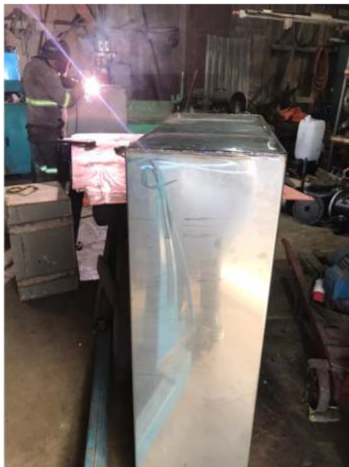
♦ Fabricação das novas caixas em aço inox.