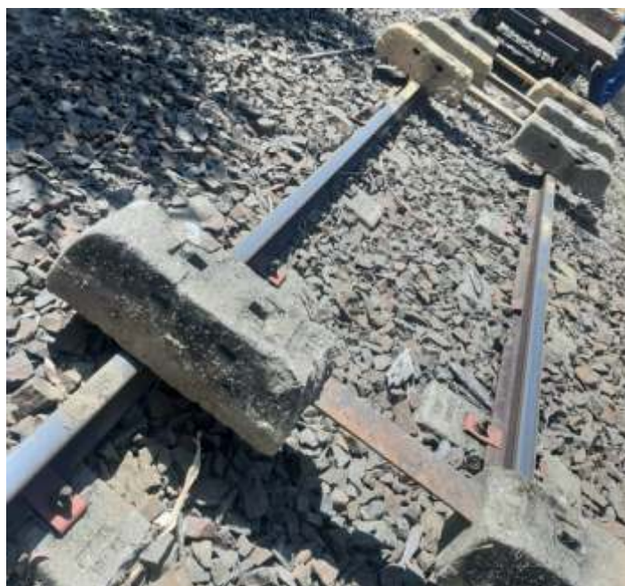
◆ Dormentes para ser substituídos.

E na via permanente, tivemos a substituição de dormentes de concreto em vários trechos, e teve vários lugares que foi feito o alinhamento e nivelamento com as máquinas de via da classe. Em dois trechos também usamos a reguladoras de lastro, sendo no km 16 e 18. Com isso os três pequenos trechos que eram restritos, foram liberados e concluídos.