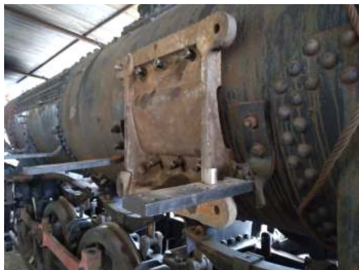
◆ Suporte do compressor reinstalado na caldeira da 522.