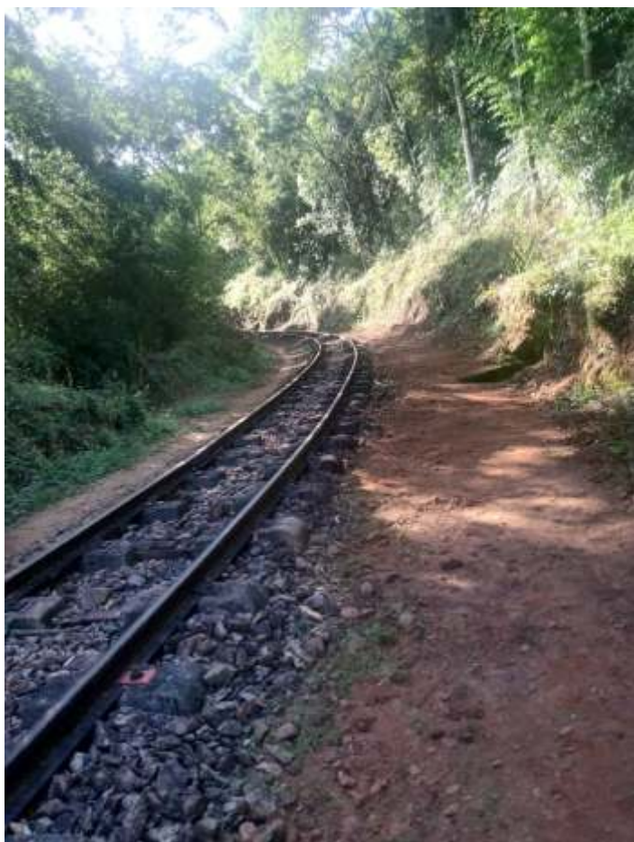
◆ Serviço de capina e limpeza da faixa de domínio.