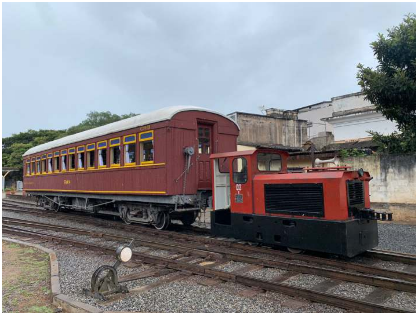
♦ A CBA 1 manobrando o carro restaurante no pátio da estação de São Lourenço.

Nas oficinas, seguem os trabalhos de reconstrução do carro SD-22, ex. EFCB, do qual tinha-mos apenas o estrado metálico e truques. A equipe da marcenaria está o reconstruindo com base nos demais carros do mesmo modelo que já foram inteiramente refeitos anteriormente. Todas as peças estão sendo confeccionadas copiando-se as dos outros carros do mesmo modelo. A montagem da nova estrutura da caixa foi concluída e o revestimento externo já está sendo instalado. Paralelamente, estamos trabalhando em um dos carros Busch ex. E. F. Sorocabana.