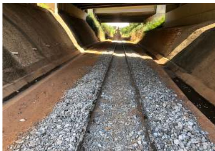
♦ Trecho com brita nova após socaria e nivelamento.