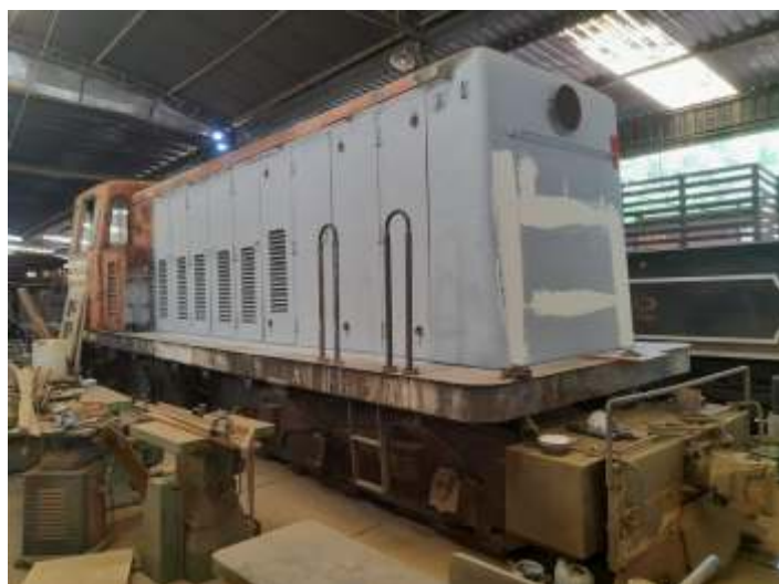
◆ Locomotiva 3104 em reparação.

E na via permanente, tivemos a substituição de dormentes de concreto em vários trechos, e teve vários lugares que foi feito o alinhamento e nivelamento com as máquinas de via da classe. Em dois trechos também usamos a reguladoras de lastro, sendo no km 16 e 18. Com isso os três pequenos trechos que eram restritos, foram liberados e concluídos.