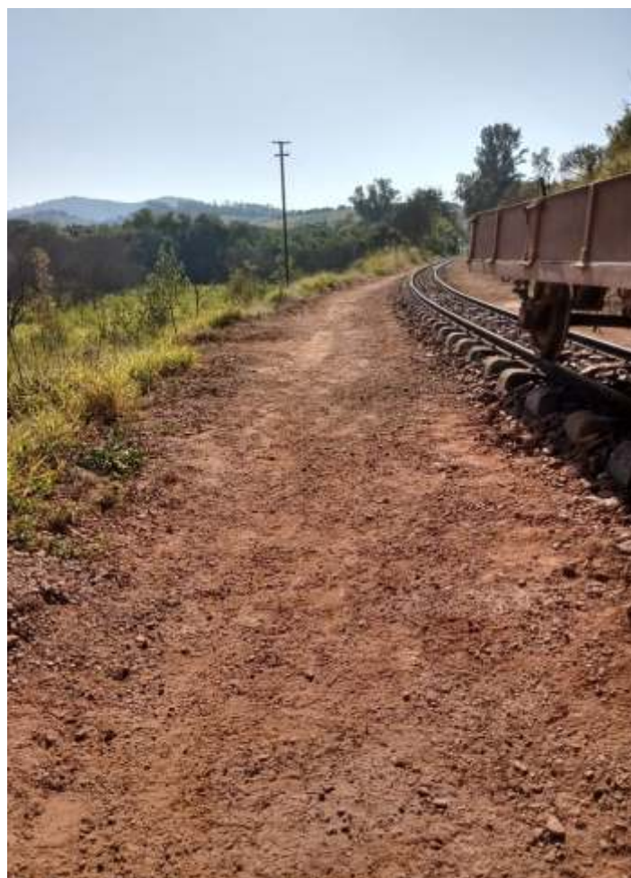
♦ Limpeza da faixa de domínio.