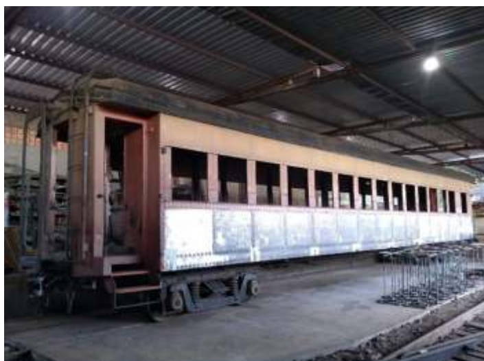
♦ Carro de passageiros PC-60 já posicionado na vala da marcenaria e com pintura parcialmente removida.