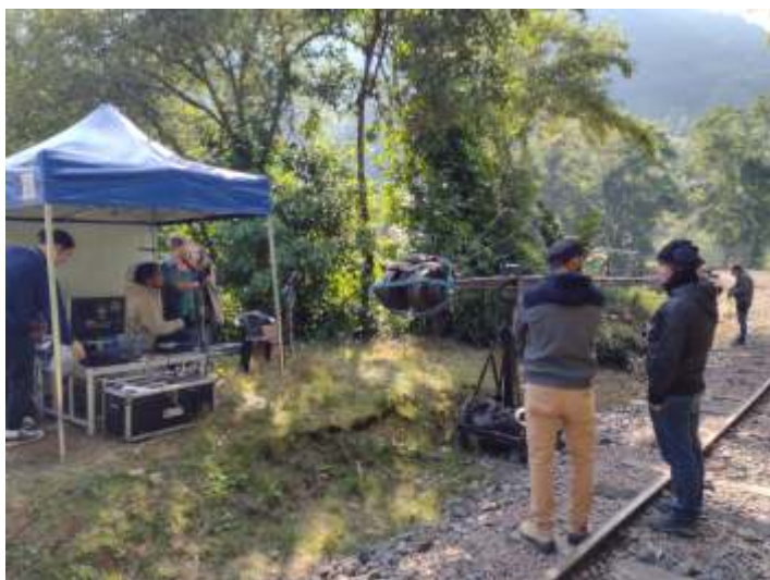
◆ Filmagens ao longo da linha e a presença do ator principal, perto da barraca.