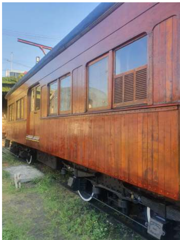
♦ Processo de aplicação de verniz no carro nº 19.