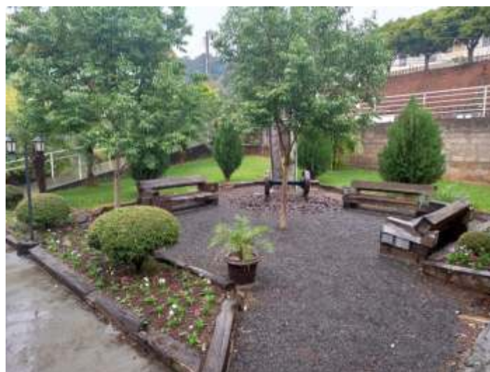
♦ Manutenção no jardim ao lado da Estação Ferroviária de Piratuba.