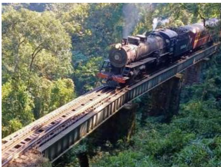
♦ Nossa Locomotiva Mikado nº 761 em subida pela Serra do Mar.