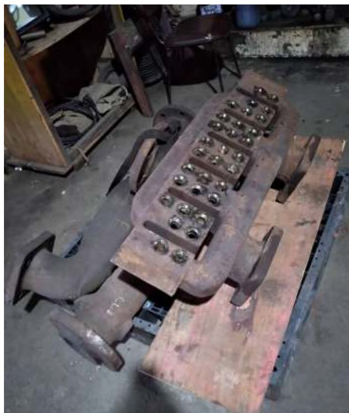
♦ Sistema de desengate recuperado.