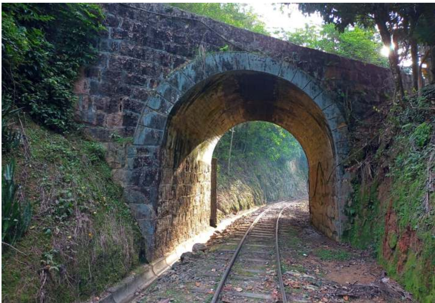
◆ Via recuperada ao longo da passagem superior em arco. Autoria de Otávio Georg Junior.