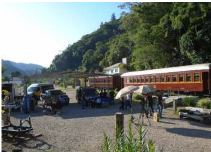
♦ Entre 21 e 22 de maio o pátio de embarque do “Trem da EFSC” foi transformado em “set” de filmagens. Luiz C. Henkels.

Nos dias 21 e 22 de maio o Trem da EFSC e a via férrea em Subida foram palco de filmagens para o “youtuber Gato Galáctico” que ali compareceu com grande equipe e aparato técnico. O trem terá pequena mas, importante participação de um longa metragem que está sendo realizado em logradouros ao longo de cidades do vale do