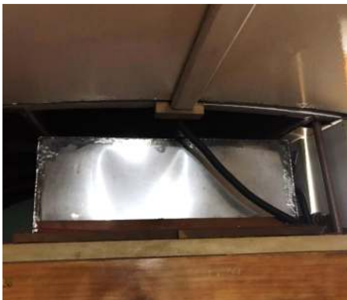
♦ Caixa d'agua nova já instalada no carro de passageiros PD-43.