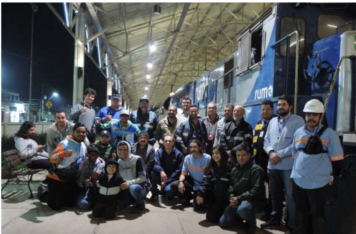
◆ Parte da equipe responsável por levar a composição ao evento e alguns entusiastas que estavam no local.