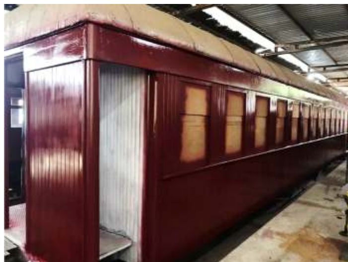
♦ Carro PD-43 com pinura finalizada.

Ainda no início do mês, foi feito a troca do madeiramento das cabeceiras e dos vestibulos deste carro, sendo seguidos pela pintura total, em vermelho. No interior, foram instaladas as estruturas dos maleiros em bronze. Também recebemos os vidros das janelas, possibilitando a instalação das mesmas. O interior do carro recebeu acabamento em Decoflex no piso, enquanto que as estruturas das poltronas e estofamento serão instaladas no início do próximo mês. Agora, os trabalhos neste carro irão concentrar-se na instalação das poltronas, material hidráulico-sanitário e das portas.