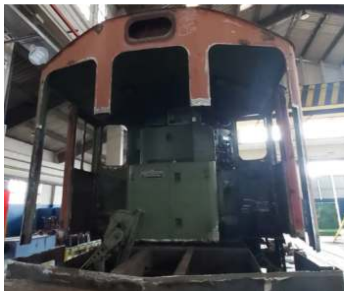
♦ Desmontagem da cabeceira traseira da locomotiva.