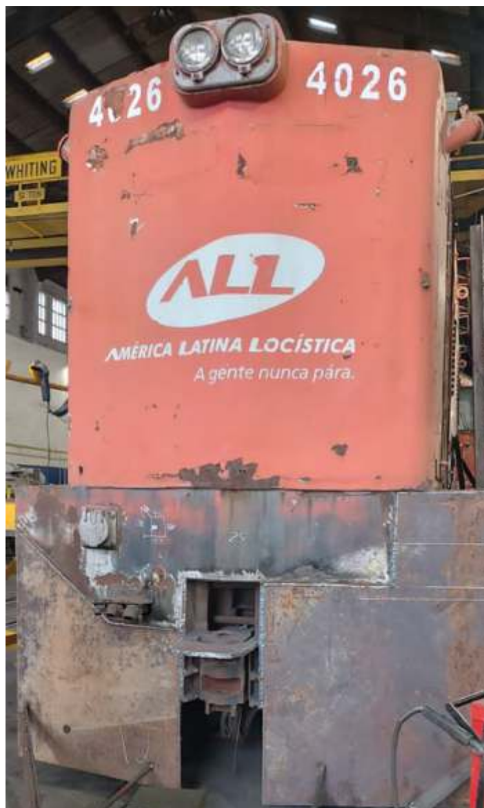
♦ Aspecto inicial da cabeceira frontal da locomotiva.