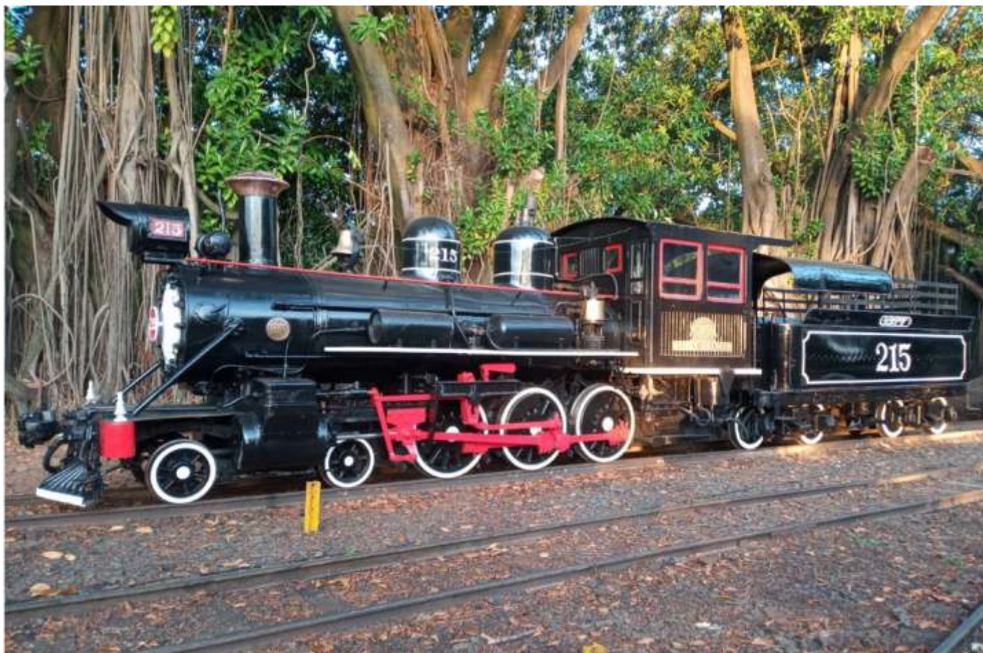
♦ Locomotiva 215 em Carlos Gomes.