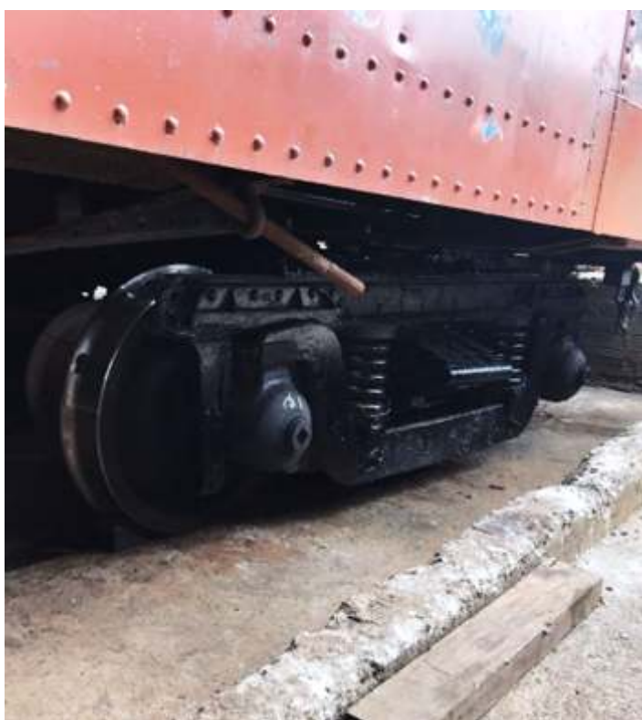
♦ Reconstrução do vestibulo do carro PC-60.p

Já o carro de passageiros PD-43 avança na reta final de sua restauração. Como mencionado anteriormente, este carro trocou de vala com o carro de passageiros PC-60, afim de facilitar a restauração. Na parte externa, os truques do carro estão sendo desmontados para revisão geral, e os rodeiros estão sendo torneados conforme o padrão exigido pela concessionária da ferrovia. Trabalho que será finalizado ao longo do próximo mês