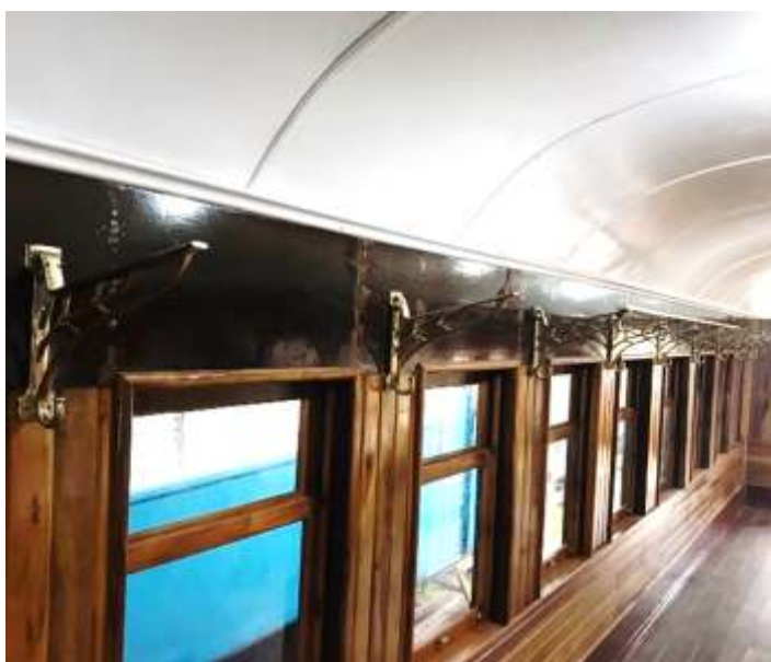
♦ Suporte dos maleiros já instalados no carro de passageiros no PD-43.