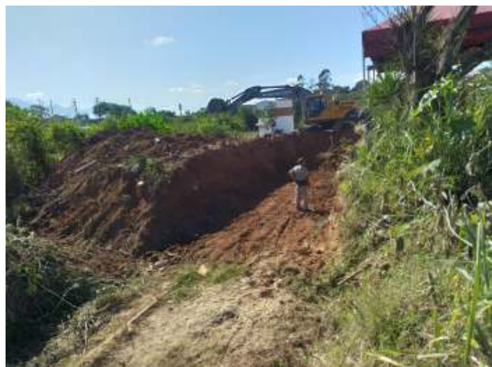
♦ Foi necessária uma escavadeira de grande porte.