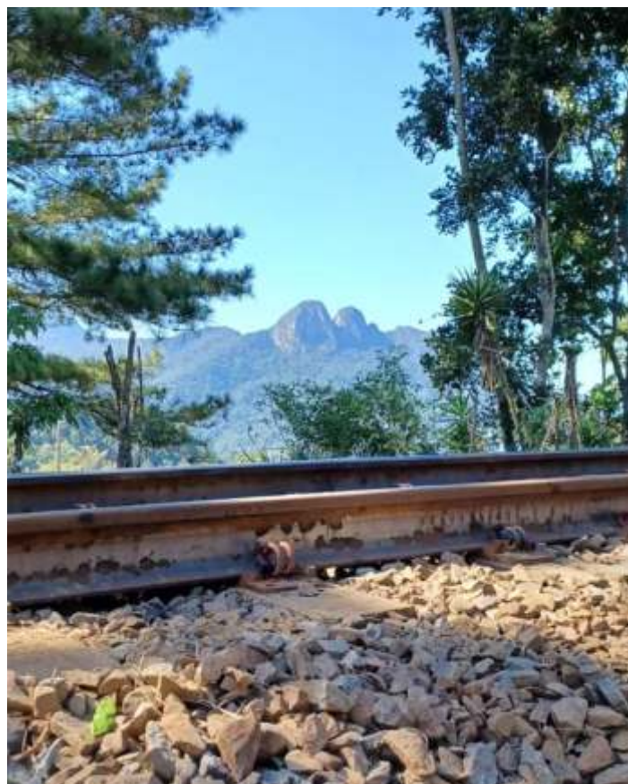
♦ Destaque para a Pedra do Morro da Igreja, que acompanha o nosso trem durante toda a passagem pela Serra do Mar.