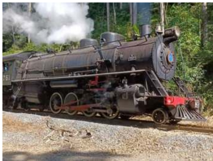
♦ Nossa Locomotiva Mikado nº 761 em subida pela Serra do Mar.