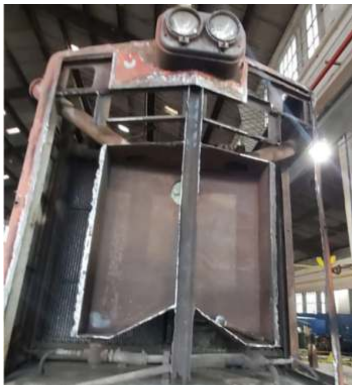
♦ Aspecto da desmontagem da cabeceira frontal da locomotiva.