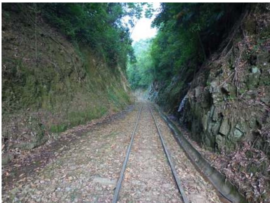
◆ Via recuperada ao longo do "grande corte". Autoria de Otávio Georg Junior.