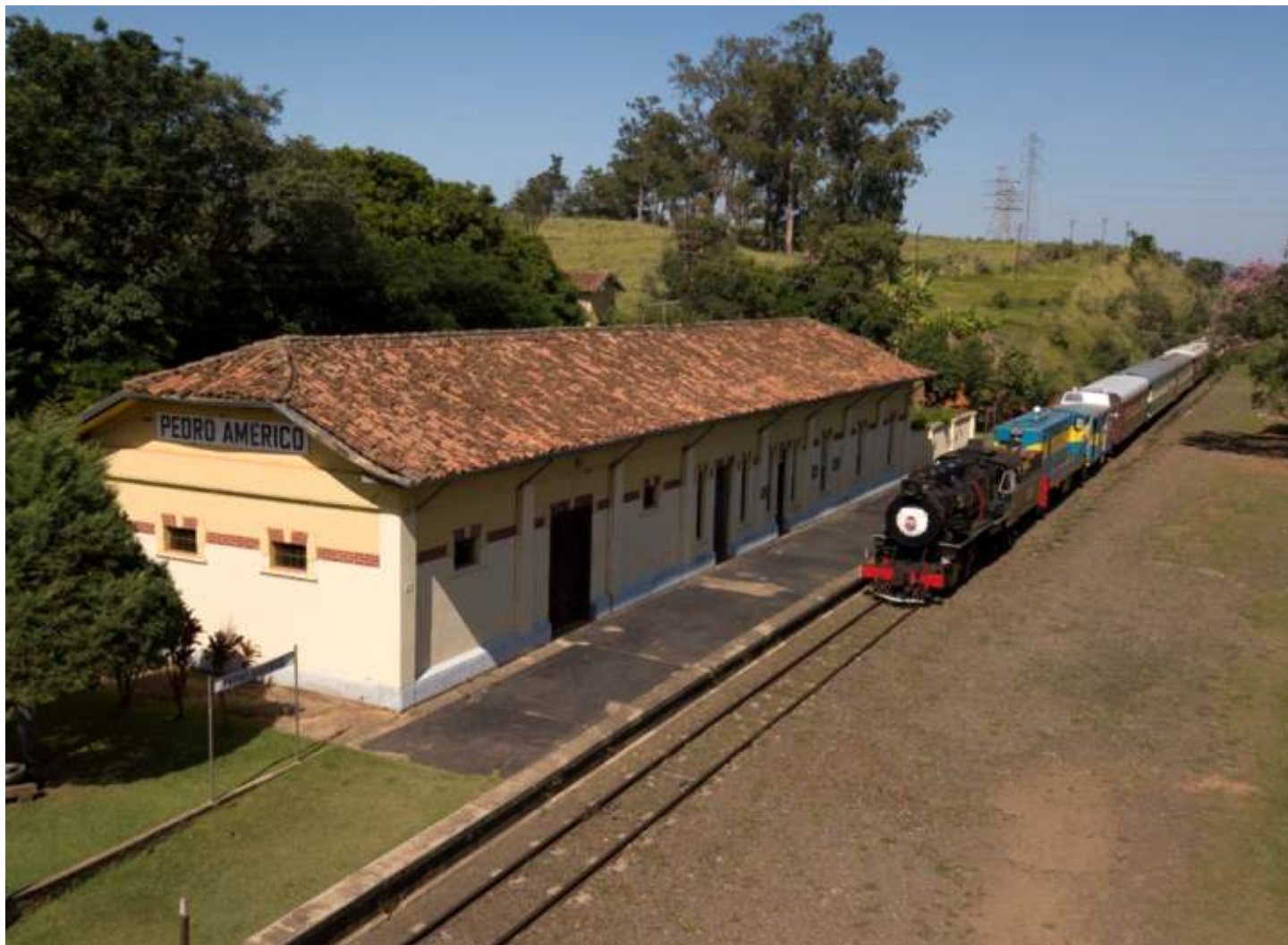
♦ Foto da composição chegando a Pedro Américo.

O mês de maio foi marcado pela volta e aniversários das locomotivas 9 e 215, que completaram 110 anos de existência e serviços prestados. Os trens funcionaram normalmente.