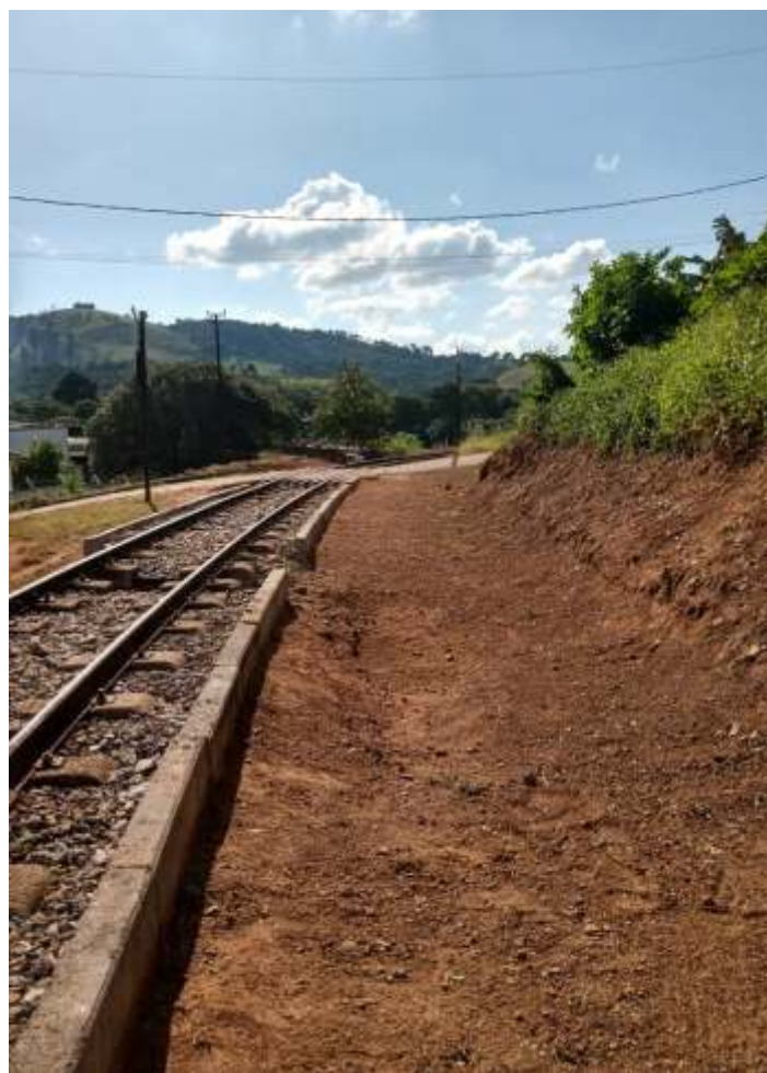
♦ Limpeza da faixa de domínio.