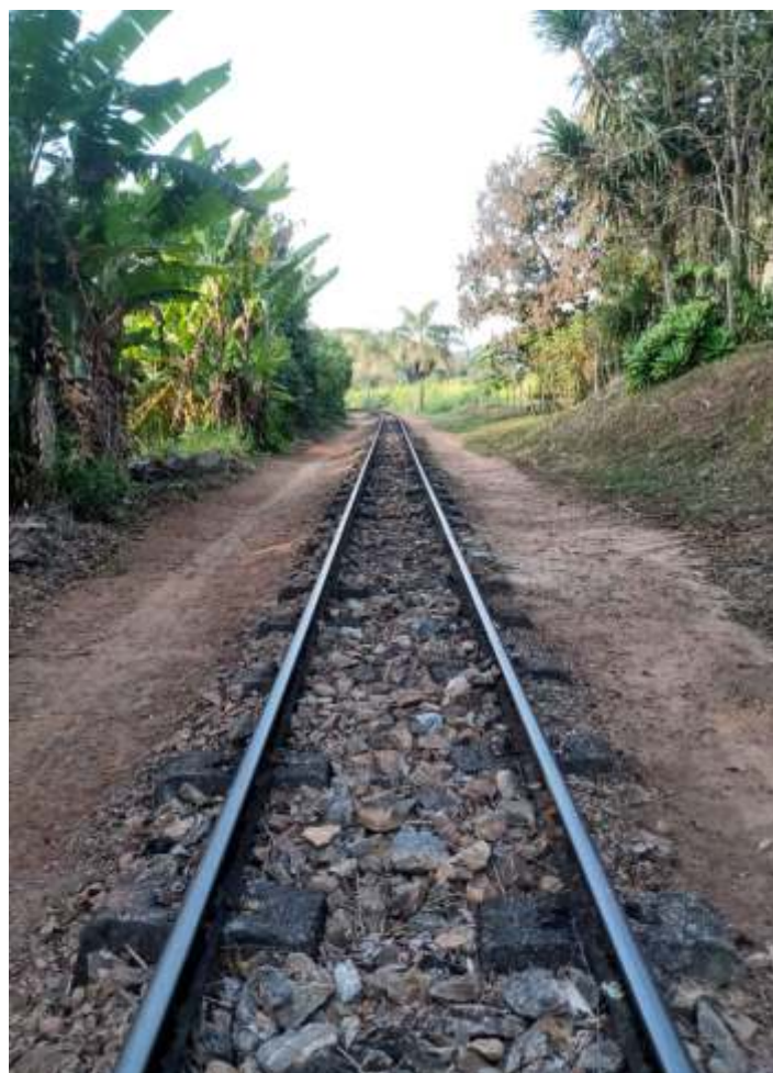
♦ Limpeza, alinhamento e nivelamento da via.