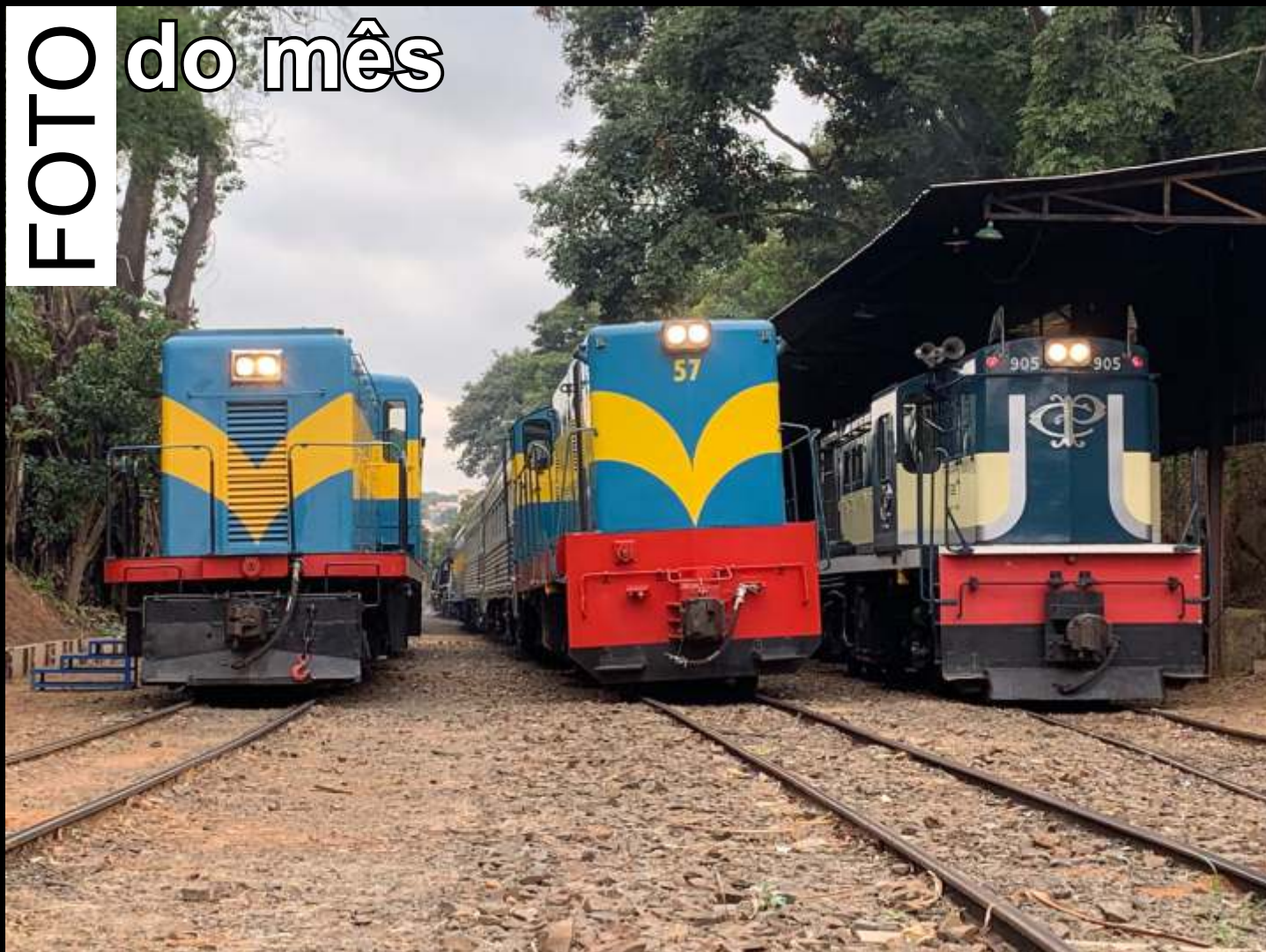
♦ O belo trio de locomotivas diesel-elétricas em manobras na estação de Anhumas.

Todo mês selecionaremos uma foto relacionada ao trabalho da associação publicada no grupo ABPF - Oficial no Facebook para publicar aqui.