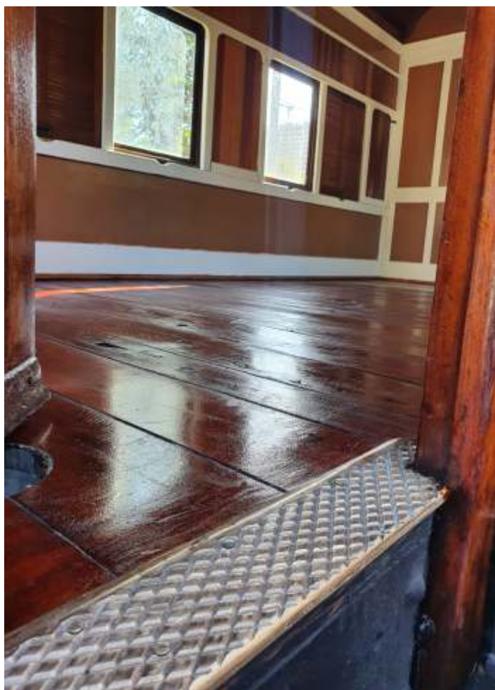
♦ Assoalho do carro nº 19 após manutenção.