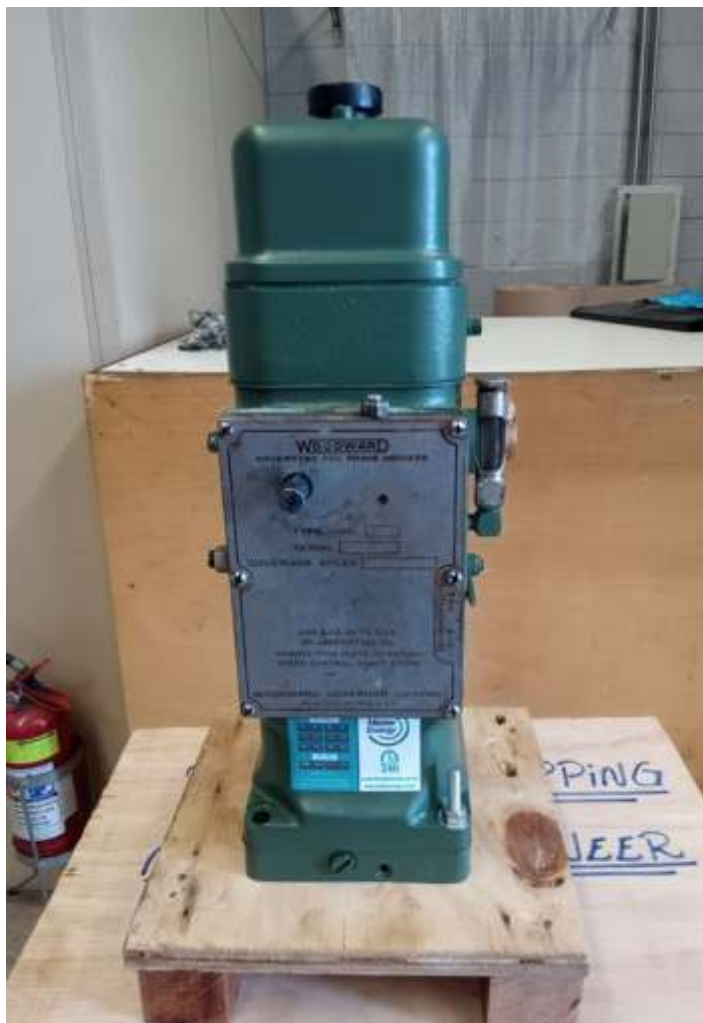
♦ Governado do motor diesel da GE 3104 – Foto Hélio Gazetta.

Os serviços de recuperação da estação de Carlos Gomes, continuam a pleno vapor, onde iniciamos a instalação do novo madeiramento e colocação das telhas galvanizadas. Parte da alvenaria do muro e sanitários também passam por reparação interna e externa. Em breve estará concluído em sua totalidade, iniciaremos a reconstrução de portas e batentes.