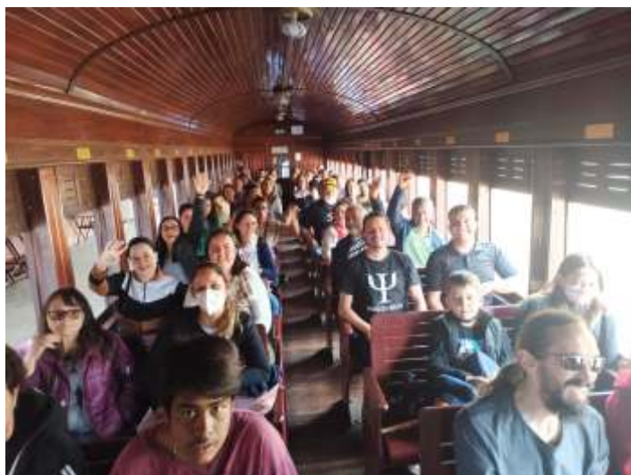
◆ Pessoal dos CAPS abordo do trem.