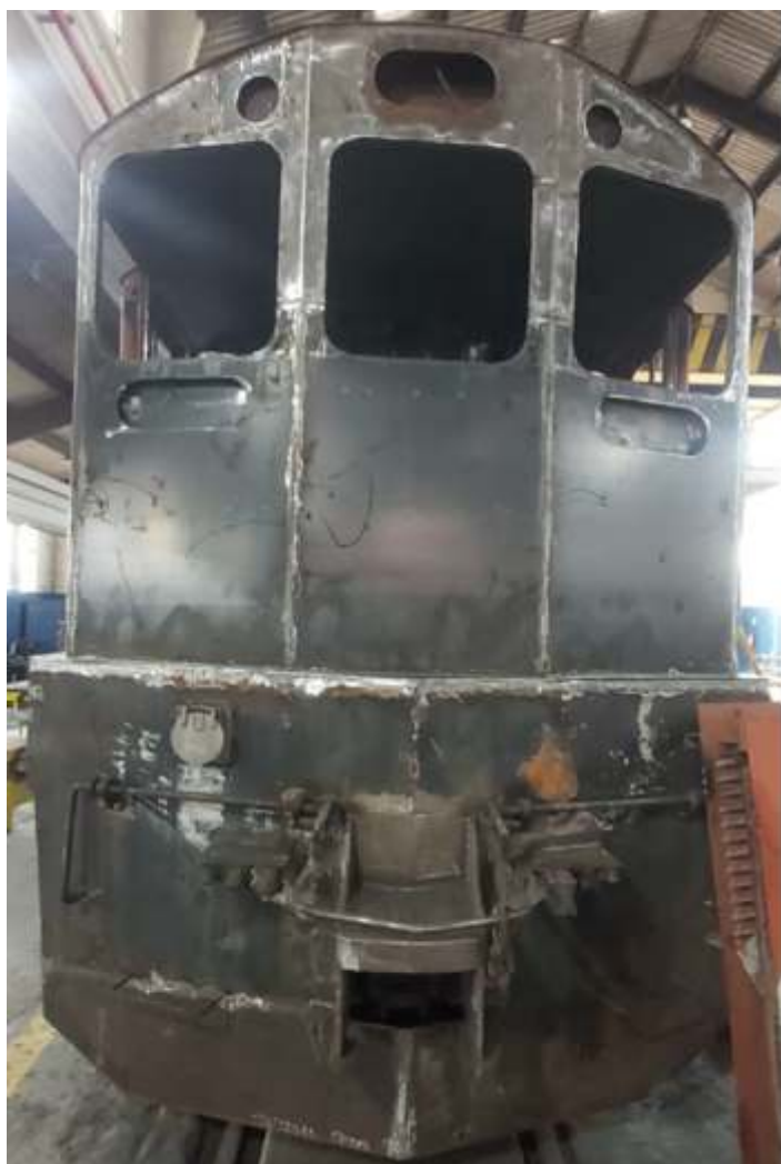
♦ Aspecto final da reconstrução da cabeceira traseira.