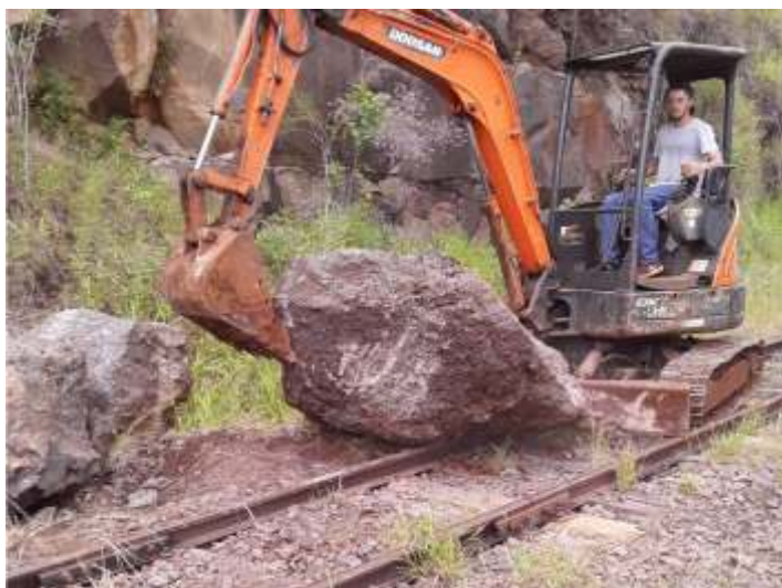
♦ Desobstrução da via entre Piratuba e Marcelino Ramos após a queda de barreiras.