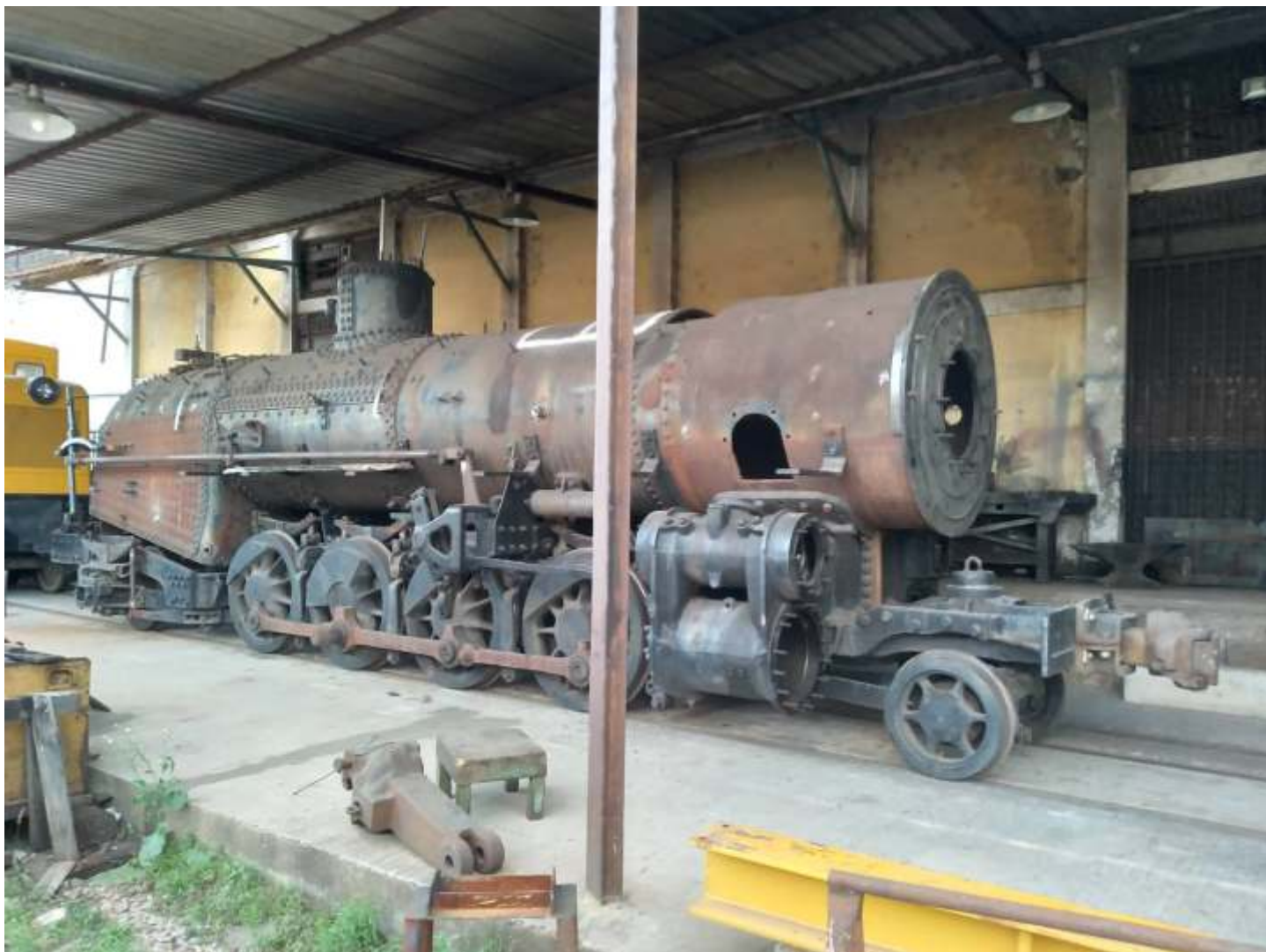
♦ A traseira do corpo longo da RSD8 em fase final de confecção. Resta agora fazer pequenos ajustes e acabamento.

Prosseguem os trabalhos na locomotiva a vapor ALCO nº 522 ex. RMV. As braçagens estão recebendo atenção, com limpeza pesada e preparação de novas buchas e pinos onde for necessário.