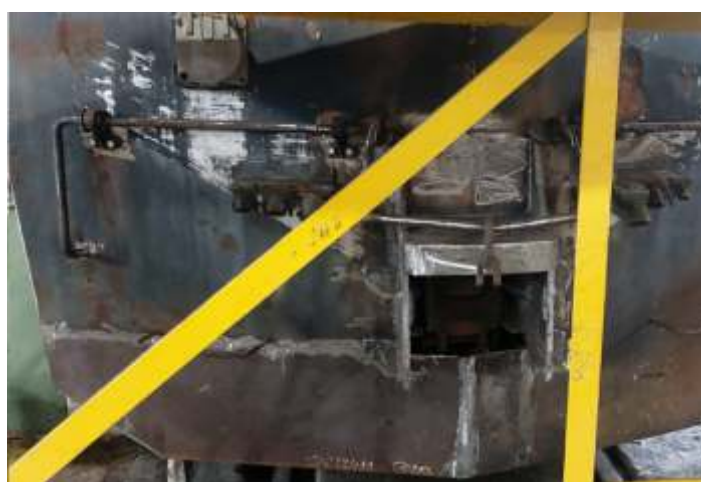
♦ Desmontagem e reconstrução do limpa-trilhos traseiro.