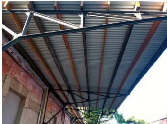
♦ Recuperação da plataforma de Carlos Gomes – Foto de Vanderlei Zago.

Os serviços de recuperação da estação de Carlos Gomes, continuam a pleno vapor, onde iniciamos a instalação do novo madeiramento e colocação das telhas galvanizadas. Parte da alvenaria do muro e sanitários também passam por reparação interna e externa. Em breve estará concluído em sua totalidade, iniciaremos a reconstrução de portas e batentes.