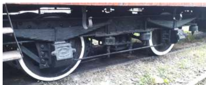
♦ Manutenção nos truques do carro nº 19.