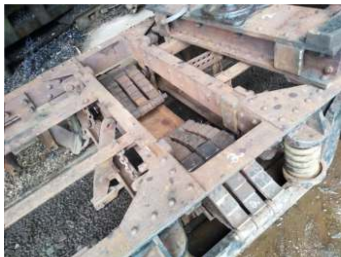
♦ Truque do Carro de Passageiros PD-43 desmontado para revisão geral.