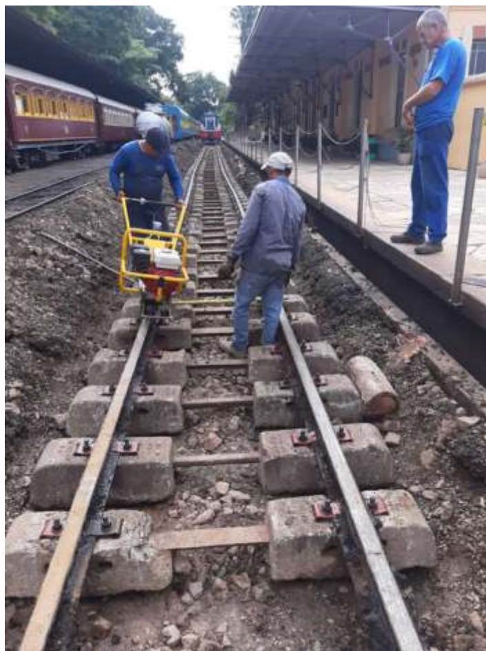
♦ Troca de dormentes na estação de Anhumas – Foto de Márcio Silva.

AABPF Regional de Campinas agradece a todos os seus colaboradores e associados que se dedicam as nossas atividades!