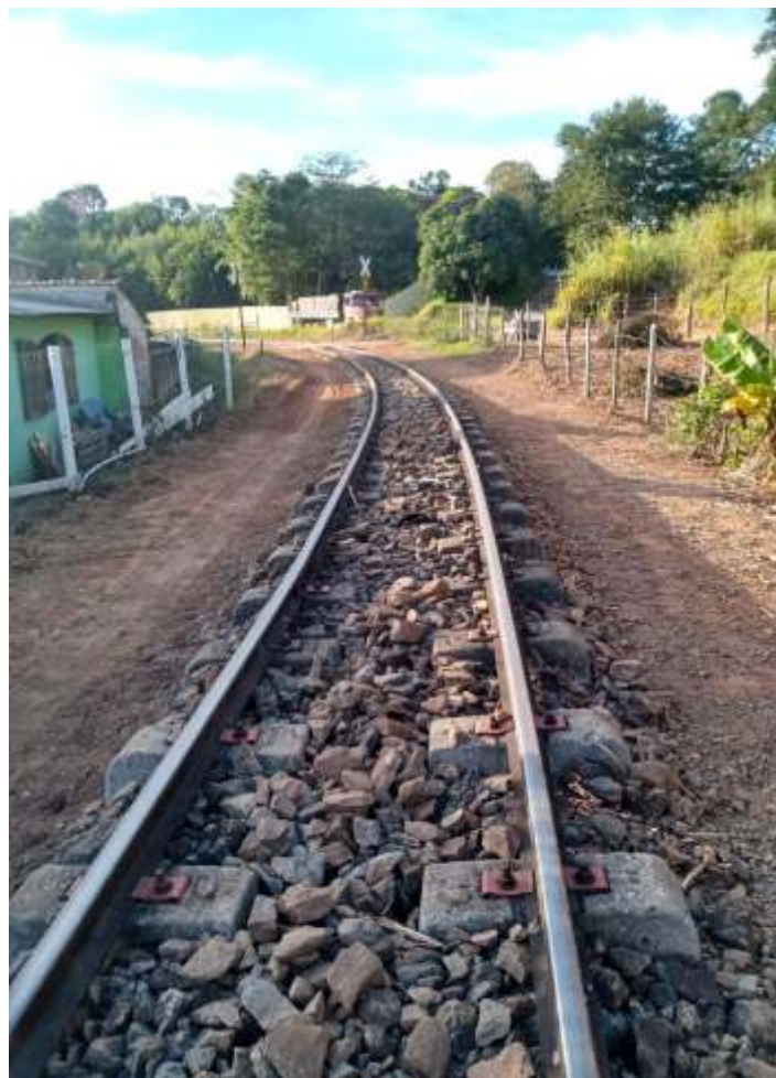
♦ Limpeza, alinhamento e nivelamento da via.