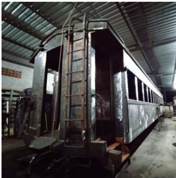
♦ Carro PC-60 já com a pintura externa removida.

Os trabalhos no carro de passageiros PC-60 estão se concentrando na restauração da funilaria, tanto externa quanto estrutural, trabalho que é feito de maneira majoritariamente manual, e acaba consumindo tempo considerável. Iniciamos a troca da chaparia metálica que compõe o teto, sendo trocadas a chaparia comprometida. Os pontos de ferrugem foram trocados e vedados, ficando para a parte final do mês, a remoção de toda a pintura. Em outra frente de trabalho, ainda no início do mês, fizemos a remoção dos truques, que foram totalmente desmontados, revisados e restaurados, já tendo sido instalados no carro.