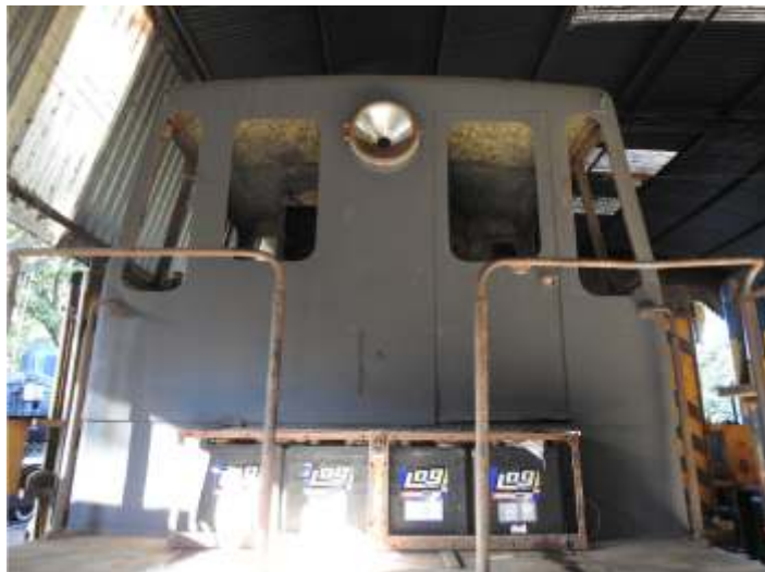
♦ Fundo primer concluído na 3104 – Foto de Vanderlei Zago.

Também ficou pronto a reforma do governador do motor diesel, feito na empresa Master Energy em Campinas.