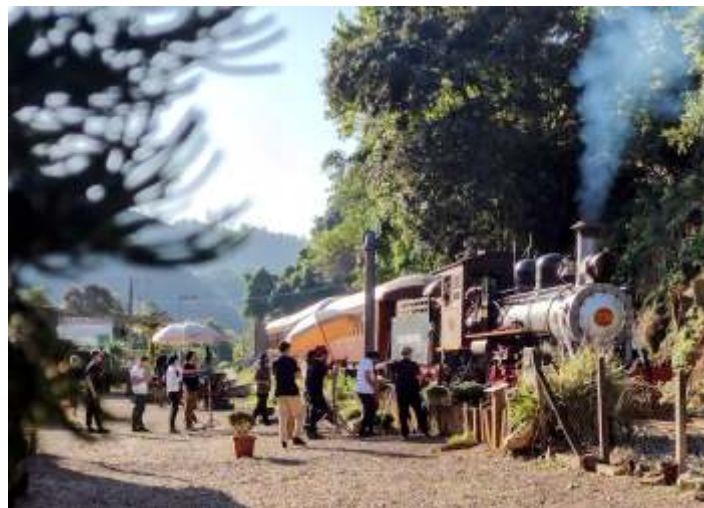
♦ A locomotiva 232 transformou-se numa das vedetes.