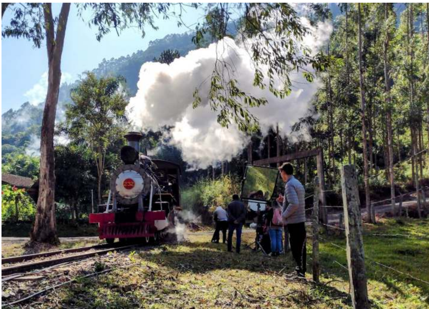
♦ Com o forte frio da manhã belíssimas imagens com vapor puderam ser realizadas.