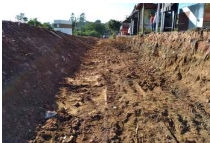
♦ Após anos soterrados, os trilhos reapareceram.