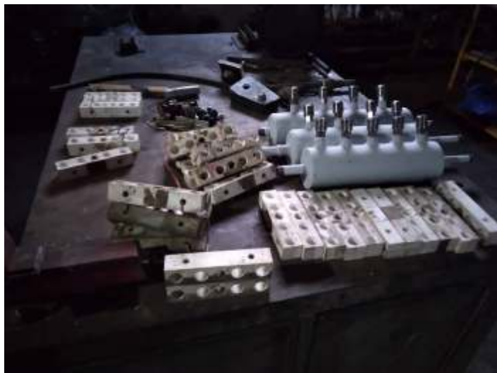
♦ Componentes da G12 sendo revisados.

Com a finalização por hora dos trabalhos nos componentes da ALCO RSD8, aproveitamos para trabalhar em alguns componentes da locomotiva EMD G12 4190.