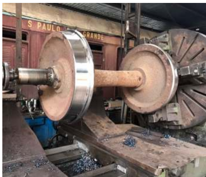
♦ Rodeiros do carro de passageiros PD-43 sendo torneados conforme perfil exigido.