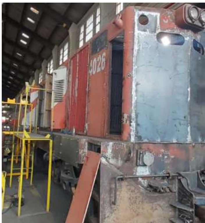
♦ Aspecto da cabeceira frontal já reconstruída.