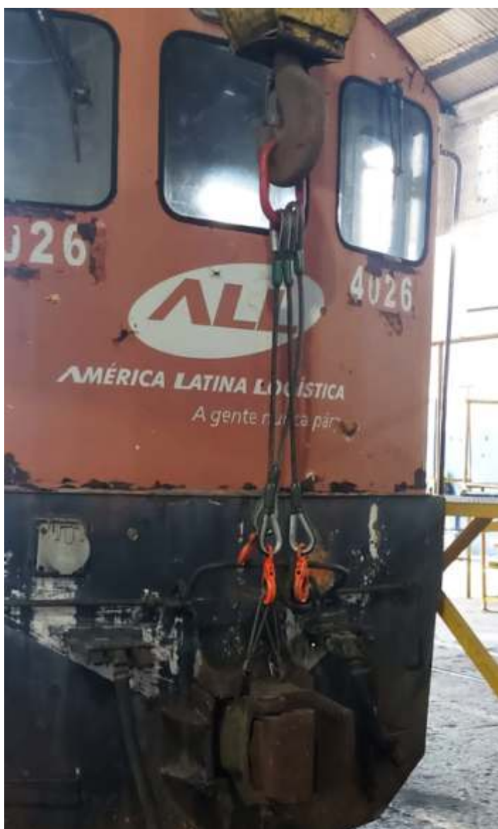
♦ Aspecto inicial da cabeceira traseira da locomotiva.