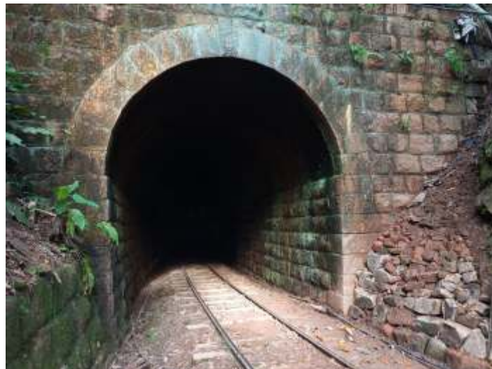
◆ Detalhe da via recuperada entrada do túnel. Autoria de Otávio Georg Junior.

O coordenador Otávio Georg Junior agradece a todos os associados e voluntários que se dedicaram às atividades de manutenção e operação do “Trem da EFSC” ao longo do mês de maio. A todos nosso “muito obrigado”.