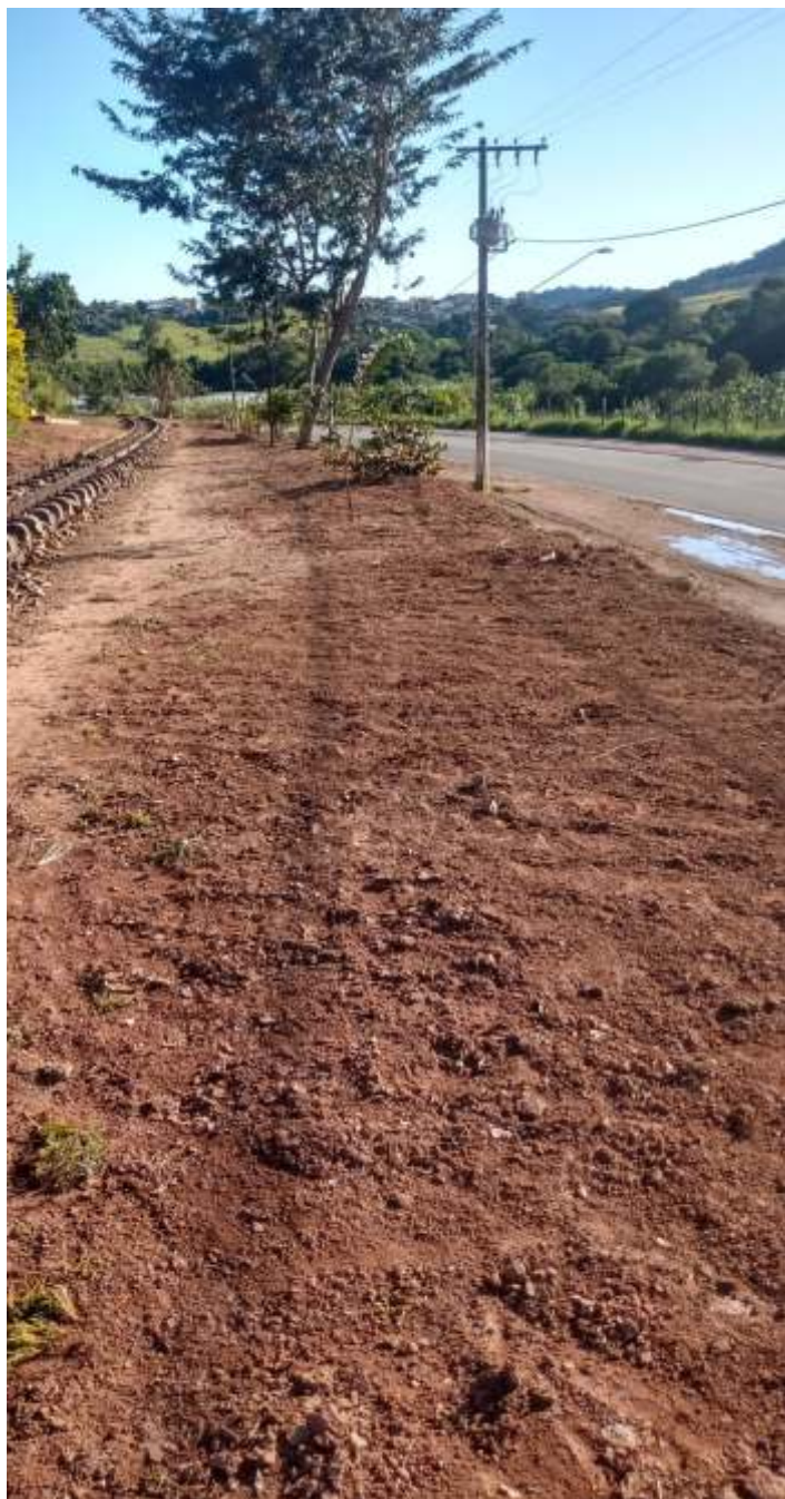
♦ Limpeza da faixa de domínio.

Seguem os trabalhos de manutenção e conservação da via e do material rodante. A via está sendo limpa, com capina e retirada de lixo. As saídas de água de vários boeiros e de drenagem da faixa de domínio foram corrigidas. Vários trechos foram nivelados e receberam complementação de lastro. A equipe está também realizando roçada da faixa de domínio.