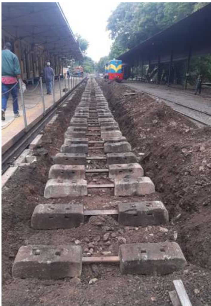
♦ Troca de dormentes na linha principal de Anhumas