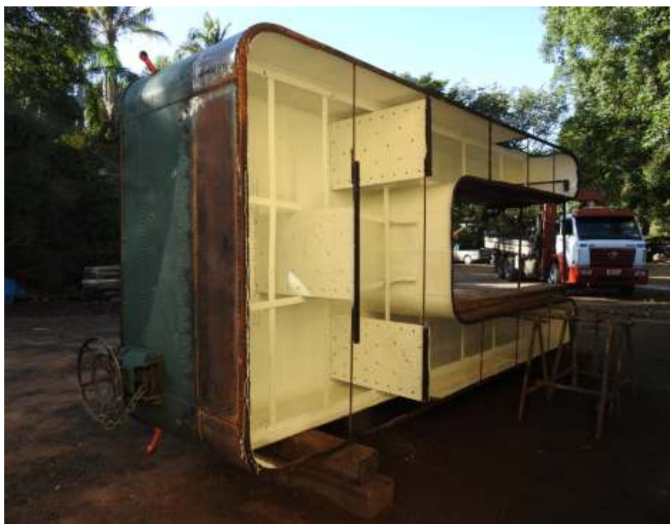
♦ Detalhe do interior do tender da 401 – Foto de Vanderlei Zago.

Nas oficinas prosseguem os trabalhos de recuperação da locomotiva 401, principalmente no tender, substituição de parte das chaparias e tratamento ante ferrugem nas partes que restaram sem substituir.