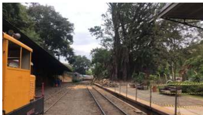
♦ Poda da seringueira na estação de Anhumas – Maurício Polli.

Na estação Anhumas foi feita a poda parcial da seringueira e posteriormente será retirado outros galhos que estão gerando riscos ao patrimônio.