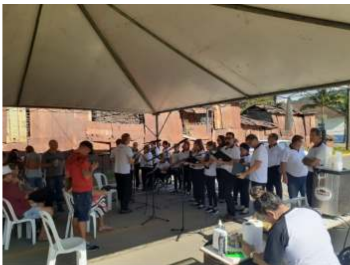
♦ Apresentação ao lado da Estação Ferroviária de Corupá em Recepção aos nossos passageiros.

Os passeios do Trem da Serra do Mar deste mês ocorreram em dois finais de semana. Sendo, a descida da Serra do Mar ocorrendo aos sábados, finalizando o retorno de subida aos domingos. Tivemos dias de passeio com clima mais frio, porém, com céu limpo e ensolarado, típicos para a época do ano, o que atraiu muitos entusiastas, que acompanharam o nosso trem ao longo da serra, fazendo diversas fotos e filmagens do passeio. Assim como nos passeios anteriores, na chegada à estação de Corupá, os nossos passageiros foram bem recepcionados e, assim como em outros passeios ao longo do ano, foi organizado um evento em frente à estação. Foram montadas tendas e houve apresentações de um Coral e de bandinhas com música ao vivo.