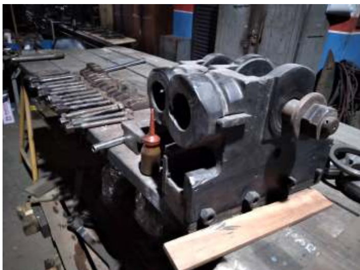
♦ Corte das novas chapas para a traseira da RSD-8.

O cabeçote do superaquecedor foi removido e está sendo trabalhado nas oficinas, com retífica de todos os alojamentos dos tubos da serpentina.