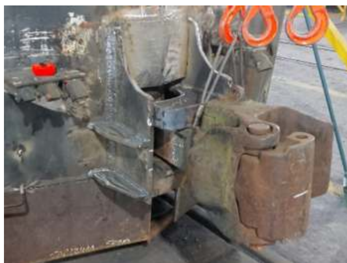
♦ Reconstrução do limpa-trilhos da locomotiva.