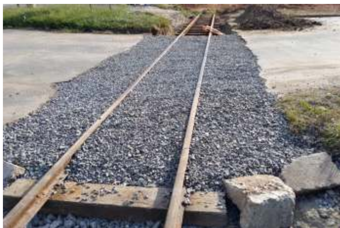
♦ Via já recuperada chegando ao local. Dormentes da pn foram trocados e a via nivelada e alinhada.