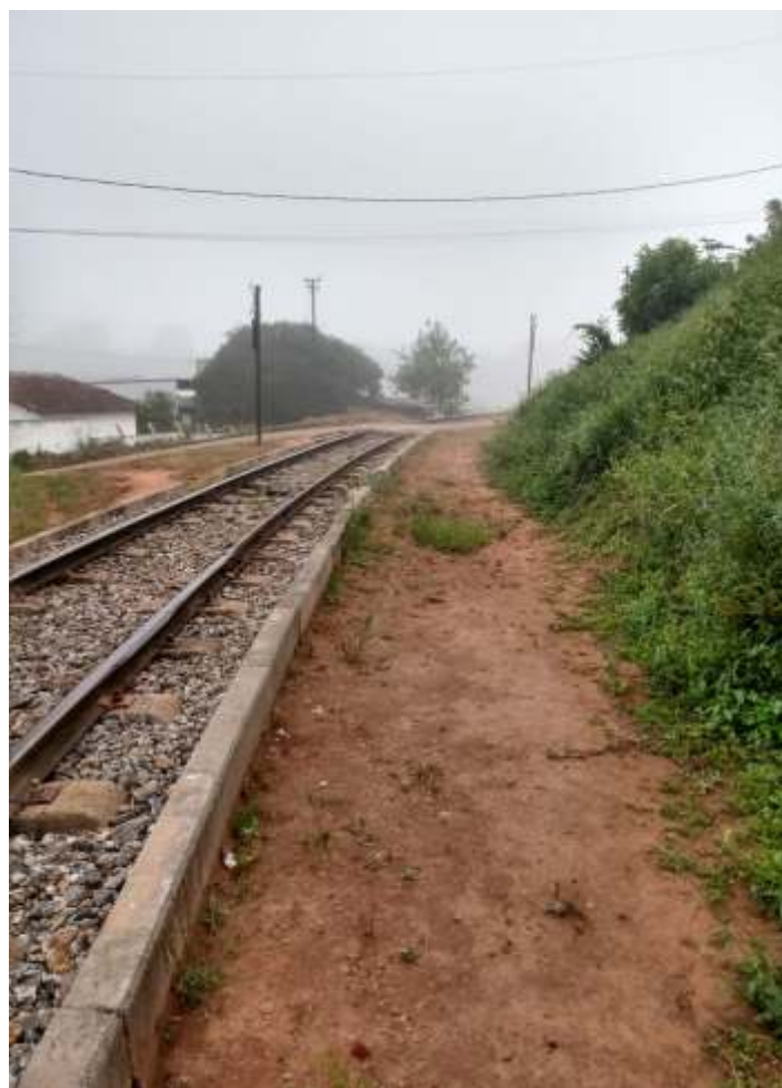
♦ Limpeza da faixa de domínio.