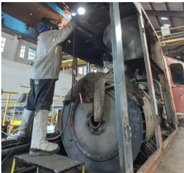
♦ Processo de desmontagem para revisão, da locomotiva EMD – GL8 nº 4026.