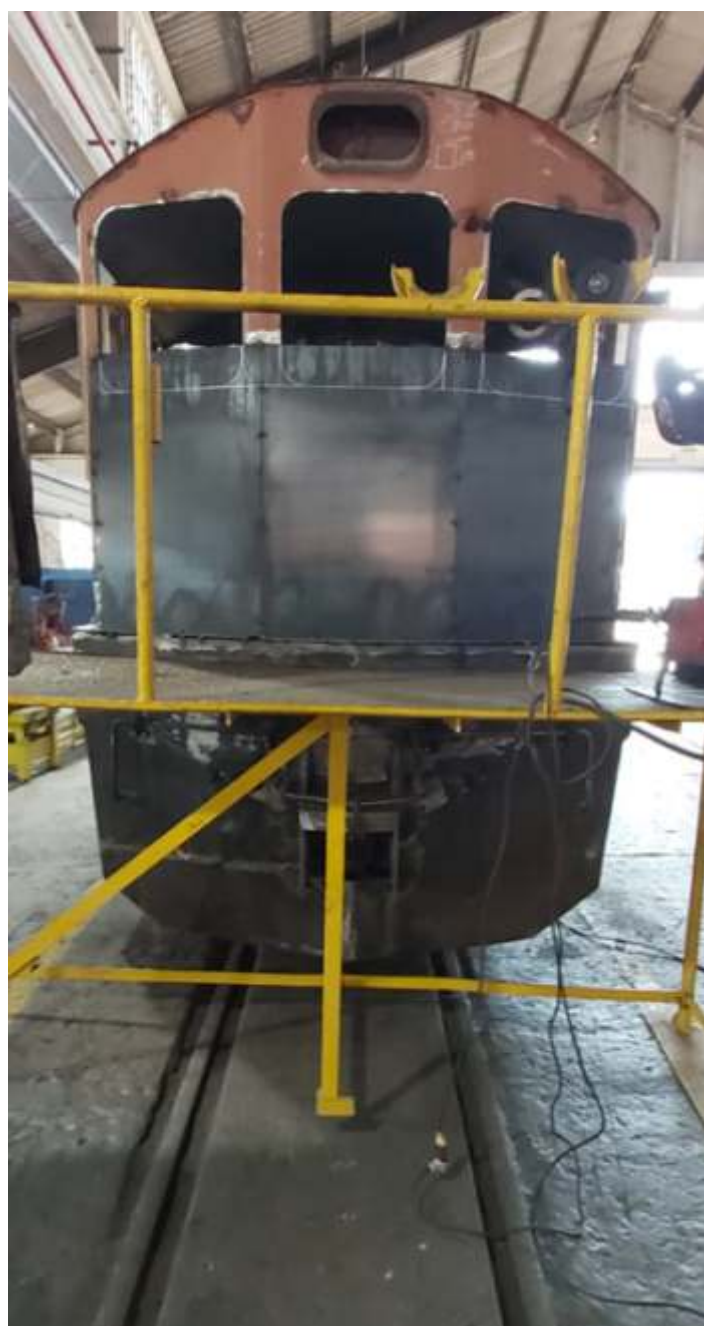
♦ Reconstrução da cabeceira traseira da locomotiva.