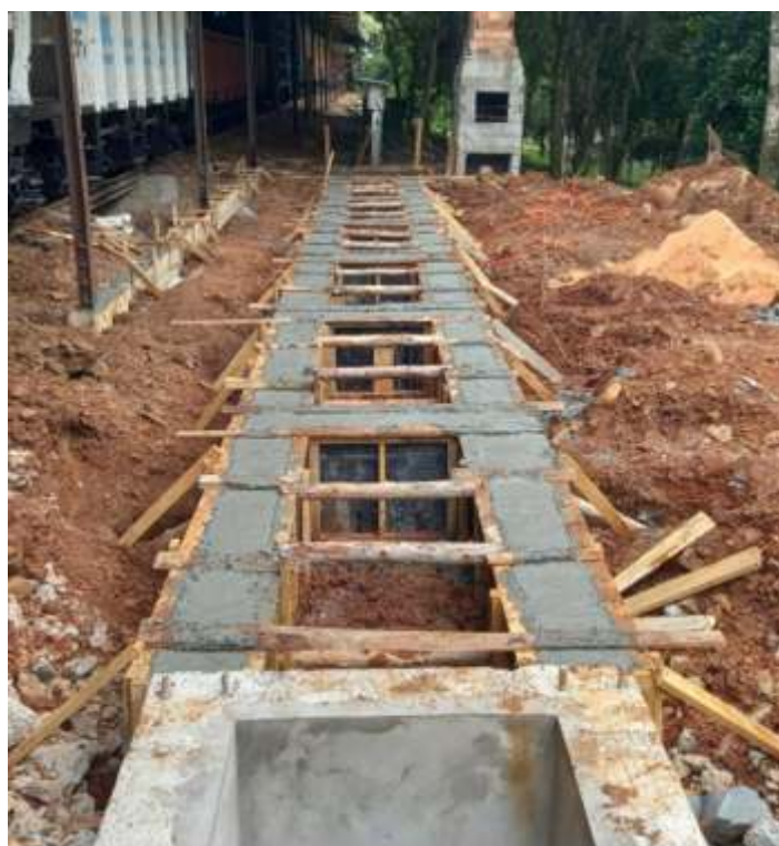
♦ Construção da Vala de Manutenção no pátio da estação de Piratuba.