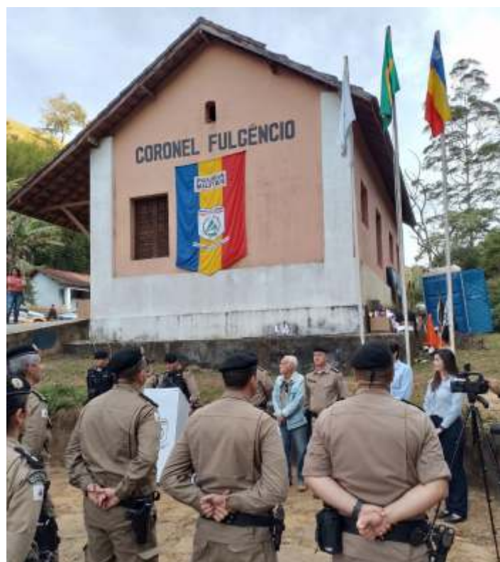
◆ Cerimônia na estação Coronel Fulgêncio.

Além de apoiar a principal força de segurança do estado, a ABPF pôde participar desse ato tão simbólico de rememoração da Revolução Constitucionalista de 1932, que está completando 90 anos, um capítulo significativo da história que teve como um de seus principais palcos o alto da Serra da Mantiqueira e a ferrovia.