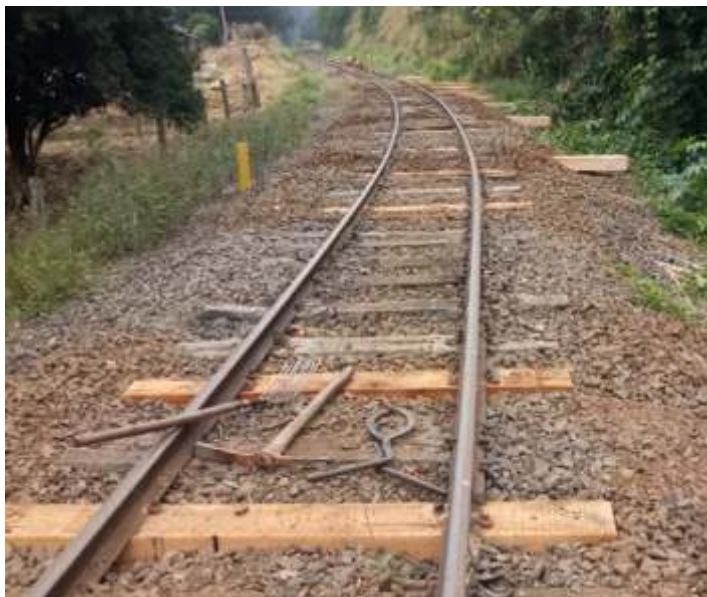
♦ Troca de dormentes na via permanente entre Piratuba e Marcelino Ramos.

Em outra frente de trabalhos, continuamos os trabalhos de construção da nova vala de manutenção de locomotivas e vagões. Localizada em uma linha desviada no pátio da Estação Ferroviária de Piratuba, a vala faz parte da futura oficina de manutenção do nosso material rodante, que será construída nas imediações da estação ferroviária. O jardim da Estação Ferroviária de Piratuba também recebeu algumas melhorias, foram plantadas flores e plantas ornamentais, de maneira a tornar mais agradável e aconchegante, a recepção dos turistas ao nosso passeio.