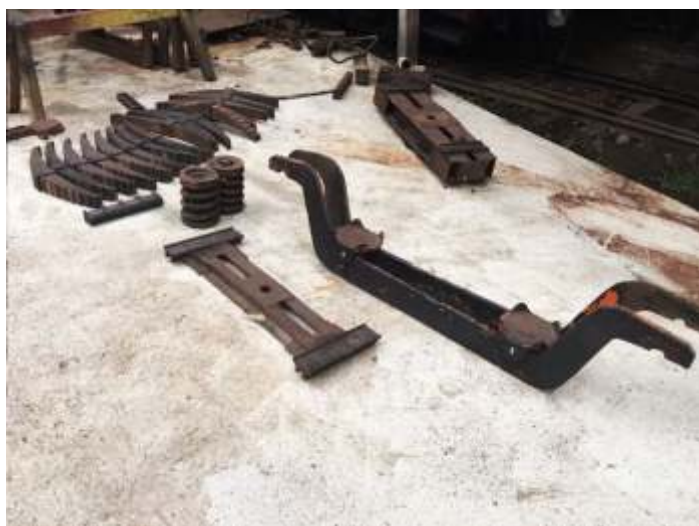
♦ Truque do Carro de passageiros PC-60 desmontado para revisão geral.