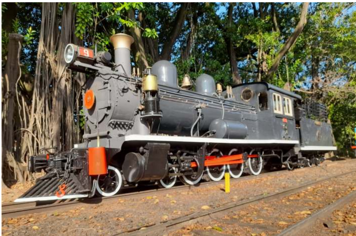
♦ Locomotiva 9 em Carlos Gomes.