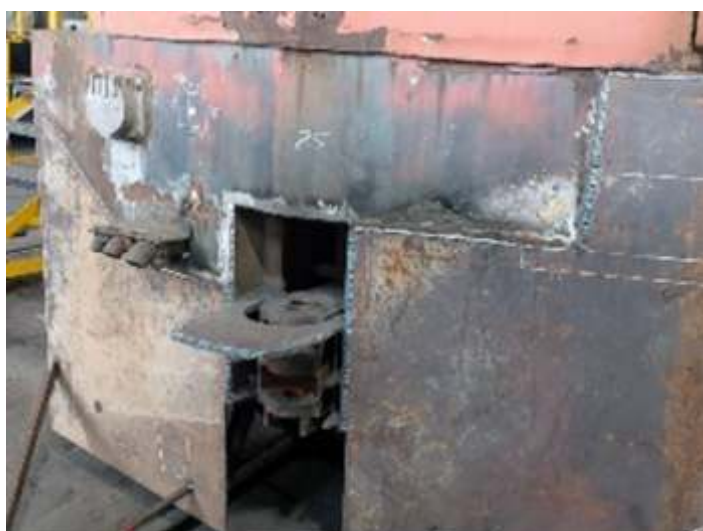
♦ Desmontagem e reconstrução do limpa-trilhos frontal.