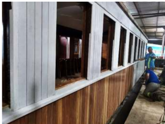
♦ Carro de Passageiros PD-43 durante o processo de pintura.