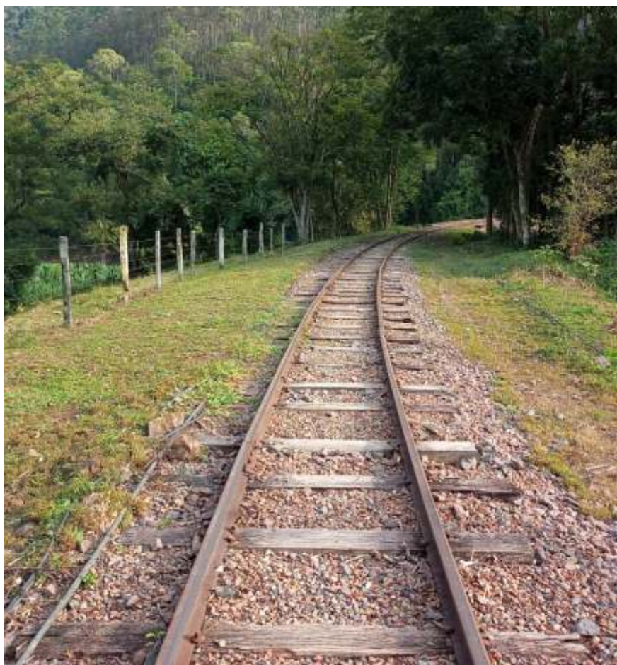
◆ Via recuperada nas proximidades do viaduto/ponte de dois arcos. Autoria de Otávio Georg Junior.

Em Rio do Sul , na estação de Matador, encontra-se depositado parte do material rodante do NuRVI, ainda por restaurar, bem como o museu estático e fotográfico relativo aos fatos históricos que marcaram a EFSC no Alto Vale do Itajaí. A estação se situa no Beco Artur Hering – Nº 50, bairro Bela Aliança de Rio do Sul.