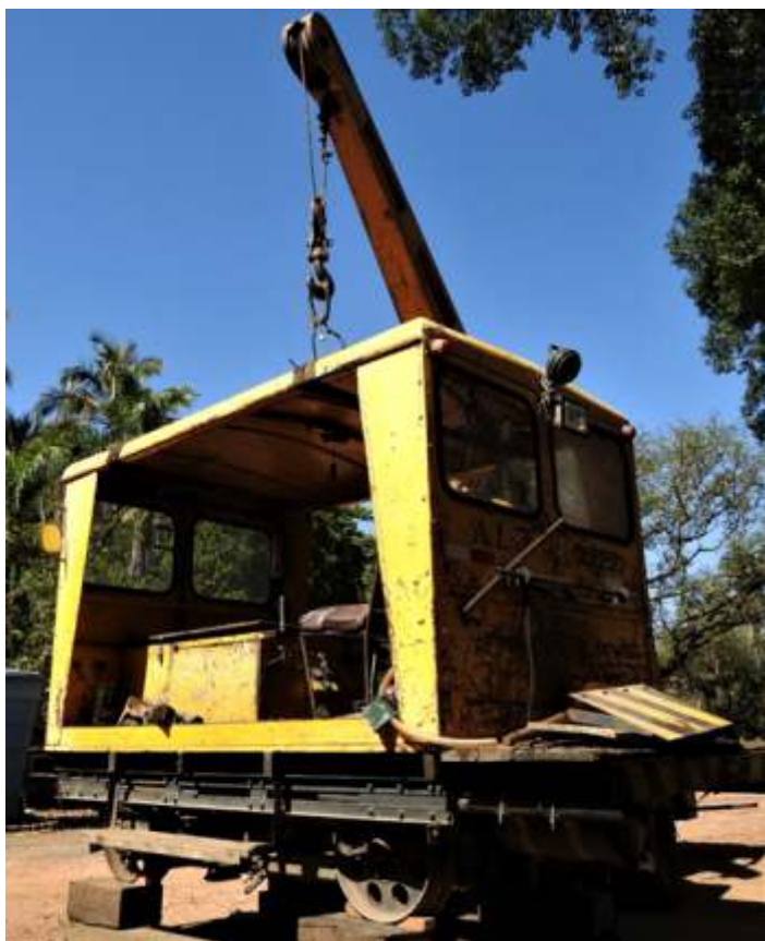
♦ AL-3 suspenso para troca de rolamento de rodas.

Os trabalhos de via permanente concentram-se no término da troca de dormentes nas linhas do pátio de Anhumas. A linha 3 também será aumentada em mais 150 metros, voltando o AMV em seu lugar original. Após a conclusão da troca dos dormentes, será aplicada uma camada de brita nova.