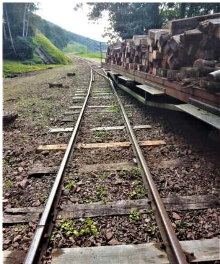
◆ Sobre o vagão prancha os dormentes substituídos agora destinados ao abastecimento da fornalha da 232.