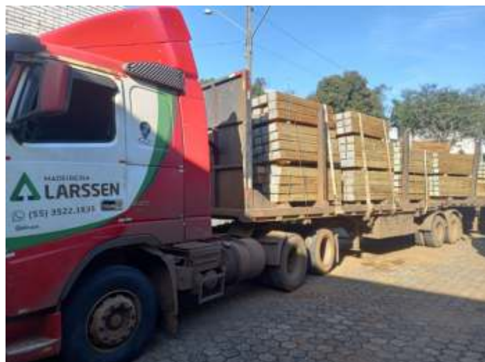
♦ Recebimento de novos dormentes da Concessionária Rumo Logística.

Em outra frente de trabalhos, demos continuidade aos trabalhos de troca de dormentes e nivelamento da via permanente entre Piratuba e Marcelino Ramos. Este trabalho, feito em parceria com a Concessionária Rumo Logística, vem se estendendo ao longo dos últimos meses, sendo os dormentes utilizados procedentes de doação da concessionária da ferrovia. Neste mês, recebemos um lote com 600 dormentes novos, para que possa ser dada continuidade à troca dos dormentes, o que deve acontecer ao decorrer dos meses seguintes.