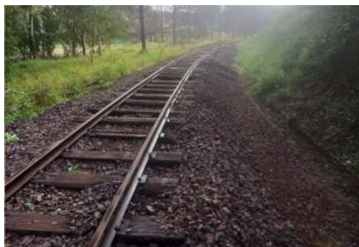
♦ Substituição de dormentes e nivelamento da ferrovia.