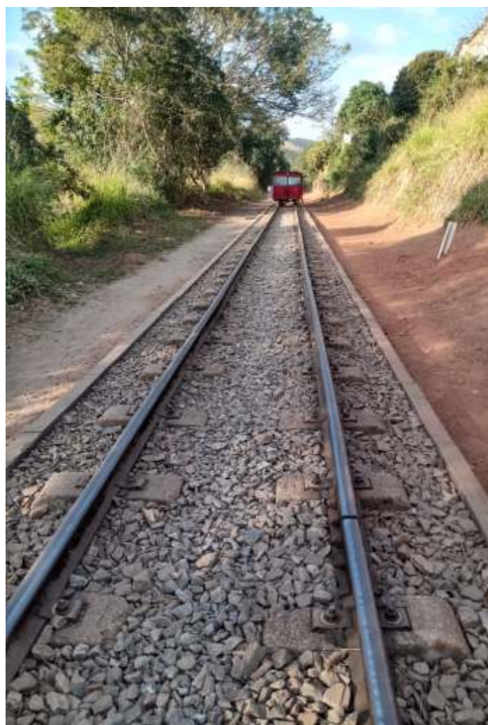
♦ Limpeza da faixa de domínio.

Seguem os trabalhos de manutenção e conservação da via e do material rodante. A via está sendo limpa, com capina e retirada de lixo. As saídas de água de vários boeiros e de drenagem da faixa de domínio foram corrigidas. Vários trechos foram nivelados e receberam complementação de lastro. A equipe está também realizando roçada da faixa de domínio.