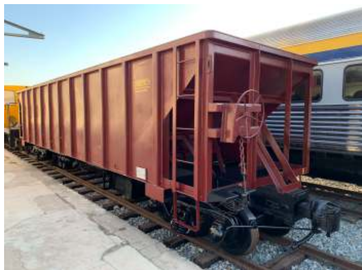
◆ Um antes e depois do vagão hopper.

Seguem os trabalhos na locomotiva ALCO RSD8. Os trabalhos de pintura tiveram que ser interrompidos pois foi identificada uma falha no motor diesel: uma das camisas apresentou vazamento, com passagem de água para o interior do cilindro.