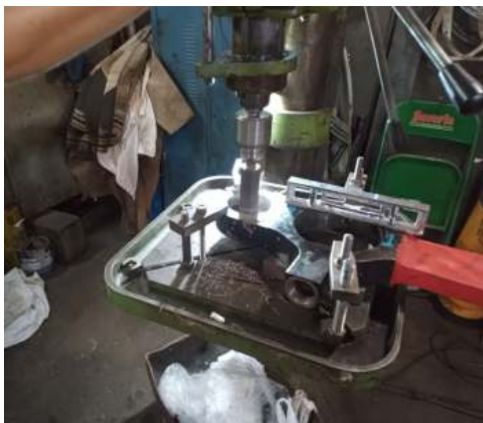
♦ Detalhe da usinagem do furo da braçagem – Foto Helio Gazetta.