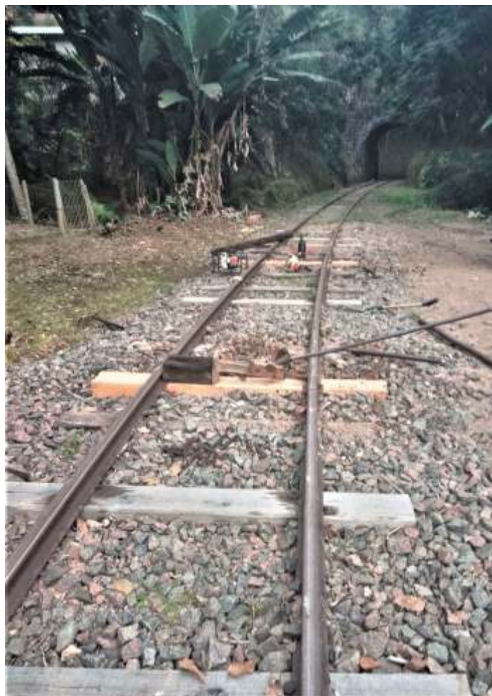
◆ Troca de dormentes e nivelção em direção à passagem superior em arco. A autoria de Jefferson Dhein.