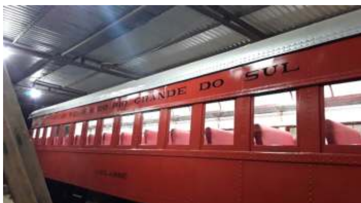
♦ Aspecto final da pintura das inscrições do carro de passageiros PC-60.