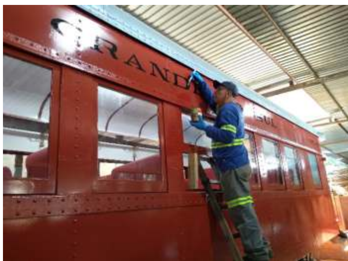
♦ Aspecto inicial da pintura dos letreiros no carro de passageiros PC-60.