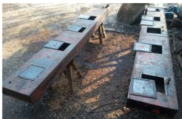
♦ Tanques de combustível da locomotiva GE, abertos para limpeza interna.

Também prosseguem os trabalhos de recuperação dos compressores de ar de locomotivas a vapor e continuam os trabalhos de recuperação e montagem da GE 3104 da Sorocabana e que terá a pintura da Fepasa em vermelho.