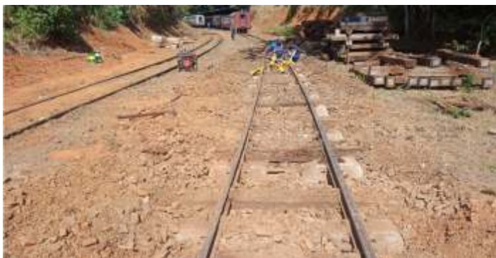
♦ Serviço de troca de dormentes em Anhumas.

Os trabalhos de via permanente concentram-se no término da troca de dormentes nas linhas do pátio de Anhumas. A linha 3 também será aumentada em mais 150 metros, voltando o AMV em seu lugar original. Após a conclusão da troca dos dormentes, será aplicada uma camada de brita nova.