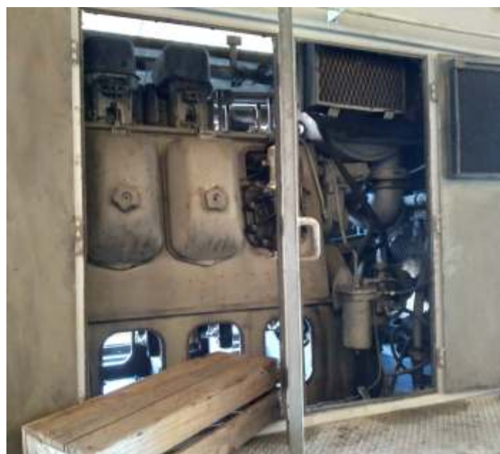
◆ Trabalhos no motor diesel da ALCO RSD8.

A equipe está trabalhando na recuperação do motor, com trabalhos no bloco e na camisa. Foi identificada corrosão no bloco e está sendo realizado um trabalho de preenchimento com solda, efeitos também dos longos anos de trabalho na baixada, onde estava exposta à maresia. Já a camisa será retificada. Esperamos em breve conseguir resolver esse problema para voltarmos aos trabalhos de acabamento da locomotiva.