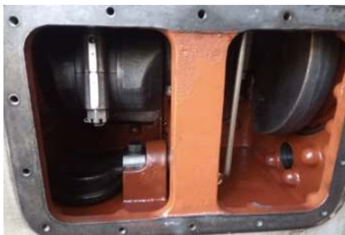
♦ Detalhe do lado interno do compressor 2 CD