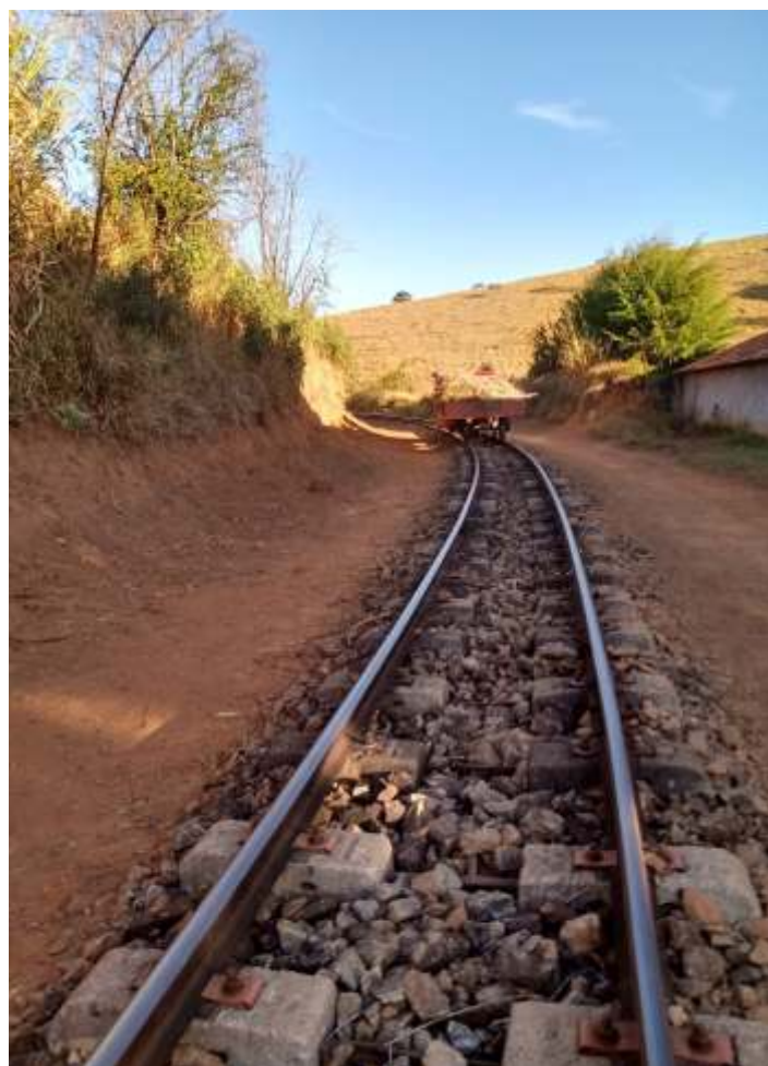
♦ Limpeza da faixa de domínio.