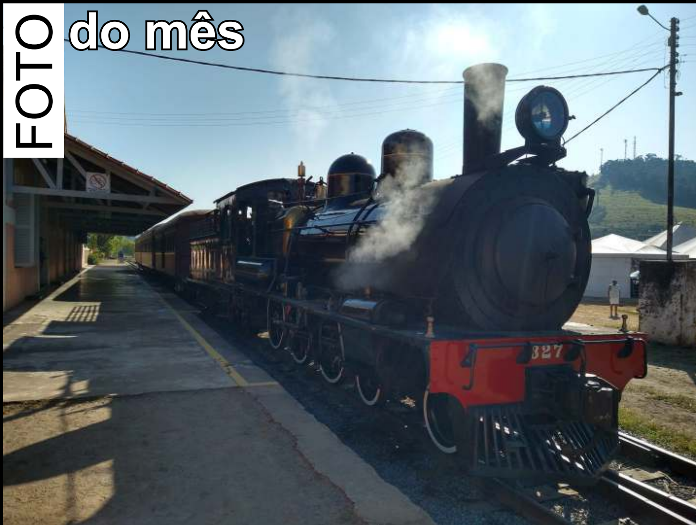
♦ A 327 pronta para partir com o Trem da Serra da Mantiqueira da estação de Passa Quatro.

Todo mês selecionaremos uma foto relacionada ao trabalho da associação publicada no grupo ABPF - Oficial no Facebook para publicar aqui.