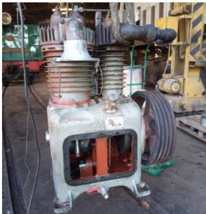
♦ Compressor 2CD da locomotiva 3104, após lavagem interna e externa