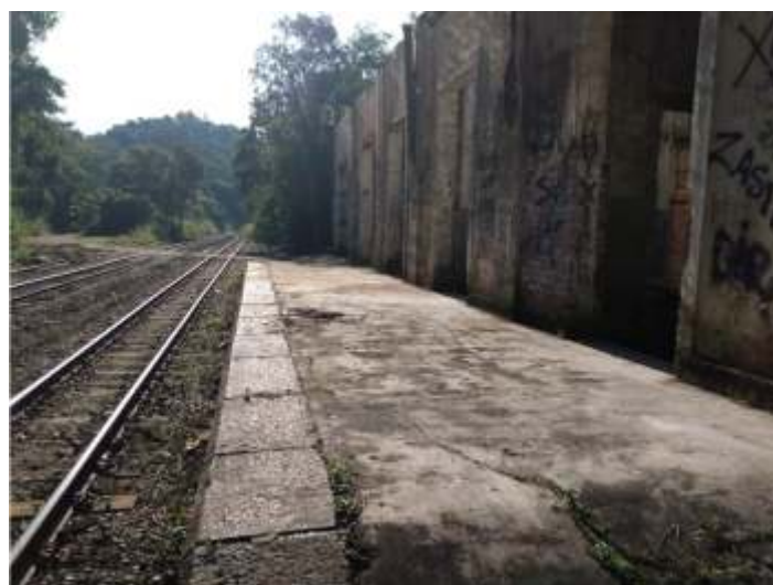
◆ Aspecto da Estação Ferroviária de Rio Natal após limpeza da vegetação local.