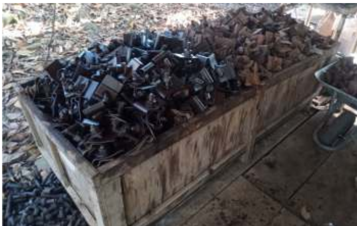
♦ Fixações tipo RN, recebidas da Regional Sul Minas, sendo preparadas para revisão e amaciamento do parafuso.