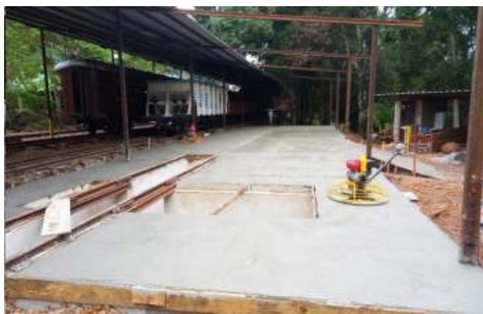
♦ Concretagem e nivelamento da calçada da vala de manutenção

Em outra frente de trabalhos, demos continuidade aos trabalhos de troca de dormentes e nivelamento da via permanente entre Piratuba e Marcelino Ramos. Este trabalho, feito em parceria com a Concessionária Rumo Logística, vem se estendendo ao longo dos últimos meses, sendo os dormentes utilizados procedentes de doação da concessionária da ferrovia. Neste mês, recebemos um lote com 600 dormentes novos, para que possa ser dada continuidade à troca dos dormentes, o que deve acontecer ao decorrer dos meses seguintes.