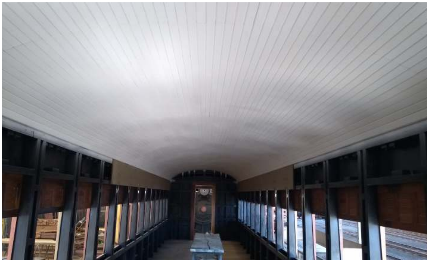
♦ Instalação do forro do teto do carro SD-22, já com a primeira demão de pintura.