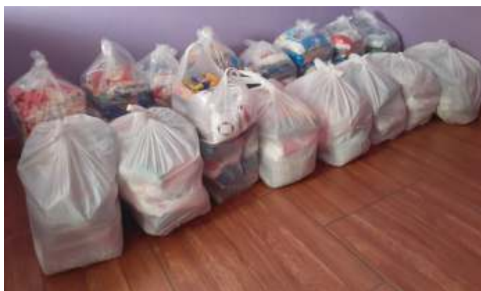
♦ Formação de cestas básicas para comunidades carentes.

Os alimentos arrecadados através dos ingressos solidários, são selecionados e distribuídos em cestas básicas, que são doados às comunidades carentes ao longo da ferrovia, nas regiões de Anhumas e Tanquinho.