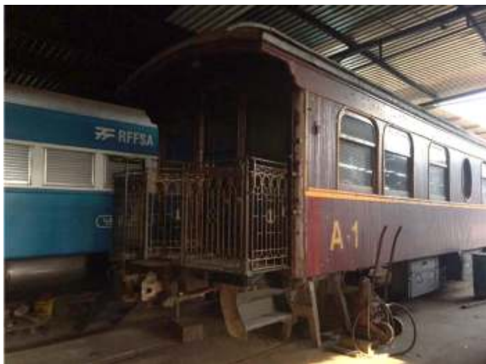
♦ Instalação de DDV no carro administrativo AM-01.