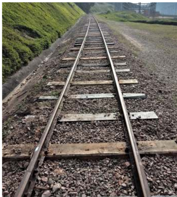
◆ Troca de dormentes realizada em subida às instalações da hidrelétrica. A autoria Jefferson Dhein.