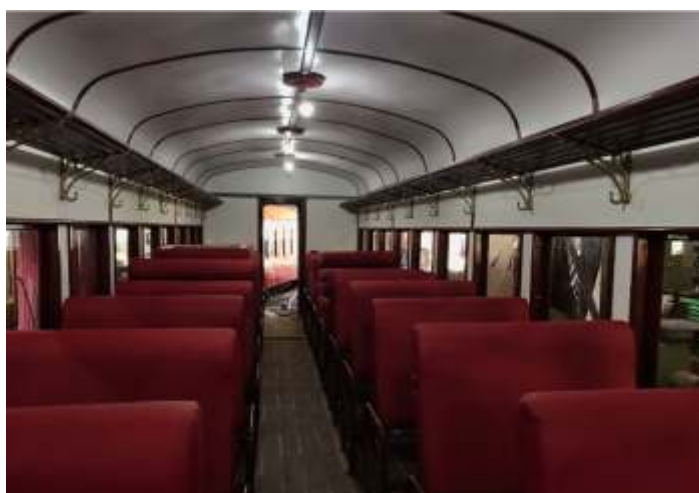
♦ Poltronas já instaladas no carro de passageiros PC-60.