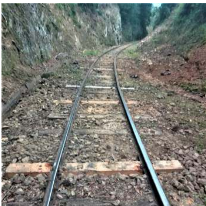
◆ Troca de dormentes e nivelção realizada ao longo do corte.