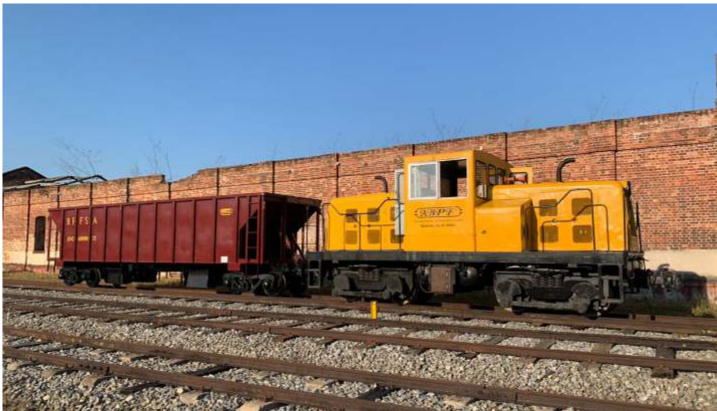
◆ O hopper junto com a GE: essa composição passará a ser vista ao longo do trecho, transportando lastro.