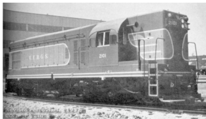
♦ Esquema de pintura original da locomotiva, conforme padrão EMD.