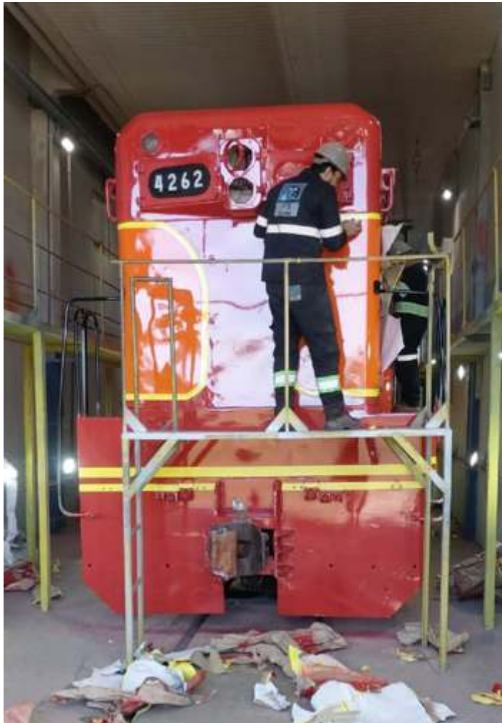
♦ Fase de pintura da locomotiva EMD G12 n° 4262.