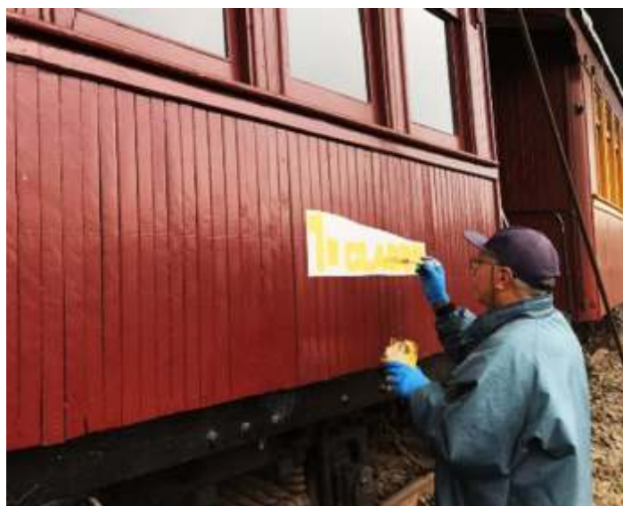
♦ Aspecto inicial da pintura dos letreiros no carro de passageiros PD-47.