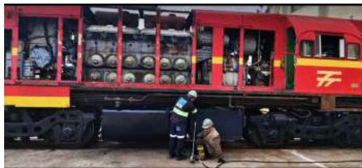
♦ Processo de revisão da locomotiva nas oficinas mecânicas da Concessionária Rumo Logística.