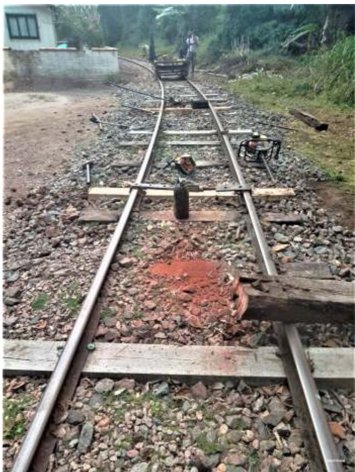
◆ Troca de dormentes e rebitolamento no trecho entre a ponte/viaduto de dois arcos e a passagem superior em arco.