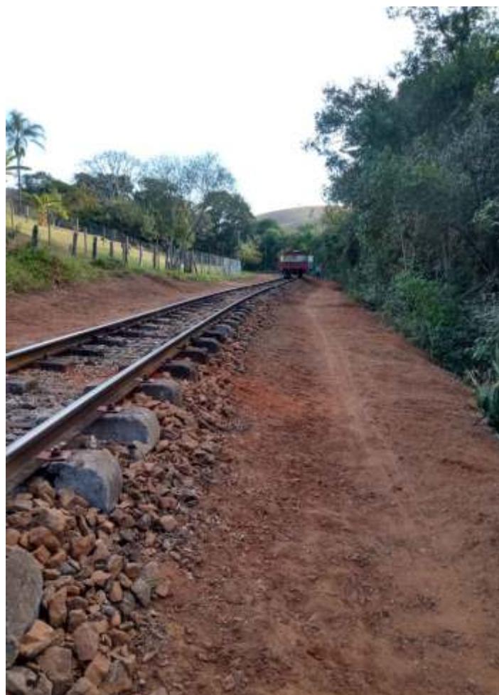
♦ Limpeza, alinhamento e nivelamento da via.