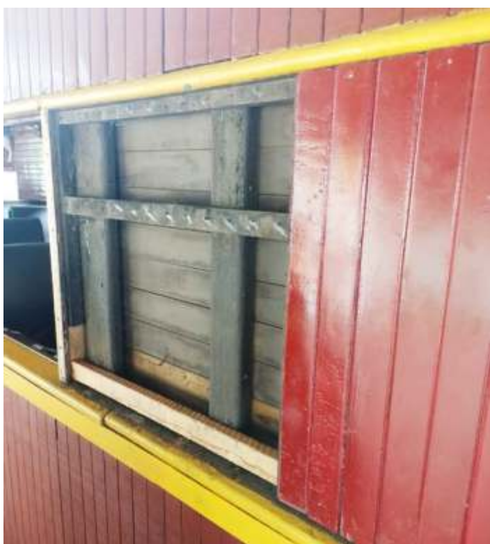
♦ Obras de melhorias no carro de passageiros SD-38.