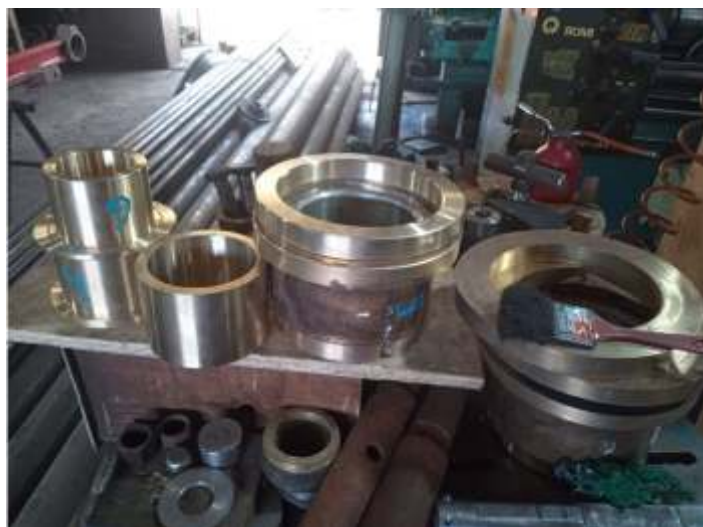
♦ Várias peças da locomotiva 9 já prontas!