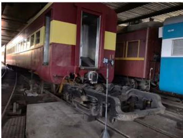
♦ Carro de passageiros PC – 59 içado para revisão do truque e usinagem de rodeiro.

Em uma terceira frente de trabalho, foi finalizado o processo de revisão em nossa locomotiva EMD G12, nº 4262. A manutenção foi feita nas Oficinas da Rumo Logística em Curitiba, sendo os trabalhos realizados compreendendo-se na limpeza e troca de partes do motor; troca de camisas e outras partes móveis. A parte de funilaria passou por melhorias, com o despenamento das portas e maçanetas. No interior, os componentes elétricos da locomotiva também foram totalmente revisados, assim como os truques, que foram removidos, desmontados e revisados. Após a conclusão dos trabalhos, foi dado início ao processo de pintura.