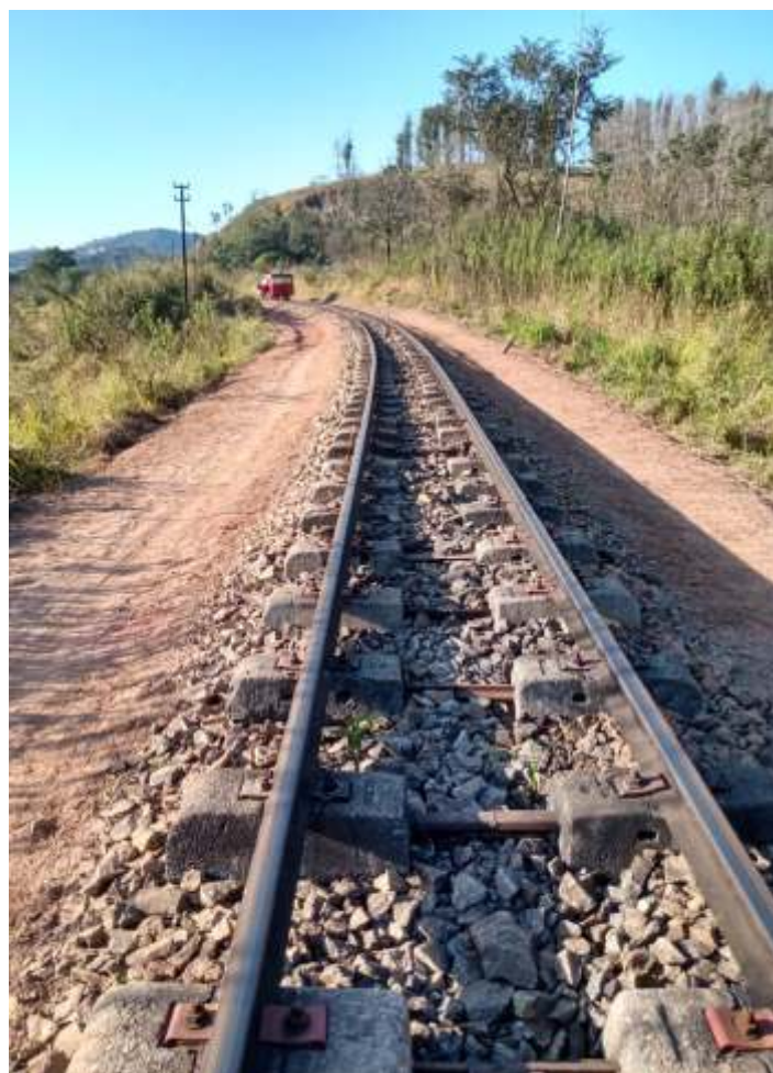
♦ Limpeza, alinhamento e nivelamento da via.