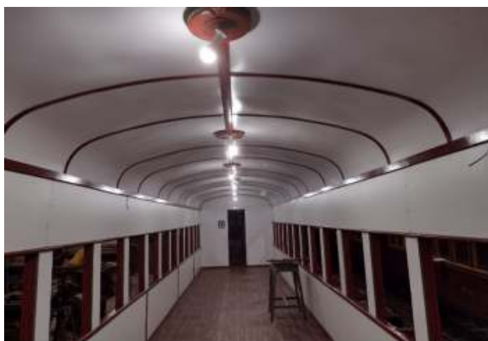
♦ Interior do carro PC-60, já com Decoflex instalado.