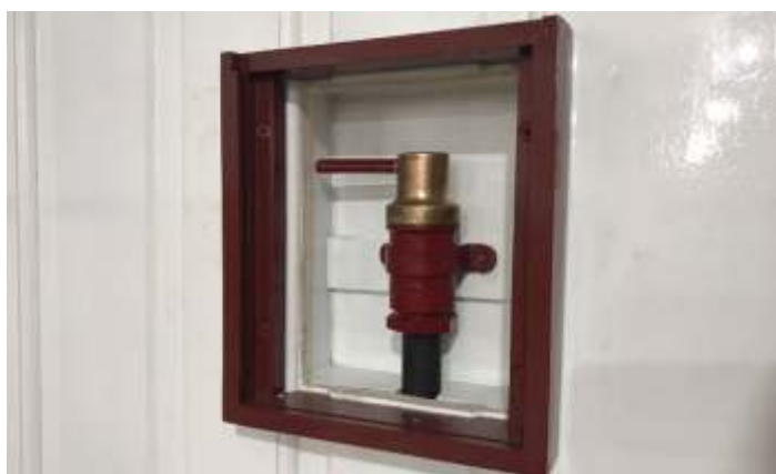
♦ Instalação das peças em bronze no carro de passageiros PC-60.