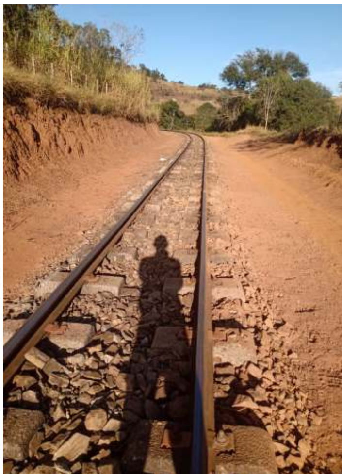
♦ Limpeza da faixa de domínio.