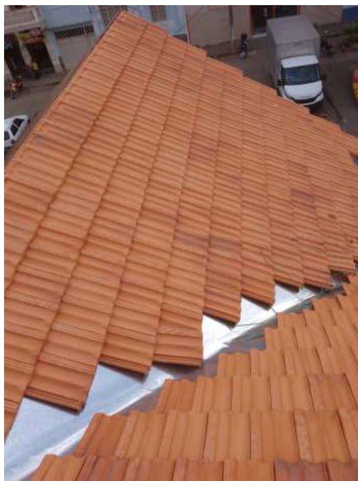
♦ Instalação de novas telhas e calhas.