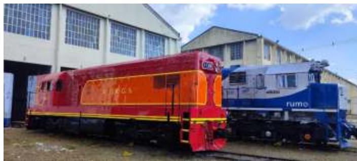
♦ Locomotiva EMD G12 n° 4262 já com a pintura finalizada ainda nas oficinas da Concessionária Rumo Logística.