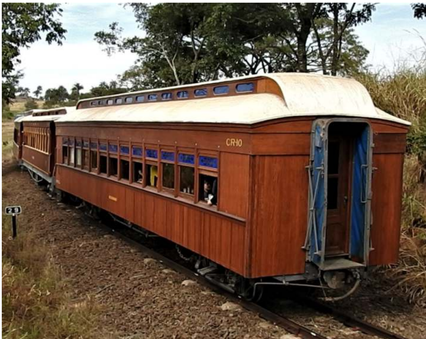
♦ Antigo carro R-1 da Mogiana, no trem servindo o café da manhã.

E termina o mês de julho com um bom número de visitantes no trem Campinas a Jaguariúna. Operamos o mês com duas composições, uma partindo de Anhumas e outra de Jaguariúna, fazendo a baldeação em Tanquinho, bem como a inserção do carro restaurante R-1 da Mogiana no trem de Jaguariúna, com o café da baronesa, o qual foi um sucesso!