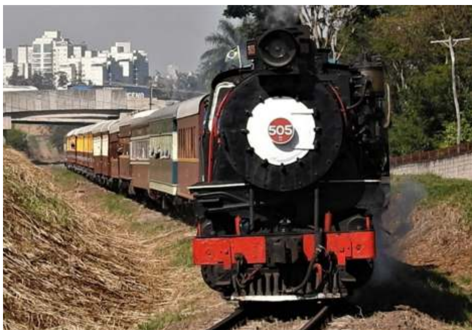
♦ Locomotiva 505 liderando trem para Jaguariúna – Foto de Vanderlei Zago.

Como a 215 e 604 estão em operação, decidimos melhorar mais ainda a locomotiva 9, refazendo todos os mancais de bronze das braçagens. Com isso a locomotiva ficará em excelentes condições de operação. Todo o trabalho está sendo feito pela equipe própria da oficina de Carlos Gomes.