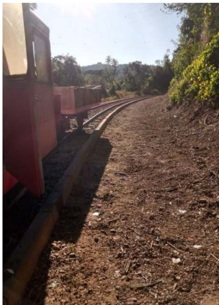
♦ Limpeza da faixa de domínio.