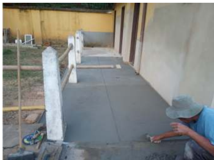
♦ Reformas dos sanitários em Carlos Gomes.

Em Carlos Gomes, continuamos com os serviços de reforma dos sanitários masculino e feminino, onde estamos fazendo a substituição do piso e revestimento, bem como das tubulações de água e esgoto.