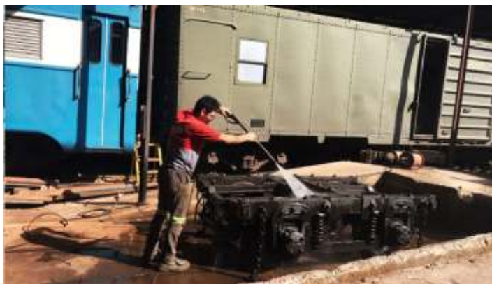
♦ Limpeza dos truques do carro administrativo AM-01 para revisão e futura instalação de DDV.

Em uma outra frente de trabalhos, foi dada continuidade à instalação dos detectores de descarrilamentos (DDV) nos carros administrativos AM-01 e AD-09. Os truques destes carros, antes de receberem o DDV, foram desmontados e passaram por revisão geral, sendo já na sequência, remontados e instalados nos carros. Aproveitando este momento de revisão de truques, o carro de passageiros PC-49, antigo P-108, da Estrada de Ferro Leopoldina, também teve seus truques retirados, para usinagem dos seus quatro rodeiros.