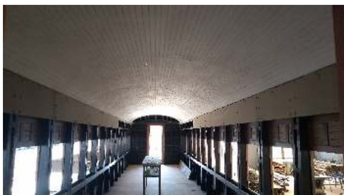
♦ Aspecto da parte interna, já com forro no teto.