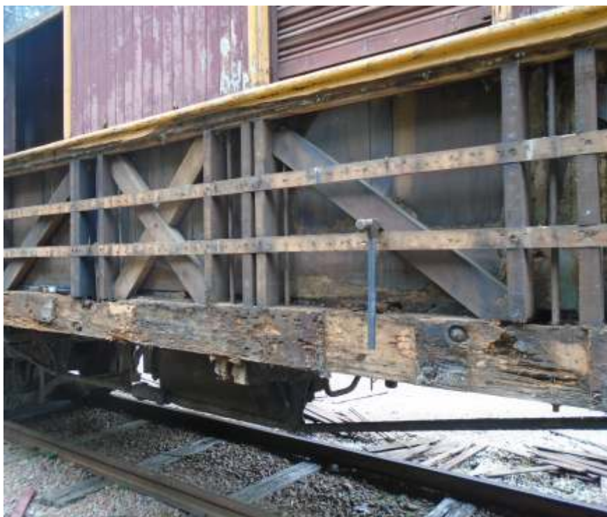
♦ Situação do carro AM6- lado direito, 1ª foto, e lado esquerdo com o detalhe da viga de sustentação que precisará ser trocada.