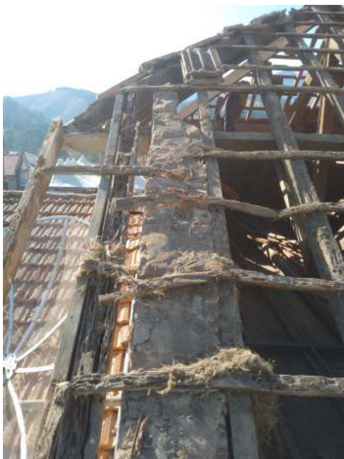
♦ Passageiros abordo do trem.