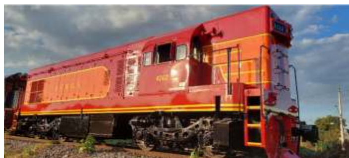
♦ Nossa Locomotiva EMD G12 na saída do pátio de Pinhais após os testes pós-reforma.