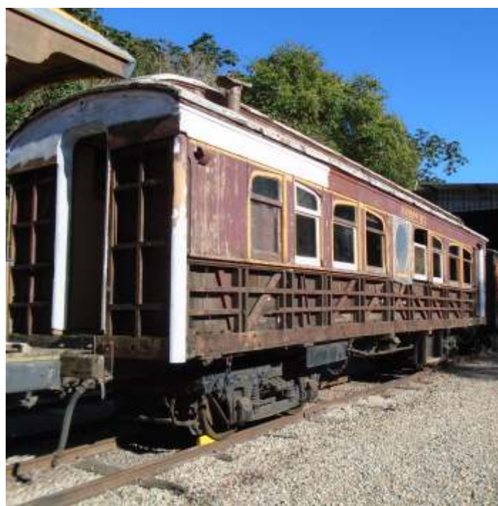
◆ Situação do carro AM6- lado direito, 1ª foto, e lado esquerdo com o detalhe da viga de sustentação que precisará ser trocada. Autoria de Luiz Carlos Henkels.

Outro carro que está tendo os primeiros cuidados é o passageiro SD56, que na EFSC tráfegará como P2. Este carro já está com a caixa parcialmente restaurada, trabalho realizado em Rio do Sul por patrocínio do empresariado. Como não está ao abrigo, está recebendo a primeira mão de tinta fundo, objetivando a proteção, bem como foi coberto com lona anti-chamas. Infelizmente este carro está com a parte mecânica e rodante totalmente fora dos padrões operacionais, visto que teve seus truques de rodagem alterados. Os atuais precisam ser adaptados ou mesmo substituídos, isto sem falar do sistema de frenagem que também precisará de adaptações.