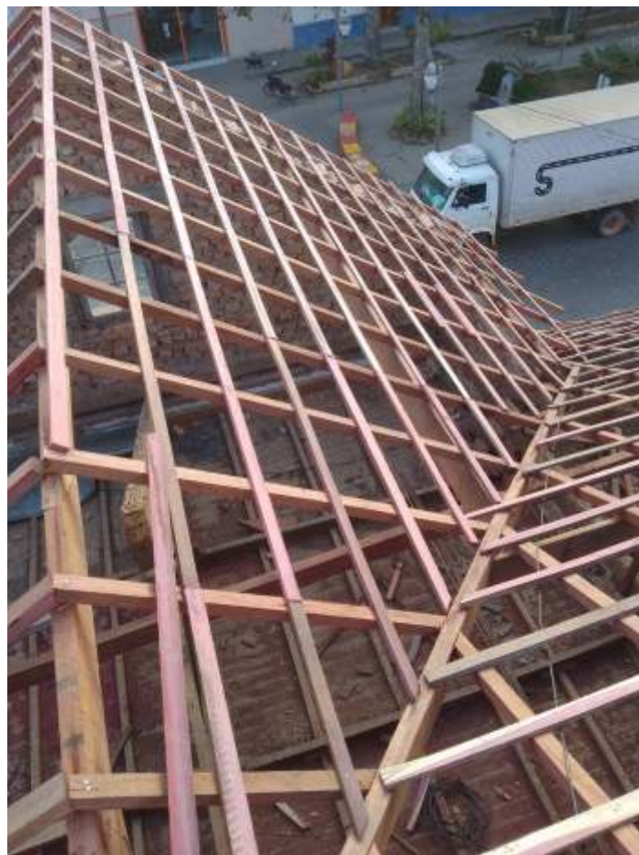
♦ Estrutura do telhado inteiramente recuperada.

Este era um desejo antigo da regional, que agora está sendo realizado. Ainda teremos vários desafios a frente, mas estamos caminhando muito bem.