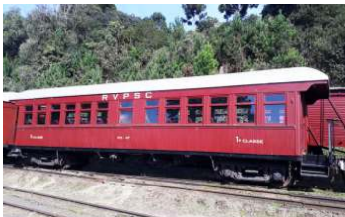
♦ Carro de passageiros PD-47 já com pintura finalizada.