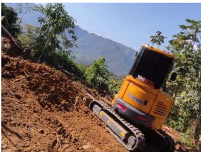
♦ Terraplanagem nos arredores da Igreja de Rio Natal.

Nas oficinas de Rio Negrinho, intensificamos as atividades de restauração do carro de passageiros PC-60, com objetivo de finalizá-lo a tempo da edição dos trens comemorativos da edição de 2022. Construído nas oficinas de Rio Grande em 1942 sobre licença da Pullman Manufacturing Corp. Iniciamos o mês com a finalização da reconstrução do madeiramento interior, possibilitando que o piso em Decoflex pudesse ser aplicado. Também foram instalados o madeiramento de acabamento, como os rodapés, e rodadetos, juntamente com as peças em bronze