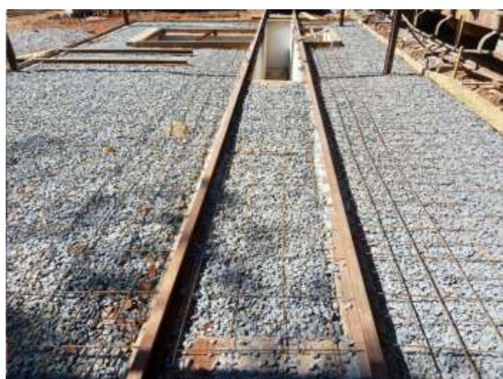
♦ Construção do radier da vala de manutenção.