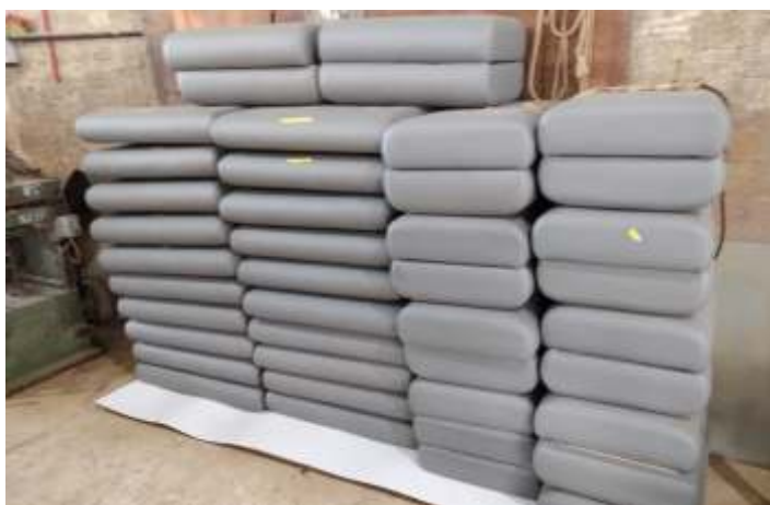
♦ Estofamento dos assentos do carro PM-33.