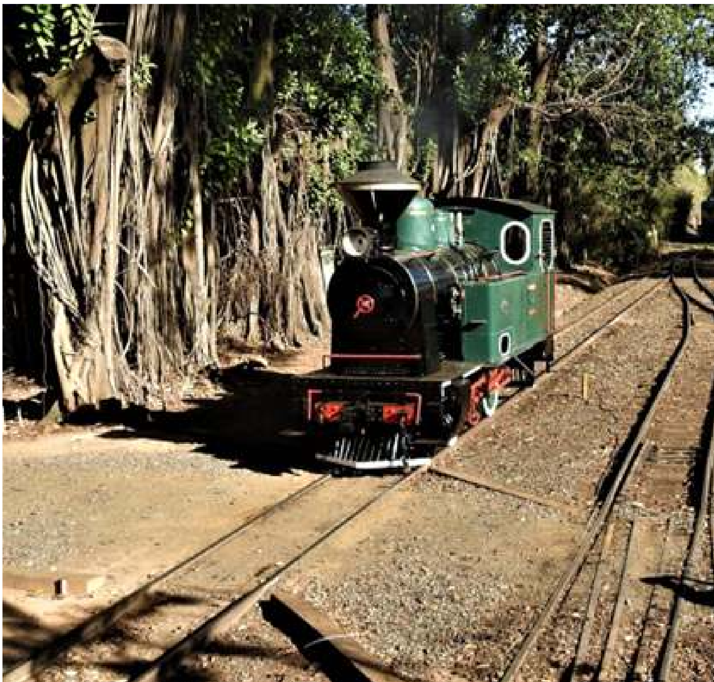
♦ Locomotiva 4 em funcionamento após repintura e limpeza!

A locomotiva número 4 Albert Blum, passou por nova repintura e foi novamente acesa e deu umas voltas no pátio de Carlos Gomes e adjacências, onde os visitantes do trem puderam ver a locomotiva em funcionamento.