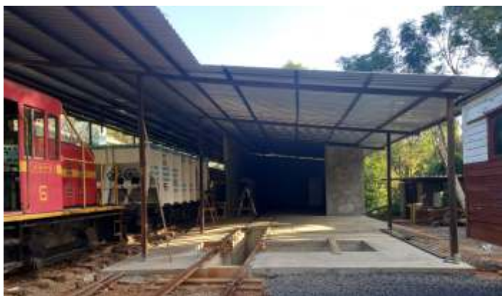
◆ Construção das paredes do almojarifado, telhado e etapa de finalização da vala para manutenção.

Aproveitando a nova vala para manutenção, foi feita a manutenção de nosso auto de linha AR 503, sendo instalado o macaco hidráulico para dar o giro no veículo. No interior, também foram feitas melhorias com a instalação de cintos de segurança. Também foi feita a revisão e manutenção dos truques do vagão FNB. Os cilindros de freio dos carros utilizados no passeio passaram por revisão geral, sendo removidos dos carros, desmontados, lavados e após totalmente revisados, foram novamente instalados nos carros.