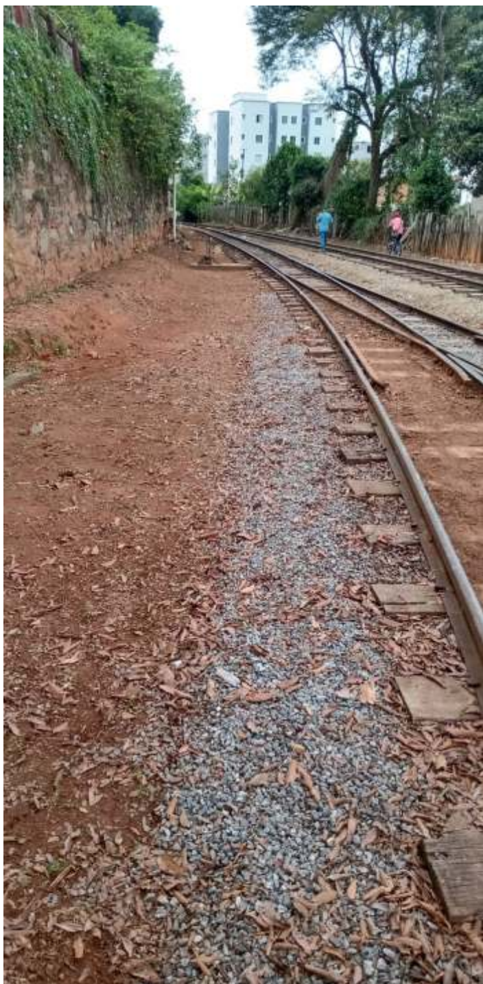
♦ Limpeza da faixa de domínio.

Seguem os trabalhos de manutenção e conservação da via e do material rodante. A via está sendo limpa, com capina e retirada de lixo. As saídas de água de vários boeiros e de drenagem da faixa de domínio foram corrigidas. Vários trechos foram nivelados e receberam complementação de lastro. A equipe está também realizando roçada da faixa de domínio.