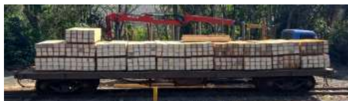
♦ Compra de lote com 200 dormentes.