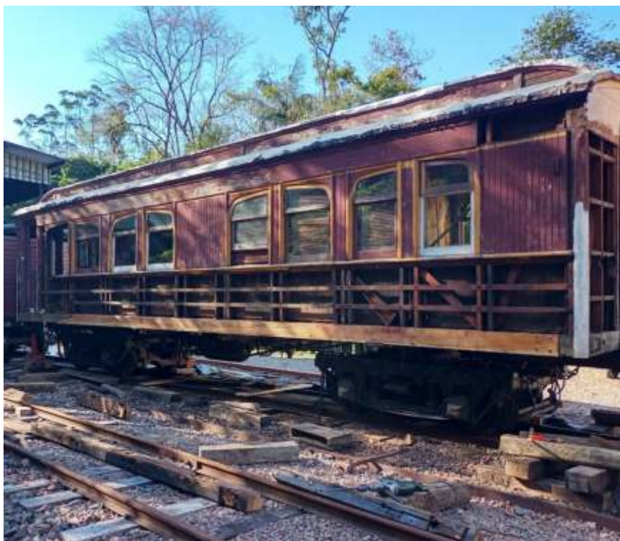
♦ Sequência de imagens da colocação da viga de 9 mts lateral do carro AM6. Autoria de Luiz Carlos Henkels e Otávio Georg Júnior.

De resto, os trabalhos de manutenção seguiram no ritmo normal, voltados principalmente à limpeza e conservação dos pátios, via permanente e material rodante, ao que o coordenador Otávio Georg Junior agradece a todos pelo apoio de sempre, inclusive durante o dia de operação do Trem Histórico Cultural.