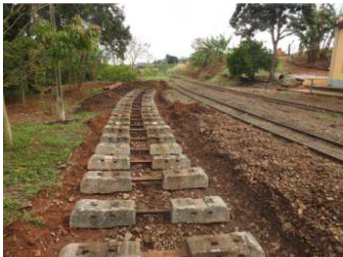
♦ Assentamento dos dormentes – Foto de Vanderlei Zago.