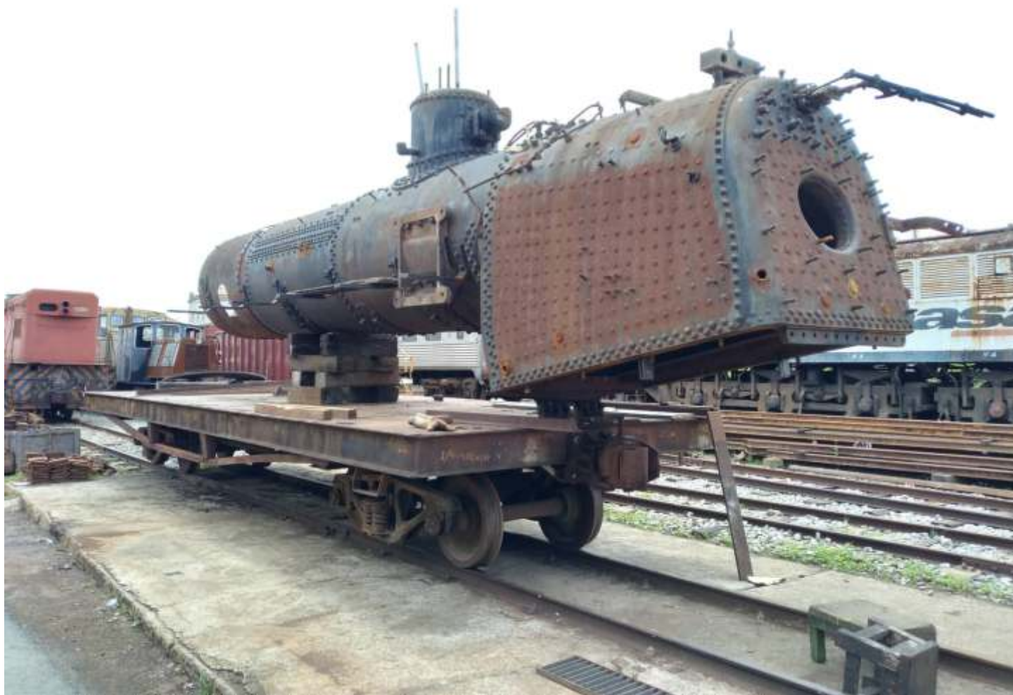
♦ Seguem os trabalhos na locomotiva nº 522 ex. RMV; a caldeira foi removida para realização de trabalhos.

Seguem os trabalhos na locomotiva nº 522. A caldeira foi removida do chassi afim de se facilitar a realização de diversos trabalhos. Apoiada sobre uma prancha de forma estratégica, afim de se garantir pleno acesso a parte inferior da fornalha, já foi iniciado o processo de confecção de uma nova grelha, adequada para a queima de lenha como combustível. Vale salientar que a 522 não mais possuía tal componente uma vez que foi convertida ainda na década de 1950 pela RMV para queima de óleo