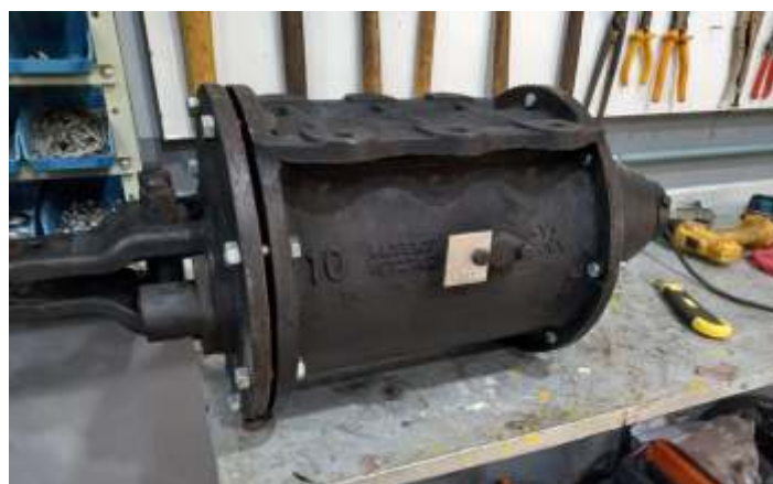
♦ Revisão dos cilindros de freio dos carros de passageiros.

Na via permanente, continuamos os trabalhos de troca de dormentes e nivelamento da via entre Piratuba e Marcelino Ramos. Este trabalho feito em parceria com a Concessionária Rumo Logística, vem se estendendo ao longo dos últimos meses, sendo os dormentes utilizados, procedentes de doações da concessionária da Ferrovia. Para que os trabalhos de troca de dormentação possam ser continuados, fizemos a compra de um lote de 200 dormentes novos, que serão instalados ainda nos próximos meses. Também aproveitamos para fazer a troca das portas de entrada, na plataforma do carro PC-50. Este carro que possuía portas inteiriças, passa agora a possuir portas com abertura dupla, mais próximo ao padrão original de construção.