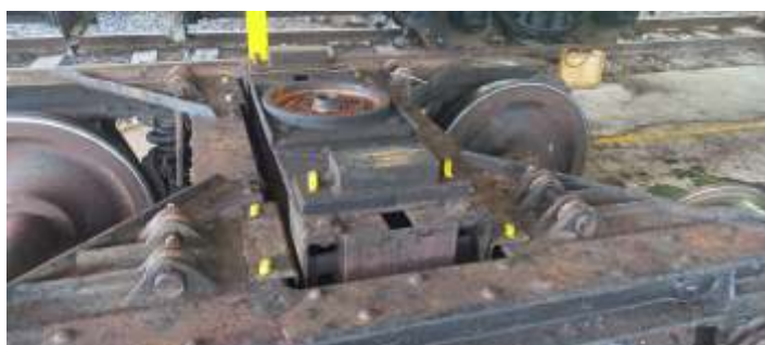
◆ Remontagem dos componentes do truque do PC-53.