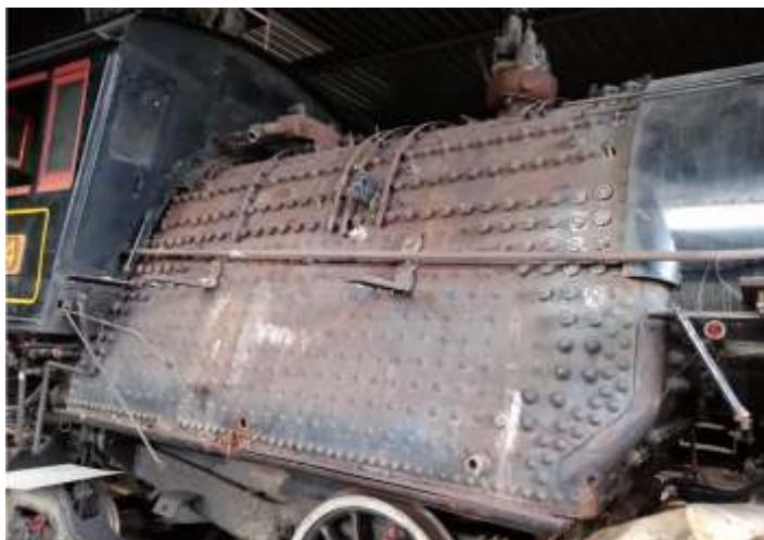
♦ Troca dos estais na fornalha da locomotiva Mallet nº 204

Iniciamos os trabalhos nas oficinas de Rio Negrinho com a revisão da locomotiva articulada Mallet nº 204. Foram removidos todos os tubos da caldeira, os quais serão substituídos por novos. As serpentinas do superaquecedor, já haviam sido reconstruídas nos meses anteriores, foram removidas e aguardam a instalação dos novos tubos. A caldeira está passando por limpeza para que possa ser feito testes de ultrassom, o qual deverá ocorrer no início do próximo mês. Na fornalha da locomotiva, estamos fazendo a substituição de alguns estais.