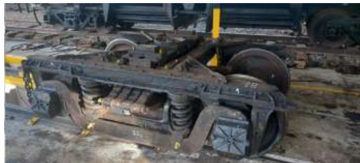
◆ Remontagem dos componentes do truque do carro de passageiros PC-53.