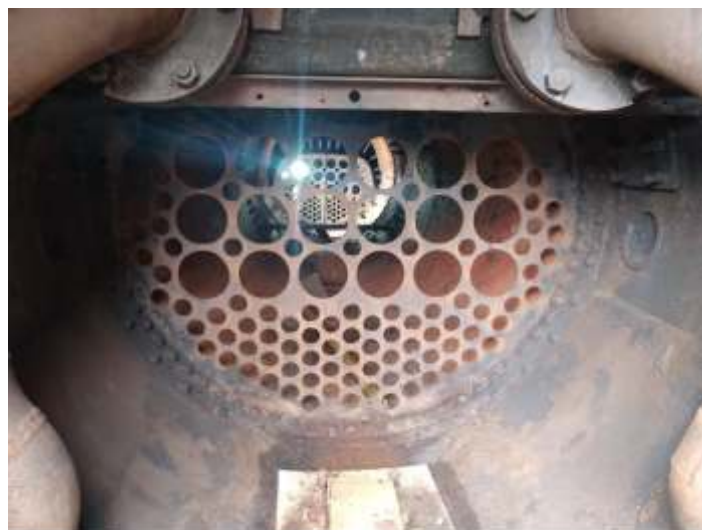
♦ Caldeira da locomotiva Mallet nº 204 já sem tubos, preparada para limpeza e ultrassom.