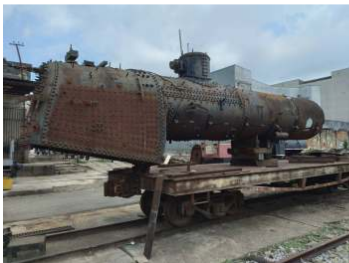
♦ Caldeira sobre uma prancha para trabalhos na grelha.

Estamos agora percorrendo o caminho inverso, reconvertendo a locomotiva para queima de lenha. Para além, a remoção da caldeira possibilita a realização de outros serviços nela e no próprio conjunto mecânico, de suspensão e chassi, que ficam mais acessíveis, propiciando a realização dos serviços com mais eficiência.