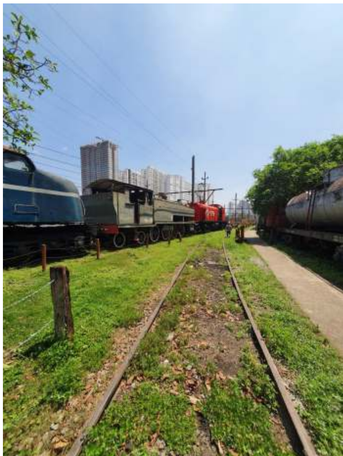
♦ Acervo da ABPF sendo manobrado com apoio da CPTM.

Este mês foi realizada a remoção de antigos pórticos de rede aérea que estavam depositados nas nossas dependências na Mooca. Para tanto, foi necessário manobrar o nosso material rodante afim de se liberar a via para acesso do trem de serviço da CPTM, o qual realizou a remoção das peças.