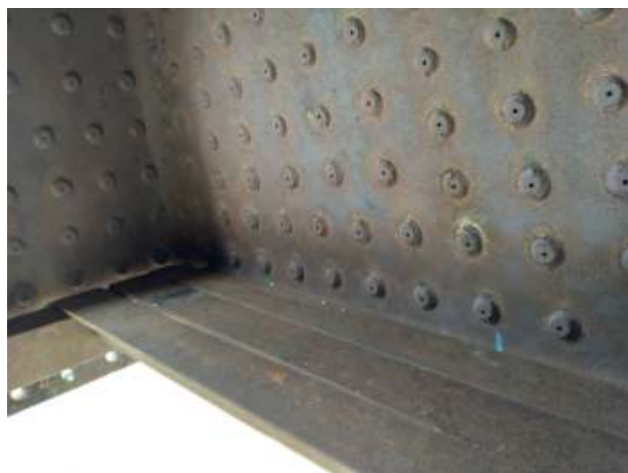
♦ Construção de nova grelha.