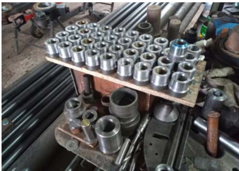
◆ Bocal das serpentinas em usinagem