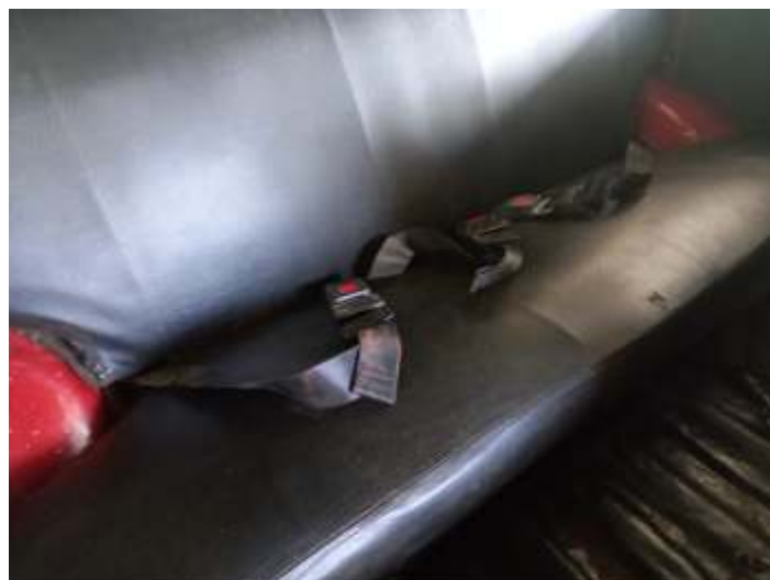
◆ Instalação de cintos de segurança no auto de linha AR-503.