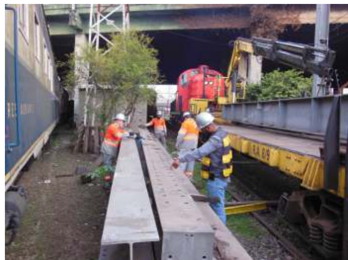
♦ Colaboradores da CPTM na operação de carregamento.

Deixamos registrados aqui os nossos agradecimentos a CPTM, na figura de seu presidente, Pedro Moro e a todos os colaboradores que se envolveram nessas atividades. A companhia tem sido uma importante parceira da ABPF, se disponibilizando a nos apoiar em diversas atividades, demonstrando o seu compromisso perante a sociedade com a preservação da memória ferroviária nacional.