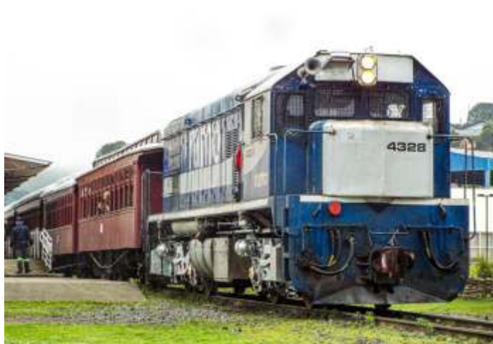
♦ Trem da Serra do Mar estacionado na estação ferroviária de São Bento.