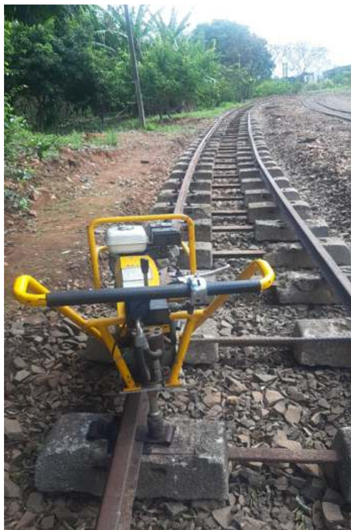
♦ Trilhos sendo fixados nos dormentes

Também passa por repintura o velho MB 1113 ano 1975, e que ainda presta relevantes serviços a ferrovia, transportando lenha, dormentes, óleos lubrificantes etc. uma vez que ele possui um pequeno Munck que facilita em muito o serviço.