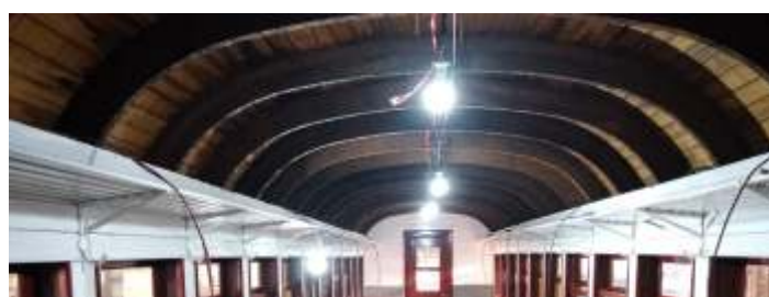
♦ Remoção do forro interior do carro PM-33.