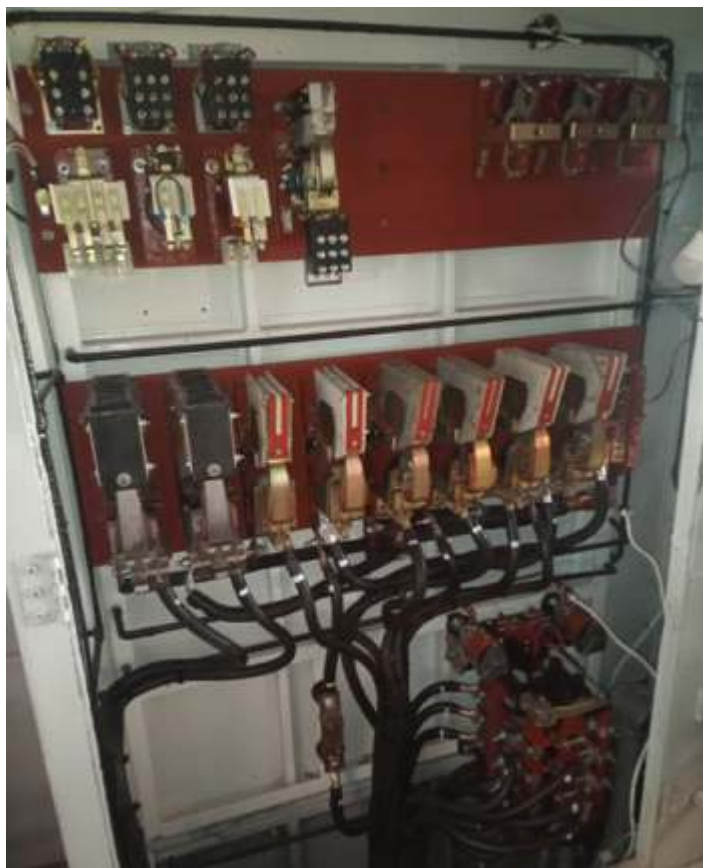
◆ Armário elétrico da 3104, com mais componentes instalados .

Os truques já estão limpos, e fazendo os ajustes de timoneria de freios e será erguido para retirar dois motores de tração para reparação.