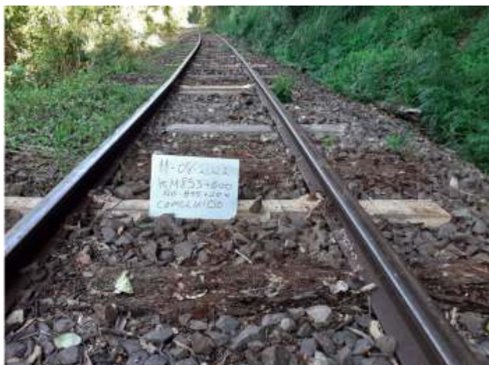
♦ Troca de dormentes e nivelamento da via férrea.

Na via permanente, continuamos os trabalhos de troca de dormentes e nivelamento da via entre Piratuba e Marcelino Ramos. Este trabalho feito em parceria com a Concessionária Rumo Logística, vem se estendendo ao longo dos últimos meses, sendo os dormentes utilizados, procedentes de doações da concessionária da Ferrovia. Para que os trabalhos de troca de dormentação possam ser continuados, fizemos a compra de um lote de 200 dormentes novos, que serão instalados ainda nos próximos meses. Também aproveitamos para fazer a troca das portas de entrada, na plataforma do carro PC-50. Este carro que possuía portas inteiriças, passa agora a possuir portas com abertura dupla, mais próximo ao padrão original de construção.