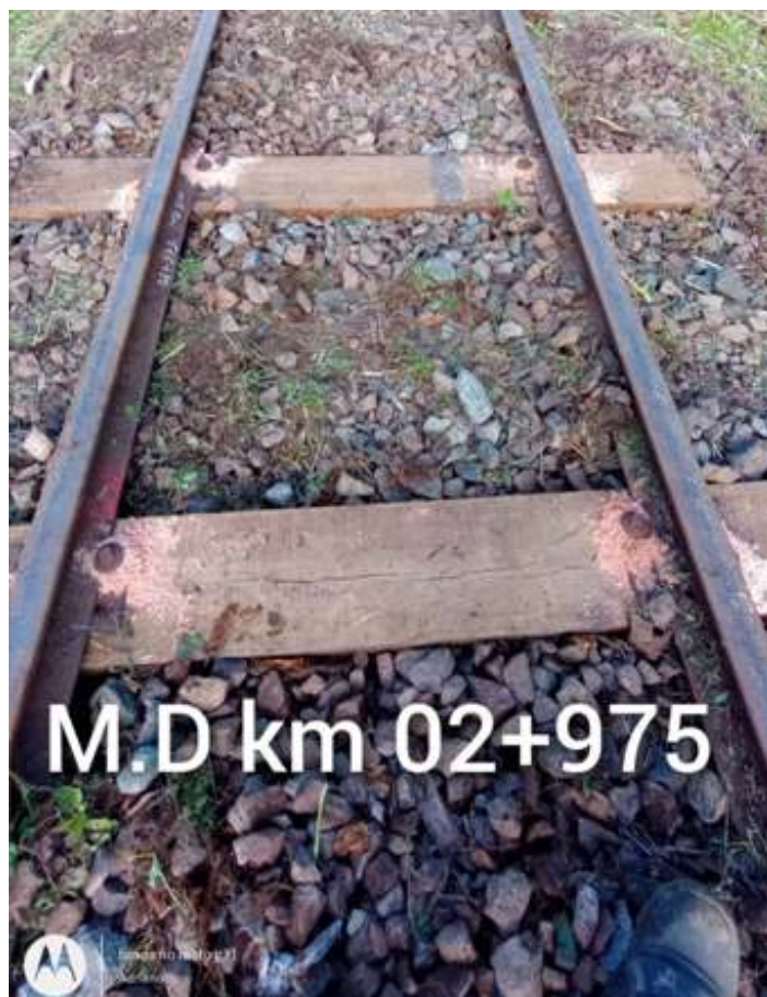
♦ Roçadas no trecho de via permanente entre Antonina e Morretes.