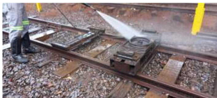
♦ Etapa de desmontagem e limpeza dos truques do carro de passageiros PC-53.