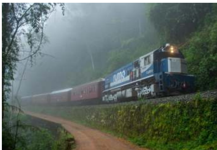
♦ Trem da Serra do Mar com locomotiva G22UB no trajeto da Serra.