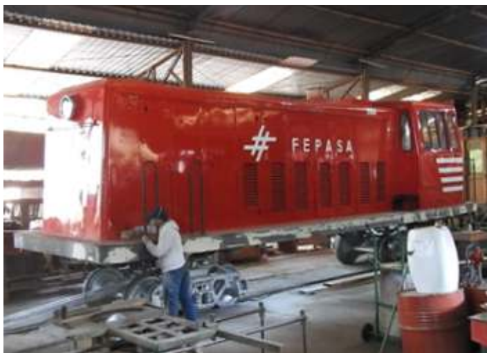
◆ Loc 3104, preparando o estrado para pintura - Foto V. Zago.

Na parte de pintura, foi concluída a pintura da locomotiva GE 3104, na cor da Fepasa, bem como pintura do estrado e tanques de combustível, que foram retirados e abertos para limpeza e já estão prontos. Enquanto isso prosseguem os trabalhos de montagem do painel elétrico e de seus componentes, como os relógios indicadores e chaves liga e desliga.