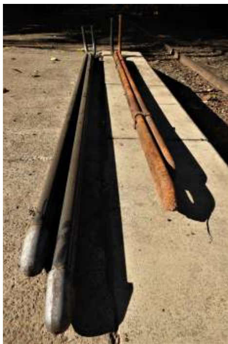
◆ Um conjunto de serpentina velho e um novo da 338- Foto H.G.F.

Nas oficinas prosseguem os serviços de substituição dos tubos e novo conjunto de serpentinas do super aquecedor sendo fabricados do zero pela nossa equipe de colaboradores das oficinas. Os novos tubos já chegaram do fornecedor e estamos ultimando a limpeza e reparação para inserir os novos tubos.