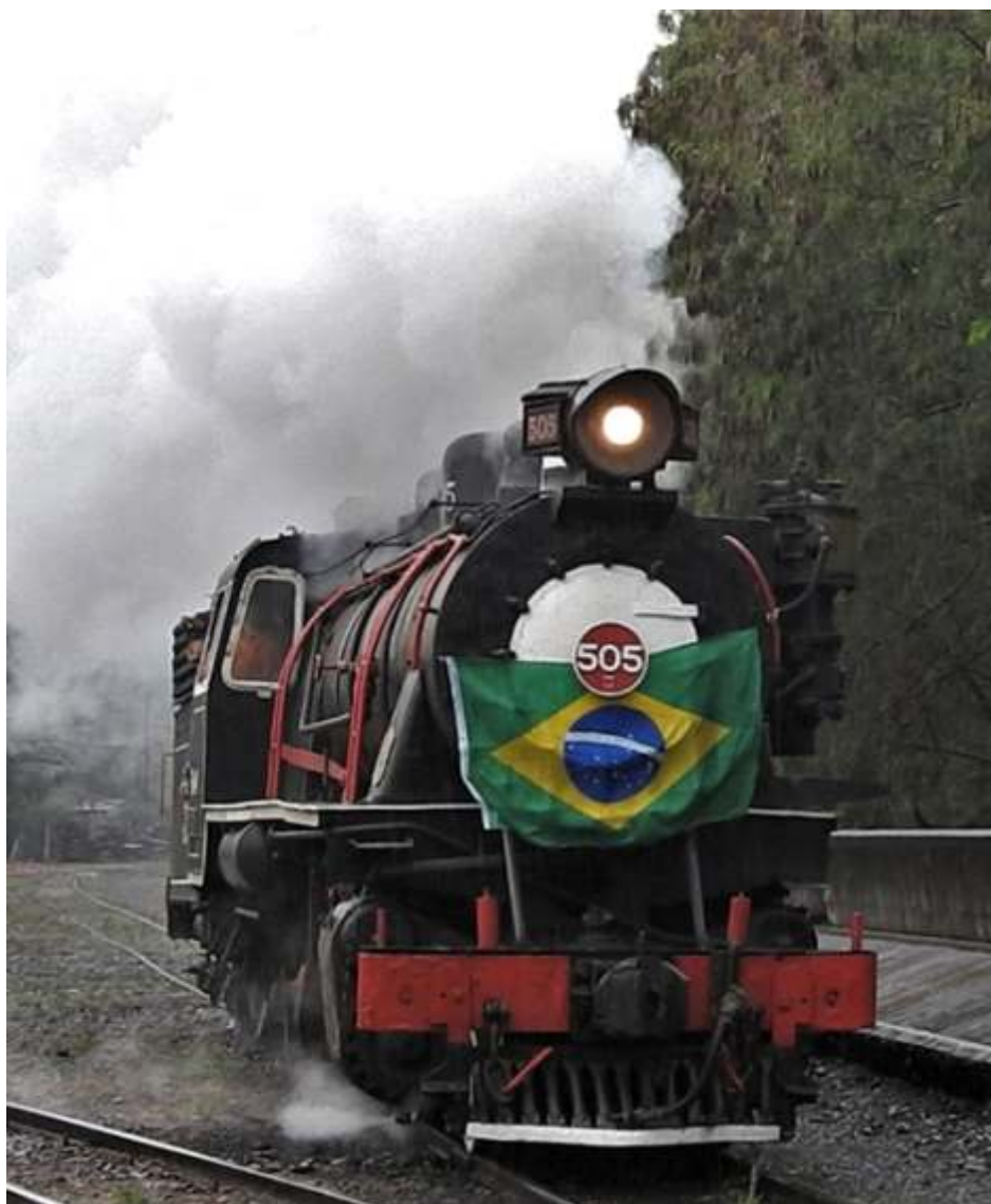
◆ Loc 505 em manobras no dia 7 de setembro – Foto Vanderlei Zago.