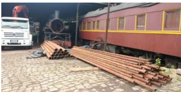
♦ Remoção dos tubos antigos da locomotiva nº 204.