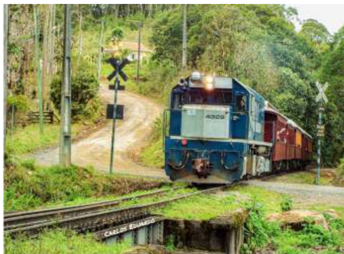
♦ Trem da Serra do Mar com a G22UB no trajeto da Serra.

Tivemos dias de passeio com clima ameno para a época do ano, com dias com temperatura agradável e entardecer fechado, o que acabou atraindo muitos entusiastas, que acompanham o nosso trem ao longo da serra, fazendo diversas fotos e filmagens do nosso passeio. Outro diferencial do passeio do Trem da Serra do Mar deste mês, foi o uso de locomotiva diesel-elétrica, modelo G22UB, fabricada em 1972 pela MACOSA, Espanha. O uso desta máquina se faz necessário neste momento em que todas as nossas locomotivas de serra passam por revisão geral, como exemplo, pode-se citar o caso da locomotiva articulada Mallet nº 204, que está sendo enquadrada conforme as normas americanas da FRA (Federal Railroad Administration), de modo que não seria possível a operação do passeio atualmente. O fator de uso de locomotivas a diesel, em especial, acabou atraindo ainda mais turistas e entusiastas ferroviários, rendendo inúmeras fotos e vídeos do nosso trem.