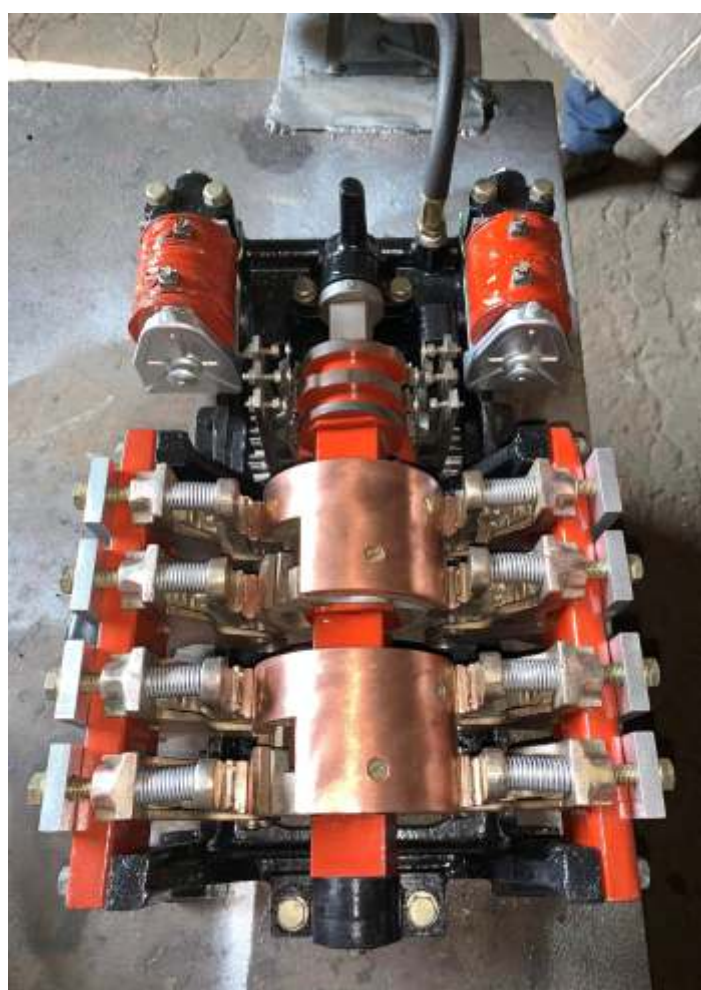
◆ Sistema de reversão da locomotiva, totalmente recuperado em nossas oficinas, pronto para a reinstalação.