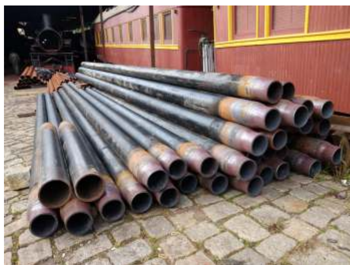
♦ Descarregamento dos novos tubos para a locomotiva Mallet nº 204.