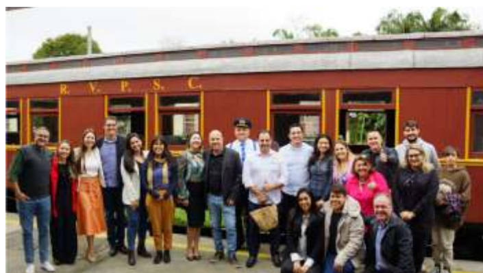
◆ Cerimônia de lançamento oficial da promoção "Trem para os Caiçaras".