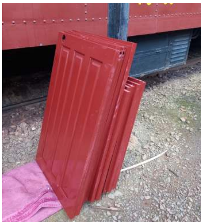
♦ Instalação de novas portas de entrada no carro de PC-50.