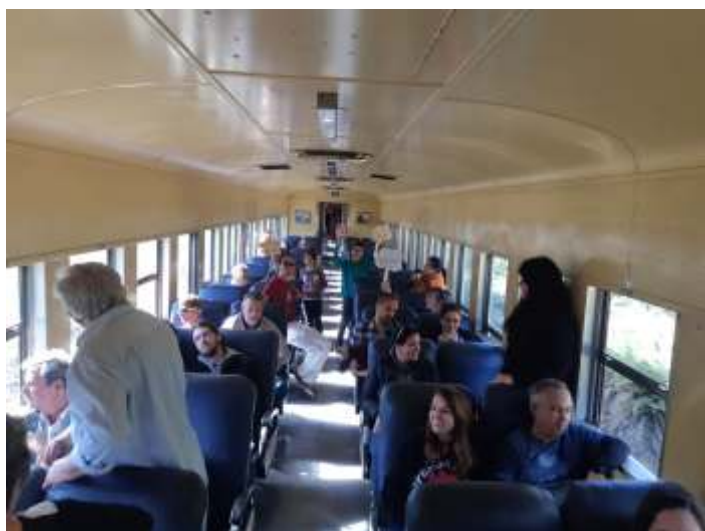
◆ Os dois grupos atendidos do City Tour abordo do trem.