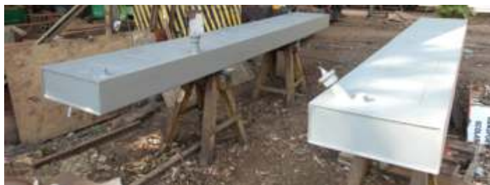
◆ Pintura dos tanques de combustível – Fotos de Vanderlei Zago.