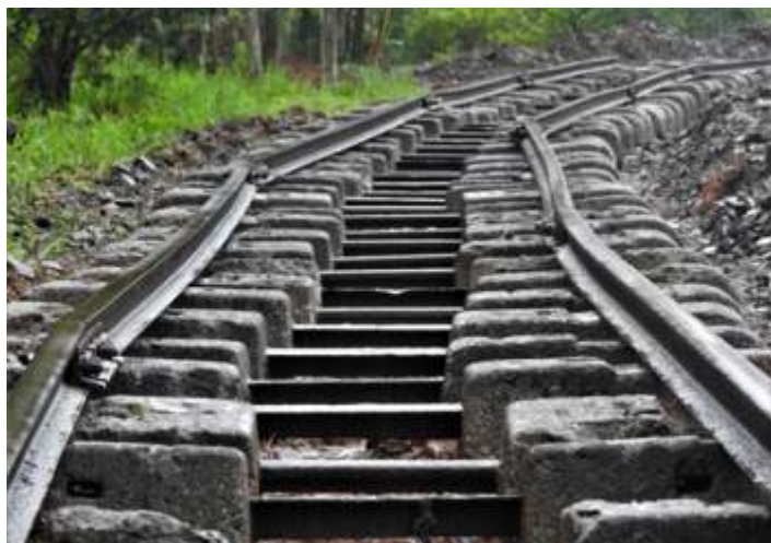
♦ Os trilhos já sendo distribuídos para fixação