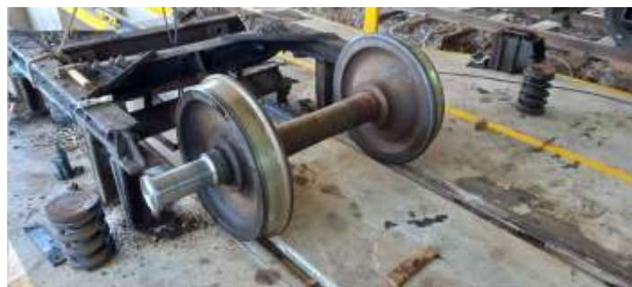
♦ Etapa de desmontagem e limpeza dos truques do carro PC-53