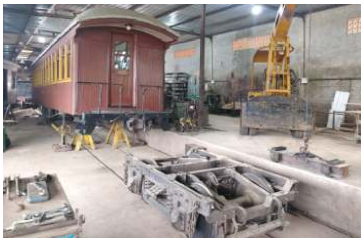
♦ Remoção do truque, para inspeção, do carro de PM-33.

Em outra frente de trabalho, iniciamos a reforma do carro PM-33. Este carro faz parte da composição do Trem da Serra do Mar, sendo utilizado agora no momento em que nossa composição permanece de maneira reduzida, em virtude dos passeios comemorativos no Rio Grande do Sul. Os trabalhos compreenderam-se em seu interior, o forro do teto interior foi totalmente removido, sendo sua substituição, programada para o início do próximo mês. Também foi feita a instalação de Decorflex no piso do carro, bem como pintura interna. As estruturas metálicas das poltronas passaram por limpeza, foram jateadas e já sendo instaladas no carro, as quais aguardam agora a finalização do estofamento.