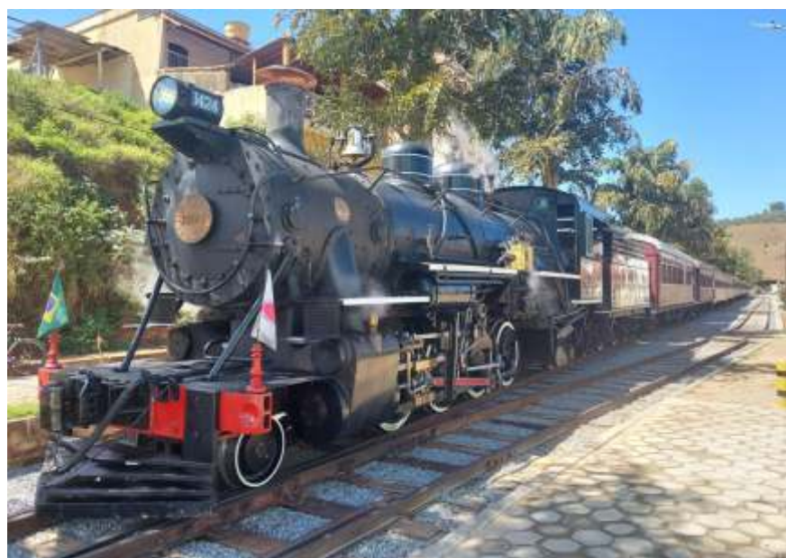
♦ O Trem das Águas chegando em Soledade de Minas.

É notável o crescimento e a evolução da associação ao longo desses 45 anos de atuação; aperfeiçoamento, profissionalização e atenção a todas as áreas. Parcerias sendo consolidadas e reconhecimento do trabalho de excelência que a ABPF tem hoje. A luta segue incansavelmente para ver um capítulo importante da história do país de volta nos trilhos.