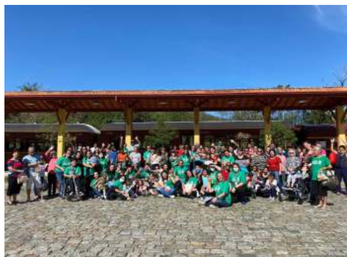
◆ O pessoal da APAE que realizou o passeio de trem.