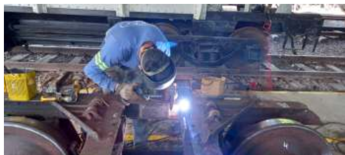
◆ Etapa de revisão e restauração dos truques do PC-53.