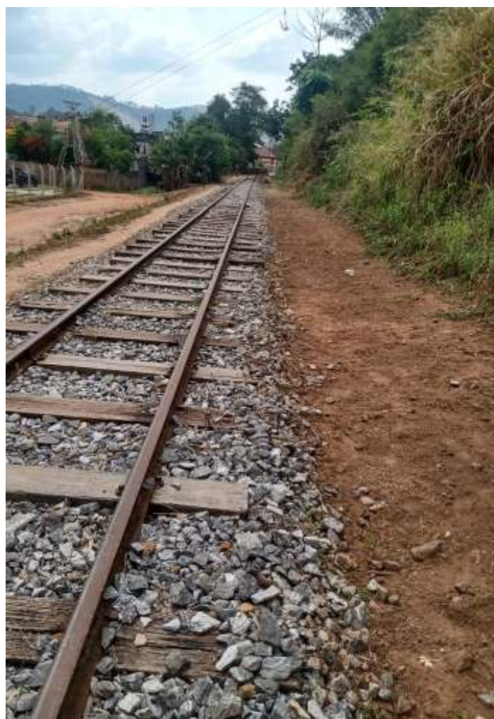
♦ Limpeza da faixa de domínio.