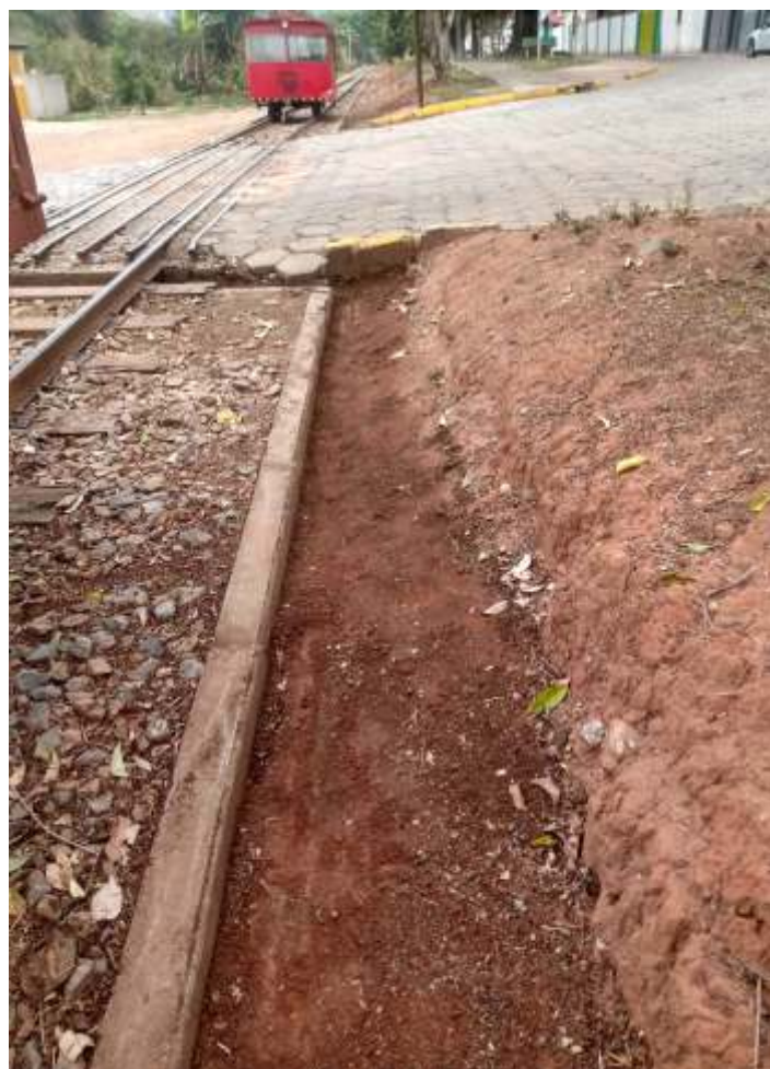
♦ Limpeza da faixa de domínio.