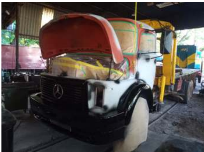
♦ Detalhes em preto já concluído.

A locomotiva número 4 Albert Blum, passou por nova repintura e foi novamente acesa e deu umas voltas no pátio de Carlos Gomes e adjacências, onde os visitantes do trem puderam ver a locomotiva em funcionamento.