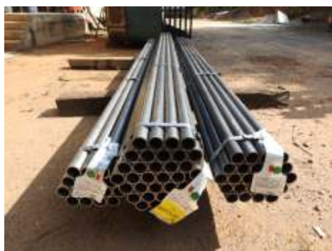
◆ Novos tubos para a caldeira da 338.