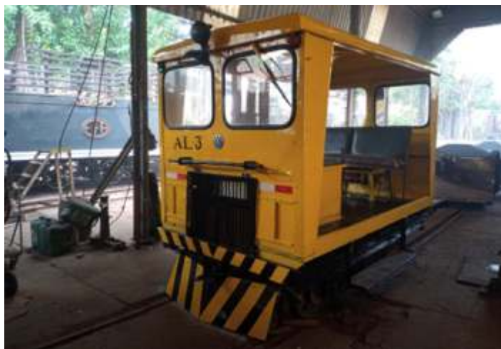
◆ AL-3 com pintura concluída

O auto de linha que estava em repintura, foi concluído e já voltou a ativa. Recebendo várias melhorias, troca de vidros etc.