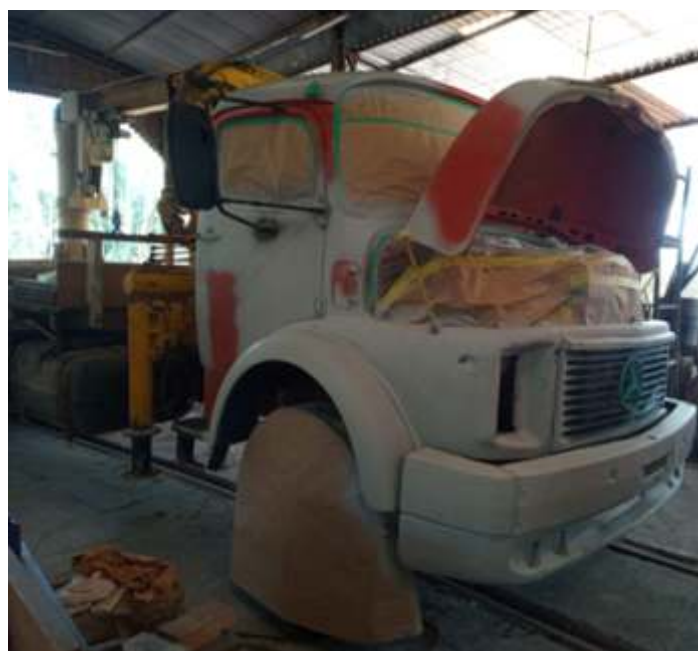
♦ Preparação para pintura.

Também passa por repintura o velho MB 1113 ano 1975, e que ainda presta relevantes serviços a ferrovia, transportando lenha, dormentes, óleos lubrificantes etc. uma vez que ele possui um pequeno Munck que facilita em muito o serviço.