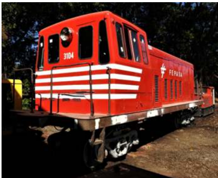
◆ Detalhe da cabina da 3104 – Foto Vanderlei Zago.