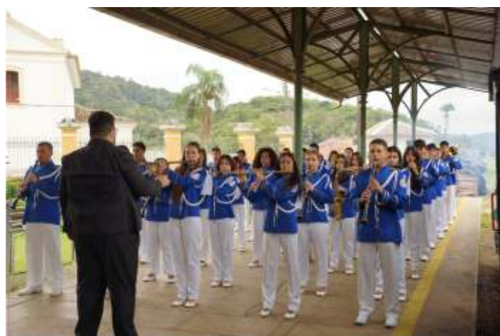
◆ Apresentação da Banda Marcial de Antonina durante a cerimônia de lançamento do passeio.