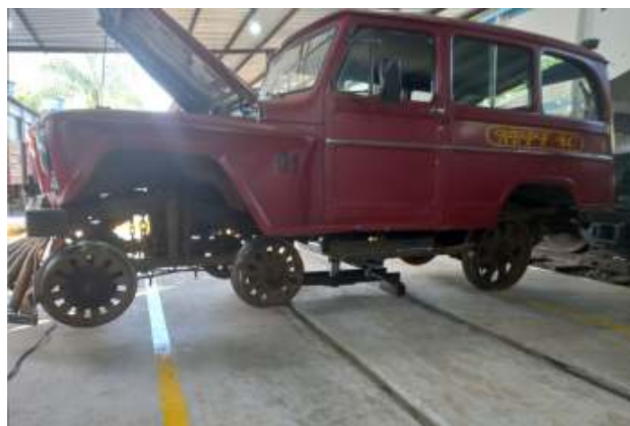
◆ Instalação de Macaco Hidráulico no auto de linha AR-503.