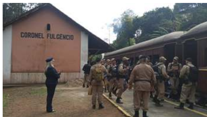
♦ Cerimônia na estação Coronel Fulgêncio.