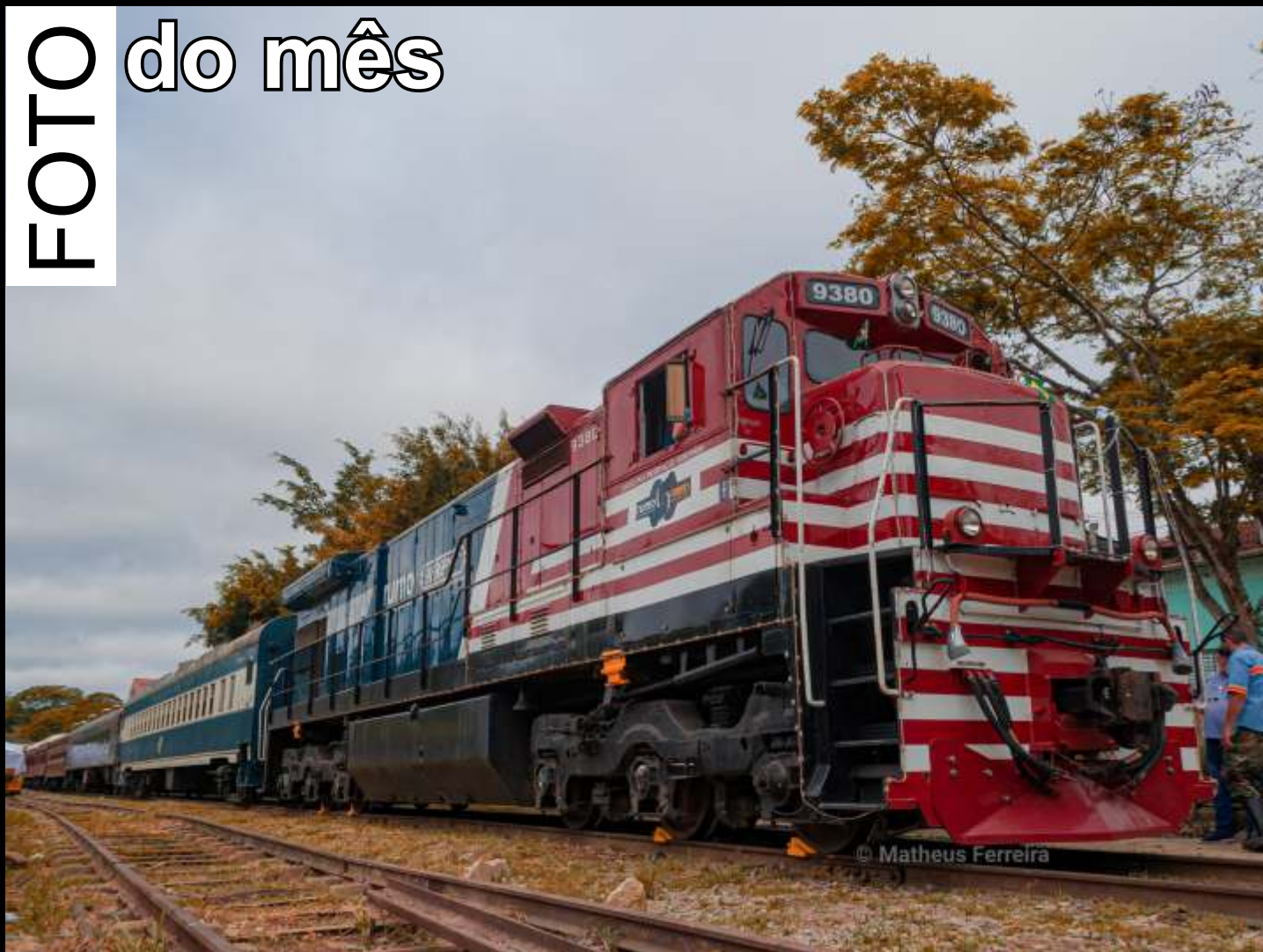
◆ Especial Trem do Cambuci na estação de Sabaúna.

Todo mês selecionaremos uma foto relacionada ao trabalho da associação publicada no grupo ABPF - Oficial no Facebook para publicar aqui.