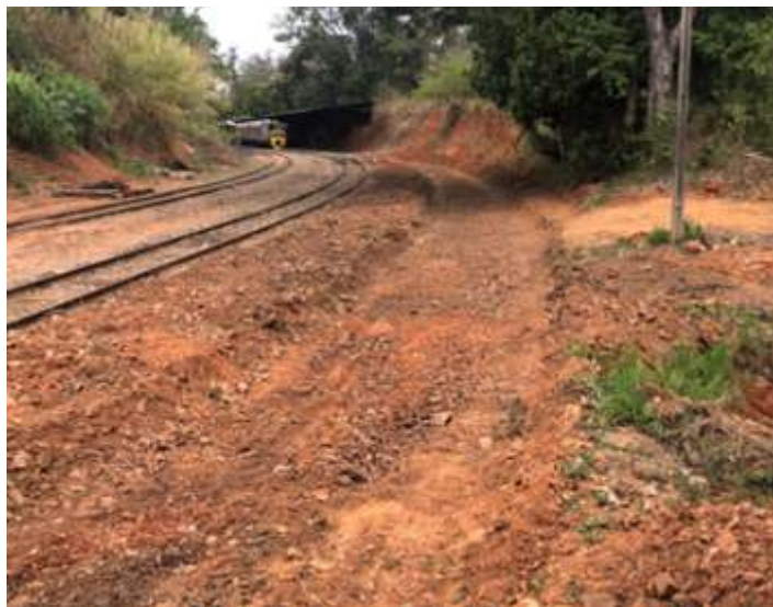
♦ Preparação para o prolongamento da linha 3 em Anhumas, no mesmo lugar da linha original.

O destaque esta para o prolongamento da linha 3 em Anhumas, voltando exatamente para onde era, que com isso teremos mais linha para estacionar os carros e que futuramente o barracão será estendido para a cobertura dos carros que não ficam no coberto, protegendo os bem mais das intempéries.