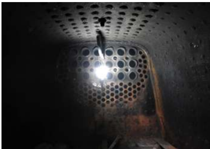
◆ Interior da fornalha da 338, já com os tubos velhos retirados.

Na parte de pintura, foi concluída a pintura da locomotiva GE 3104, na cor da Fepasa, bem como pintura do estrado e tanques de combustível, que foram retirados e abertos para limpeza e já estão prontos. Enquanto isso prosseguem os trabalhos de montagem do painel elétrico e de seus componentes, como os relógios indicadores e chaves liga e desliga.