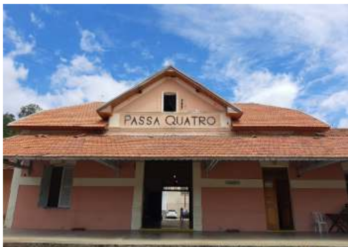
♦ Novo telhado da estação de Passa Quatro.