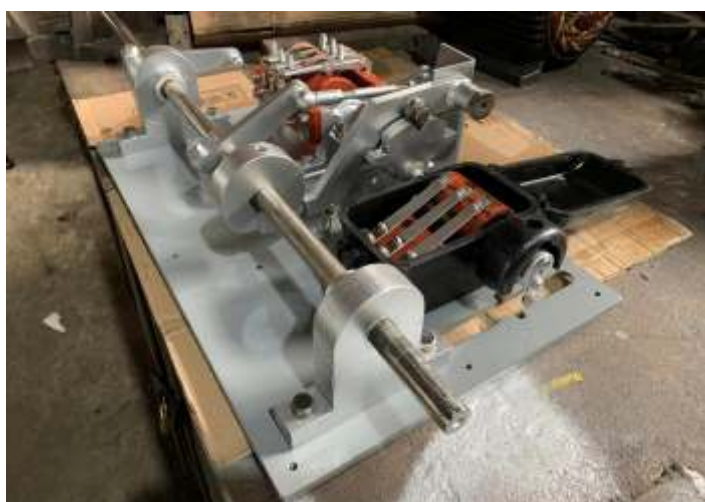
◆ Conjunto do acelerador da locomotiva, totalmente recuperado em nossas oficinas, pronto para a reinstalação.