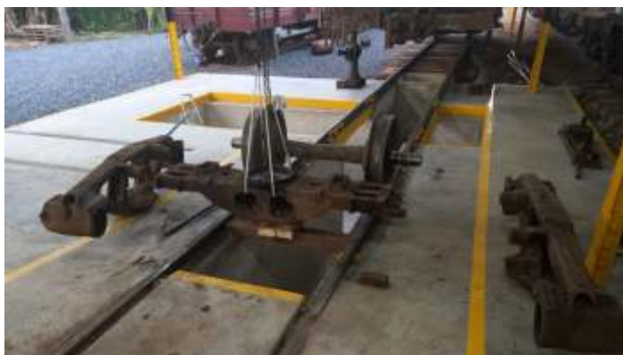
♦ Revisão e manutenção do truque do vagon FNB.