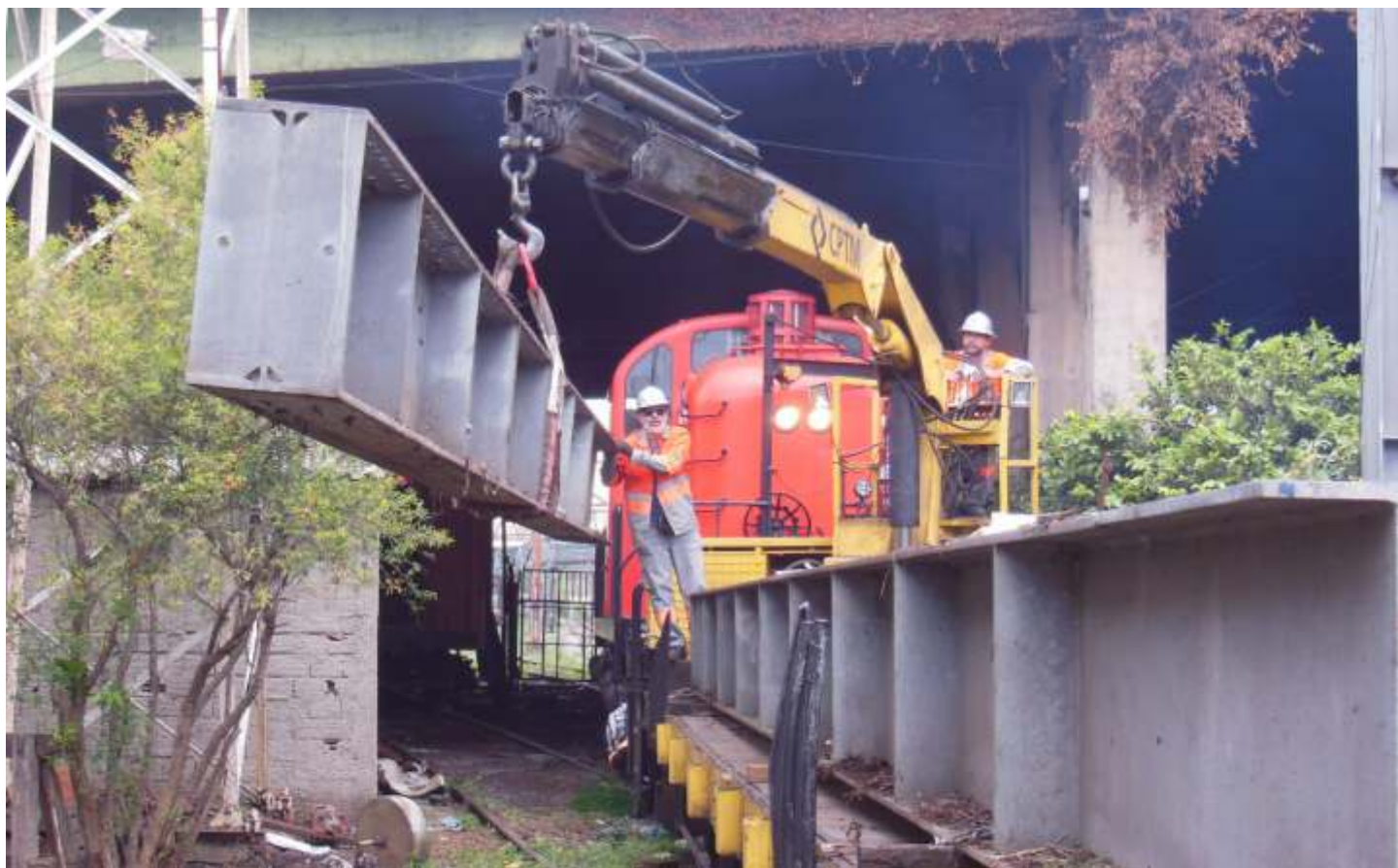
♦ Operação de carregamento dos antigos pórticos sendo realizada pelos colaboradores da CPTM.