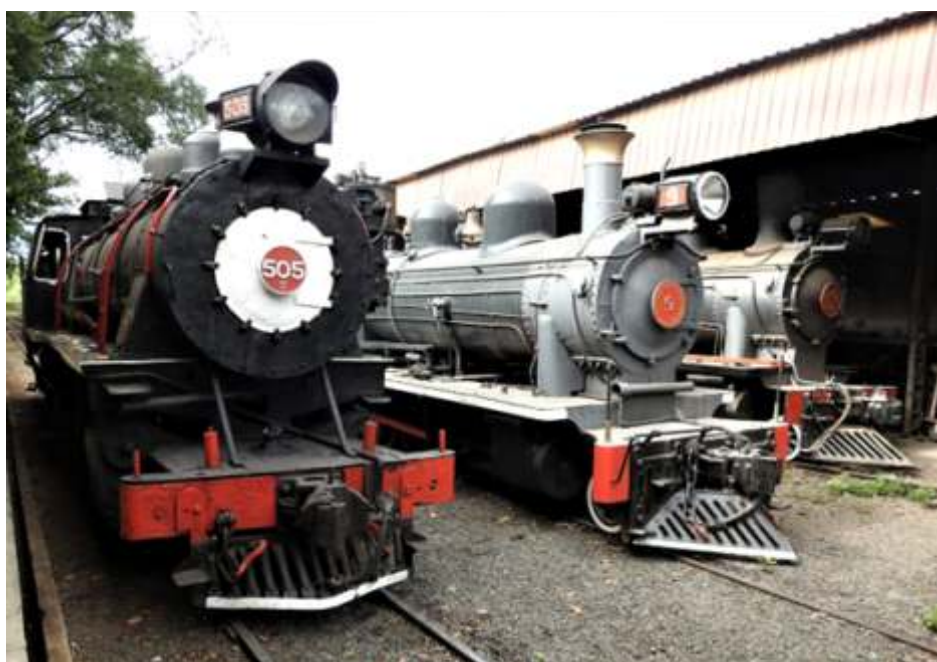
♦ Cenário de um dia normal em Carlos Gomes com as 3 alemãs.

O acesso a linha 3 está normalizado e aprovado com sucesso. Para o início do próximo ano, vamos fazer as fundações da extensão do abrigo de carros de passageiros e posteriormente a estrutura metálica e cobertura.