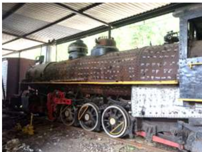
♦ Trabalhos de ultrassom na caldeira da locomotiva nº 627.

Em uma terceira frente de trabalhos, realizamos a revisão completa dos truques do carro de passageiros AC-07, utilizado como dormitório de tripulação durante os Trens Comemorativos. Os truques foram removidos, totalmente desmontados, revisados e já estão instalados no veículo. Também aproveitamos este momento pós passeios comemorativos para fazer a pintura do carro administrativo AM-01. Fabricado pelas Oficinas de Curitiba para a Estrada de Ferro do Paraná (EFP) em 1.924, o AM-01 é utilizado para equipagem da tripulação em viagens e passeios comemorativos. Com o retorno às oficinas de Rio Negrinho, o madeiramento externo foi totalmente lixado e o carro pintado. A pintura escolhida é a da Rêde de Viação Paraná – Santa Catarina, sucessora da EFP, a qual o carro foi amplamente utilizado.