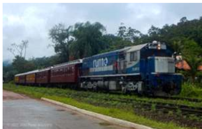
♦ Registros fotográficos do Trem da Serra do Mar ao longo deste mês.

O uso desta máquina se faz necessário neste momento em que todas as nossas locomotivas de serra passam por revisão geral, o que deve se estender ainda durante o mês de dezembro, e como exemplo, pode-se citar o caso da locomotiva articulada Mallet nº 204, que está sendo enquadrada conforme as normas americanas da FRA (Federal Railroad Administration), de modo que não seria possível a operação do passeio atualmente.