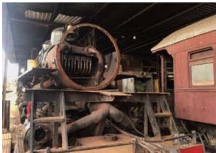
♦ Aspecto da locomotiva durante obras de reforma e reestruturação.