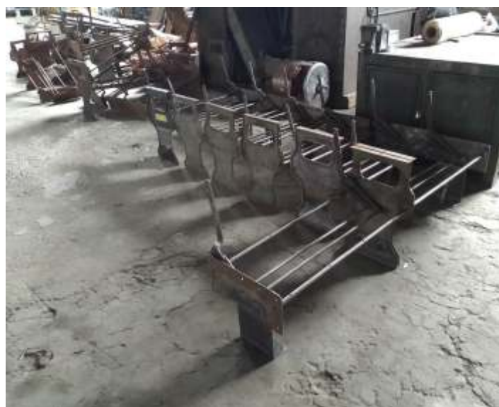
♦ Recuperação de estruturas de bancos de carros.