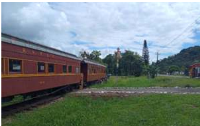
♦ Simulado de acidente ferroviário, primeiros socorros e resgate em Antonina.