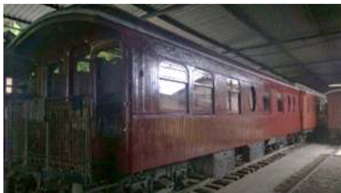
♦ Pintura externa do carro administrativo AM-01 já finalizada.