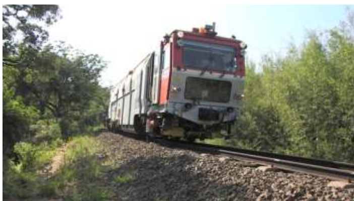
◆ Tubos de 5" já com ponta reduzida, para super aquecedor

Na via permanente foi feito vários reparos de nivelamento ao longo do trecho, inclusive na reta da estação de Anhumas, com o uso da niveladora Plasser.