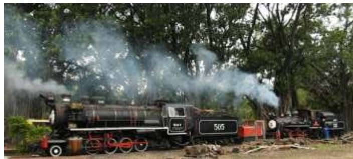
◆ Locomotiva 505 acesa para testes do aparelho lubrificador e 215 em tráfego no trem de passageiros.

A locomotiva 505 apresentou falhas no aparelho de lubrificação, e o mesmo deu muito trabalho e perdeu vários dias para fazer sua reparação, depois remontagem e testes. Para os testes é preciso acender a locomotiva. O aparelho é hoje usado somente para lubrificar o compressor de ar, e além do conserto do aparelho, aproveitamos e instalamos uma bomba de lubrificação no mesmo. Por fim o aparelho voltou a funcionar normalmente e a locomotiva liberada ao tráfego novamente.