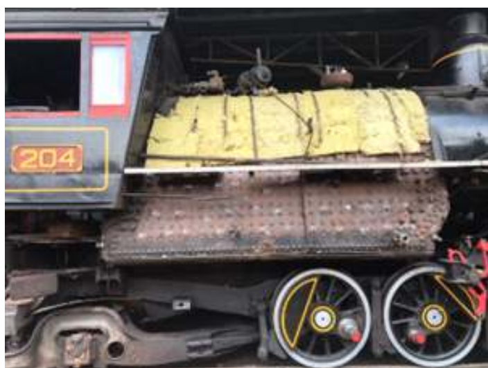
♦ Início da remontagem dos componentes externos na locomotiva Mallet nº 204.