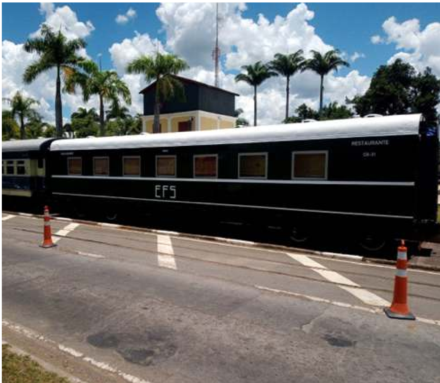
♦ Já no tráfego e concluído, na estação de Jaguariúna