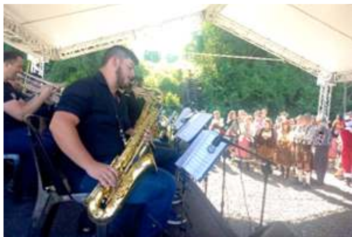
♦ Animações musicais nas Estações Ferroviárias de Colinas e de Roca Sales.