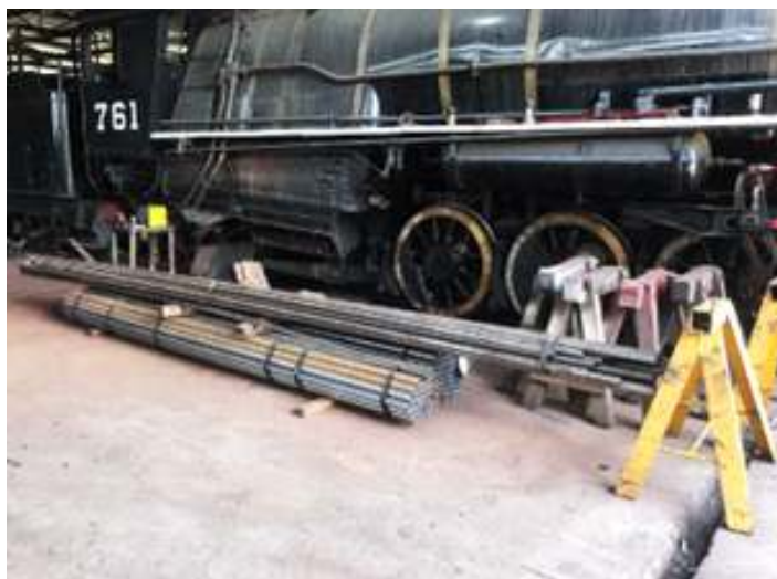
♦ Trabalhos de revisão da caldeira da locomotiva Mikado nº 761.