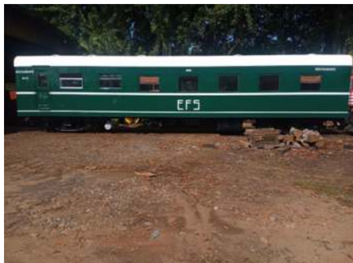
◆ Saindo da pintura em Carlos Gomes.