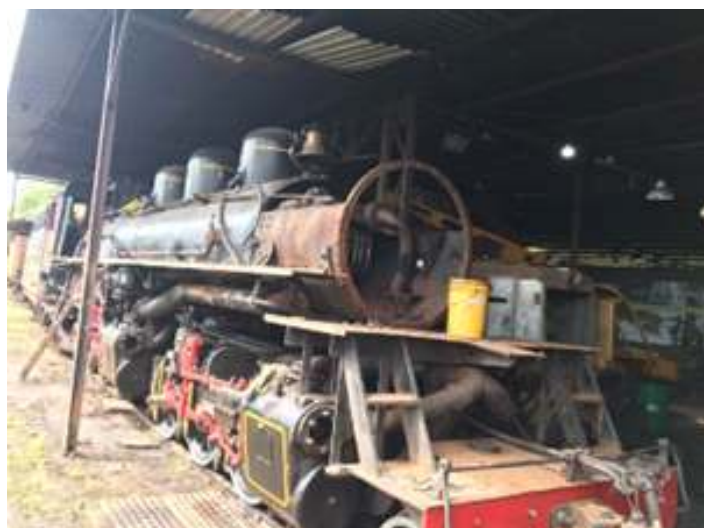
♦ Aspecto da locomotiva durante obras de reforma e reestruturação.