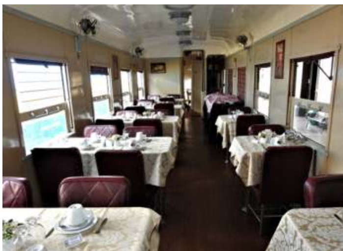
♦ Interior do carro Restaurante R-404 (CR-31) preparado para servir o café!

E no momento iniciamos a repintura do guindaste Hyster (conhecido como canarinho) muito utilizado em nossas oficinas.