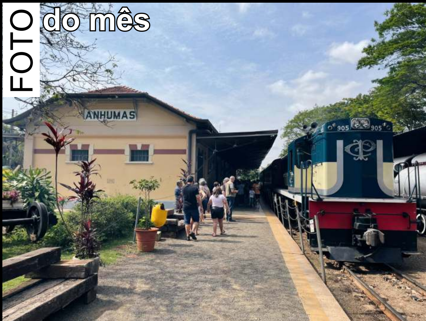
♦ A bela RSD8 905 com as cores da C.P. pronta para partir com o trem da estação de Anhumas.

Todo mês selecionaremos uma foto relacionada ao trabalho da associação publicada no grupo ABPF - Oficial no Facebook para publicar aqui.