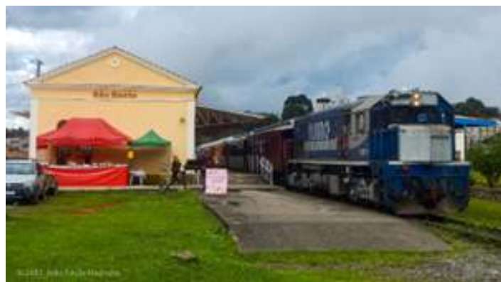
♦ Registros fotográficos do Trem da Serra do Mar ao longo deste mês.