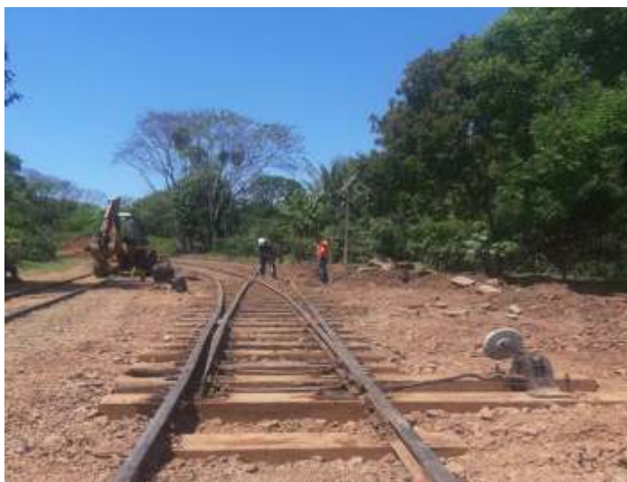
◆ Últimos ajustes para a liberação da extensão da linha 3.

Na via permanente foi feito vários reparos de nivelamento ao longo do trecho, inclusive na reta da estação de Anhumas, com o uso da niveladora Plasser.