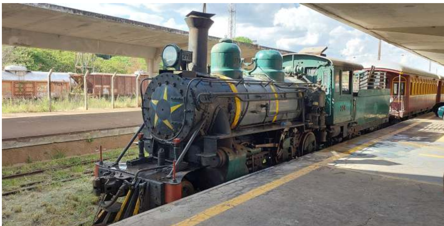
♦ A locomotiva a vapor 278 após realização da limpeza pelos associados e voluntários.