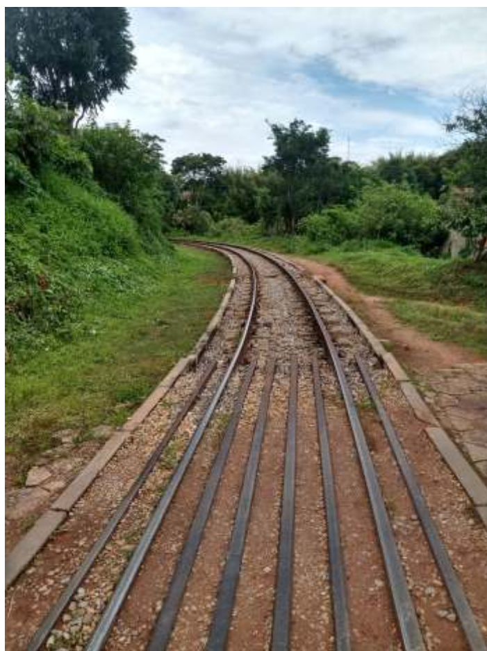
♦ Manutenção da via-permanente: capina, roçada e limpeza ao longo da faixa de domínio