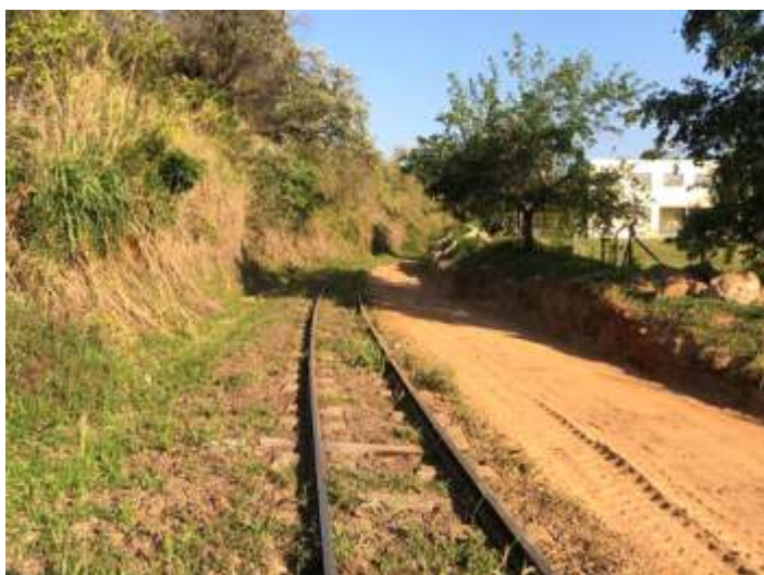
◆ Retirada de detritos da via, no km 11,5 – Foto de Mauricio Polli.

Também em outros trechos começamos a retirar o excesso de terra das margens da via. Esses resíduos de terra, pedra e entulho foram causados pelos novos bairros formados ao longo da via.