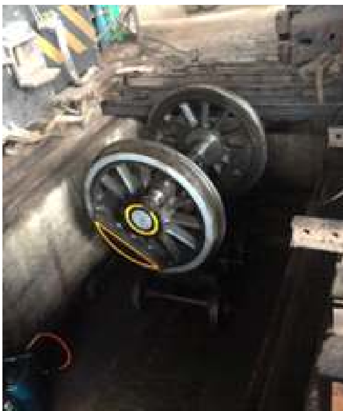
♦ Desmontagem e usinagem dos rodeiros motrizes da locomotiva Mallet nº 204.

Aproveitando a retirada dos rodeiros, os mancais foram revisados e lubrificados. As braçagens da locomotiva foram removidas, passaram por limpeza e re-lubrificação, sendo instaladas na locomotiva no final do mês. Já a caixa de fumaça que havia sido parcialmente removida, devido ao estado crítico de deterioração do material, será remontada no início do próximo mês.