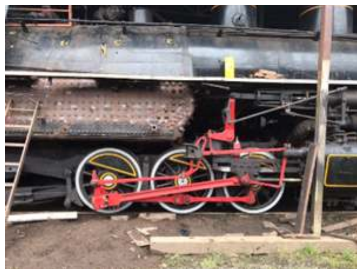
♦ Instalação das braçagens e finalização externa da locomotiva Mallet nº 204.