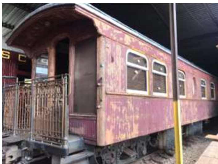
♦ Início do processo de pintura e primeira demão no carro administrativo AM-01