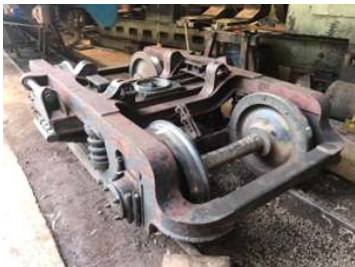
♦ Truque do carro de passageiros AC-07 já inspecionado e pronto para ser reinstalado.