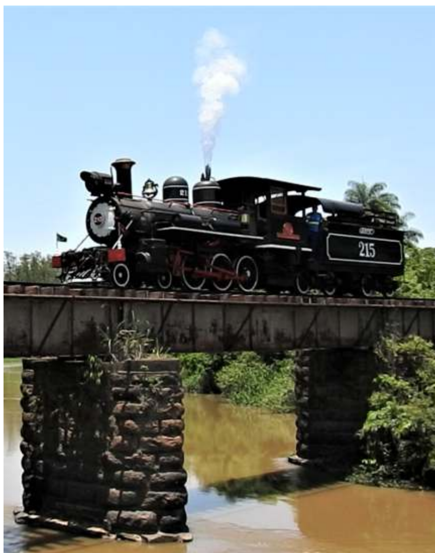
♦ A bela locomotiva 215 passando pela ponte sobre o Rio Atibaia em Campinas/SP.

A associação segue crescendo e evoluindo com aperfeiçoamento, profissionalização e atenção a todas as áreas; o reconhecimento vem crescendo, principalmente no meio ferroviário, onde diversas concessionárias vem estreitando relações e desenvolvendo parcerias. E assim segue o resgate de um capítulo importante da história do país.