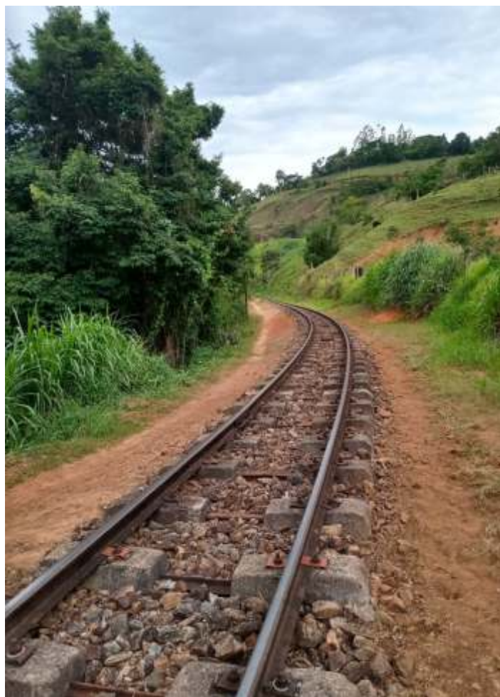
♦ Manutenção da via-permanente: capina, roçada e limpeza ao longo da faixa de domínio