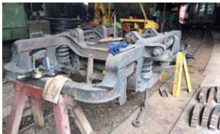
♦ Desmontagem e revisão dos truques do carro de passageiros AC-07.

Em uma terceira frente de trabalhos, realizamos a revisão completa dos truques do carro de passageiros AC-07, utilizado como dormitório de tripulação durante os Trens Comemorativos. Os truques foram removidos, totalmente desmontados, revisados e já estão instalados no veículo. Também aproveitamos este momento pós passeios comemorativos para fazer a pintura do carro administrativo AM-01. Fabricado pelas Oficinas de Curitiba para a Estrada de Ferro do Paraná (EFP) em 1.924, o AM-01 é utilizado para equipagem da tripulação em viagens e passeios comemorativos. Com o retorno às oficinas de Rio Negrinho, o madeiramento externo foi totalmente lixado e o carro pintado. A pintura escolhida é a da Rêde de Viação Paraná – Santa Catarina, sucessora da EFP, a qual o carro foi amplamente utilizado.