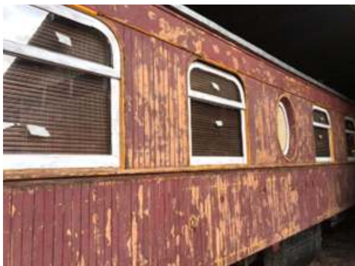
♦ Etapa inicial de lixamento e troca do ripamento comprometido do carro administrativo AM-01.