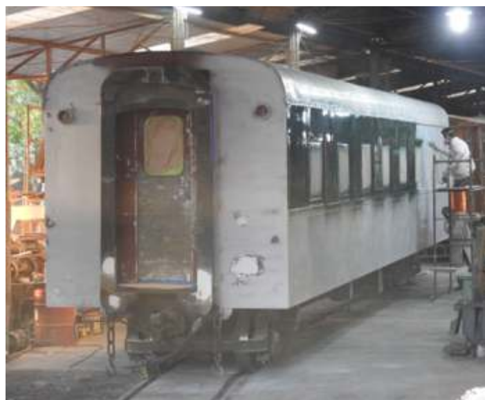
◆ Início da pintura verde.