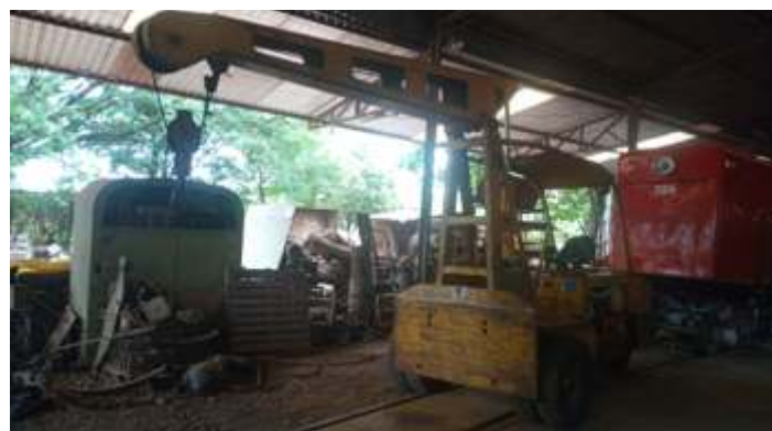
♦ Guindaste Hyster, usado nas oficinas, sendo preparado para pintura.

E no momento iniciamos a repintura do guindaste Hyster (conhecido como canarinho) muito utilizado em nossas oficinas.