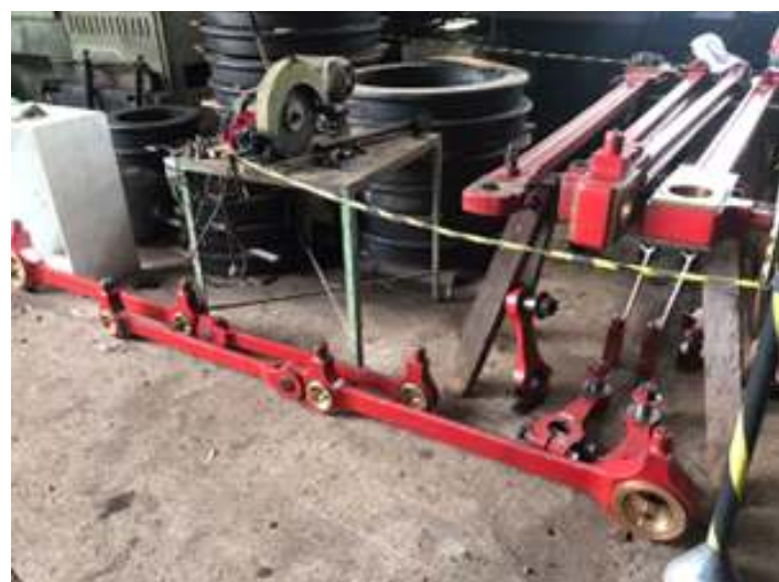
♦ Limpeza e lubrificação das braçagens da Locomotiva Mallet nº 204.