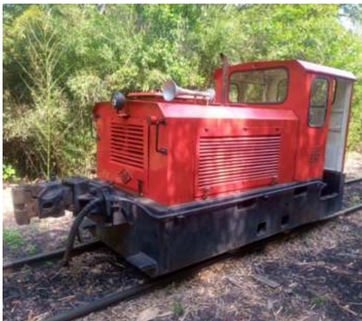
◆ Locomotiva 2 em manobras no pátio de Carlos Gomes

A pequena e valente locomotiva de manobra Orenstein Koppel, número 2, que faz grande parte dos serviços de manobra em Carlos Gomes, recebeu um banho e pequenos reparos como troca de óleo e reativação da buzina.