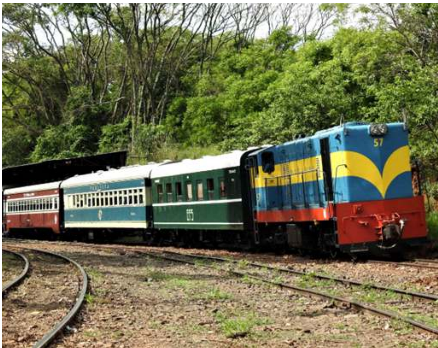
♦ Composição sendo formada, no novo desvio e já com o carro Sorocabana – Foto Vanderlei Zago.

O mês de novembro teve mais uma vez as operações normais. Sentimos uma ligeira queda de visitantes no início do mês, mas melhorando na segunda quinzena.