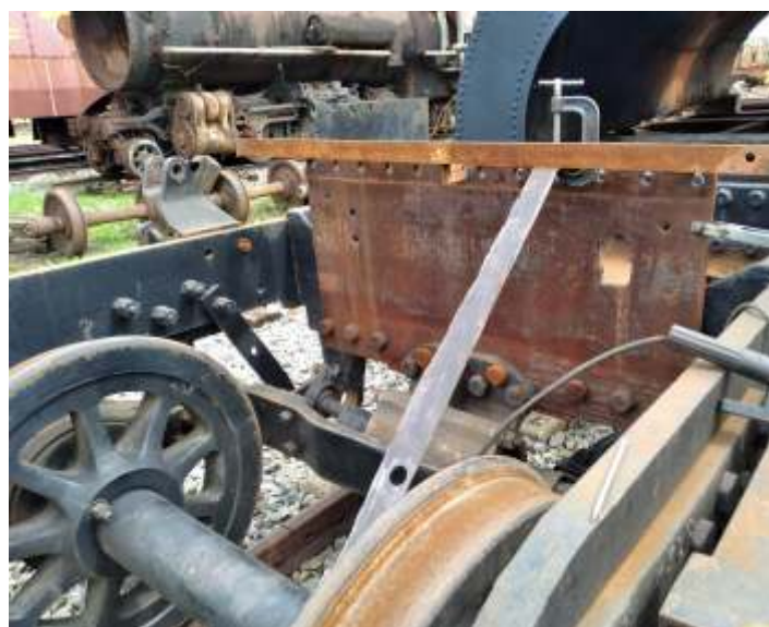
♦ Confeção de novo cinzeiro para a locomotiva nº 522.

Em paralelo está sendo realizada a recuperação das estruturas metálicas de bancos de carros de passageiros, onde as mesmas são desmontadas para se substituir as partes danificadas e/ou desamassar, solda e por fim jateamento e preparação para receber nova pintura.