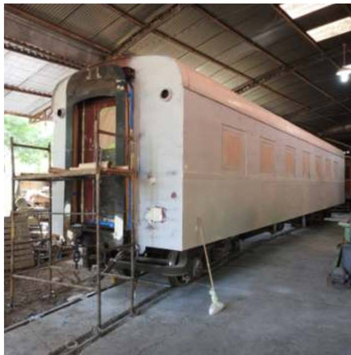
◆ Pintura de fundo e últimos detalhes para pintura.

Nas oficinas de carros de passageiros, concluímos a repintura do carro restaurante da EFS, CR-31, antigo R-404, da série 400 fabricados nas oficinas de Sorocaba. A pintura ficou exatamente como ele era na época da antiga Sorocabana. Foi totalmente raspado e lixado, e recebeu pintura em PU (poliuretano) que é a mesma pintura dos automóveis. Somente o teto e por baixo que foi mantido o esmalte sintético. As janelas que são de madeira, foram repintados de alumínio como se fossem metálicas. Os logotipos foram todos refeitos com a ajuda do Movimento Sorocabana de Preservação Ferroviária, de Sorocaba SP e o mesmo já está trafegando e fazendo muito sucesso no trem. Depois de 51 anos, desde a formação da Fepasa, este é o primeiro veículo que volta a circular com a pintura original verde da Sorocabana.