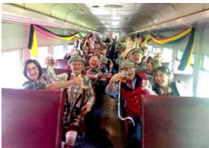
♦ Decoração interna e animação dentro dos carros temáticos do passeio.