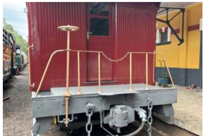
♦ Detalhe da varanda.