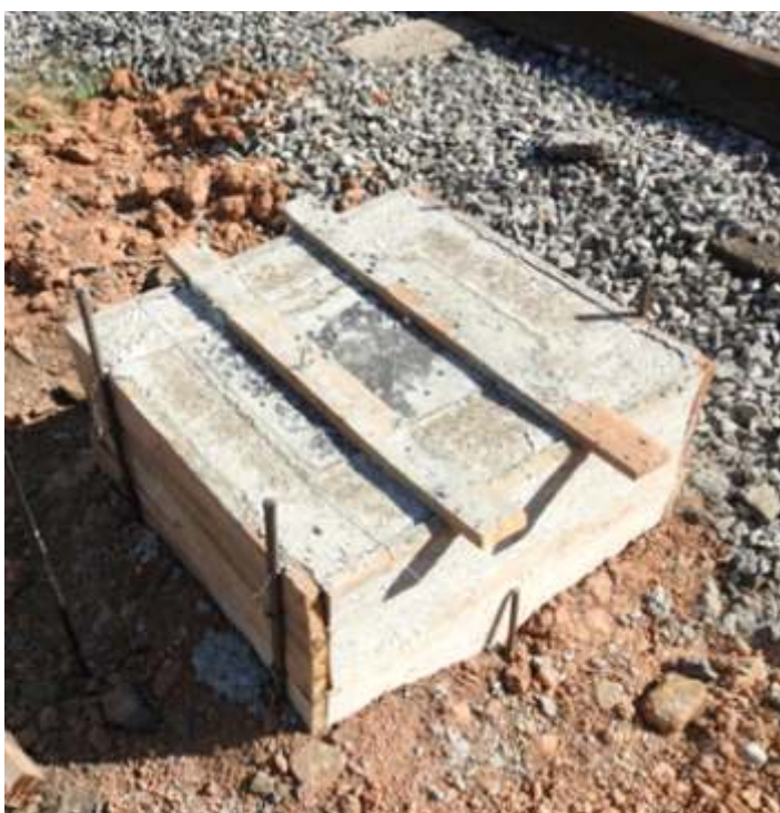
◆ Base já concretada, mas sem desformar.

Como houve sobra de material de outra estrutura, conseguimos fazer por conta própria mais um vão de 6 metros da linha 3 em Anhumas. Com a folga que tinha e mais estes 6 metros, caberá o vagão caboose da Paulista.