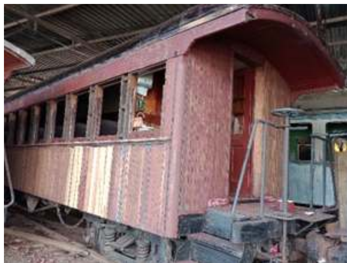
◆ Carro de passageiros PD-37 com a tinta antiga já removida e com ripamento trocado.