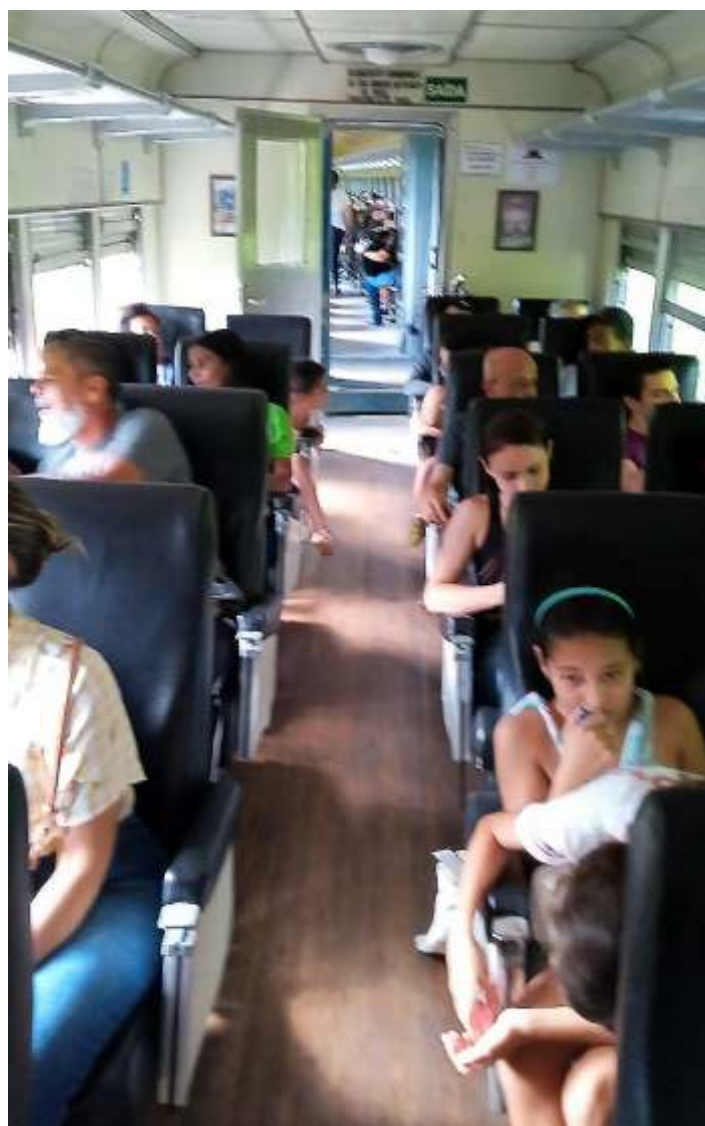
◆ Os moradores a bordo do trem durante o passeio.