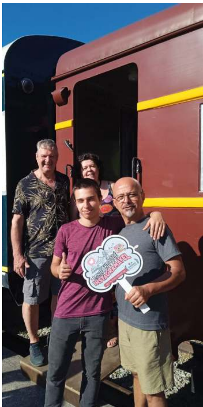
◆ Os moradores embarcando no trem para o passeio.

A ABPF segue como parceira da prefeitura no projeto “Um novo olhar sobre Guararema” e no último dia 30/03, às 14:30h 34 moradores que se inscreveram no projeto realizaram o passeio de trem de forma gratuita, com cortesias fornecidas pela associação dentro do seu programa de “Trens Sociais”, onde a ABPF procura contemplar a comunidade local e as instituições de relevância dos municípios onde atua com passeios gratuitos e/ou como forma de arrecadação de doações para instituições filantrópicas afim de se incentivar a educação patrimonial no município e promover o acesso à este meio de transporte, sendo um resgate desse importante capítulo da história. O custo dessas viagens sociais é 100% subsidiado pela ABPF, não havendo nenhum ônus para as entidades ou órgãos públicos. Este já é o terceiro ano consecutivo onde a ABPF é parceira da prefeitura de Guararema nesse projeto.