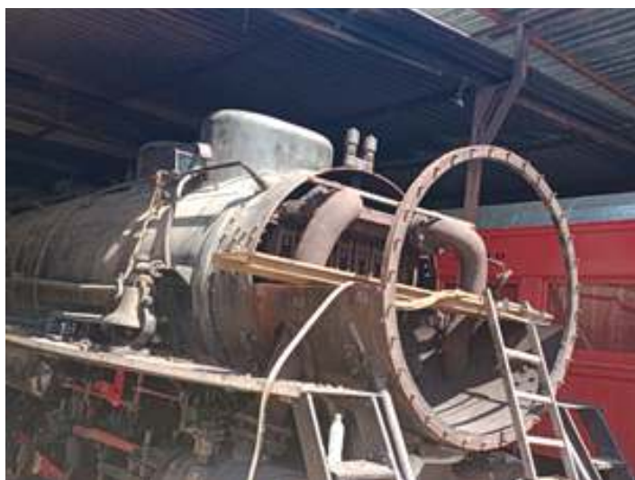
◆ Caixa de fumaça da locomotiva Mikado #761 já com a parte comprometida removida.

Já a locomotiva La Meuse #102 que vem passando por uma longa reforma geral, teve mais um de seus rodeiros retirados para troca do aro. Com a retirada de dois rodeiros de maneira simultânea, pode-se iniciar a desmontagem dos componentes e preparo da locomotiva para pintura.