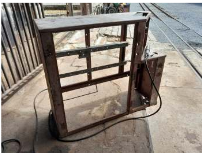
◆ Reparação do gabinete de comando da locomotiva.