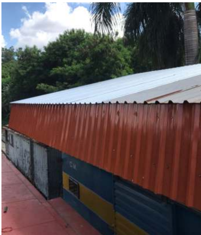
◆ Outra vista da cobertura já concluída.

Nas oficinas de locomotivas, prosseguimos ainda com as intervenções na locomotiva 215 e 338.