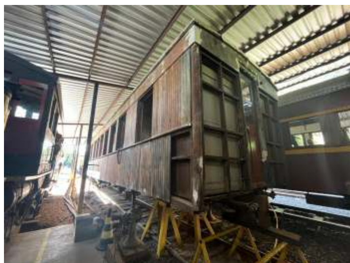
◆ Trabalhos de restauração do Carro Administrativo AM-04.