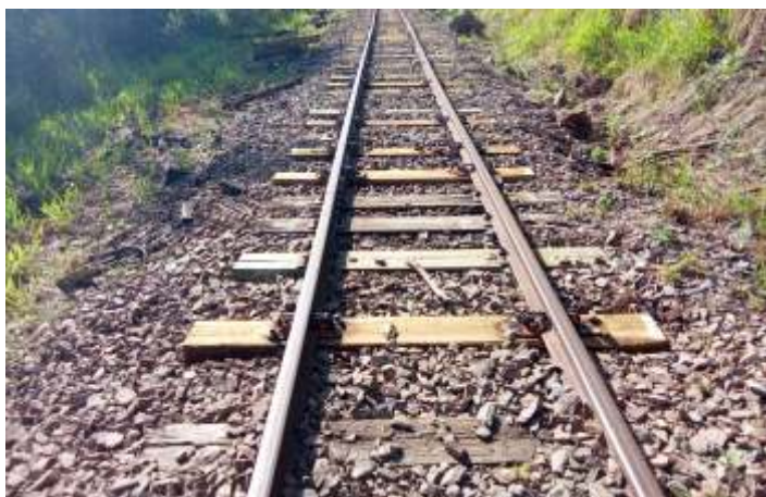
♦ Troca de dormentes no trecho do Trem das Termas.