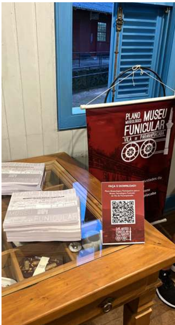
◆ Entrega do Plano Museológico do Museu do Funicular.

O Plano Museológico é um instrumento essencial para o planejamento estratégico de uma Instituição. É a partir da elaboração deste documento que são definidas diretrizes técnicas e funcionais, metas e projetos, norteados por um diagnóstico institucional, com o objetivo de qualificar um museu. Esta ferramenta de planejamento e gestão foi instituída pela Lei Federal 11.904/2009 – a Lei do Estatuto de Museus, regulamentada pelo Decreto Federal 8124/2013 –, que a tornou obrigatória para os museus brasileiros. O Plano Museológico é um instrumento que consolida a instituição no campo museológico paulista e nacional, permitindo novas formas de promover o desenvolvimento do Museu.