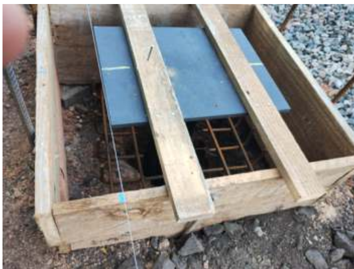
◆ Base já preparada para concretagem.