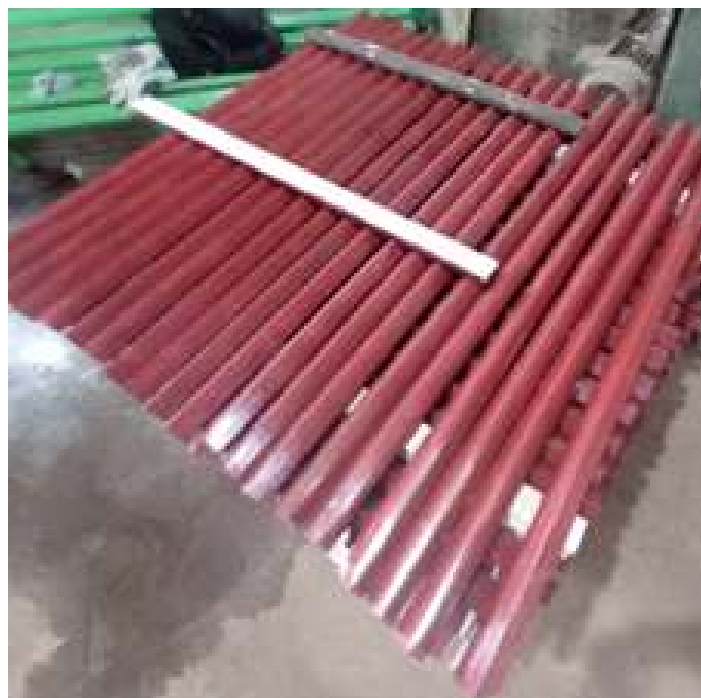
◆ Carro de passageiros PD-37 com a tinta antiga já removida e com ripamento trocado.