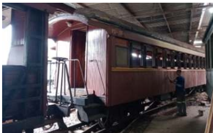
◆ Remoção da tinta antiga no carro de passageiros PD-37.