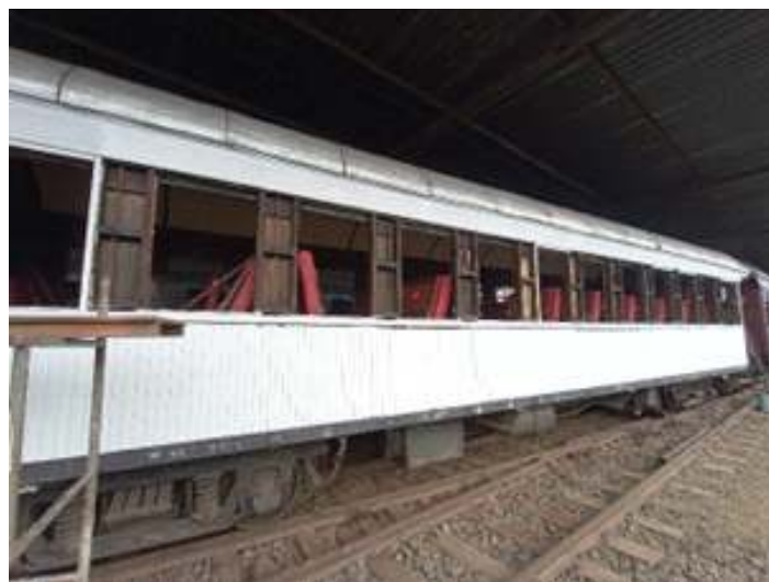
◆ Aplicação de tinta fundo no carro de passageiros PD-46.