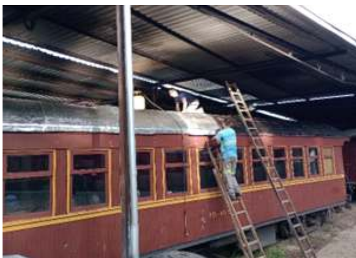
◆ Etapa de aplicação da nova manta asfáltica no teto do carro de passageiros PD-40