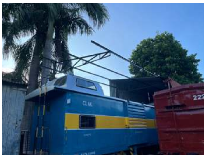
◆ Construção de mais um vão de cobertura.

Como houve sobra de material de outra estrutura, conseguimos fazer por conta própria mais um vão de 6 metros da linha 3 em Anhumas. Com a folga que tinha e mais estes 6 metros, caberá o vagão caboose da Paulista.