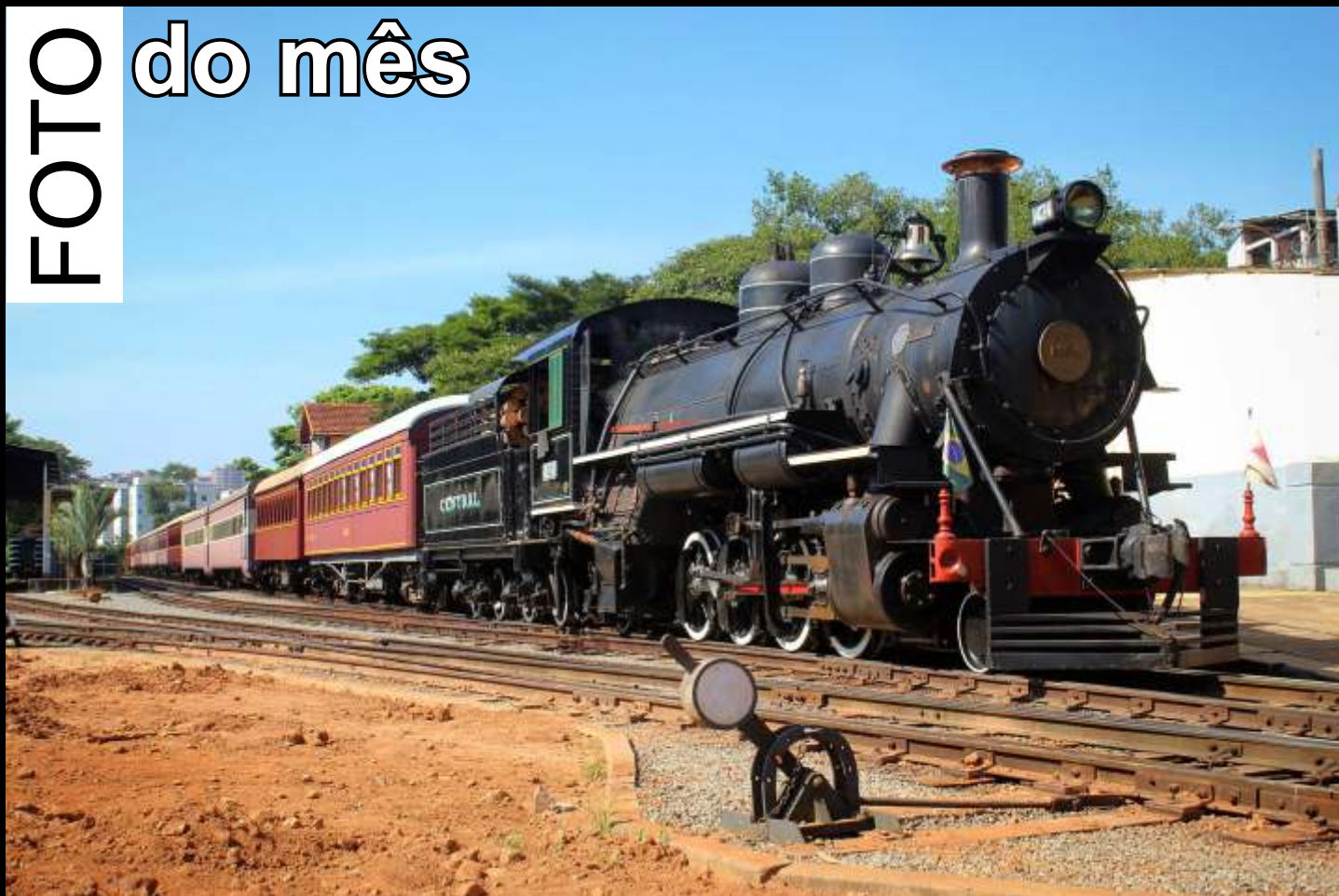
◆ Trem das Águas com a 1424 aguardando para partir da estação de São Lourenço/MG.

Todo mês selecionaremos uma foto relacionada ao trabalho da associação publicada no grupo ABPF - Oficial no Facebook para publicar aqui.