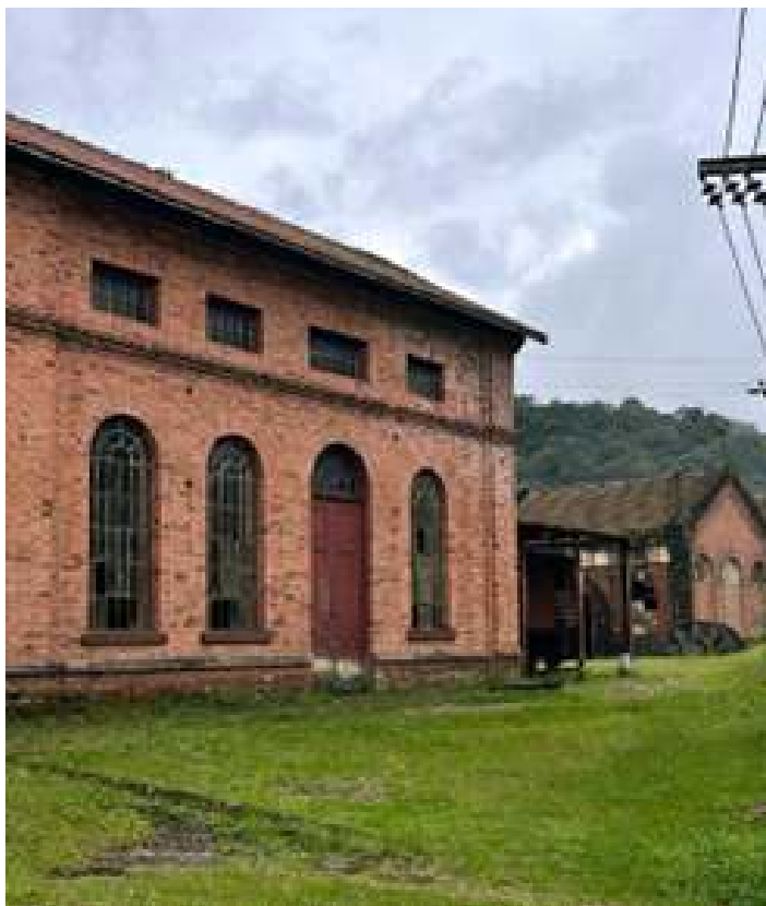
◆ Visão parcial da área do Museu do Funicular, com destaque para a Casa da 5ª Machina.