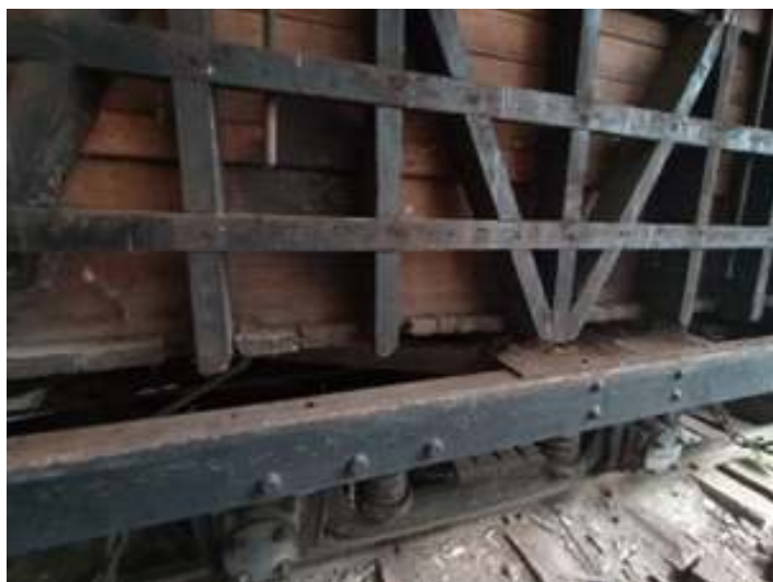
◆ Remoção do madeiramento estrutural comprometido do carro de passageiros PD-46.