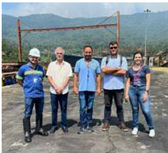
◆ Membros da MRS Logística, ABPF Regional São Paulo e do DNIT durante a visita técnica.

Esta última infelizmente utilizada clandestinamente por pessoas que insistem em fazer caminhadas nas trilhas do antigo Sistema Funicular, mesmo sendo proibidas atualmente pelo Ministério Público e a Instituição que cuida do Parque Estadual da Serra do Mar.