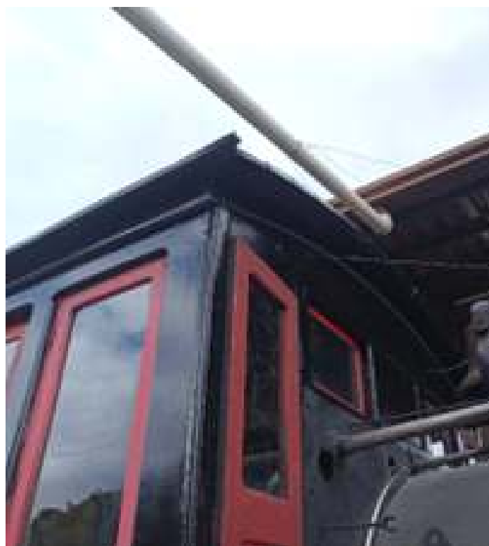
♦ Pintura da locomotiva Mogul #11 finalizada.