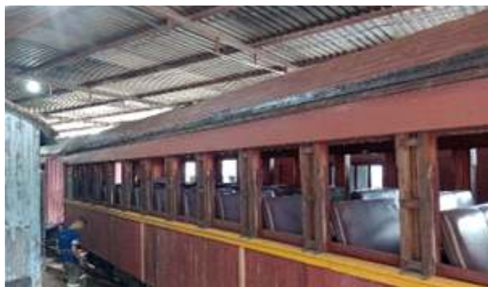
◆ Remoção da manta asfáltica antiga, expondo o ripamento do teto do carro de passageiros PD-37.

No setor da marcenaria, seguimos trabalhando intensamente a reforma estética de três carros de passageiros, de modo simultâneo. O carro de passageiros PD-37 teve a manta asfáltica do teto removida para a aplicação de nova manta, evitando assim, possíveis infiltrações de água da chuva. Após, o exterior do veículo foi lixado e a tinta antiga removida. Em pontos específicos, o ripamento externo que estava comprometido foi substituído por novo. O carro foi então preparado para pintura, onde aplicou-se tinta fundo e na sequência a tinta definitiva. As próximas etapas para o veículo compreendem agora a finalização da pintura e dos acabamentos.