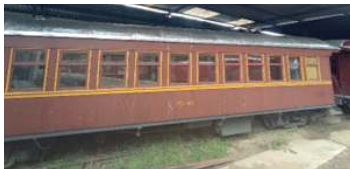
◆ Carro de passageiros PD-40 com a nova manta asfáltica já instalada.

Uma terceira frente de trabalhos abrangeu o carro de passageiros PD-46, o qual apresentou dispendioso processo de restauro exterior. De primeiro momento, o ripamento externo foi removido, onde notou-se que parte da madeira estrutural estava comprometida necessitando ser também substituída.