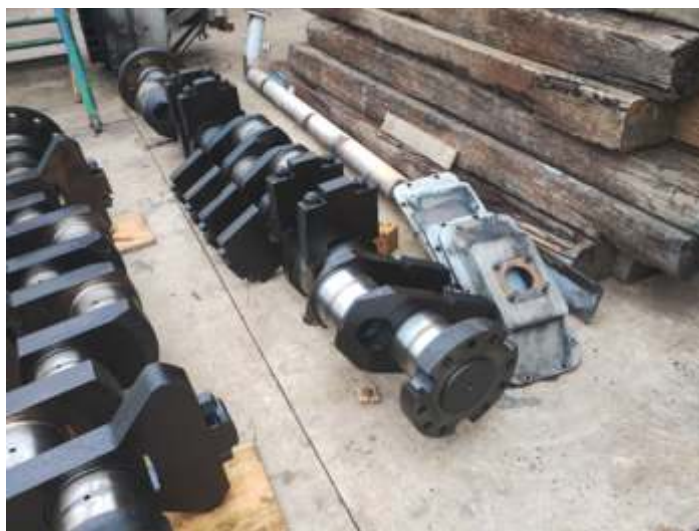
◆ Detalhe do virabrequim (lado esquerdo) da 3104.

A locomotiva GE 3104., estamos aguardando avaliação do estado geral e da empresa terceirizada que faz a cromação do virabrequim. Após isso é que será avaliado tudo e feita a montagem.