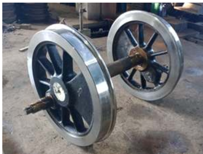
◆ Aspecto de antes e depois da troca dos aros da locomotiva La Meuse 102.