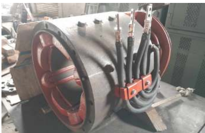
◆ Motor de tração desmontado sendo revisado.