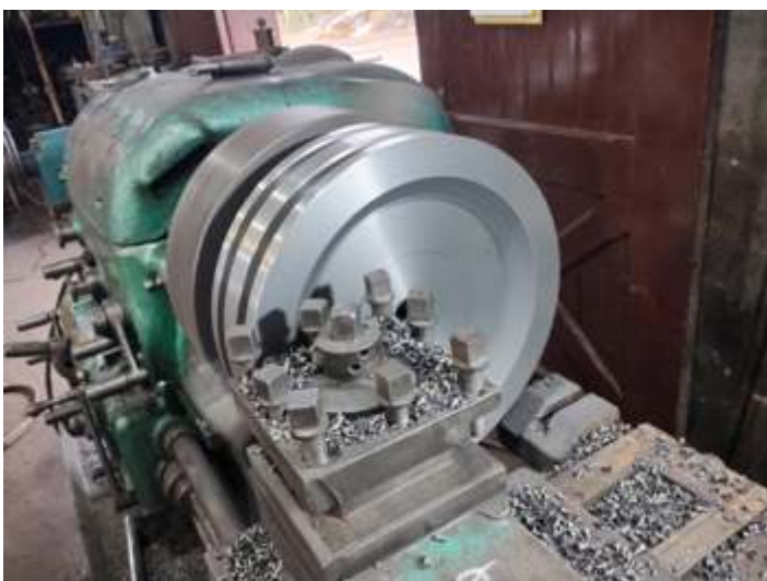
◆ Confecção do novo embolo da 215 nas oficinas de Carlos Gomes.

Os serviços de confecção de novo embolo e anéis já foram retomados. Houve um pequeno empenamento na guia do paralelo e na haste, que também já foram reparados e instalados.