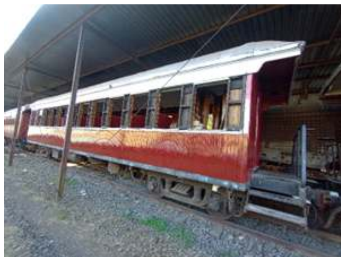
◆ Pintura parcial externa do carro de passageiros PD-46