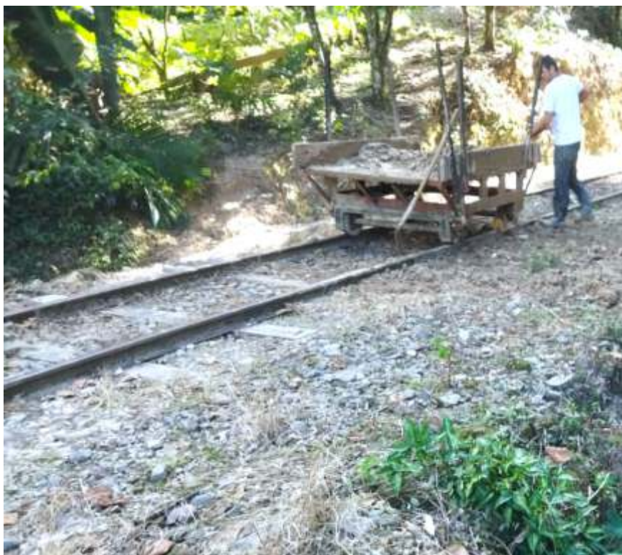
♦ Limpeza pesada, no trecho mais afetado pelas intempéries do clima.

A coordenação do NuRVI agradece a todos os seus associados, voluntários e colaboradores que de várias formas se dedicam à preservação da memória histórica da extinta EFSC, dedicando suas horas de folga aos trabalhos no “Trem do Vale Europeu – EFSC”.