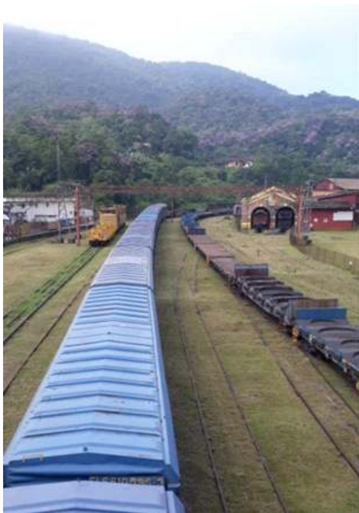
◆ Visão parcial de onde será feita a segregação das áreas operacional da MRS e do Museu do Funicular.