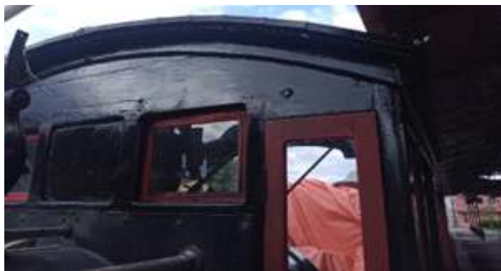
♦ Aspecto de antes e depois da pintura na pintura da locomotiva Mogul #11.