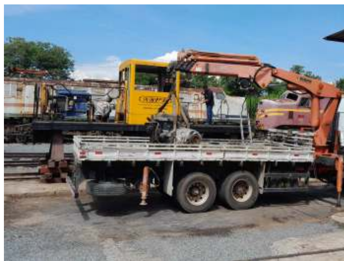
◆ Remoção dos conjuntos de motores diesel/geradores.