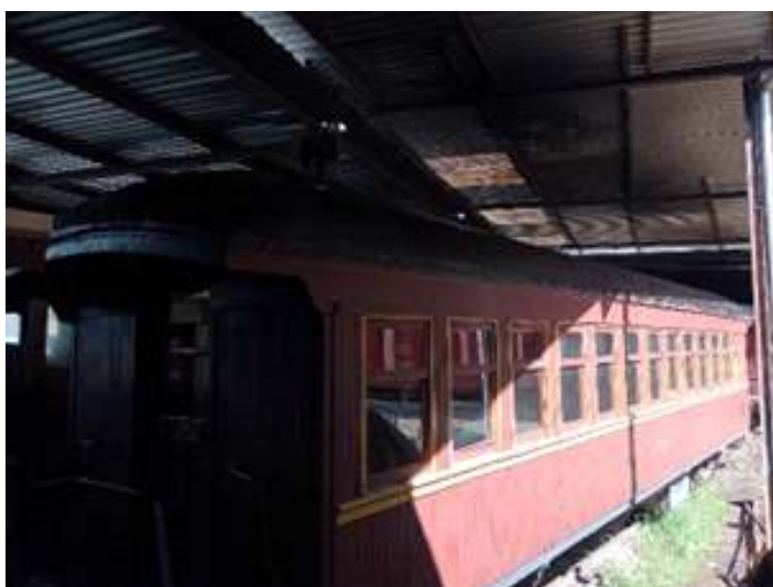
◆ Cobertura com piche e preparo do teto para receber a nova manta asfáltica.