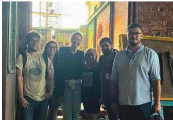
◆ Na foto, o Grupo técnico que elaborou o Plano Museológico, juntamente com Diretoria e colaboradores da ABPF durante visitas em campo no Museu Tecnológico de Paranapiacaba.

Em 19 de março, ocorreu uma visita técnica entre membros da MRS Logística, ABPF Regional São Paulo e o DNIT (Departamento Nacional de Infraestrutura de Transporte) para a discussão sobre a segregação de áreas entre o Museu Tecnológico Funicular e Pátio MRS. Estas reuniões visam determinar a delimitação de áreas que pertencem a Concessionária MRS Logística e o Museu, como a instalação de barreiras físicas (grades e alambrados) para evitar-se a invasão de pessoas na faixa de domínio de operação ferroviária e também para a proteção do Museu contra acessos não autorizados dentro de nossa área e a parte mais distante da 5ª Máquina.