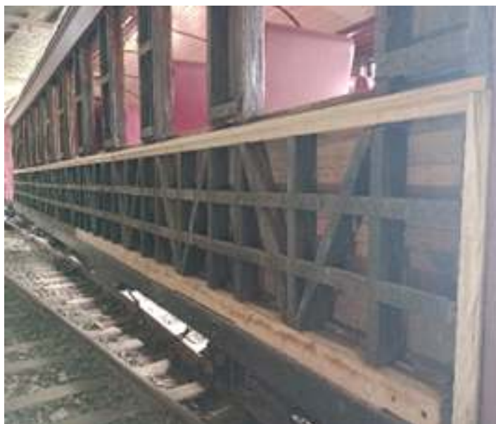
◆ Reconstrução do madeiramento estrutural que precisou ser substituído.