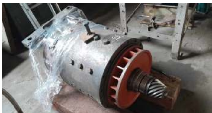
◆ Um dos motores de tração já reformado