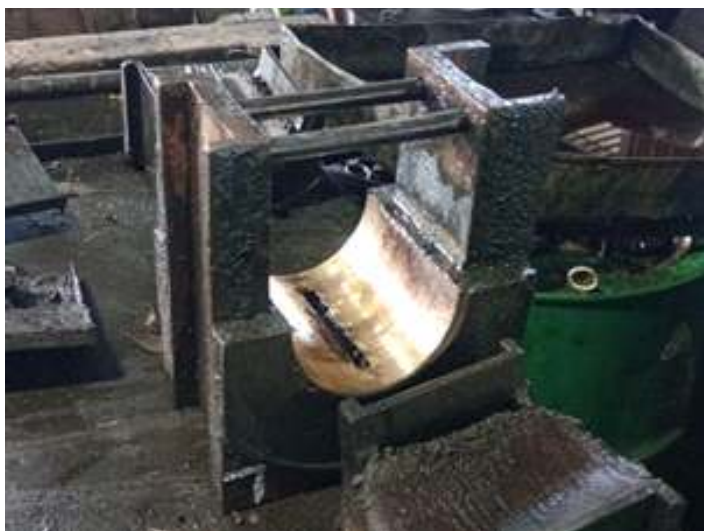
◆ Limpeza da caixa de mancal dos rodeiros da locomotiva La Meuse #102.

No setor da marcenaria, seguimos trabalhando intensamente a reforma estética de três carros de passageiros, de modo simultâneo. O carro de passageiros PD-37 teve a manta asfáltica do teto removida para a aplicação de nova manta, evitando assim, possíveis infiltrações de água da chuva. Após, o exterior do veículo foi lixado e a tinta antiga removida. Em pontos específicos, o ripamento externo que estava comprometido foi substituído por novo. O carro foi então preparado para pintura, onde aplicou-se tinta fundo e na sequência a tinta definitiva. As próximas etapas para o veículo compreendem agora a finalização da pintura e dos acabamentos.