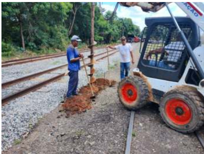
◆ Detalhe do início da furação para instalação das bases.