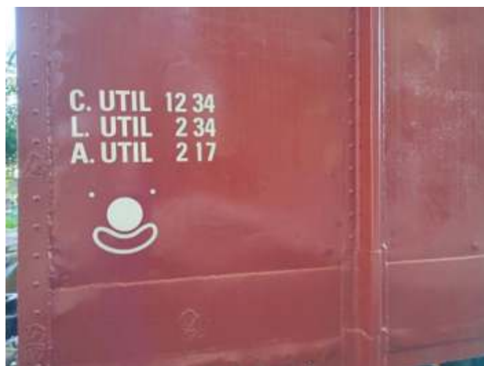
♦ Detalhe da outra cabeceira do vagão.