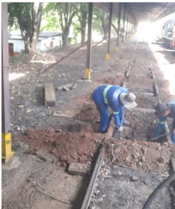
♦ Troca de dormentes na linha 3 em Anhumas.

E por fim o quarto vagão do total de 5, que já havia sido pintado no final do ano passado, recebeu as inscrições da Sorocabana e agora já está liberado e devemos começar os serviços no último da série.