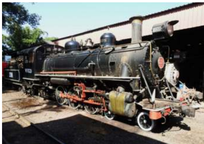
◆ Locomotiva 338 já com o trole guia instalado.