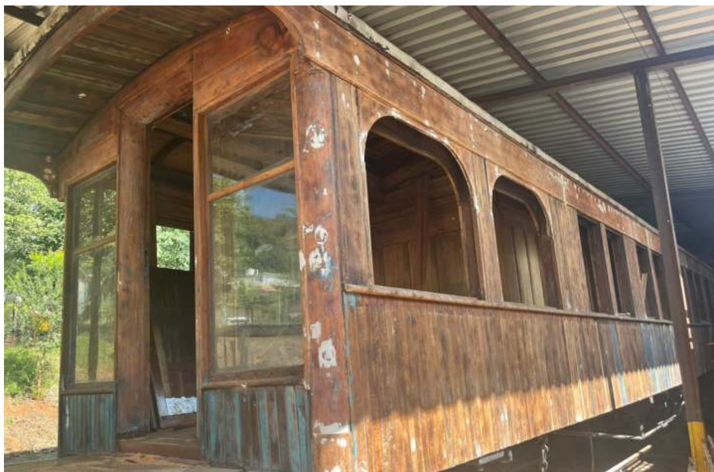
♦ Trabalhos de restauração do Carro Administrativo AM-04.