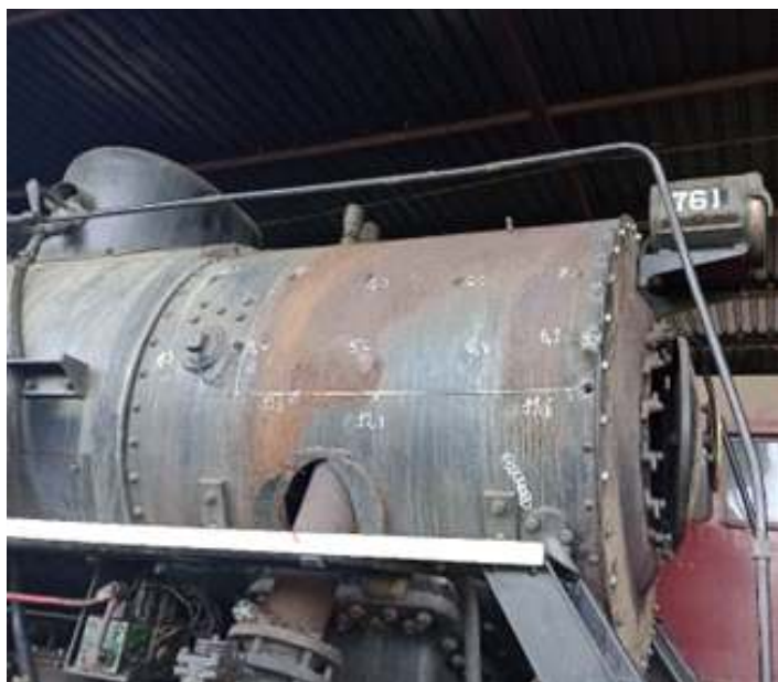
◆ Prospecção com ultrassom na locomotiva a vapor Mikado #761.

A locomotiva Mikado #761 que havia passado por troca de aros e tubos nos meses anteriores, passou agora por prospecção com ultrassom, onde notou-se a necessidade da troca da parte superior da caixa de fumaça.