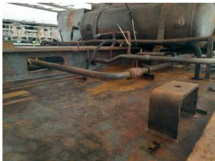
◆ Após a remoção dos conjuntos de motores diesel/geradores, foi realizada a limpeza do estrado.