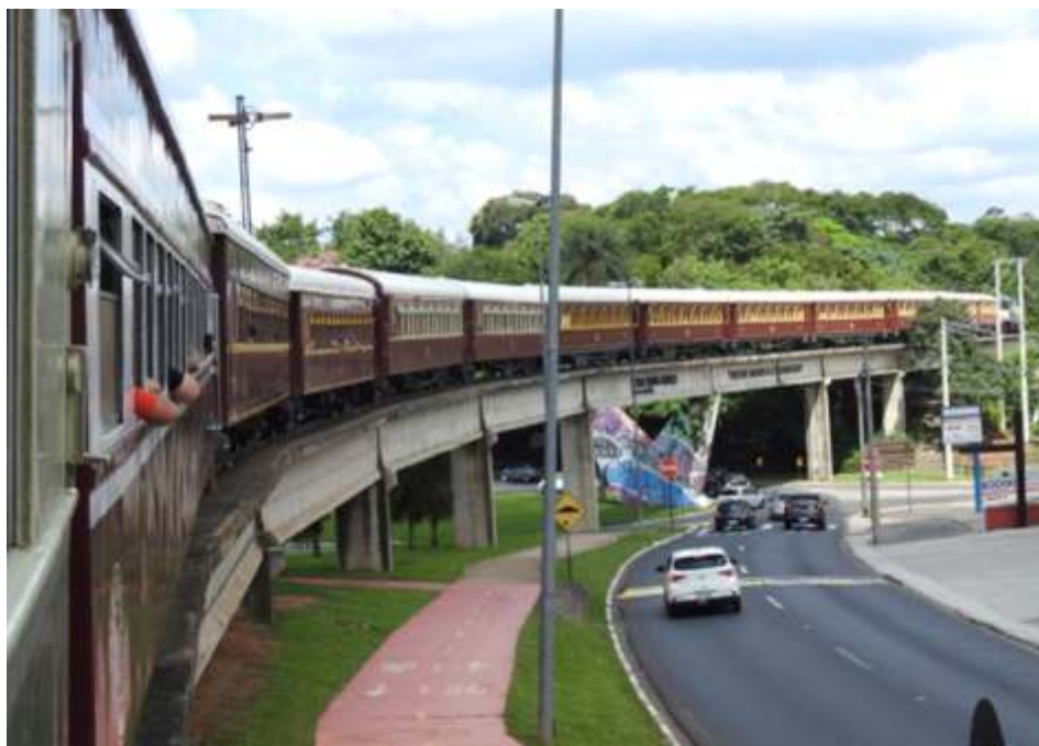
◆ Trem retornando de Jaguariúna para Anhumas.

As estruturas metálicas já foram recebidas e o início da montagem será a partir de 8 de abril.