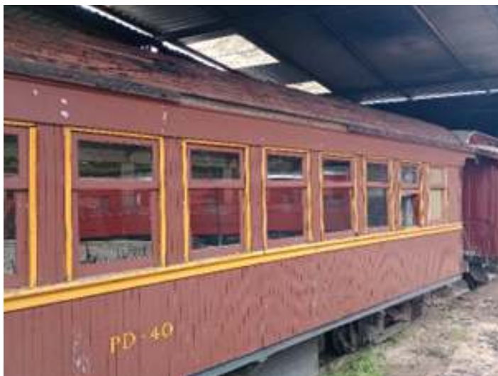
◆ Remoção da manta asfáltica do teto do carro de passageiros PD-40.

Outro carro que passou por melhorias foi o carro de passageiros PD-40. Assim como o PD-37, este teve a manta do teto removida com posterior aplicação de nova manta. Na sequência, deu-se início à etapa de limpeza e remoção de tinta do exterior, para posterior pintura do veículo.