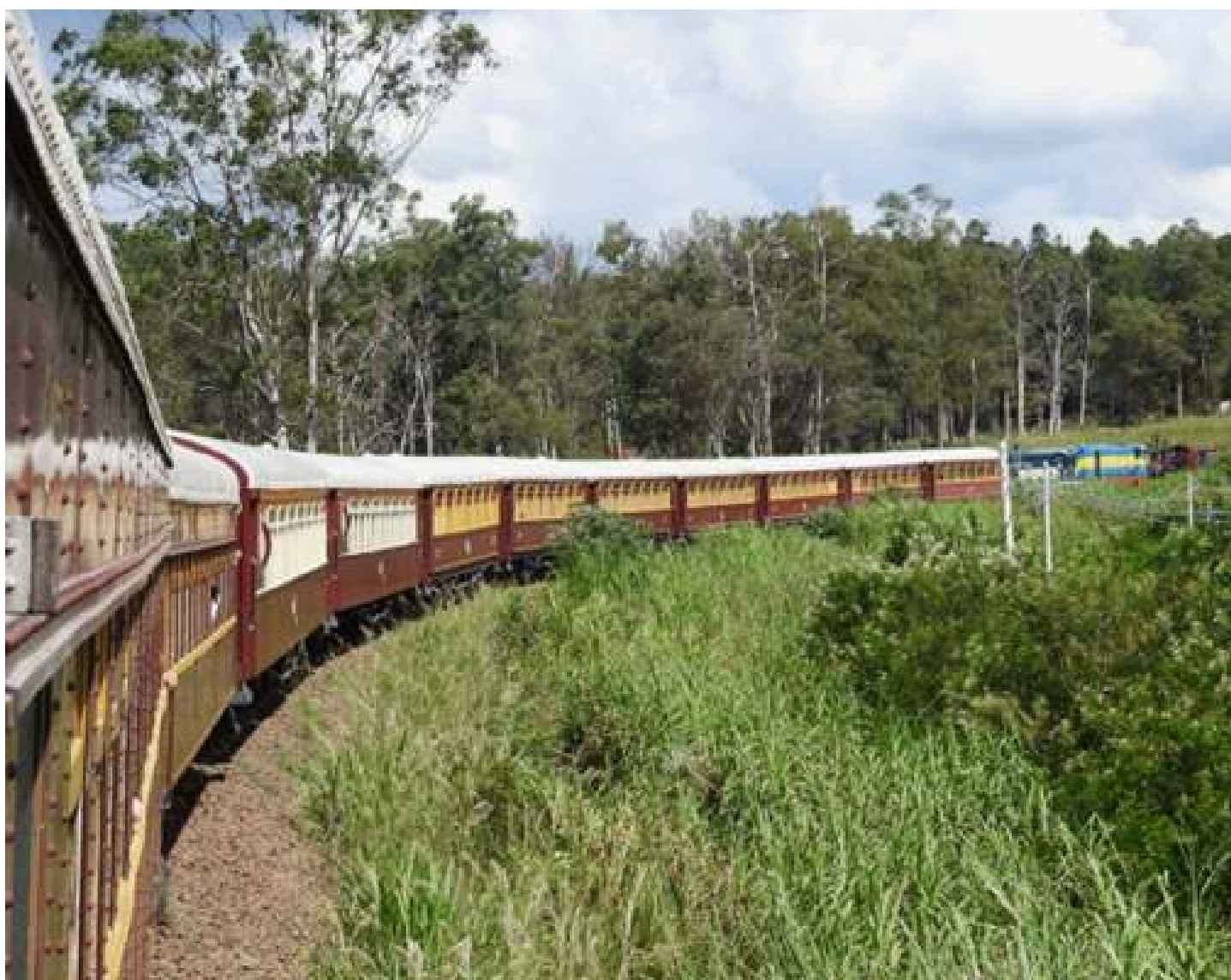
◆ Outra foto no famoso curvão do km 15.