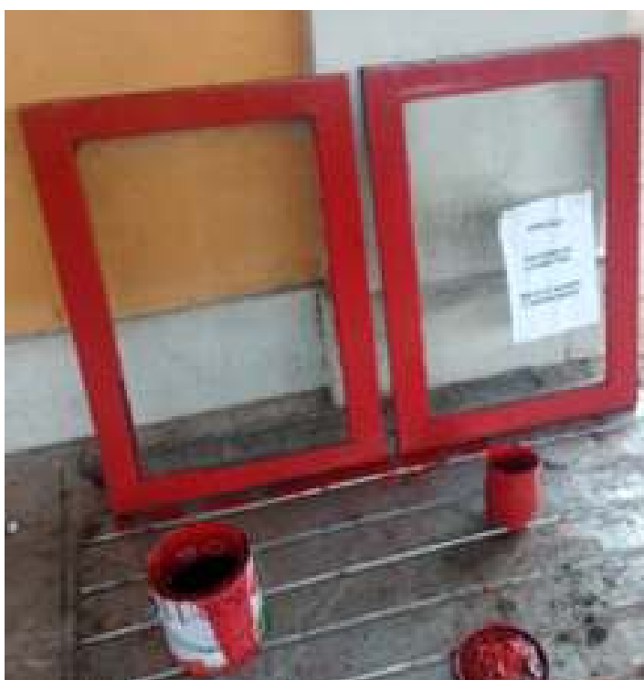
♦ Pintura das janelas da cabine da locomotiva Mogul #11.