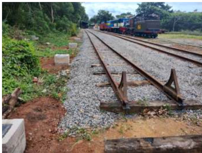
◆ Um dos finais de linha em instalação na linha 3.