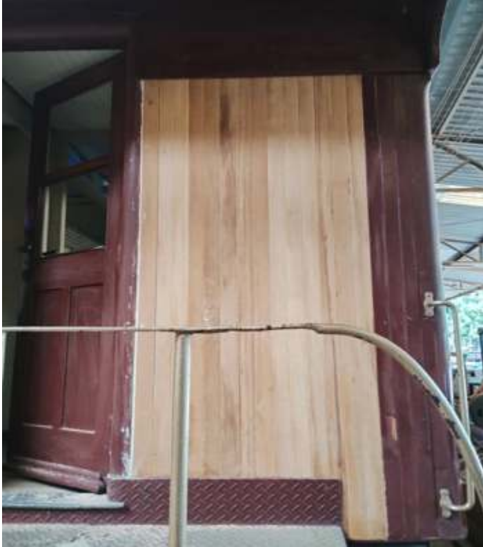
♦ Detalhe da troca do revestimento externo.

Nas oficinas de carros de passageiros, foi concluído os serviços de pintura e reparos do carro CA-18 da antiga VFRGS e já voltou ao tráfego no mês de março, precisamente no dia 30. Em seguida começamos a repintura do carro CA-8 da antiga Mogiana, onde iniciamos os reparos no madeiramento e preparação para a pintura. Esperamos até final de abril o carro estar novamente no trecho.