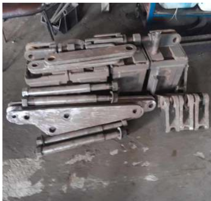
◆ Alguns componentes do sistema de freio desmontados e já limpos.