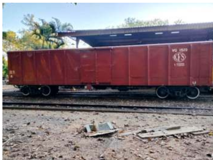
♦ Vista geral do vagão após conclusão das inscrições.