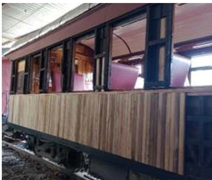
◆ Reconstrução do ripamento lateral do carro de passageiros PD-46.