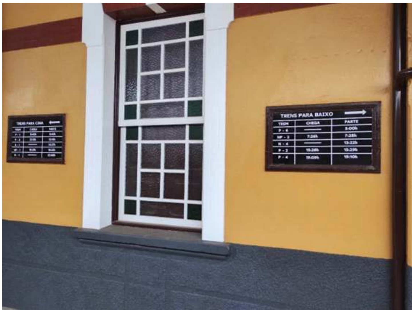
◆ Horários dos trens em Carlos Gomes no ano de 1965.