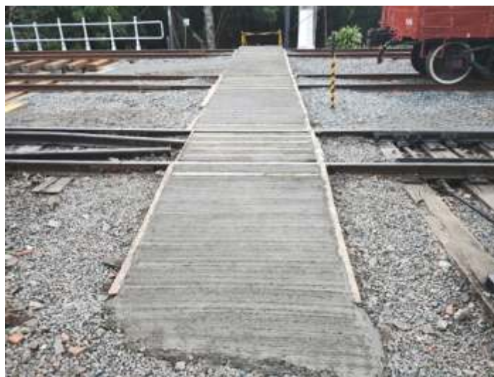
◆ Concretagem da passagem de pedestres do acesso ao estacionamento.