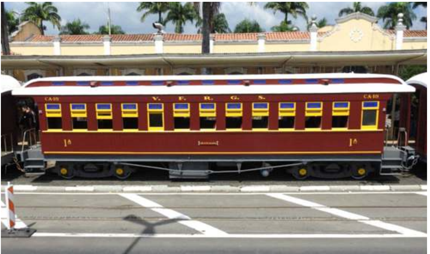
♦ Carro já no tráfego em Jaguariuna.