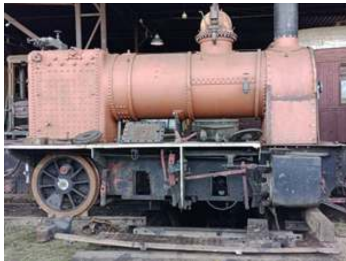
◆ Locomotiva La Meuse #102 parcialmente desmontada já com os rodeiros removidos.

Já a locomotiva La Meuse #102 que vem passando por uma longa reforma geral, teve mais um de seus rodeiros retirados para troca do aro. Com a retirada de dois rodeiros de maneira simultânea, pode-se iniciar a desmontagem dos componentes e preparo da locomotiva para pintura.