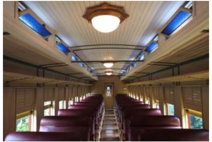
♦ Interior do CA-18.