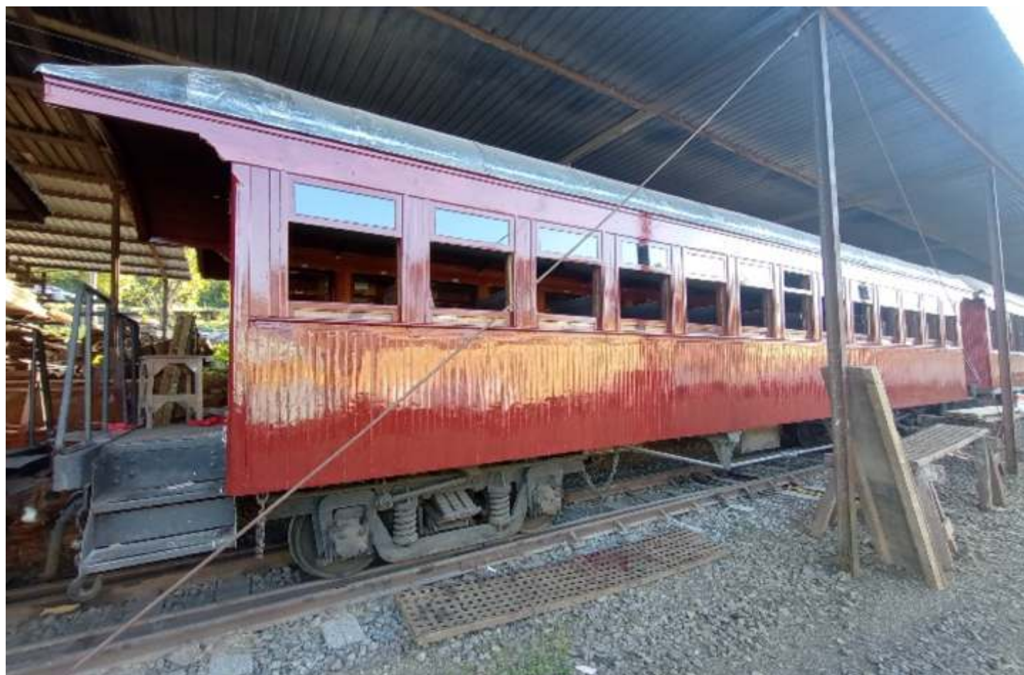
♦ Carro de passageiros PD-37 com a pintura externa praticamente finalizada.