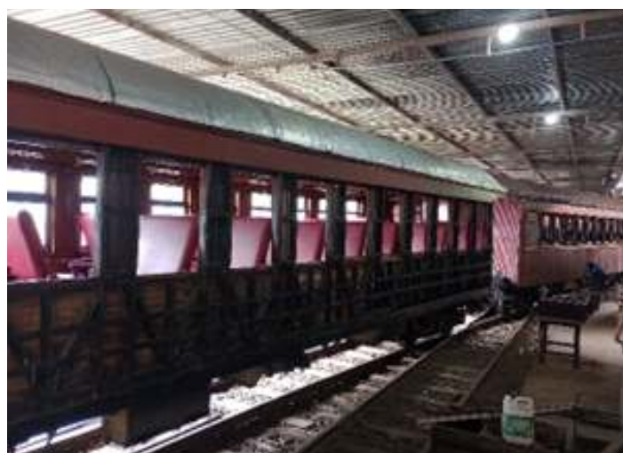
◆ Remoção do madeiramento lateral do carro de passageiros PD-46.