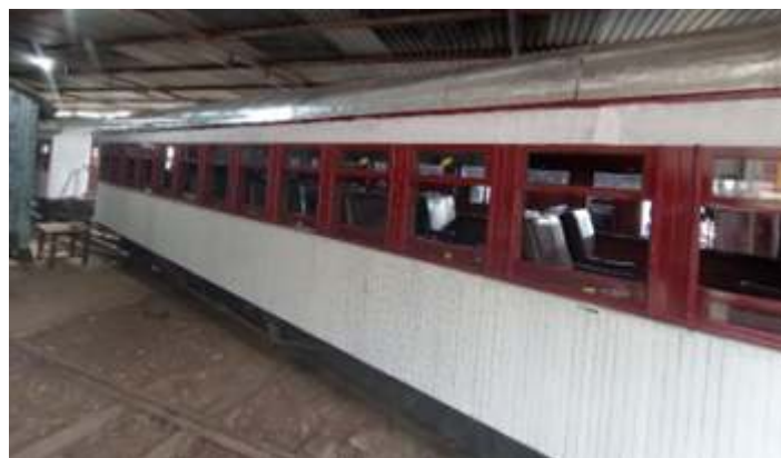
◆ Carro de passageiros PD-37 com a pintura fundo aplicada e início da pintura definitiva em vermelho.