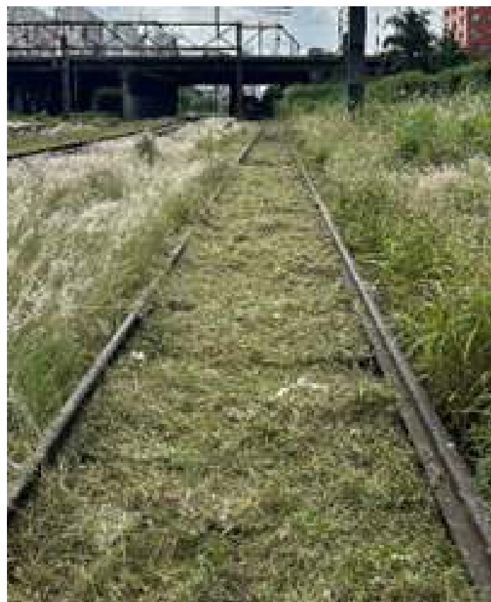
◆ Serviço de limpeza da via.