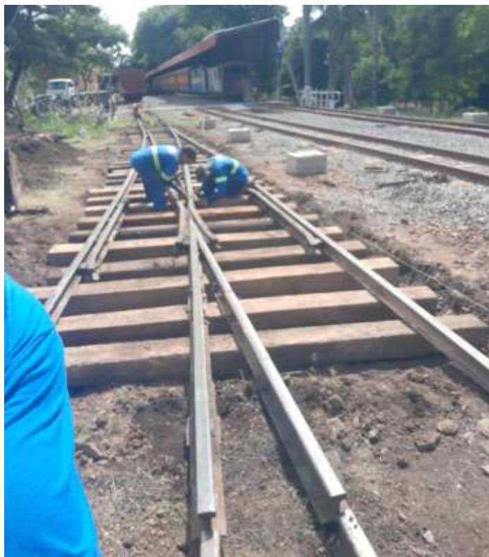
♦ Troca de dormentes do AMV de acesso ao girador.

A via permanente fez além de serviços de limpeza e roçagem no trecho, a substituição do madeiramento do AMV de acesso ao girador da estação Anhumas. Foi substituído 100% do madeiramento do AMV, além de nivelamento e alinhamento e após recebeu brita nova. Também foram substituídos 40 dormentes da linha 3 no trecho coberto em Anhumas.