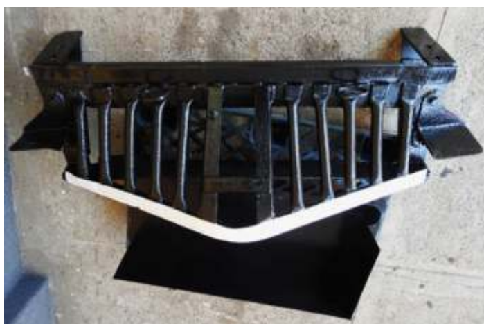
◆ Limpa trilhos da 338, após reparo, limpeza e pintura para ser instalado.

Na operação estão as locomotivas 604 e a 9, e as diesel 3, 57, 905 e 3128.