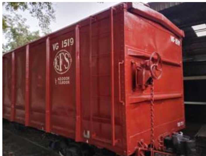
♦ Detalhe do vagão Pressed steel ostentando a pintura original.

E por fim o quarto vagão do total de 5, que já havia sido pintado no final do ano passado, recebeu as inscrições da Sorocabana e agora já está liberado e devemos começar os serviços no último da série.