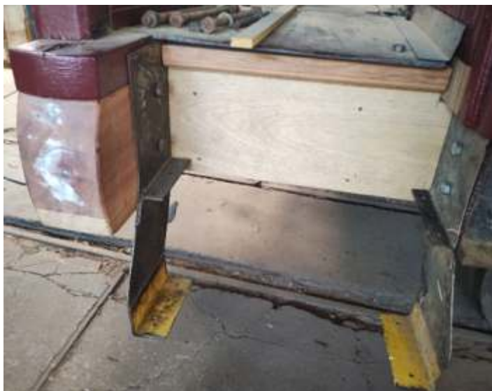
◆ Detalhe da ponteira nova e as ferragens do estribo.