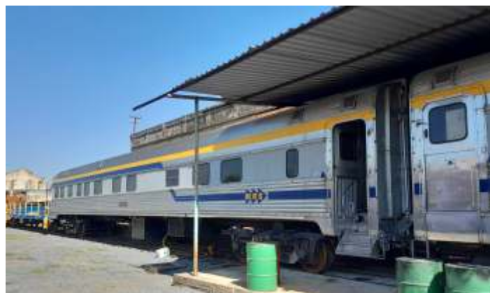
◆ Carros de passageiros da MRS Logística passando por revisão e checkup nas oficinas de Cruzeiro da ABPF.