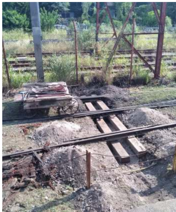
◆ Substituição dos dormentes do AMV que faz o acesso a locomotiva “V8”, aos carros de aço carbono e a “Berkshire”.