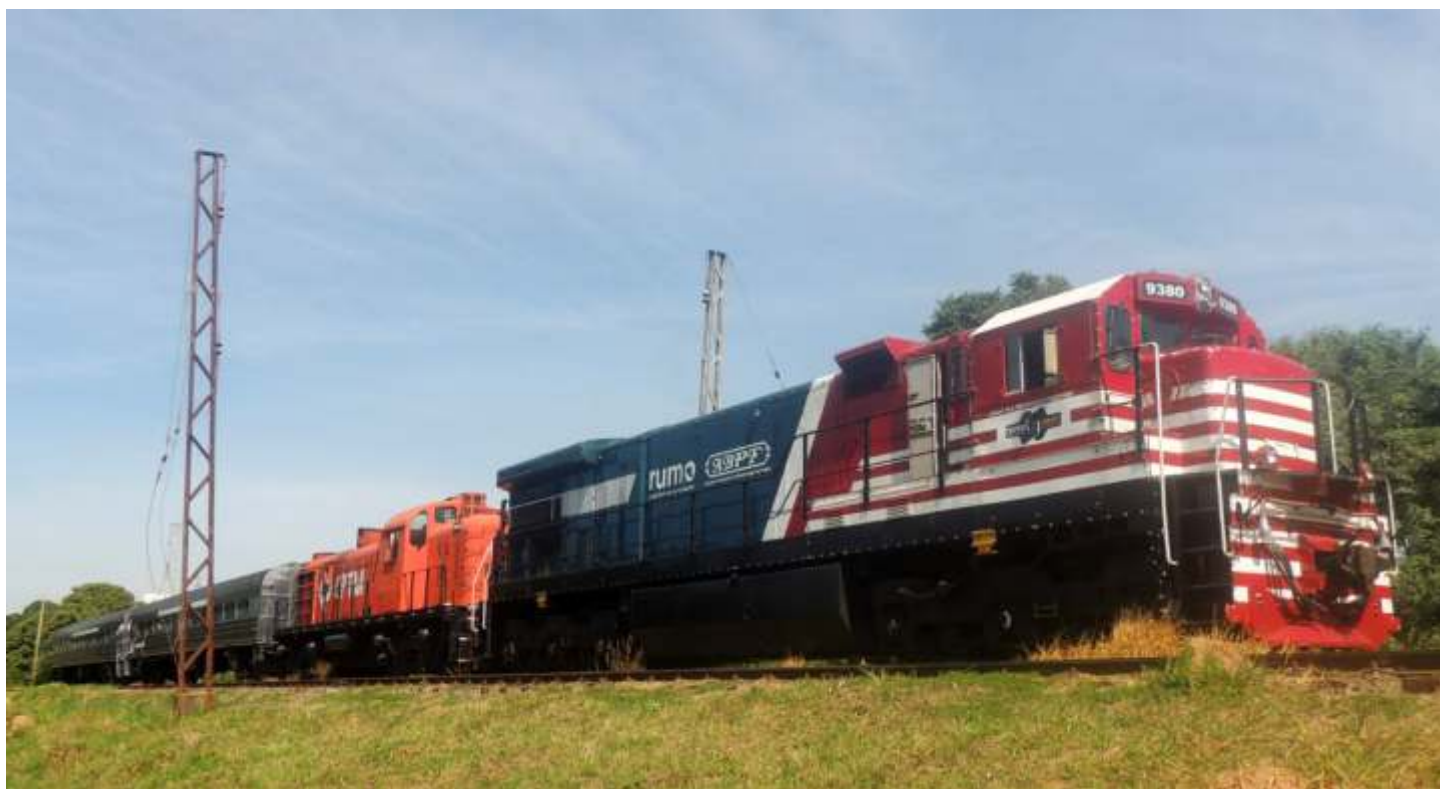
◆ O trem especial durante uma das paradas ao longo do trecho para a coleta de dados pelos técnicos. A composição, liderada pela 9380 teve ainda a RS3 6006 da CPTM e dois dos carros do Expresso Turístico.