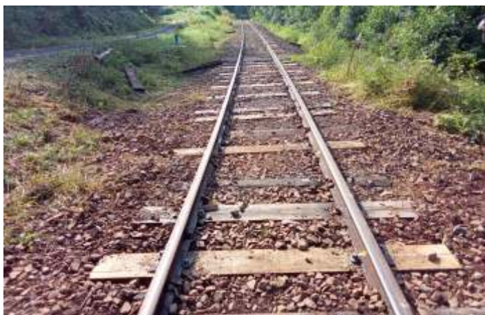
♦ Troca de dormentes no trecho do Trem das Termas.