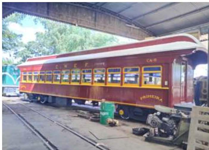
◆ Carro Mogiana CA-8 com pintura quase pronta.

Nas oficinas de carros de passageiros, foi concluída a repintura e troca de algumas madeiras do carro CA-8, algumas correções de freio e também da parte elétrica. Já está liberado para o próximo trem partindo de Jaguariúna.