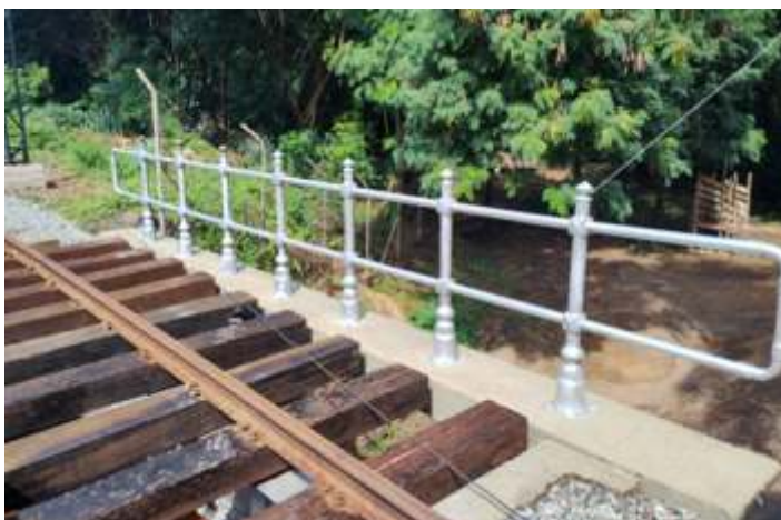
◆ Gradil do lado esquerdo. (O menos danificado)

Também conseguimos colocar mais um pouco de brita no AMV do girador que foi feito, bem como em uma parte do pátio.