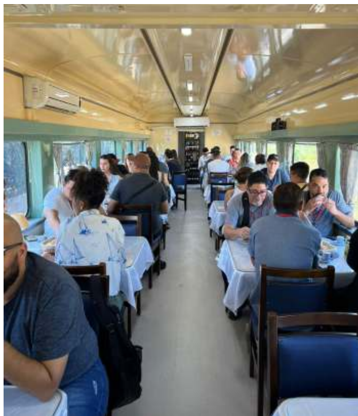
◆ Convidados a bordo do carro restaurante RC 3304.

envolvidos, o que contribui ainda mais para a já consolidada parceria entre a ABPF e a CPTM. Um agradecimento especial à MRS Logística por flexibilizar a operação destes trens especiais em sua malha ferroviária, planejando a circulação de maneira a atender as demandas solicitadas sem impactar a grade de circulação dos trens de carga.