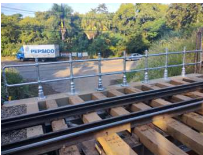
◆ Gradil lado direito em Anhumas