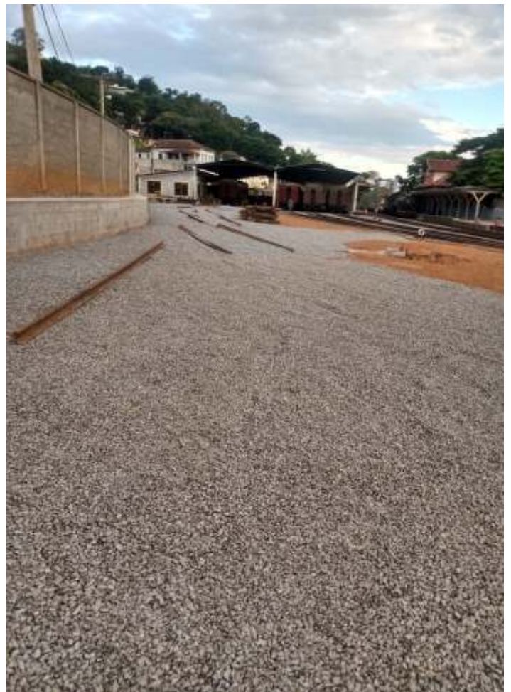
♦ Limpeza e aplicação de brita em toda a área do pátio.