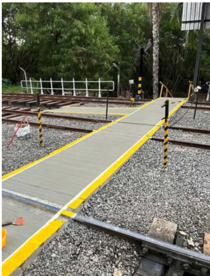
◆ Pintura das faixas de segurança na travessia de pedestres.

Foi feita também a pintura das faixas amarelas da passagem de pedestres para acesso a plataforma e estacionamento.