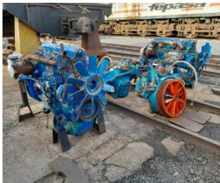
◆ Os motores e compressores após a limpeza.

Toda a parte elétrica será refeita, com substituição de todo o cabeamento e revisão de todos os componentes, dos quais vários já foram trabalhados e recuperados. Os que não tiverem recuperação, serão substituídos afim de deixar a locomotiva plenamente confiável e segura. Para finalizar, a locomotiva receberá serviço de funilaria completo.