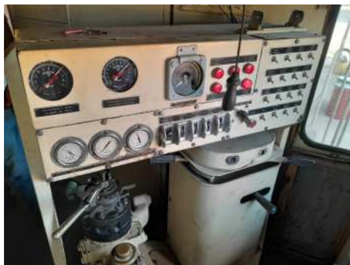
◆ Painel e console de comando da ALCO RSD8 n°3507.