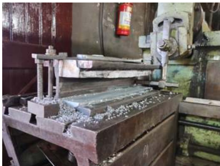
◆ Uma das partes do paralelo sendo enchidas com metal.