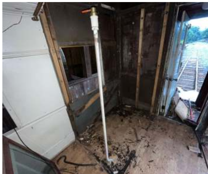
◆ Trabalhos de reforma do carro PC-50.