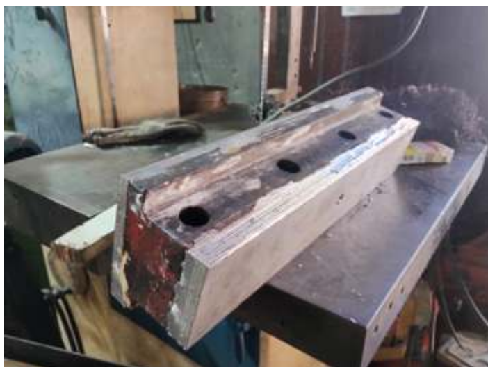
◆ Outra parte do paralelo já enchido e usinado.

Os novos êmbolos e anéis, já foram instalados e concluídos.