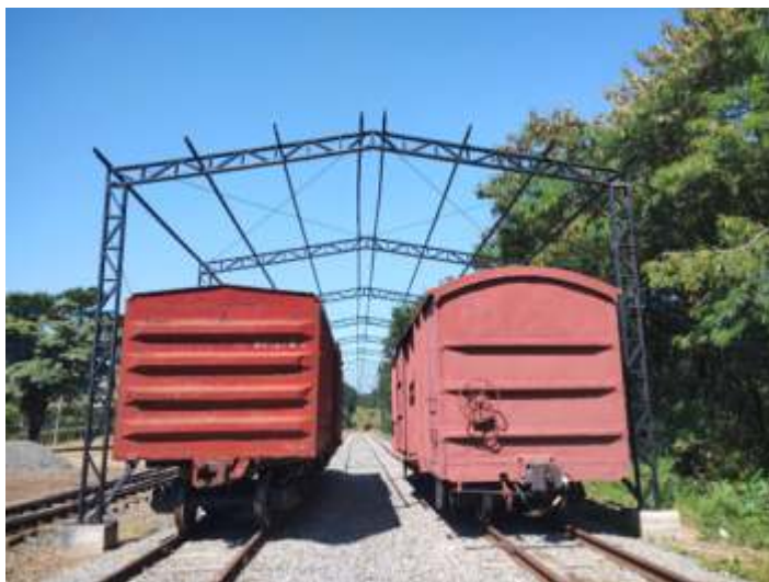
◆ Vagões sendo usados na obra.