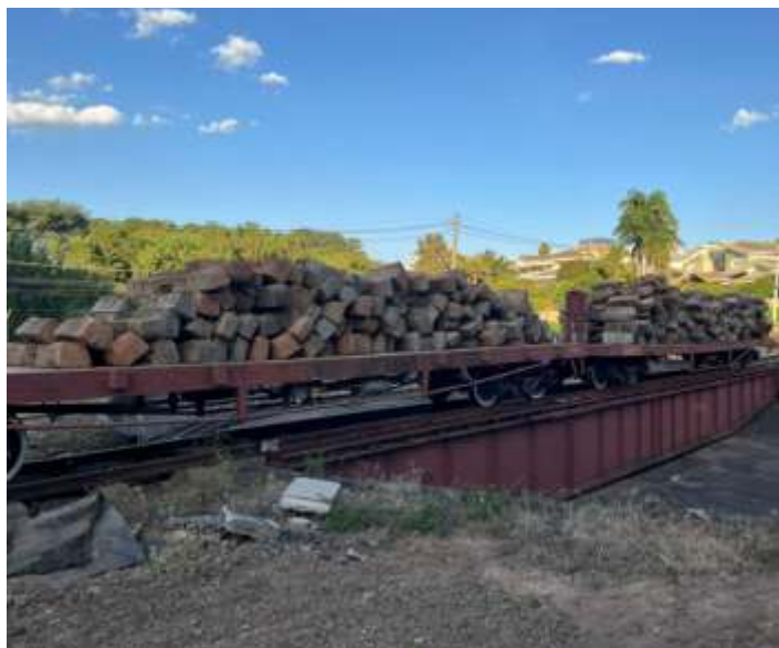
◆ Dormentes de concreto para distribuição no trecho.

A via permanente está na fase final dos serviços no pátio de Anhumas, fazendo espalhamento de brita nova, e para o mês de maio vai retornar no trecho na colocação de dormentes, partindo da saída de Anhumas em direção a Pedro Américo. Duas pranchas de dormentes de concreto já foram carregadas para serem distribuídas.