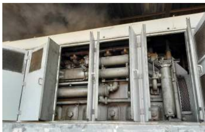
◆ Teste e regulagem do motor ALCO 251 da RSD8 n°3507.

Houve também bastante trabalho na locomotiva ALCO RSD8 n°3507, que recebeu uma grande intervenção em seu motor diesel 251B, que gera 900 hp equipado com turbocompressor ALCO modelo 320-D refrigerado a água.