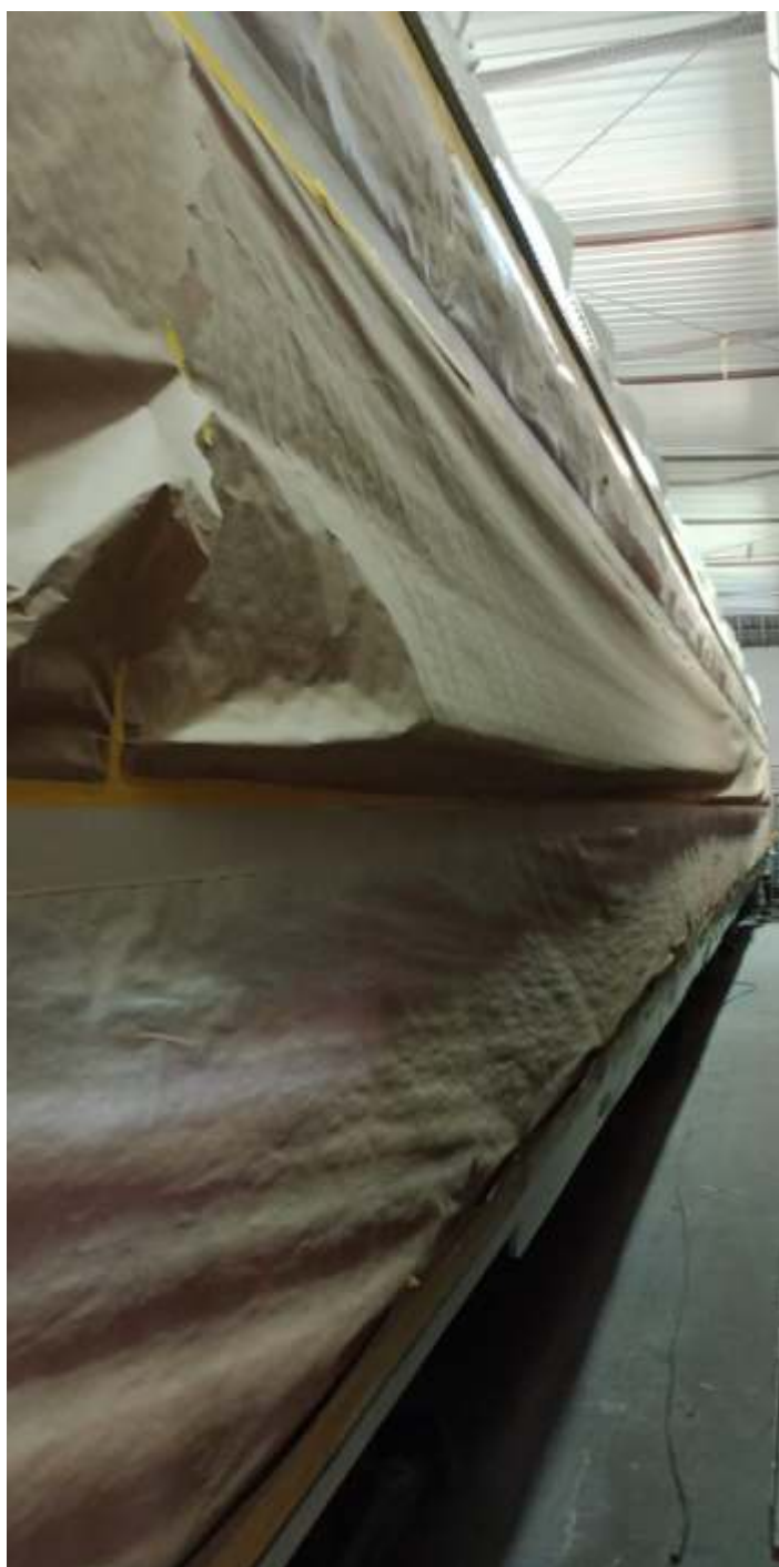
◆ Empapelamento e aplicação de pintura.

Nesta etapa inicial, foram removidas todas as janelas e poltronas e a parte elétrica foi totalmente remodelada. O carro encontra-se atualmente na cabine de lixamento e pintura da Oficina de Roosevelt, onde está recebendo o mesmo padrão de pintura já aplicado nos carros RC 3304 e PC 3027. As próximas etapas envolvem a recuperação do assoalho e aplicação de piso Paviflex e restauração do interior, com aplicação de nova pintura e instalação dos maleiros.