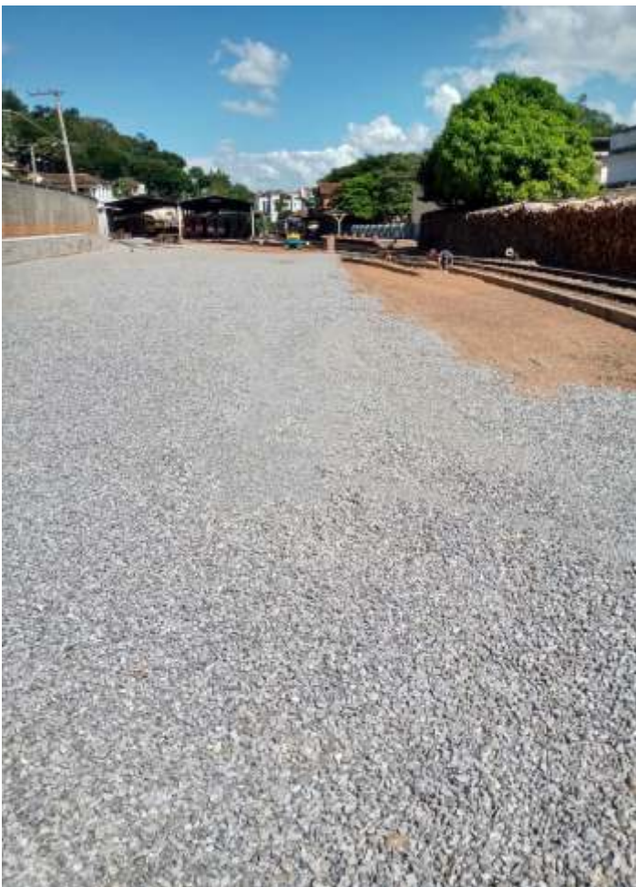
♦ Limpeza e aplicação de brita em toda a área do pátio.