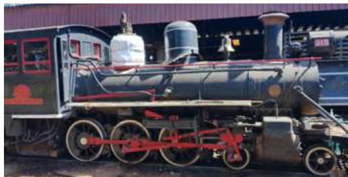
◆ Vista da 215 nas oficinas.

Agora os trabalhos estão concentrados no termino da recuperação da 215, que teve seu condutor de vapor substituído, bem como a válvula de abertura do vapor, ambos prontos e testados e aproveitamos para fazer ajustes dos paralelos, que apresentavam desgastes, sendo que o lado esquerdo já está concluído e o direito está em andamento os serviços.