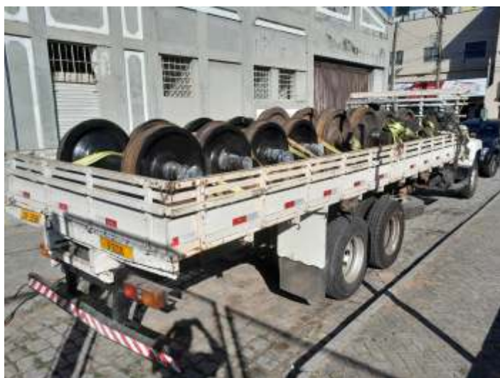
◆ Rodeiros prontos para serem levados para torneamento.