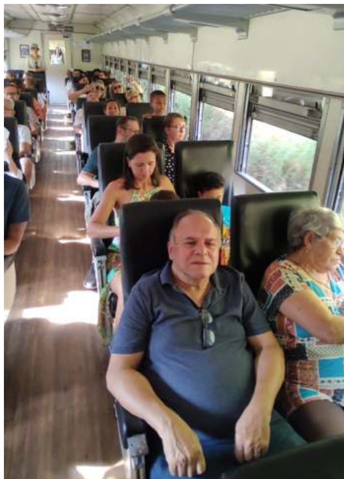
◆ Os participantes do city tour a bordo do trem.