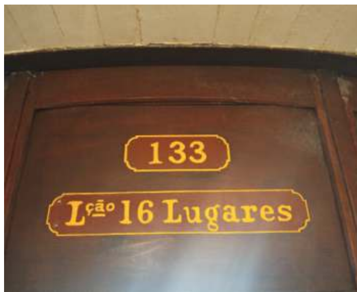
◆ Cabeceira interna do 133 da Paulista.