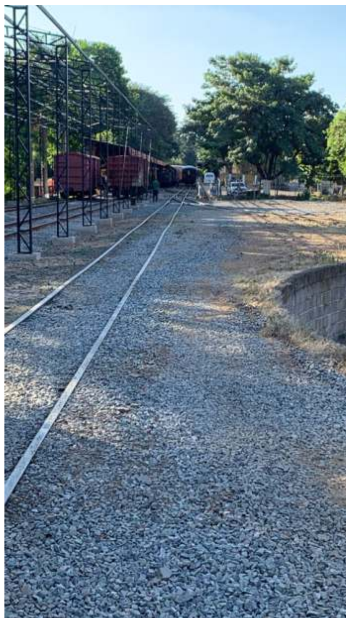
◆ Espalhamento de brita no pátio que será usado para estacionamento.

Também conseguimos colocar mais um pouco de brita no AMV do girador que foi feito, bem como em uma parte do pátio.