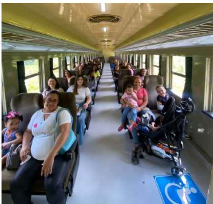
◆ Pessoal do CRAS durante o passeio de trem.