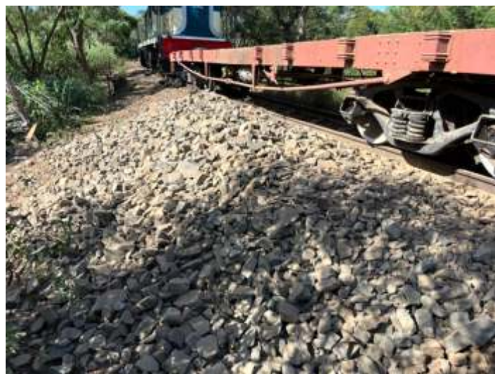
◆ Descarregamento de pedras em trecho atingido por erosão.

Também finalizamos a recomposição do aterro no km 22, onde teve uma erosão no início do ano pelas fortes chuvas, e levou uma parte do aterro e que agora já foi recomposto com pedras e terra. Também foi refeito e aumentado o bueiro da passagem de água sobre a linha.