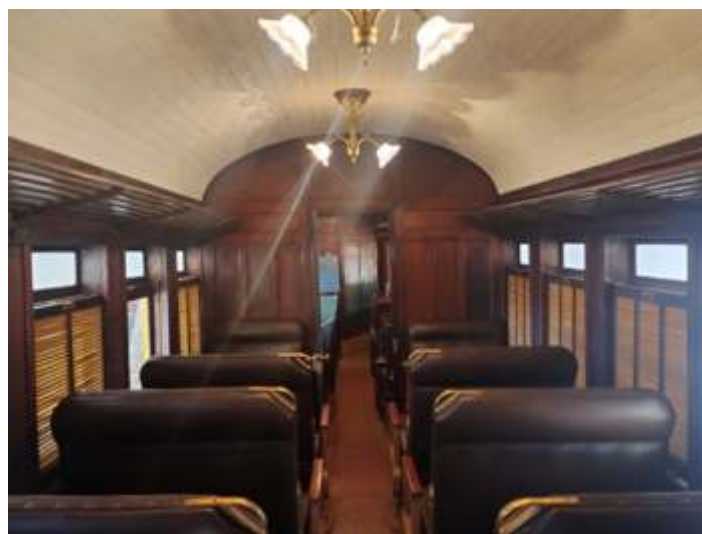
◆ Detalhe do salão do carro restaurante – primeira.