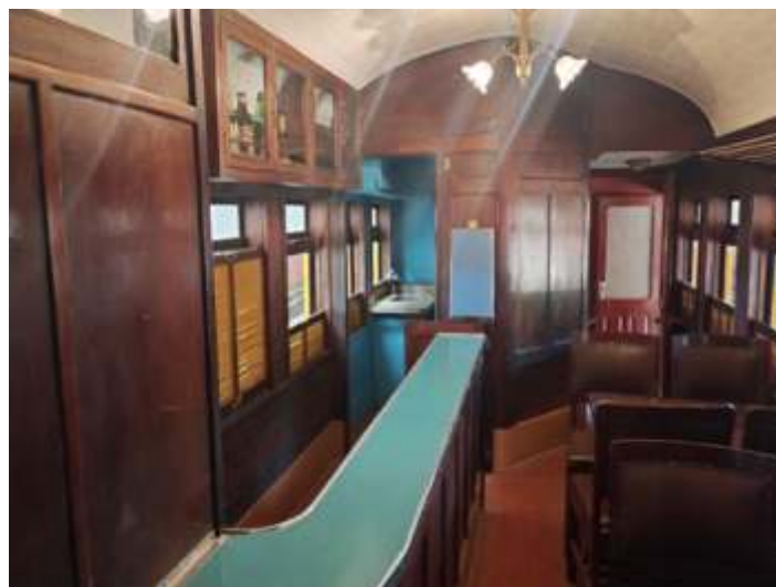
◆ Detalhe do compartimento do bardo carro 133.