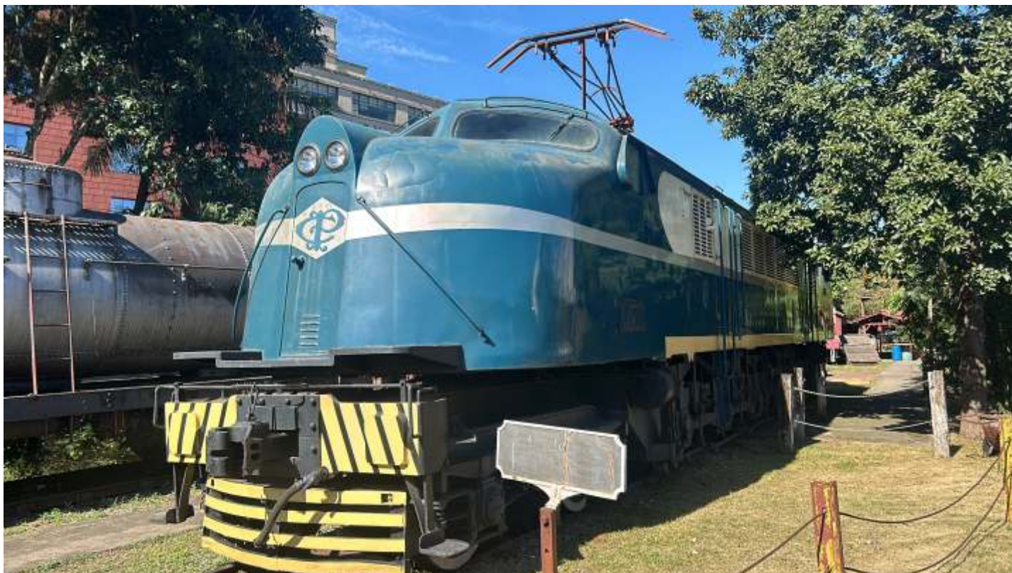
◆ Aspecto da locomotiva “V8” nº6371, fabricada pela GE nos Estados Unidos em novembro de 1939, após a limpeza.

Algo que já estava sendo programado para fazermos e, por questões técnicas ainda não tinha acontecido, foi a limpeza/lavagem da locomotiva “V8” da regional que por tempos deixou de ser feita.