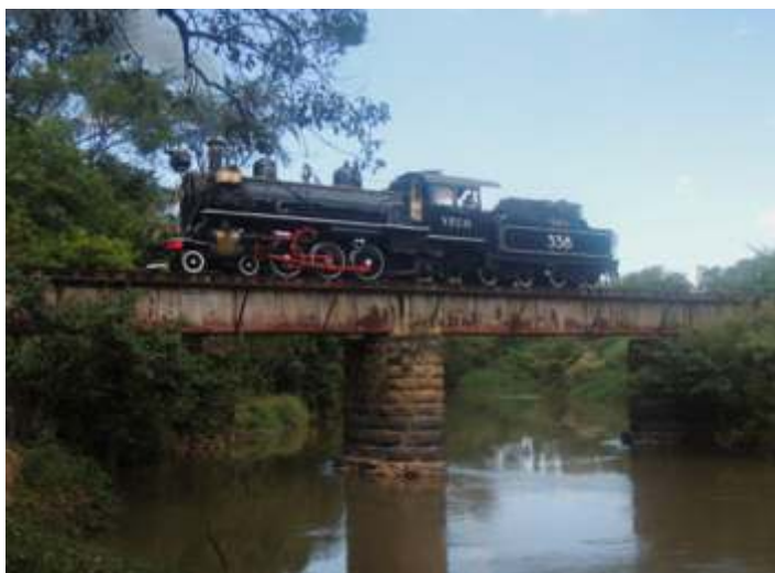
◆ Locomotiva 338 na ponte do Rio Atibaia – Foto de Vanderlei Zago.

Nas oficinas de locomotivas, foram concluídos os trabalhos da 338 e a mesma já retornou à operação normal nos finais de semana.