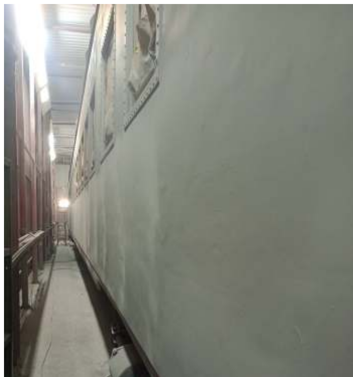
◆ Preparação da superfície com lixamento e aplicação de fundo primer.