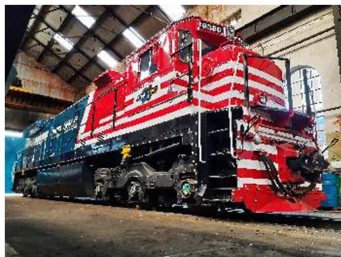
◆ A 9380 irá receber o sistema ATC.

Ao término da instalação, que será realizada através de parceria com a CPTM, serão realizadas as etapas de testes operacionais para sua aprovação e homologação.