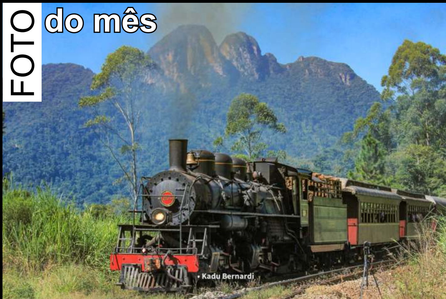
♦ O Trem da Serra do Mar com a Mallet 204 e o Morro da Igreja ao fundo, em Rio Natal/SC.

Todo mês selecionaremos uma foto relacionada ao trabalho da associação publicada no grupo ABPF - Oficial no Facebook para publicar aqui.