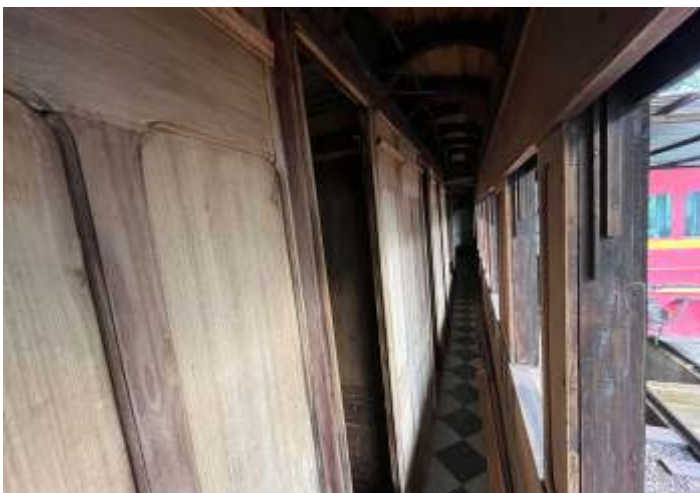
◆ Trabalhos de restauração do Carro Administrativo AM-04.