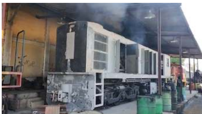
◆ Testes e regulagem do motor diesel da RSD8 n° 3507.

Ações como esta mostram a seriedade e a competência da ABPF bem como ela vem sendo cada vez mais reconhecida pelos diversos atores da ferrovia hoje no país, sejam as concessionárias, sejam os órgãos governamentais. A associação é hoje e respeitada e reconhecida pelo seu know-how em matéria de material ferroviário histórico, se tornando uma referência no país.