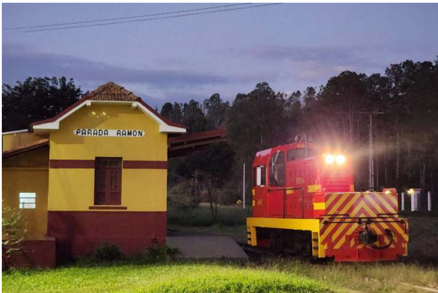
◆ Viagem de teste da “Marcelina” em dois momentos: chegada em Soledade de Minas e retorno passando pela Parada Ramon já ao anoitecer.