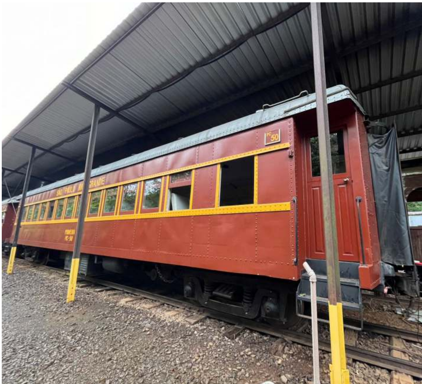
◆ Foram iniciados os trabalhos de reforma do carro de passageiros PC-50.