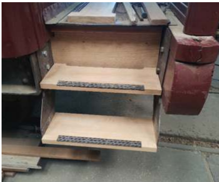
◆ Novos degraus do estribo da plataforma do NOB.

Com isso retomamos os serviços do carro NOB CA-26 continuando a fabricar as peças de madeira novas e início das montagens das bandeiras, superior as janelas, e também fabricação dos caixilhos.