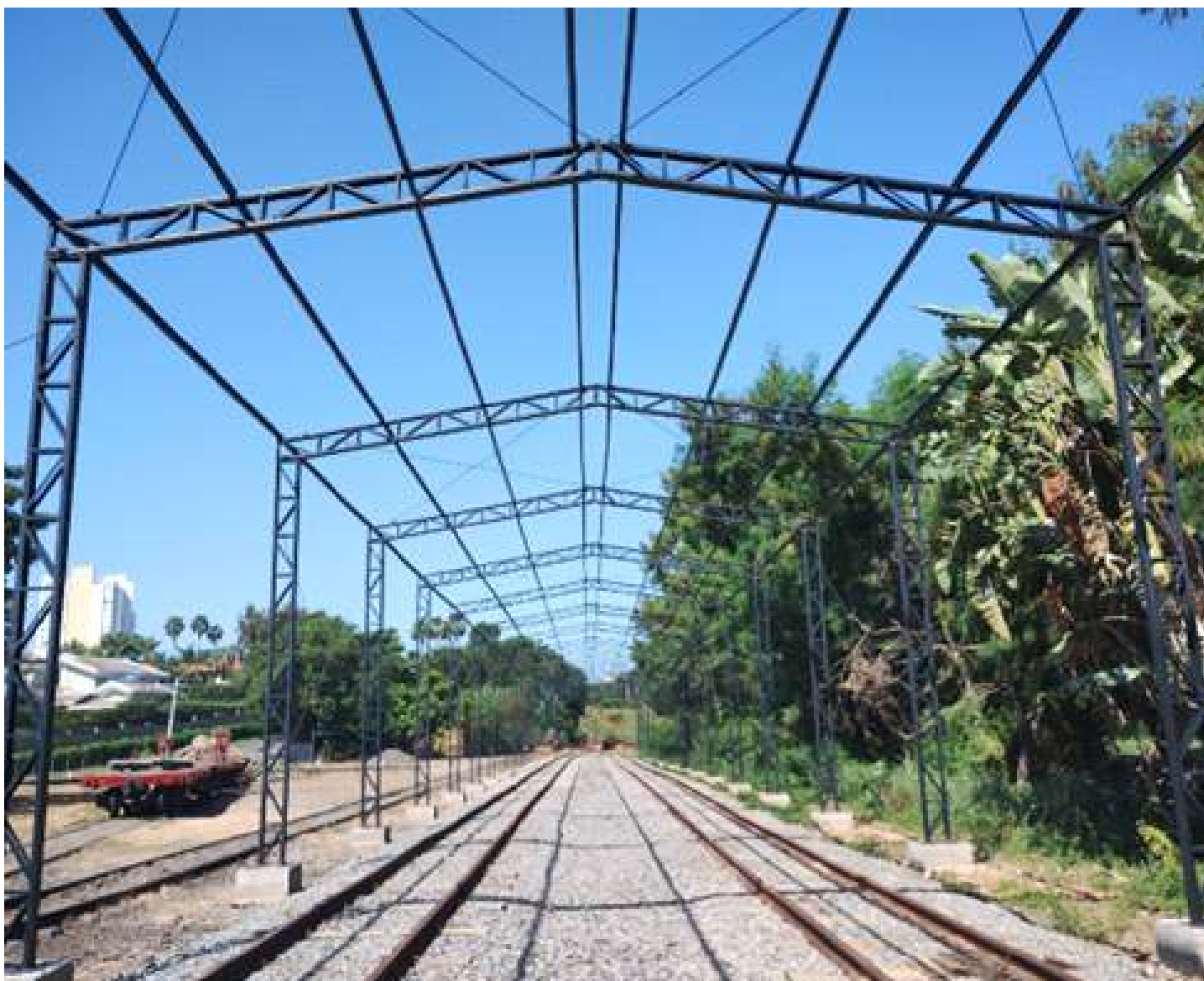
◆ Montagem da estrutura metálica do futuro museu.