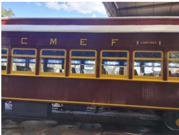
◆ Detalhe da lateral do CA-8.

Com isso retomamos os serviços do carro NOB CA-26 continuando a fabricar as peças de madeira novas e início das montagens das bandeiras, superior as janelas, e também fabricação dos caixilhos.