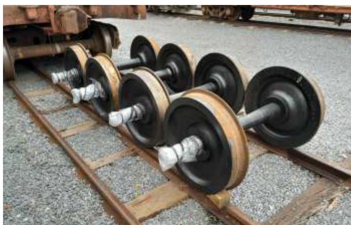
◆ Na oportunidade, foram enviados rodeiros de carros de passageiros para serem torneados também.