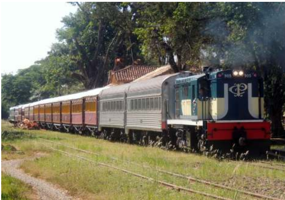
◆ Composição partindo de Tanquinho sentido Anhumas.

Conforme noticiado no último boletim, no dia 8 de abril começou a montagem da estrutura metálica do abrigo do museu ferroviário, tanto dos pés como como das tesouras, tendo já tudo concluído, e para maio será feita a instalação das telhas. Esperamos até final de maio a cobertura estar concluída. Parte de linha e outros detalhes já estavam prontos.