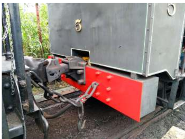
◆ Etapas do processo de pintura do para-choque traseiro da locomotiva n°5. Trabalho realizado pelo Rafael Massini.

Dando continuidade às atividades de manutenção na via permanente, neste mês foram trocados os dormentes de 5,40m do AMV que faz o acesso a locomotiva “V8”, aos carros de aço carbono e a “Berkshire”.