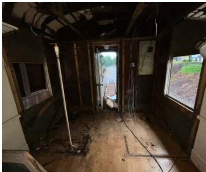
◆ Trabalhos de reforma do carro PC-50.