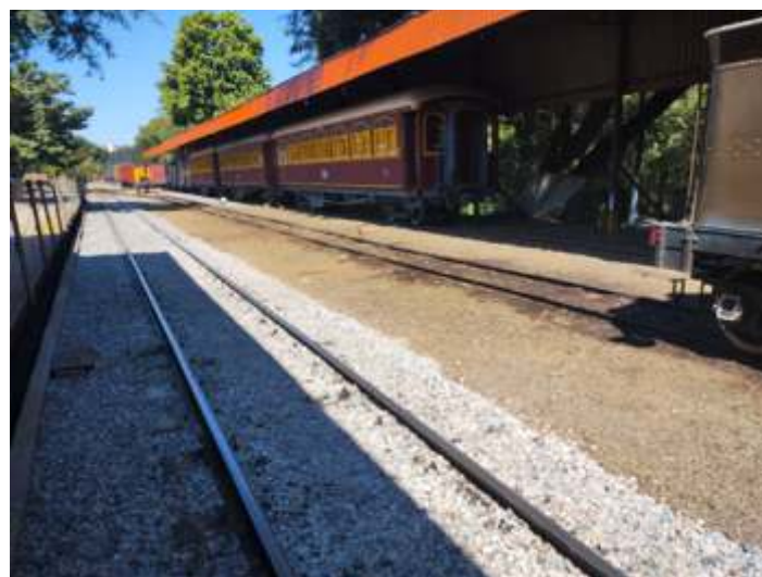
◆ Início colocação de brita no pátio Anhumas