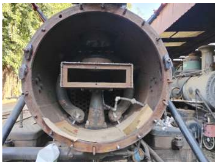
◆ Acessórios da loc. 215 sendo instalados para fechar a tampa.