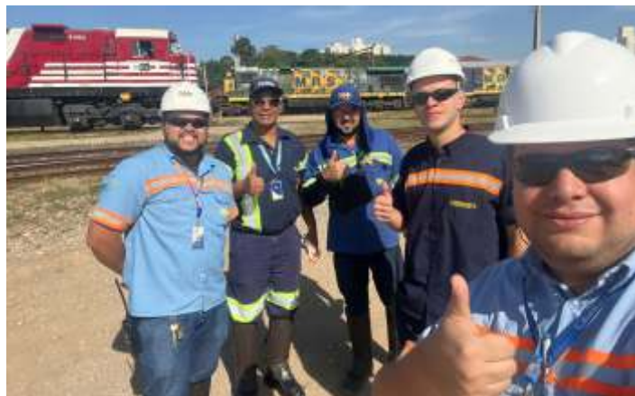
◆ Parceria e cooperação entre as equipes da MRS, Rumo e ABPF no pátio de Jundiaí.

A utilização da nossa locomotiva neste trem simboliza um momento histórico para a Associação, considerando que é a primeira vez que a ABPF cede uma locomotiva equipada com os equipamentos de tecnologia operacional e sistemas de segurança que permitem o tráfego pelas linhas das três concessionárias envolvidas. Além do material rodante, a ABPF cedeu também para a realização deste evento seu corpo técnico qualificado e habilitado, apoiando tanto as operações ferroviárias quanto as demandas de atendimento aos passageiros.