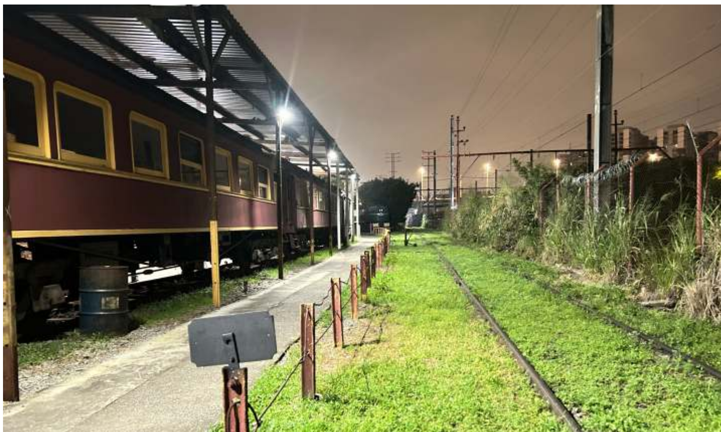
◆ Continuam os trabalhos de melhoria do sistema de iluminação do pátio, com instalação de novos refletores.

São Paulo por nossos colaboradores, com a instalação de novos refletores e o reposicionamento de alguns já existentes, visando a maior segurança do local que num passado muito distante sofria com eventuais furtos e invasões de pessoas estranhas, e também para a apreciação dos passageiros a bordo dos trens da Linha 10 Turquesa da CPTM.