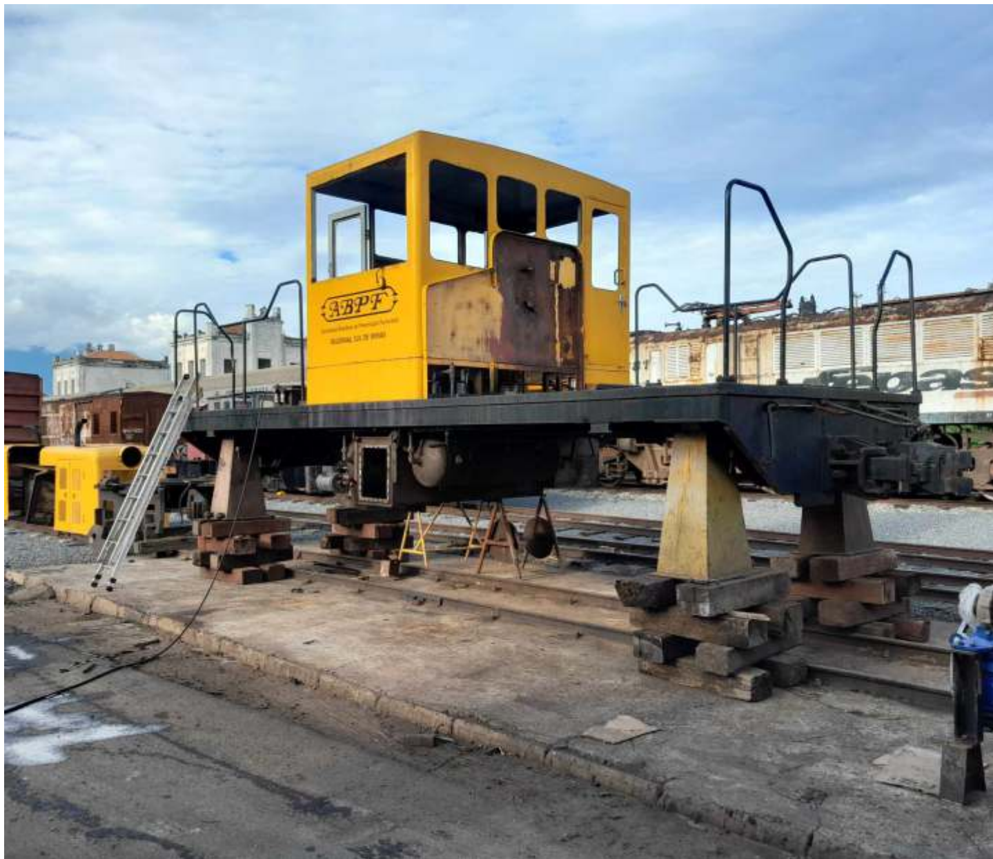
◆ A GE 44Ton totalmente desmontada sobre cavaletes.