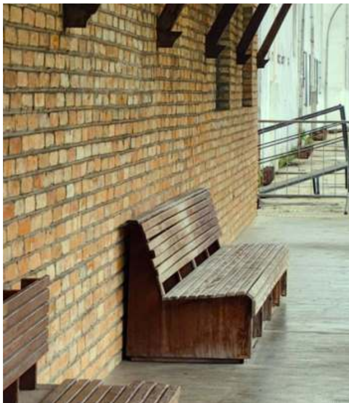
♦ Antigos bancos da plataforma de embarque.

O tradicional passeio do Trem dos Imigrantes, que ocorre todos os finais de semana a partir da plataforma que integra o Museu da Imigração, ficou com uma melhor caracterização para o público que faz o passeio de Trem. Com estes bancos genuinamente ferroviários, agora de volta ao seu antigo local, a Plataforma da antiga "Hospedaria dos Imigrantes" retoma as características ferroviárias que outrora não possuía infelizmente.