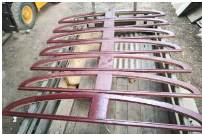
♦ Peças superiores das janelas do carro NOB.

Os trabalhos no carro NOB CA-26 prosseguem normalmente, tendo já sido concluída a fabricação de todas as bandeiras superiores das janelas, bem como seu acabamento e também todas as colunas e cordões em curva. As montagens também já foram feitas e iniciou-se as pinturas das peças e do carro em geral. Em breve o mesmo será estaleirado nos macacos para a retirada dos truques e substituição dos mesmos, bem como reparação de engates e aparelhos de choque e tração.