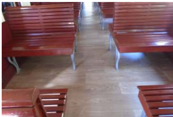
♦ O carro AM6 e o carro passageiro SM32 respectivamente, receberam novo piso em manta vinílica, o maior investimento do NuRVI neste mês. A autoria de Luiz Carlos Henkels.