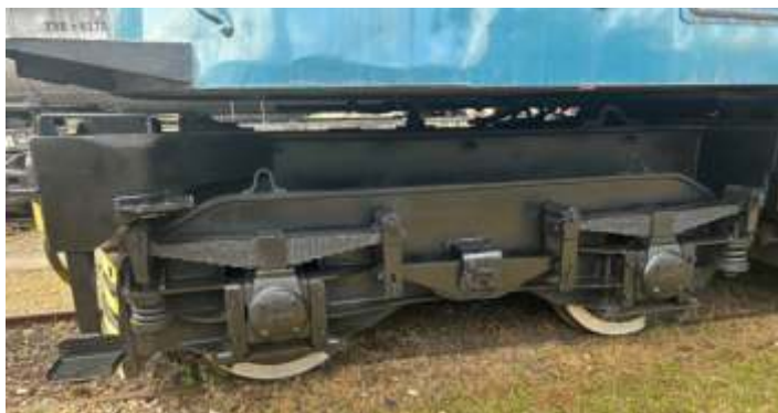
♦ Detalhe de um dos truques após os trabalhos de limpeza.

Na área operacional, o Trem dos Imigrantes contou com movimento normal neste mês e recebeu diversas escolas na última semana do mês. Nosso passeio de trem compõe parte da visita ao Museu da Imigração e proporciona uma experiência mais completa para as crianças e adolescentes, contribuindo para manter a cultura e memória ferroviária para as novas gerações.