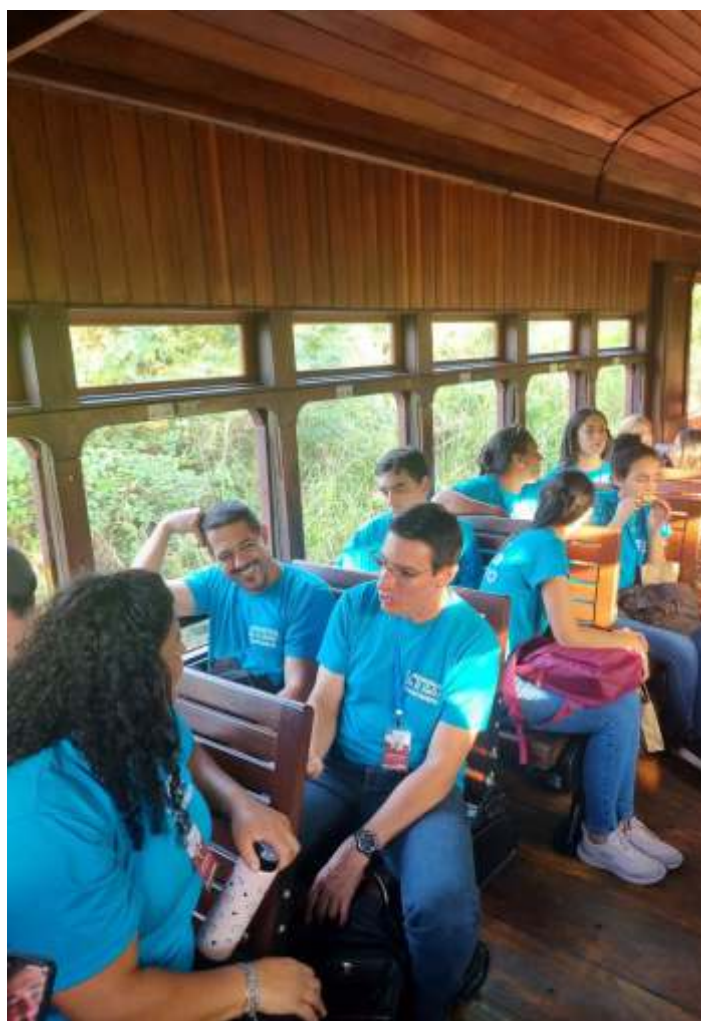
♦ A comitiva da ETEC durante o passeio de trem.