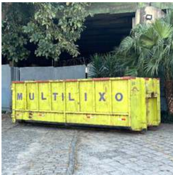
♦ Uma das caçambas utilizadas para remoção do material.

Neste mês de junho, a Regional São Paulo iniciou o trabalho de zeladoria e limpeza pesada na área do pátio ferroviário, bem como do material rodante que compõe o acervo da Regional e ao longo da Via Permanente. Esta ação foi planejada para resolver de maneira definitiva um problema recorrente relacionado à destinação de materiais diversos e que não poderiam ser utilizados, nem mesmo para a queima como combustível da locomotiva à vapor que faz a tração do Trem dos Imigrantes. Na área localizada abaixo do Viaduto Alcântara Machado, a concentração de materiais inservíveis era crítica, sendo necessária a contratação de três caçambas de aproximadamente 26m 3 de capacidade, o que resultou na retirada de cerca de 70% de todo resíduo do local. Com a chegada de uma caçamba adicional, concluímos a completa limpeza do local, totalizando cerca de 15 toneladas de resíduos descartados e destinados corretamente.