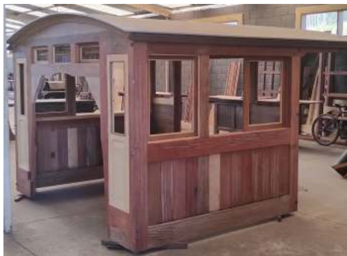
♦ A nova cabine confeccionada para a locomotiva nº332.

Está sendo realizada também a ampliação da cobertura das oficinas, visando aumentar o espaço para realização das atividades de manutenção bem como para abrigar mais veículos.