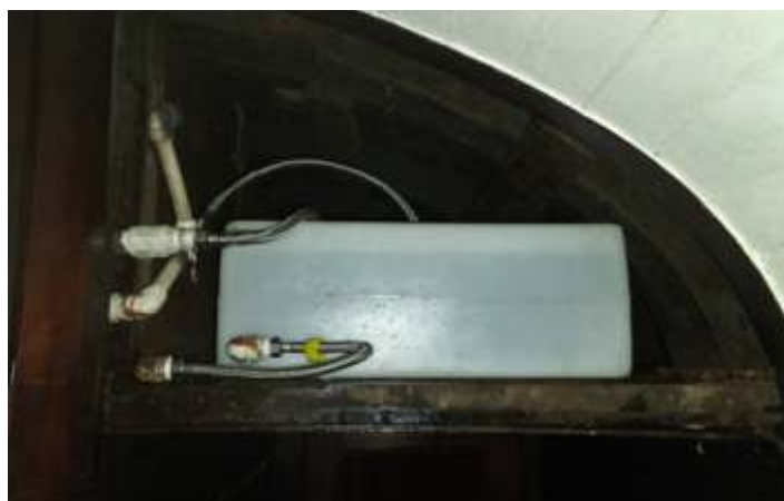
♦ Caixa de 100 litros adaptada na outra cabeceira, exclusiva para a pia da cozinha.

Os trabalhos no carro NOB CA-26 prosseguem normalmente, tendo já sido concluída a fabricação de todas as bandeiras superiores das janelas, bem como seu acabamento e também todas as colunas e cordões em curva. As montagens também já foram feitas e iniciou-se as pinturas das peças e do carro em geral. Em breve o mesmo será estaleirado nos macacos para a retirada dos truques e substituição dos mesmos, bem como reparação de engates e aparelhos de choque e tração.