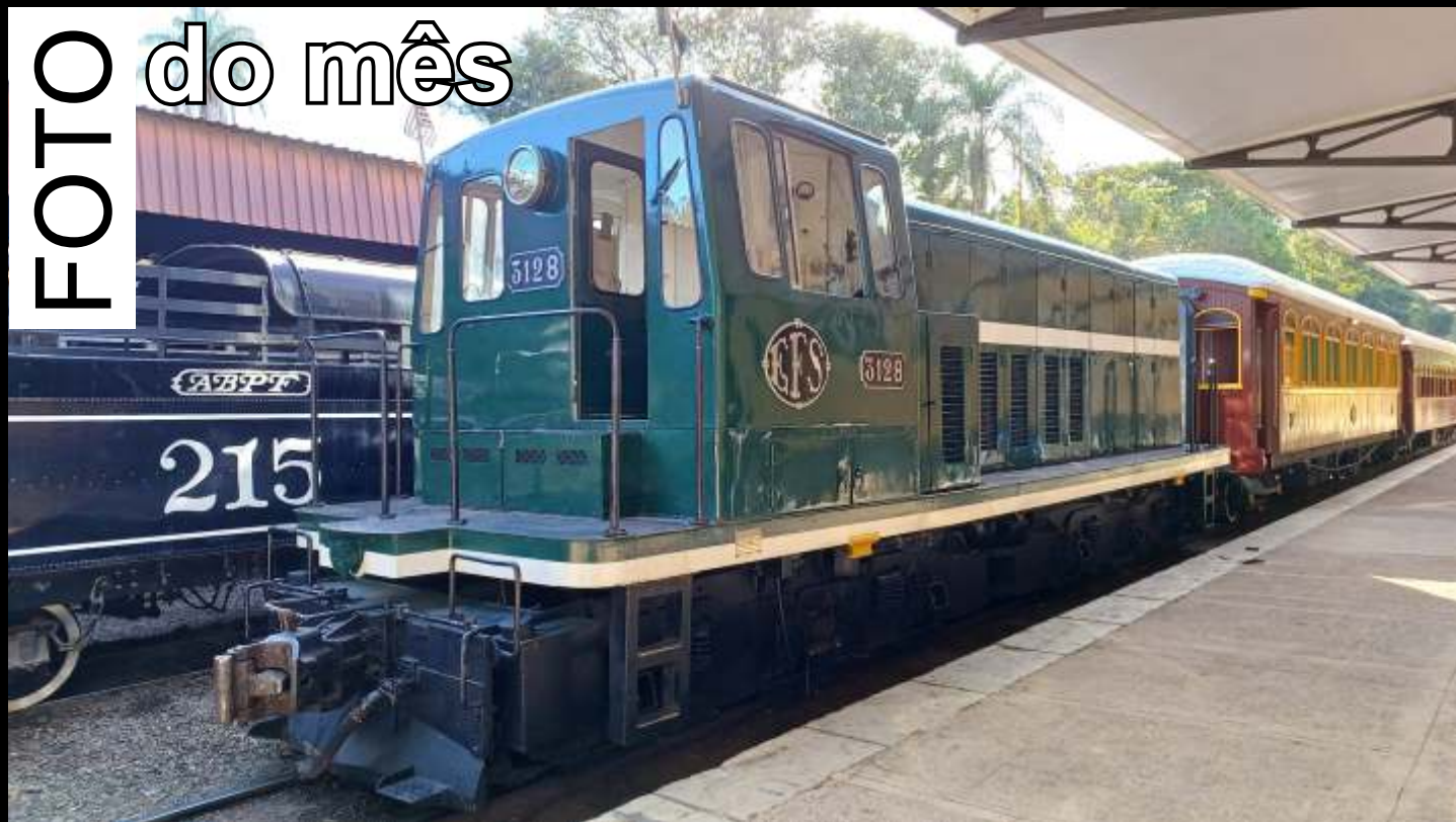
♦ Trem liderado pela 3128 durante parada na estação de Carlos Gomes, em Campinas/SP.

Todo mês selecionaremos uma foto relacionada ao trabalho da associação publicada no grupo ABPF - Oficial no Facebook para publicar aqui.