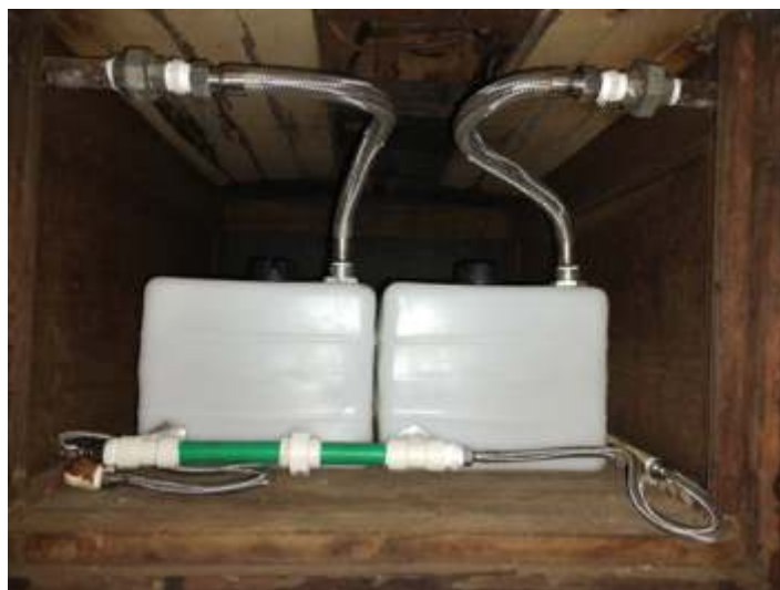
♦ Caixas de água adaptadas, totalizando 120 litros, aproveitando as saídas já existentes, do lado do sanitário.

Nas oficinas de carros de passageiros, retornamos com o carro primeira – restaurante da CP, para ré instalação de caixas de água no sanitário e cozinha, pois ambas foram retiradas pelo proprietário anterior, onde adaptamos caixas de água de nylon já existentes no mercado, com dimensões aproximadas ao espaço existente. Após um pouco de trabalho, todo o projeto e montagem deu certo. Também já foi instalada a caixa de baterias no mesmo local da anterior, onde o próximo passo será a instalação elétrica do mesmo, sendo que terá que ser adaptado um dínamo ou gerador, e confecção do suporte do mesmo. Este trabalho será feito no mês de agosto quando o carro estiver fora de tráfego