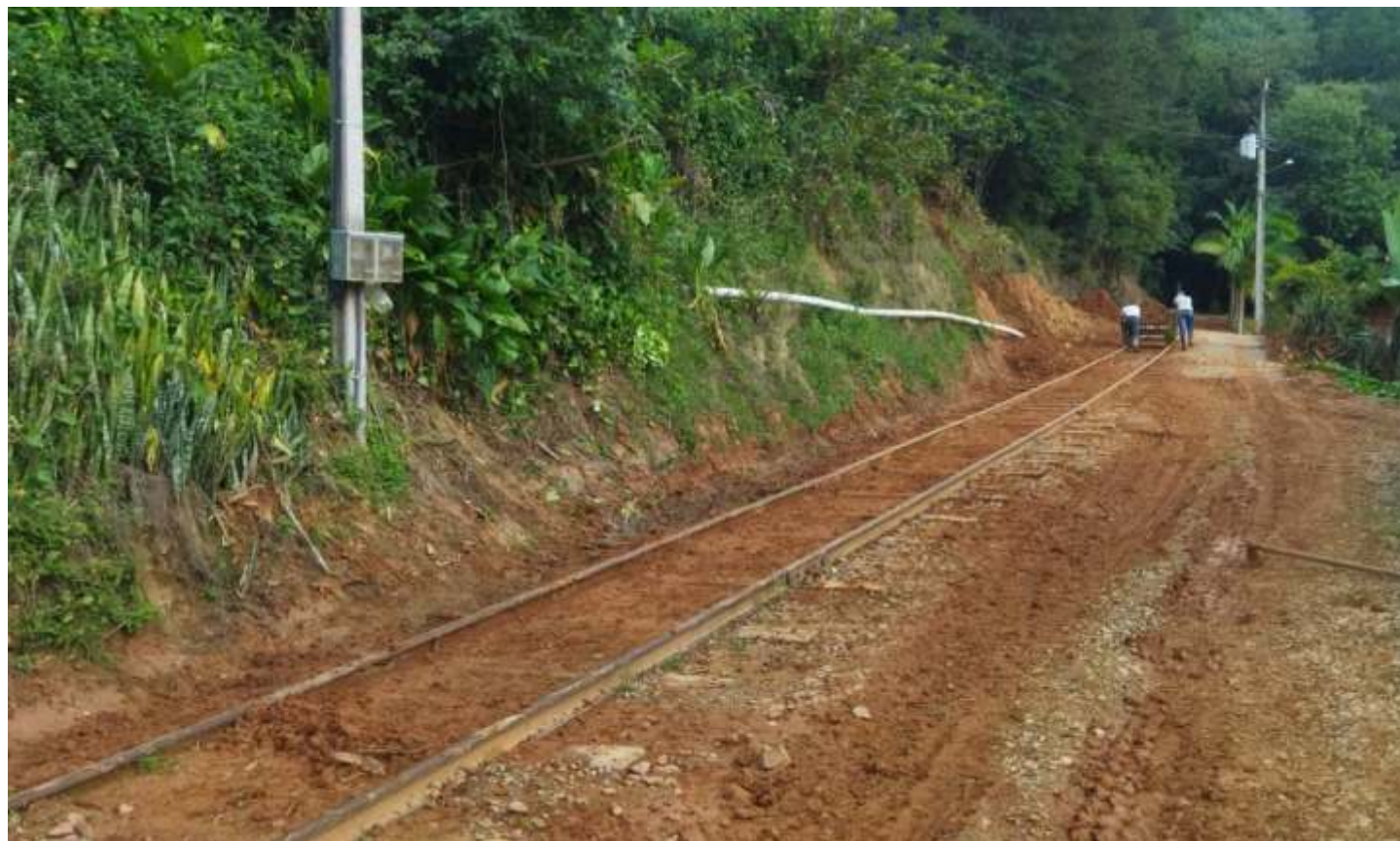
♦ Local da barreira do KM 1,5 onde obras paliativas foram realizadas pelo NuRVI para o tráfego da composição.