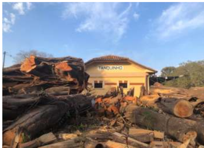
♦ Outra vista da estação com a arvore a 5 metros do prédio.