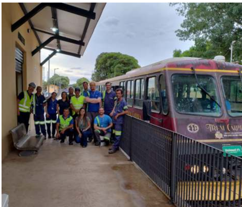
♦ Testes iniciais da composição do "Trem Caipira" na plataforma da estação recém reformada de Engenheiro Schmitt com as equipes Rumo, ABPF e Prefeitura de São José do Rio Preto.