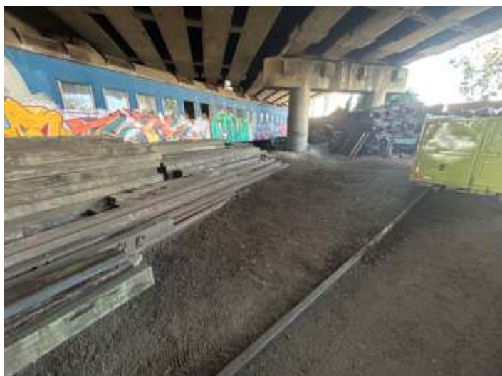
♦ Aspectos do antes e depois da limpeza.