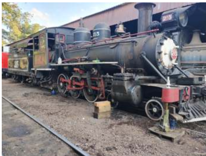
♦ Locomotiva 215 nos finalmente da reparação, preparando para entrar na seção de embelezamento!

na semana de 10 de julho, sendo que estiver tudo ok, a mesma vai entrar para a área de pintura e polimento.