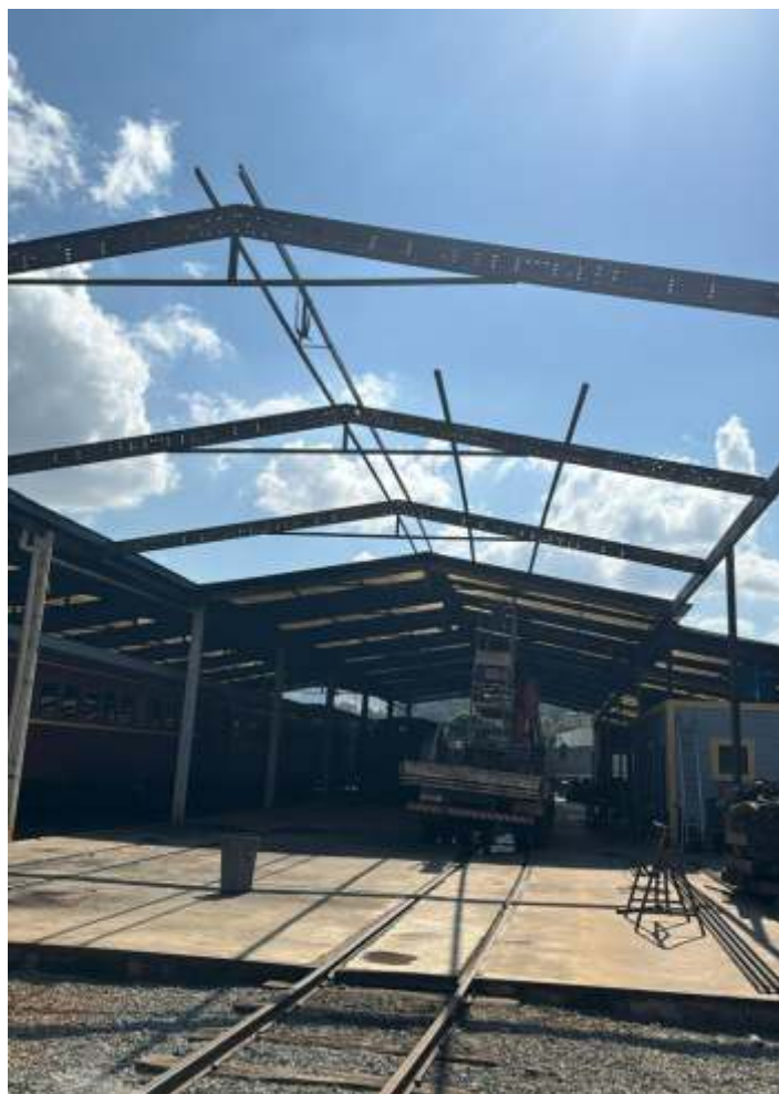
♦ Estrutura metálica da ampliação da área das oficinas.

Quando estiver pronta, a nova área coberta vai permitir um melhor andamento dos trabalhos bem como permitirá a guarda de mais veículos.