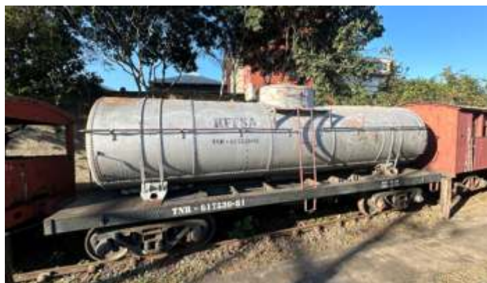
♦ Antes e depois: limpeza do vagão tanque.