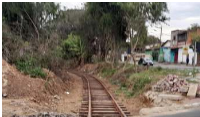
♦ Trabalhos de limpeza da via e substituição dos dormentes, já deixando o trecho trafegável para trens de serviço.