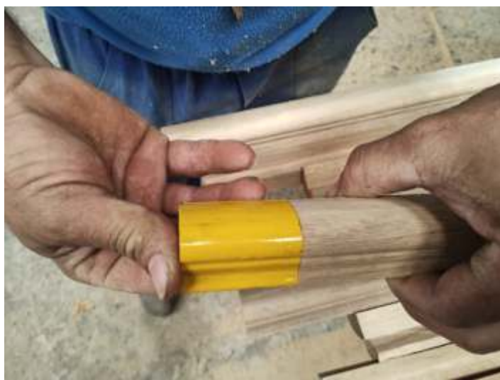
♦ Comparando a original e nova, das peças do carro NOB.