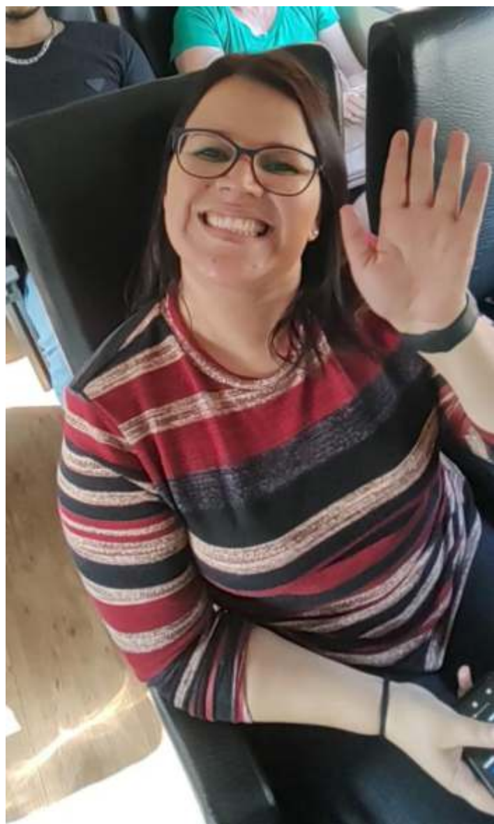
♦ Os participantes do city tour a bordo do trem.