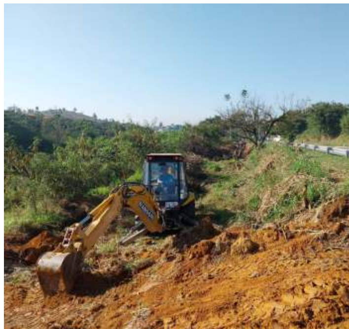
♦ Remoção da terra e entulho que foram jogados sobre a linha, onde estamos tendo apoio da prefeitura de Cruzeiro.