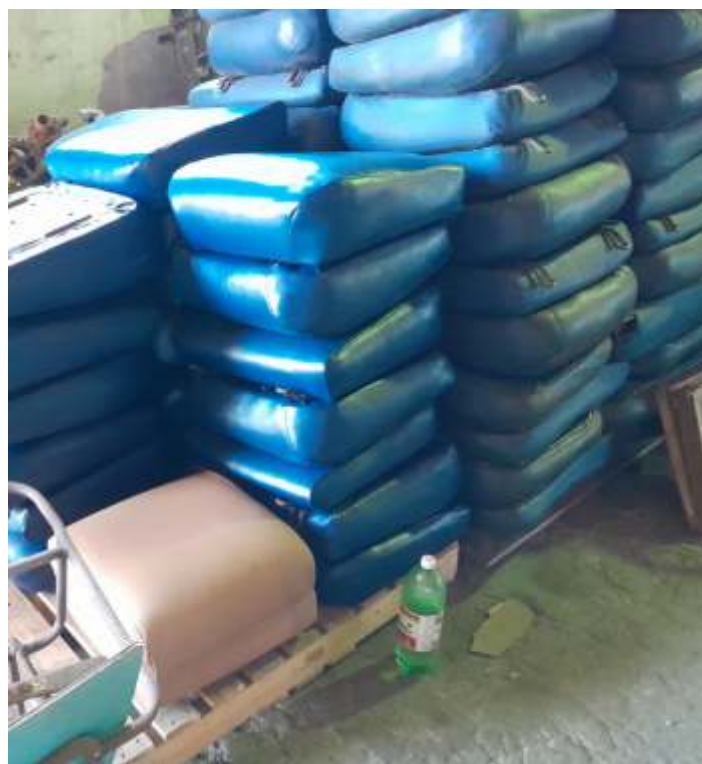
♦ Já retornaram do estofador os assentos e encostos dos bancos do carro Pullman PC-3020 totalmente reformados.