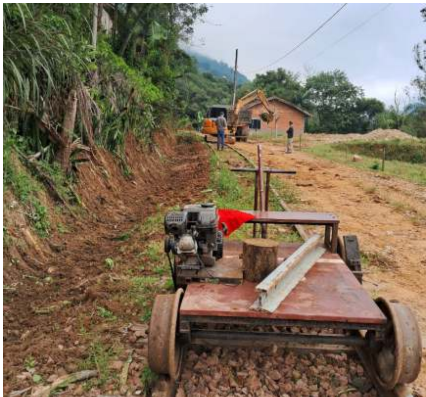
♦ O trole AI512, volta a mostrar serviço e teve direito a repartir a garagem com o vagonete de linha AS513. Autoria de Ângela Marques.

A coordenação do NuRVI agradece a todos os seus associados, voluntários e colaboradores que de várias formas se dedicam à preservação da memória histórica da extinta EFSC, dedicando suas horas de folga aos trabalhos no “Trem do Vale Europeu – EFSC”.