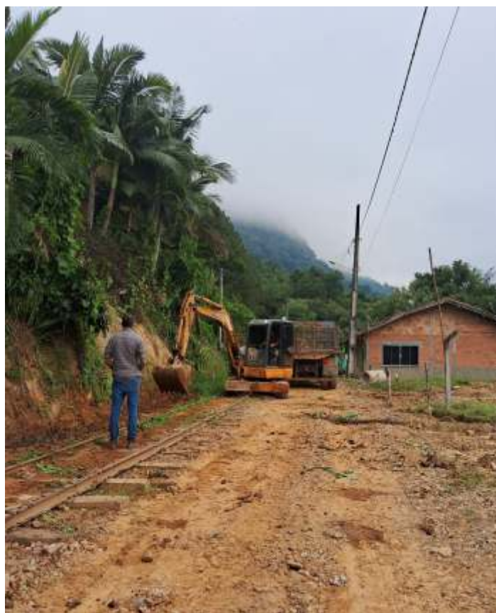
♦ Local da barreira do KM 1,5 onde obras paliativas foram realizadas pelo NuRVI para o tráfego da composição.