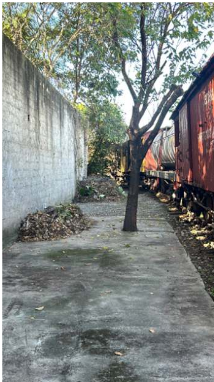
♦ Limpeza da área em andamento.