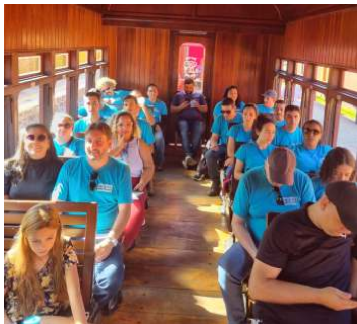
♦ A comitiva da ETEC durante o passeio de trem.

A comitiva com 20 integrantes realizou o passeio de trem de forma gratuita, com cortesias fornecidas pela associação dentro do seu programa de “Trens Sociais”, onde a ABPF procura contemplar a comunidade local e as instituições de relevância dos municípios onde atua com passeios gratuitos e/ou como forma de arrecadação de doações para instituições filantrópicas afim de se incentivar a educação patrimonial no município e promover o acesso à este meio de transporte, sendo um resgate desse importante capítulo da história. O custo dessas viagens sociais é 100% subsidiado pela ABPF, não havendo nenhum ônus para as entidades ou órgãos públicos.