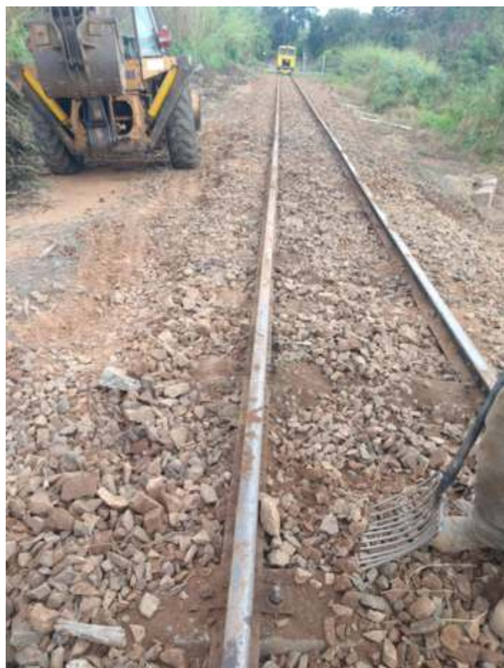
♦ Trecho sendo trabalhado.

Outro fator que teve uma despesa enorme além do trabalho, foi o corte das duas seringueiras da estação de Tanquinho. Ambas com brocas no tronco, devido à idade e pela proximidade da estação, o risco iminente da integridade do prédio, bem como das pessoas que ali transitam, tiveram que ser cortadas. Pouco antes caiu um galho com diâmetro de 40 centímetros, do lado da plataforma, que por pouco não atingiu a composição. Outro fator é que por estar ao lado do prédio e plataforma, as enormes raízes estavam danificando toda a estrutura.