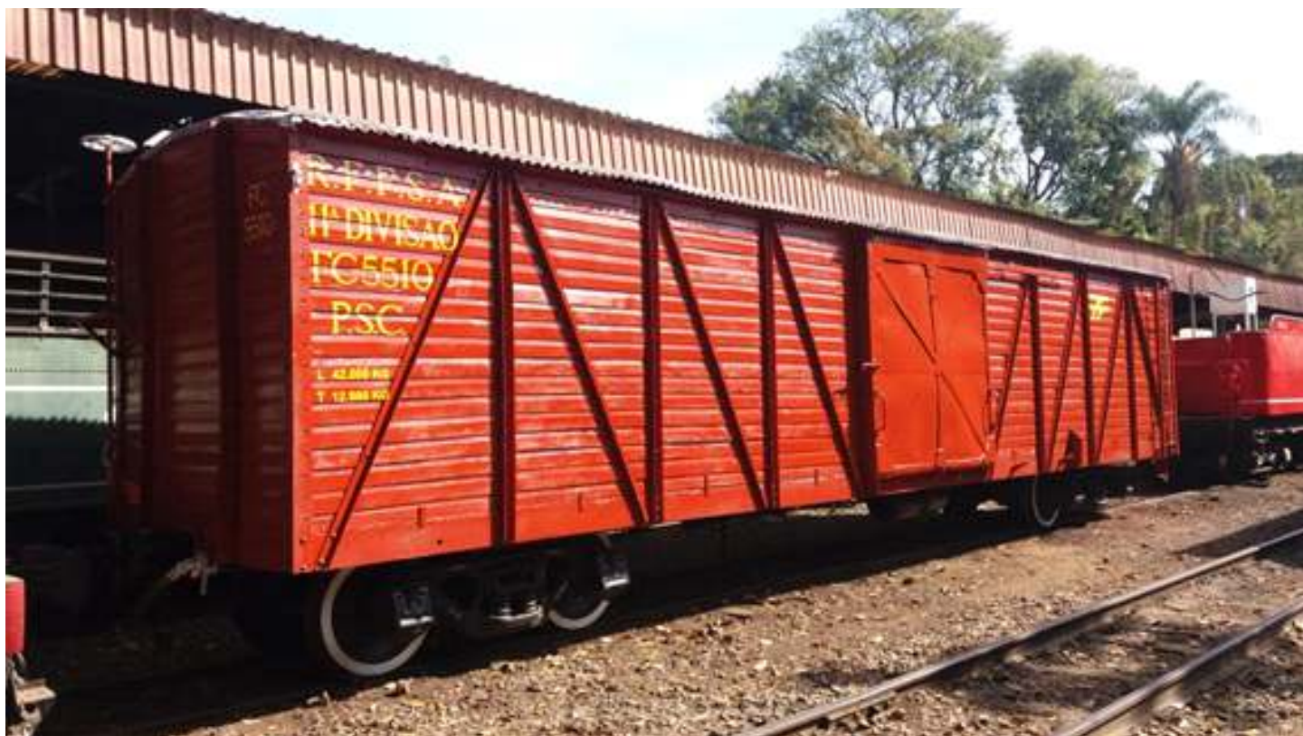
♦ Foto do FV 5510 com as inscrições em Carlos Gomes.