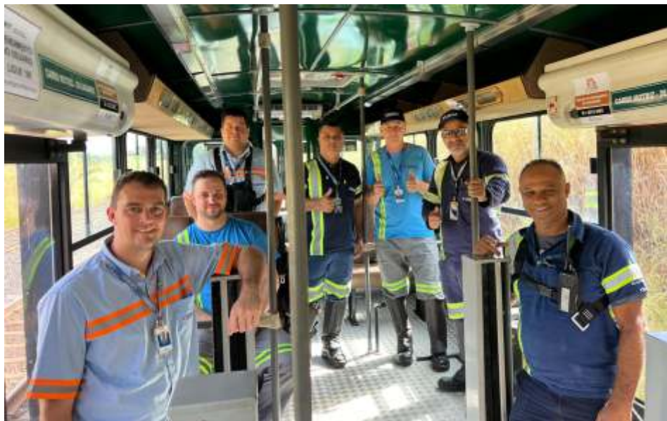
♦ Equipe operacional ABPF e Rumo no interior do Trem Caipira durante manobras da primeira viagem com passageiros a bordo.