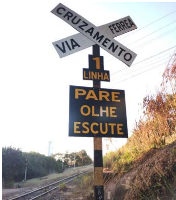
♦ Reforma das placas de PN. Foto HGF.

Na via permanente, prosseguimos com a distribuição de dormentes de concreto no trecho, limpeza dos mesmos, preparação de conjuntos de fixações e aplicação dos mesmos no trecho, partindo para a substituição total partindo da saída da chave de Anhumas.