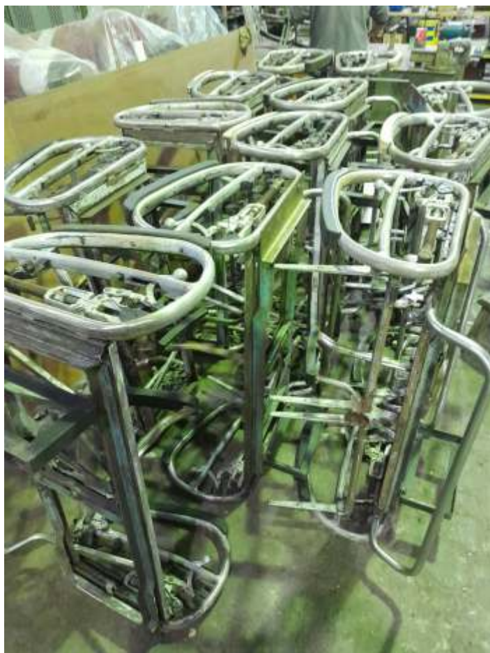
♦ Trabalhos de desmontagem, limpeza e recuperação das estruturas dos bancos do carro Pullman PC-3020.