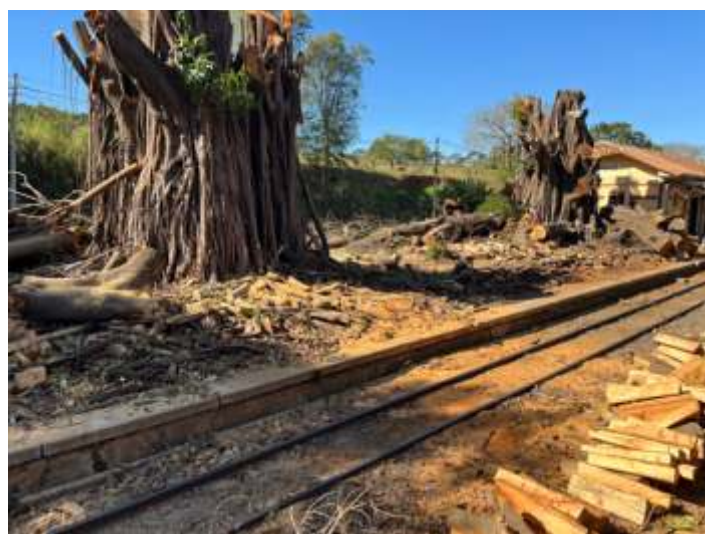
♦ Estação de Tanquinho.

Outras arvores de menor porte serão plantadas após a total retirada.