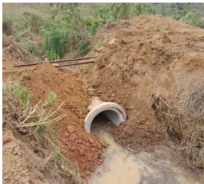
♦ Manilhas novas instaladas no local onde a força das águas destruiu o antigo boeiro.