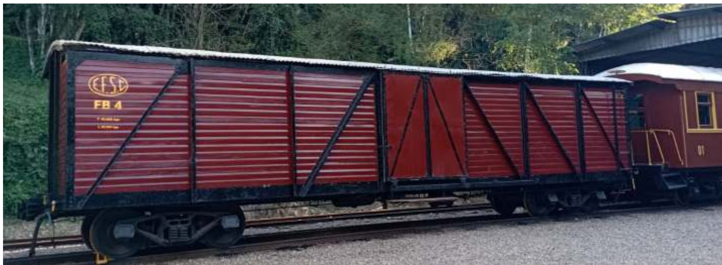
♦ O vagão VF130 (FB 4 no NuRVI) teve seu restauro concluído com a afixação do letreiro histórico fazendo referência à década de 1940/1950. A autoria de Luiz Carlos Henkels.