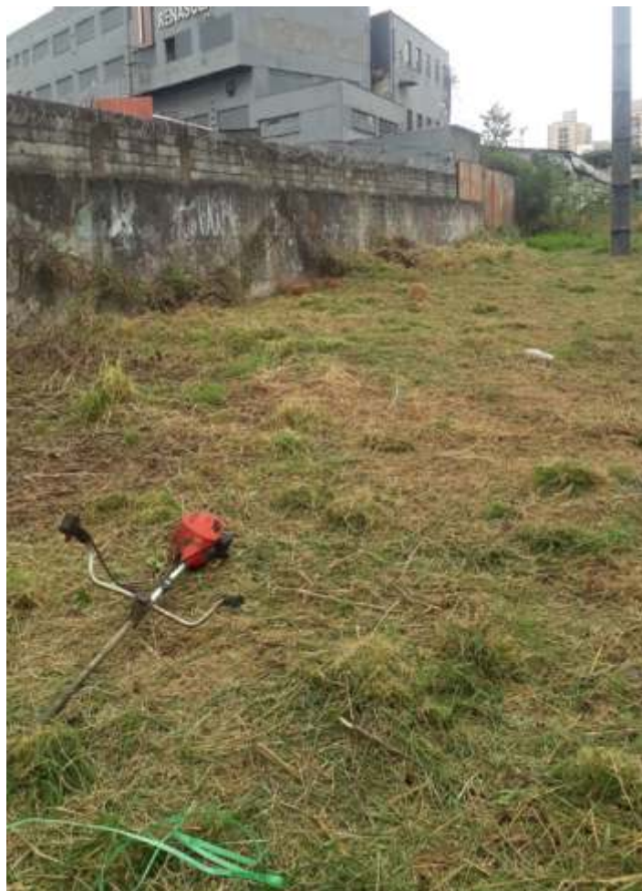
♦ Parte traseira do Pátio Mooca: antes e após a roçada.