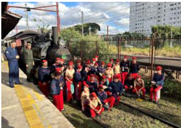
♦ Uma das turmas de escolas que nos visitaram em junho.

Na área operacional, o Trem dos Imigrantes contou com movimento normal neste mês e recebeu diversas escolas na última semana do mês. Nosso passeio de trem compõe parte da visita ao Museu da Imigração e proporciona uma experiência mais completa para as crianças e adolescentes, contribuindo para manter a cultura e memória ferroviária para as novas gerações.