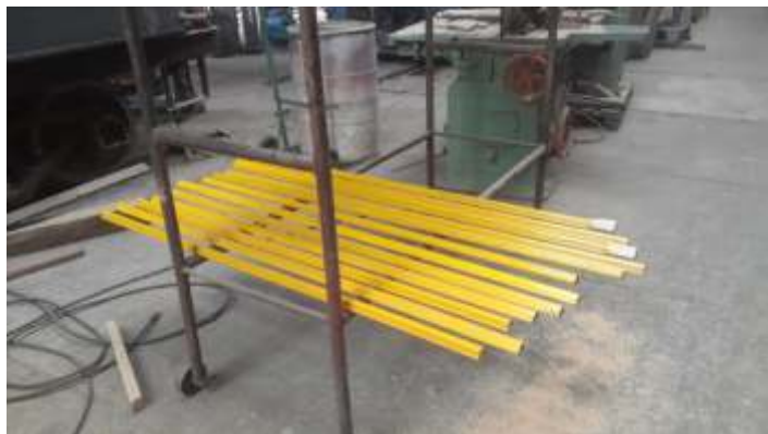
♦ Acabamentos das partes superiores das janelas.