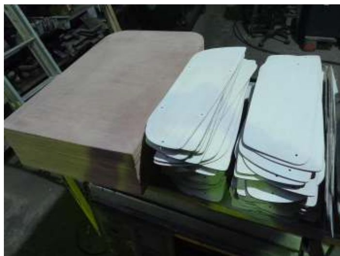
♦ Confeção de novas laterais de acabamento dos bancos.