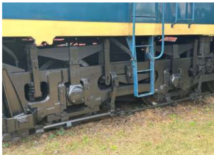
♦ Limpeza e conservação da locomotiva "V8".