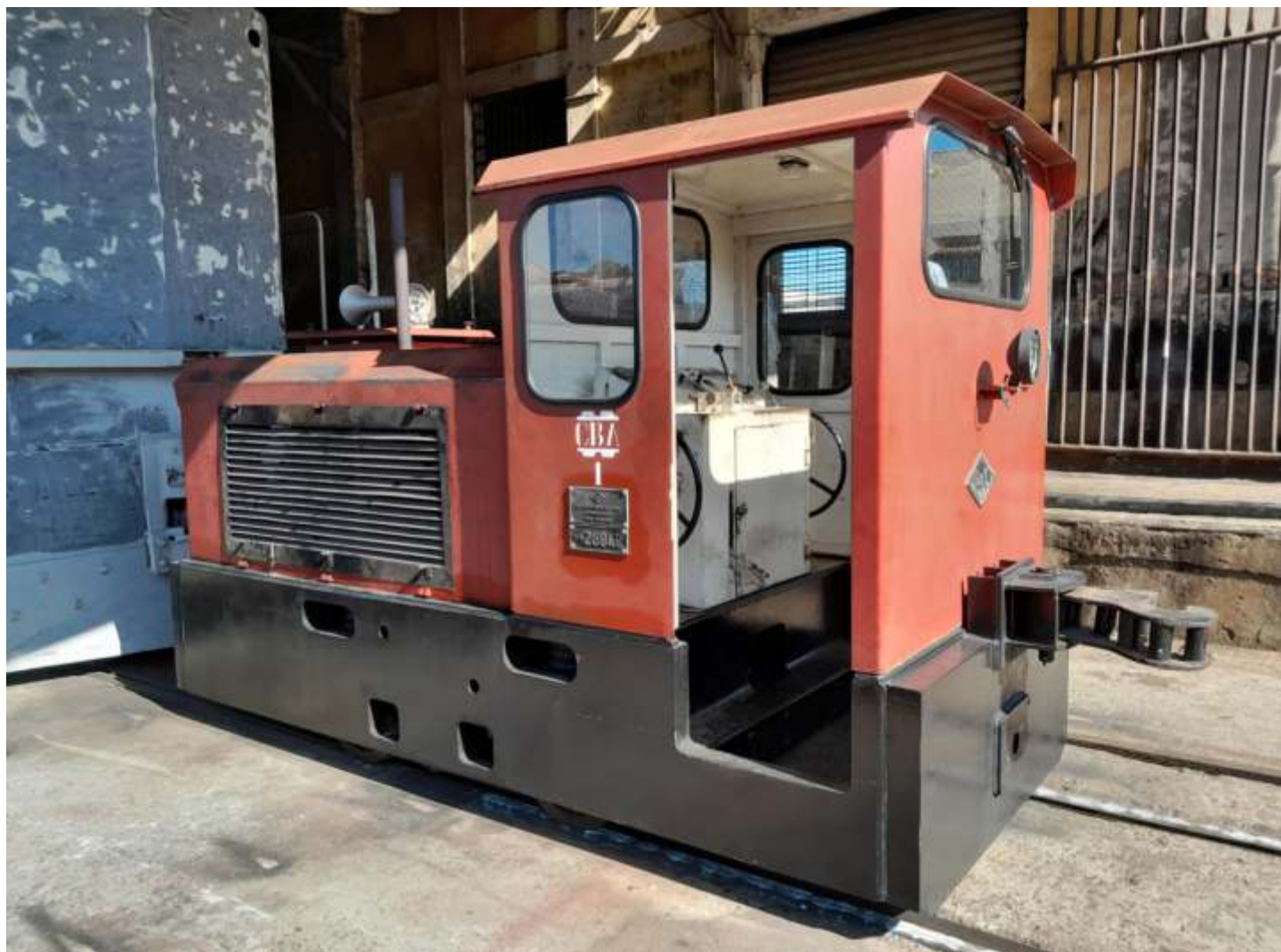
♦ Testes da pequena locomotiva diesel-hidráulica O&K ex. CBA nas oficinas de Cruzeiro da ABPF.

A pequena locomotiva diesel-hidráulica Orenstein & Koppel ex. CBA nº1 está passando por manutenção e reforma nas oficinas de Cruzeiro. A mesma foi utilizada por muitos anos nas atividades de manobra e, em algumas ocasiões, nas atividades de manutenção da via-permanente em São Lourenço/MG e agora está recebendo a merecida revisão e reforma.