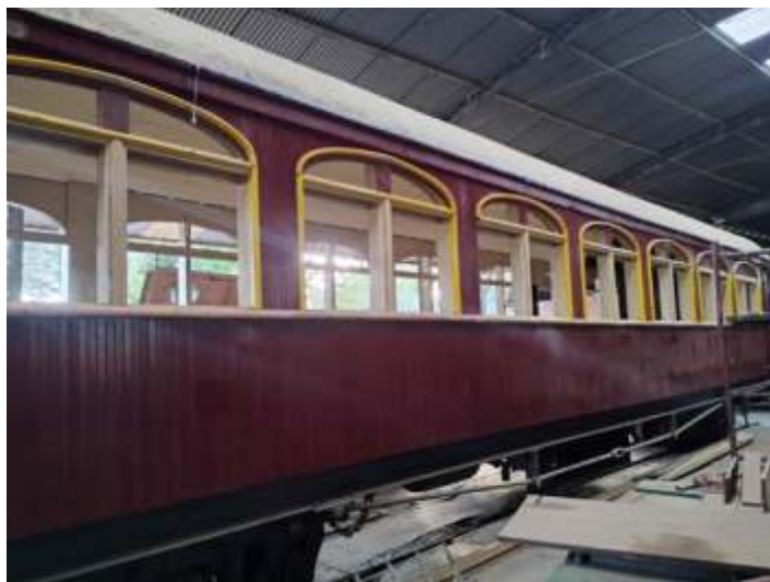
♦ Vista geral do carro já com parte das peças instaladas.

Paralelamente fizemos uma rápida intervenção no vagão FV-5510, um ex. FNC, da antiga Rede Viação Paraná Santa Catarina, resgatado há três meses. Foram feitas diversas reparações no madeiramento, (basicamente troca de tabuas), recuperação das escadas e pega mãos, troca de truques que vieram danificados devido ter rodado sem os mancais de bronze, por outro de rolamento, instalação de partes dos freios e hastes de manobra. Em seguida recebeu a pintura e as inscrições da P. S. C. O vagão fará parte do acervo de vagões preservados da ABPF Campinas e eventualmente usados em especiais e filmagens.