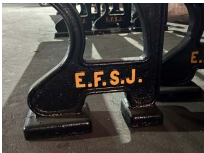
♦ Detalhe do E.F.S.J. em alto relevo nos pés dos bancos.