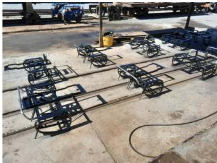
♦ Pintura das estruturas dos bancos.