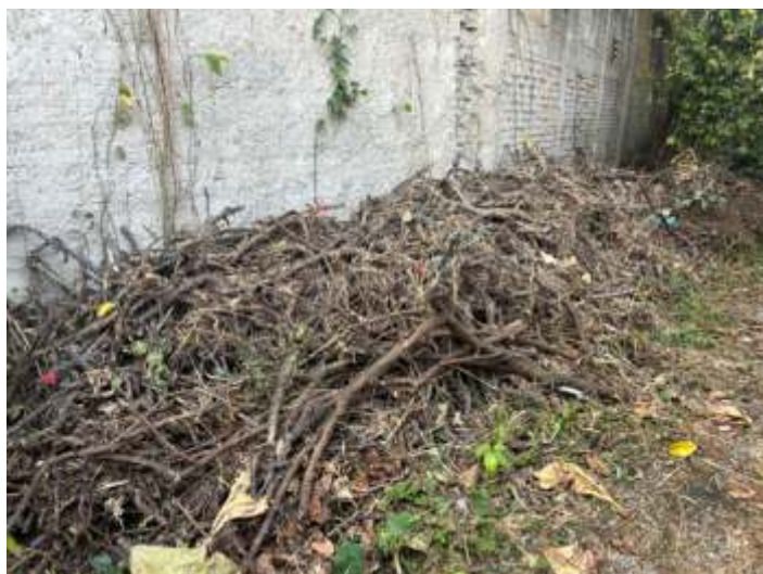
♦ Material que estava acumulado em parte do pátio.