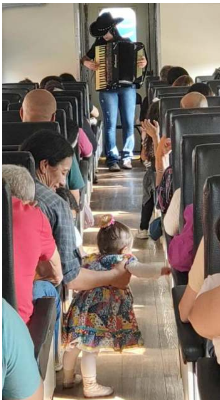
♦ Os participantes do city tour a bordo do trem.