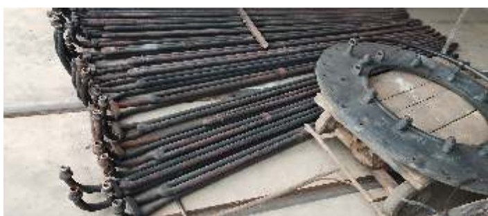
♦ Desmontagem da locomotiva nº332.