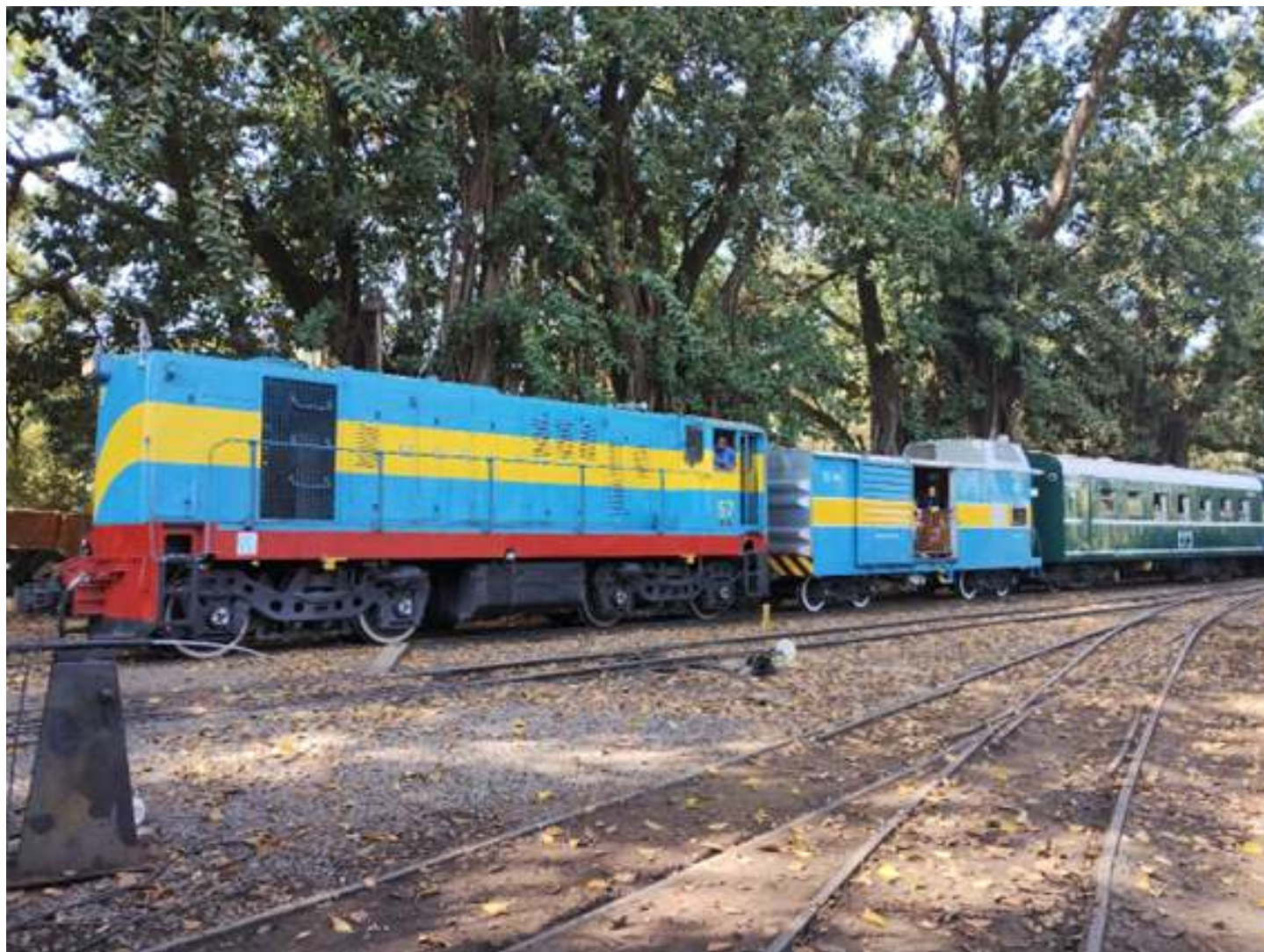
♦ Composição chegando em Carlos Gomes com a locomotiva 57 e o caboose EI-1 da Cia. Mogiana.