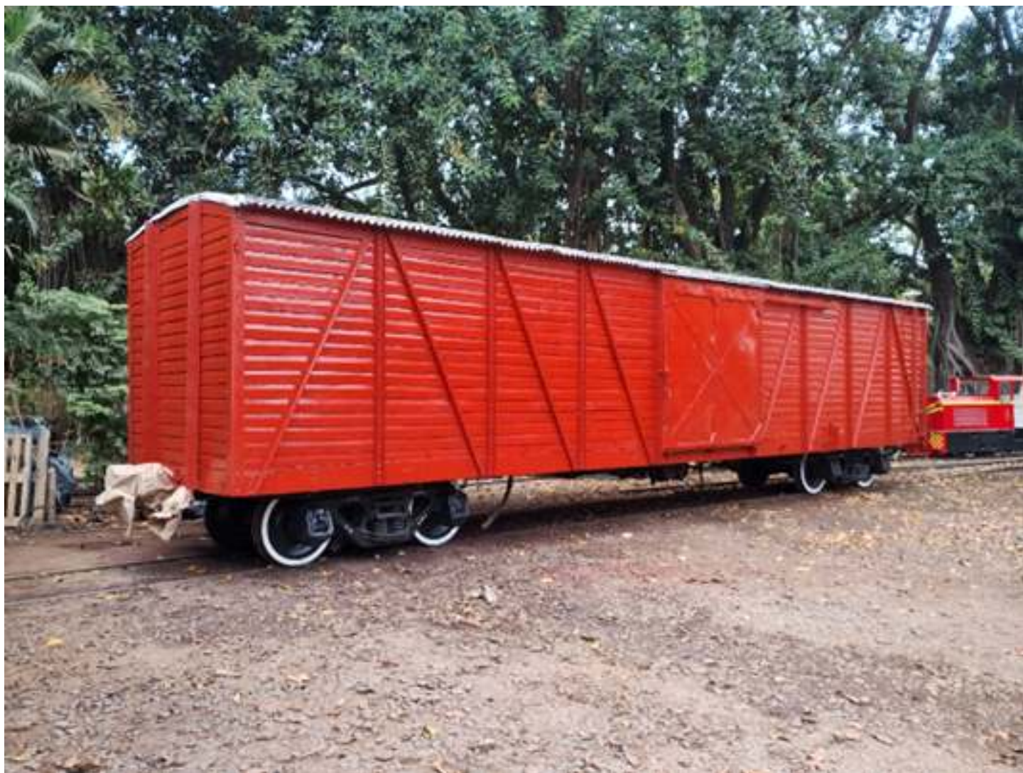
♦ FV-5510 em Carlos Gomes, após pintura.