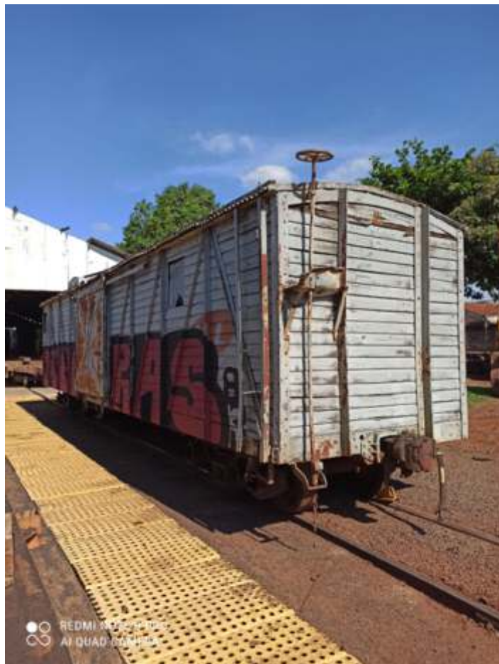
♦ Vagão FV 5510 – sendo preparado para embarque. Crédito na foto.

Paralelamente fizemos uma rápida intervenção no vagão FV-5510, um ex. FNC, da antiga Rede Viação Paraná Santa Catarina, resgatado há três meses. Foram feitas diversas reparações no madeiramento, (basicamente troca de tabuas), recuperação das escadas e pega mãos, troca de truques que vieram danificados devido ter rodado sem os mancais de bronze, por outro de rolamento, instalação de partes dos freios e hastes de manobra. Em seguida recebeu a pintura e as inscrições da P. S. C. O vagão fará parte do acervo de vagões preservados da ABPF Campinas e eventualmente usados em especiais e filmagens.