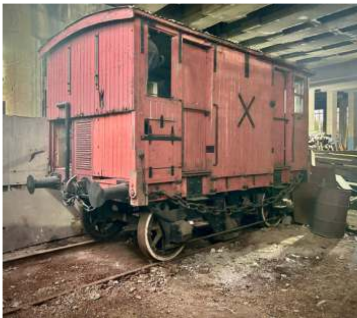
♦ Aspectos do antes e depois da limpeza, podendo se agora observar melhor o Serra-Breque.

Na área de conservação de material rodante, realizamos a lavagem externa da Locomotiva GE V8 e do Vagão-Tanque ex-RFFSA, com atenção especial para a limpeza dos truques. Por serem itens que estão expostos à intempéries e ao ambiente poluído da cidade de São Paulo, há uma grande concentração de fuligem nas superfícies, o que faz com que o trabalho de limpeza melhore expressivamente o aspecto visual do acervo.