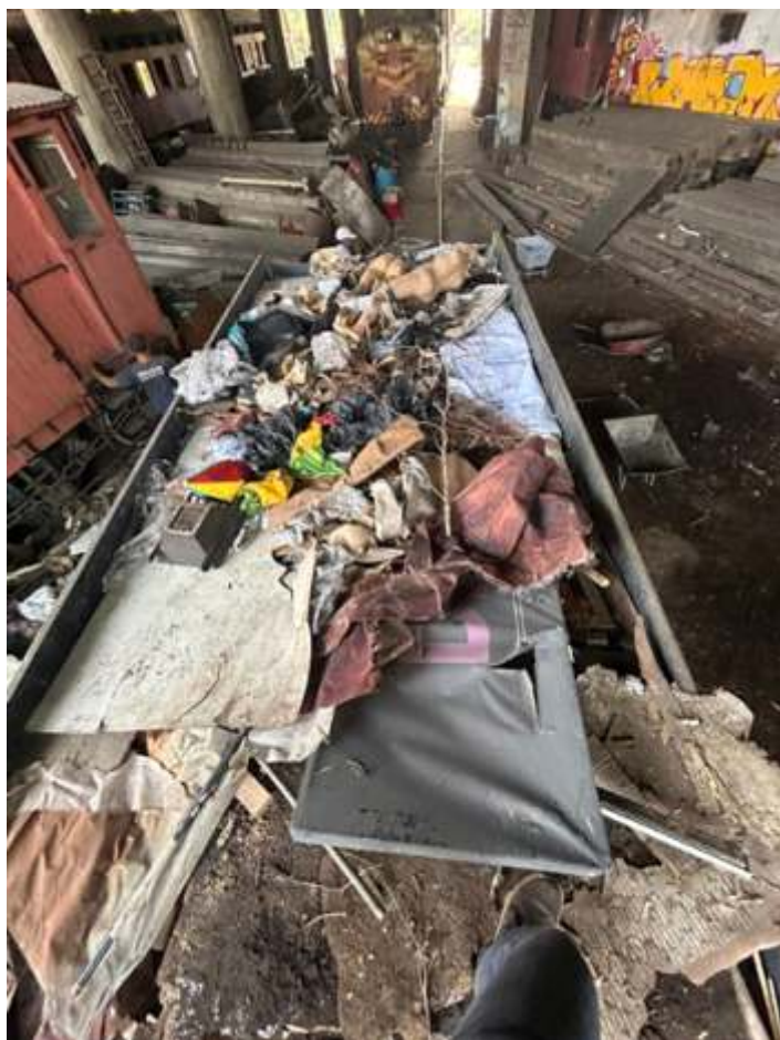
♦ Exemplo da grande quantidade de lixo que estava acumulada na área do pátio.