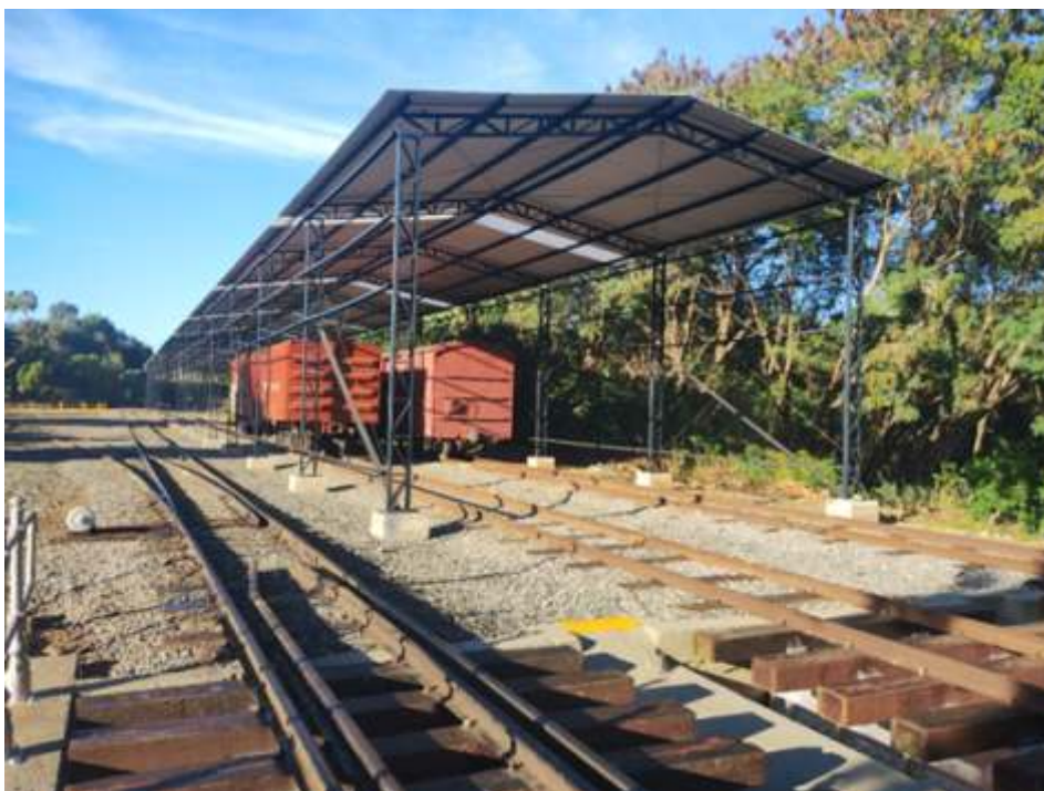
♦ Cobertura do futuro Museu, com detalhes da estrutura da lateral sendo preparada para o fechamento.

Todos os enchimentos foram refeitos e os testes de linha serão feitos