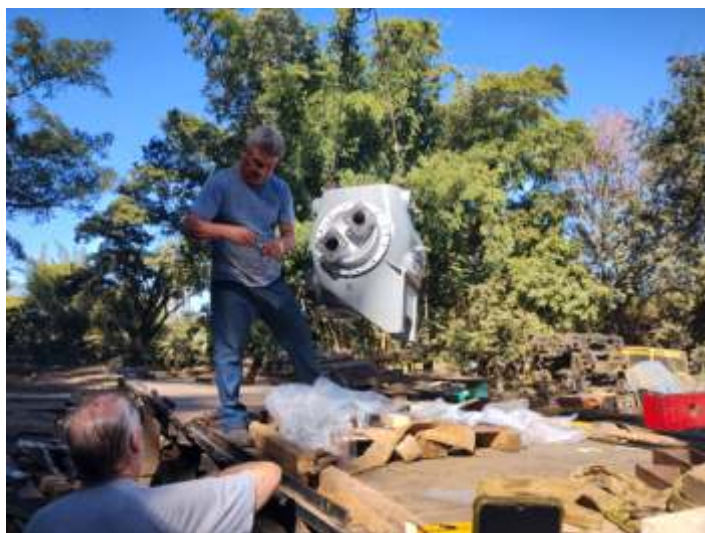
♦ Turbo alimentador da ALCO 905, sendo descarregado e preparado para ser colocado. Foto em Carlos Gomes por HGF.

Na seção de diesel, conforme noticiado, foi feita a reforma do turbo alimentador da ALCO 905. Foram duas semanas com a locomotiva parada entre tirar o turbo, enviar a SP na empresa Americam Turbo e o mesmo retornar e ser instalado para o funcionamento da locomotiva. O trabalho da Americam Turbo foi perfeito, tendo o turbo retornado em estado de zero quilometro, proporcionando maior rendimento e economia de combustível. As demais locomotivas operam normalmente.