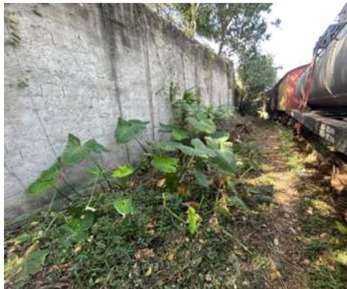
♦ Aspecto de parte do pátio antes da limpeza.