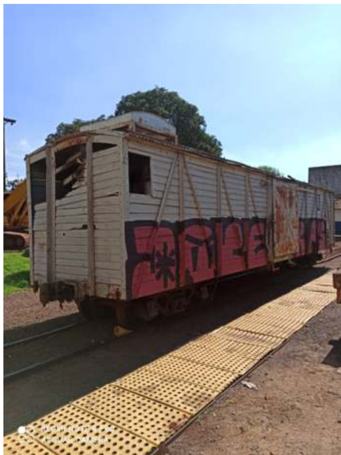
♦ Outra vista do FV 5510 -Créditos na foto!