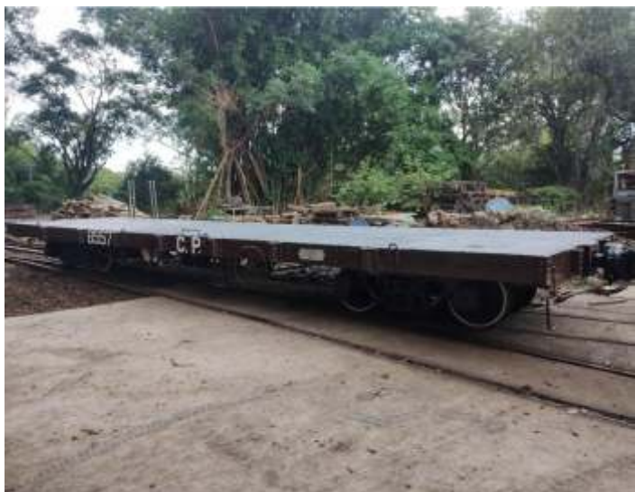
♦ Segunda plataforma da CP, após término dos serviços.

Na seção de vagões, foi concluída e reformada a segunda plataforma da Pullman Standard (bitola larga) recebidas ano passado. Uma já havia ficado pronta no mês passado e a segunda ficou pronta agora. Ambas já estão disponíveis em Anhumas para serviços diversos.