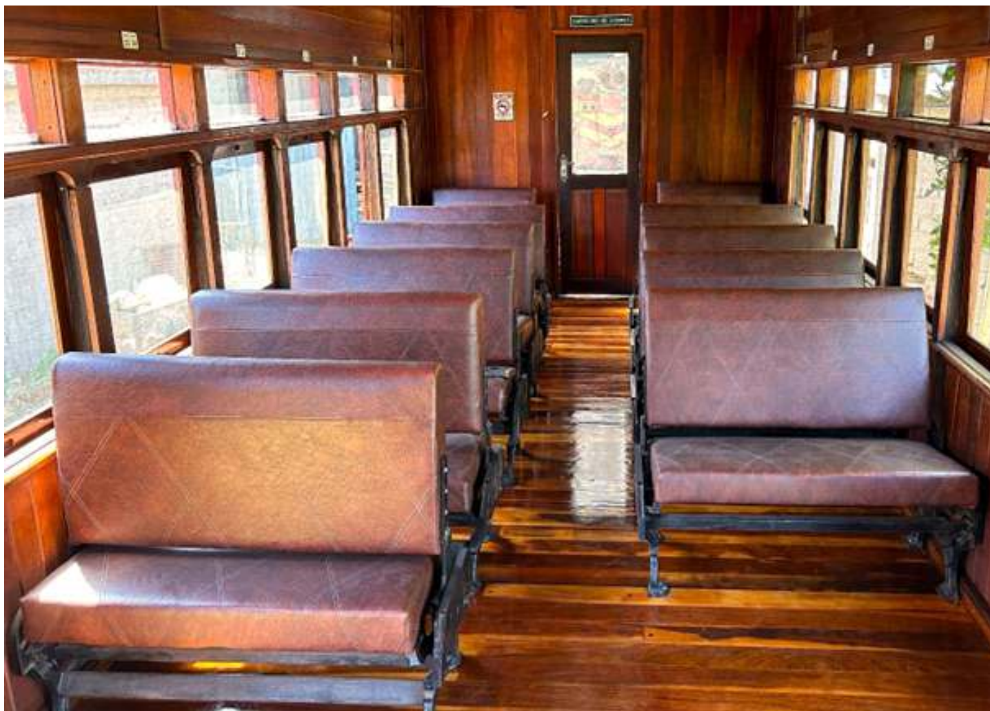
♦ Os bancos já em processo de fixação no piso do carro.