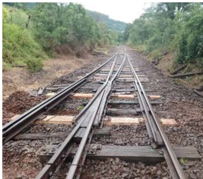
♦ Manutenção de amv no pátio, com substituição de dormentes.