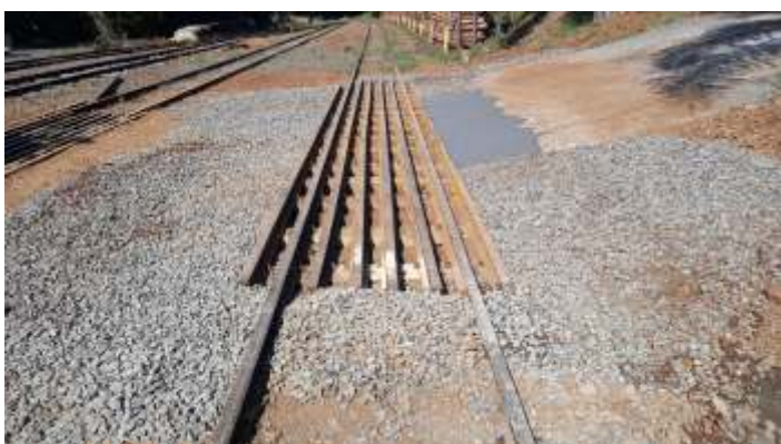
♦ Trabalhos de manutenção em uma das pn's do trecho: aspectos da evolução dos trabalhos e após a conclusão.