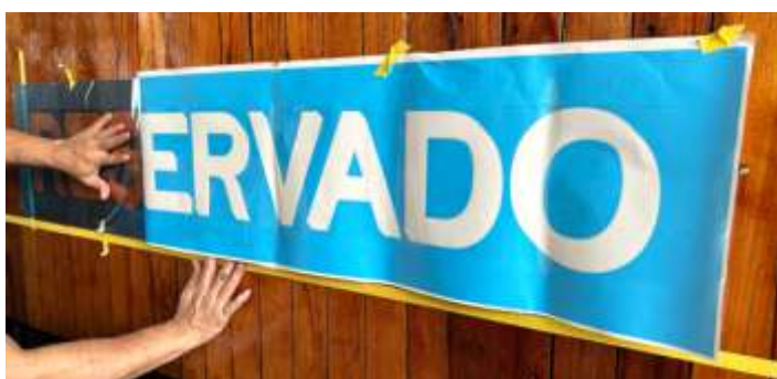
♦ Aplicação da máscara com o “sombreado” da palavra RESERVADO.