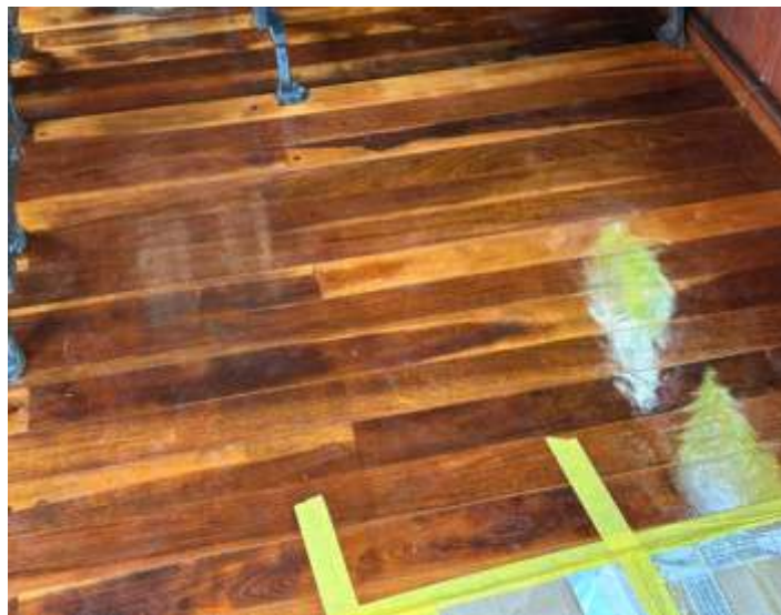
♦ Detalhe da parte central do carro, ainda com proteções no piso, nota-se um excelente brilho deste tipo de verniz aplicado.

Também foi possível fazer a finalização da aplicação da manta asfáltica no teto do carro e sua posterior pintura na cor branca conforme algumas imagens mostradas aqui.