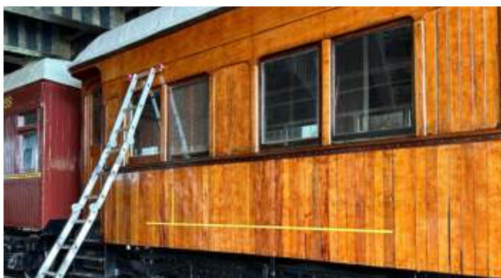
♦ Preparativos para a aplicação da máscara na nova tipologia.