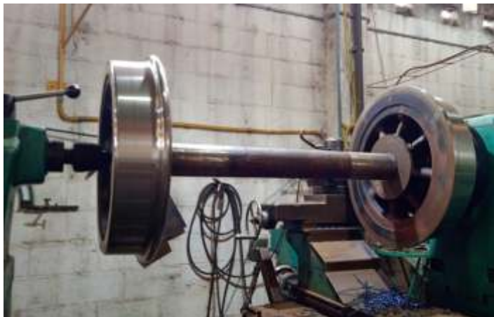
♦ Rodeiro locomotiva 9 no torno da empresa ANX.

Em nossas oficinas prossegue a reforma do trole dianteiro da locomotiva 9, bem como a confecção dos novos anéis dos cilindros, que já estão em andamento no torno. As rodas também já estão prontas e em breve vamos fazer as montagens.