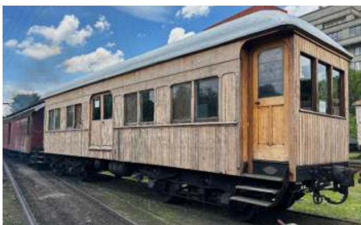
♦ Aspecto após lixamento externo do carro 19.

Assim como no carro 289, o carro Reservado 19 teve a pintura do chassi, engates e truques em preto com o aro das rodas em branco.