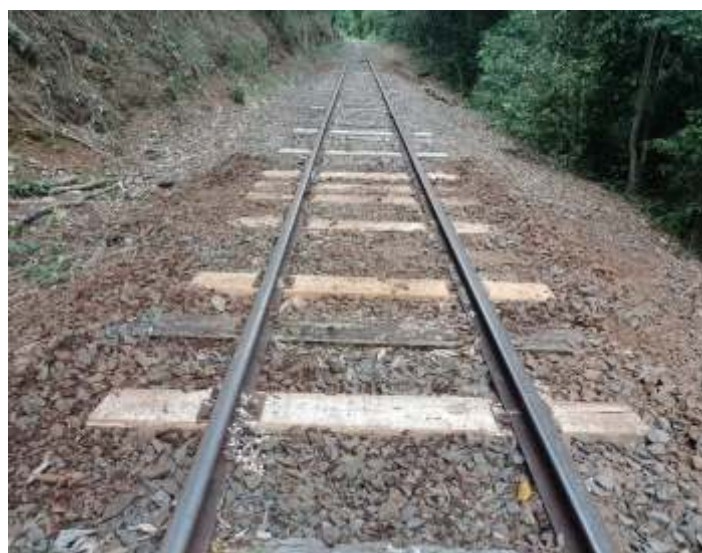
♦ Manutenção da via permanente, com substituição de dormentes.p