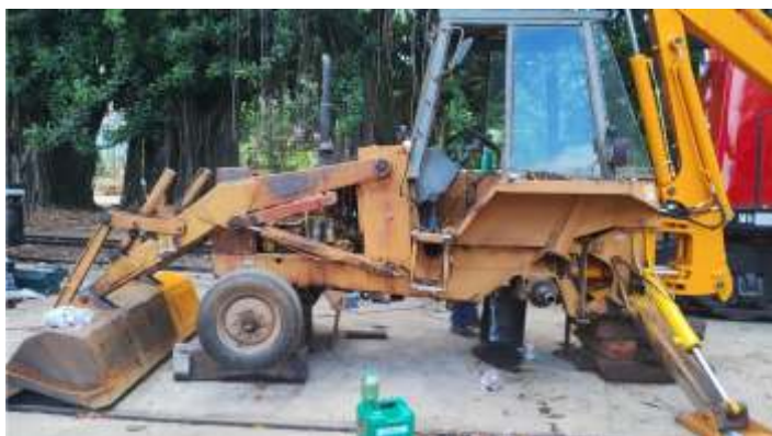
♦ Retroscavadeira em reforma nas oficinas de CG.

Também foi dedicado bom tempo na reforma geral da retroscavadeira, como a troca de todas as buchas e pinos das articulações, retiradas de trincas, troca de rolamento das rodas e sistema de freios, e por último repintura geral. Estamos preparando o equipamento para uma possível adaptação para uso rodo ferroviário, que muito vai nos ajudar no nosso dia a dia nos trabalhos da via permanente.