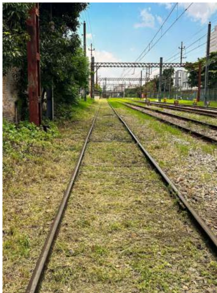
♦ Observando se a linha sentido Mooca tendo nossa plataforma de embarque/desembarque ao fundo.