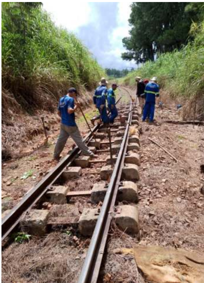
♦ Aplicação de dormentes no KM 14.

Os serviços de manutenção e repintura da estação de Anhumas, já foram concluídos, mudando totalmente o visual da estação.