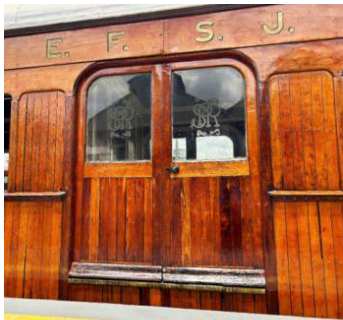
♦ Com o logo da EFSJ e uma breve parada na nova plataforma da Regional.