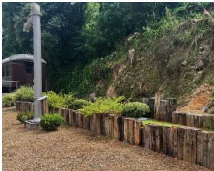
♦ Canteiro da marginal da via férrea revitalizado com novo gramado e arbustos podados.