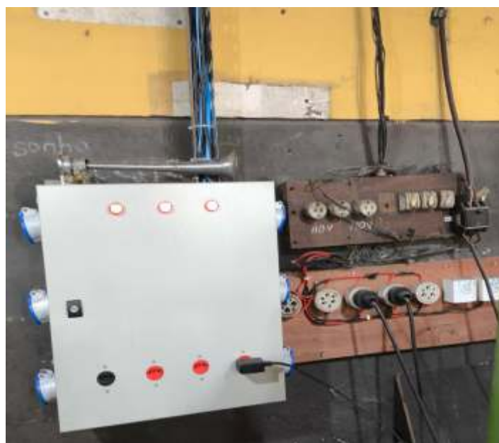
♦ O novo ao lado do velho, sendo substituído.

E por fim, estamos ultimando os últimos trabalhos da parte elétrica nas oficinas, área do armazém da estação, substituindo toda a linha aparente e os painéis de tomada externos por caixas. Este trabalho é feito pelo associado Cristiano Belarmino.