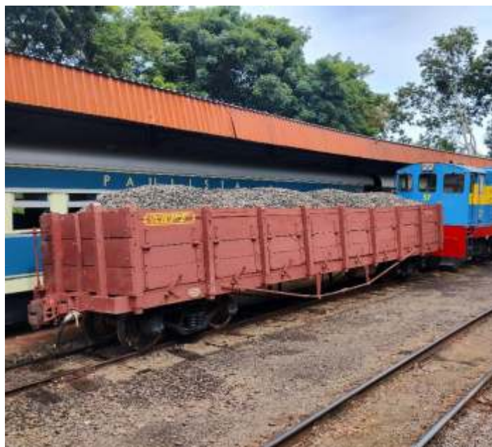
♦ Gondola carregada para ser distribuída no trecho.

E os trabalhos da via permanente, concentra se no km 14, onde a algum tempo houve grande contaminação do lastro por queda de barreira e muito barro e água, por um erro da fazenda vizinha que aterrou a curva de nível, fazendo com que toda a terra arada e água caísse no leito. Com isso já está sendo feita a troca dos poucos dormentes de madeira que sobraram, e aplicação de 180 toneladas de brita. Em seguida será feita a correção com a máquina Plasser.