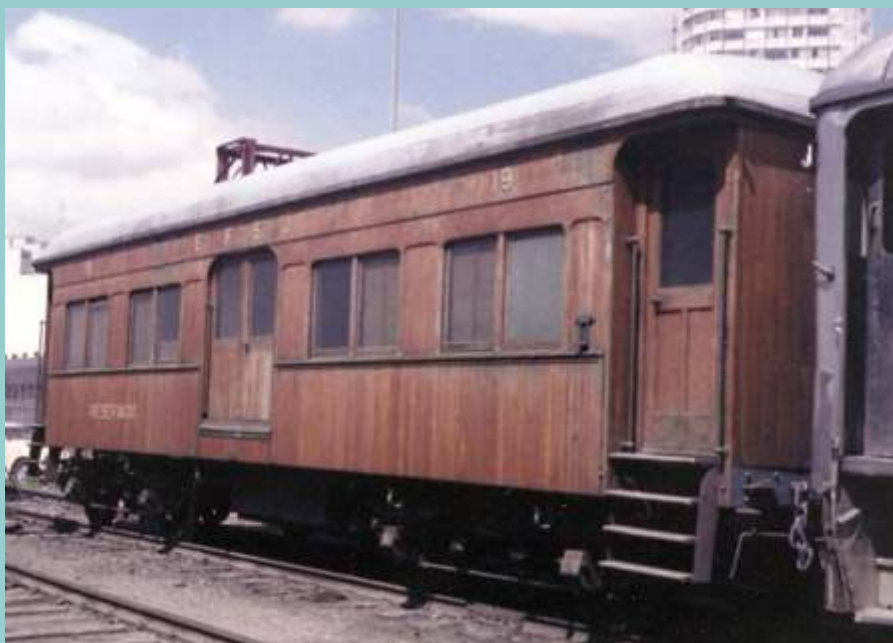
♦ Carro nº19 quando ainda estava em serviço na E.F. Santos a Jundiaí.