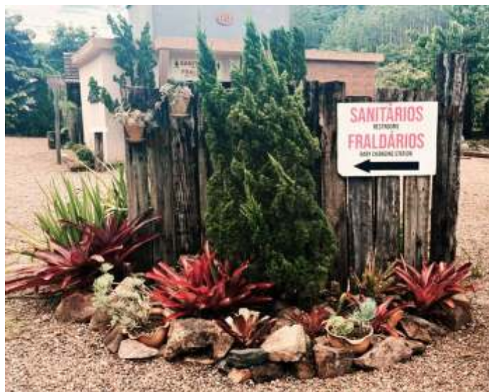
♦ Novo aspecto do canteiro central do pátio. Autoria de Priscila Jesani dos Santos.