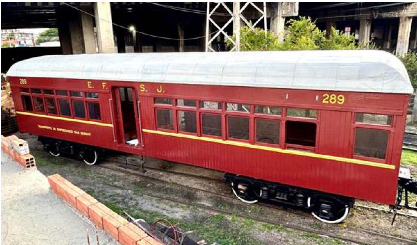
♦ O teto também já 100% finalizado, com a aplicação da manta asfáltica e posterior pintura do tipo PU, na cor branca.