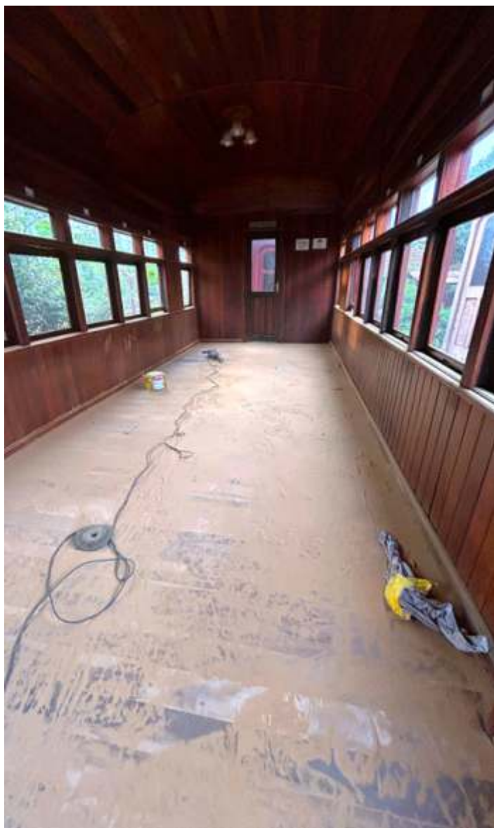
♦ O piso já com o lixamento em andamento.