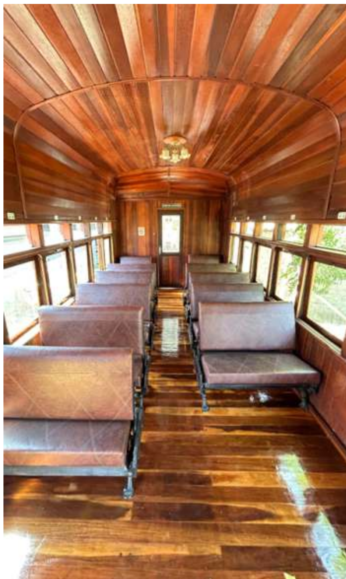
♦ Recolocação dos bancos já após a aplicação do verniz marítimo.