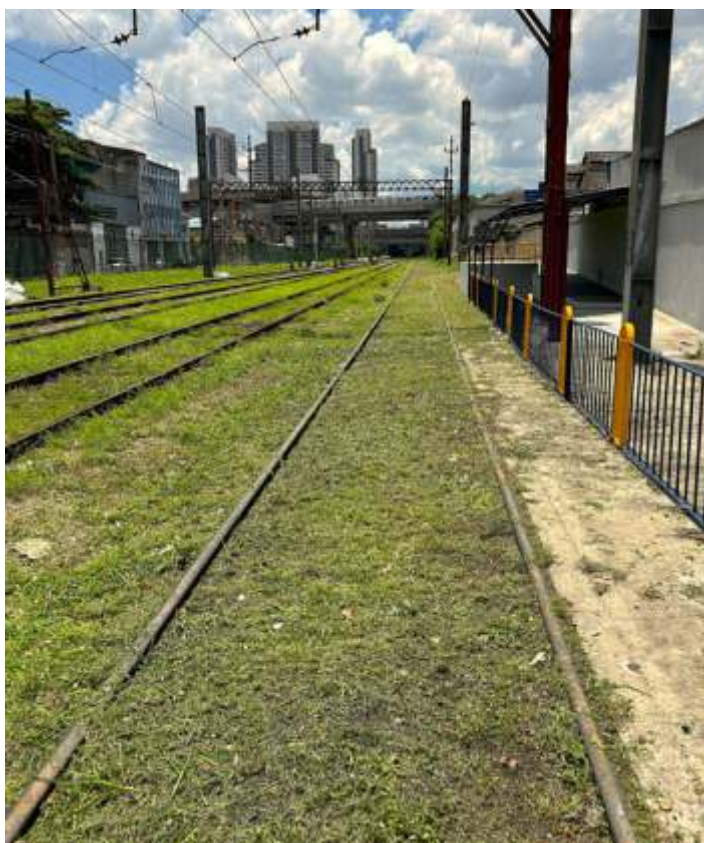
♦ Observando se a linha sentido Mooca tendo nossa plataforma de embarque/desembarque ao fundo.