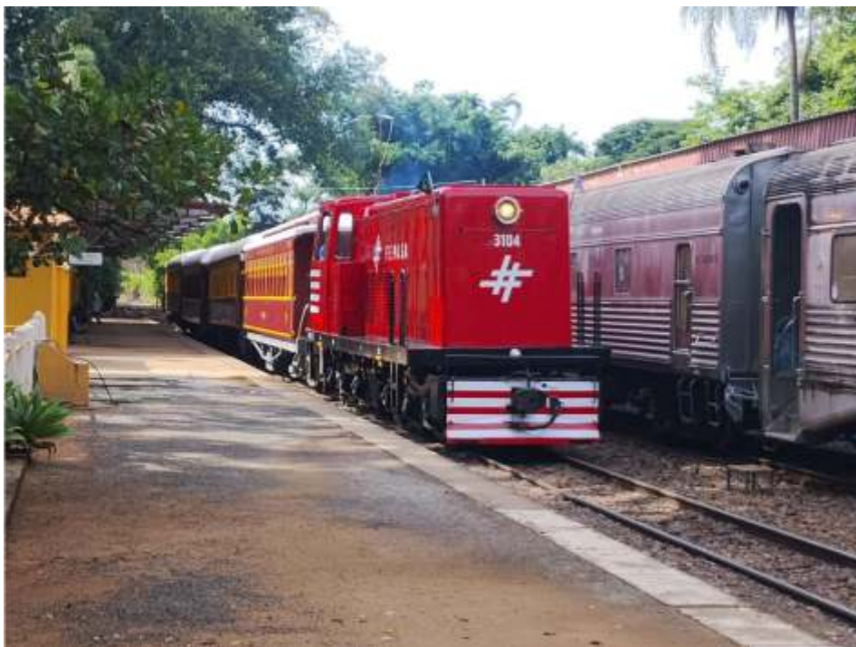
♦ Locomotiva 3104 partindo para sua primeira viagem oficial.

O Destaque nesse período de férias foi com a entrada ao tráfego da locomotiva 3104, após a reforma do motor diesel. A locomotiva operou na última quinzena fazendo os trens em Jaguariúna aos sábados e domingos. A locomotiva ficou excelente, apresentando um bom rendimento e sem falhas, estando apta a operar definitivamente. Chama a atenção por onde passa com a pintura vermelha, segunda fase da Fepasa.