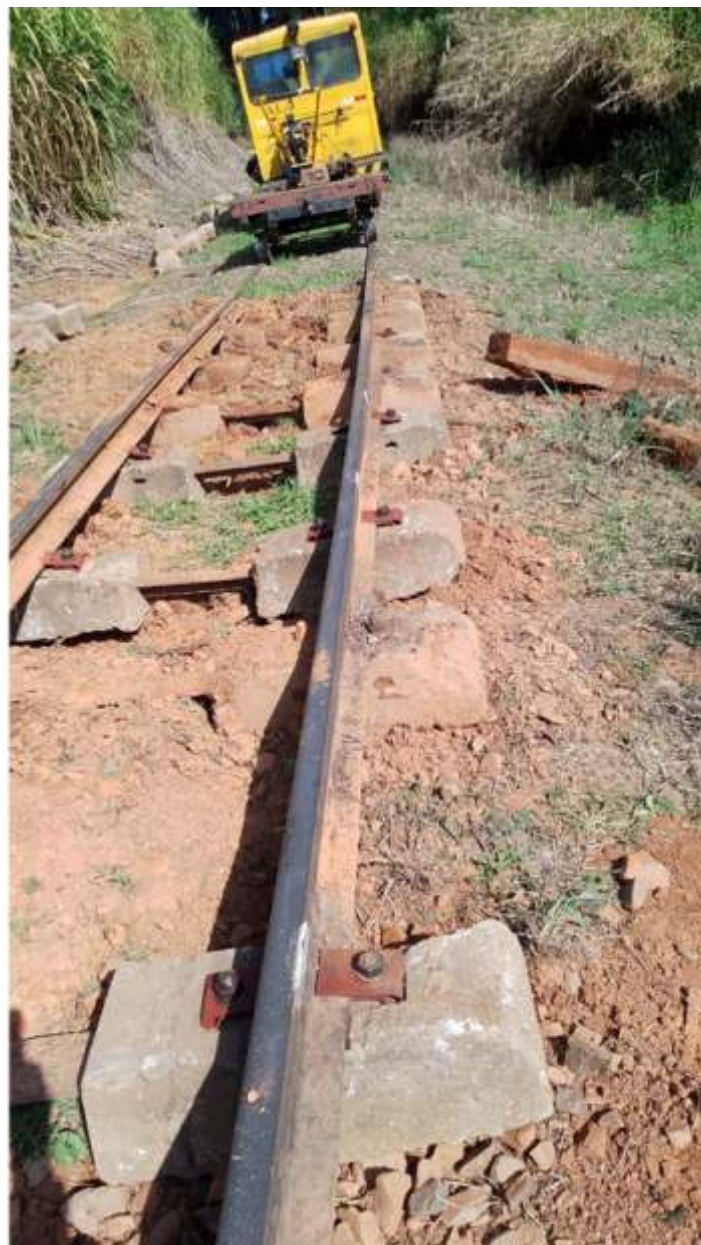
♦ Início do trecho em remodelação.