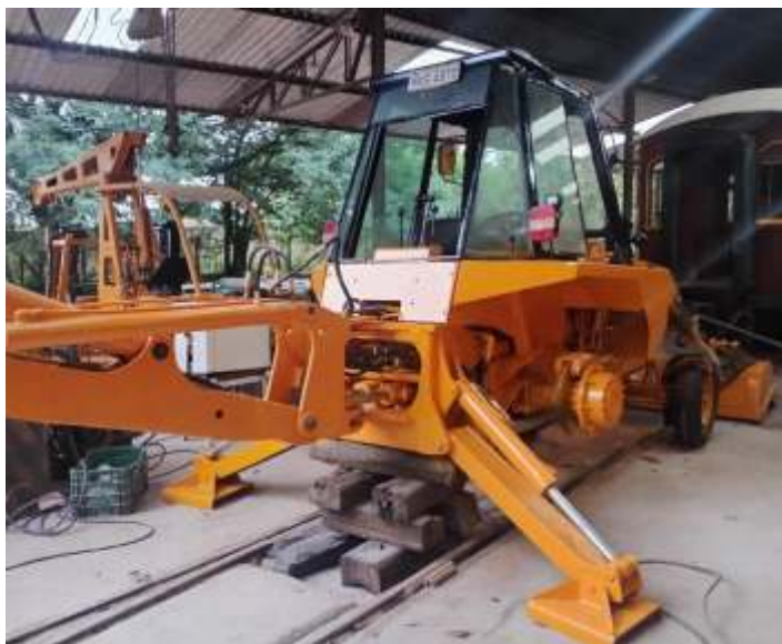
♦ Serviços quase finalizados na retroscavadeira.

E os trabalhos da via permanente, concentra se no km 14, onde a algum tempo houve grande contaminação do lastro por queda de barreira e muito barro e água, por um erro da fazenda vizinha que aterrou a curva de nível, fazendo com que toda a terra arada e água caísse no leito. Com isso já está sendo feita a troca dos poucos dormentes de madeira que sobraram, e aplicação de 180 toneladas de brita. Em seguida será feita a correção com a máquina Plasser.