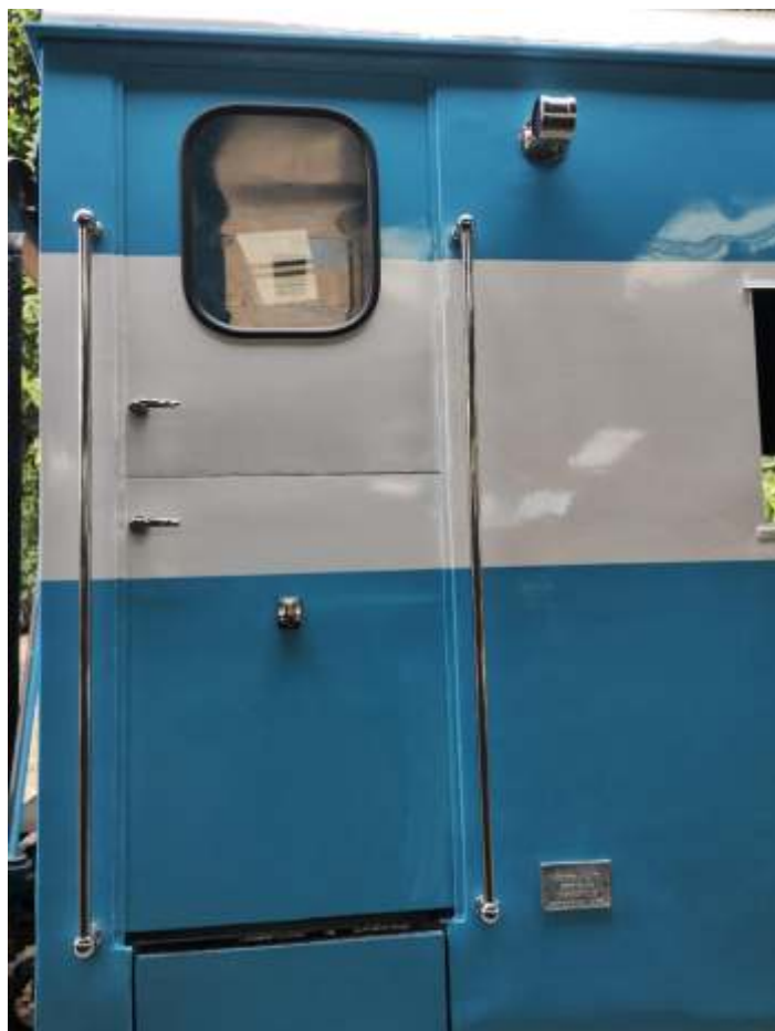
♦ Vista de detalhes instalados na plataforma do S-339.

O carro de aço da RFFSA S-339, que já havia concluído a pintura, recebeu a nova fiação elétrica, instalação de balaústres, lanterna de cauda, fechaduras das plataformas, bem como os vidros das portas da plataforma. Terminando o NOB, iremos trabalhar em outro carro NOB, onde faremos um remanejamento de estofamentos, para em seguida fazer o interior do S-339.