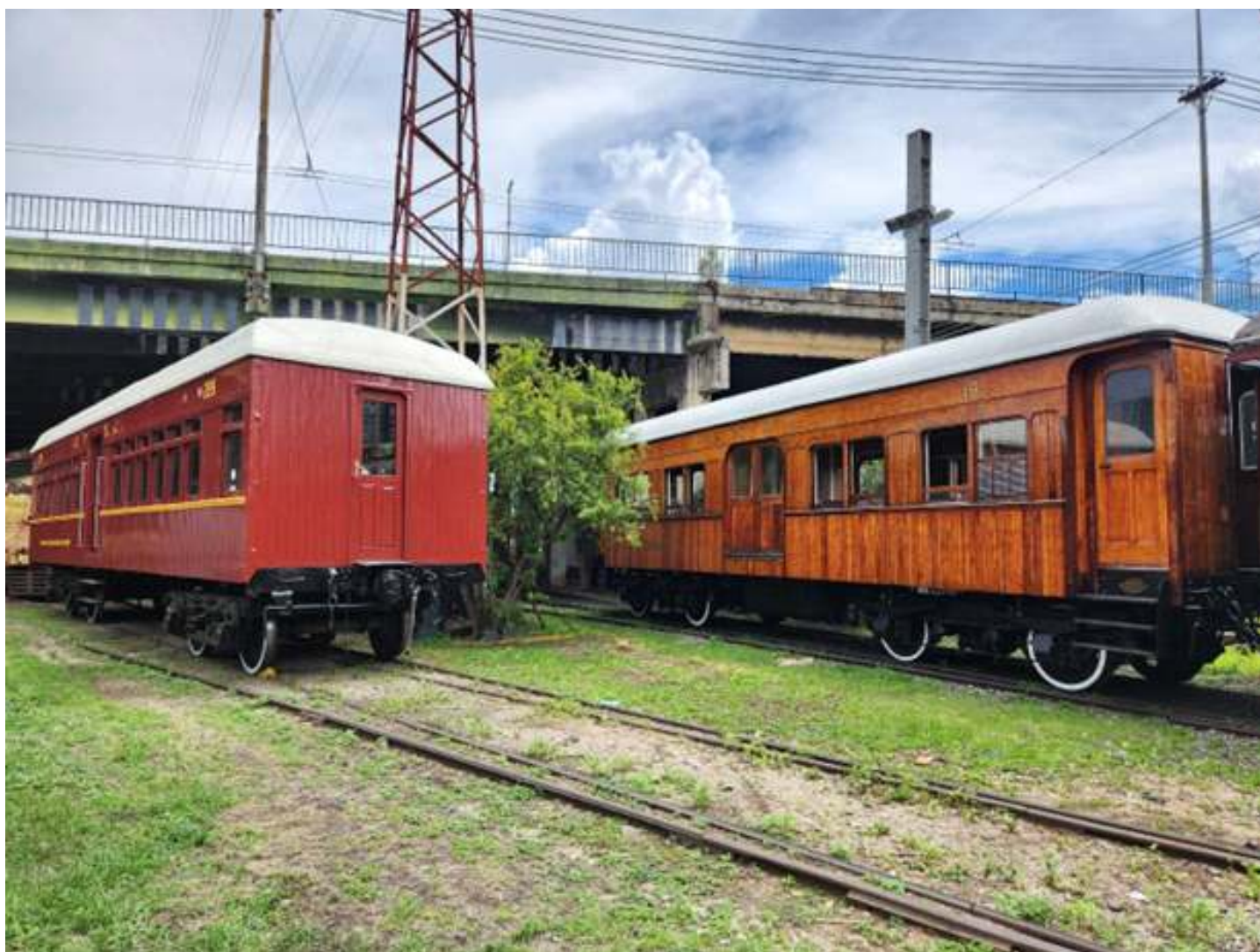
♦ Ambos os carros operacionais sendo manobrados para os passeios do final de semana.