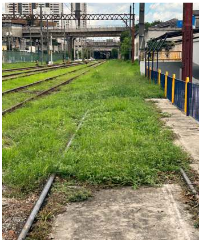
♦ Aspecto antes dos trabalhos de limpeza da Via, observando se a Estação Brás da CPTM ao fundo e nossa plataforma a direita da foto.