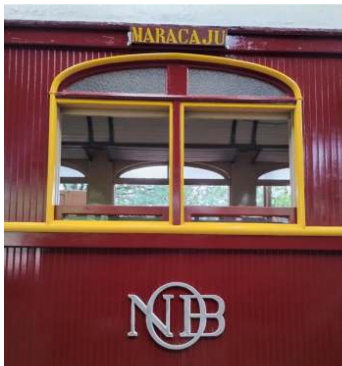
♦ Detalhe carro NOB S-76.

Nas oficinas de carros de passageiros, o NOB S-76 já está concluído. Estamos fazendo alguns retoques e instalação de acessórios. Esperamos na segunda quinzena de fevereiro ele estar em testes e voltar a operação.