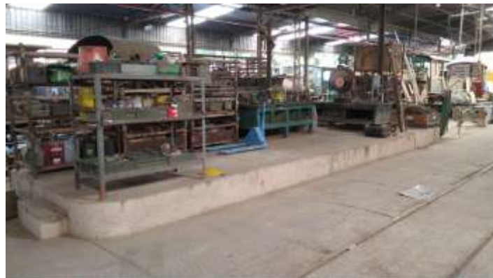
♦ Organização dos materiais na oficina.

Em paralelo estamos fazendo a organização da oficina na parte externa, como adequação de painéis, organização de bancadas e armários, e de separação de materiais de locomotivas.