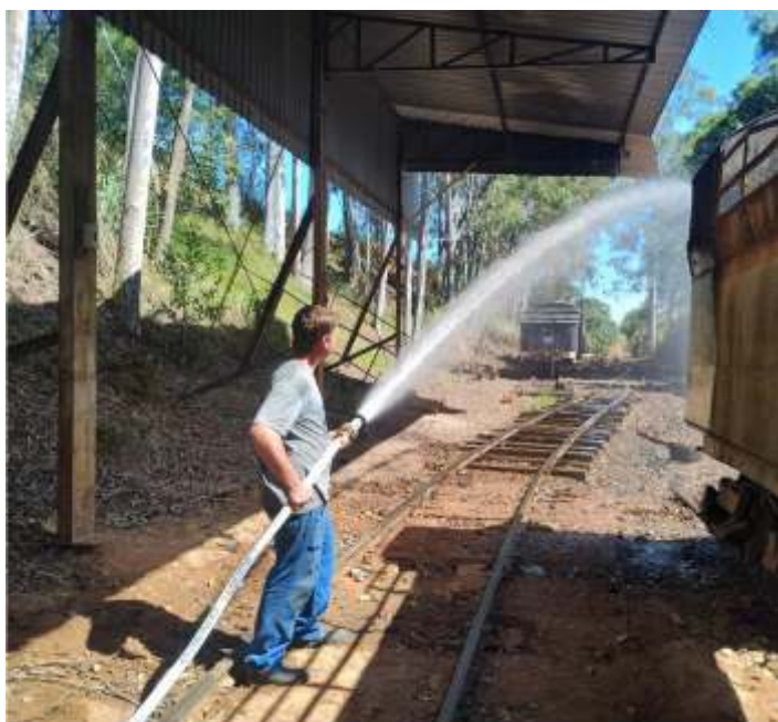
♦ Testes do sistema de hidrantes no pátio de CG.

Outra importante obra que foi concluída, foi a instalação do sistema de Hidrantes no pátio da estação de Carlos Gomes. O sistema foi testado e cobre toda a área coberta da estação.