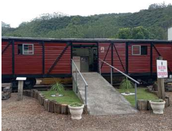
♦ Canteiro do entorno do vagão bilheteria recebeu gramado novo e vasos ornamentais. Autoria de Luiz Carlos Henkels.