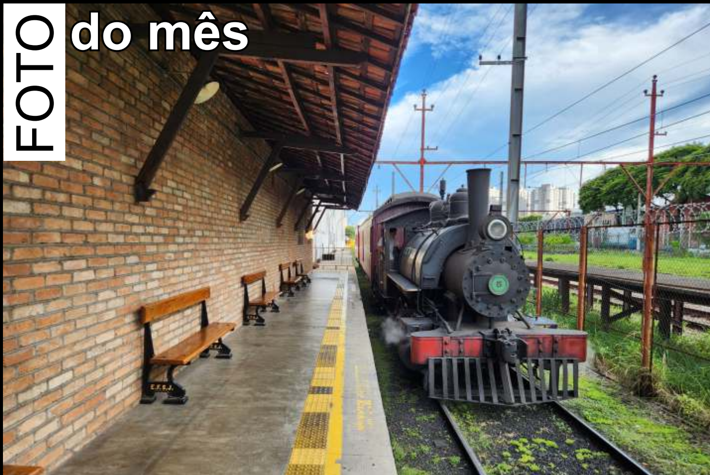
♦ O Trem dos Imigrantes em dia de passeios na Mooca, São Paulo.

Todo mês selecionaremos uma foto relacionada ao trabalho da associação publicada no grupo ABPF - Oficial no Facebook para publicar aqui.