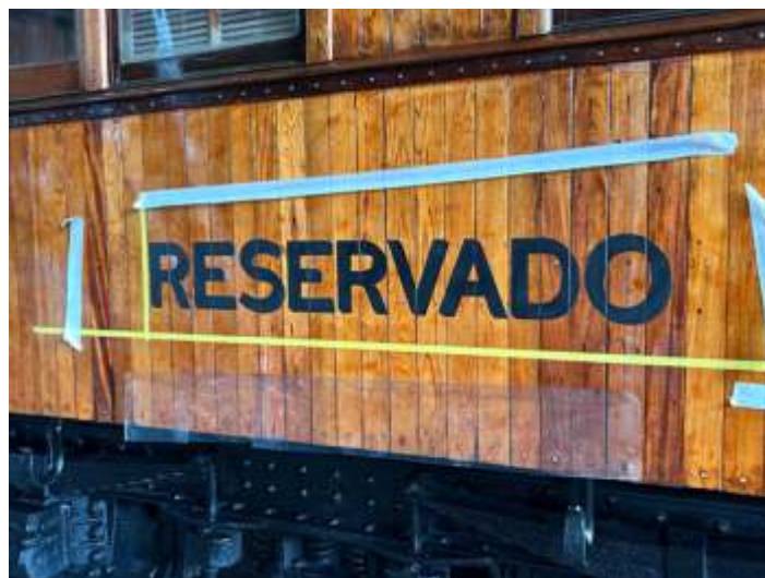
♦ Aplicado o “sombreado” da palavra RESERVADO.