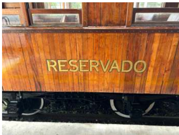
♦ Pós aplicação das duas camadas da máscara de pintura já com o RESERVADO concluído.