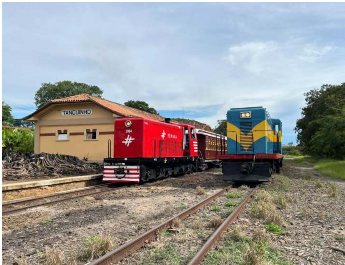
♦ Cruzamento com a outra composição.