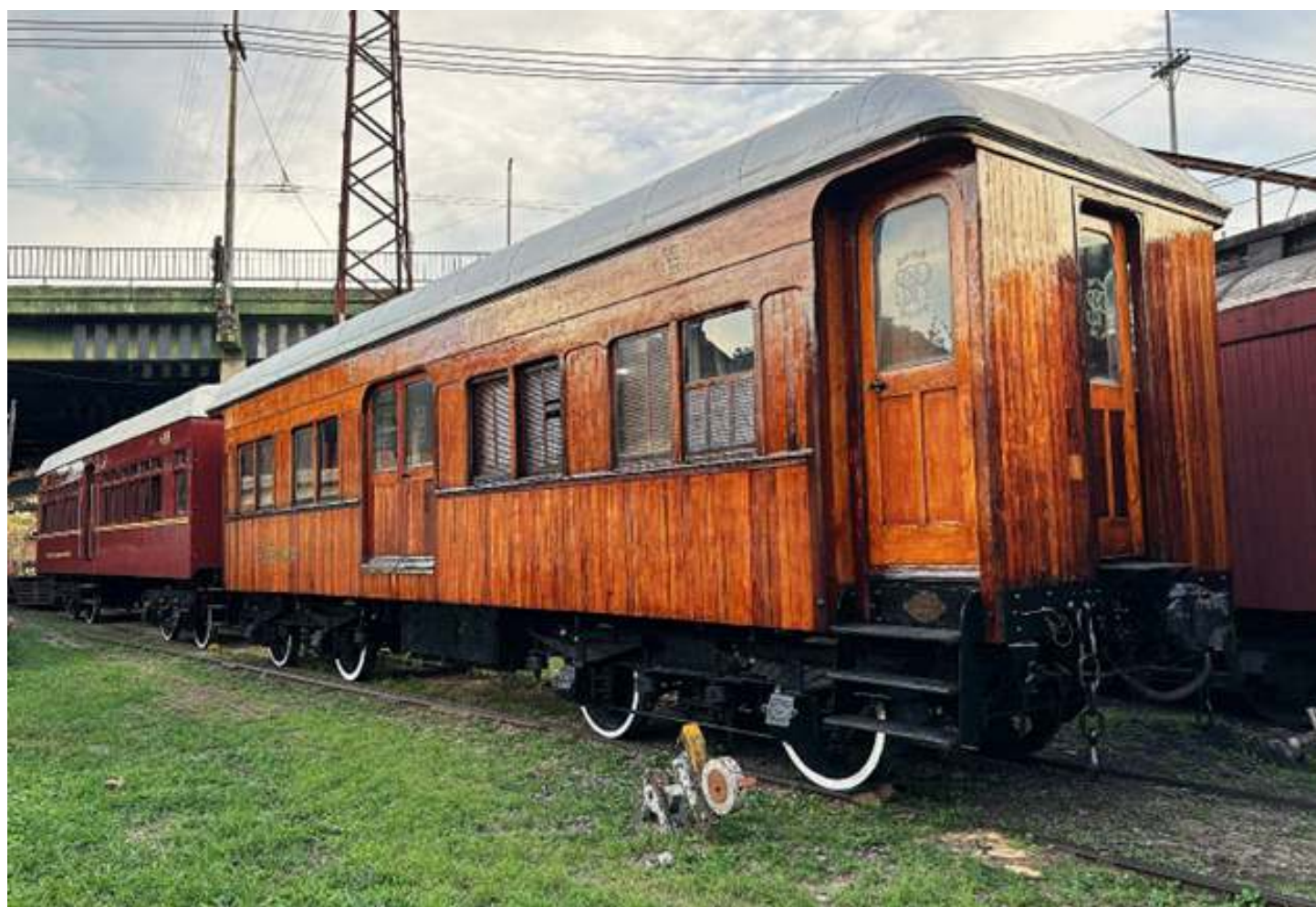
♦ Carro Reservado 19 totalmente finalizado com as tipografias e verniz aguardando manobras no Pátio Mooca.