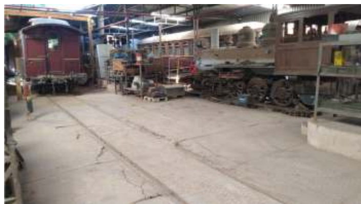
♦ Organização da oficina.

E por fim, estamos ultimando os últimos trabalhos da parte elétrica nas oficinas, área do armazém da estação, substituindo toda a linha aparente e os painéis de tomada externos por caixas. Este trabalho é feito pelo associado Cristiano Belarmino.